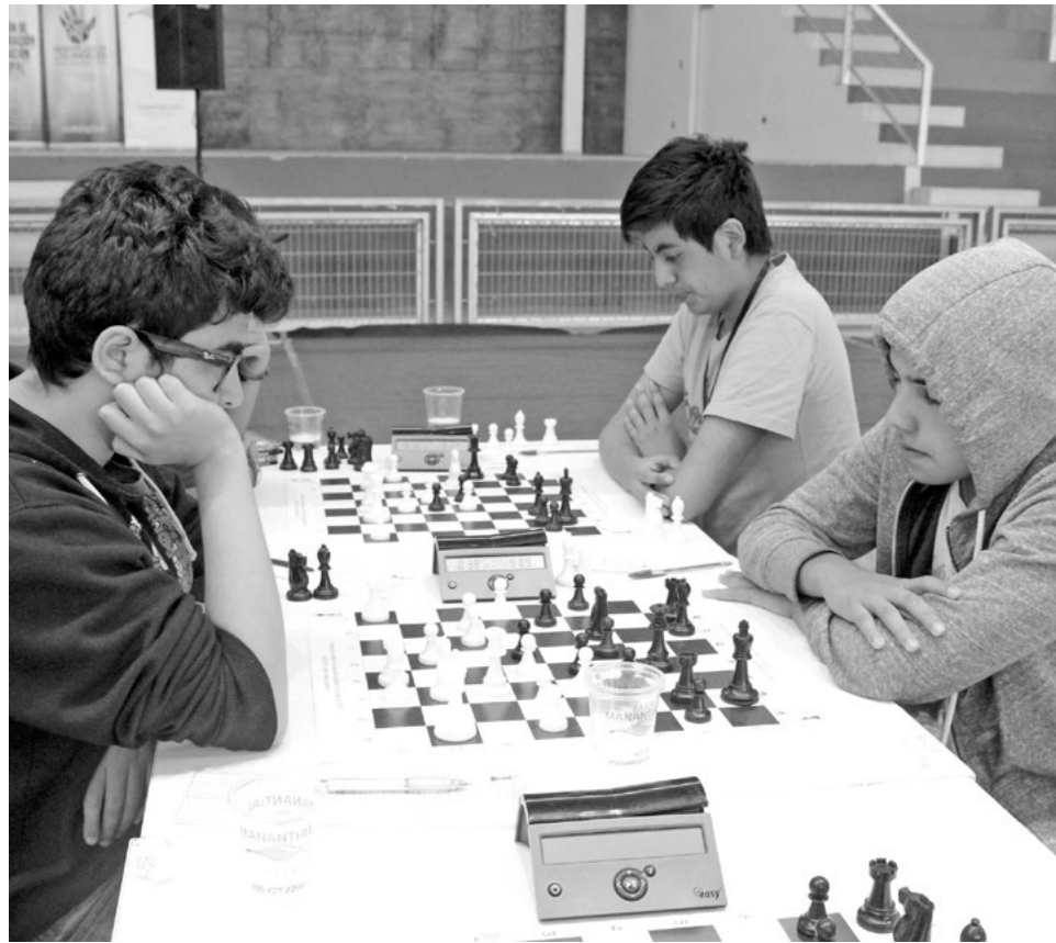
AJEDRECISTAS ANGELINOS viajarán, hoy, a Concepción para disputar torneo en el DUOC.