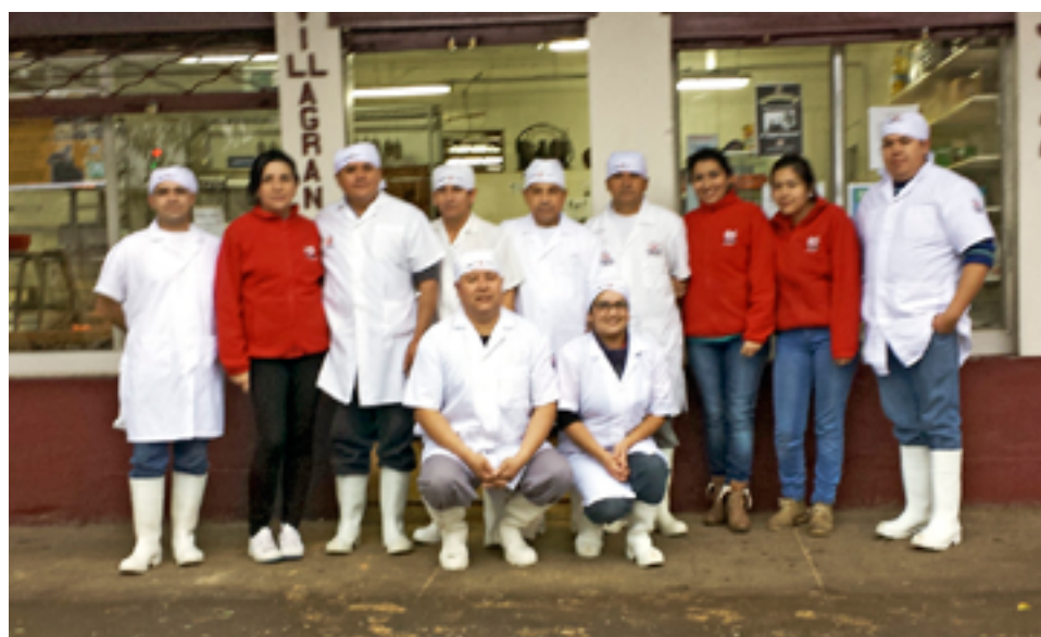
UN EQUIPO DE CATORCE personas mantiene la calidad y excelencia de Cecinas Melo.