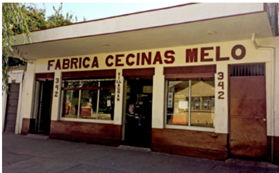
ACTUALMENTE ESTÁN UBICADOS en calle Villagrán 342 de la comuna de Mulchén.