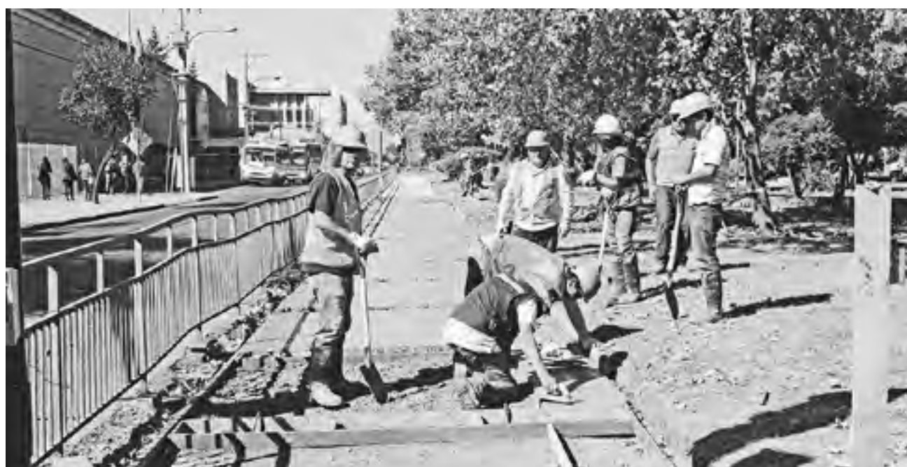
1.770 PERSONAS en Los Ángeles dejaron de estar en condición de desocupados.

Se estima que 5.360 personas se incorporaron a la fuerza laboral.