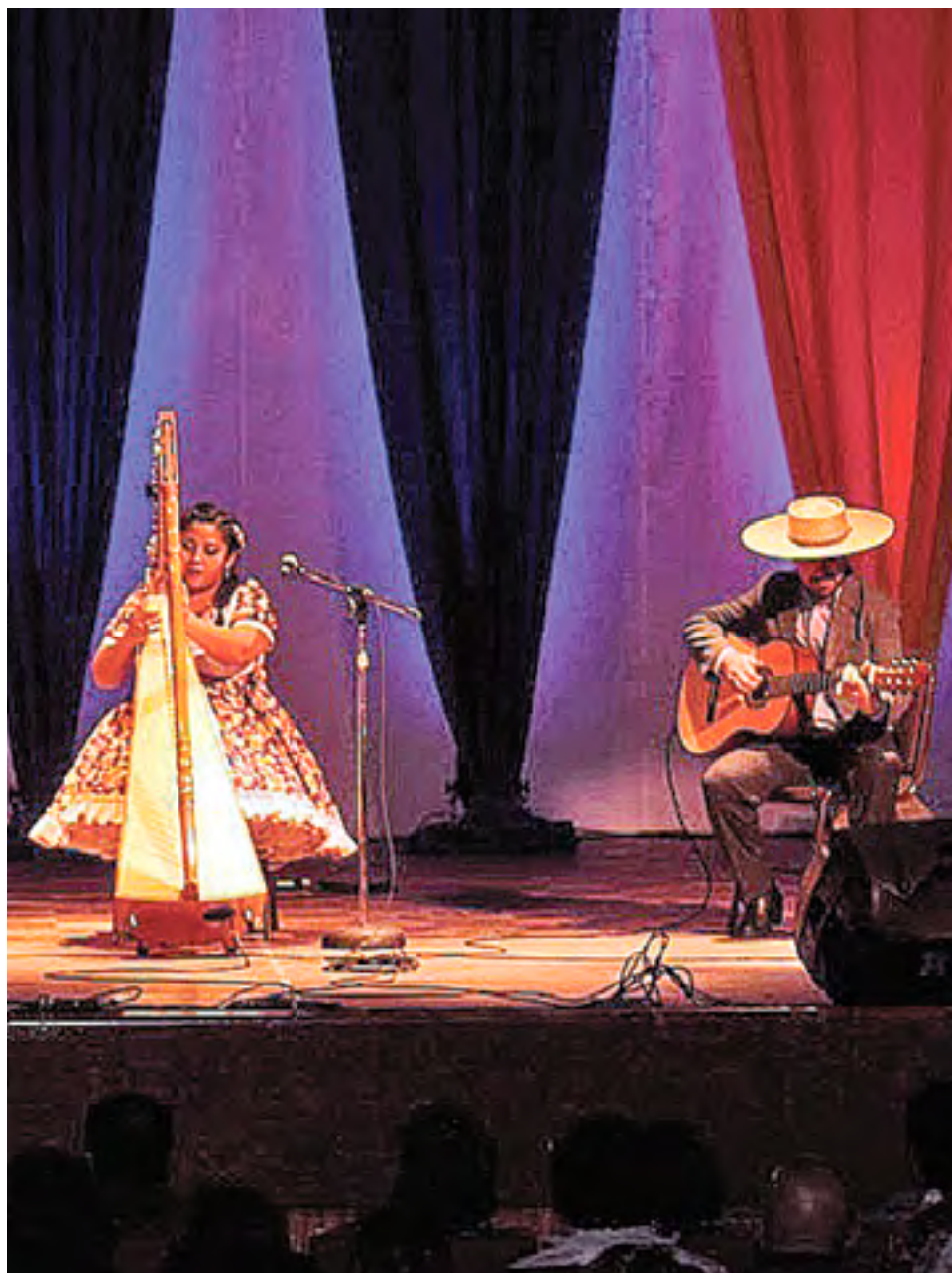
CON MÚSICOS DE México, Chile, Argentina y Paraguay, se hará muestra de virtuosismo con el arpa.

De esta forma, los angelinos tendrán la oportunidad de apreciar la maestría y virtuosismo de estos connotados músicos en nuestra comuna, en un espectáculo con entrada liberada, y que resultará imperdible para los fieles seguidores de este arte, y para aquellos que quieran ampliar sus horizontes musicales.