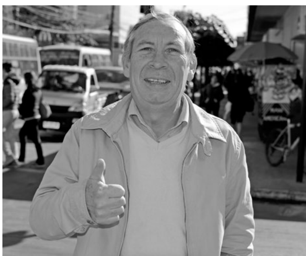
DIRIGENTES ASEGURAN que se está en presencia del mejor campeonato de la historia del fútbol amateur.

“Vamos a jugar la séptima fecha de la primera rueda de ANFA Bío-Bío A, y la cuarta fecha de Bío-Bío B, que son