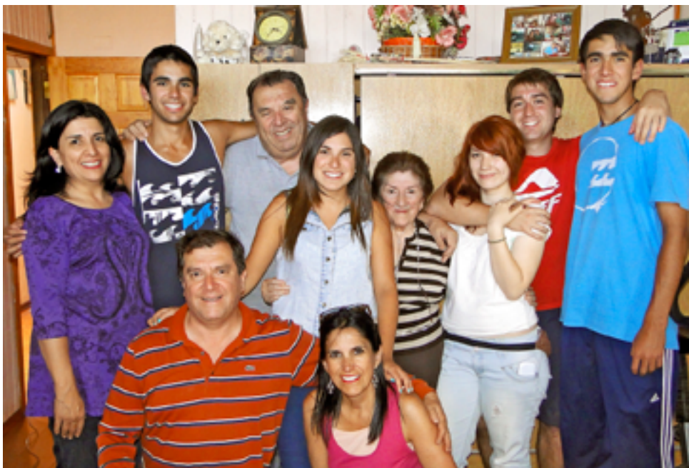
PARA MANTENER LA TRADICIÓN familiar, es fundamental que las nuevas generaciones conozcan desde pequeños el funcionamiento de la empresa.

primas certificadas y de calidad ya que nuestro principal objetivo es dar la mayor satisfacción a nuestros fieles clientes.