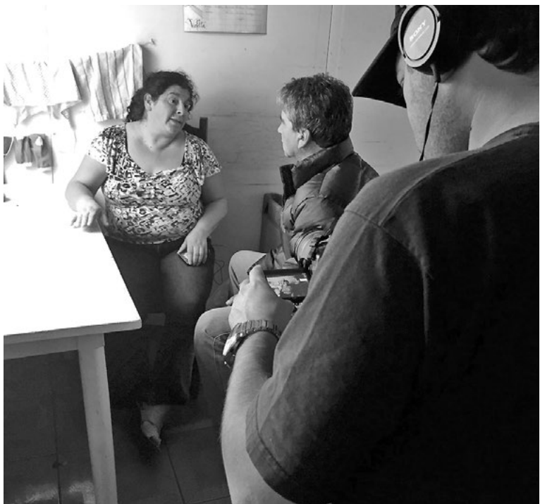
DURANTE LA ENTREVISTA cambió varias veces su relato.

Parte del impactante relato saldrá a las 22 horas de este domingo por las pantallas del canal católico.