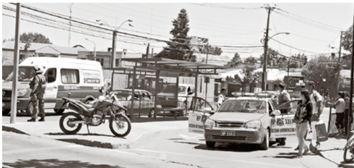
LA INICIATIVA CONTEMPLA una importante inversión territorial, sistemas de cámaras nuevos y seguridad ciudadana reforzada.

Este programa dispondrá de un presupuesto de 400 millones de pesos, por los próximos tres años,