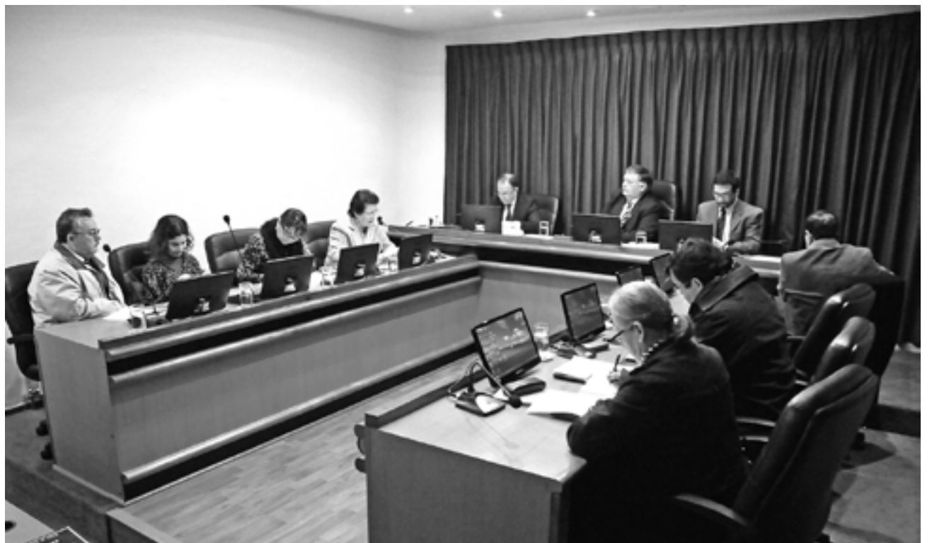
EL TEMA HA SIDO tratado en diversos concejos municipales.