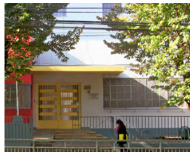
LA ESCUELA D-926 abrirá sus puertas para una visita guiada y charla inaugural del Día del Patrimonio.