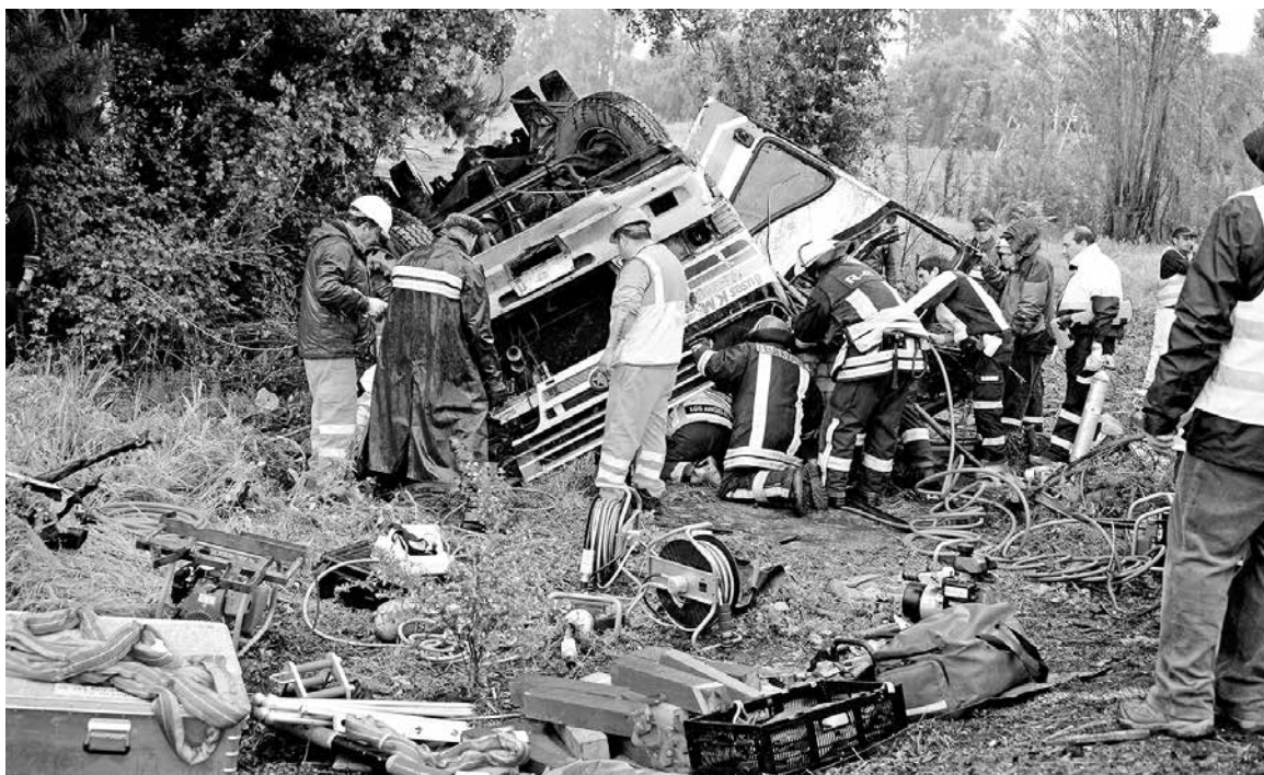
CON ARRESTO DOMICILIARIO nocturno y firma quincenal quedó el conductor que el martes pasado protagonizó el fatal accidente.

En este sentido, sostuvo que tanto los vehículos de carga como