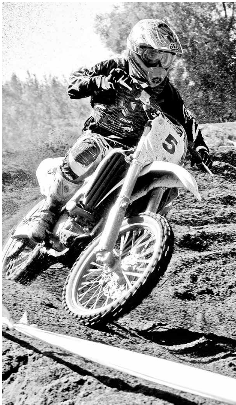
LA COMPETENCIA INICIARÁ estrictamente a la hora, por lo que no aceptarán retrasos.