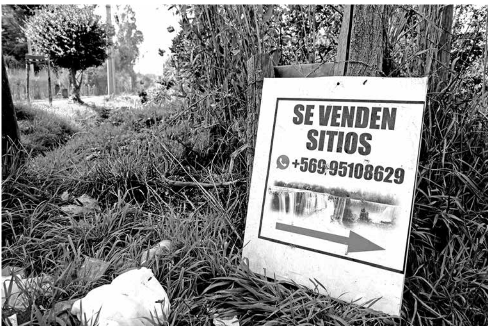
RECORDEMOS que los sitios, de menos de media hectárea, eran ofrecidos en páginas web de la zona.

Un segundo capítulo en tribunales tendrá la denuncia por ventas irregulares de terrenos en Saltos del Laja, luego que el municipio angelino constatará –in situ– la situación, remitiendo los antecedentes al Juzgado de Policía Local. La inspección fue realizada por un funcionario de la Dirección de Obras de la casa edilicia, quien visitó el –supuesto– loteo irregular, ubicado en camino a Paraguay, kilómetro 2, sector Salto del Laja, comuna de Los Ángeles.