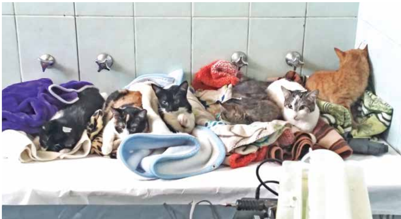
LA CAMPAÑA BUSCA esterilizar a cerca de 800 mascotas, tanto de sectores urbanos como rurales de la comuna de Mulchén.

De igual forma, se espera que -al igual que el año pasado- haya una buena recepción, recordando que durante el 2015 este programa permitió esterilizar a más de 1.500 mascotas de Mulchén.