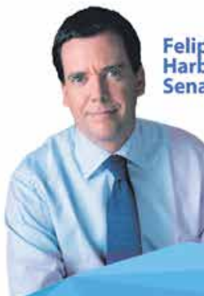
Felipe Harboe Senador