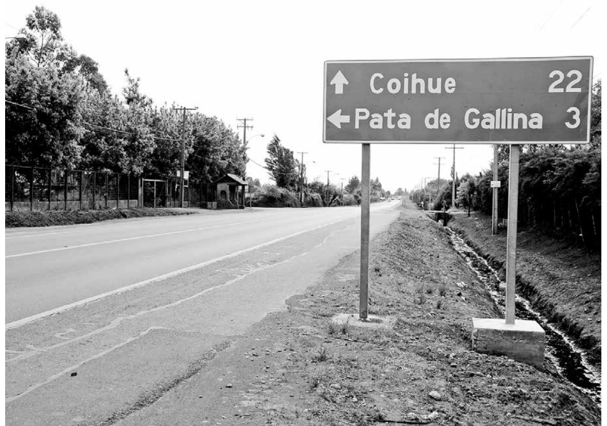
LOS VECINOS DEL SECTOR manifestaron estar cansados de la presencia de extraños en las cercanías de sus hogares.

De igual modo, está –expresamente– prohibido cazar en terrenos privados sin la autorización del dueño de la propiedad, cuya fiscalización