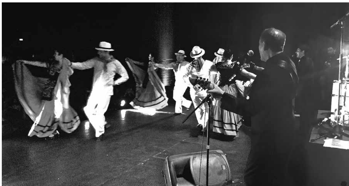
BANDA RETROMANÍA (R) nace a la vida artística en el mes de diciembre de 2011 como un proyecto familiar.

Nuestro reto es difundir nuestro arte en el medio local, Regional y nacional y junto con ello, seguir trabajando en los arreglos musicales, adecuaciones artísticas y puesta en escena para la edición del Volumen II, en un mediano plazo.