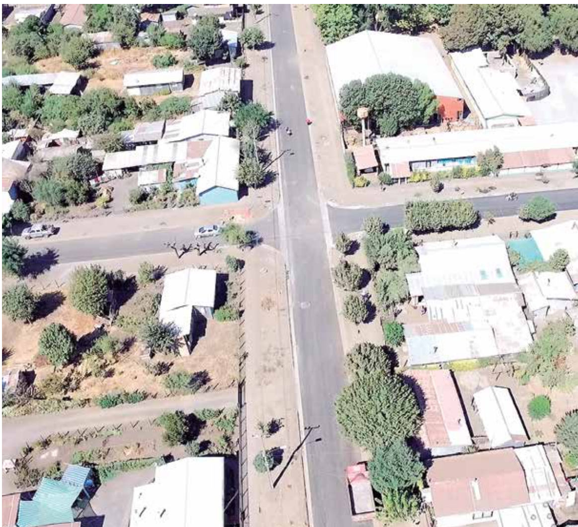
EXISTEN DOS AUMENTOS de obra, los que permitirán continuar con el proyecto que ha renovado villa Mercedes.

Los recursos permitirán un aumento de la capacidad de la planta, además de un costo de mantención mucho más bajo y con un sentido mucho más amigable con el medio ambiente.