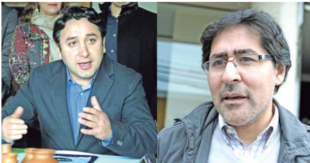
LÍDERES POLÍTICOS entregaron también los métodos para llevar a cabo la instancia.

En el contacto con los dirigentes locales también se