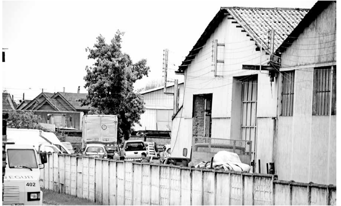
LAS DEPENDENCIAS AFECTADAS se ubican a la altura del kilómetro 510 de avenida Las Industrias.

Con la información recabada, "efectuaron un recorrido, encontrándolo en calle 21 de Mayo, efectuándole un control de identidad y