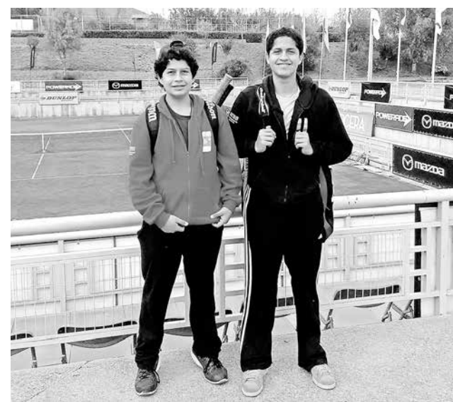
NO ES PRIMERA VEZ que se ven apoyados por el gobierno regional, lo que habla de la gran responsabilidad de sus padres.

La preparación y participación de los Toledo, tiene un alto costo en lo econó-