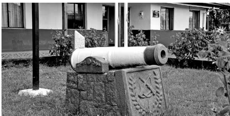
LAS DILIGENCIAS FUERON encabezadas por personal de Carabineros de Yumbel.

La denuncia por apropiación indebida fue realizada a principios de octubre de este año, en la ciudad de Illapel. Sin embargo, el delito habría ocurrido en septiembre de 2014,