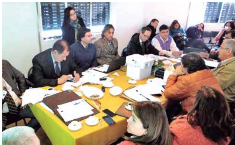
CORES REVISARON la iniciativa en las sesiones que se llevaron a cabo el pasado martes en la provincia de Biobío.

de lo que me pasó, de lo que tuve que vivir, en ningún caso quiero estar de nuevo en una situación similar”, concluyó.