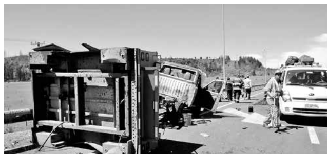
EL HECHO OCURRIÓ poco antes del mediodía de este miércoles a la altura del kilómetro 499 de la Ruta 5 Sur.

Asimismo, detalló que el conductor del camión resultó con lesiones leves y lo hacía en normal estado de temperancia alcohólica al momento de ocurrido los hechos.