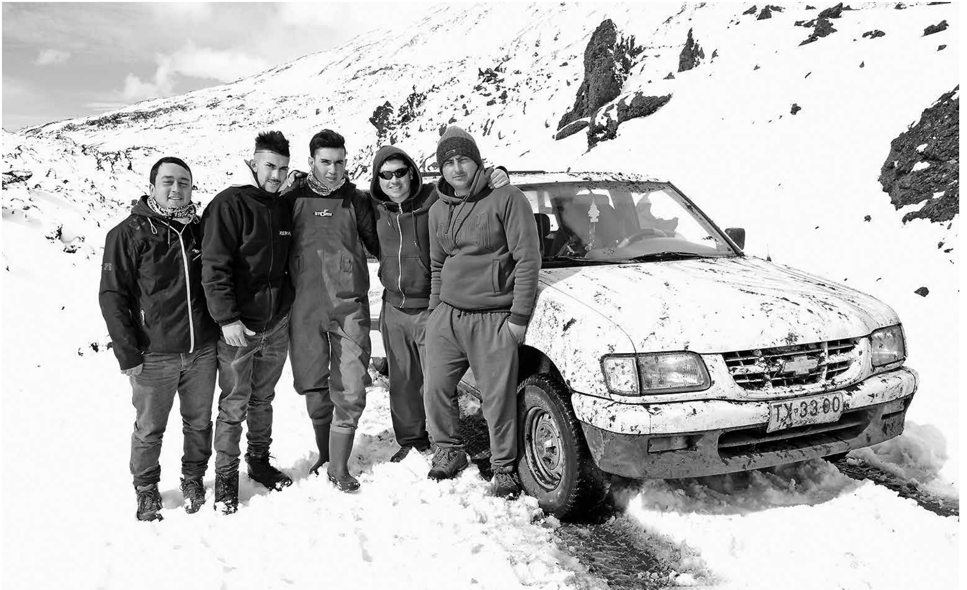
EN SEPTIEMBRE DE 2015 en Antuco cinco excursionistas se extraviaron en los faldeos del