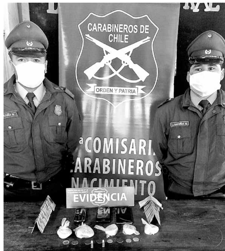
CONTROL VEHICULAR permitió sacar de circulación droga avaluada en cerca de dos millones de pesos.

Pese a que, en este caso, el propietario de la vivienda no resultó con