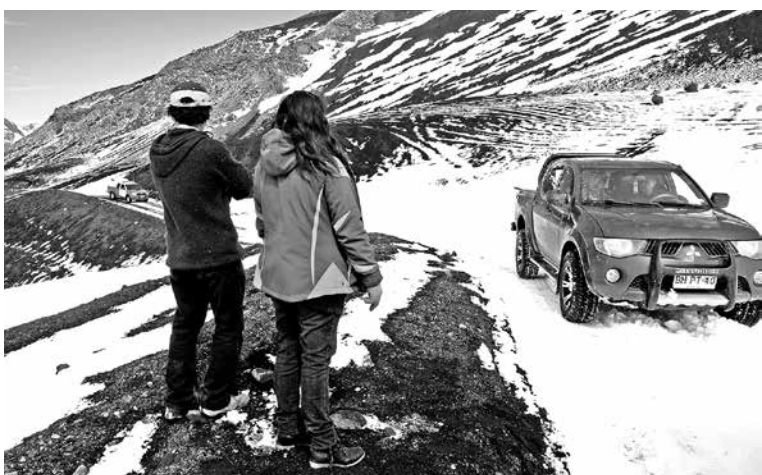
UNO DE LOS PRINCIPALES CONSEJOS es dar aviso a Carabineros y familiares de la expedición.

Con respecto a la vestimenta y los recursos óptimos para llevar a cabo una excursión de este tipo, Olate señala que idealmente se debiera contar con vestuario técnico, de preferencia usar el sistema de capas con propiedades hidrófugas e isotérmicas, que ofrece protección ante la humedad y el viento. “Un buen calzado, firme y con suela que brinde gran agarre, nos dará tranquilidad en el momento del descenso. También los bastones de caminata reducen el esfuerzo en la subida, complementando el trabajo de piernas con la tracción de los brazos, dando gran seguridad y equilibrio en las bajadas”.