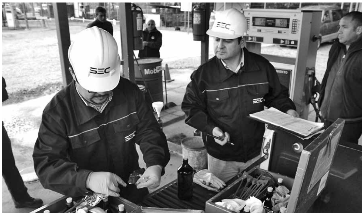
EMPRESAS DISTRIBUIDORAS que no cumplen con la normativa de calidad vigente se arriesgan a multas que pueden alcanzar los 46 millones de pesos (1.000 U.T.M.).

"Esta es una fiscalización a la calidad de los combustibles que realiza la Superintendencia de Electricidad y Combustibles para dar mayor certeza a los consumidores de que los lugares de expendio de combustibles están