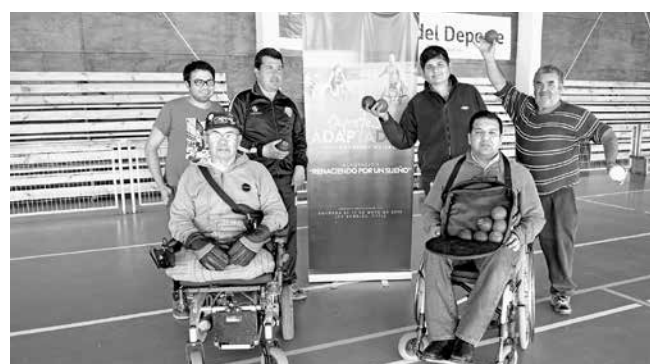
ESTOS SON ALGUNOS de los jugadores que completa el equipo de boccia de la agrupación “Renaciendo por un Sueño”.

En Los Ángeles, son la única agrupación que tiene las boccia, y requieren ayuda para poder trasladarse a Santiago, por lo que apelan a la buena voluntad de alguna empresa.