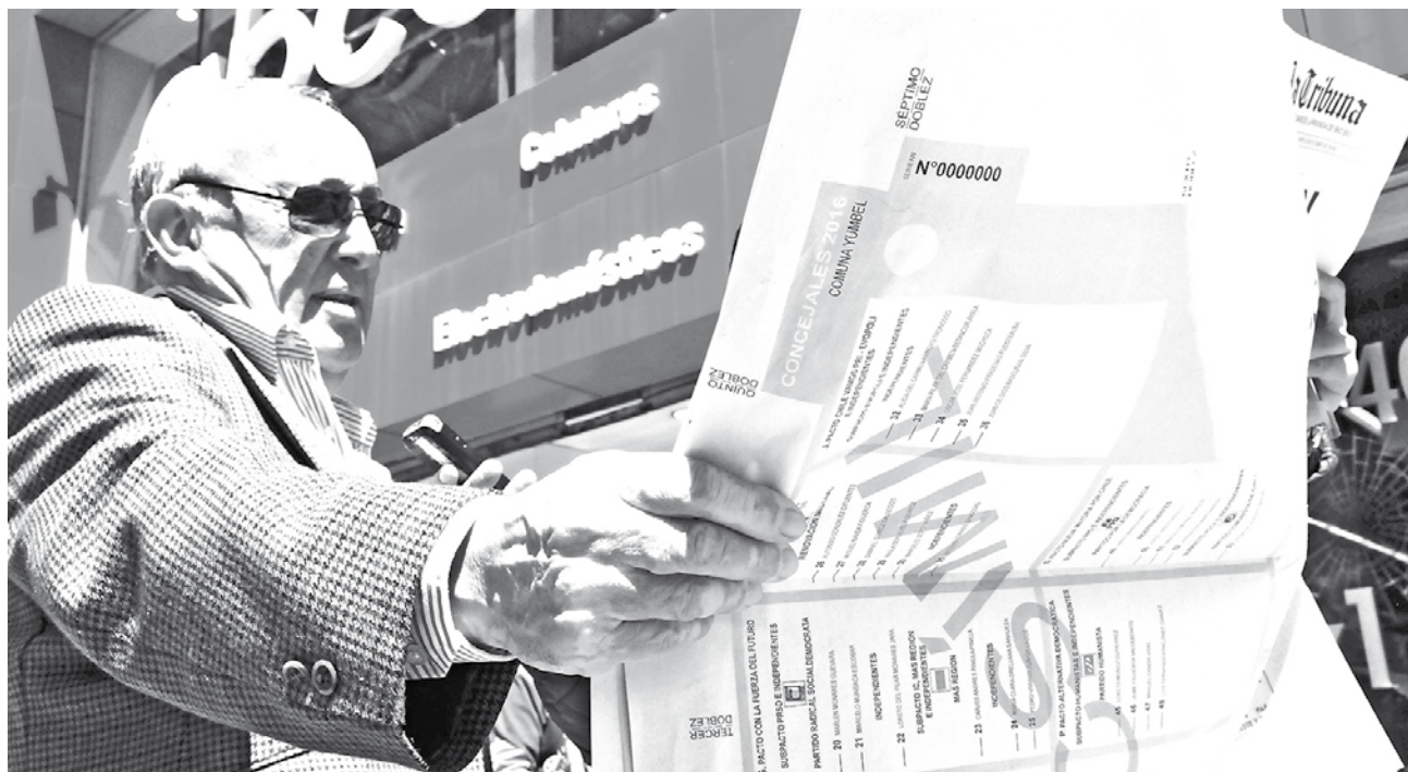
LOS LECTORES ANALIZANDO cómo doblarán el voto para el próximo domingo 23 de octubre.

“Para echarlos en la urna va ser bien complicado, espero que hayan agrandado la ranu-