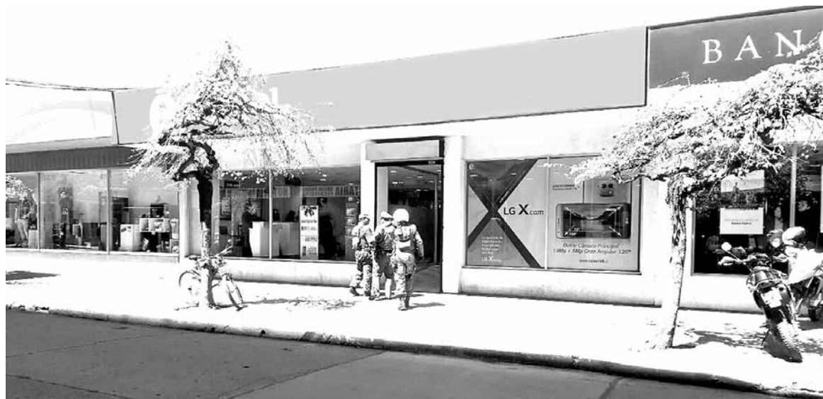
TRÁNSITO PEATONAL y vehicular por calle Lautaro permaneció cortado durante unos 25 minutos, aproximadamente.

Respecto al detenido, se trató de un hombre de 26 años, con el cual se adoptó el procedimiento de rigor correspondiente.