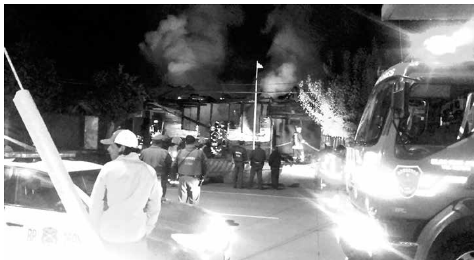
EL SINIESTRO se originó en calle Orompello, a la altura del 900.

Una persona damnificada y una vivienda completamente destruida por las llamas fue el saldo que arrojó un incendio ocurrido en la capital de la provincia de Bío Bío.