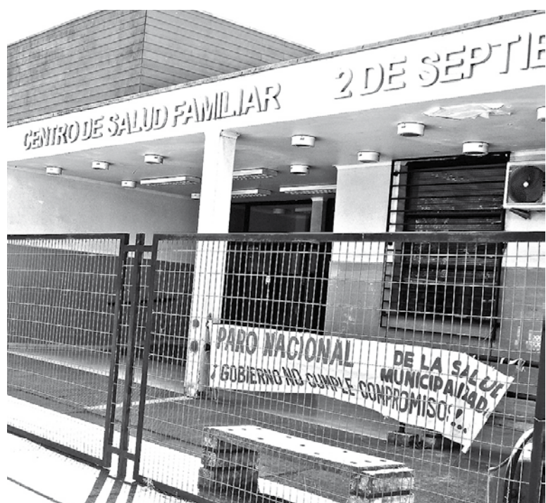
EN LOS ÁNGELES toda la salud municipalizada se adhirió a la medida de 76 horas.