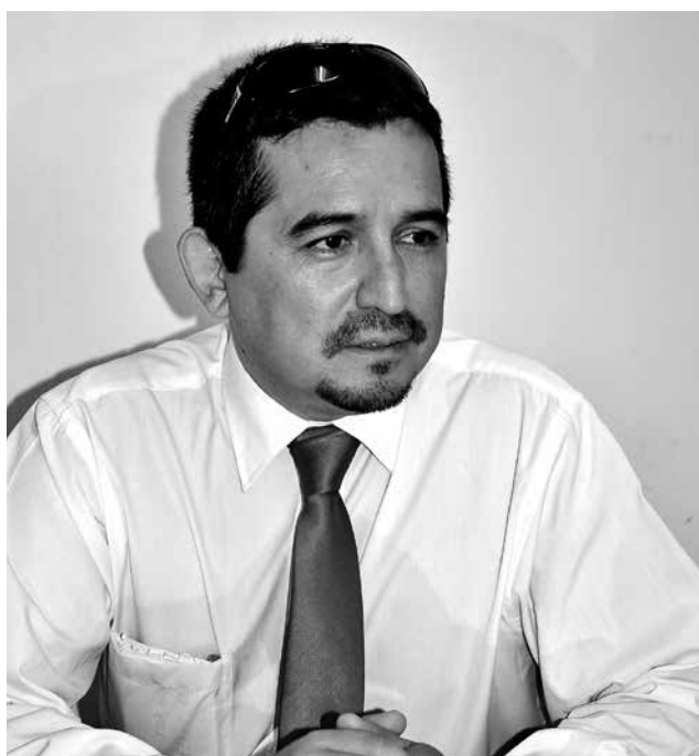
DIRECTOR REGIONAL DE FOSIS, explicó que los proyectos van en la línea del emprendimiento, para generar condiciones de habitabilidad y empleabilidad.

Durante el 2015 y 2016 las fiscalizaciones se han focalizado en las estaciones de servicio denominadas "Puntos Blancos", que no pertenecen a las grandes cadenas, ya que según los datos históricos de la SEC, en ellas hay mayor riesgo de adulteración de combustibles.