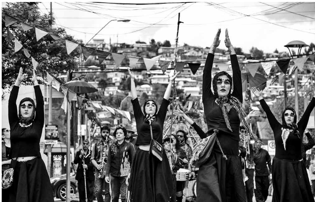
SANTA PETRONILA se presentará este viernes 21 de octubre, a las 15:45 horas en Plaza de Armas.

Quienes deseen inscribirse, deben enviar sus datos