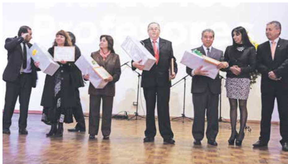
PROFESORES FUERON HOMENAJEADOS por la gran labor que desempeñan a diario.