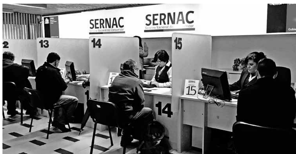
EL 24 DE AGOSTO estará en Santa Bárbara, el 26 en Quilaco, el 29 en Antuco, el 30 en Nacimiento y el 31 en Laja.