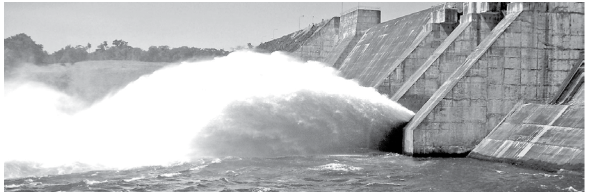
LOS LÍDERES PEHUENCHES mostraron su malestar con la instalación de nuevos proyectos energéticos.

Consultado sobre qué se le puede decir a las familias chilenas con igual o menores recursos que pagan mensualmente su cuenta de luz y no tienen ni siquiera "derecho al pataleo", el werkén contestó que "deben entender los no mapuche que nosotros somos las primeras generaciones, que esto está en la base de nuestras