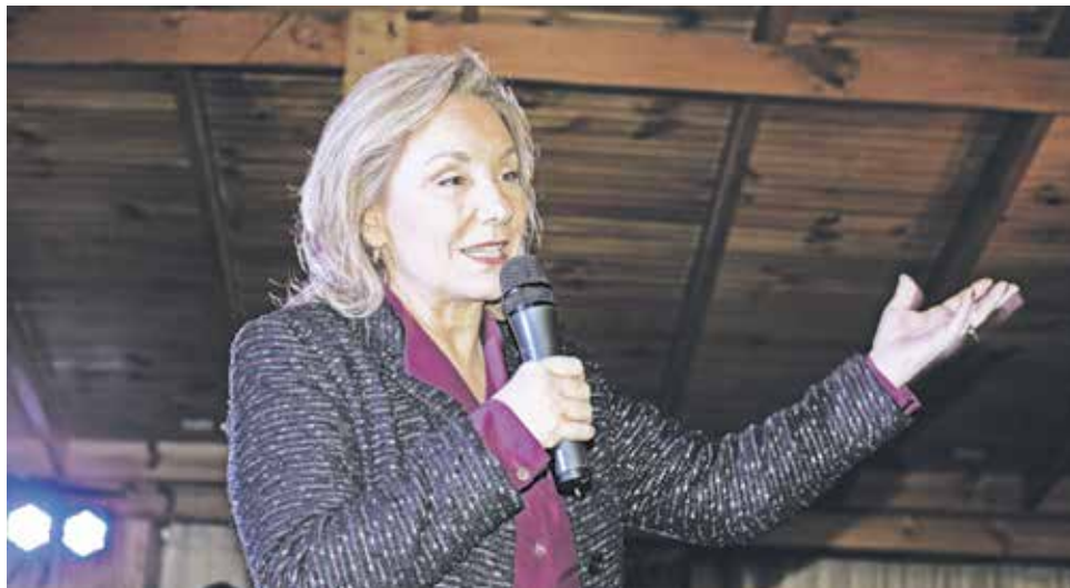
LA EX PRIMERA DAMA respondió sólo algunas preguntas de la prensa en su paso por la comuna santuario.

La ex primera dama enfatizó sus cuestionamientos a la calidad de vida.