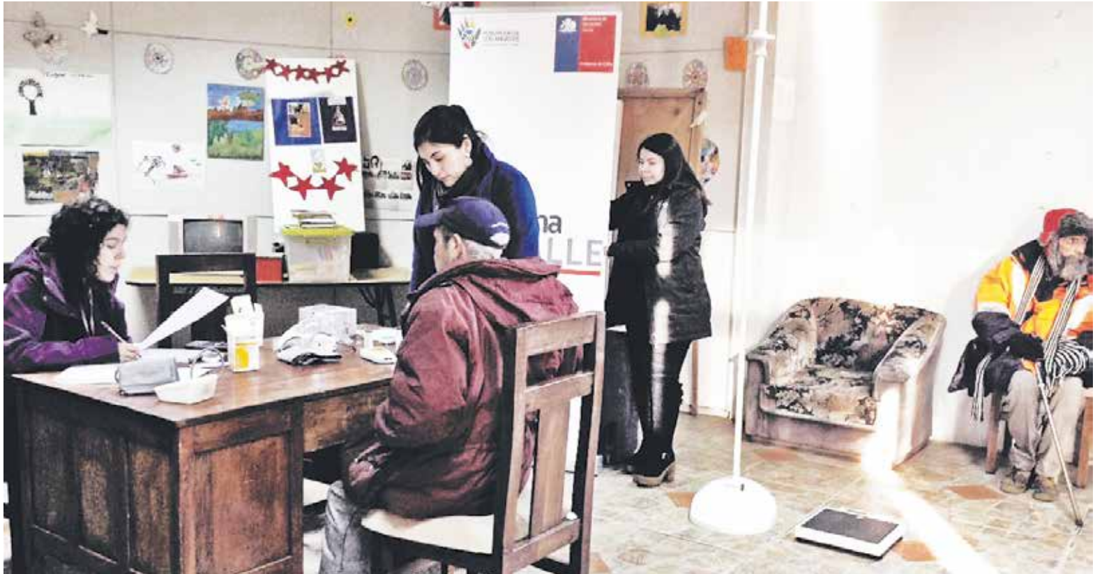
SE HICIERON CHEQUEOS preventivos, controles de peso y toma de temperatura, entre otros.

Vale mencionar que el programa psicosocial a cargo del municipio angelino tiene permanente contacto con los participantes calle, muchos