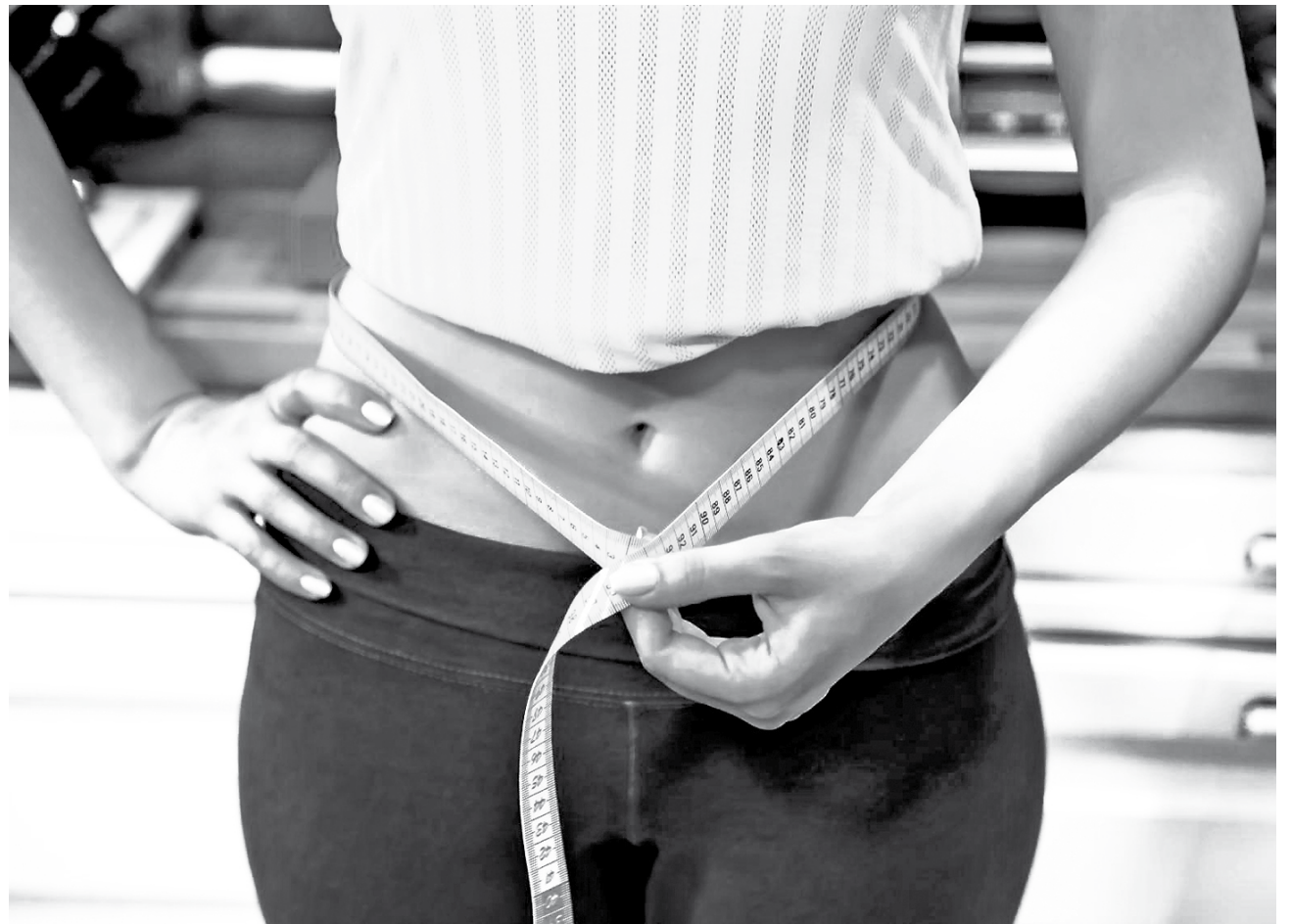
LA CINTURA ES uno de los rasgos más típicos de una mujer: es esa zona a mitad del abdomen mucho más fina que el resto del cuerpo.

extiende las piernas tanto como puedas y elévalas del suelo una cuarta, de tal modo que las rodillas queden diagonal a los glúteos y el resto de las piernas paralelas al suelo.