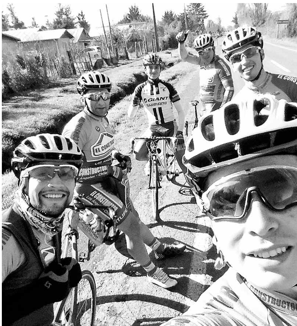
SE ESTÁN REUNIENDO dos veces al mes para entrenar enfocados en distancias con altas intensidades.

De todos modos, respecto a los entrenamientos que están realizando, Pavéz detalló que se están reuniendo dos veces al mes y están entrenando enfocados en ejecutar distancias con intensidades, con el fin de aumentar los umbrales para las próximas competencias.