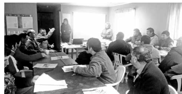
PROCESO DE FORMACIÓN se enmarcó dentro de una capacitación de bienestar animal en materia de transporte.

El jefe de la Patrulla de Atención a Comunidades