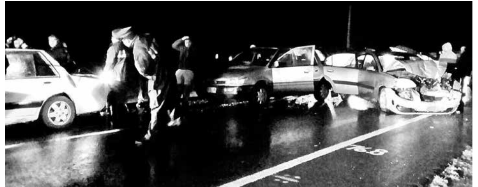
LA IMAGEN MUESTRA la magnitud y violencia con la cual colisionaron los cuatro vehículos.

Con camino resbaladizo, las precauciones son siempre las mismas, particularmente en carretera: mantener una buena distancia entre vehículos, estar atento a las condiciones del tránsito y las climáticas, y por cierto, conducir a las velocidades permitidas.