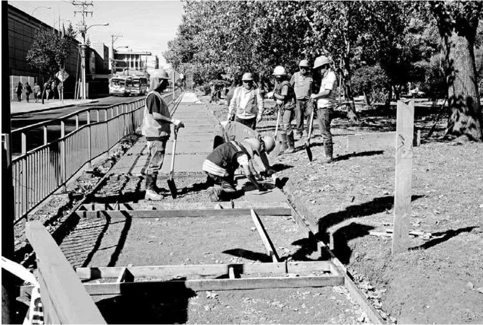
SÓLO DOS NEGOCIOS provinciales fueron dados a conocer públicamente.

Entre las que fueron sancionadas durante el primer semestre está la panadería Súper Pan de Los Ángeles, que fue multada con más de 400 mil pesos, y la empresa de fábricas de puertas Masonite de Cabrero, que no tuvo multa.