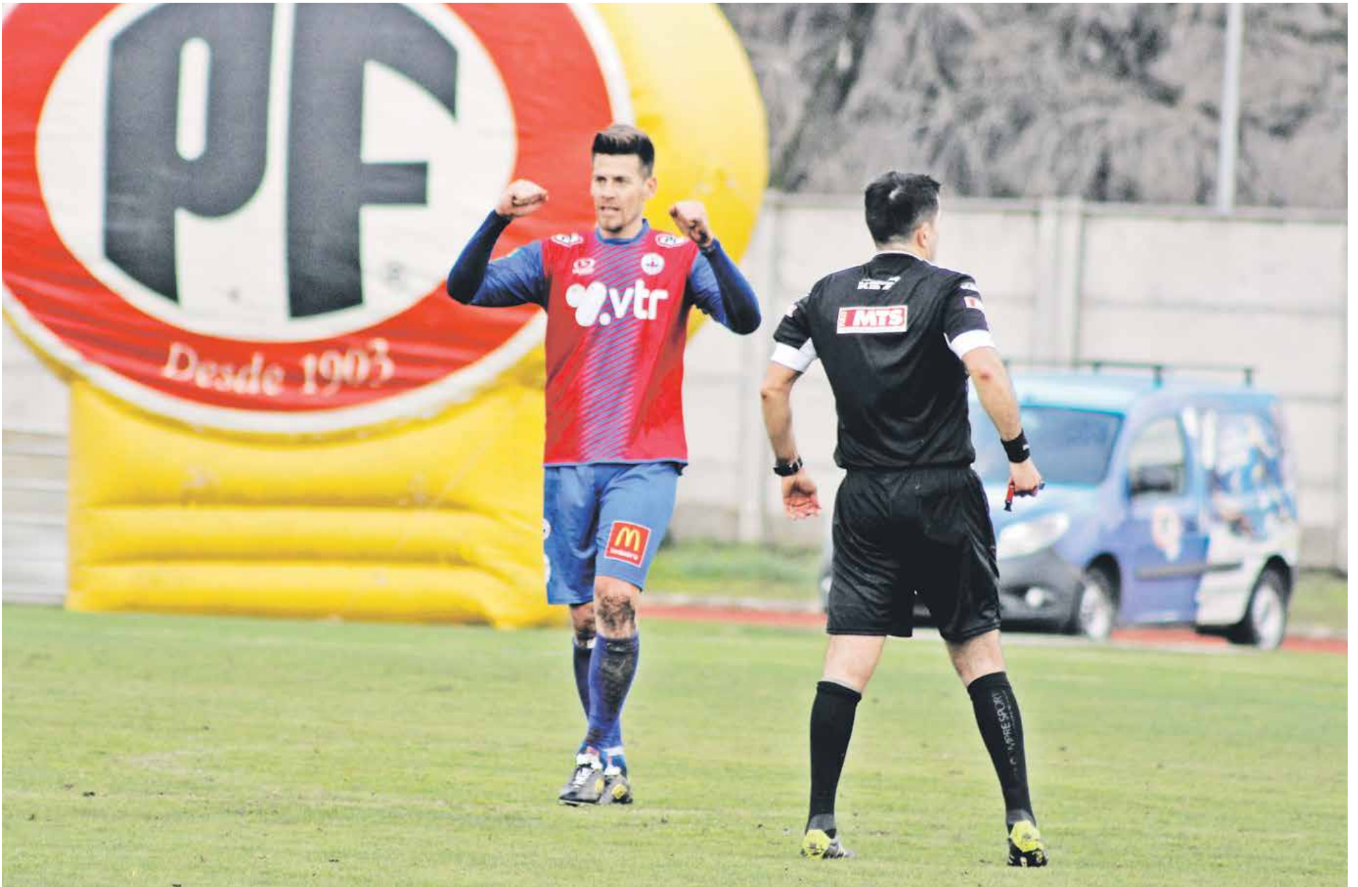
DE CABEZA FUERON los dos goles que realizó Iberia en el primer partido del campeonato.