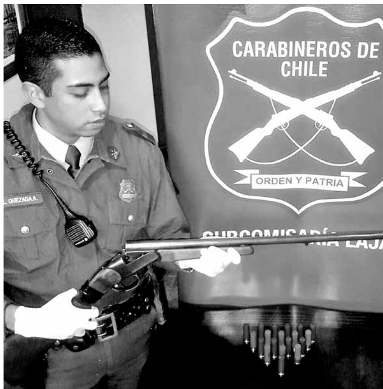
CARABINEROS INCAUTÓ una escopeta calibre 16, además de munición.

Ministerio Público para su posterior control de detención en el Juzgado de Garantía de Laja, quedando con prohibición de acercarse a la víctima y citado a audiencia de formalización durante el transcurso de esta semana.