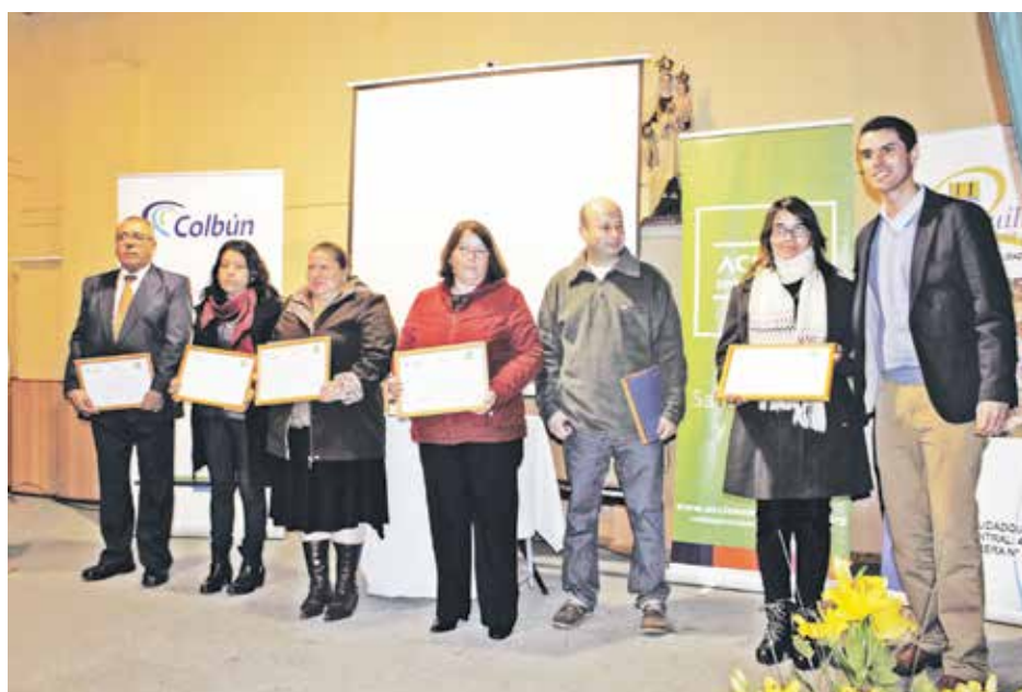
EN TOTAL FUERON 39 las personas beneficiadas gracias a esta alianza tripartita.

Perret, por su parte, comentó que Colbún mantiene un compromiso con todas las comunas donde está presente. En el caso de Quilleco, existen dos centrales con una gran capacidad instalada, donde la responsabilidad empresarial existe, pero también se desarrollan otras acciones como, por ejemplo, un apoyo a los resultados SIMCE de ambos liceos, además de otras iniciativas de inversión que se ejecutarán pronto.