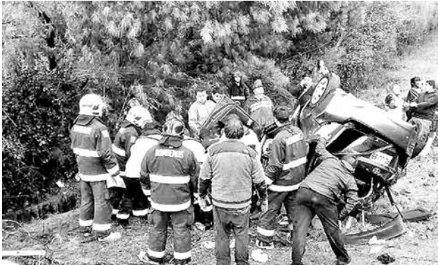
ASÍ QUEDÓ EL VEHÍCULO al volcar sobre el canal de regadío.

D urante la madrugada del 30 de julio, a las 04:40 horas, cuatro personas lesionadas y una fallecida fue el saldo de un accidente en la ruta Q-496 al llegar al kilómetro 5, en el sector denominado como puente Los Mellizos.