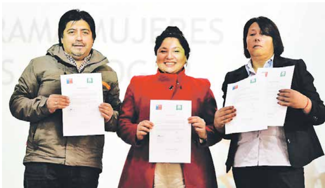
CON LA FIRMA del convenio se encuentran abiertas las inscripciones para este programa.