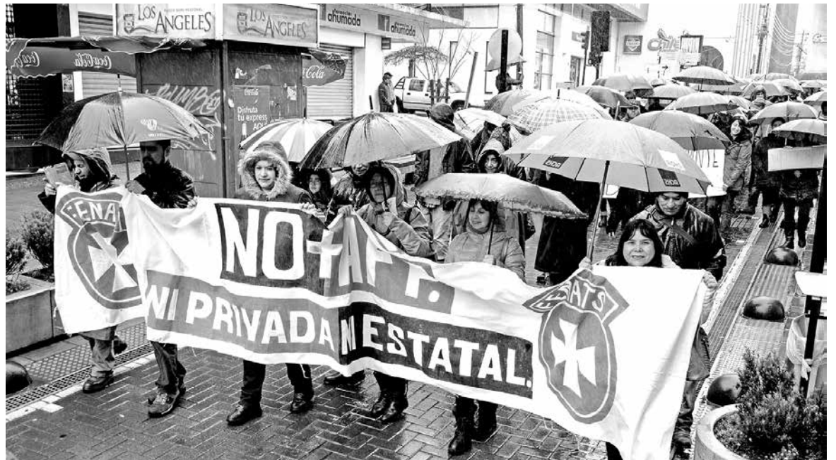
RECORDEMOS QUE LA PRIMERA marcha en la comuna reunió a más de 400 personas.

Más adelantados se encuentran con respecto a la marcha del 21 de agosto, la que volverá a tener el carácter familiar y masivo de la anterior, con la finalidad, sostienen, de dejar de manifiesto que la ciudadanía está cansada del sistema de pensiones imperante en el país.