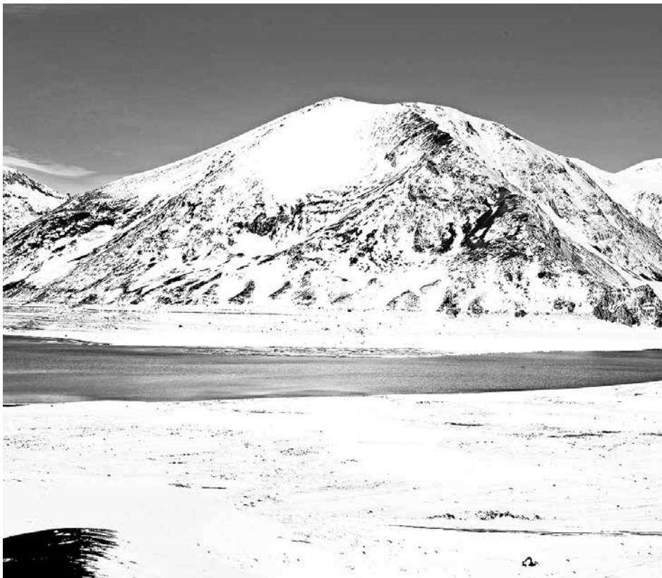
EL CLUB SÓLO LOGRÓ vender 250 tickets, de los 800 que esperaba.

“Ahora tenemos más gente arriba haciendo mantenimiento y otras cosas que hay que hacer siempre; como están contratados, están trabajando en eso a la espera de