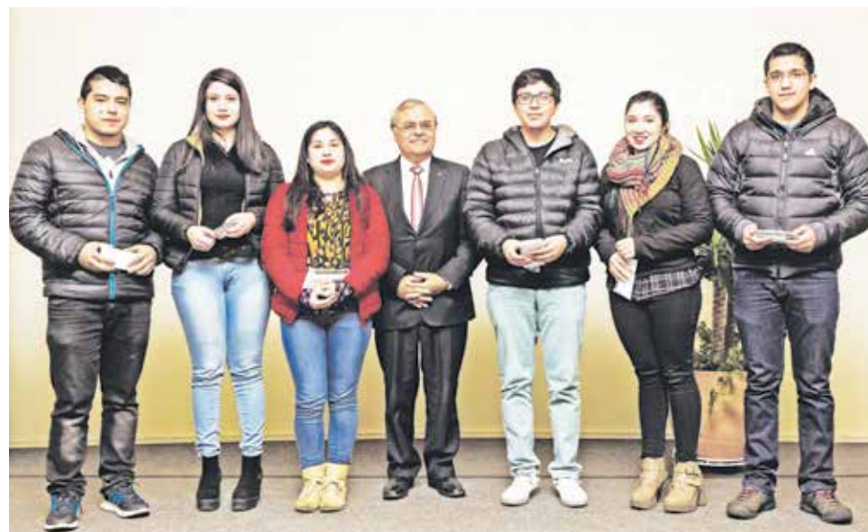
LA INICIATIVA BENEFICIÓ a 150 jóvenes universitarios de la UdeC, sede Los Ángeles.

Asimismo, destacó que están “continuando su gran obra, como es ayudar a los alumnos a mejorar su visión en pro de conseguir sus metas”.