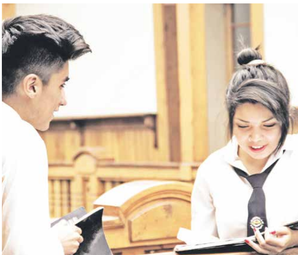
LA SOLICITUD SE DEBE HACER en la página web www.registrosocial.gob.cl .

No obstante, aquellas en las que ninguno de sus integrantes está en el RSH deben realizar la solicitud en la web registrosocial.gob.cl o hacer la solicitud de ingreso en la municipalidad correspondiente a su domicilio familiar.