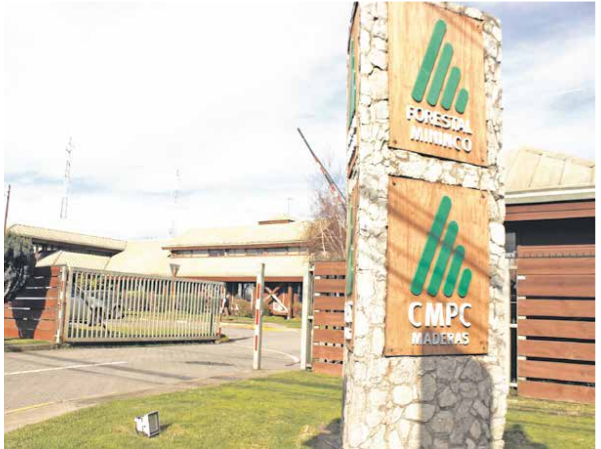
LA COMPAÑÍA DE LA ZONA difundió su Programa Vive Sano.

Explicó que "se procuró que las acciones de promoción fueran duraderas en el tiempo, que trabajaran desde la mirada de los factores protectores de la salud y no desde la enfermedad; de ellas quedaron seis, pero una no pudo participar".