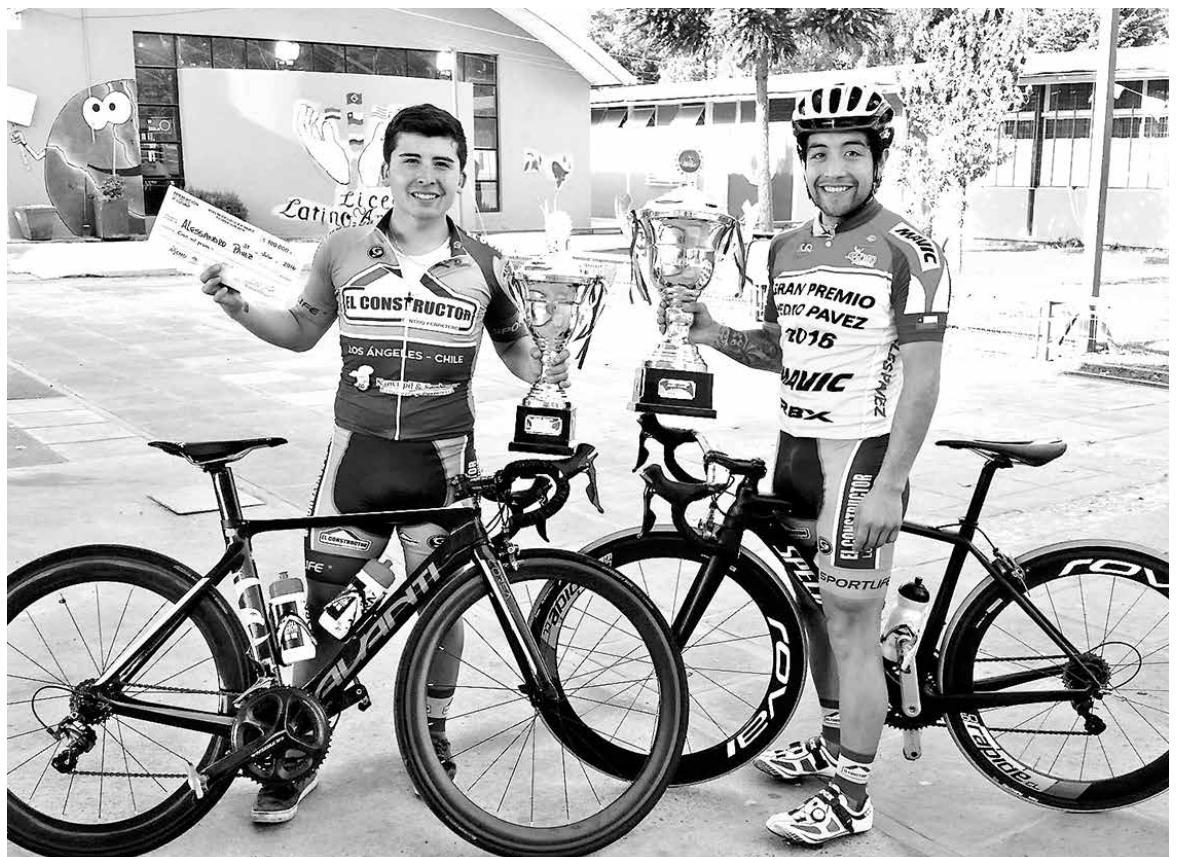
CICLISTAS ANGELINOS y de Nacimiento se robaron las miradas en Pichidanguí.

Sabido era que la principal competencia a la que aspiran llegar es a la del país trasandino, y todo lo que han hecho durante este último tiempo apunta a una preparación exigente