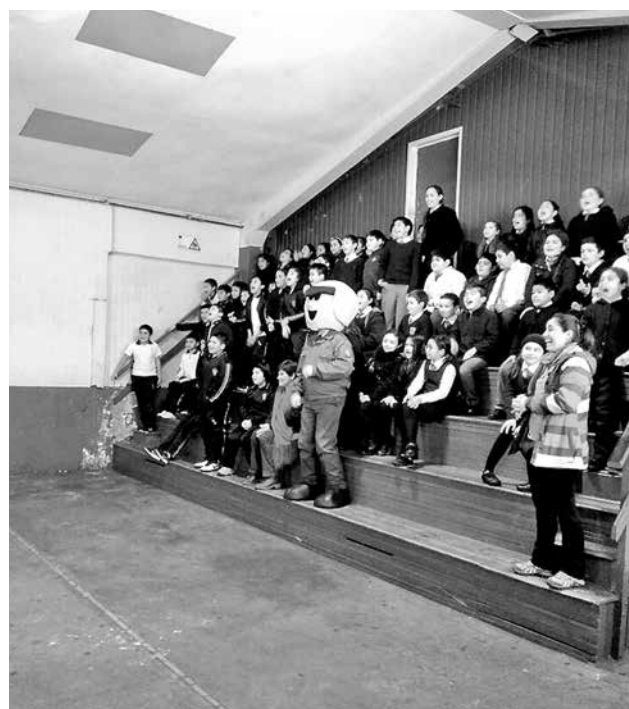
CERCA DE MIL ESTUDIANTES de Yumbel participaron en esta iniciativa.

Todas ellas apuntan a entregar medidas en materia de seguridad vial y de autocuidado; de esta forma, durante la jornada de ayer, la Escuela de Tránsito de Carabineros de Chile visitó varios colegios de la localidad. En ellos, Carabineros impartió charlas en torno a las medidas preventivas que deben evitar los alumnos para evitar ser víctimas de atropellos. Sin embargo, una de las actividades que más sensación causó fue la obra de títeres llamada "Signos vitales", iniciativa desarrollada en el gimnasio municipal de la comuna y que enseña a los