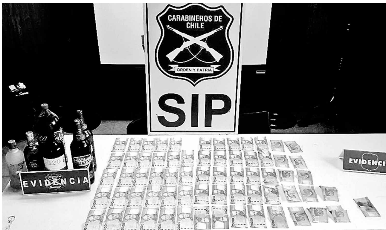
PARTE DEL DINERO sustraído fue encontrado al interior de una vivienda emplazada en la población J. Pérez de Mulchén.

En el lugar, expresó Valdés, Carabineros logró recuperar