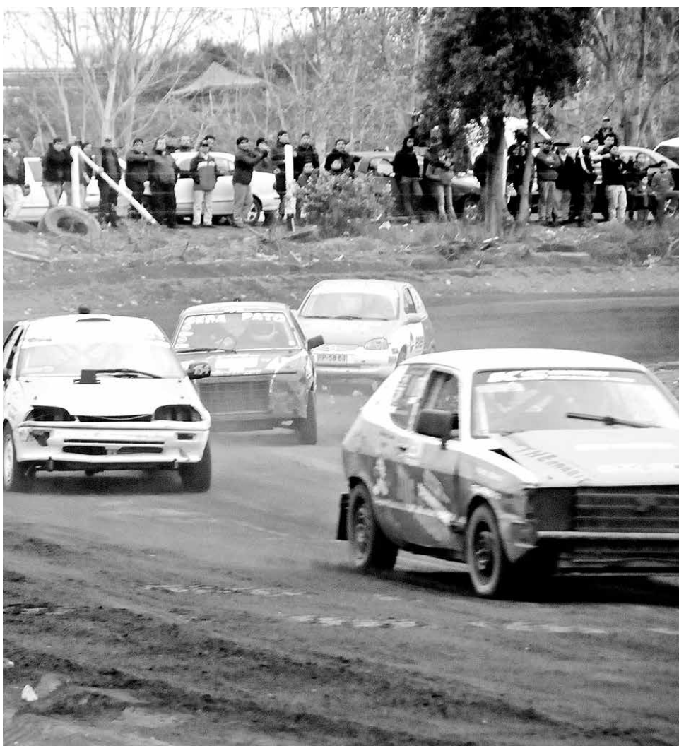
EL 14 DE AGOSTO SE VOLVERÍA a correr, y si no, se suspende hasta septiembre sin posibilidad de nuevo receso.

Es por ello que, en la misiva, dijeron que a raíz de lo expuesto “informamos a ustedes que el periodo de invierno restante procederá de la siguiente forma: la cuarta fecha ha sido planificada para el día 14 de agosto de 2016, y en el caso de que el tiempo no permita hacer la carrera, se realizará receso hasta el mes de septiembre en día y fecha a informar. Suponemos que ya vendrá el buen tiempo (de septiembre en adelante) y no tendríamos fechas móviles para el resto del torneo 2016”.