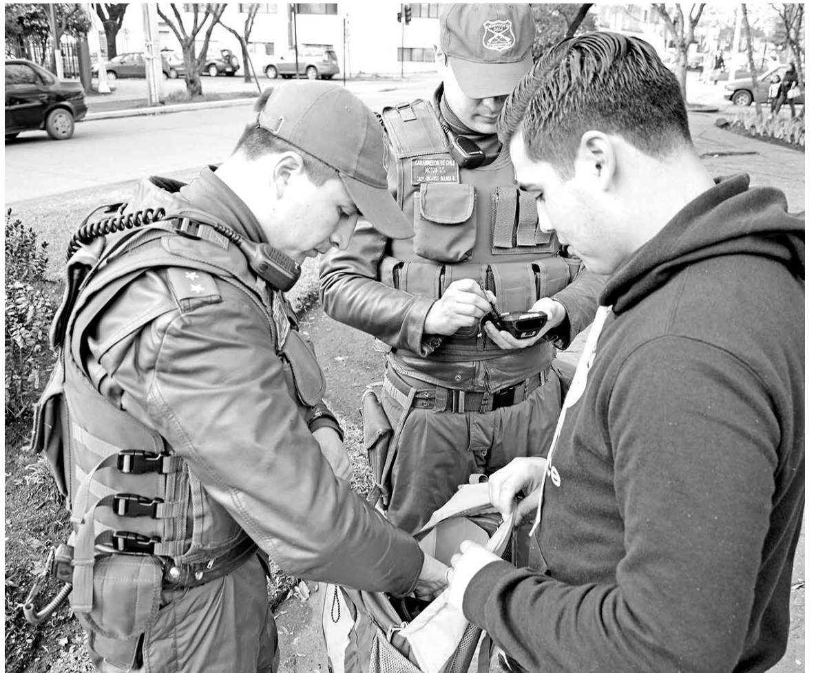
PERSONAL DE LA PATRULLA Centauro ha efectuado 4 mil 917 controles de identidad en lo que va de este año.

En virtud de ello es que “para nosotros es importante la denuncia, porque con eso nosotros vamos focalizando y realizando nuestros análisis con las herramientas tecnológicas con las que contamos”, explicó Zenteno. Con dichos antecedentes podrán determinar, de forma oportuna, qué lugares van a patrullar. “Conforme a esa información se disponen los servicios y se repotencian los controles en un sector determinado”, añadió el oficial. Los servicios se realizan todos los días y durante