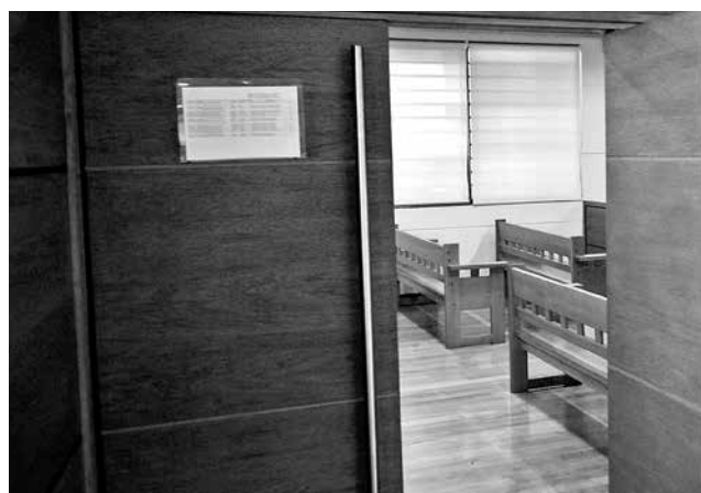
LA AUDIENCIA de formalización de cargos se realizará en dependencias del Juzgado de Garantía de Los Ángeles.

Durante la jornada de este martes se espera que sea formalizado el presunto autor del homicidio ocurrido este fin de semana en la comuna de Los Ángeles.