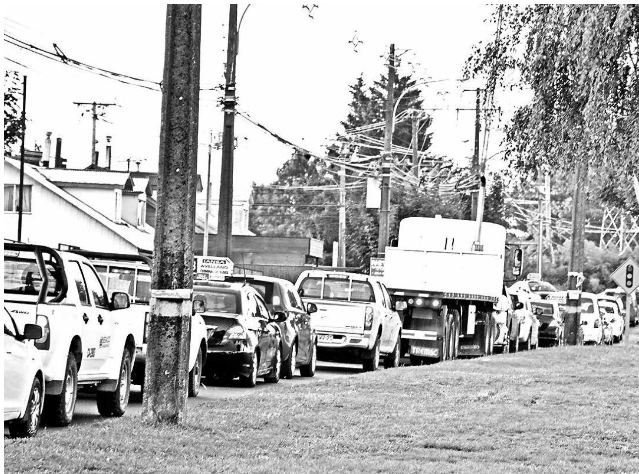
LAS VIVIENDAS SON, por lejos, las que más contaminan en Los Ángeles, llegando al 94% de las emisiones de material particulado.

Pese a que las cifras son bajas, fue el mismo seremi quien comentó que igualmente el parque automotriz formará parte del plan de emergencia de descontami-