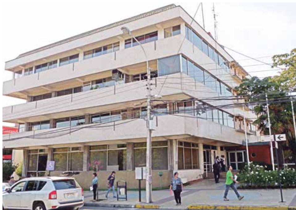
DESDE LA ENTIDAD municipal decidieron no entregar un planteamiento a Diario La Tribuna.

Por último, el informe precisó también situaciones puntuales en la materia, como tareas asignadas fuera del horario laboral consideradas