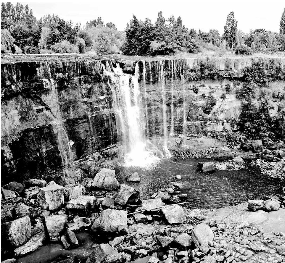
LA INICIATIVA PRETENDE que el lugar sea salvaguardado por el Sistema Nacional de Áreas Silvestres Protegidas.

Vale mencionar que a la reunión de coordinación fueron invitados los tres municipios que inciden en el lugar, sin embargo, ninguno se hizo presente con un representante, situación que fue considerada por los ecologistas como otra muestra más de indiferencia de la autoridad.