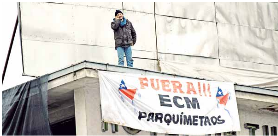
Uno de los manifestantes, incluso, instaló una pancarta en el techo del Hotel Alcázar.

Con base en la argumentación, se le preguntó cómo se enteró de que no existía esa política de concesiones, a lo que respondió que “este documento nunca ha sido dictado por el municipio, como consta en la respuesta que entregó el secretario municipal, con fecha 30 de noviembre del 2015, en donde sostiene que el municipio no cumple con el artículo 65 letra A de la Ley Orgánica Constitucional de Municipalidades”.