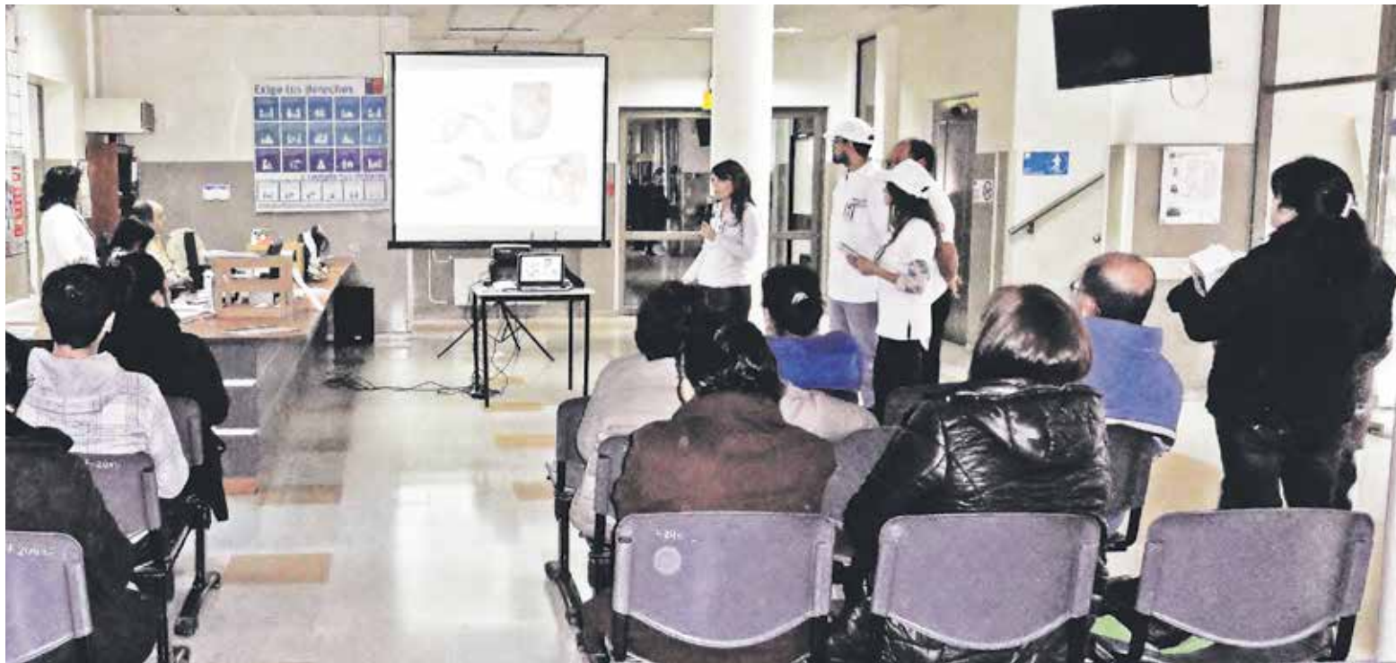
LA ACTIVIDAD PREVENTIVA fue dirigida a los usuarios del citado centro de salud de la provincia.

Vale comentar que es el odontólogo el que tiene un rol fundamental y clave entre los profesionales de la salud en instruir a sus pacientes en la detección precoz del cáncer oral, que forma parte de los cánceres de cabeza y cuello; este rol clave se basa en la realización del examen preventivo de cáncer oral a todos los pacientes.