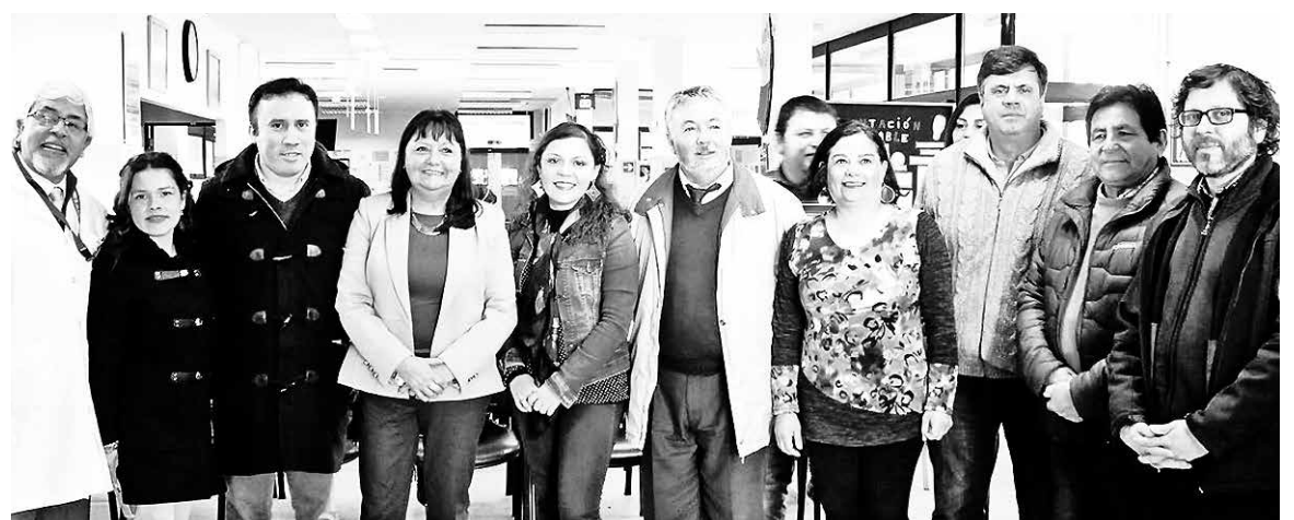
AUTORIDADES PRESENTES en el evento.