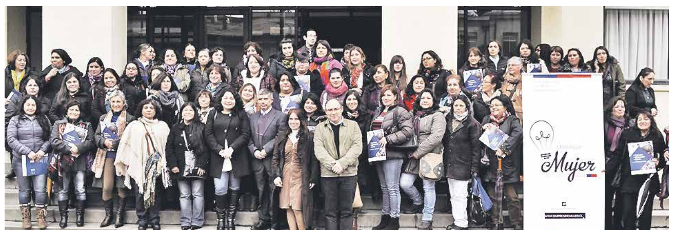
PARA ESTE AÑO HAY 70 beneficiadas entre las dos comunas de la región.

Por último, cabe destacar que las Escuelas de Emprendimiento contemplan el desarrollo de seis módulos de trabajo: Empoderamiento de la mujer y habilidades emprendedoras; Desarrollo de la marca y marketing; Educación financiera; Asociatividad; Instrumentos públicos y privados de fomento, y Formulación de proyectos.