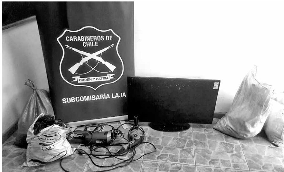
VARIAS ESPECIES, cuya procedencia sería producto de un robo, fueron recuperadas por Carabineros en la comuna de Laja.

El hombre que se dio a la fuga estaría plenamente identificado, mientras que Carabineros está trabajando en la ubicación de esta persona para su detención respectiva.