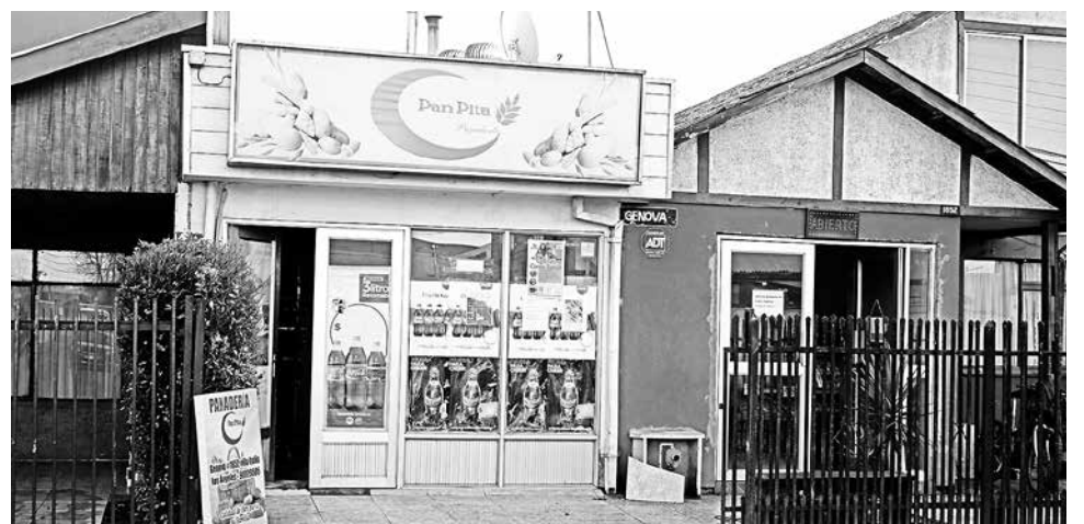
Cerámicas sueltas y tabiques rotos, así como falta de ventilación, fueron otras de las infracciones que se hallaron en el local.

Desde la Seremi de Salud destacaron que era importante mencionar que los procesos sumarios pueden establecer sanciones, que van desde una amonestación, a multas entre