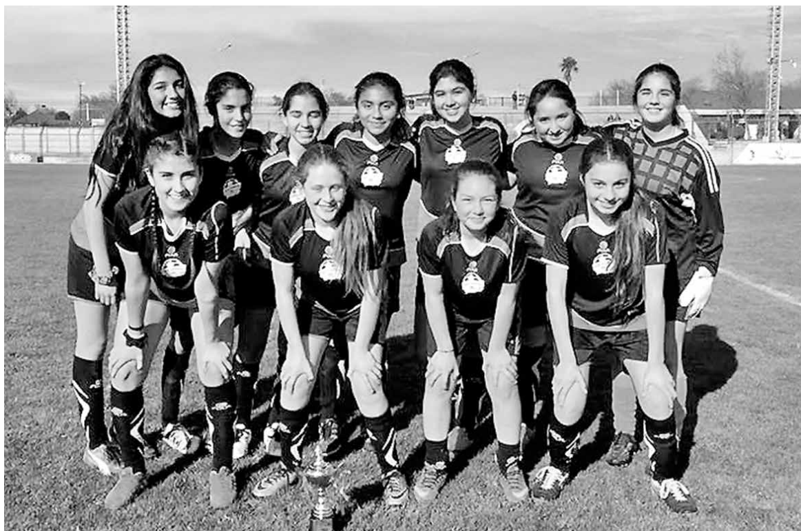
ESTA ES LA SELECCIÓN FEMENINA del San Gabriel, que se convirtió en bicampeona de la competencia.

Representarán a la comuna de Los Ángeles en el campeonato provincial a efectuarse el 8 de septiembre, en Nacimiento.