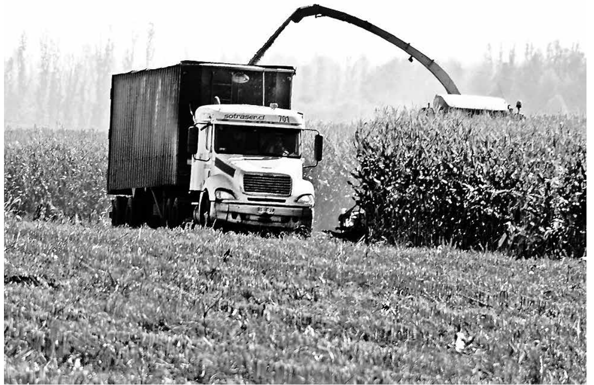
EL DIRECTOR REGIONAL de Indap llamó a los agricultores a programar con cuidado sus próximas siembras.

En cuanto a cifras, dijo que "si sigue la sequía podríamos llegar a un 50 o 60% de pérdidas, porque si