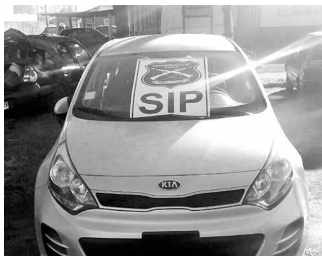
EL VEHÍCULO FUE ENCONTRADO en el pasaje Andrés Bello, de la población María Luisa Bombal.

Cuando Carabineros tomó contacto con la víctima, esta habría manifestado que