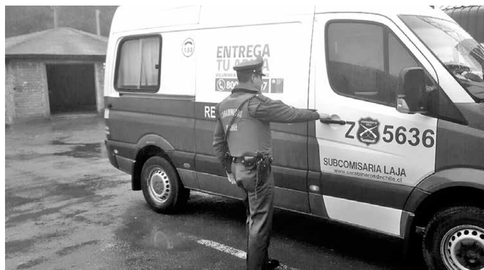
LAS DILIGENCIAS FUERON encabezadas por personal de la Subcomisaría de Carabineros de Laja.

Por lo anterior, "habría enviado a su hermano a consultarle por ello, ya que él conocía a la víctima. El hermano tenía el teléfono en su poder, salió desde donde estaba viendo la transacción el adulto, se lo entregó y el menor agredió con un golpe de puño a la víctima, ésta se cayó y ahí huyeron los dos", puntualizó Parra.