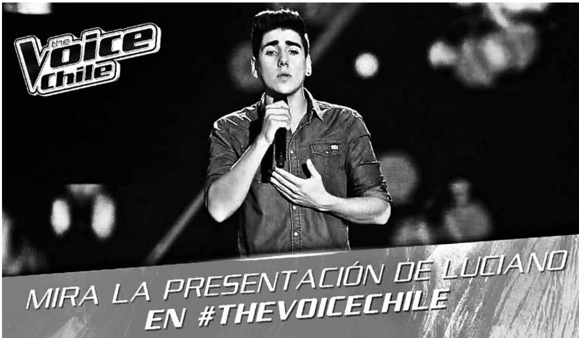
El artista yumbelino ya pasó la etapa de batallas y continúa en la competencia, donde es uno de los favoritos del público.

Sebastián Díaz Sandoval prensalatribuna@gmail.com