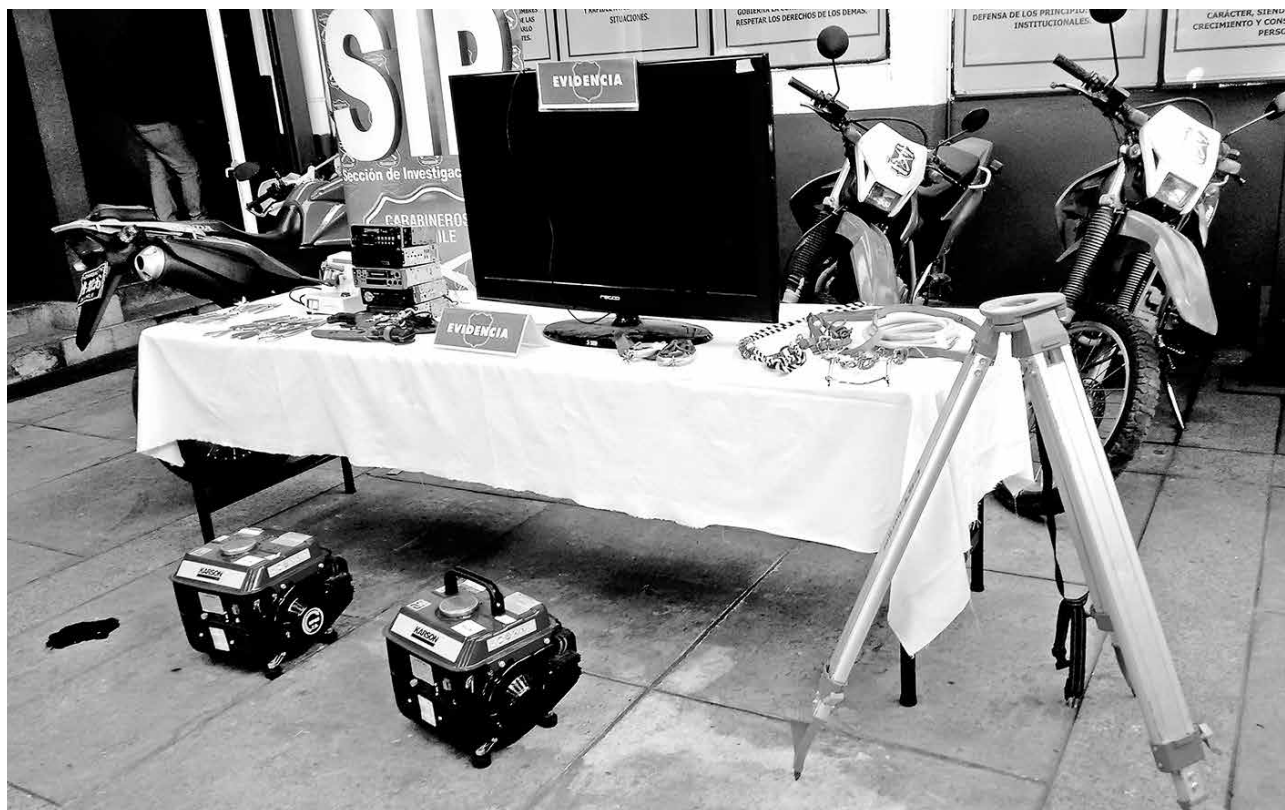
DIVERSAS ESPECIES fueron recuperadas por efectivos de la SIP de Carabineros de Los Ángeles.

Entre los objetos incautados se encontraba un plasma, accesorios de caballares, generadores, radios de vehículos y un equipo odontológico, el que habría sido sustraído hace unos cinco años desde el Hospital Base de Los Ángeles,