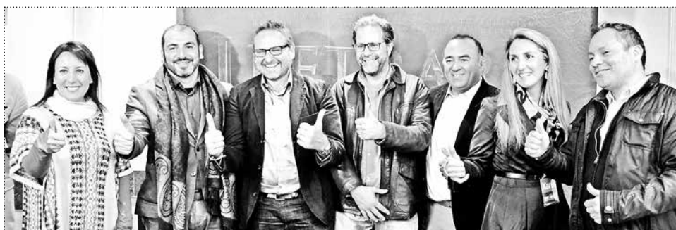
EN OCTUBRE SE TOMARÁ la decisión que podría concretar que Biobío sea parte de la cinta.