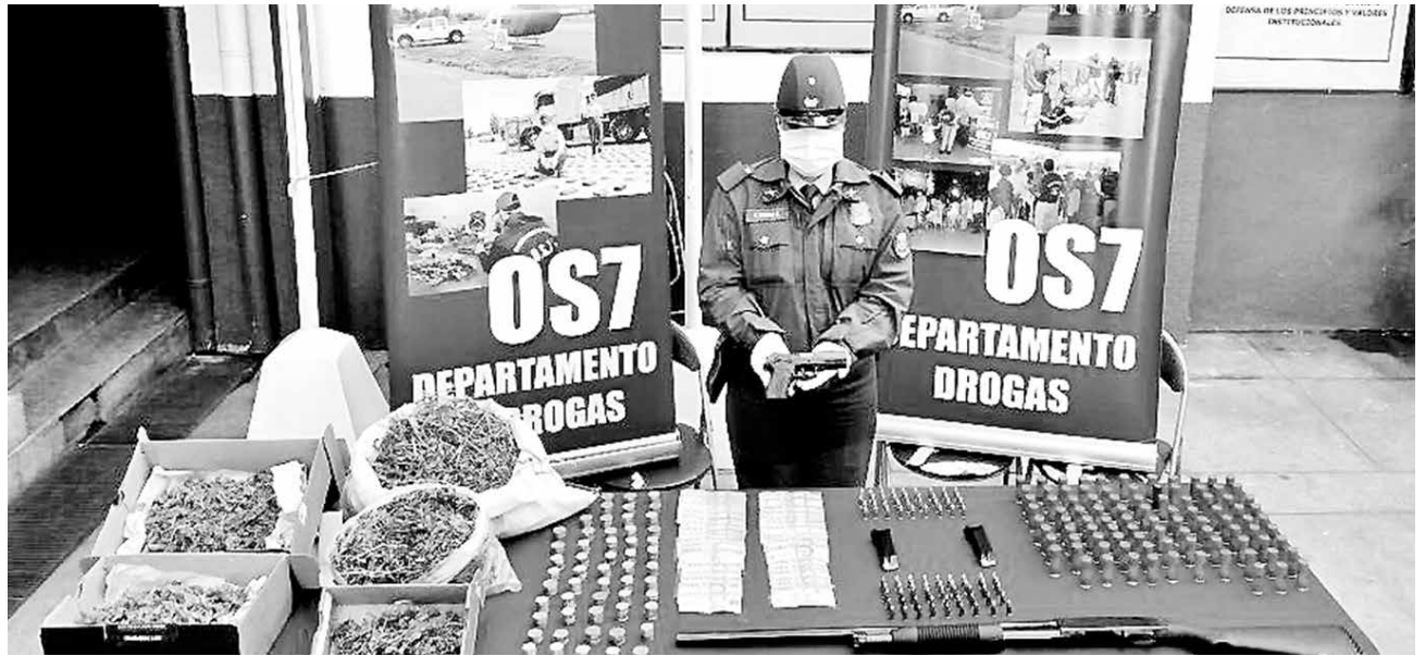
LA DROGA INCAUTADA bien puede ser avaluada en un monto cercano a los 20 millones de pesos.

Traducido en dosis, esta droga equivaldría una cantidad cercana a las 5 mil; en su mayoría, cogollos. Estos son brotes que contienen un alto nivel de THC, lo que puede