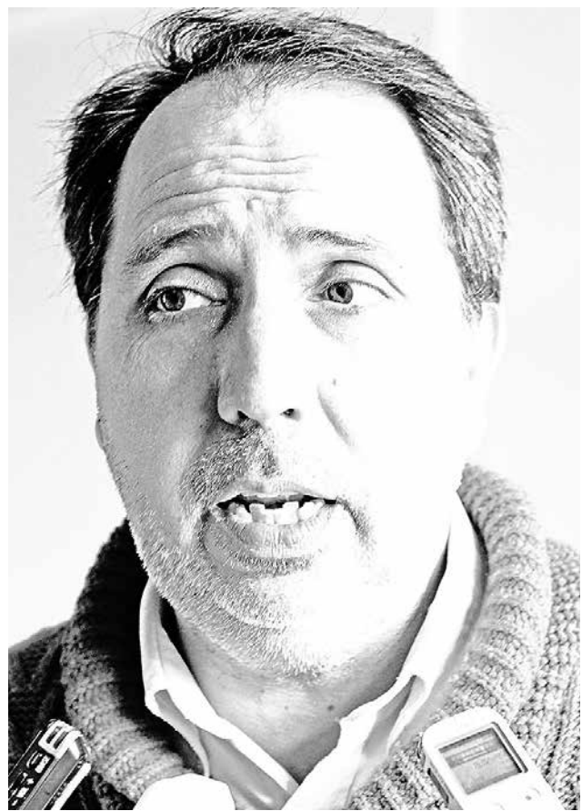
EL PRESIDENTE DE APIALÁN aseguró que se reunirá con los socios para discutir el caso y debatir con las autoridades.