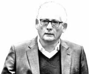
Gonzalo Navarrete, presidente del PPD

“Valoramos altamente que la Presidenta haya tomado una decisión política de enfrentar el tema de mejores pensiones para los chilenos, esto que inicialmente no estaba en una agenda prioritaria, pero hoy existe claramente una demanda social por resolver en temas de mejores pensiones para los chilenos”.