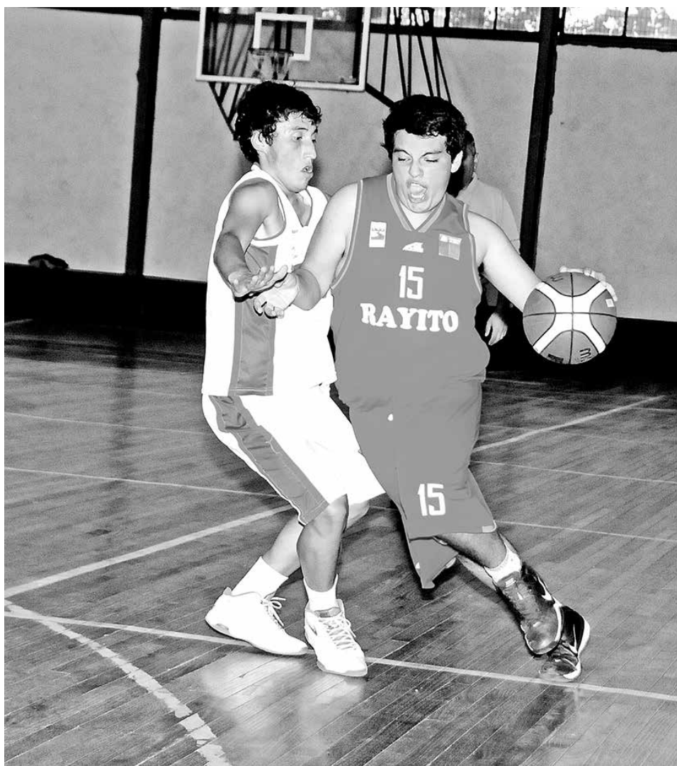
AUTORIDADES LE RATIFICARON los recursos para tener un equipo profesional en la liga nacional.

En un partido donde el establecimiento ganador no tuvo contrapeso, se definió la última competencia que estaba pendiente.