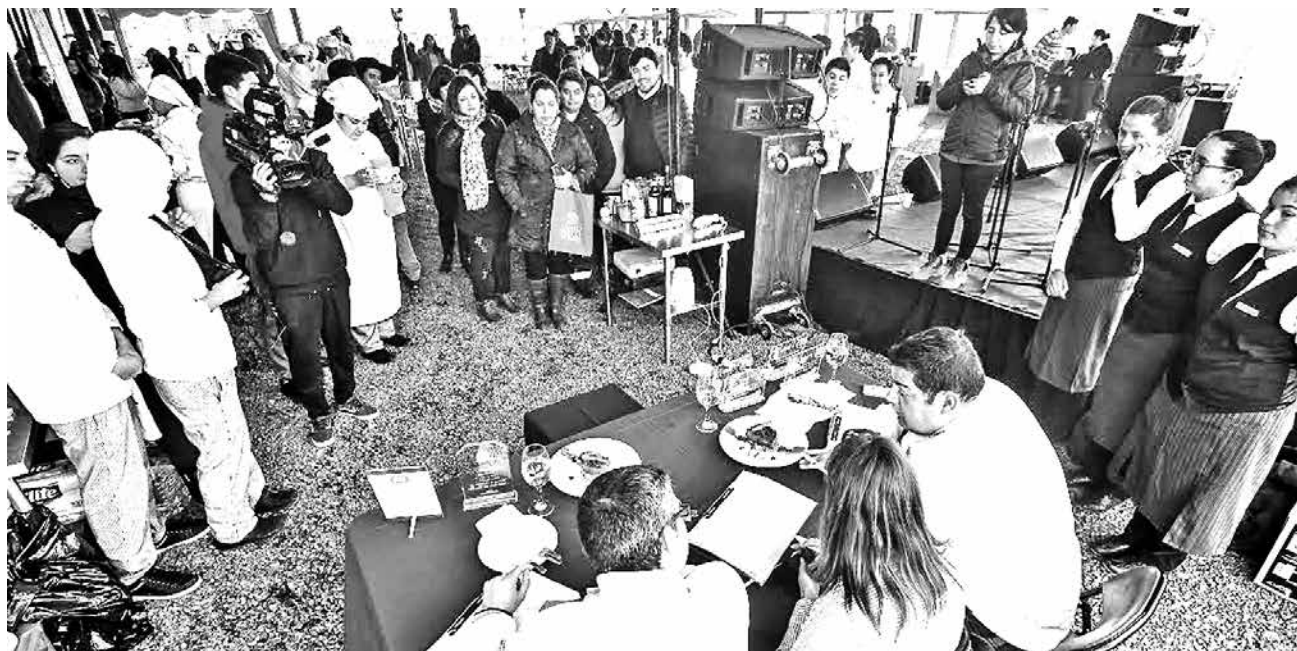
“RINCÓN DEL LAGO”, se alzó como el Restaurante ganador del concurso de comida.