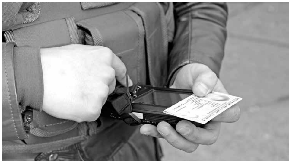
LOS CONTROLES PREVENTIVOS de identidad realizados en Los Ángeles han permitido detener a 38 personas.

Estos contemplan los robos con violencia, con intimidación, por sorpresa, lesio-