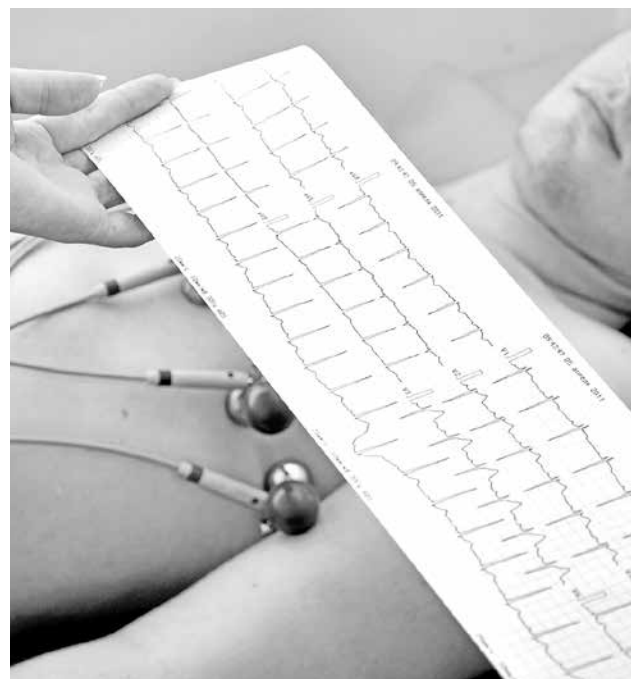
LA DIABETES, HIPERTENSIÓN Y COLESTEROL alto dañan gravemente el corazón y otros órganos.

Verdadero. Una enfermedad crónica, es aquella que no tiene cura y por lo tanto la