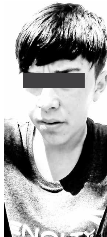
EL ADOLESCENTE SALIÓ a juntarse con unos amigos, el pasado sábado y no volvió a su casa hasta la madrugada de ayer.