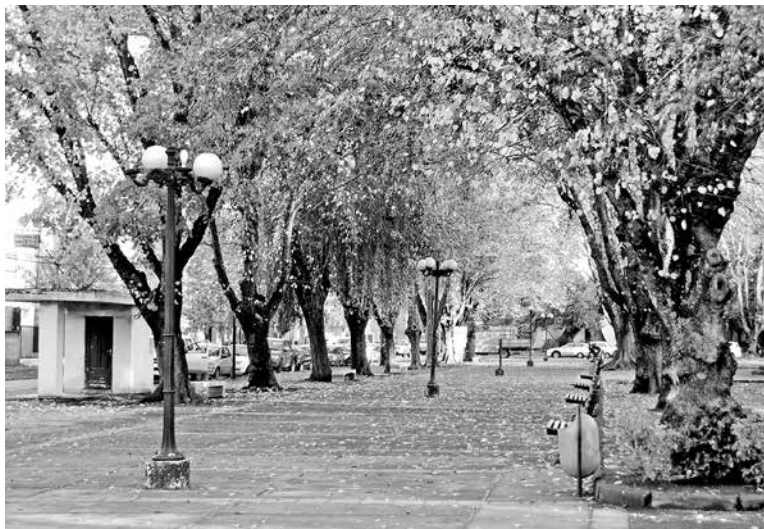
EL GERENTE DE UNA EMPRESA de control de plagas aseguró que hace unos años se hizo una desratización en la Plaza Pinto.

"Yo hace 2 días atrás me vine a lustrar y de repente pasó algo entre mis piernas, y justamente era un ratón grande que venía como de la esquina. Yo me asuste un poco, sin embargo, vi como el guarén se subió y se metió entremedio de uno de los árboles", aseguró.