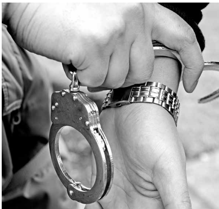
EL HOMBRE FUE DETENIDO a unas tres cuadras del lugar donde cometió el delito.

Desde Carabineros de Chile relataron que esta persona registra antecedentes por delitos anteriores, pero ninguno vigente.