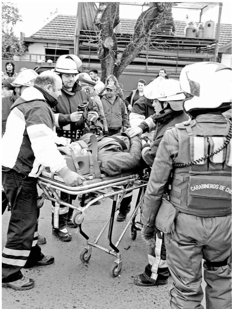
EL MOTORISTA HERIDO fue trasladado por personal del SAMU hasta el Hospital Base de Los Ángeles.

Los lesionados fueron trasladados hasta el hospital de Laja y posteriormente al Complejo Asistencial "Dr. Víctor Ríos Ruiz de Los Ángeles".