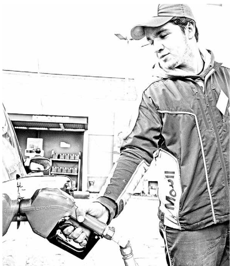
SE ESPERA QUE PARA las siguientes semanas, continúe la baja de precios.