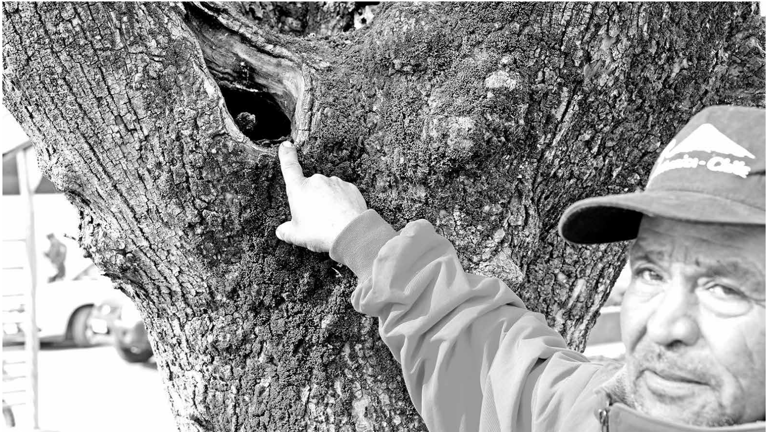
EL LUSTRABOTAS asegura que ha visto los roedores esconderse en los árboles.