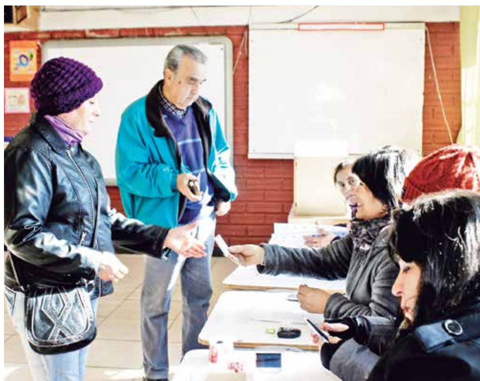
HASTA EL MOMENTO Los Ángeles tiene cuatro opciones confirmadas para los comicios de octubre.

EN LOS ÁNGELES 2 POSTULANTES QUEDARON EN EL CAMINO