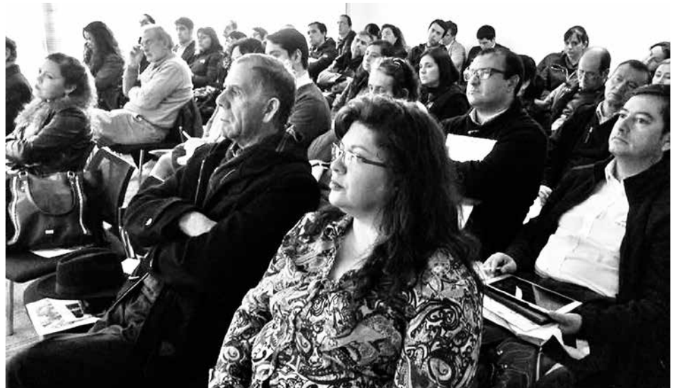
EL EVENTO ESTUVO MARCADO por una alta concurrencia de público.

El año 2013, el Presidente de la República, Sebastián Piñera Echeñique, promulgó la mayor reforma en los veinte años de existencia de la Ley de Donaciones con Fines Culturales. Esta reforma multiplica el universo de donantes, amplía el número de beneficiarios, extiende los plazos de ejecución de los proyectos, permite la comercialización de los bienes que surjan de los proyectos y amplía la fiscalización para resguardar el buen uso de la ley.