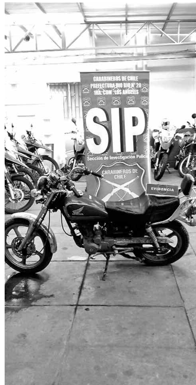
LA MOTOCICLETA era comercializada a través de Facebook, logrando ser recuperada en Loncopangue.

La investigación en torno a este hecho continúa por parte de la SIP, puesto que el joven deberá dar cuenta respecto a los motivos por los cuales comercializaba una motocicleta que mantenía encargo vigente por el delito de robo.