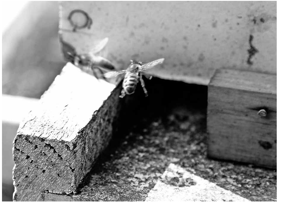
LA ACTIVIDAD APÍCOLA en la zona, ha ido en aumento durante los últimos años, y ya no sólo acoge a una pequeña cifra de productores.

Asimismo, agregó que se encuentran saliendo de