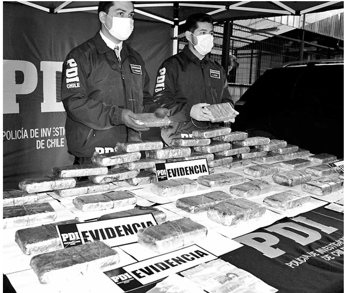
LA BRIANT PENQUISTA sacó de circulación 56 contenedores de droga con un peso aproximado de 39 kilos.

Fue específicamente a la altura del peaje Las Maicas donde "se procedió al control de un vehículo, el cual al ser registrado se le encontró una cantidad importante de cannabis sativa en compartimentos ocultos en el pick up del automóvil", detalló el jefe de la Brigada Antinarcóticos de