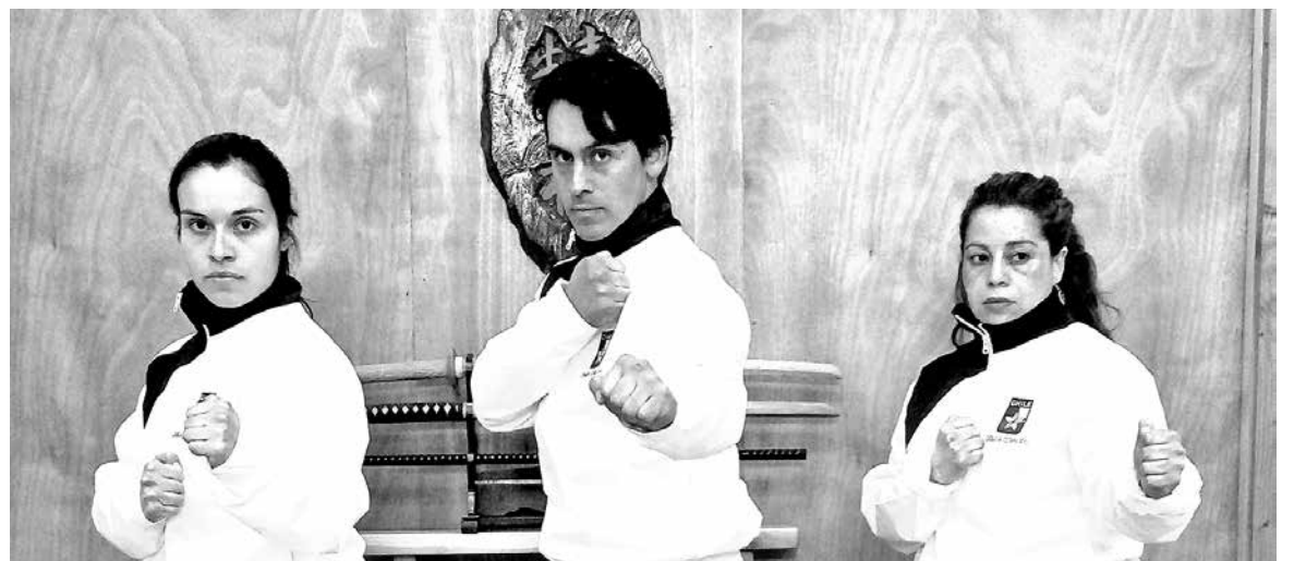
SERÁ A NIVEL nacional, destacando a cuatro angelinos.