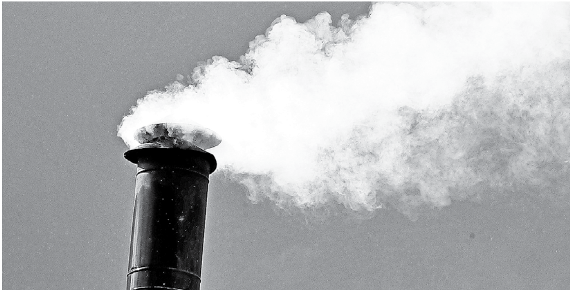
EL PRONÓSTICO DE CALIDAD DEL AIRE se realiza tomando como base un sistema predictivo elaborado por el Ministerio de Salud.

Desde el 5 de agosto no se registran en la capital de la provincia de Bío Bío episodios críticos de contaminación del aire.