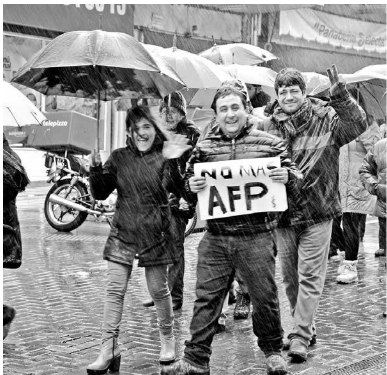
LA MEDIDA NO AFECTARÁ la marcha programada para el próximo domingo.

Los integrantes locales sostuvieron que realizarán una mesa provincial, con la finalidad de abordar la propuesta de la mandataria.