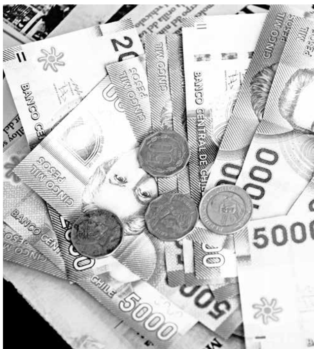
LA REGIÓN QUE TUVO el ingreso medio más alto fue Magallanes con $740.561 pesos

El ingreso promedio mensual de Biobío es de $422 mil pesos, según la última Encuesta Suplementaria de Ingresos que publicó el Instituto Nacional de Estadísticas -INE- y que da a conocer resultados de 2015 a nivel nacional y regional.