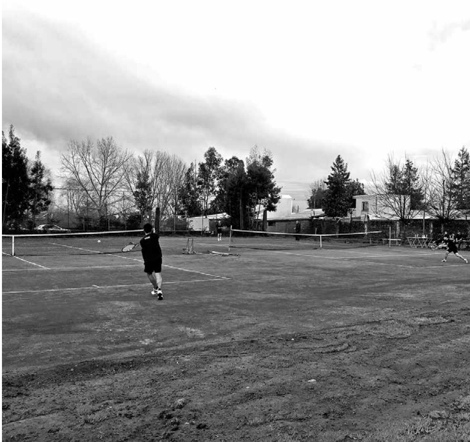
LA IDEA ES FORMAR un proyecto que parta desde cero y que tenga su cancha e implementos propios.

Alumnos de la escuela de tenis municipal buscan no sólo aprender, sino que tener más competitividad, algo que no les ofrece la escuela actualmente.