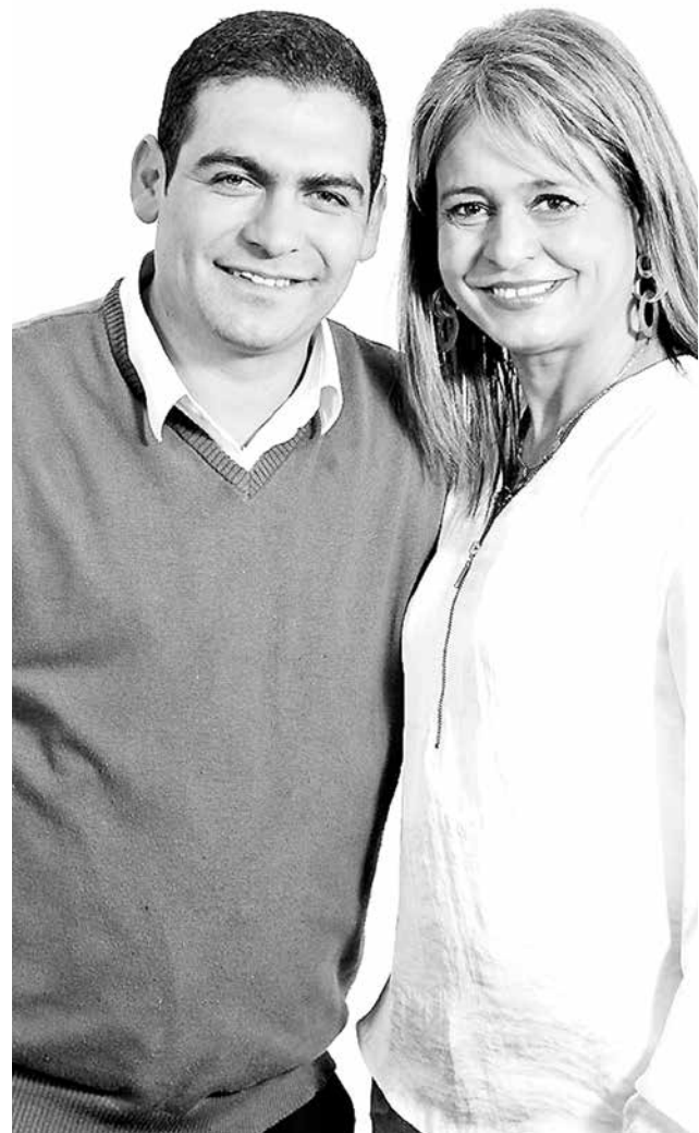
POSTULANTE A EDIL manifestó que evaluará su bajada, sólo para evitar que su familia resulte expuesta.

Por último, se le consultó si votaría por un candidato cuyo partido habla del respeto por la familia, pero al mismo tiempo es protagonista de incidentes de violencia contra su mujer. Ante ello, el postulante a edil comentó que “existen otros candidatos que no violentan a nadie y no se ven involucrados en cosas así, pero tienen otro tipo de problemas más serios, como