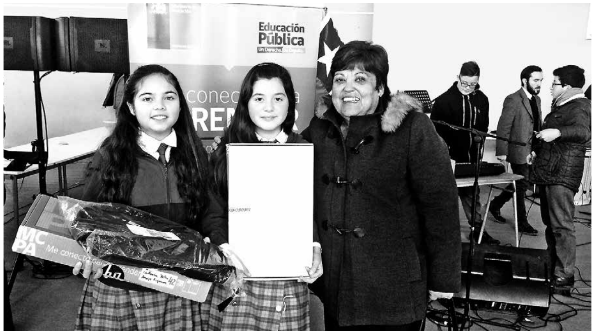
INVITAN A ACERCARSE A CADA MUNICIPIO de la provincia para conocer el calendario de actividades.

Tal como indicó la representante del Ministerio de Educación de la zona, durante toda esta semana se llevarán a cabo instancias ligadas a la educación pública en las diferentes comunas, por ejemplo, en Los Ángeles se realizará la "Feria de la Educación", donde establecimientos municipales de la ciudad presentarán números artísticos y mostrarán sus hitos educativos a la comunidad angelina. En Cabrero, por otro lado, se llevará a cabo el "Encuentro Cultural por la Educación Pública". En las comunas de Antuco, Quilaco, Alto Bío Bío y Santa Bárbara se desarrollarán distintas jornadas sobre la Educación Pública, tales como: reflexión, recorrido por colegios municipales, talleres de debate, bailes y otras muestras; en Mulchén y Yumbel dirán presente a la "Semana de la Educación Pública" con actos conmemorativos. En total son las catorce comunas de la provincia