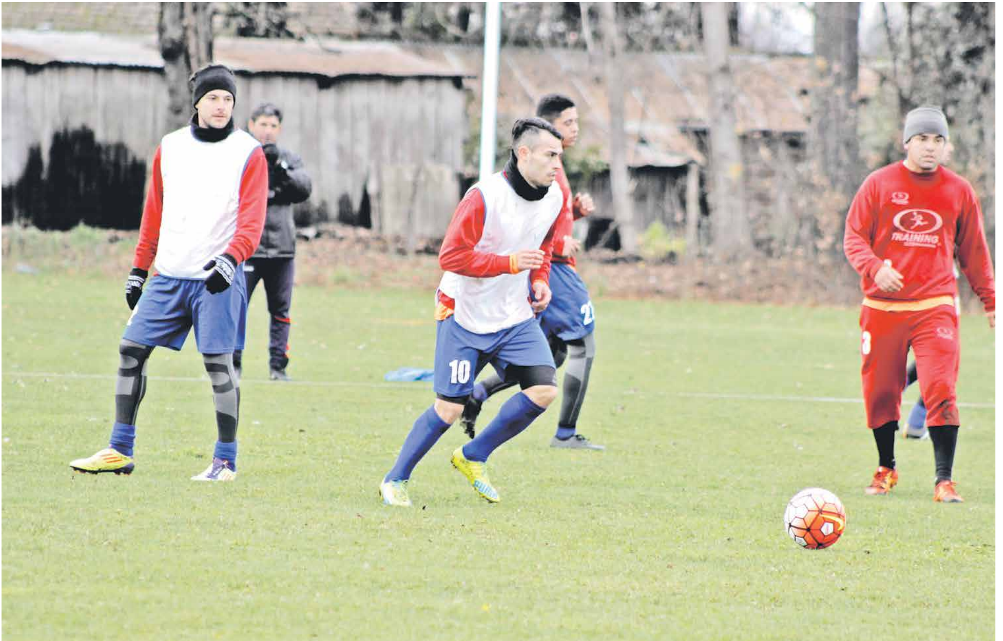
IBERIA SIGUE preparándose para el duelo como visita ante Unión La Calera que se disputará en el Lucio Fariña de Quillota.