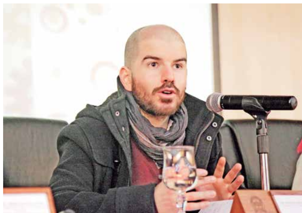
PARTIDO DEL DIPUTADO, Giorgio Jackson, entregó las firmas recaudadas hasta el momento para constituirse como partido político.

La presentación de firmas de Revolución Democrática (RD) en el Servicio Electoral de la región Metropolitana, también tuvo una bajada en la provincia de Biobío, ya que los representantes de la agrupación también están trabajan-