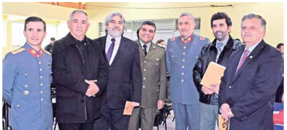
Coronel Rodrigo Marchessi; Claudio Solar, alcalde de Antuco; diputado Roberto Poblete; Hugo Zenteno, prefecto de Carabineros; Luis Fariás, general de División de Ejército; Rodrigo Tapia, alcalde Quilleco y Esteban Krause, alcalde de Los Ángeles.