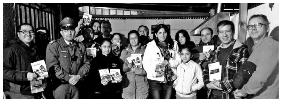
DENTRO DE LA JORNADA, Carabineros entregó una serie de medidas preventivas a fin de evitar delitos.

Impulsada por la Oficina de Atención Comunitaria de la primera comisaría de Carabineros de Los Ángeles, vecinos del sector de Alto del Retiro -en villa Galilea- participó de una reunión cuyo objetivo era prevenir diversos delitos de los cuales pudiesen ser víctimas.