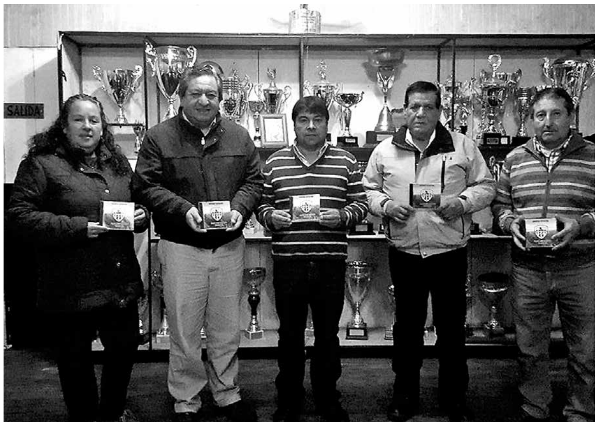
SANTA BÁRBARA goza de buenas nuevas en el fútbol amateur, con respaldo de himno e implementación.

comuna precisó que era necesario poder trabajar un anteproyecto de sede social, y la viabilidad de la compra de un terreno, para su construcción, por lo que instó a los directivos, socios y jugadores a desarrollar varias ideas, iniciativas y actividades, para generar recursos, y pensando a