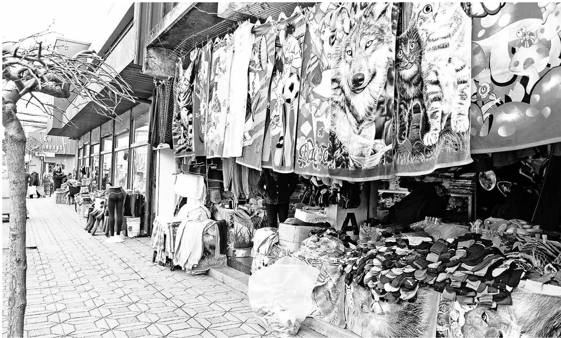
PARA ARÁNGUIZ LAS CIFRAS reflejan el estancamiento de la economía nacional.