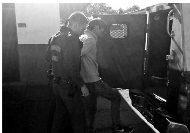
LOS TRES IMPLICADOS en el asalto fueron detenidos momentos más tarde por Carabineros de Laja.

Sin embargo, el hombre de 25 años mantenía antecedentes por ilícitos de robo por sorpresa y lesiones de carácter leve en una agresión, ambos hechos registrados en 2015.