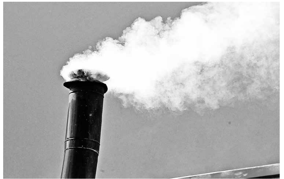
EN CASO DE PREEMERGENCIA, continúan prohibidas las chimeneas de hogar abierto y salamandras, el uso de hornos a leña de panadería y los hornos de ladrillo y la leña con humedad superior al 25%.

De la misma forma, destacó que para los días de emergencia, están impedidas de funcionar los calefactores residenciales las 24 horas.