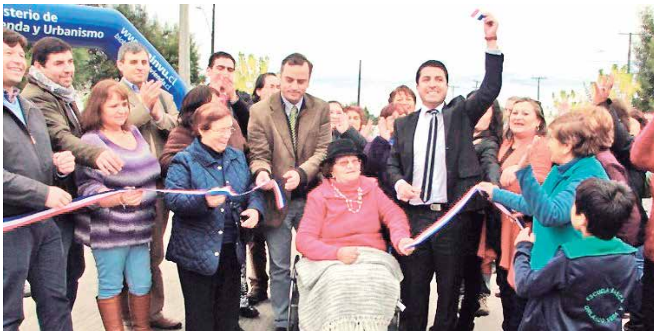
INICIATIVA DEMANDÓ una inversión que superó los 400 millones de pesos.

La segunda etapa de este proyecto incluirá, además, la demarcación de la ciclovía, los