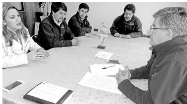
SE ANUNCIÓ QUE EJECUTARÁN una sesión con todos los alcaldes de la región para exponer del tema.