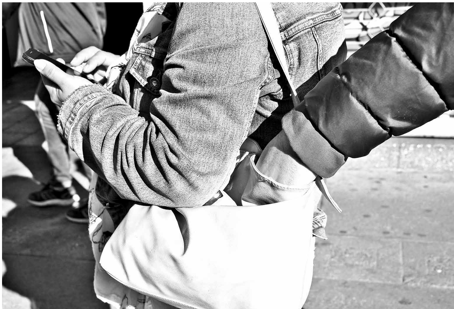
AL MOMENTO DE concurrir a un banco o local comercial, el oficial llamó a mantener especial cuidado con las carteras, bolsos y tarjetas de crédito.

En ese sentido, “la comunidad tiene que estar tranquila; estamos abocados a brindar la sensación de seguridad que