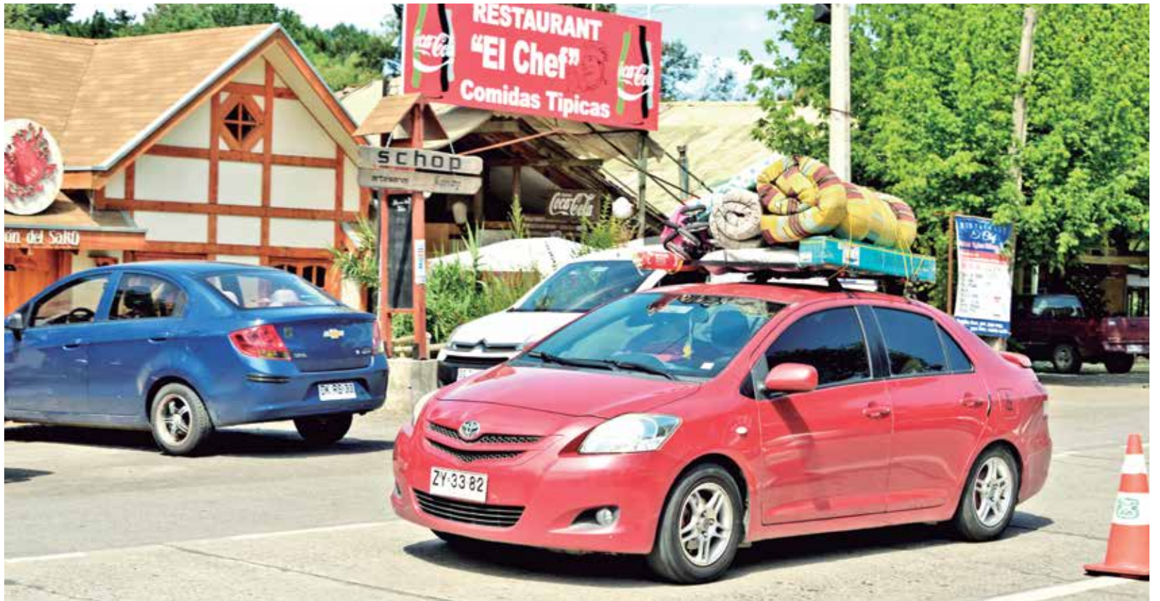
PROYECTO SE DESARROLLARÁ dentro de 24 meses, con la finalidad de incentivar el aumento de turistas en la provincia.