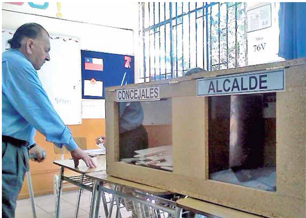
SERVEL TRABAJA en estructurar los locales de votación en la zona.

En torno al tema central, cabe destacar que los precandidatos de la Nueva Mayoría en la zona, mani-