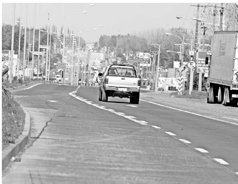
LA IMPRUDENCIA DE ESTOS CHOFERES puede provocar accidentes en el lugar, debido a la gran afluencia de autos circulan por el funcionamiento de una concurrida discoteque en el sector.

Son varios los testigos que aseguran ver cada viernes los eventos, que ponen en peligro no sólo a quienes compiten, sino también a quienes transitan por el sector.