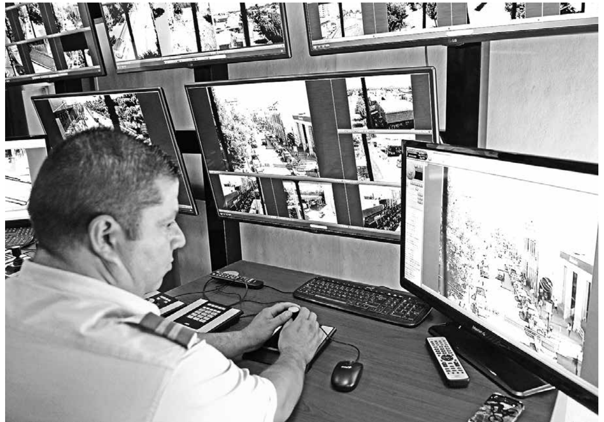
CARABINEROS DETUVO A DOS PERSONAS que intentaban ingresar a un local comercial del paseo Ronald Ramm.

Asimismo, Jara expresó que Carabineros de Chile es la frontera entre la delincuencia y la ciudadanía. Para ello, están reforzando los servicios a fin de evitar la comisión de delitos en la comuna de Los Ángeles.