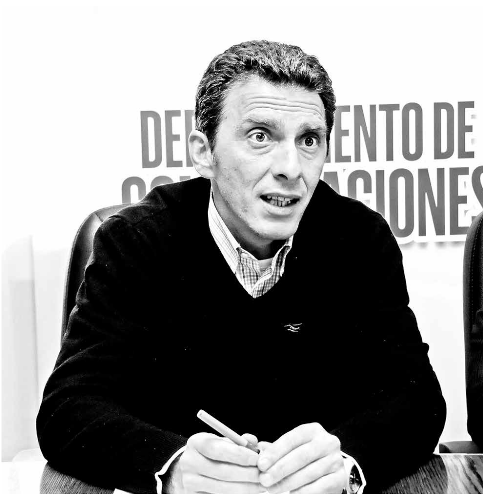
EL DIRECTOR, ASEGURÓ que la empresa está contratada para conseguir todos los permisos necesarios.

Además, el director regional del Instituto Nacional del Deporte, reafirmó los conceptos entregados por el alcalde y el seremi del Deporte en la conferencia para aclarar la situación del nuevo recinto deportivo angelino.