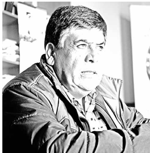
MULTIGREMIAL ANGELINA aseguró que buscan informar a la comunidad para mejorar políticas públicas respecto de hechos de violencia.

En el marco de una gira nacional, se desarrollará un seminario de violencia y terrorismo en Los Ángeles el próximo lunes.