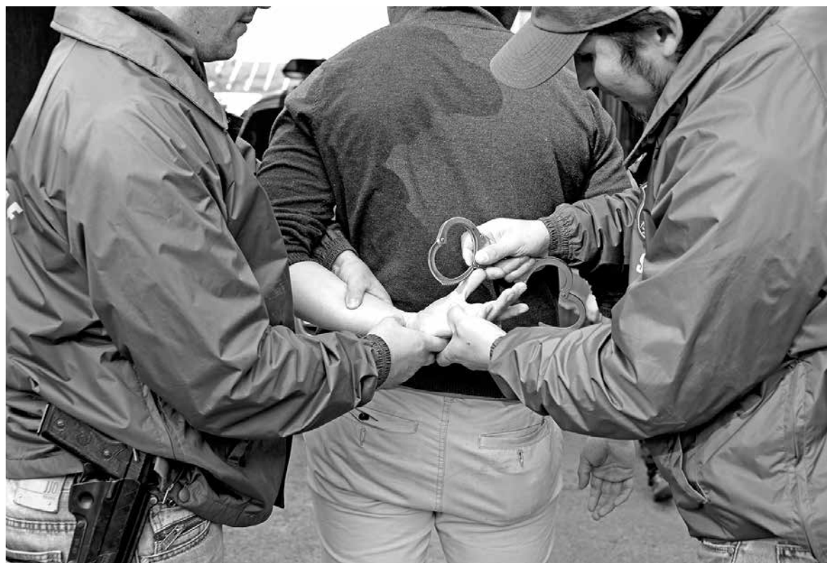
EL HOMBRE fue capturado en el sector poniente de la comuna de Los Ángeles.

Asimismo, se percataron de que el hombre registraba dos