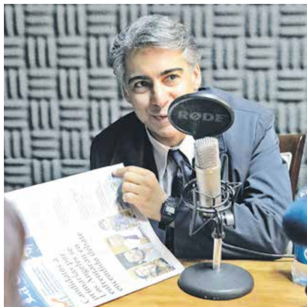
EN ENTREVISTA con Radio San Cristóbal y Diario La Tribuna, ME-O respondió a los cuestionamientos por SQM.