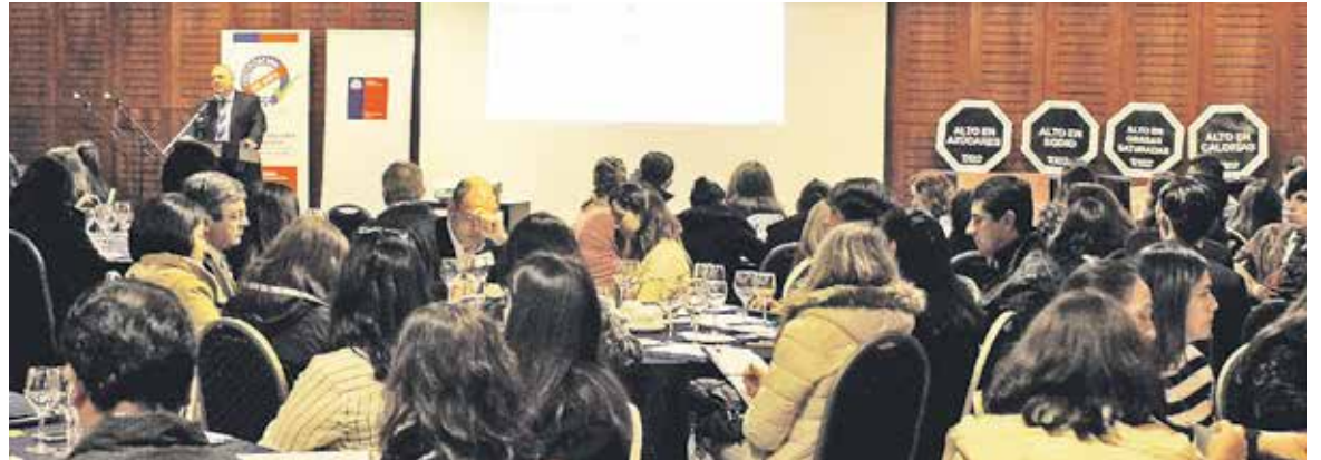
DIRECTOR REGIONAL DE LA ENTIDAD, informando de los detalles de la nueva normativa a la comunidad educativa angelina.

El seremi de la cartera, Mauricio Careaga, comentó al respecto que “el 10% de nuestros niños menores de 6 años están obesos y casi el 30%