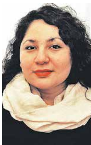
LA AUTORIDAD DE SERNAM Biobío se refirió sobre el discurso presidencial de 21 de Mayo.