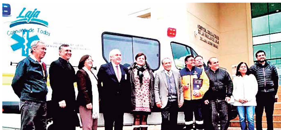
EL MÓVIL FUE BENDECIDO en una ceremonia realizada en el frontis del recinto asistencial.

La ceremonia concluyó con la entrega de las llaves del vehículo por parte del alcalde Pinto al conductor de la ambulancia.