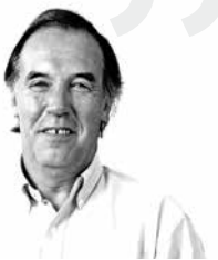
Jaime Orpis, Senador UDI.

"Si bien recibí aportes de Corpesca para financiar pagos y deudas de campaña, en mis votaciones y acciones relacionadas con el sector pesquero, he mantenido siempre mi independencia -a veces concordando con la opinión de la pesquera y otras veces no- votando y actuando de acuerdo a mis convicciones".