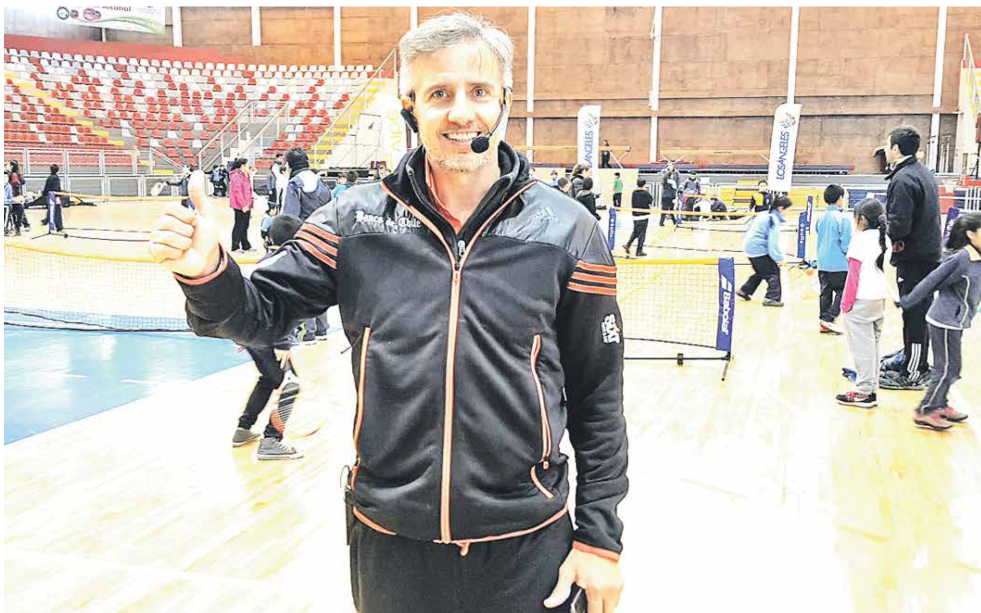
EL PULGA CONVOCÓ a más de 100 niños a jugar en el Polideportivo de Los Ángeles.