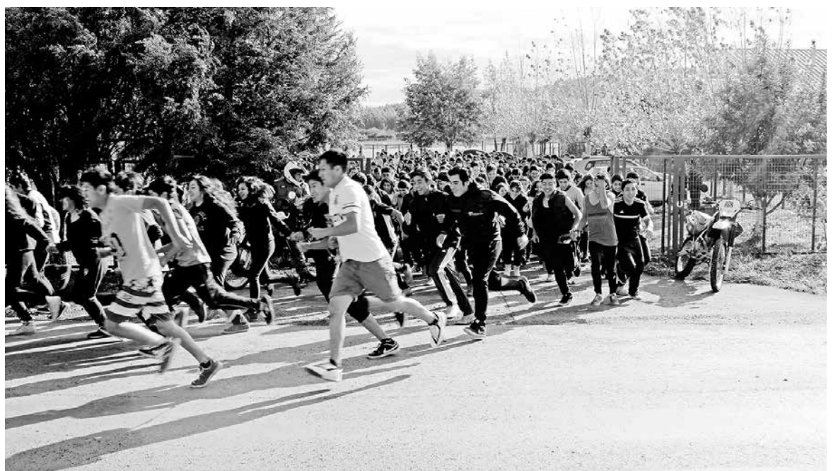
CON UNA GRAN ACTIVIDAD deportiva, liceo de Santa Bárbara recibió a sus nuevos alumnos.

El inspector general del Liceo Politécnico Cardenal Antonio Samoré de Santa Bárbara, señaló que “con esta actividad los alumnos de 2°,