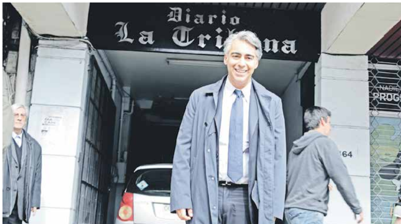
EL LÍDER DEL PRO arribó a la provincia para reunirse con los candidatos a concejales por la zona.