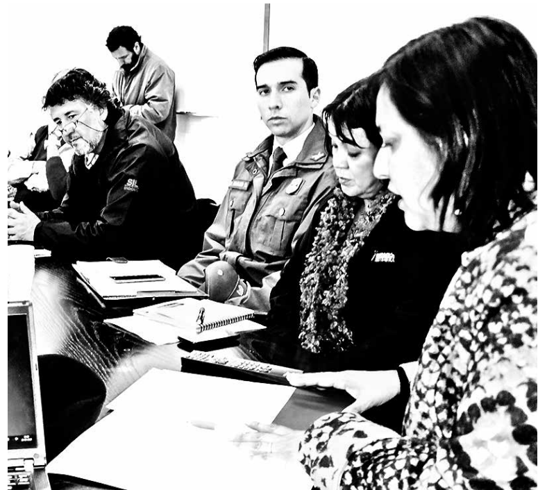
LOS ÁNGELES, COIHUECO, Cañete y Coronel son las cuatro comunas beneficiadas con la iniciativa.

Los criterios para definir las comunas fueron la cantidad de población comunal, el número de niños y adolescentes que han desertado de la educación formal, el porcentaje de pobreza comunal, la necesidad de conocer realidades comunales dis-