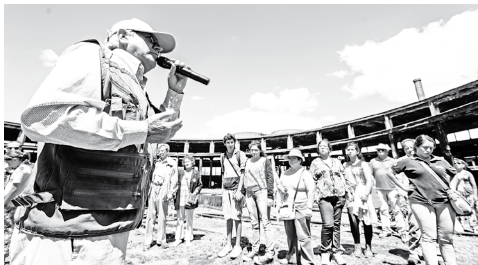
EL PRECIO DEL TOUR será de sólo 6 mil pesos.

La directora del servicio, agregó además que “la muestra más clara del éxito y del cariño de la gente por el tren fue el éxito de ventas que tuvimos con las primeras salidas que agotaron todos los tickets. Yason más de 300 las personas que han participado de este viaje y este año pretendemos seguir llenando los trenes que tienen una capacidad de 170