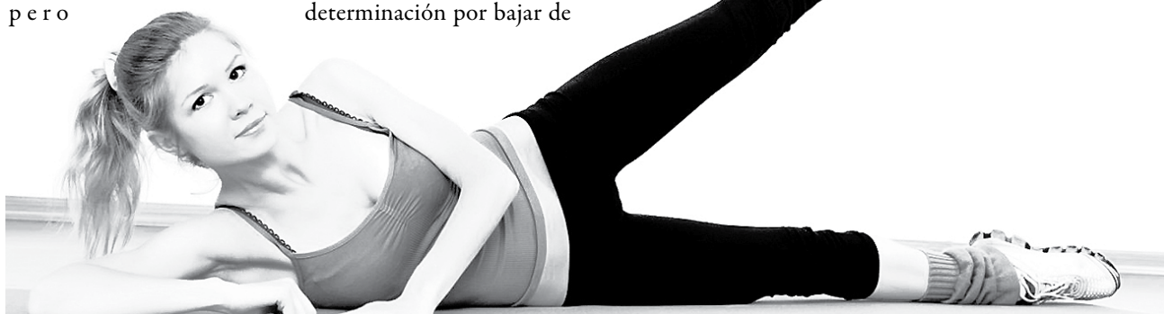
ESTA ES LA POSICIÓN que debes tener para hacer las elevaciones circulares.

Como puedes ver, estos ejercicios son muy sencillos de hacer. Basta con que encuentres media hora al día para realizarlos, alternando unos con otros. Si te acompañas con algo de música te será más agradable. Pero recuerda, lo