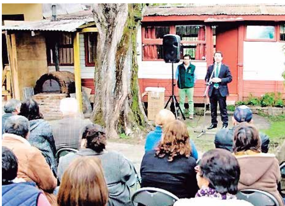
MUNICIPIO CABRERINO ENTREGÓ DEPENDENCIAS

permanencia del programa de Inclusión Laboral que atiende a muchos vecinos de Tucapel y sus alrededores.