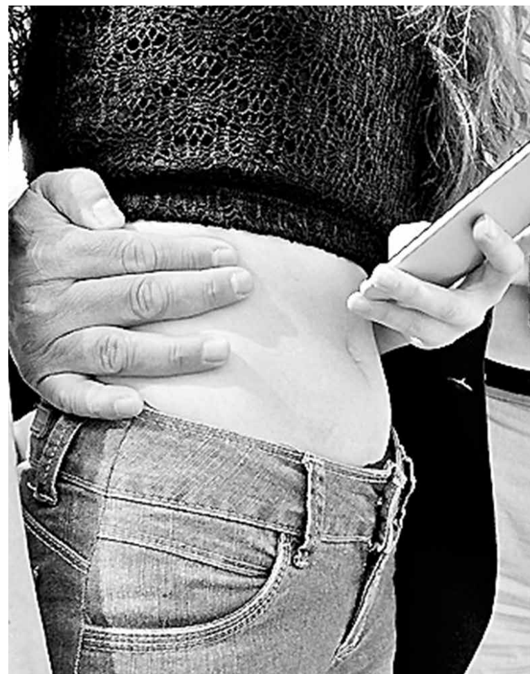
LA PDI IMPULSA una serie de iniciativas que apuntan a que niños, niñas y adolescentes no sean víctimas de explotación sexual infantil.

En este sentido, “será necesario poner atención respecto a qué tipo de material ellos están intercambiando