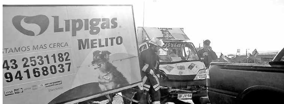
ACCIDENTE SE ORIGINÓ cuando el camión de CCU realizó un viraje a la derecha a fin de ingresar a una empresa.

Al momento de ocurrido el accidente, ambos vehículos transportaban carga en sus respectivos acoplados; sin embargo, ésta no se habría desprendido al momento de ocurridos los hechos.