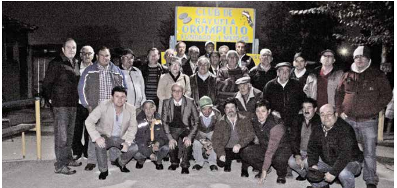
Club de Rayuela Orompello.