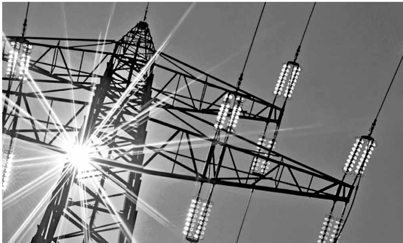
MARCHA POR LA IGUALDAD tarifaria se desarrollaría antes del 21 de Mayo