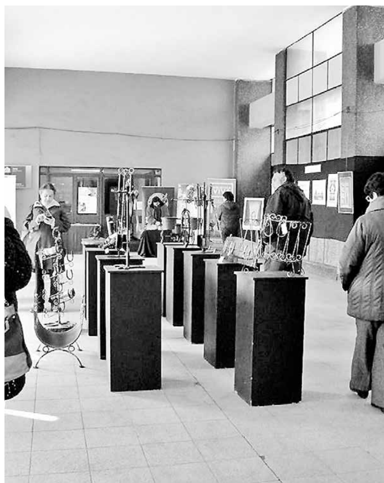
LA PRÓXIMA SEMANA se espera que expongan artistas de las comunas en donde los municipios no se interesaron en apoyar la instancia artística.

Recordemos que Asociación de Consumidores y Usuarios del Biobío busca que Los Ángeles obtenga un descuento similar a las comunas generadoras de energía eléctrica de la provincia, en un rango de un 20 a 25% de descuento.