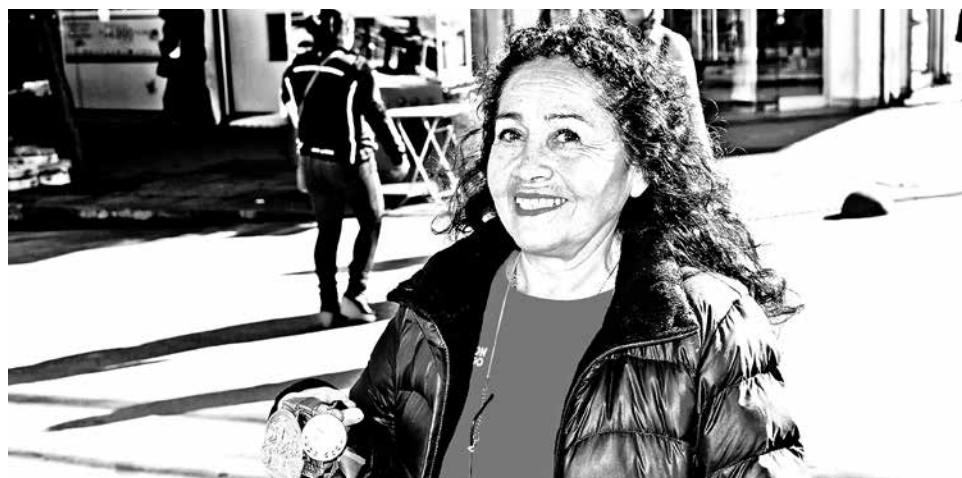
NACIMENTANA ORGULLOSA DE poder correr en nombre de su comuna, obtiene meritorio tercer lugar.

Además, añadió que “el clima nos acompañó, porque normalmente llueve. El recorrido iba hacia Concepción,