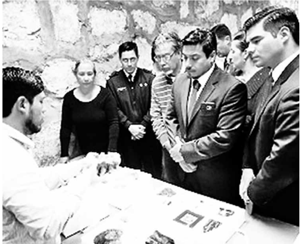
DURANTE LOS DOS días que duró el Seminario - Taller, también hubo espacios para conocer los vestigios subacuáticos existentes en las costas porteñas.

Además, la iniciativa permitió a los asistentes conocer las pautas técnicas y teóricas sobre la identificación de bienes paleontológicos, históricos y arqueológicos, junto a los procedimientos de manejo y conservación al ser incautados. Todo esto bajo la supervisión de arqueólogos, biólogos y conservadores, de la Dibam y del Consejo de Monumentos Nacionales.