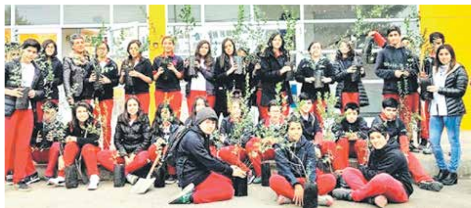
LA INICIATIVA SE ENMARCO dentro de las actividades del programa de educación ambiental del municipio de Laja.

Los árboles fueron plantados por los menores en el amplio patio de la escuela, recibiendo ayuda de profesores y de profesionales del área medioambiental del municipio y educación.