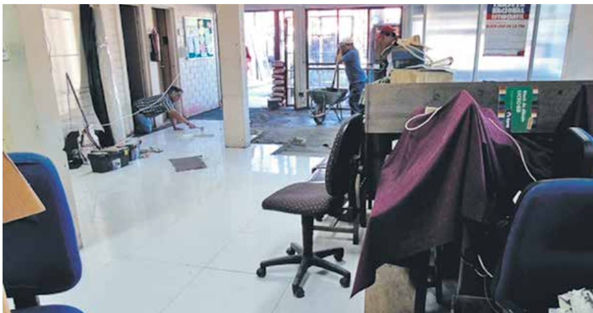
LA INICIATIVA FUE POSTULADA, en marzo de 2015, al Programa de Mejoramiento Integral de Bibliotecas Públicas.

Ello, a fin de ofrecer mejores condiciones de comodidad y atractivo a los usuarios y posibles beneficiarios de la Biblioteca, incentivando las visitas e incorporación de nuevos socios.