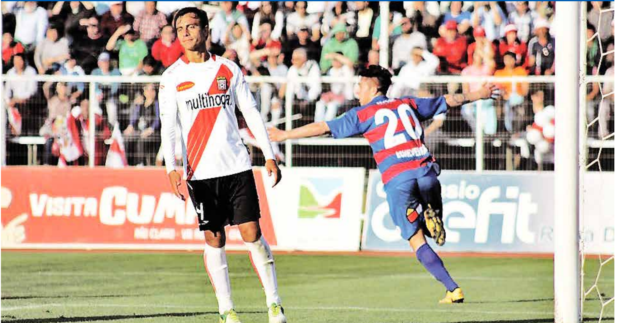
AHORA IBERIA CHOCARÁ ante el ganador de la llave entre Deportes Puerto Montt y Rangers de Talca.