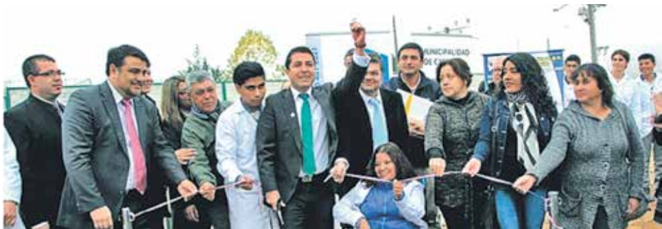
LOS ALUMNOS PODRÁN desarrollar destrezas y habilidades y aprenderán de manipulación de elementos estando de pie.

En el Liceo Politécnico A-71 “Óscar Bonilla Bradanovic”, de Monte Águila, fue inaugurado un centro de entrenamientos y prácticas para los alumnos de la especialidad de electricidad.