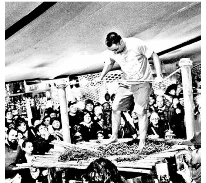
LA ACTIVIDAD DEBIÓ retrasarse un poco, debido a problemas de los agricultores con el producto de la zona.

Según Opazo, fueron los propios agricultores de las uvas quienes pidieron retrasar un poco más la actividad, porque aún no estaban listos sus productos.