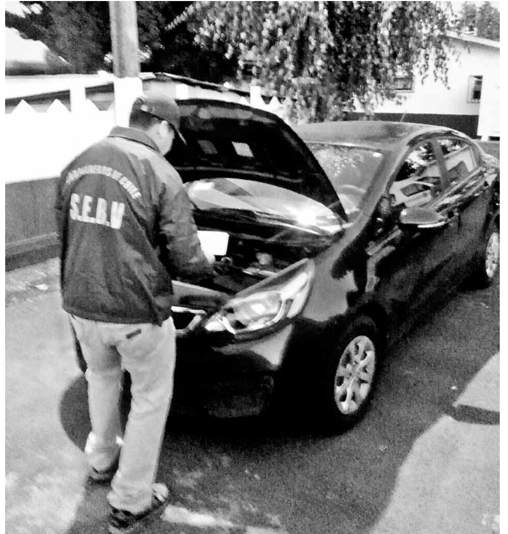
EL VEHÍCULO FUE UBICADO, fiscalizado e incautado por personal del Sebv de Carabineros en la comuna de Yumbel.

Para poder operar, los integrantes de esta banda crean una empresa ficticia, inscriben los vehículos y obtienen las placas patentes en el Registro Civil, colocándose a los automóviles que roban; eso sí, no sin antes adulterar la serie de su motor y chasis.