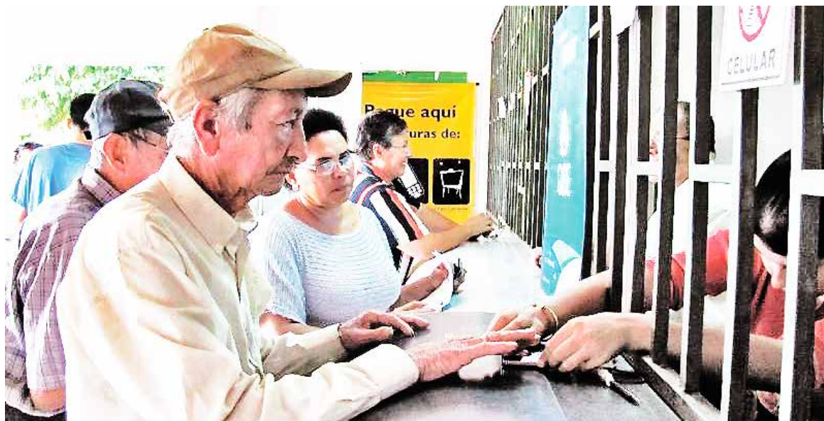
EL PARLAMENTARIO ENFATIZÓ en los perjuicios ocasionados a los adultos mayores por el cierre de los lugares de pago.

Finalmente el diputado Pérez reflexionó sobre las mociones parla-