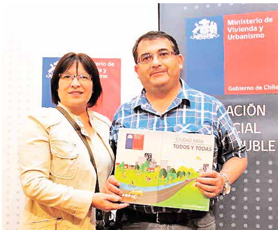
REGISTRO DE UNA PERSONA beneficiada con el subsidio especial que otorga el Minvu.

En la provincia de Biobío fueron un total de 1.417 los que realizaron los trámites.