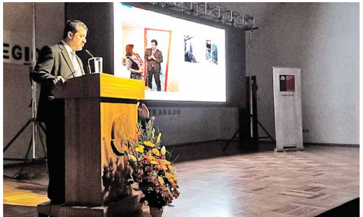
EL SECRETARIO REGIONAL de la cartera exponiendo los principales logros alcanzados.