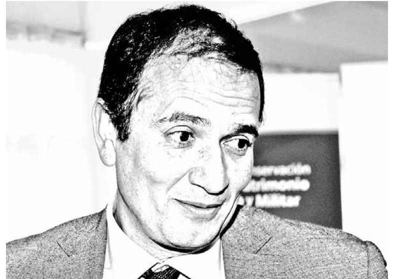
FRENTE AL CONFLICTO entre el gobierno y los pescadores chilotes, la máxima autoridad en la región dijo que siempre es bueno resolver los problemas mediante el diálogo.

final después de la violencia, hay que lamentar daños y hay que volver a sentarse, por lo tanto mi invitación es al diálogo".