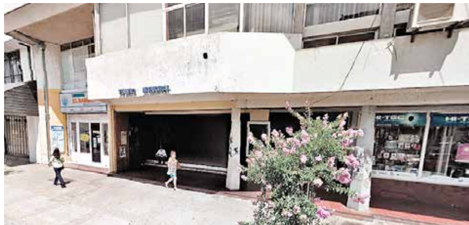
LA ACTIVIDAD SE llevará a cabo en el Teatro Municipal de Los Ángeles.

El evento, que es principalmente ciudadano y que lleva varios años realizándose en la comuna, es auspiciado por Florería Evolet y Joyería Revillo.