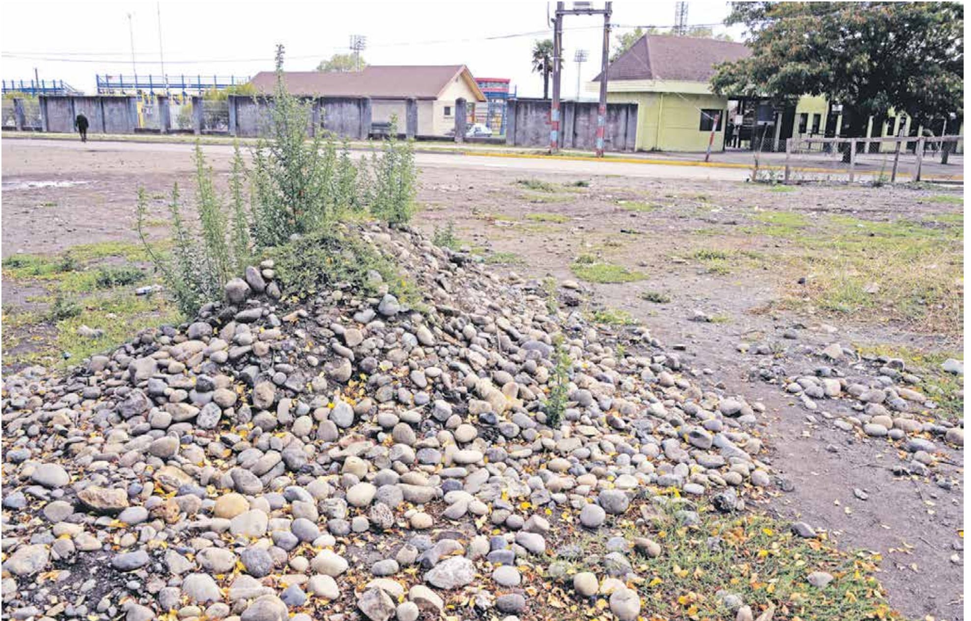
LA IMAGEN HABLA POR SÍ SOLA. Las piedras abundan en las zonas aledañas a las boleterías del estadio municipal.