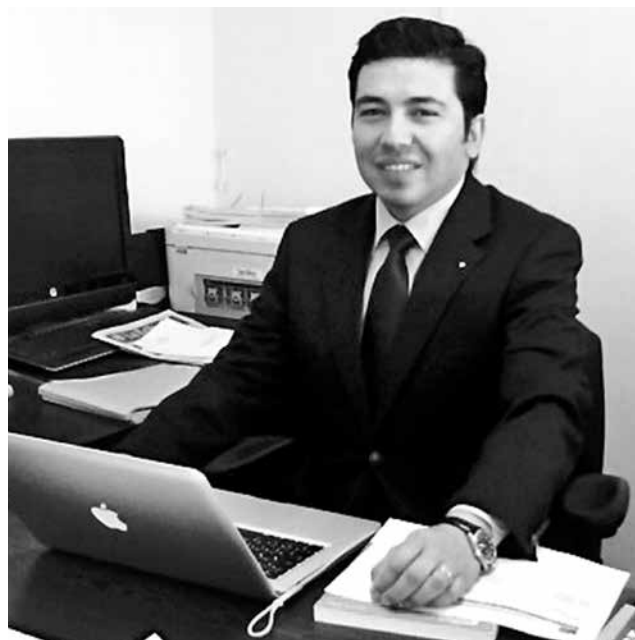
JEFE DEL DAEM ASISTIRÁ mañana al Concejo Comunal para recibir las disculpas públicas del sentenciado.

La resolución surgió tras unos meses de investigación, estableciendo que el edil debe-