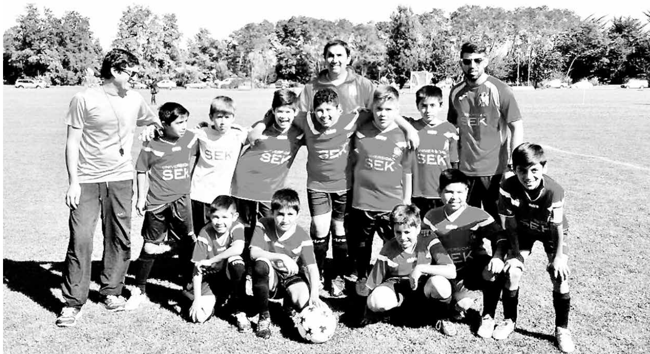
ANGELINOS QUE INTEGRAN la escuela de la Unión Española enfrentarán duro torneo este fin de semana.

“A la vez, trabajamos con niños con capacidades diferentes, tenemos niños dentro de las series, y para nosotros no es ningún tipo de problema. La mayoría de los niños pertenecen a la villa Galilea, pero también a niños que vienen del campo, de Nacimiento, Negrete, Renaico, de distintas partes cercanas