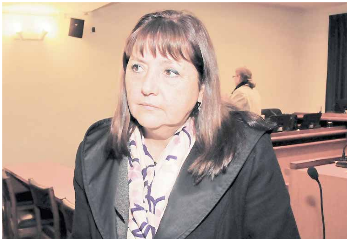
LA POLÍTICA DE LA PRSD habló de "confabulación y articulación de varias personas, que de alguna y otra manera, están relacionadas con el municipio".

Fue así que tras la alocución de varios concejales, dentro de los cuales algunos citaron o entregaron su postura con respecto al polémico tema, le tocó el turno a la edil cuestionada, quien -con un documento en mano- comenzó a leer una declaración al respecto.