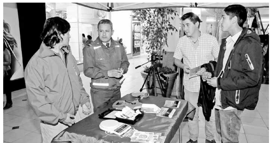
LA "EXPO CARABINEROS 2016" se realizará entre el viernes 22 y el domingo 24 de abril en Mall Plaza Los Ángeles.

Quienes participen de dicha actividad podrán conocer respecto a las distintas funciones policiales, interiorizarse en torno al proceso de reclutamiento y selección que deben seguir los postulantes, inscribirse en terreno quienes estén interesados y observar parte del equipamiento técnico que utiliza esta institución.