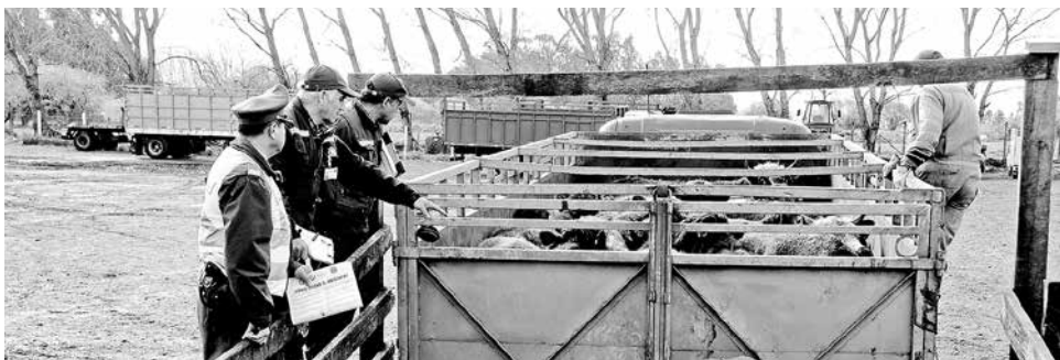
DOS HOMBRES FUERON aprehendidos mientras intentaban rematar, en la Feria Tattersall, vacunos robados. (Imagen de contexto).

Dos hombres detenidos y 71 vacunos recuperados fue el saldo que arrojó un operativo encabezado por personal de la Sección de Investigación Policial (SIP) de Carabineros, en la comuna de Los Ángeles.