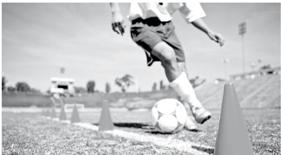
LA RESISTENCIA, EN ESTE CASO, se construye a partir de la fuerza.

El buen posicionamiento de la cadera y el tronco será beneficioso para evitar posibles lesiones. Podemos trabajar los saltos con pocos desplazamientos y en los que