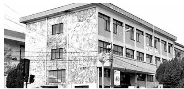
HOY A LAS 10:30 HORAS se realizará una capacitación al respecto en el edificio de la Gobernación.

La Gobernación Provincial de Biobío invitó a las organizaciones sociales con personalidad jurídica de la zona a postular a los Fondos de Seguridad Ciudadana que entregará para este año el Gobierno Regional. Las postulaciones se pueden realizar hasta fin de mes, por lo cual quedan dos semanas para acceder a dicho beneficio, que tan sólo el 2015 entregó en la provincia 197 millones de pesos a 34 iniciativas, tanto de municipios como de organizaciones sociales.