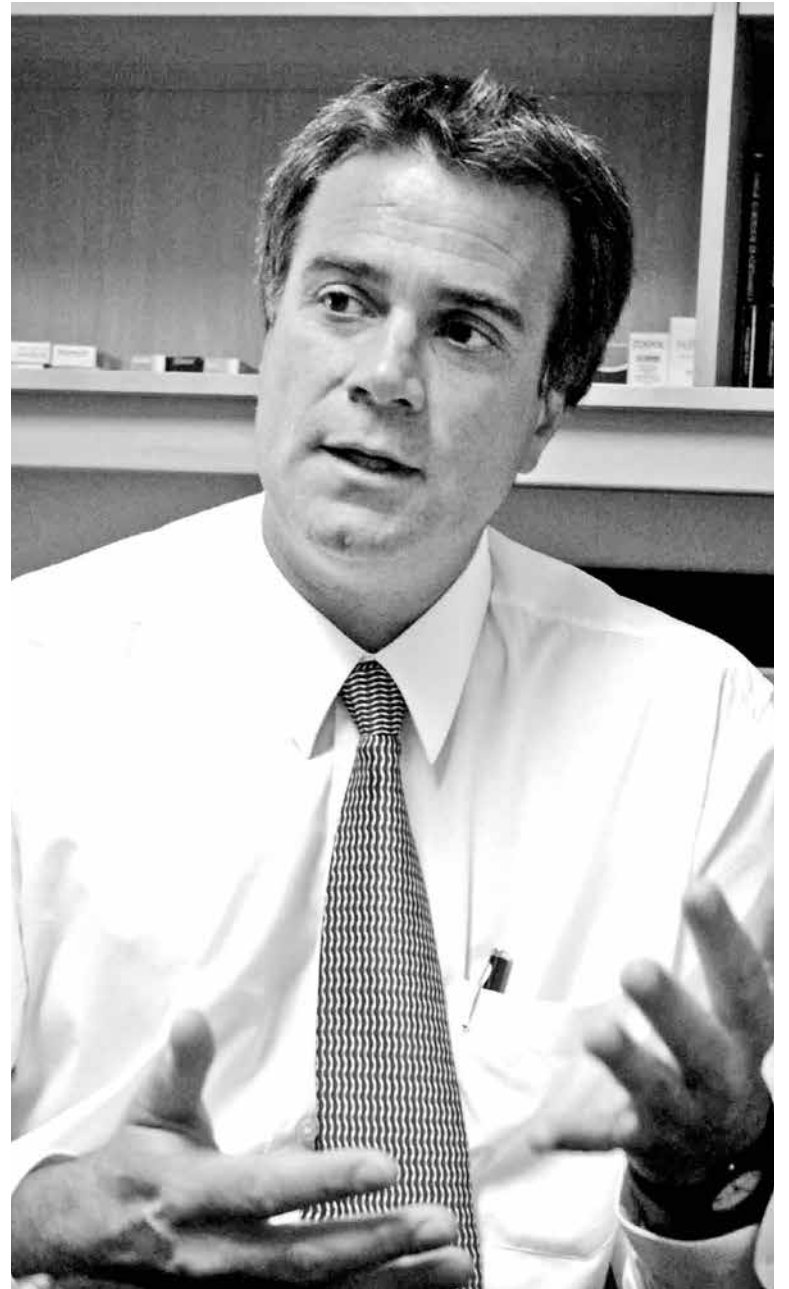
LOBOS FALLECIÓ EN UN ACCIDENTE ocurrido a la altura del kilómetro 20 de la ruta que conecta Cabrero y Concepción.

Asimismo, expresa que “(...) el cerco en mal estado que permitió la salida del animal no era perimetral, sino que se encontraba a casi 4 kilómetros del lugar por donde accedió a la carretera, siendo responsabilidad de su propietario mantener en resguardo a sus animales y, si bien, había otros cercos en malas condiciones colindantes a la vía, por donde también habría atravesado el animal, su mantención y reparación también es responsabilidad del propietario del predio”.