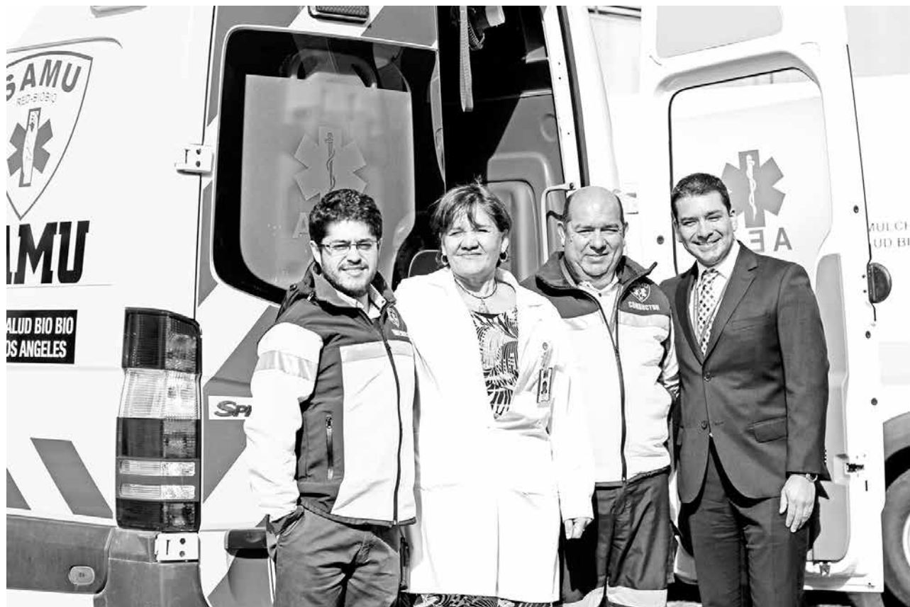
EL COMPLEJO ASISTENCIAL Víctor Ríos Ruiz recibió un vehículo de emergencia para el SAMU.