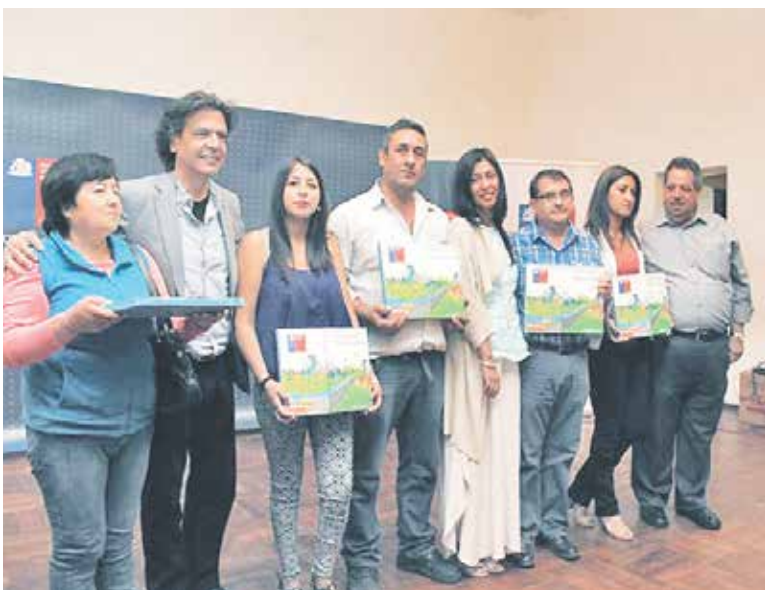
AUTORIDAD REGIONAL de la cartera haciendo entrega del beneficio en postulaciones anteriores.

Desde este lunes comienza el proceso de postulación al subsidio DS 01, Primer Llamado 2016, destinado a familias de sectores medios que impulsa Ministerio de Vivienda y Urbanismo.