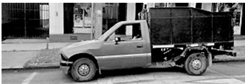
UNA CAMIONETA que mantenía encargo vigente por apropiación indebida fue recuperada en Villa Génesis.

Un vehículo recuperado, el que mantenía encargo policial, fue el saldo que arrojó un operativo efectuado por la Policía de Investigaciones de Los Ángeles.