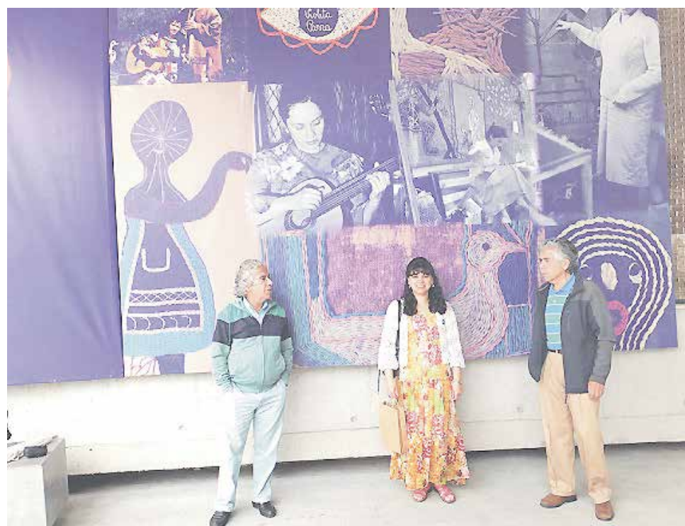
ORGANIZADORES DEL CONCURSO de poesía, posando con el afiche oficial de la actividad.