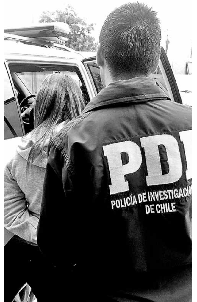
UNA MUJER DE 46 AÑOS fue detenida por el delito de recepción. (Imagen de referencia).

Al momento de ser encontrado, el cuerpo presentaba un estado de descomposición avanzado que podría fluctuar entre tres y cuatro días, y presentaba lesiones atribuibles a terceras personas.