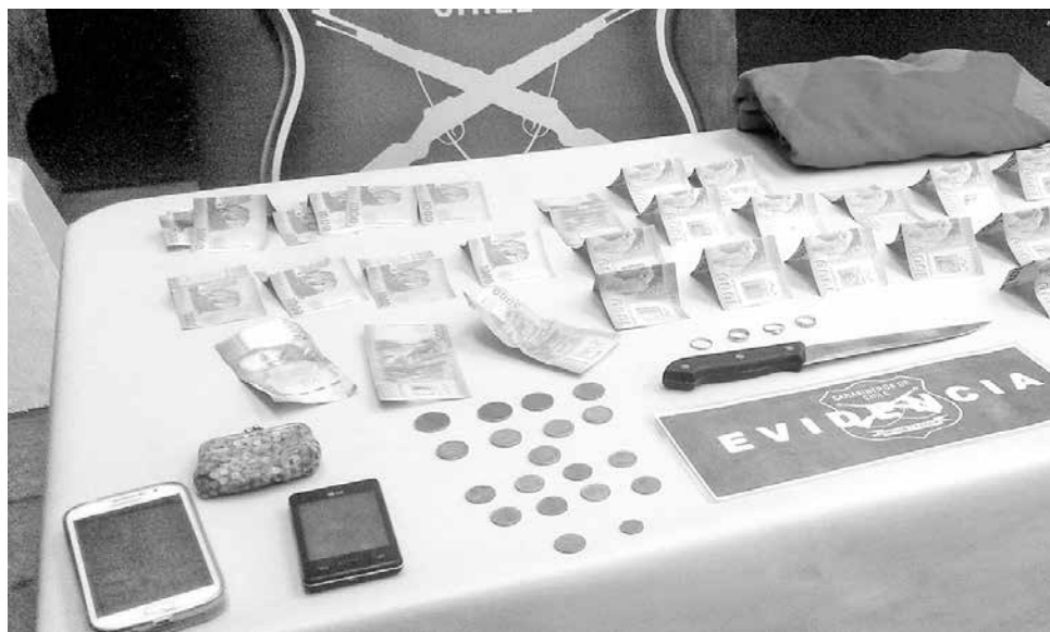
LA GRAN MAYORÍA DE LAS ESPECIES fueron recuperadas al interior de una vivienda abandonada en la población Contreras Gómez.

Al cierre de esta edición, M.A.M.T. aún no era formalizado en los tribunales correspondientes por lo que se desconoce la decisión adoptada por el juez en torno al caso.