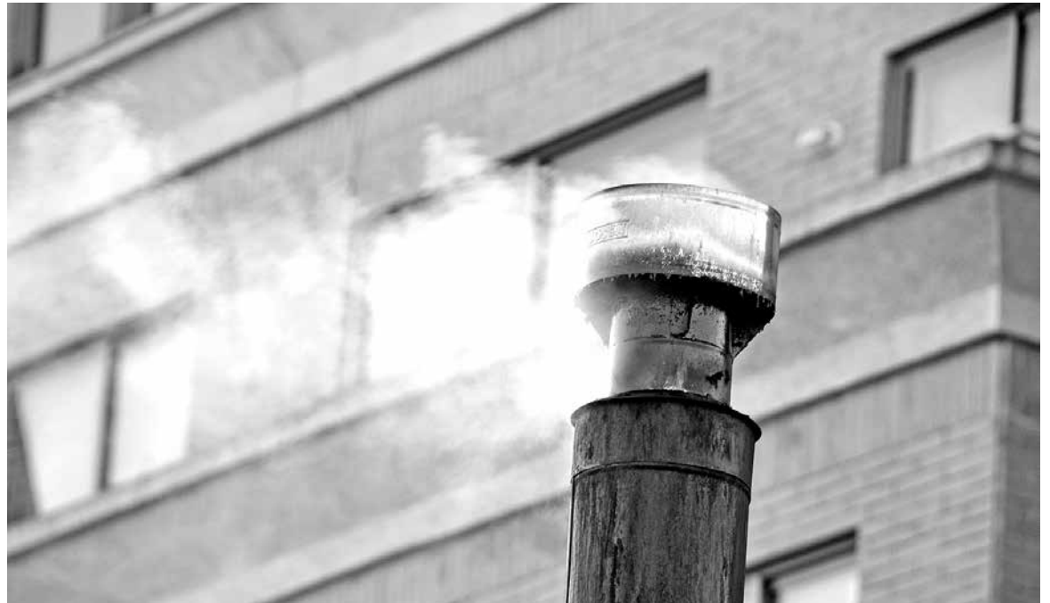
MUCHOS ANGELINOS no adoptaron las medidas de prohibición, porque simplemente no estaban enterados de la medida.

Cabe destacar, que las condiciones del ambiente empeoraron durante la jornada de ayer, aumentando en un rango de 170 y más ug/m 3 , por lo cual se declaró pasadas las 17 horas emergencia ambiental para el día de hoy.