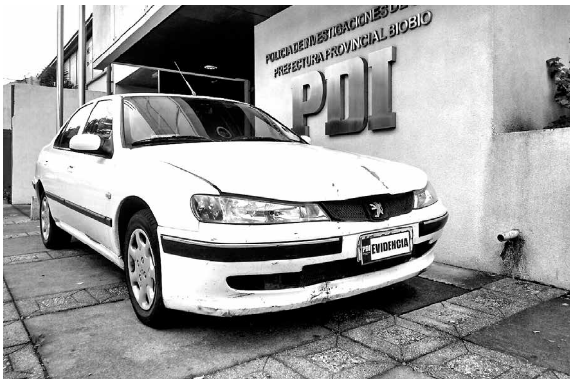
EL PEUGEOT 406 LOGRÓ ser recuperado en la población 11 de Septiembre, en la comuna de Los Ángeles.

El hecho fue denunciado el 25 de abril de este año ante Carabine-