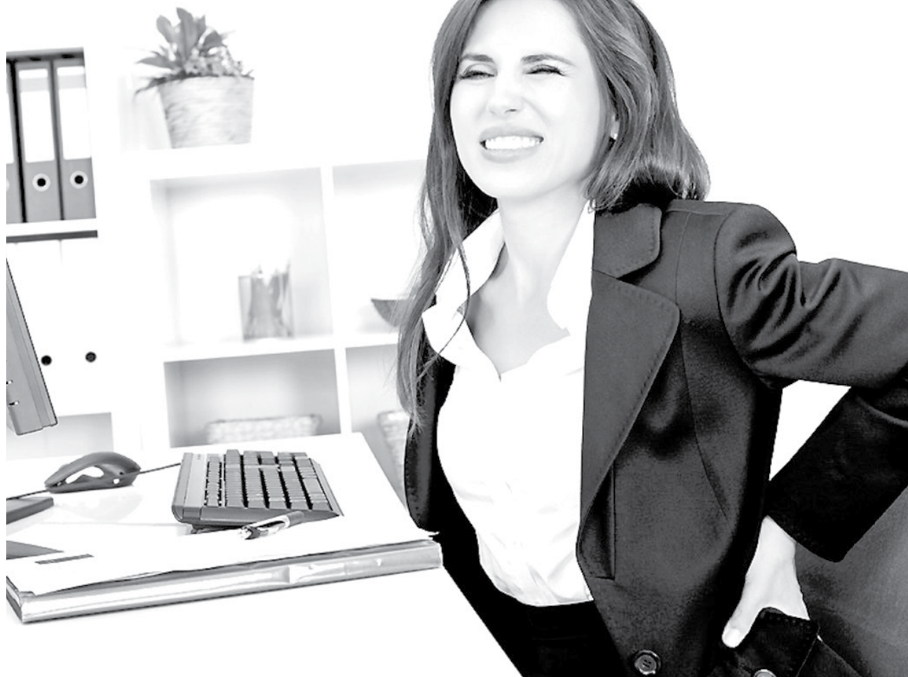
HACER ALGUNOS EJERCICIOS durante las horas de oficina alivia el estrés y la tensión que provoca estar sentado en una silla durante mucho tiempo.

Estiramiento de musculatura extensora de muñeca: Recomendado para