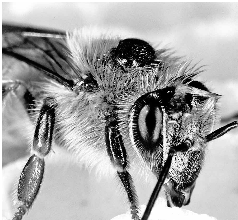
ADEMÁS DE LA VARROA, la contaminación y los parques eólicos también generan problemas para la apicultura.

De la misma forma, aseguró que "en el Congreso nadie nos ha tomado en cuenta, nuestras autoridades no han estado de acorde al problema que tenemos.