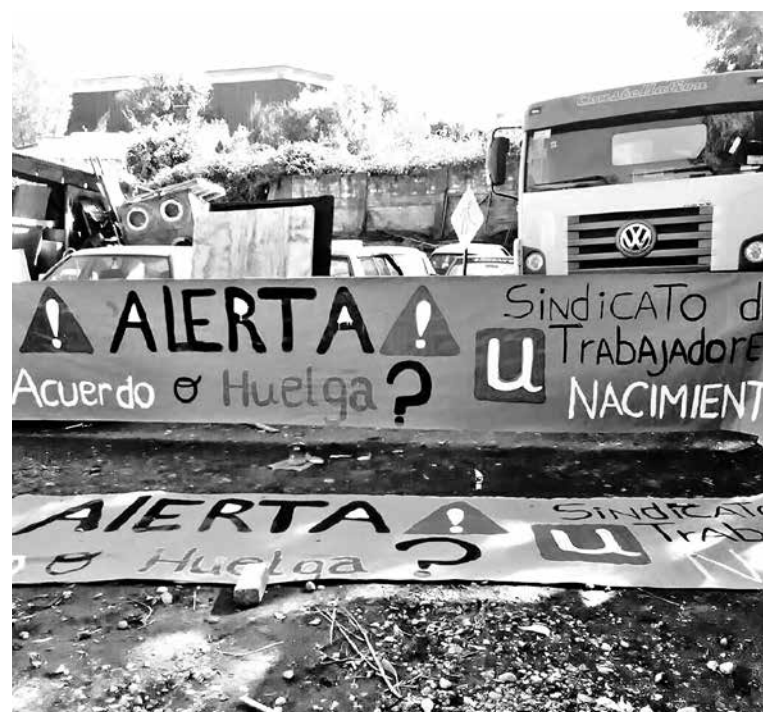
LA NEGOCIACIÓN llegó a su fin al filo de llevarla a una paralización legal.

En ese sentido explicó que "hubo que votar la huelga para hacer un alaruge en la negociación, eso significa que nosotros teníamos cinco días más para estar negociando con