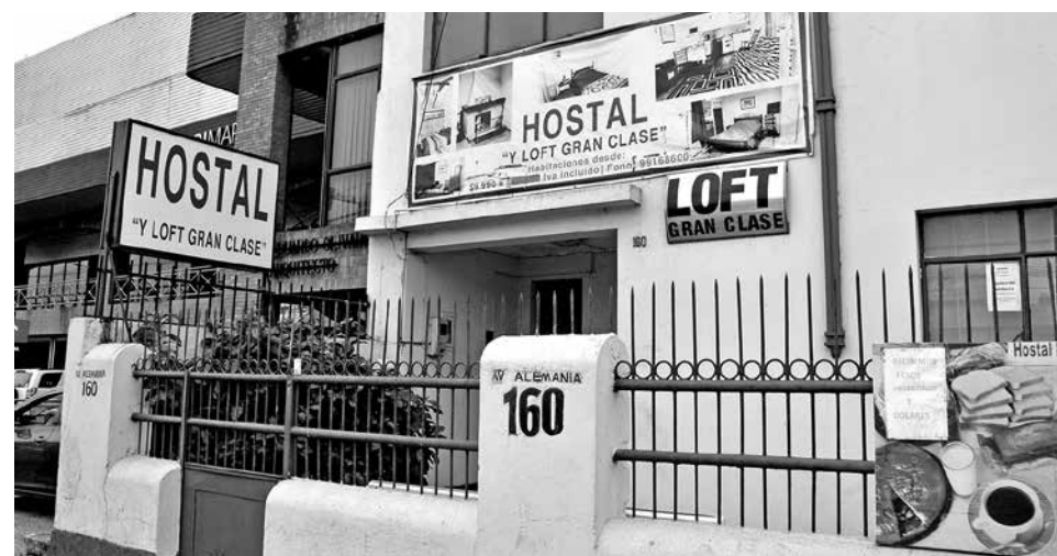
LOS HECHOS OCURRIERON en un hostel emplazado en avenida Alemania, en la comuna de Los Ángeles.

Tras denunciar el hecho a Carabineros, se inició nuevamente las labores que permitieran dar con el paradero del antisocial. A eso de las 4:15 de la madrugada, aproximadamente, el hombre fue divisado por efectivos de la Sección de Investigación Policial (SIP) de Carabineros y por personal de servicio que efectuaban un patrullaje por la población Domingo Contreras Gómez. “Al momento de efectuarle