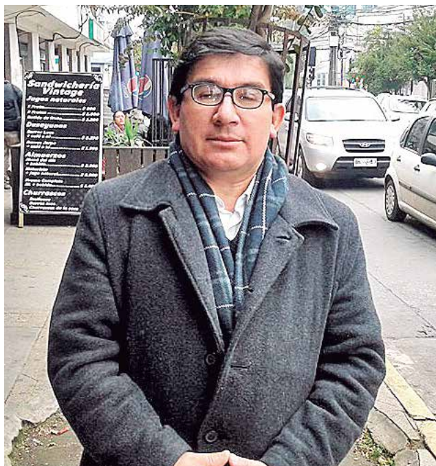
PRESIDENTE DE LA CUT local invitó a participar este domingo en el Día del Trabajador en Los Ángeles.