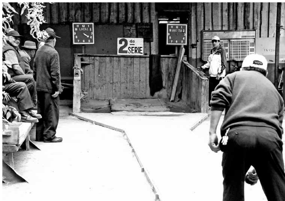
ATRACTIVO FIN DE SEMANA para los amantes de la rayuela. Entrada gratuita para los que miran, 250 pesos los que juegan.