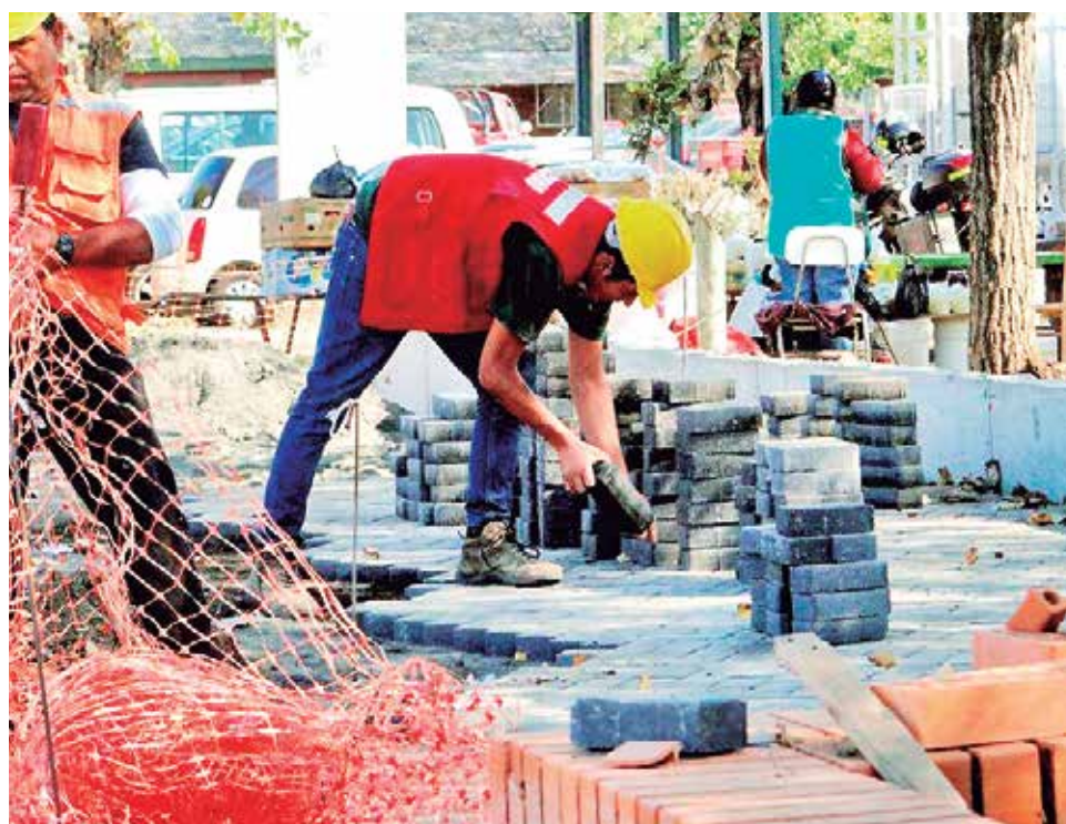
PROYECTO CONTEMPLA una inversión que bordea los 723 millones de pesos.

Por su parte, la concejala Ana Villalobos resaltó el papel del municipio en la