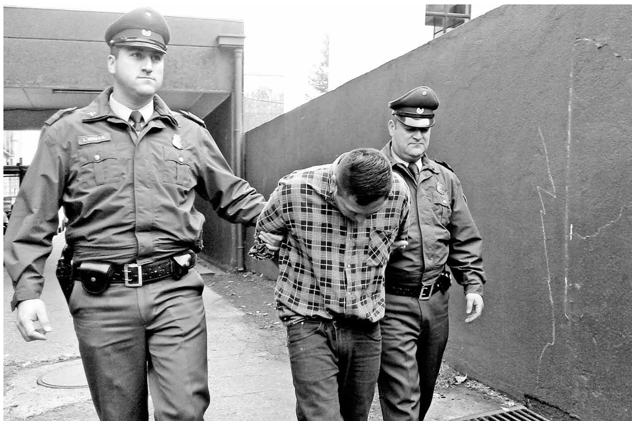
M.A.M.T. REGISTRA 28 DETENCIONES por diferentes delitos; entre ellos, hurto y robo con intimidación.

la pasajera, a la madre de la recepcionista y a la recepcionista en la habitación, llevándose a la hermana y la violentó.