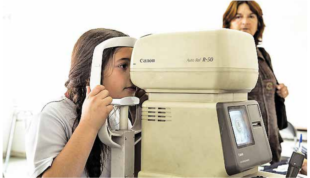
EN LA PROVINCIA TAMBIÉN se aplicará la medida, beneficiando a 9.306 alumnos.

Cabe destacar que el Programa de Servicios Médicos resuelve la problemática de salud en tres áreas, las que son oftalmología, otorrino y columna.