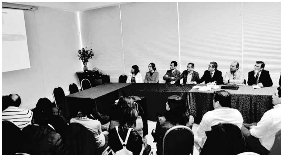
IDEA ES FUSIONAR A SERCOTEC, Innova Bío Bío y Corfo para que quienes quieran participar, puedan acceder con mayor facilidad a los 33 instrumentos para mejorar sus emprendimientos.

De esta forma pretenden ser más eficientes a la hora de ayudar a emprendedores con sus proyectos y sacarle partido a los trabajos que se llevan a cabo en la provincia de Bío Bío.