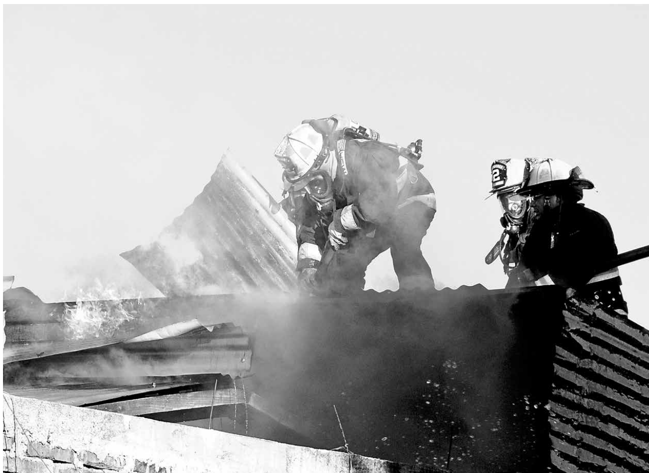
INCENDIO SE REGISTRÓ en el sector rural Las Higueras de Los Ángeles.