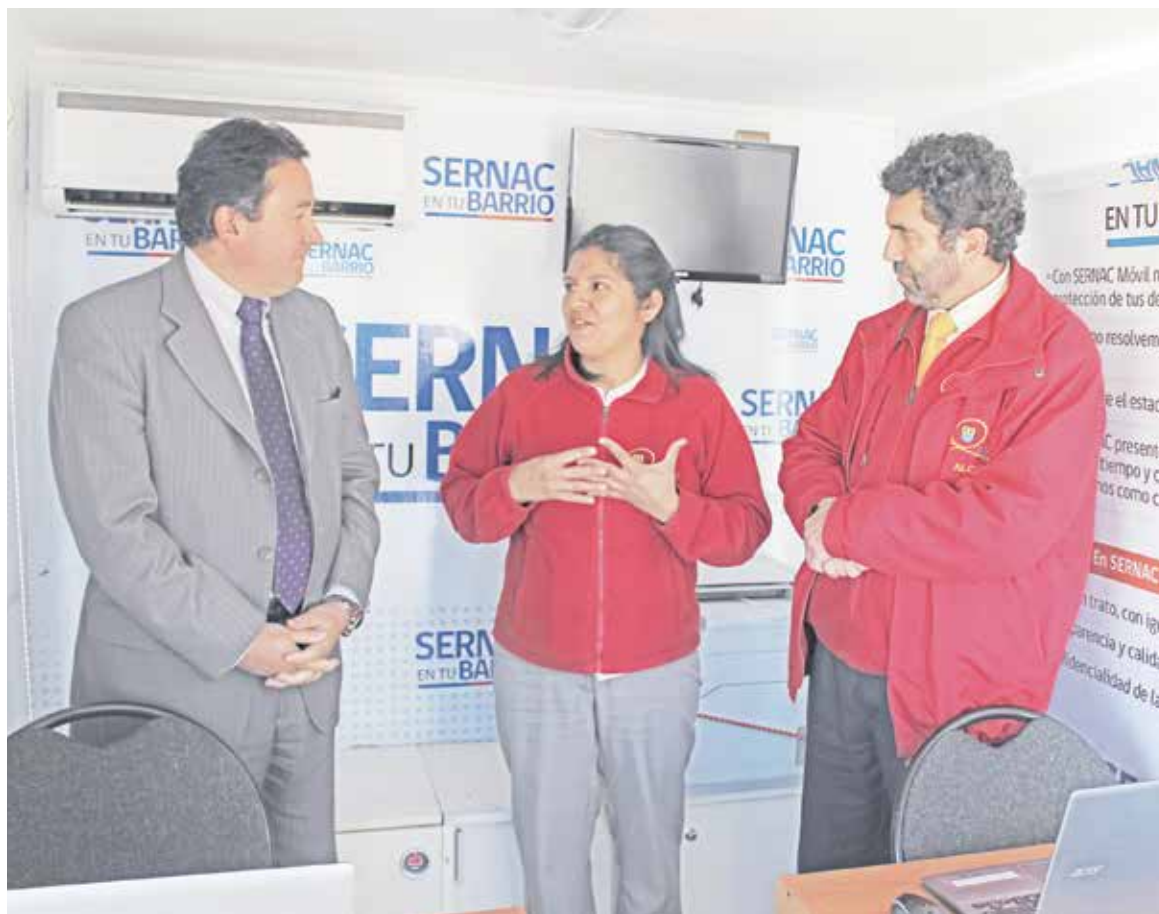
BENEFICIO APUNTA directamente al consumidor de la comuna de Quilleco.

El Sernac intercede o media en los conflictos de consumo entre las empresas y los consumidores. Cuando el consumidor reclama a el Sernac, este se comunica con la empresa para informarle la situación existente y solicitar una respuesta al caso.