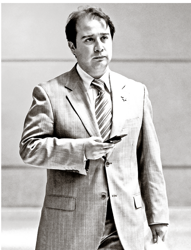
ADEMÁS, SAUERBAUM llamó a la Presidenta a hablar sobre el caso Luchsinger.

El ex parlamentario, indicó que el Banco Unificado de Datos permitirá que todas las instituciones de prevención y persecución criminal compartan los datos y trabajen coordinadamente.