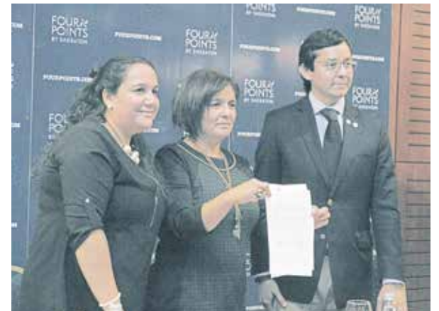
El convenio contó con la firma del gerente de Hotel FourPoints, la rectora de Santo Tomás y la jefa de carrera de Gastronomía del Centro de Formación Santo Tomás Los Angeles.

formación que existe en la adquisición y desarrollo de competencias de los alumnos requieren instancias de trabajo en el mundo real y en el caso de Gastronomía, tener la experiencia de una cocina en donde los tiempos son reales, es algo sumamente importante, y más aún en una como la que ofrece el Hotel Four Points".