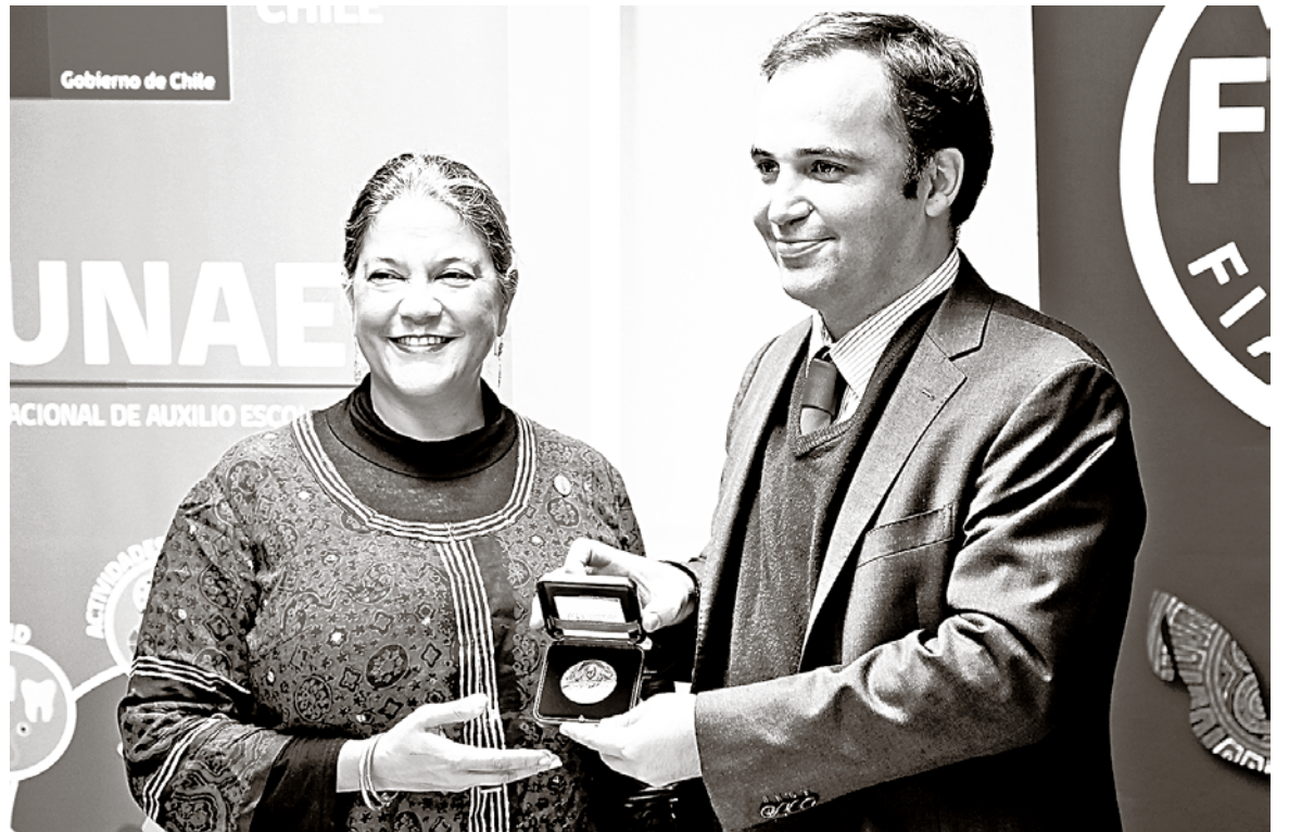
RECONOCIMIENTO SE REALIZÓ en el marco de una visita de representantes de la FAO al país.

En la reunión, además participaron representantes del Fondo Nacional de Desarrollo de la Educación de Brasil (FNDE), liderados por la