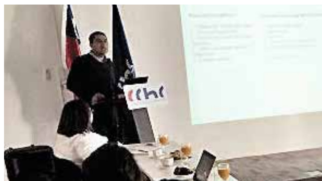
DURANTE LA REUNIÓN se coordinaron los detalles del Plan de descontaminación que debiera estar operativo en el 2017.

Una vez concluido el plazo de la Consulta Pública, corresponde la sistematización y ponderación de las propuestas ciudadanas para ser incorporadas al Anteproyecto del Plan de Descontaminación, que, de acuerdo a la programación, debiera ocurrir en agosto de 2016, en vista a que el Plan de Descontaminación debiera estar operativo en 2017.