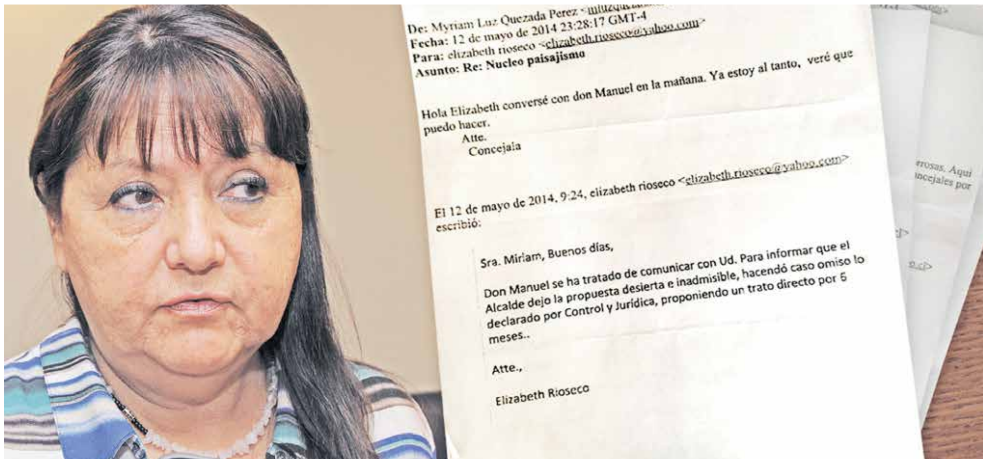
CONCEJALA DESCARTÓ aporte económico de Núcleo Paisajismo S.A, para estar a favor de la oferta.