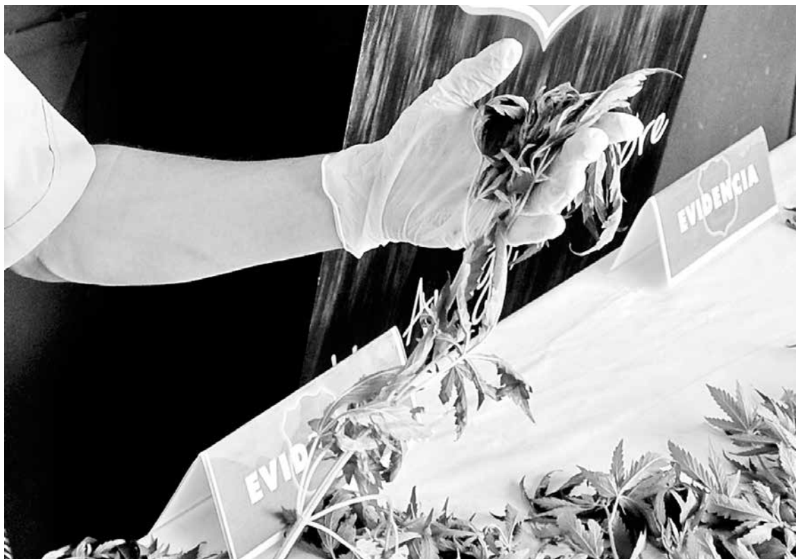
LA DROGA SERÁ ENVIADA al Servicio de Salud Bío Bío.

La droga será enviada al Servicio de Salud Bío Bío, mientras que el joven detenido, identificado con las iniciales D.E.M.J de 18 años, quedó en espera para el respectivo control de detención.