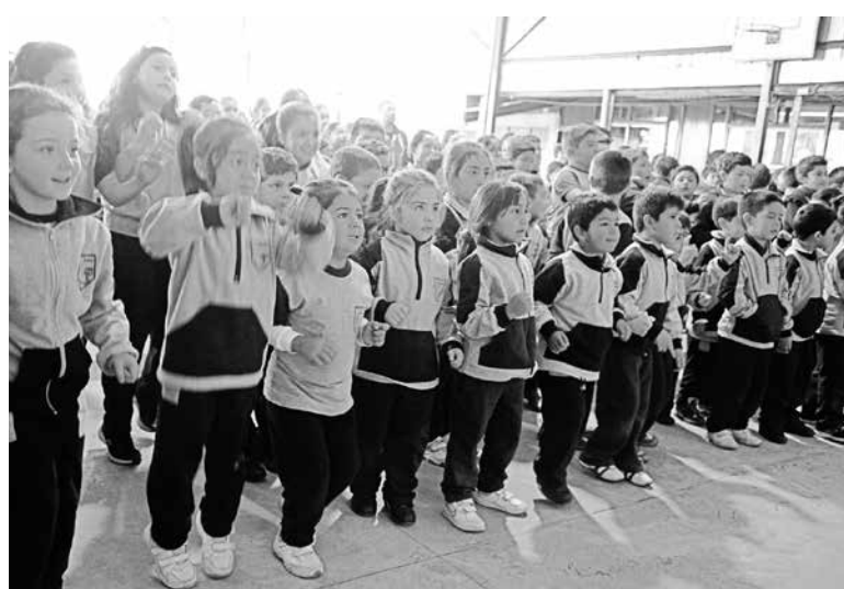
MÁS DE 600 DEPORTISTAS dieron vida a la actividad.

Con una serie de actividades deportivas, en las que participaron todos los integrantes de la comunidad educativa, el colegio Juan Pablo II se organizó bajo la consigna "Niño activo = adulto saludable".