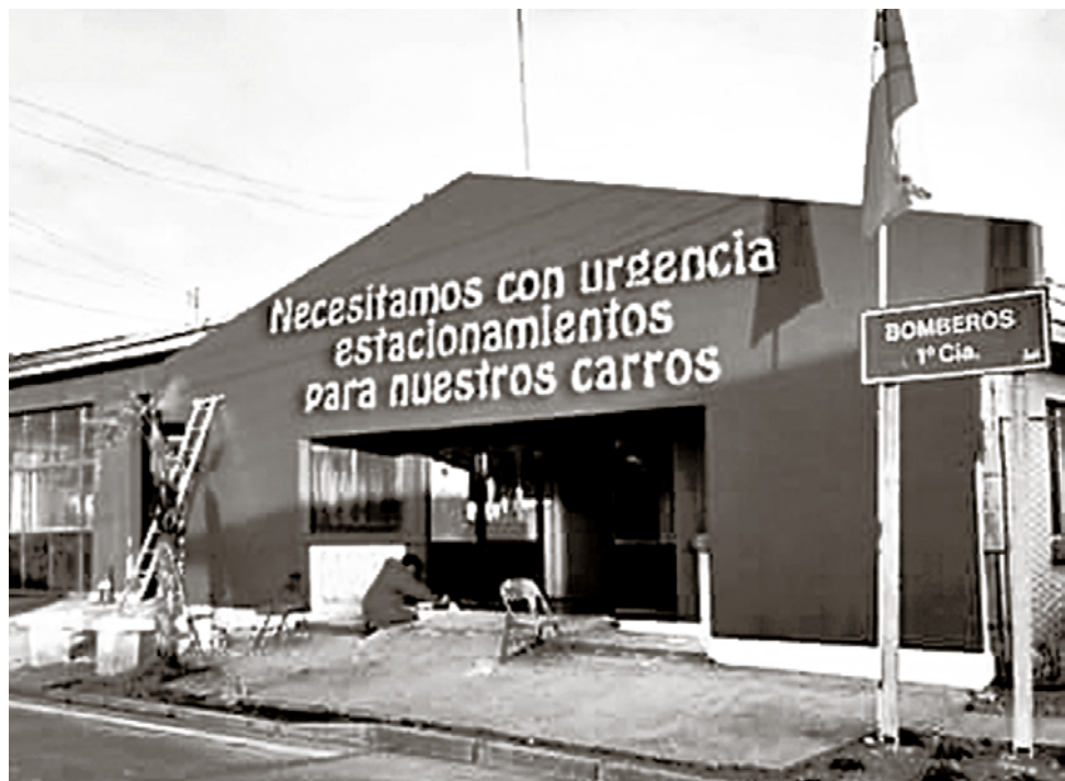
VOLUNTARIOS TEMEN SER MULTADOS por estacionar a las afueras de la compañía.

Tras ello, el funcionario municipal aclaró el documen-