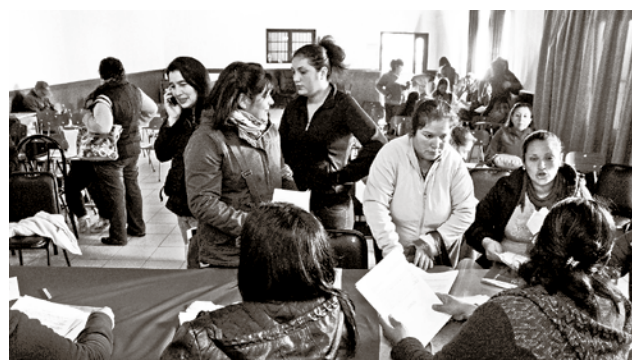
IMAGEN DE ARCHIVO de trabajadoras recopilando antecedentes para la asesoría legal.

"Hasta el minuto del dueño de la empresa no sabemos nada (...) no hay ninguna comunicación con sus ex trabajadores, sólo sabemos que nuestras cartas de despido no son legales. Ayer tuvimos reuniones con el abogado en la CUT, él nos dio tranquilidad para seguir adelante, ya que nos asegura que se podrá conseguir que se paguen los