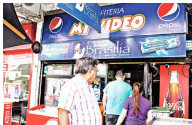
LA AUSENCIA DE LUZ al interior del local, impidió que los antisociales se fueran con un botín más grande.

Vale mencionar, que la confitería se encuentra incluida dentro del edificio Pedro de Córdoba, lugar que dispone de un cuidador del recinto, quien no se dio cuenta de los hechos.