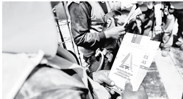
CIRCULAR OBLIGA a contar con profesionales competentes e idóneos en el tema de salud ocupacional.

Extiende el plazo de investigación a 45 días y posteriormente a 30 para tener un rango de tiempo óptimo para la revisión de los casos y permi-