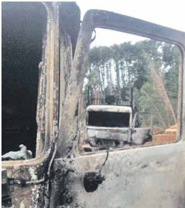
REGISTRO DE ATAQUE INCENDIARIO ocurrido en la comuna de Lanco.

violencia, el gerente general de Kruse, manifestó que "el gobierno de esto se está lavando las manos hace mucho tiempo, y tiene a la institución de Carabineros de Chile atados de manos, sin poder