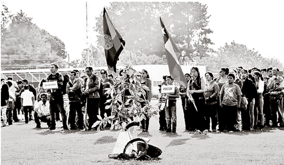
INAUGURACIÓN DE ACTIVIDAD en la comuna de Mulchén. (Imagen de archivo)