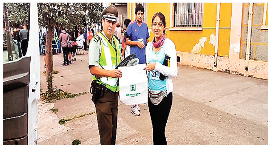
FUNCIONARIO ENTREGANDO VOLANTE con información sobre admisión a Carabineros.

La campaña continuará ejecutándose hasta el mes de marzo, en donde se tienen programadas distintas visitas a liceos de la comuna mulchentina.