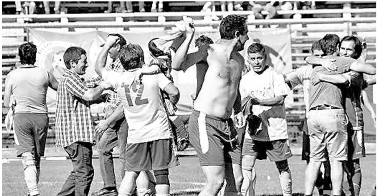
CUADRO DE LA COMUNA del Bureo dio la sorpresa y eliminó a Real Victoria en octavos de final de la Copa de campeones de la ANFA regional.

Respecto a la planificación del partido de vuelta ante el cuadro angelino, afirmó que no era fácil dar vuelta el juego, pero que los venía siguiendo desde que supo que iba por la llave de ellos, los estudió partido a partido, donde dice, se dio el trabajo de grabar los partidos de su rival y ver los movimientos de cada jugador,