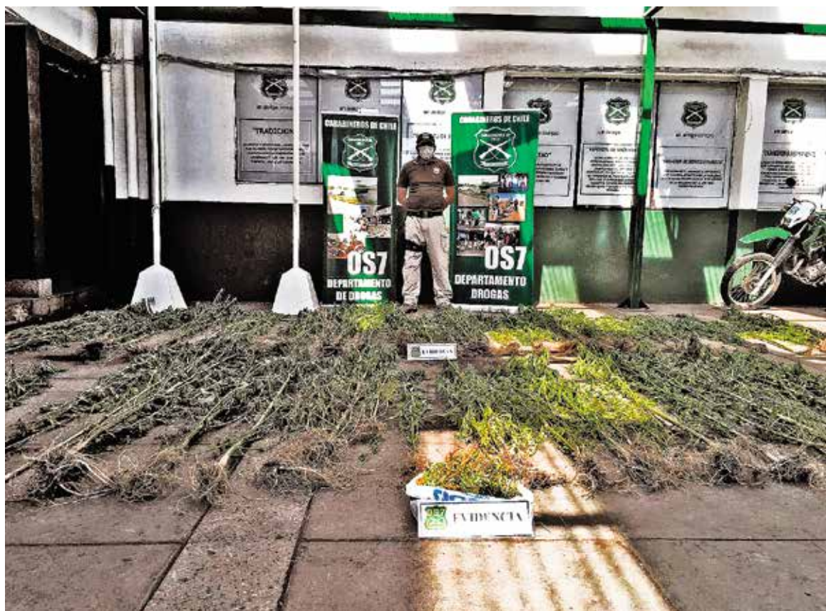
EL DECOMISO DE DROGAS concluyó con una persona detenida.

Desde la Sección OS7 de Carabineros sostuvieron que el operativo se enmarcó en el Plan de Erradicación de Cannabis Sativa 2015-2016, que tan sólo en la semana lleva decomisado en la provincia 4 kilos de marihuana a granel y más de 225 plantas.