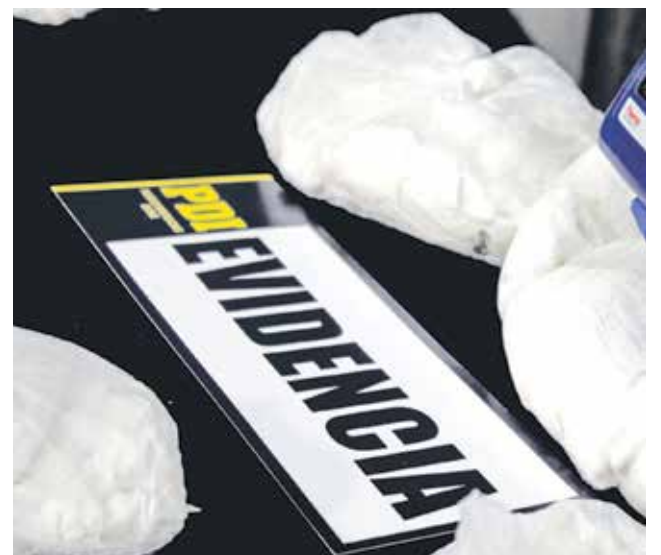
IMAGEN DE LAS DOSIS de cocaína halladas en posesión del sujeto.

Finalmente el sujeto fue puesto a disposición del tribunal competente, por la comercialización de droga evaluada en $1.200.000.