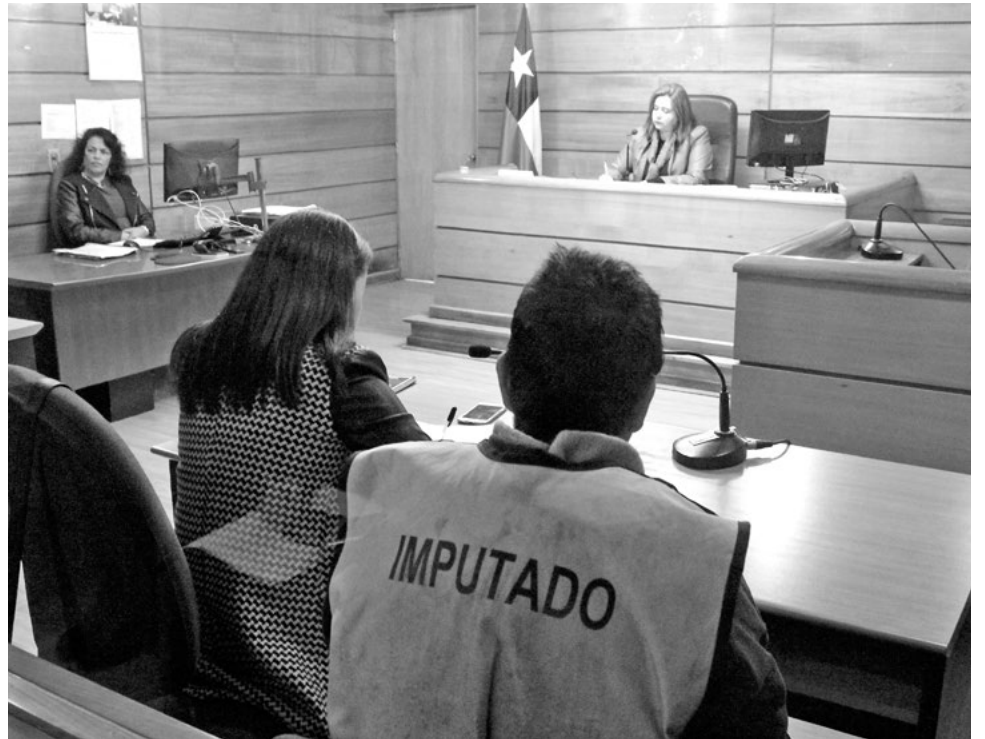
EN EL JUZGADO de Letras y Garantía de Santa Bárbara, C.A.P.M. fue formalizado por los delitos de parricidio consumado y frustrado.

Por su parte, a juicio de la Defensoría Penal Pública en