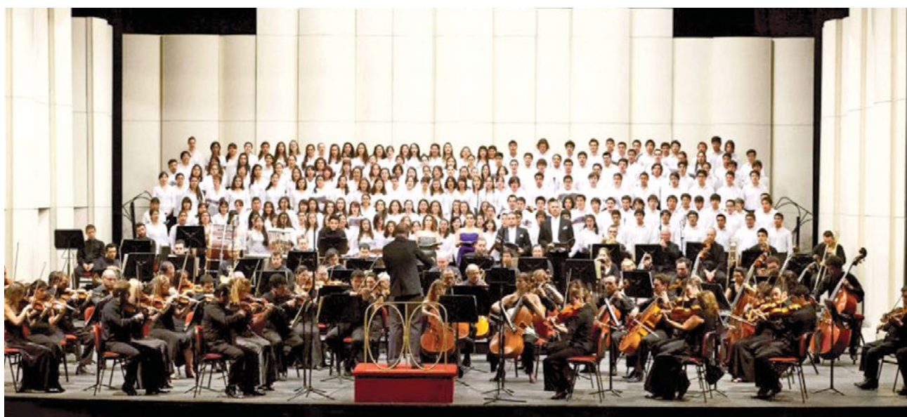
“CRECER CANTANDO”, programa del Teatro Municipal.

Yo pienso que es una de las primeras expresiones del hombre, un grito de alabanza o de temor. El canto está arraigado al interior de nuestra espiritualidad.