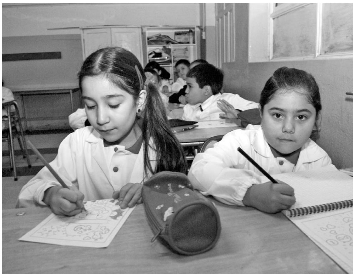
ENTRE EL LUNES 6 y el viernes 17 de julio, los estudiantes de los colegios municipales tendrán vacaciones de invierno.

Luego de diversos diálogos con el Magisterio, el alcalde José Pinto decidió adelantar el periodo de descanso.