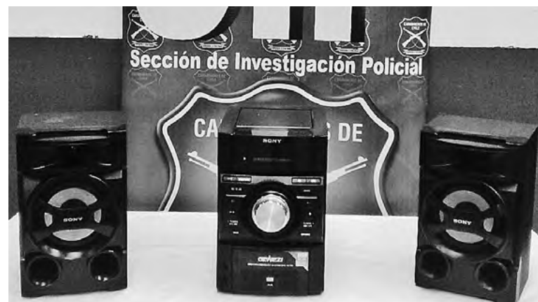
UN EQUIPO DE MÚSICA está dentro de las especies sustraídas desde la casa y que fueron recuperadas por la SIP.

Mantiene antecedentes por distintos delitos, especialmente por robo en lugar habitado y no habitado.