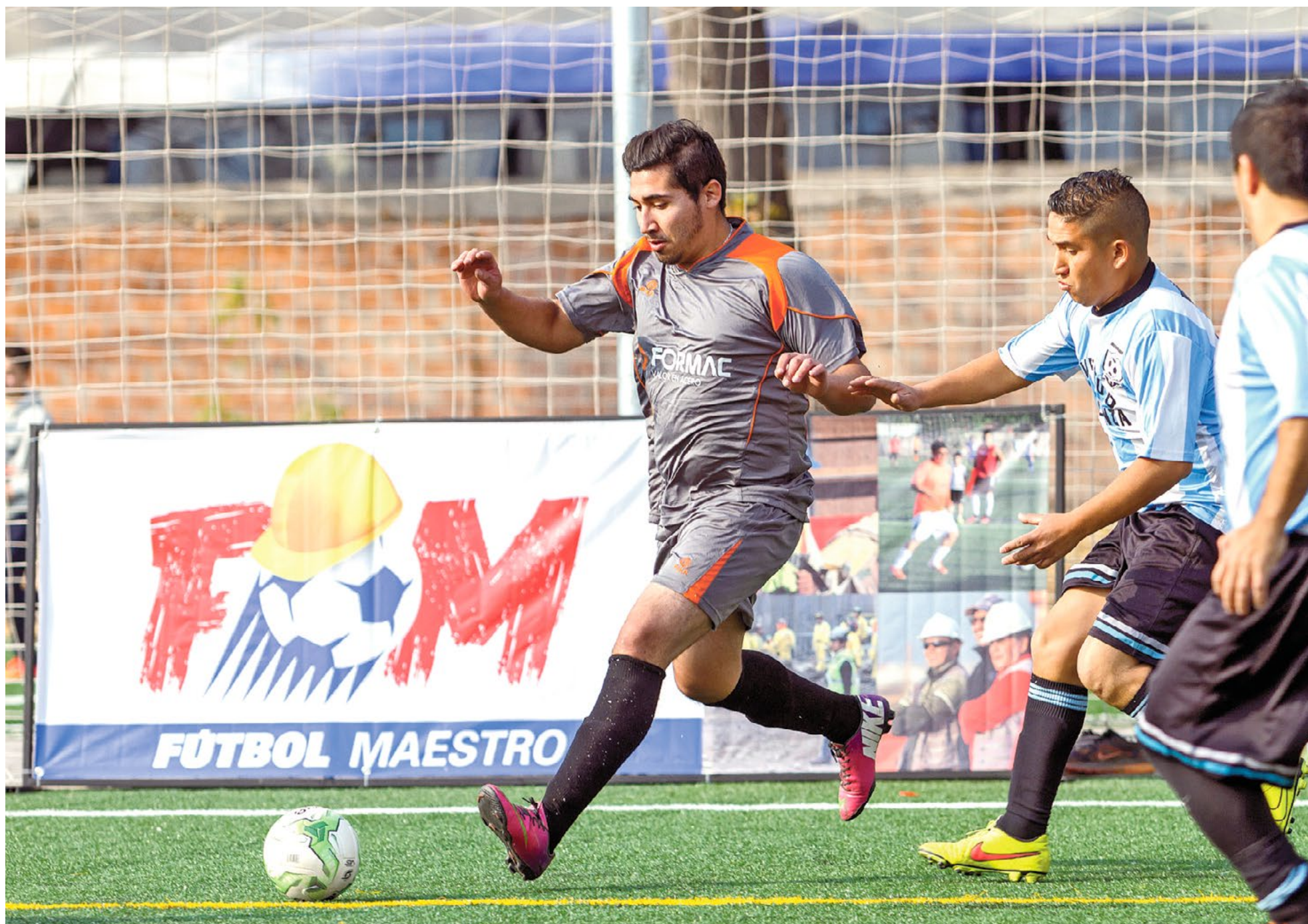
TORNEO DE FÚTBOL MAESTRO