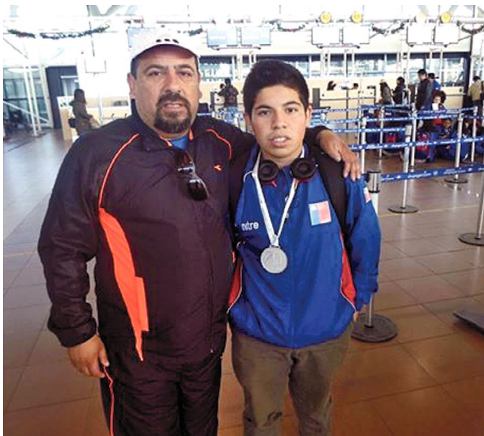
PRACTICA CON SU PADRE, quien es el entrenador de la Escuela Municipal de Ajedrez angelina

Mi familia siempre me apoya, es una familia de ajedrecistas, por lo tanto, se ponen muy contentos por mis logros.