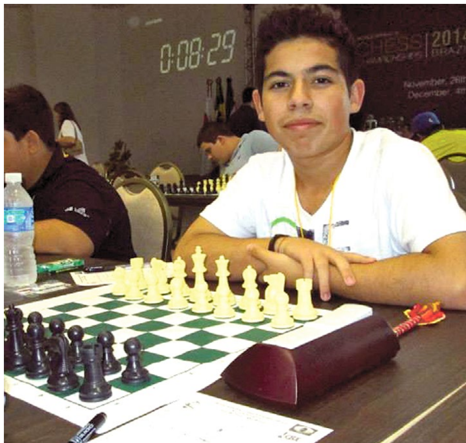
SU PRIMER TORNEO fue a los 6 años, nadie de su familia estaba al tanto de que sabía jugar. Pidió que lo inscribieran para participar, donde fue la sorpresa para todos, obteniendo el segundo lugar.

Creo que debería mejorar mi poder de concentración, ya que en algunas partidas me desconcentro, lo que me lleva algunos minutos volver a retomar la concentración que