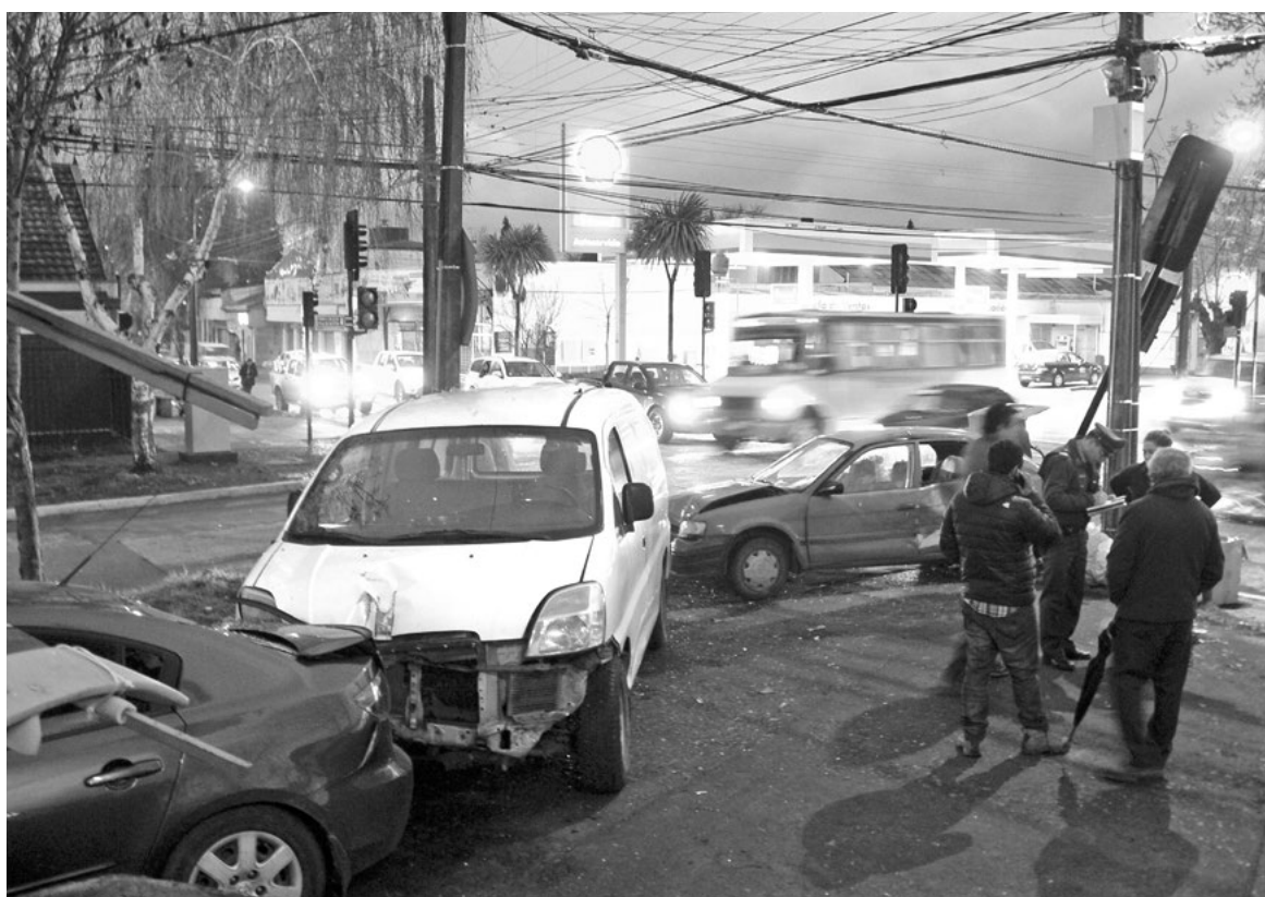
INFORMACIÓN PRELIMINAR expresaba que quien conducía el vehículo rojo no habría respetado la luz roja del semáforo.

Público no ha recabado suficientes antecedentes”, puntualizó Espinoza. En caso de que logren acreditar la participación en los hechos que se le imputan, el hombre arriesgaría una pena que comienza en los 15 años y un día y puede llegar hasta presidio perpetuo calificado. Esto es, 40 años.