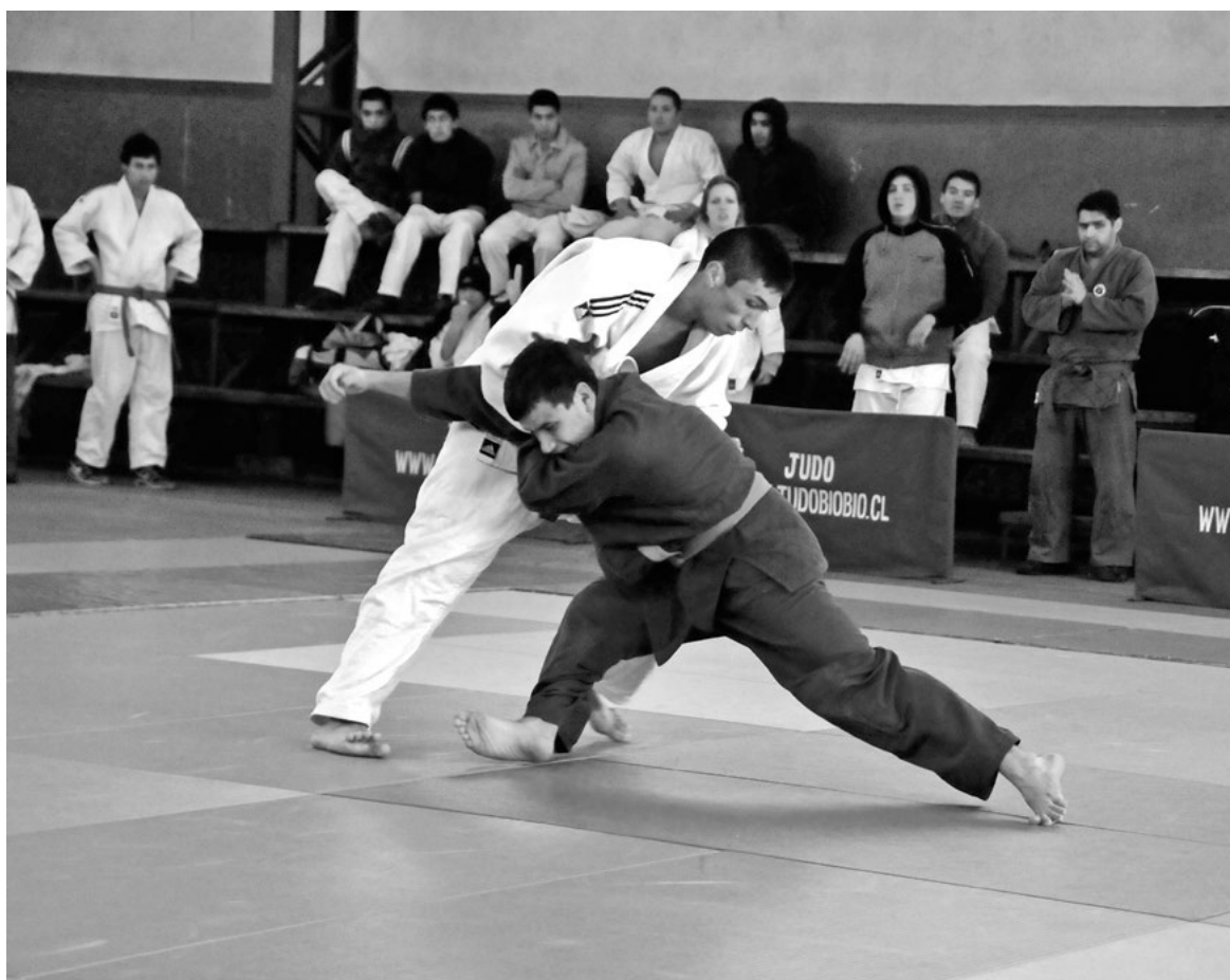
JUDOKAS SE PREPARAN para enfrentarse a los mejores del país en el polideportivo angelino.

El polideportivo se viste de gala para recibir a los principales judokas del país, en uno de los torneos más trascendentales de esta disciplina marcial.