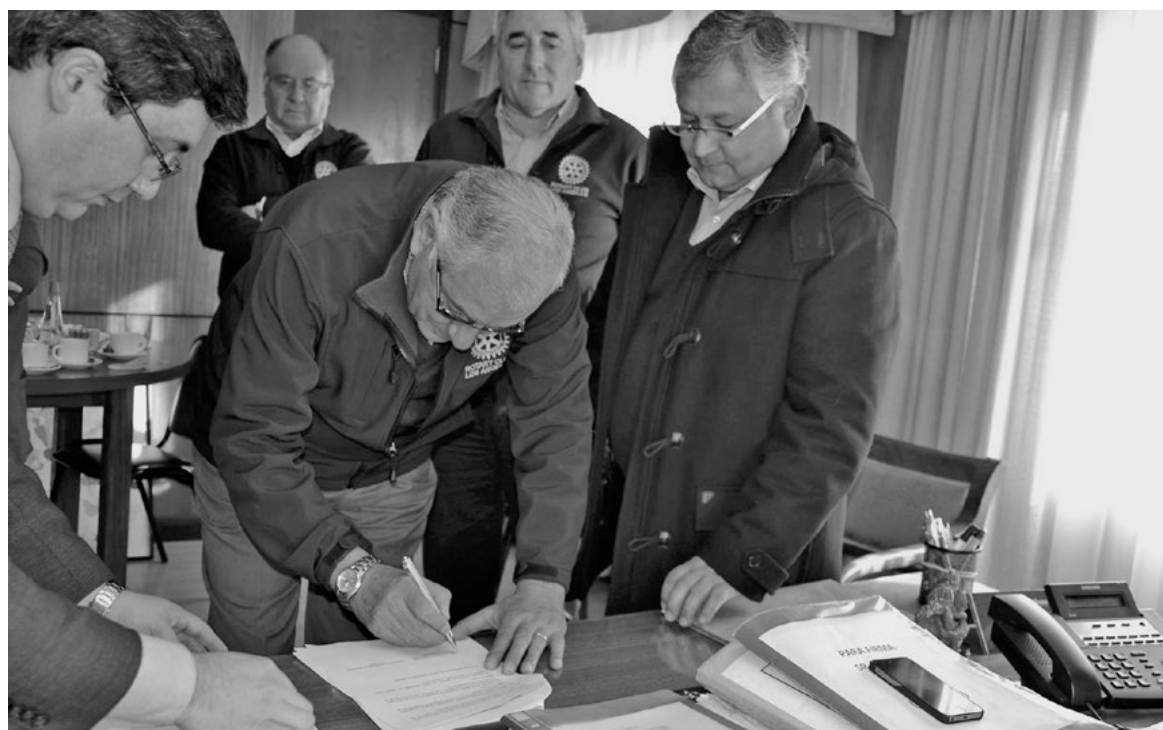
LA FIRMA de este convenio se llevó a efecto el viernes pasado.

Este equipo beneficiará a toda la población inscrita y que requiera de esta prestación profesional y técnica