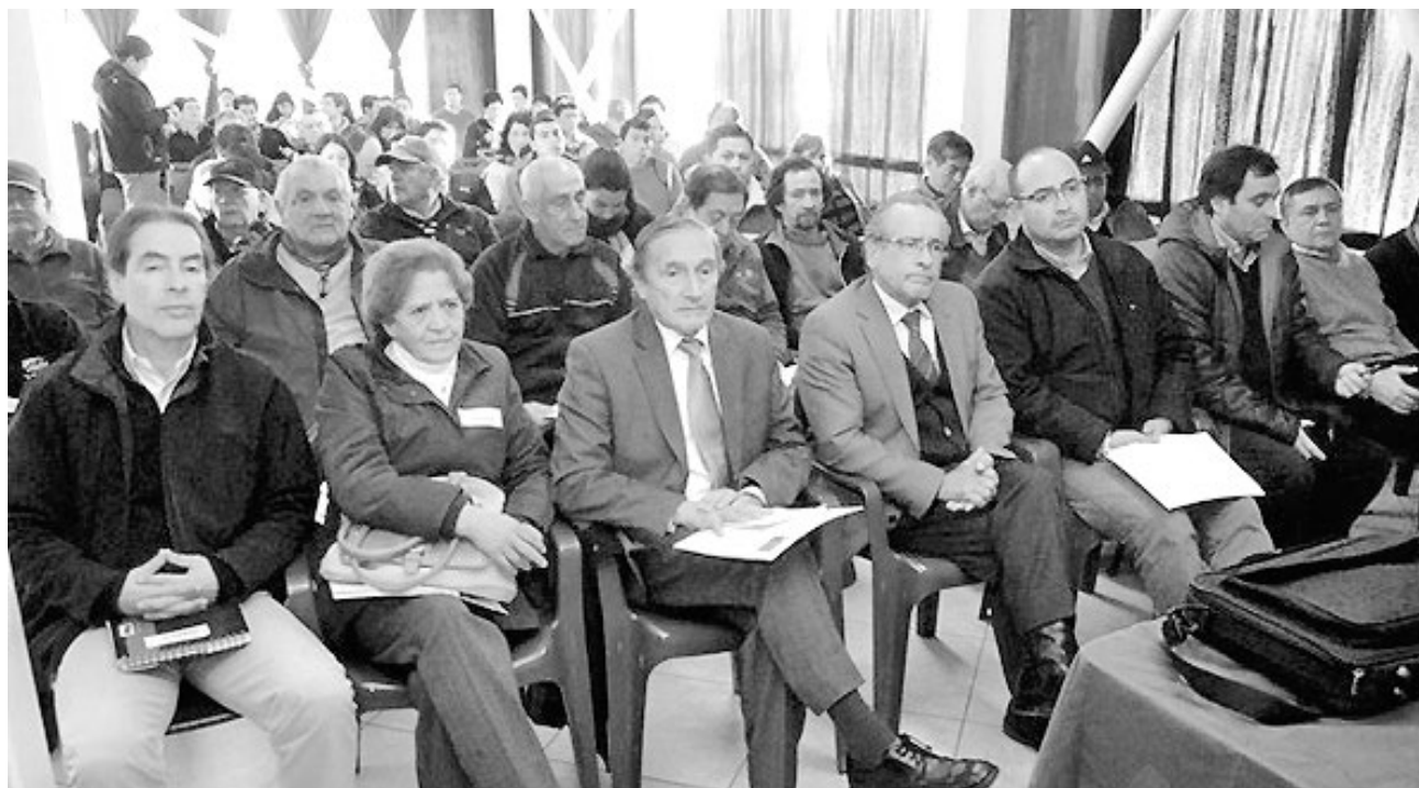
CERCA DE CIEN PERSONAS, provenientes de distintos sectores, participaron en la jornada desarrollada en Laja.

Agregó que acudieron a Laja abiertos a recibir las aspiraciones que tengan como comuna, las que van a unirse a los planteamientos de las otras regiones del país para finalmente dar cuerpo y forma a esta Política Nacional de Actividad Física y Deporte, la que ha de regir la actividad deportiva durante los próximos 15 años.