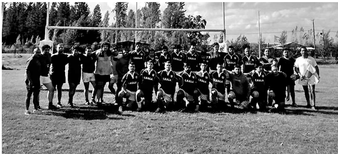
LA IDEA ES QUEDAR dentro de los cuatro primeros lugares este torneo y luego reposicionar al club en la región.

Teniendo en cuenta que la personalidad jurídica siempre