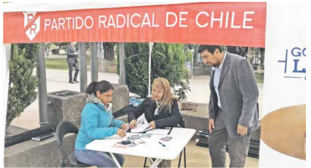
EN LOS ÁNGELES el PR intensifica el trabajo para fichar nuevos militantes.

tener representantes del Partido por la Democracia en las primarias presidenciales con Ricardo Lagos y vamos a cumplir la meta a nivel región”, aseguró.