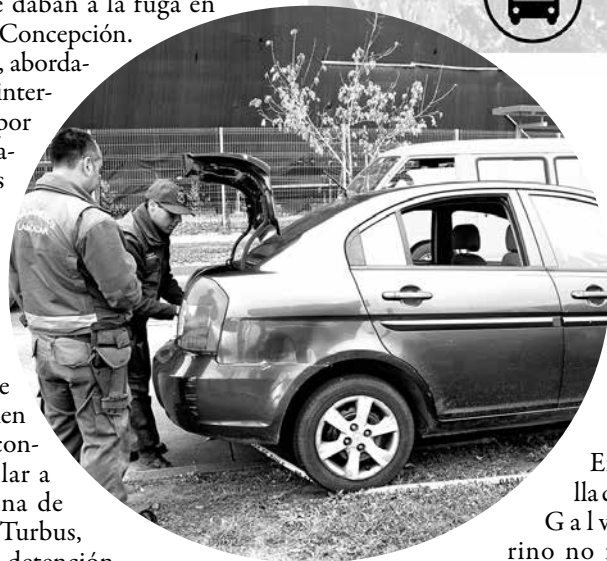
Ercilla con Galvarino no fue encontrada.

El vehículo, en tanto, fue periciado por personal del Laboratorio de Criminalística (Labocar) de Carabineros para, posteriormente, ser devuelto a su dueño.