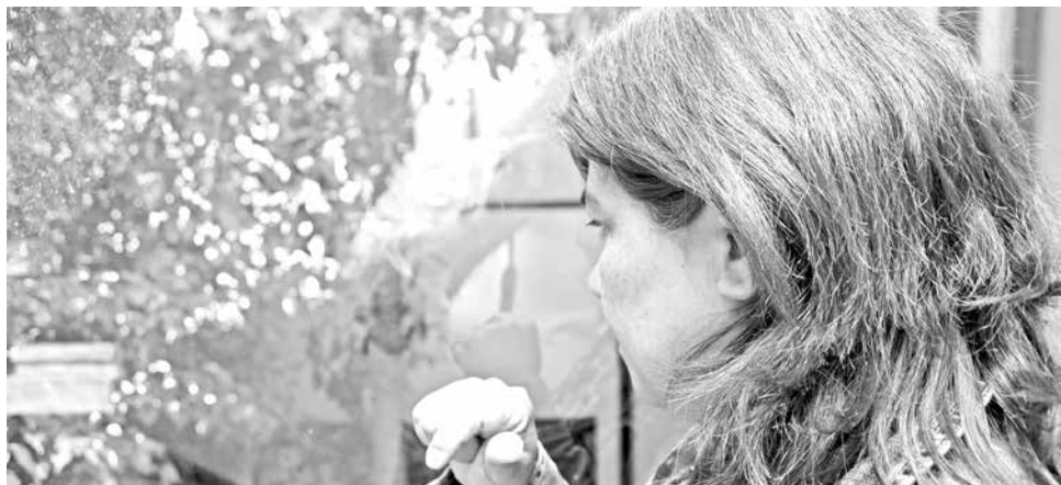
LA DEPRESIÓN ES una enfermedad silenciosa que puede causar la muerte, por eso es importante combatirla.

Junto con ello, sostuvo que "hay que seguir al pie de la letra los cuidados postoperatorios establecidos por el médico, ya que un buen resultado es producto no sólo de una buena cirugía, sino de un adecuado y responsable cuidado postoperatorio por parte del paciente", concluyó el profesional.