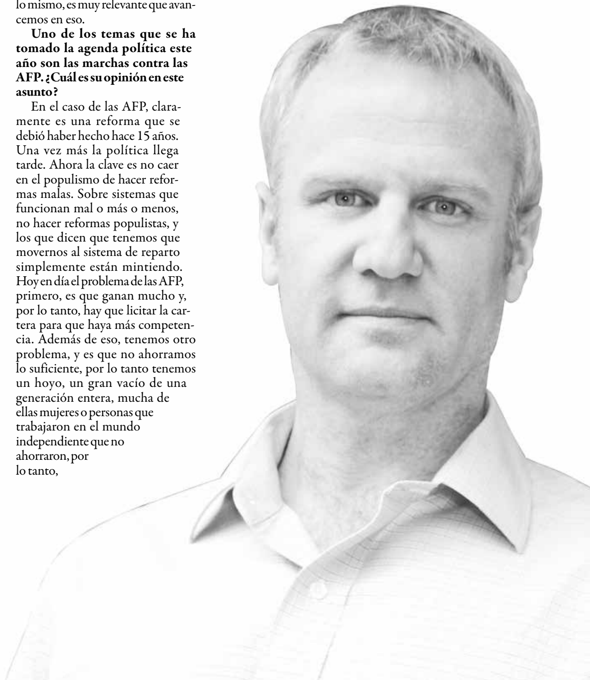
FELIPE KAST EXIGIÓ primarias abiertas dentro de Chile Vamos.

“Lo que importa es que tengamos debates regionales. Aquí necesitamos que ojalá los candidatos presidenciales no nos quedemos cómodos en Santiago, sino que estemos dispuestos a venir a provincia.”