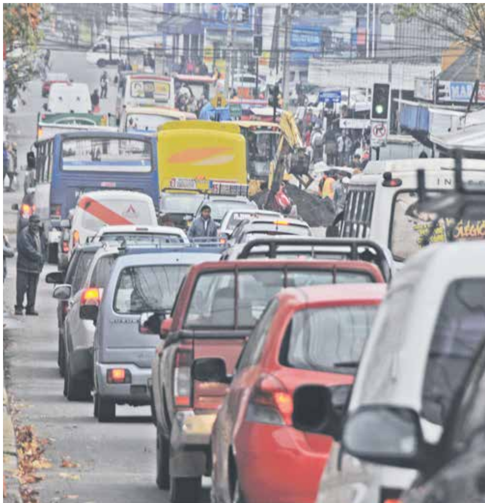
EL PROPIETARIO PUEDE quedar como moroso y se arriesga a intereses extras y a multas policiales que pueden llegar a los $170.000

Hasta las 8 de la noche de hoy los conductores tienen plazo para realizar este trámite.