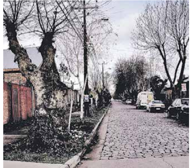
EL CATASTRO REALIZADO permitirá saber qué especies deberán ser renovadas en la ciudad.