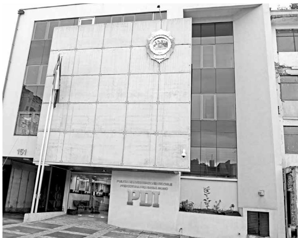
FUERON DETECTIVES DE la PDI quienes realizaron una indagatoria de largo aliento que se extendió entre 2014 y 2015.