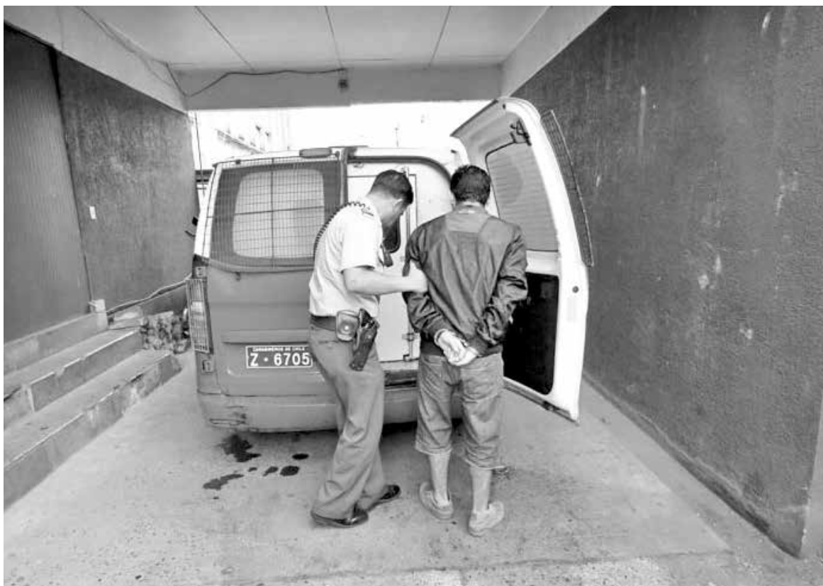
EL HOMBRE FUE FORMALIZADO por el delito de robo con intimidación, quedando en prisión preventiva.

Personal de la SIP activó el plan de búsqueda de información, logrando