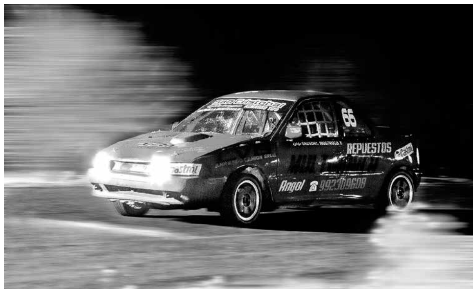
DESDE LA ORGANIZACIÓN aseguraron que esto abre la puerta a crear un campeonato nocturno.

Sebastián Díaz Sandoval deportes@latribuna.cl