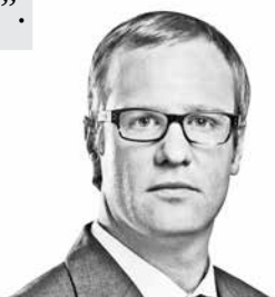
Felipe Kast, candidato presidencial Evópoli.

“Se ratifican las primarias abiertas, legales y vinculantes. Si es que antes se elegían los candidatos presidenciales entre cuatro paredes, hoy el poder está en la ciudadanía. Felicito a Sebastián Piñera y a Manuel José Ossandón por demostrar que la democracia es estar dispuesto a competir; ojalá no descalificando sino mostrando a Chile nuestros sueños de futuro”.