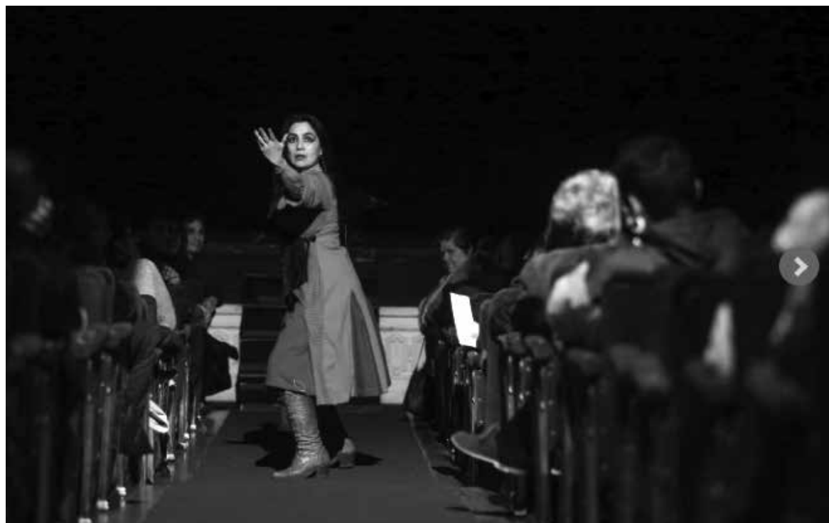
ESTE SEMINARIO SE REALIZA en el marco del aniversario de los 10 años del Programa Iberescena.