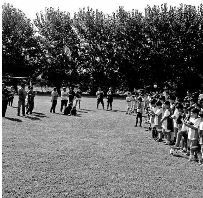
LA ESCUELA DE FÚTBOL de la Prefectura, del hospital, "Entre ríos" de Nacimiento y Los Ángeles Galaxy participan de la actividad.

Así, la escuela de fútbol de la Prefectura de Carabineros Biobío hace extensiva la invitación a todos los padres, apoderados, familiares y amigos a concurrir hasta el complejo deportivo de Carabineros de Santa Fe apoyar a los niños y participar de esta actividad deportiva y recreativa.