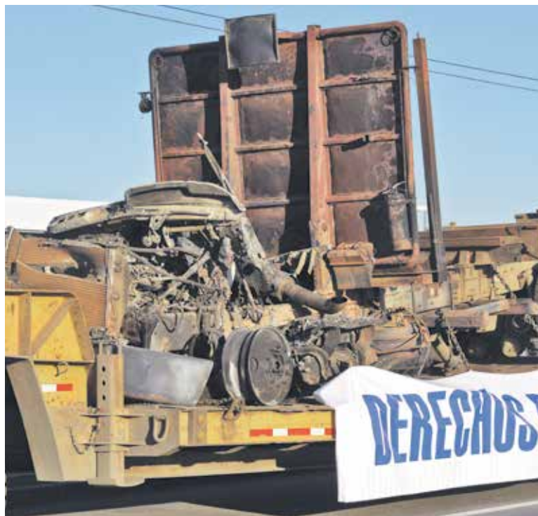
EL ANGELINO PERDIÓ 5 máquinas del rubro forestal en el pasado ataque por encapuchados.

“Los empresarios y los trabajadores, la gente que vive en el lugar, están absolutamente cansados de esto, y pierden ellos, la economía de la región, el turismo y la imagen de nuestro país”, finalizó el vocero, Rolando Merino.