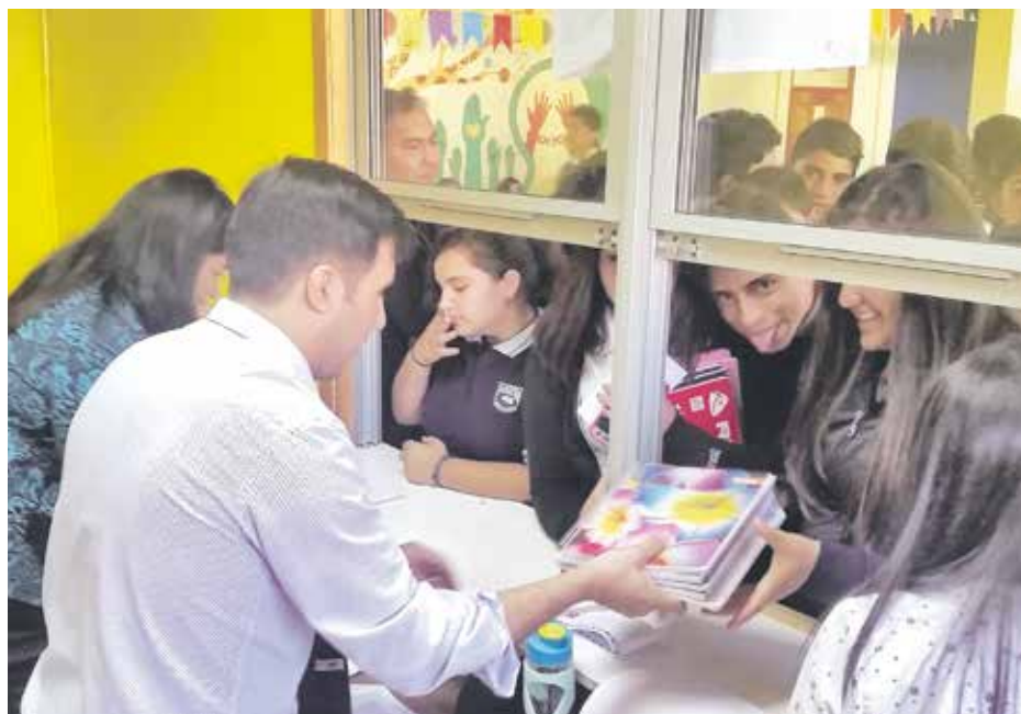
EL OBJETIVO PRINCIPAL es que los alumnos puedan autogestionar los recursos que necesitan.

El director del Daem sostuvo que esta unidad educativa ha fortalecido sus carreras -Electricidad, Enfermería y Párvulos- y