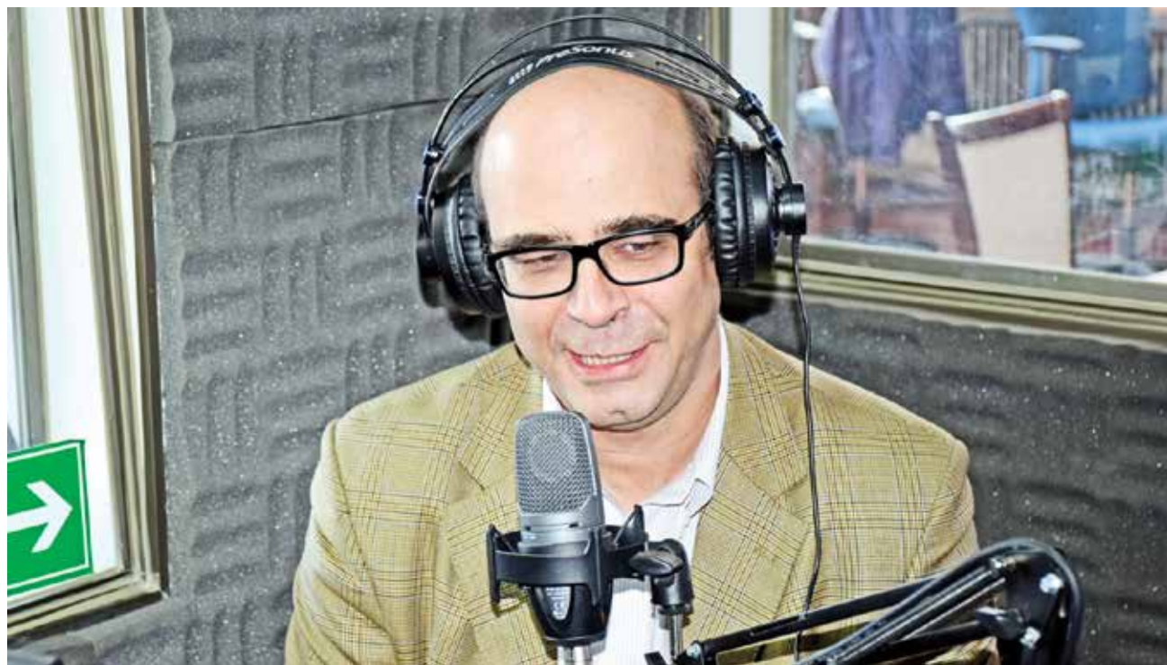
FERNANDO ATRIA, señaló que lo político es visto como un poder que está al servicio del poder económico.

Consultado sobre el acontecer de la ciudadanía en la política nacional, Fernando Atria, contextualizó que “hay un problema fundamental de relación entre el poder político y económico, yo lo diría así