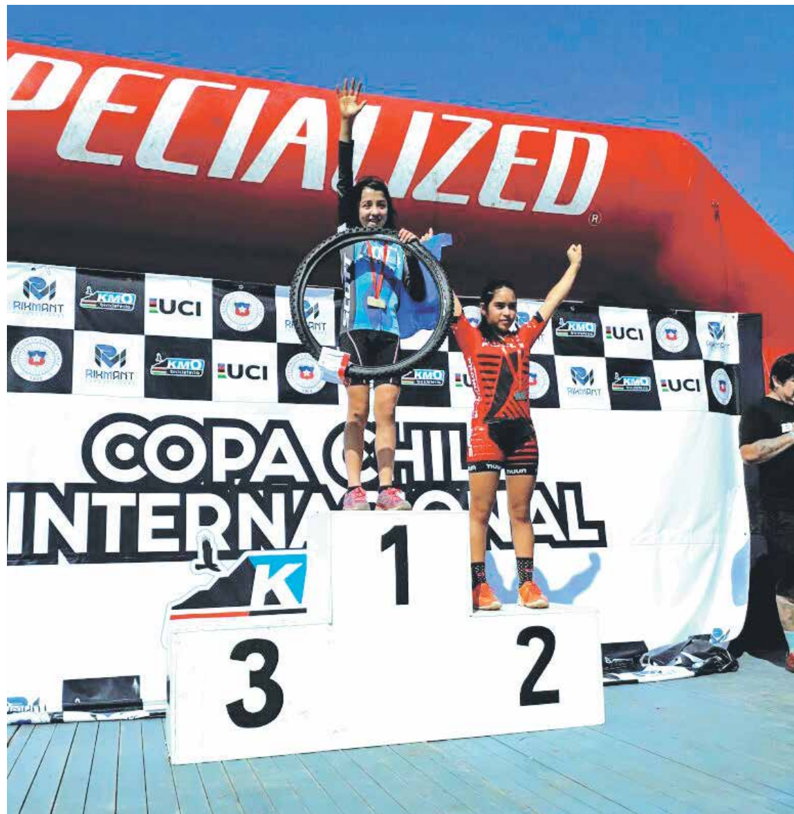
EL CONSTRUCTOR Y UCM-SCOTT LOS ÁNGELES tuvieron destacadas participaciones en Curicó y Chillán.