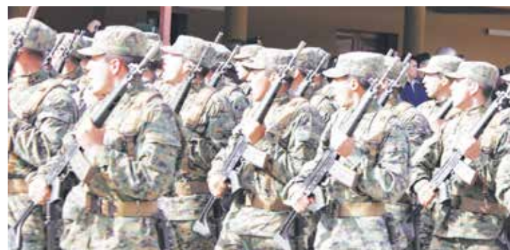
LOS PLAZOS SE AMPLIARON en todo el país y comienzan a regir para los días lunes y martes de la próxima semana.