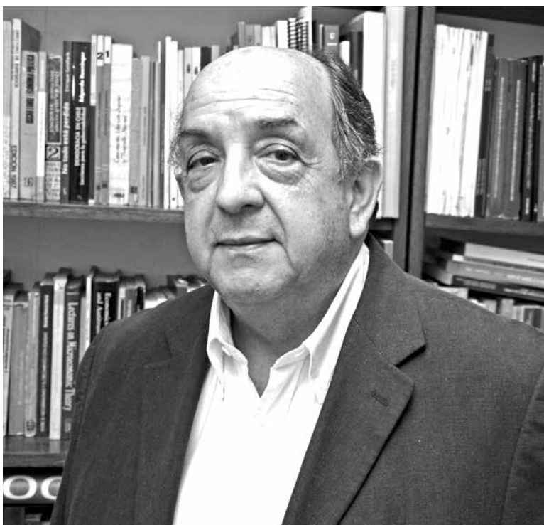
EL EXPERTO RECALCÓ que "a tasas decrecientes, en 2017 podemos llegar hasta el 1% y perfectamente continuar hacia abajo después".