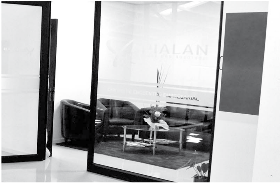
LA ESTRUCTURA CUENTA con dos salas de reuniones implementadas con todas las tecnologías necesarias, además de una sala multiuso.

Ya es una realidad. Después de 20 años, Los Ángeles tiene su primer Centro de Encuentro e Información destinado para los micros, pequeños y medianos empresarios, lugar en el que podrán informarse, realizar reuniones, seminarios, así como juntarse con sus pares para intercambiar ideas.