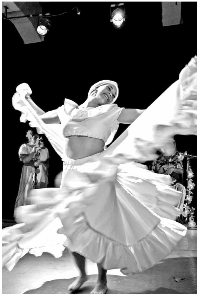
LAS INSCRIPCIONES ya están abiertas a través del sitio http://www.cultura.gob.cl/seminario-politica-aace/

del Programa Iberescena y contará con la participación de los representantes de los 13 países miembros: Argentina, Brasil, Colombia, Bolivia, Costa Rica, Ecuador, El Salvador, España, México, Panamá, Paraguay, Perú y Uruguay, junto a los representantes de la Secretaría General Iberoamericana-SEGIB, de la Agencia Española de Cooperación Internacional para el Desarrollo-AECID y el Secretario Técnico de Iberescena. El seminario será transmitido vía streaming.