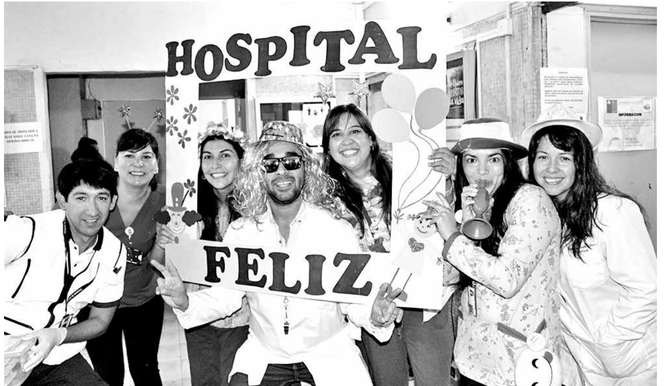
LA ACTIVIDAD PERMITE estrechar los lazos entre el personal y la comunidad.

Los usuarios también se sumaron a la jornada y mani-