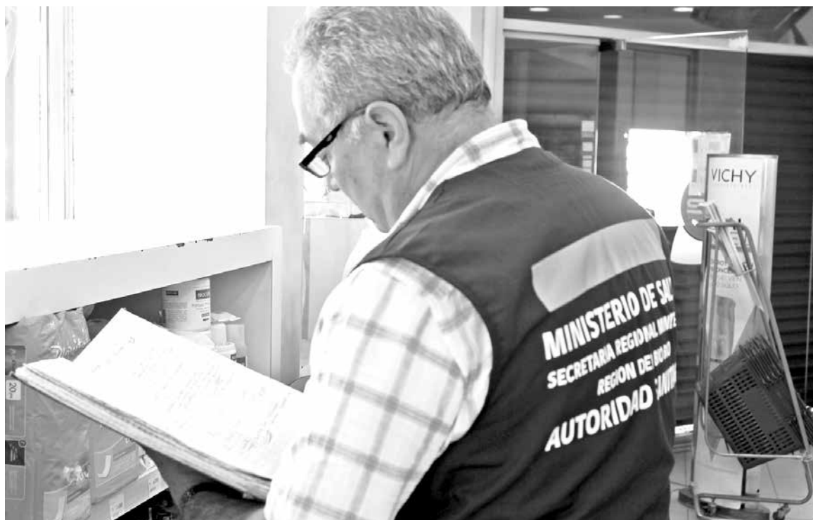
A NIVEL REGIONAL se han iniciado entre 2014 y 2016 un total de 134 sumarios.

El trabajo de fiscalización a farmacias por parte de la autoridad sanitaria, en los últimos tres años a nivel provincial, ha dado origen a 26