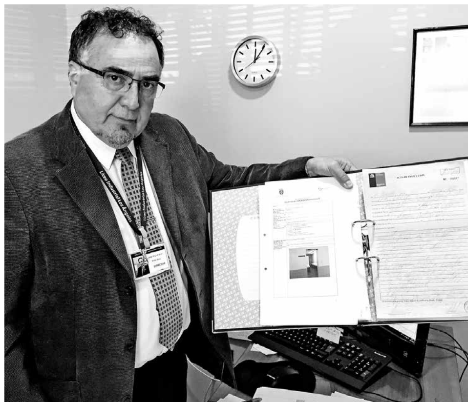
ALUMNOS DEL LICEO pidieron hace un año la mejora en los servicios higiénicos y sólo hoy tienen respuesta.