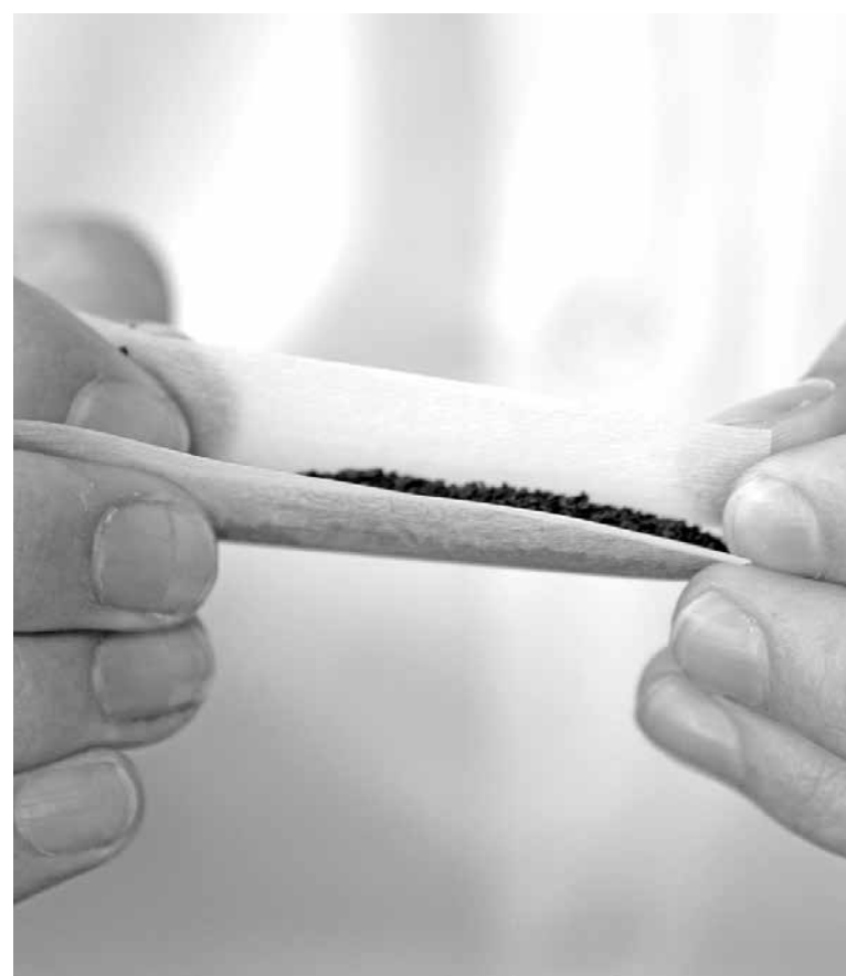
EL MENOR cursa 8° básico en la Escuela Isla del Laja, emplazada en la población O'Higgins de Los Ángeles.

De igual forma, agregó que Carabineros les ofreció empezar con un ciclo de charlas en el establecimiento "pero basados en la versión si es o no droga pero no tenemos esa confirmación aún", puntualizó el director.