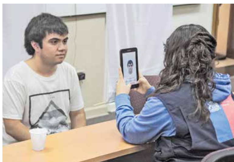
SE ESPERA QUE más de 100 mil estudiantes reciban su nueva TNE 2017.

Continúa desarrollándose el proceso de captura fotográfica para la Tarjeta Nacional Estudiantil (TNE) dirigido a alumnos de Educación Superior.