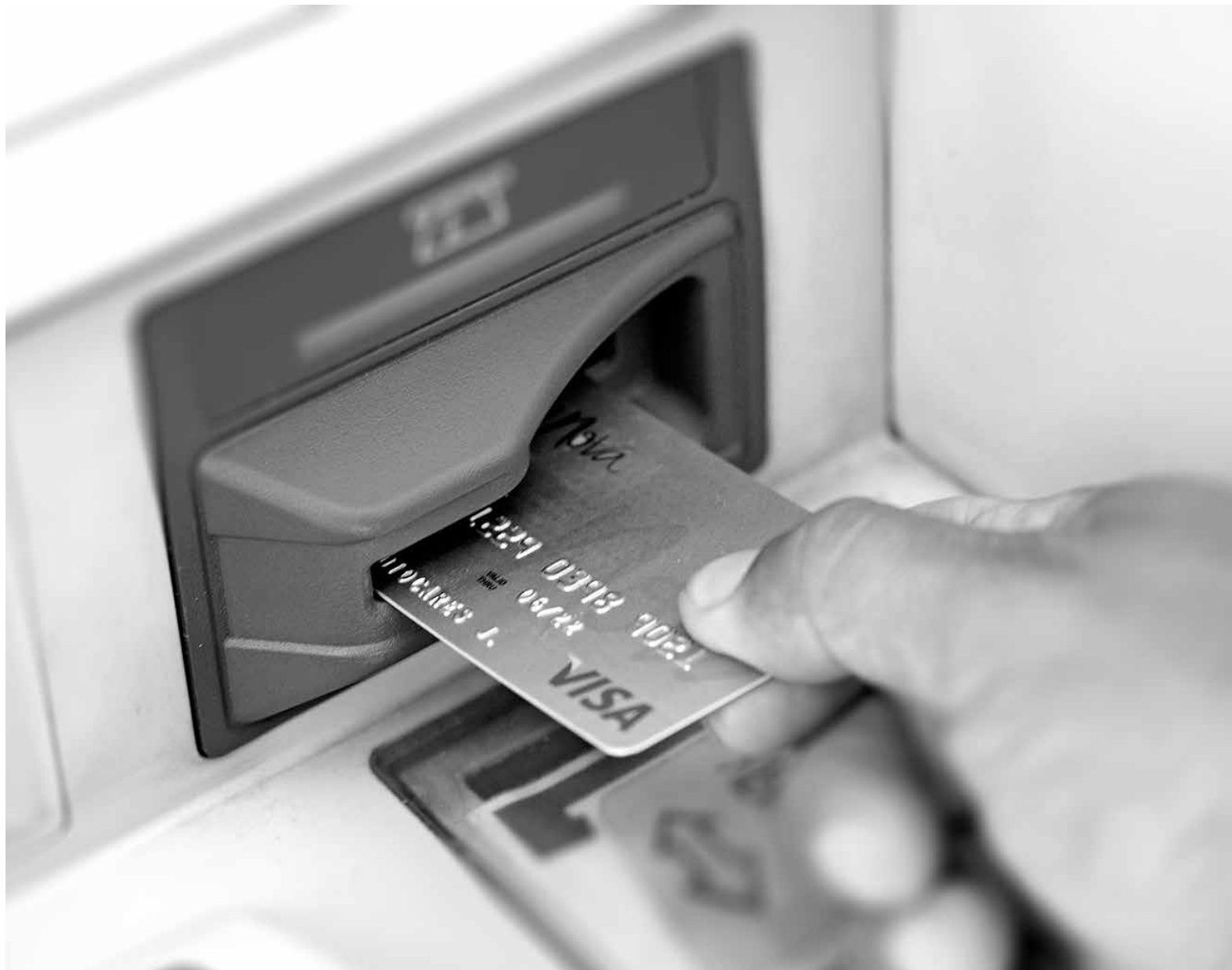
AL MENOS 15 DENUNCIAS ha recibido la PDI por la clonación masiva de tarjetas bancarias en Los Ángeles.

Pese a que Delgado realizó la denuncia por la clonación de su tarjeta en Carabineros de Chile, información recabada por La Tribuna da cuenta de que la Policía de Investigaciones acogió denuncias masivas