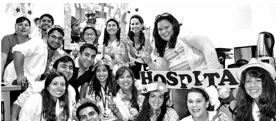
FUNCIONARIOS ASEGURAN que estas intervenciones cambian el ambiente laboral y el ánimo de los pacientes.