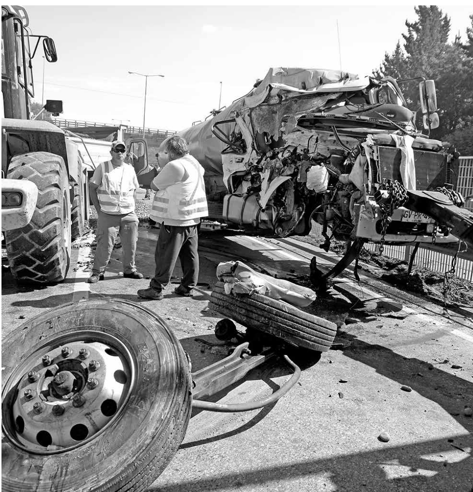
EL HECHO SE PRODUJO a la altura del kilómetro 535 de la Ruta 5 Sur.

A LA ALTURA DEL ACCESO A LA COMUNA DE MULCHÉN