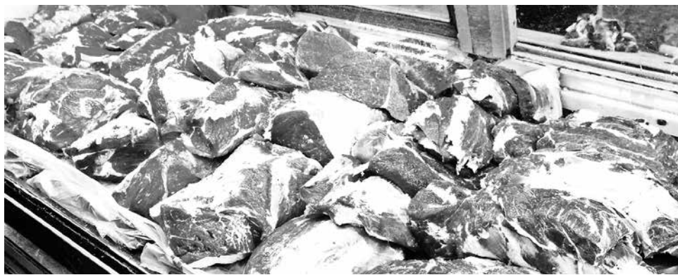
LA PRODUCCIÓN DE CARNE en vara de ganado bovino registró 1.781,9 toneladas.

En tanto, la producción de carne porcina en vara presentó un alza acumulada a noviembre 2015 de 24,5%, es decir, 714,6 toneladas más.