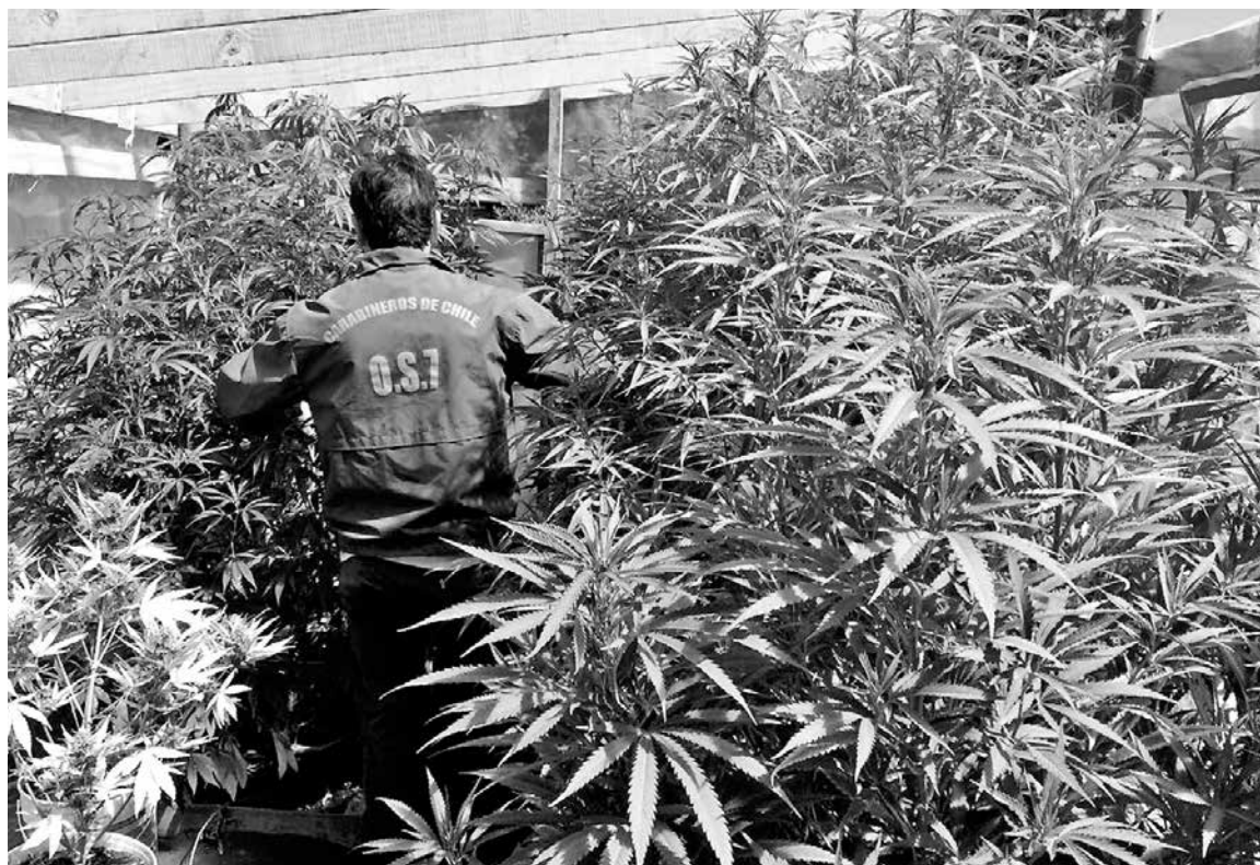
UN TOTAL DE DIECISÉIS plantas de cannabis sativa fueron incautadas sólo en la comuna de Cabrero.

exhortaron a la comunidad a entregar información oportuna en torno a puntos de venta de drogas y personas que se dedican a su comercialización.