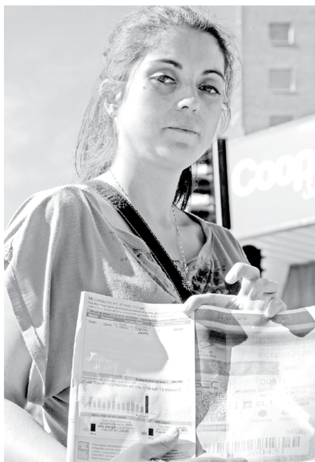
LA AFECTADA ACUDIÓ a las oficinas de la entidad la jornada de ayer, asegurando que —incluso— fue tratada rudamente por los funcionarios.

“Ella puede hacer el reclamo por internet, por teléfono o con la misma ejecutiva, enviándole copia a la Superintendencia. Eso es lo que se no pide, en ningún momento la presencia de un libro de reclamos”, sentenció.