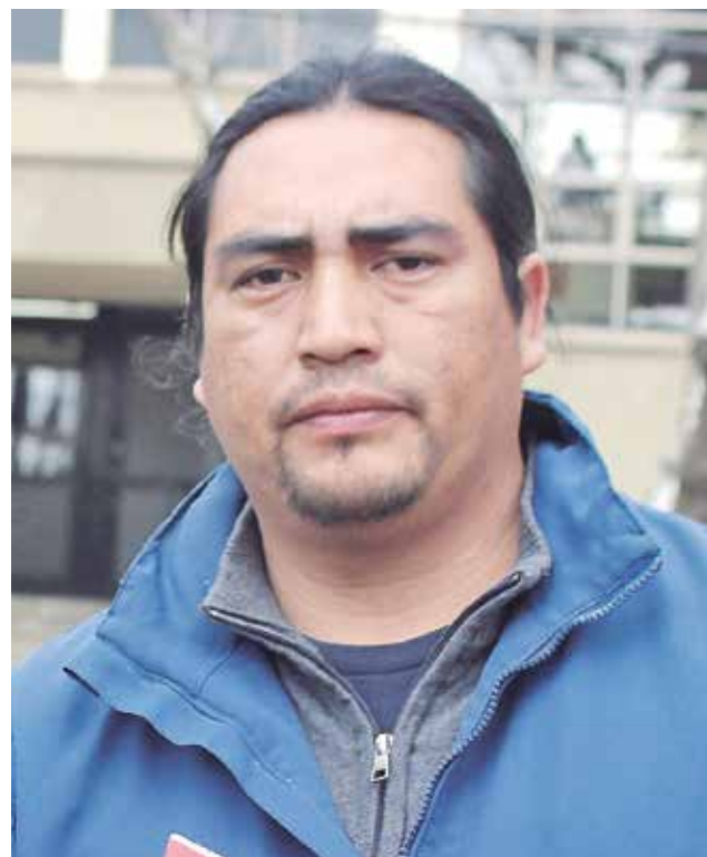
REPRESENTANTE INDÍGENA cuestionó que no se haya integrado la autonomía mapuche dentro de las conclusiones.

que ahora la mandataria analizará las propuestas, con la finalidad de ver la posibilidad de darles curso, dentro de las cuales también aparece el reconocimiento constitucional del pueblo indígena,