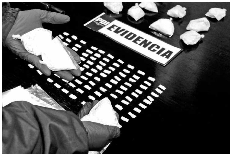
ESTE TIPO de intervenciones pretende desincentivar y reducir el tráfico de drogas y disminuir la sensación de inseguridad.

Se trató de dos operativos que se enmarcaron dentro de una investigación desarrollada en coordinación con el Ministerio Público, permitiendo —además— confiscar municiones de diferentes calibres.