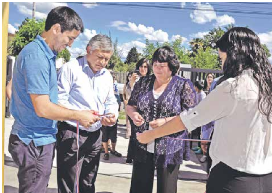
LAS OBRAS SIGNIFICARON una inversión que supera los 42 millones de pesos.

El Fondo Nacional de Seguridad Pública es un concurso anual que busca incorporar a agrupaciones comunitarias, organizaciones sin fines de