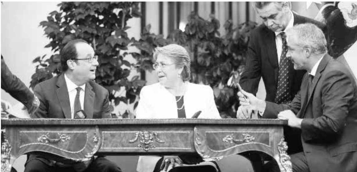
AUTORIDADES EN FIRMA de acuerdo en Palacio de La Moneda.

Las autoridades expresaron su satisfacción por la existencia de manifestaciones culturales y artísticas de alta visibilidad en Chile y en Francia, tales como la retrospectiva del cineasta chileno Raúl Ruiz que tuvo lugar en 2016; las ediciones bilingües relacionadas con la exposición fotográfica "El espíritu de los hombres de Tierra del Fuego"; los intercambios y circulación de obras de teatro y de artes escénicas que se producen cada año; las exposiciones provenientes de museos dedicados a las artes visuales y un gran número de coproducciones cinematográficas y acciones basadas en acuerdos directos entre festivales, centros de creación y otras estructuras ligadas a la cultura.