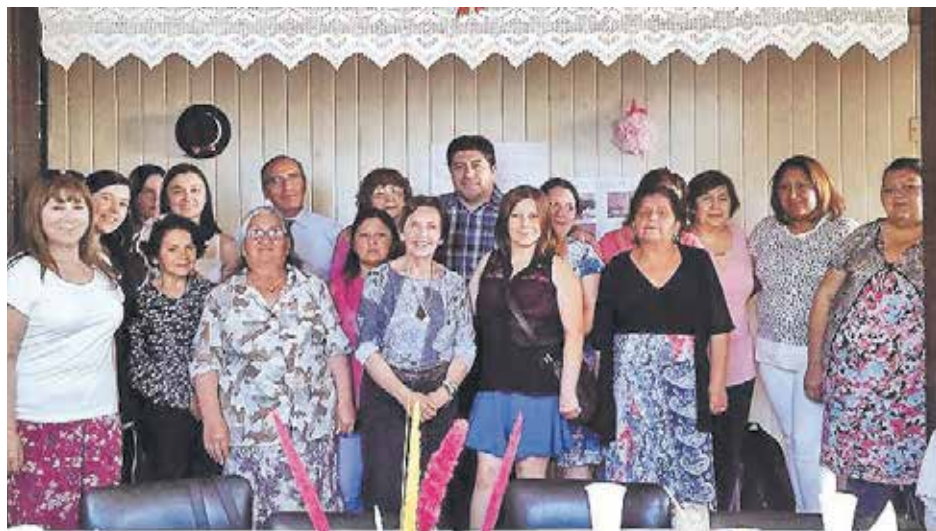
DURANTE LA JORNADA, se entregaron certificados y regalos a las alumnas, compartiendo con ellas de una once.

Para aquellas personas de Mulchén interesadas en ser parte de este programa, llamar al siguiente número para mayor información: 79686914