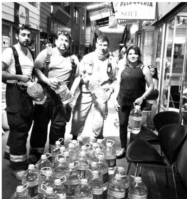
SE ESPERA QUE LA GENTE se acerque al lugar en donde se recibe colaboración. Local 37, del centro comercial Sovela.

Después de la tragedia que se está viviendo en la región de O'Higgins se encuentra en alerta por los incendios que se han propagado en diferentes sectores, dejando a muchas familias sin casa, y con pérdida total de lo que para muchos era su fuente laboral, el ganado y las siembras.