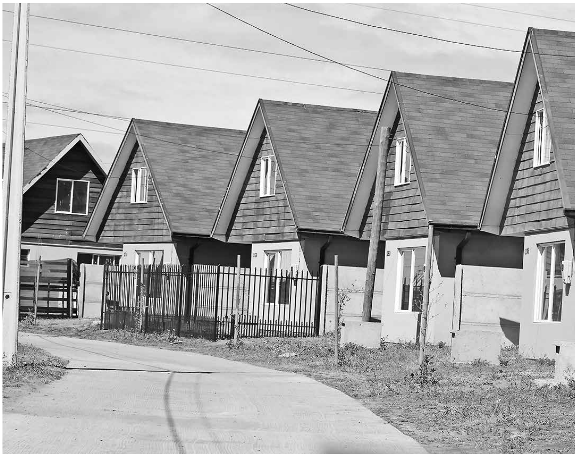
BENEFICIO CONTEMPLA tres alternativas de postulación para los grupos familiares.

te comprar una vivienda nueva o usada o construir en terreno propio o cedido (densificación predial); la vivienda a adquirir o construir debe tener un valor y no puede exceder las 2200 UF. Según el tramo a postular, las familias podrán optar a un monto