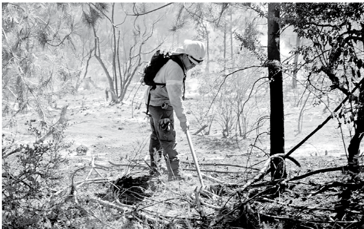
LA INSTITUCIÓN TIENE UN REGISTRO de más de 21 mil hectáreas afectadas por los recientes incendios.

“La idea es trabajar todo el año, en lo que se llama como silvicultura preventiva, en el sentido de trabajar