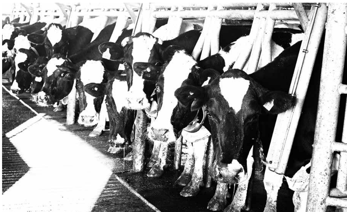
EN LA ACTUALIDAD, Danone Chile recibe leche fresca de productores de la zona de Ñuble, Los Ángeles y de La Araucanía.

Vale consignar que actualmente, Danone procesa leche fresca de pro-