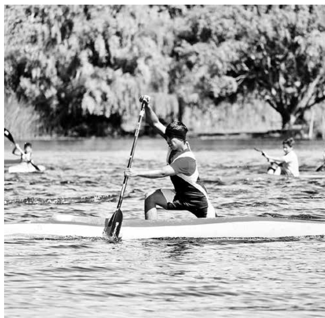
PARTICIPARON DEPORTISTAS de San Pedro de la Paz, Santa Juana, Laja, Talca, Carahue y Nueva Imperial.

Con grandes complicaciones, se desarrolló la tercera versión del Maratón de Canotaje 25K de Quillón, competencia que debió ser reducida a la mitad de su distancia, a raíz de los fuertes vientos provocados por los abruptos cambios de temperatura, generados por los incendios forestales que afectaron la zona.