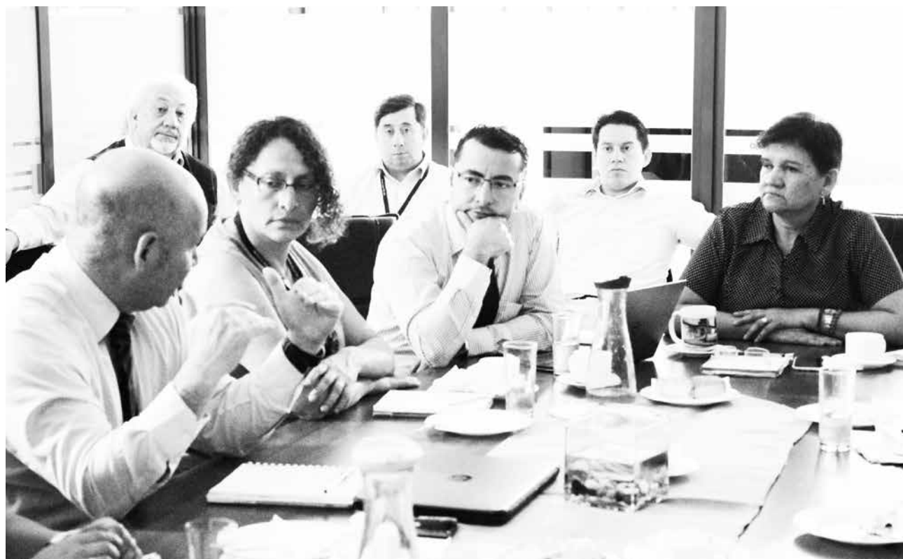
EL TRABAJO QUE ya se ha realizado entre ambas instituciones, seguirá desarrollándose durante los próximos meses.