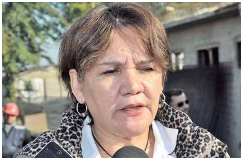
LA MÁXIMA AUTORIDAD del organismo precisó que esto no significa que se modifique el protocolo de categorización de salud.

Con el objetivo de cooperar con el combate de los incendios forestales y de pastizales que se registran, tanto en la región como en la provincia, el Servicio de Salud de Biobío dispuso