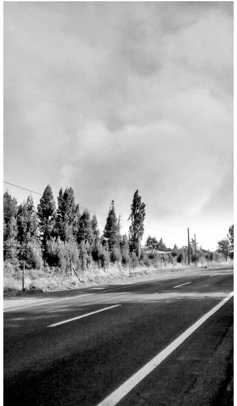
EL INCENDIO FORESTAL que afecta a Yumbel ha arrasado al menos unas 200 hectáreas.

El problema radica en la "agresividad con la que se han empezado a desarrollar los incendios en razón de la temperatura, de la velocidad del viento y cómo estas dos afectan el contenido de humedad del combustible. Por lo tanto, permiten que una vez iniciado el incendio, avance muy rápido", puntualizó el director regional interino de la Corporación Nacional Forestal (Conaf).