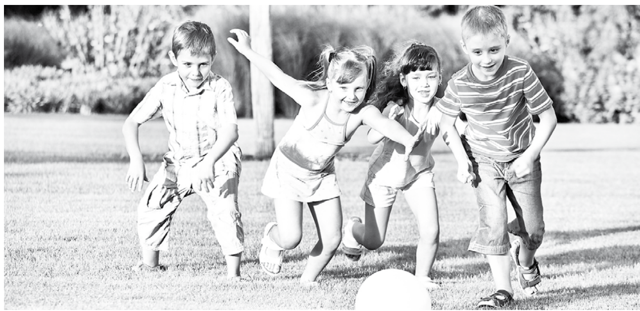
LOS EJERCICIOS CLÁSICOS de fuerza tienen un esquema de movimiento muy definido, trabajan en uno o dos planos.

ficios en las habilidades motoras y cognitivas, siendo positivo para sus relaciones personales, como el respeto a sus compañeros, aceptar la derrota, saber ganar, esperar su turno, obteniendo con ello bienestar físico y psicológico, y experiencia y habilidades para su día a día.