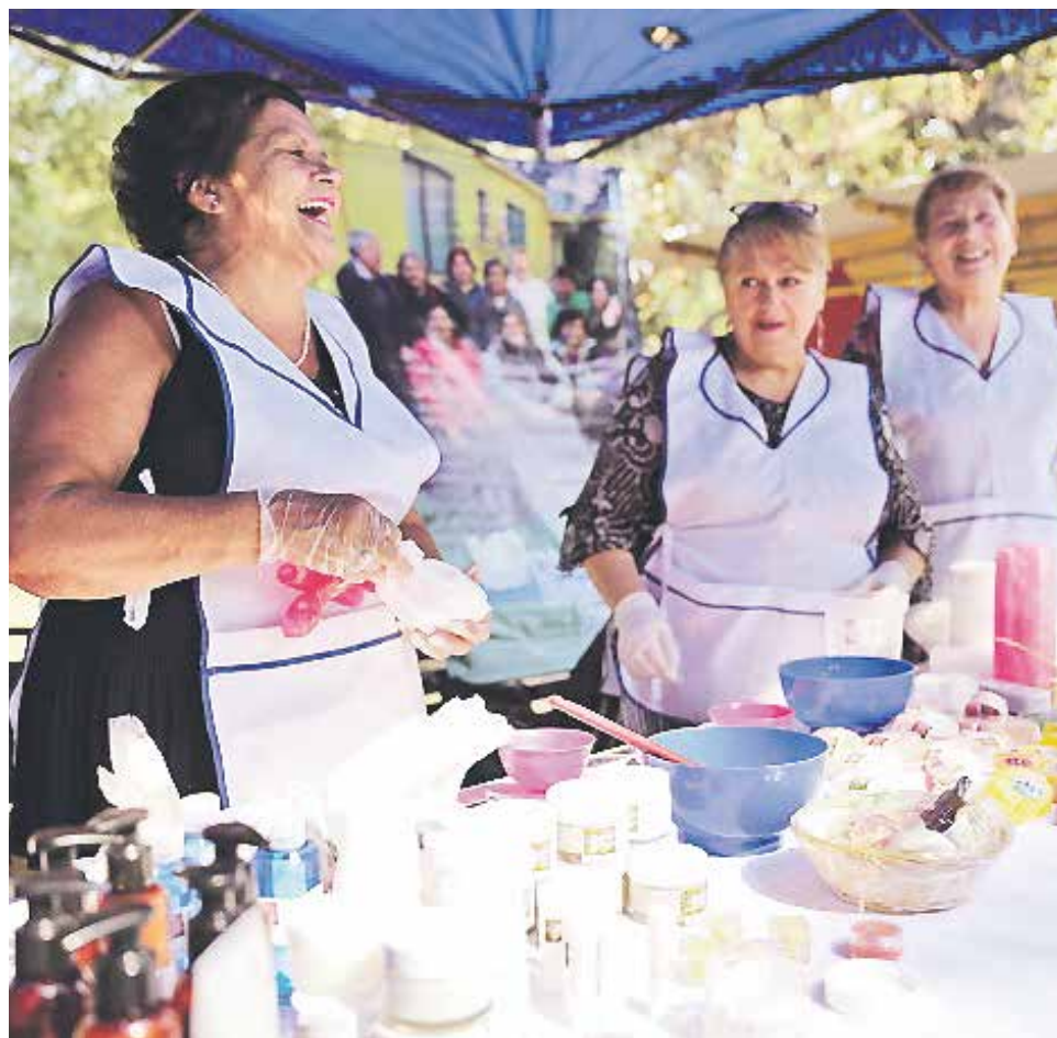
LAS AGRUPACIONES DE TERCERA edad pueden acceder a las bases del fondo en la página www.senama.cl .

“El año pasado este fondo permitió entregar financiamiento a la mitad de las organizaciones que postularon. Esto es muy relevante para ellos, ya que se mantienen activos y aumenta su capacidad de autogestión en el marco del respeto a sus derechos”.