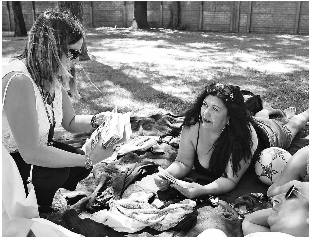
PROFESIONALES APROVECHARON de conversar en detalle con quienes, a esa hora, se encontraban en la piscina.

En materia de prevención del contagio del hanta recordaron la importancia de mantener el exterior de las casas y bodegas libres de maleza y basura; mientras para la prevención de la hepatitis, cólera y diarrea, recordaron la necesidad de consumir siempre agua potable o hervida, además de consumir pescados y mariscos cocidos, junto con lavarse siempre bien las manos antes de comer y cocinar.