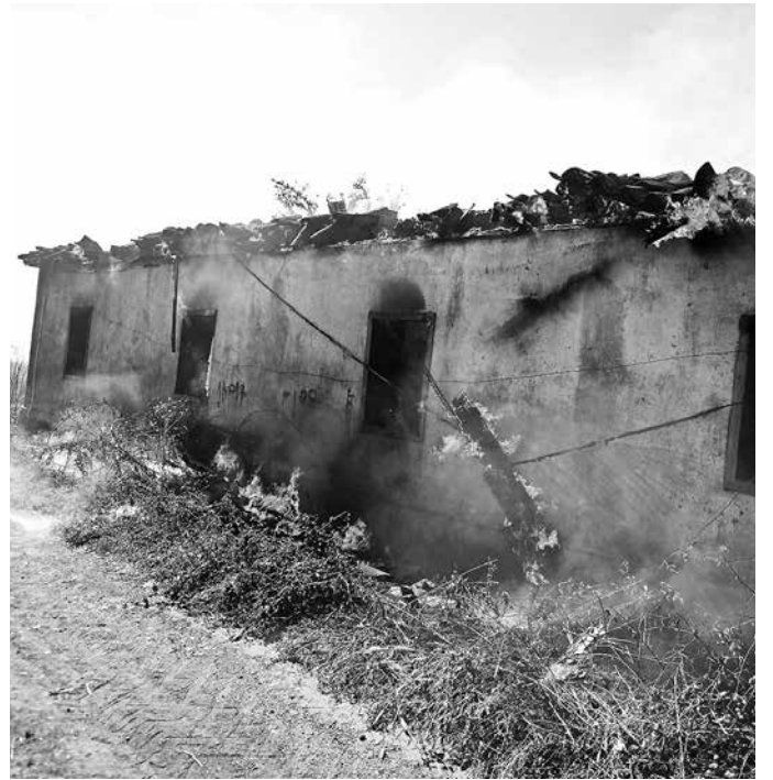
TRES VIVIENDAS, una de ellas deshabitada, resultaron dañadas producto de incendios registrados en Los Ángeles.

Sin embargo, otras tres unidades concurren en apoyo debido a la cantidad de viviendas comprometidas por la propagación del fuego.