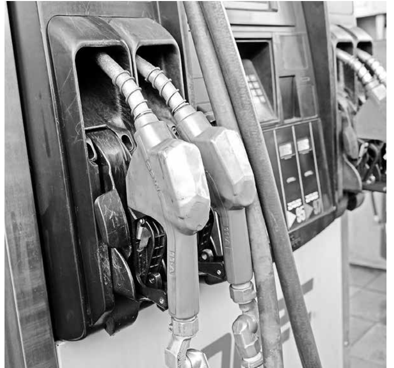
LA MAYOR DISMINUCIÓN se evidenció en el kerosene, con $9,7 por litro.

Hoy, al cierre del presente informe, el Brent ICE se transaba a 55,2 US$/bbl en la Bolsa Intercontinental de Londres, aumentando 1,3 US$/bbl respecto del promedio de la semana de referencia anterior.