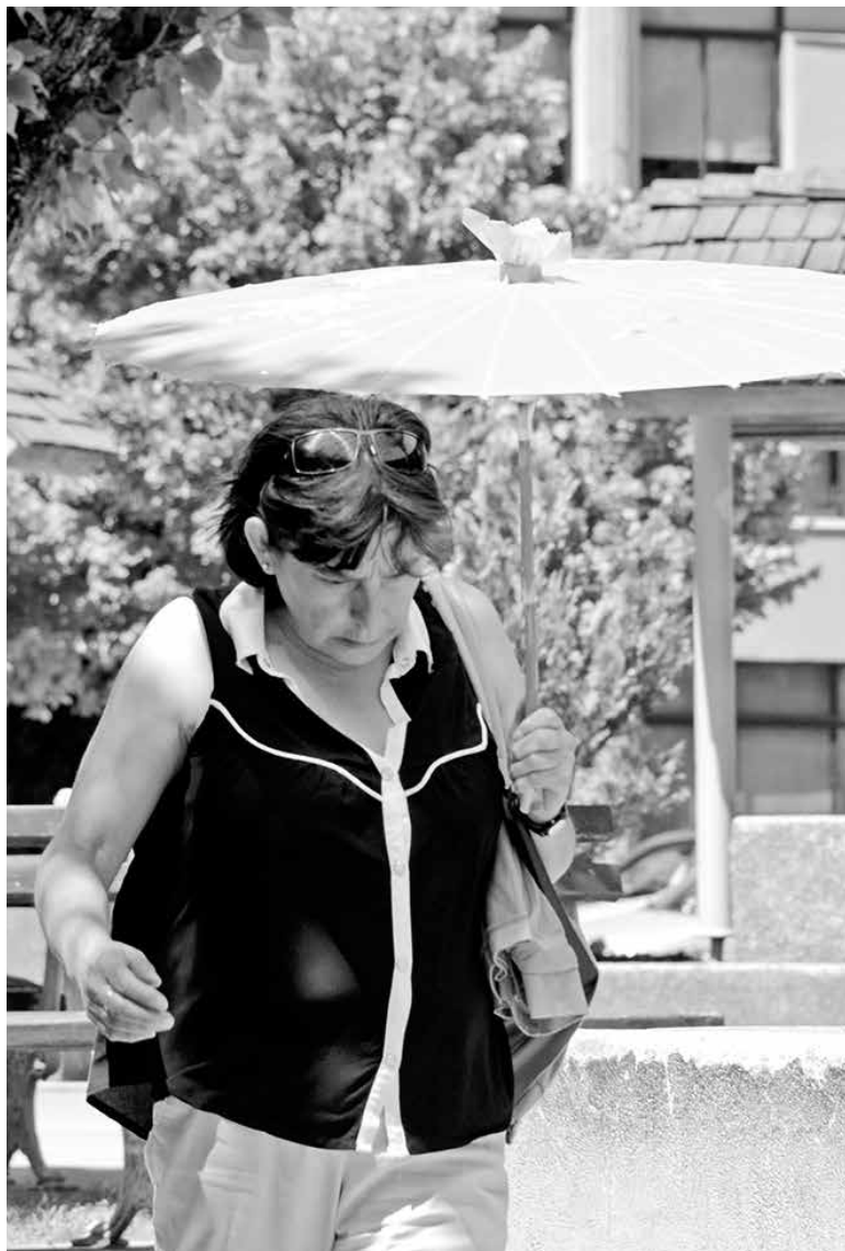
LLAMARON A LAS PERSONAS de tercera edad a hidratarse, recordado que una persona promedio necesita 2 litros a 2 litros y medio de agua.

"Se debe tener cuidado con el lavado de frutas y verduras, porque las bacterias que producen cuadros digestivos proliferan con el calor. También cuidar la protección de los alimentos, sobre todo manteniéndolos refrigerados. Por último, no consumir alcohol, ya que aumenta la incidencia de complicaciones", concluyó.