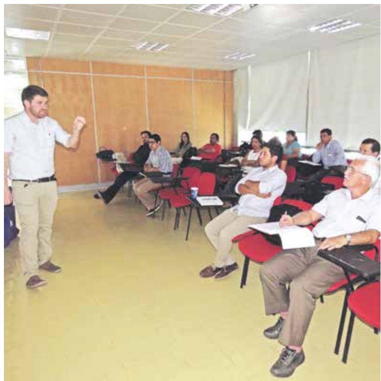
PARTICIPARON REPRESENTANTES de las 54 comunas de la región, incluyendo localidades de la provincia de Biobío.

Durante esta semana, los jefes comunales del Biobío están siendo capacitados sobre diversos aspectos del Censo 2017, tales como la planificación del levantamiento para organizar los locales, el perfil de los cargos y las áreas de trabajo para los supervisores, entre otros temas.