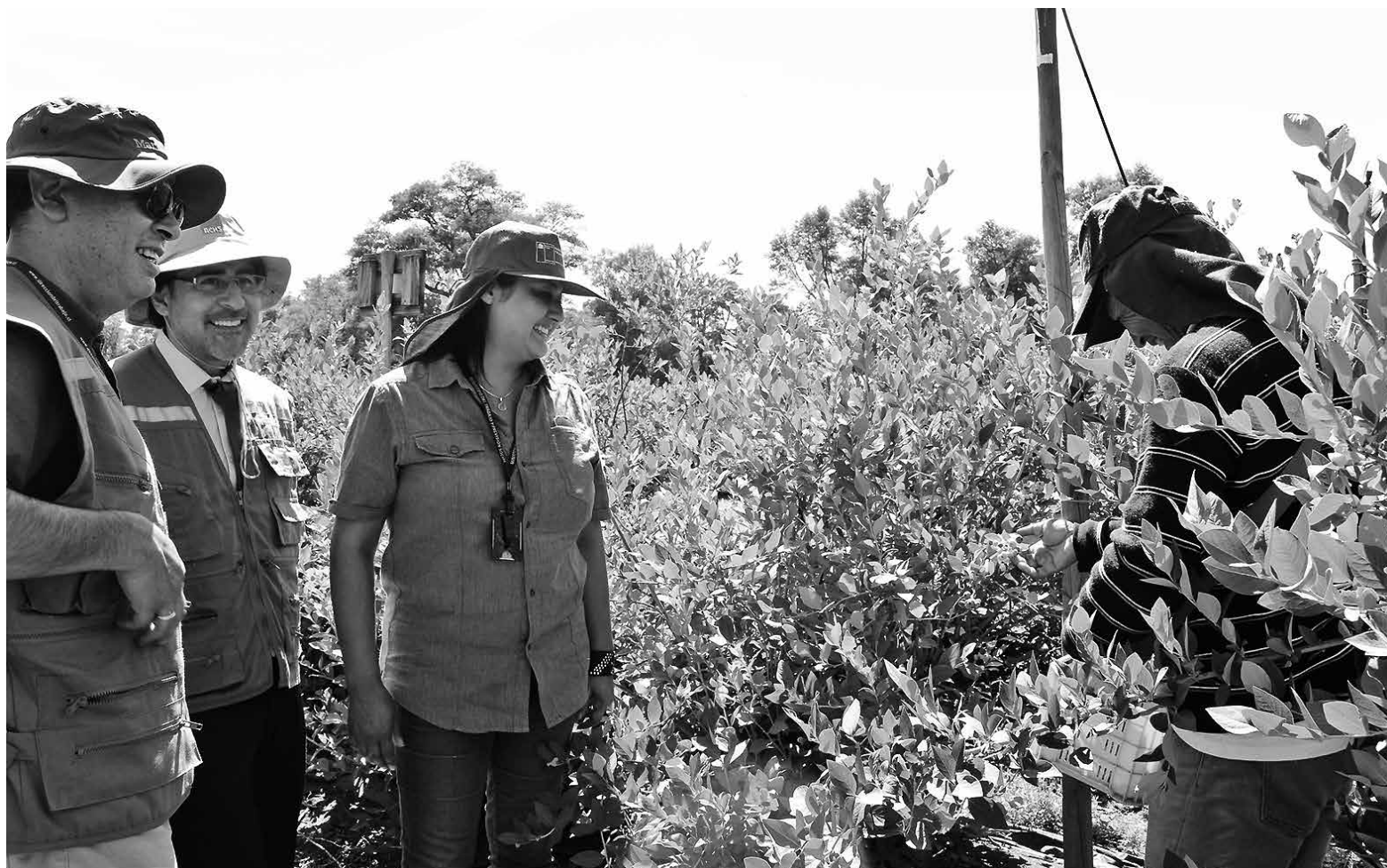
ESTE AÑO SE ESPERA REALIZAR más de 90 fiscalizaciones por parte de las oficinas de la Inspección del Trabajo de Chillán, San Carlos y Los Ángeles.

Asimismo, agregó que durante la pasada fiscalización, es decir, la correspondiente a los años 2015-2016, se ejecutaron un total de 79 fiscalizaciones, lo que involucró un