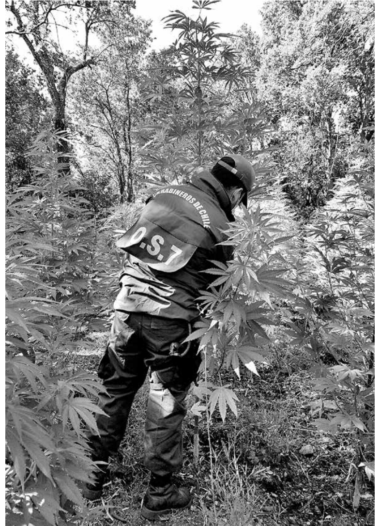
DE HABER LLEGADO a su etapa de floración, estas plantas se habrían transformado en 3.308.800 dosis de marihuana.

Estas labores realizadas por el O.S.7 de Carabineros de Chile se ejecutan de forma paralela a las investigaciones por delitos de tráfico y microtráfico de estupefacientes y todos los problemas asociados a la Ley 20.000 que se puedan registrar en la ciudad, sus poblaciones y alrededores.