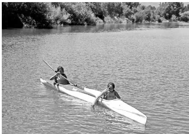
LOS CUPOS SIGUEN abiertos para estudiantes de la comuna de Tucapel y pueden participar jóvenes de entre 8 y 18 años.

La Municipalidad de Tucapel, a través de su Departamento de Educación, está realizando talleres para alumnos del sector los días martes y jueves en la Laguna Trupán.