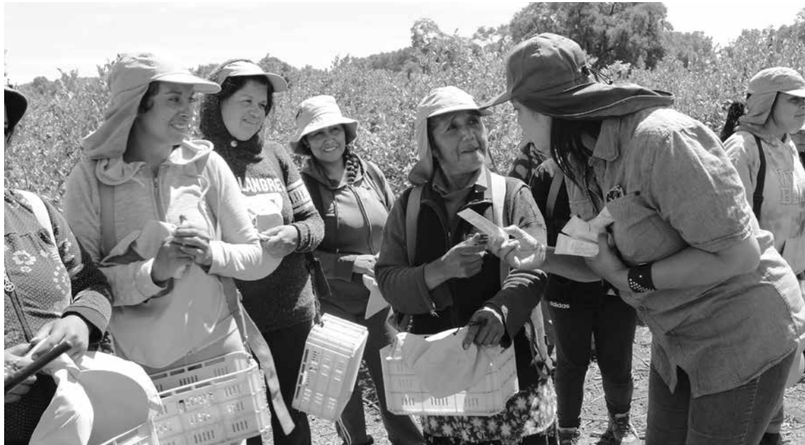
EN LA ACTIVIDAD, además, se hizo entrega a los trabajadores y trabajadoras de elementos de seguridad y protección muy necesarios en esta época.

“Señalar que el empleador está obligado, entre muchos otros aspectos, pero para efectos del calor, entregar el gorro legionario para todos los trabajadores, bloqueador con buen protector solar, verificar que sea aplicado entre las 11 y 17 horas, que es la hora de más calor, y, además una hidratación con agua potable fresca y constantemente, que son las medidas que se toman en esta ola de calor”, concluyó la seremi del Trabajo en Biobío.