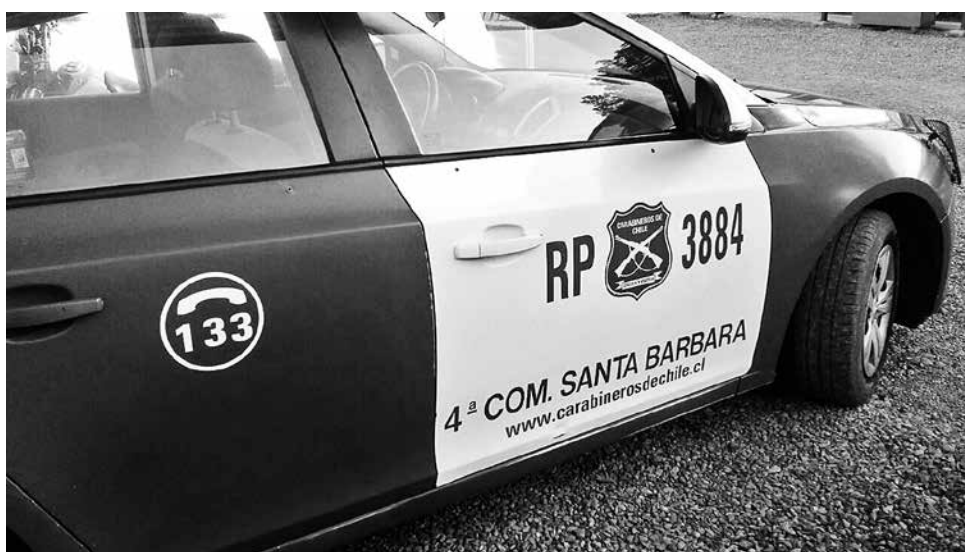
AMBAS DILIGENCIAS fueron encabezadas por Carabineros de la comun.

Un hombre detenido y la recuperación de diversas especies, cuyo origen fue producto de un robo, fue el saldo que arrojó un operativo en la comuna de Santa Bárbara.