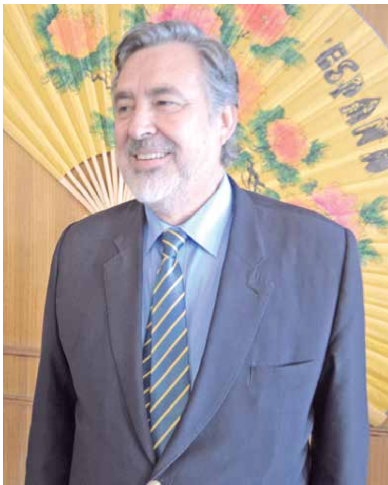
PRESIDENTE PROVINCIAL DEL PS no descartó el apoyo a Guillier, si gana las primarias de la Nueva Mayoría.

Vale contextualizar que la consulta ciudadana para determinar el presidenciable del PS se llevará a cabo el 23 de abril, siendo uno de los principales ausentes el ex mandatario, Ricardo Lagos, quien había anunciado restarse de primarias internas.