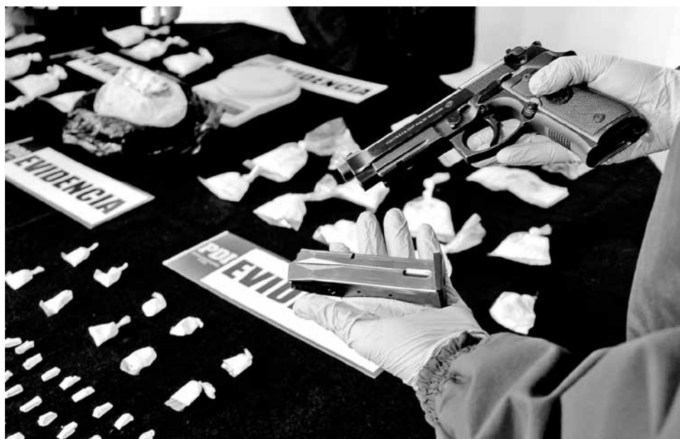
ADEMÁS DE LAS 915 DOSIS de cocaína base, detectives incautaron dinero en efectivo y un arma a fuego con cuatro cartuchos.

Las diligencias se llevaron a efecto en un domicilio ubicado en la población 21 de Mayo siendo dos personas detenidas.