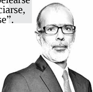
Rodrigo Valdés, ministro de Hacienda.

“Lo que pasó con el TPP es una muestra de otras cosas. A nosotros no nos conviene, como país chiquitito que estamos en el mundo integrado, que el mundo empiece a pelearse y no querer comerciarse, no querer integrarse”.