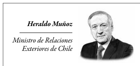
Heraldo Muñoz Ministro de Relaciones Exteriores de Chile

Han construido un vínculo sólido, que incluye intereses comunes en diversas áreas. Nuestras relaciones bilaterales se sustentan en un compromiso con la democracia, los derechos humanos y el estado de derecho.