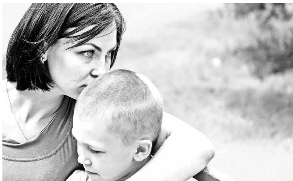
NO SÓLO LO MATERIAL SE VE AFECTADO en estas emergencias, sino que también los niños, a quienes hay que apoyar.

Transmitir la necesidad de aceptar lo ocurrido, enfatizando que los sentimientos