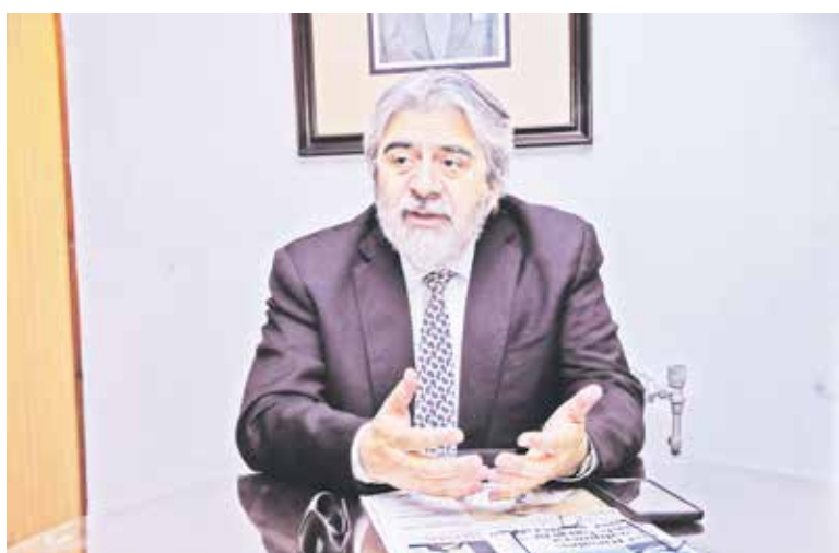
EL LEGISLADOR también comentó la aprobación de una comisión investigadora que estudiará las causas de los recientes incendios.

De igual modo, sostuvo que la Presidenta y el gobierno saldrán “superbién parados” una vez que concluyan los siniestros.