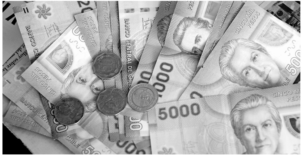
LOS RESULTADOS DE ESTA ENCUESTA comprender mejor los factores económicos y financieros que explican su evolución.

En el segmento de pymes, la percepción de la demanda de créditos se fortaleció en el cuarto trimestre del año pasado. Por una parte, disminuyó el porcentaje de bancos que perciben un debilitamiento de la demanda, desde 14 a 7%, y