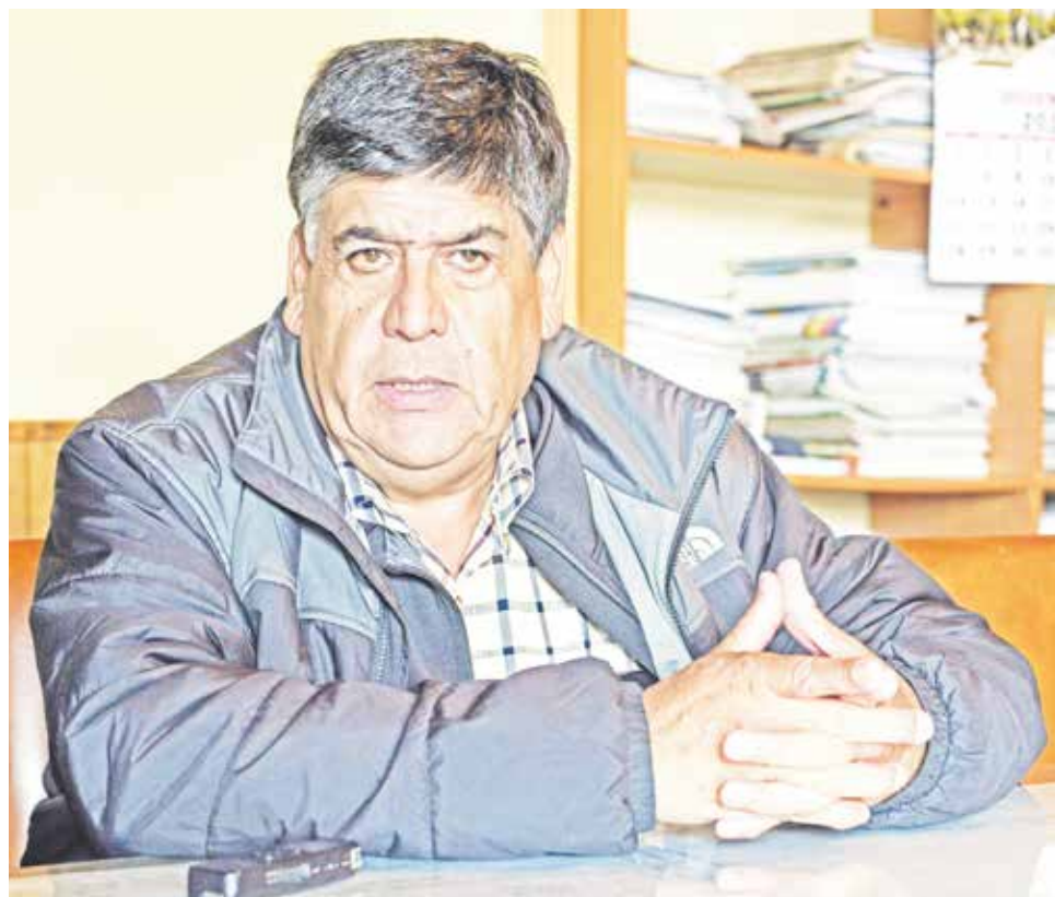
EL LÍDER GREMIAL recordó que en el 2016 ocurrieron varios incendios forestales en La Araucanía.

“Nosotros hace mucho rato que sabemos que el con-