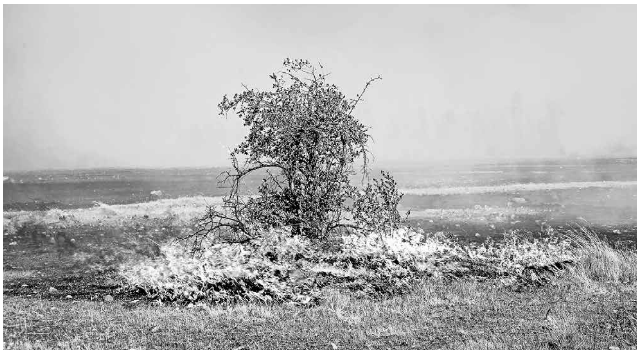
EN CASO DE IRREGULARIDADES, es importante que los consumidores denuncien ante el Sernac.

Los productos comprendidos son alimentos, vestuarios, herramientas, materiales de construcción, productos, medicamentos y artículos farmacéuticos, menaje de casa, combustibles, jabón y bienes que sirvan para el alhajamien-