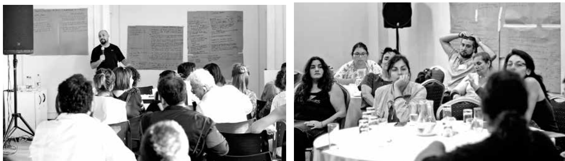
EL AÑO PASADO se realizaron cinco encuentros en los que se contempló la explicación de la metodología y un levantamiento inicial de información de las artes escénicas.

Diversos agentes del ámbito del teatro, la danza, el circo, narradores orales y titiriteros, entre otros, se han reunido para discutir los lineamientos futuros que contendrá la Política de Artes Escénicas 2017-2022, que tiene como objetivo diagnosticar el sector y definir lineamientos que den sustento territorial a la Política Pública Nacional.