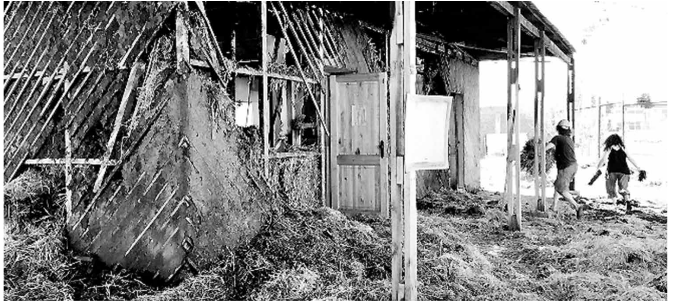
EN BIOBÍO, artesanas de Florida y Peninhueque reportaron daños en sus viviendas, animales y forraje.