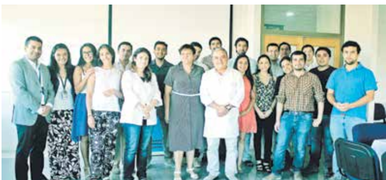
SON EN TOTAL 18 facultativos que terminaron su etapa de destinación en el hospital angelino.

Pese a profundizar sus estudios en distintas partes del país, algunos expresaron su deseo de retornar a la capital provincial.