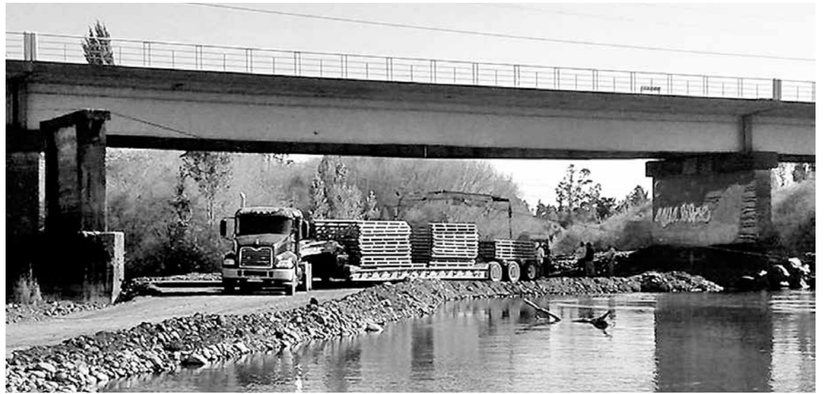
ACTUALMENTE SE DESARROLLAN trabajos de reforzamiento en el mencionado viaducto en Tucapel.

“Son muchas las ventajas, sobre todo por el turismo, pero también para fortalecer nuestros lazos cul-