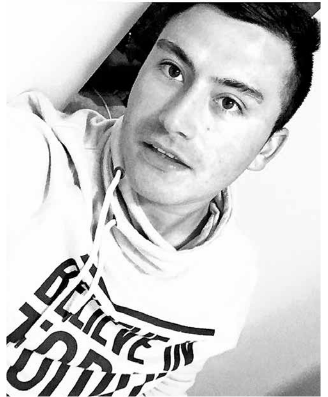
EL JOVEN DE 30 AÑOS cayó al río cerca de las 3 de la madrugada del domingo, siendo encontrado a eso de las 10 de la mañana.

Cabe destacar que las causas del deceso están siendo investigadas a fin de determinar con exactitud qué es lo que sucedió.