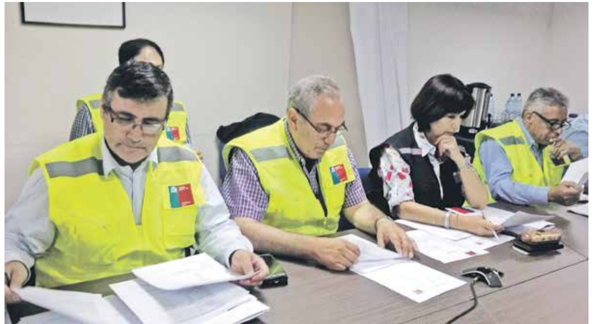
EL COMITÉ DE EMERGENCIAS se constituyó tras la determinación de la zona de catástrofe en la región.

De acuerdo con información proporcionada por la Seremi de Educación al 29 de enero, se registran 695 albergados, de ellos 495 corresponden a brigadistas y 200 a afectados directos o indirectos. Del