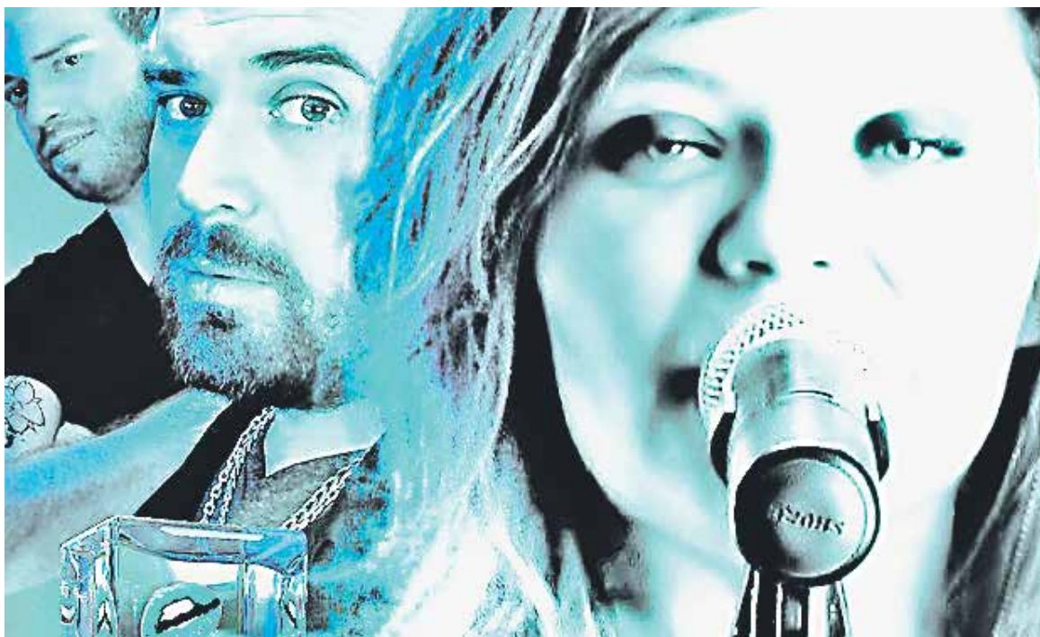
LA CANTANTE DIJO que en el país hay muchos decretos y pocas acciones contra el maltrato a la mujer.

Una de las cosas que remarca Redenz es su participación en el show de la Teletón, tanto el 2015 como el 2016, donde tocó su éxito "Deja de golpear".