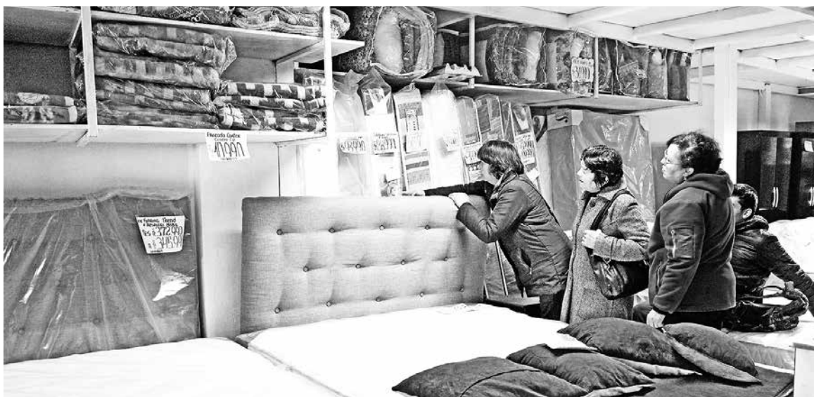
EL BIOBÍO PROMEDIÓ un alza de 3% en los 11 meses del año 2016.

Las ventas reales del comercio minorista de la región del Biobío, tras crecer un 9% en octubre, marcaron en el undécimo mes del año un alza de 5,6%, acumulando un crecimiento de 3% real entre enero y noviembre de 2016, superior al resultado registrado en igual periodo de 2015 (-1,2%).