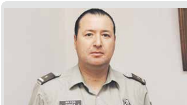
COMISARIO DE CARABINEROS DE YUMBEL, EL MAYOR RODRIGO PÉREZ

Por lo pronto, ya se realizó una reunión donde se delineó la línea de trabajo durante el 2017 para afrontar la problemática delictual. Se detalló que entre las políticas de trabajo se encuentra el contacto permanente con la comunidad, hacer partícipe a cada comuna, especialmente en cuanto a información, y tener cercanía con las juntas de vecinos, que entreguen información veraz para poder actuar oportunamente ante la detección de personas que contravienen la ley.