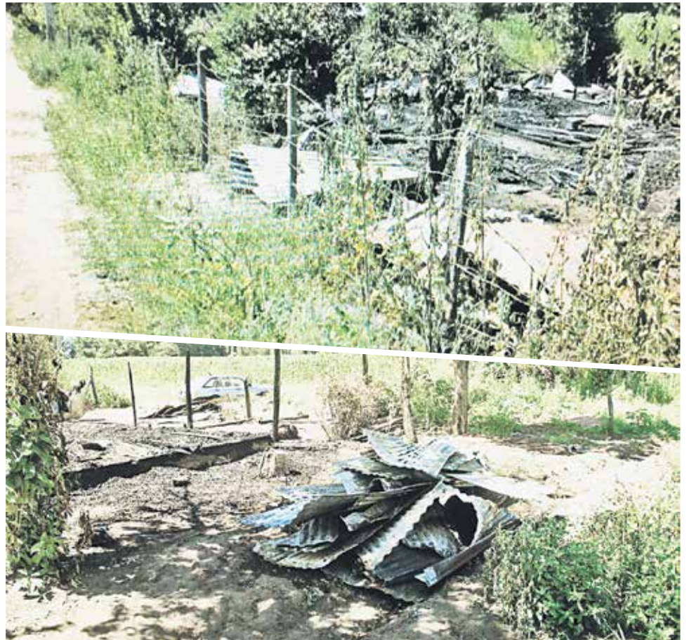
CUANDO BOMBEROS llegó al lugar, la vivienda ya se encontraba completamente consumida por las llamas.

Del mismo modo, entre las recomendaciones generales, es importante recordar no arrojar colillas de cigarrillos ni fósforos encendidos en ningún lugar y abstenerse de hacer fogatas en bosques o lugares donde haya vegetación. También recomiendan no hacer quemas de basura, y finalmente, cortar la maleza que se encuentre alrededor de las viviendas.