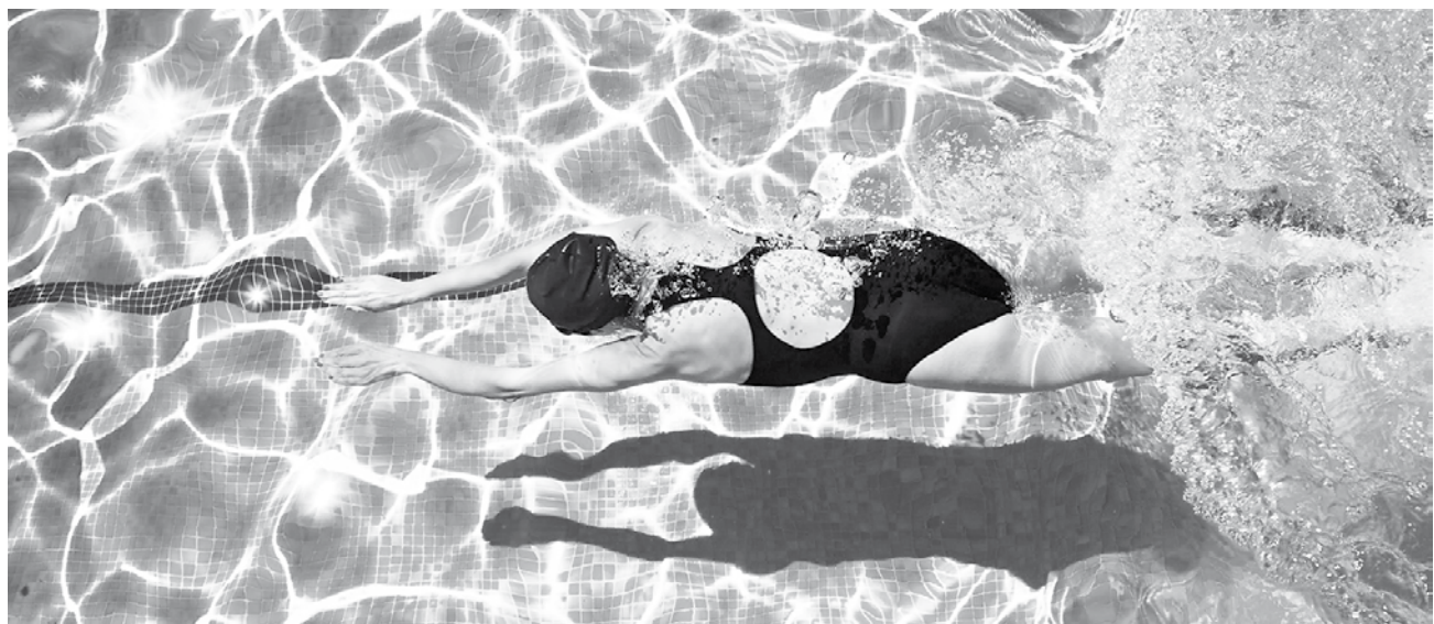
SIGUE ESTOS CONSEJOS y verás que tu pasatiempo de verano servirá para verte increíble.

Dentro del agua sólo se necesitan 20 minutos al día para tonificar los músculos, ya que los beneficios que proporciona el elemento acuático en el cuerpo son muchos. Entre otros, cabe destacar que mejo-