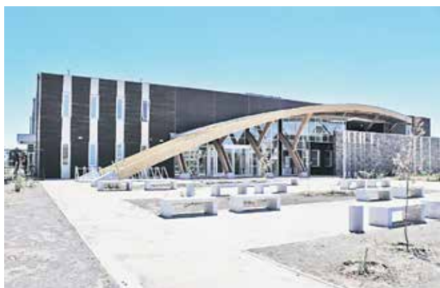
LOS VECINOS están satisfechos y esperan con ansias la apertura del recinto.

El nuevo recinto de salud está edificado en el sector de Paillihue, y comenzaría a operar en el mes de marzo.