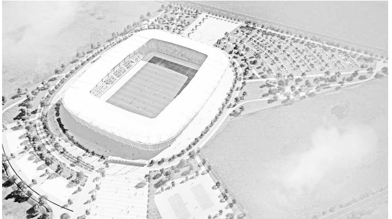
ES POSIBLE que se apruebe sólo un porcentaje del monto, y el otro sea puesto por el gobierno central.

Respecto a su votación cuando el proyecto aparezca en la tabla de discusión, Belloy explicó que "tendríamos que discutirlo, aquí hay que ser lógicos, en nuestra región y provincia existen temas bastante importantes, como por ejemplo la conectividad. Hemos estado discutiendo arduamente en la Comisión de Gobierno la instalación de puentes metálicos, no mecánicos, es decir, puentes que se instalan y quedan de forma