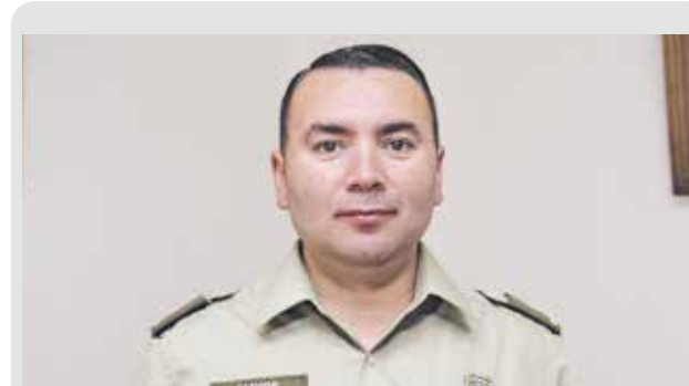
COMISARIO DE CARABINEROS DE LOS ÁNGELES, EL MAYOR PABLO FUENTES

Próximo a la llegada del 20 de enero con la festividad de San Sebastián, el oficial detalló que la planificación de los servicios ya está siendo analizada con la finalidad de brindarle la seguridad a todo el público que acude a Yumbel en esta fecha.