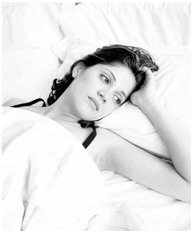
CAPEAR LAS ALTAS TEMPERATURAS por las noches puede ser un problema, sobre todo si cuesta dormir.