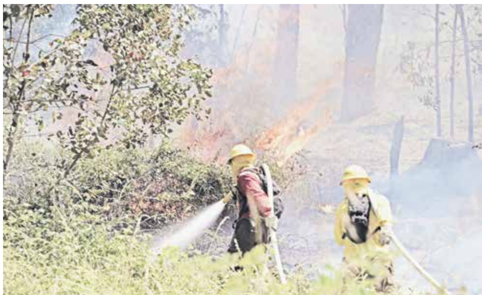
DURANTE LOS ÚLTIMOS TRES DÍAS, Bomberos ha tenido cuatro emergencias simultáneas de incendio en pastizales o bosques.