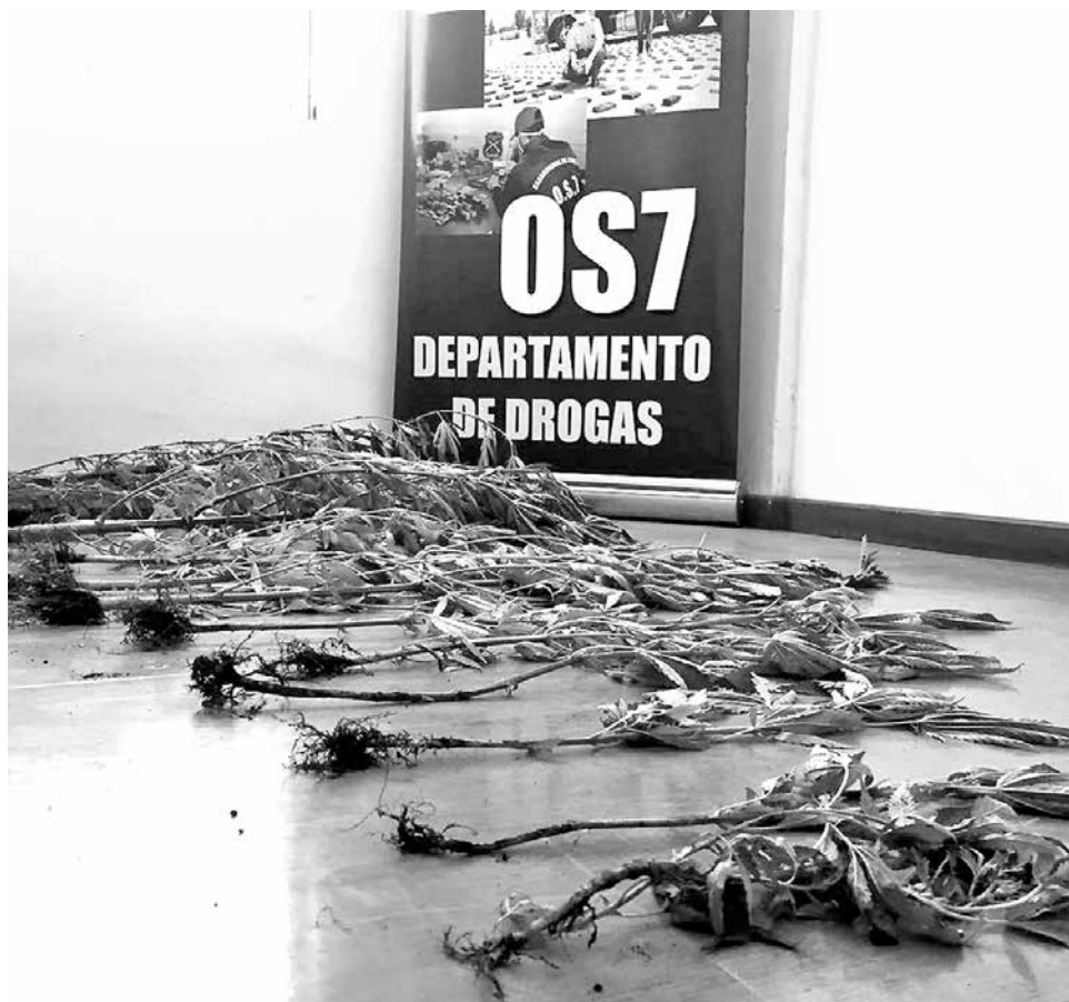
LAS PLANTAS DECOMISADAS por el O.S.7 en la comuna de Los Ángeles se encontraban en proceso de crecimiento.

Asimismo, instaron a la comunidad a colaborar en cualquier hecho delictual que tenga relación con esta materia o con otros ilícitos que la comunidad estime conveniente denunciar.