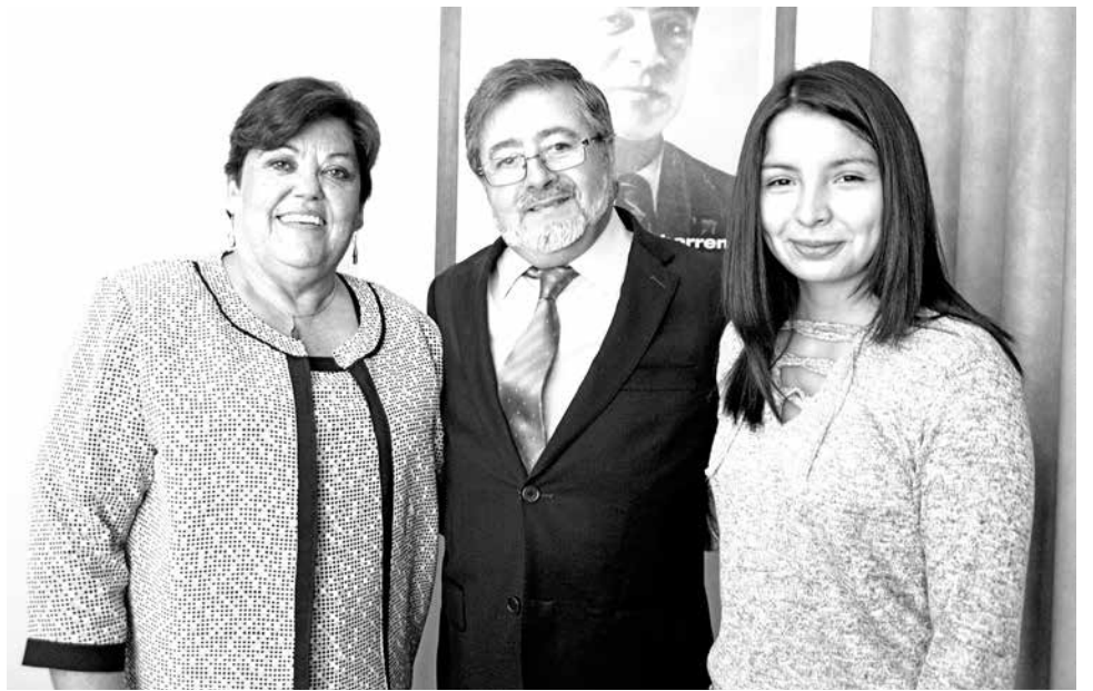
EN HORAS DE LA MAÑANA compartieron un desayuno con la estudiante lajina que obtuvo 850 puntos.

“Yo siempre he sido estricta con mis hijas, tengo tres, y creo que eso ha sido importante, pues también lograron acceder a estudios superiores. Por ello, creo que es fundamental el apoyo y supervisión de la