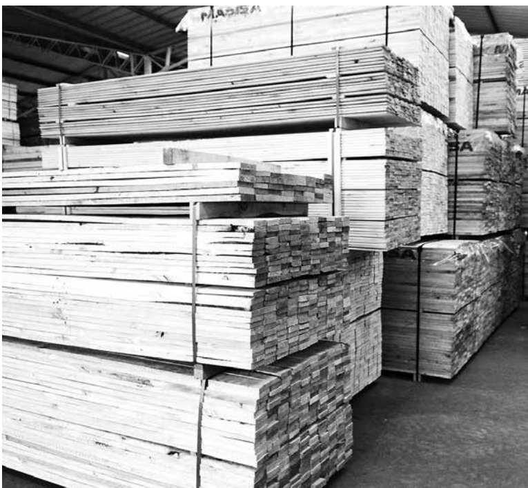
CORMA PROYECTÓ que las exportaciones forestales cerrarán el año con envíos por un total de US$ 5.300 millones.

Este miércoles, la Corporación Chilena de la Madera —Corma—, dio a conocer su proyección en lo que respecta a las exportaciones forestales para el cierre de este 2016 y el escenario para el 2017. Previendo una disminución en el monto total, la que también se mantendría durante el próximo año.