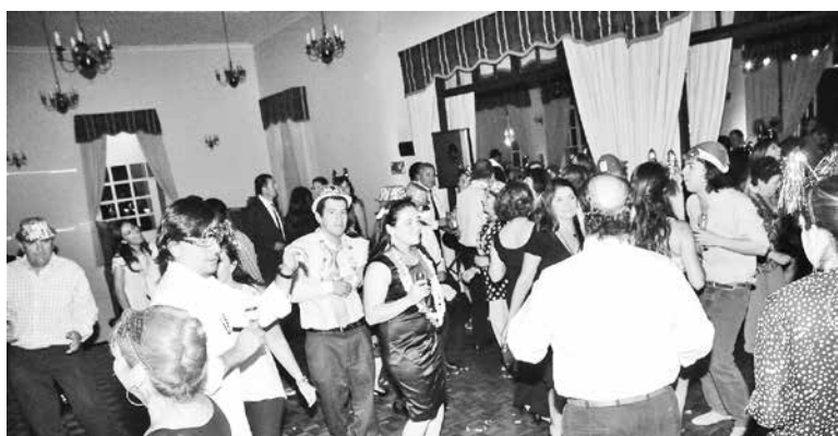
TRAS LOS EVENTOS para recibir el 2016, ninguno de los reclamos presentados al Sernac, obtuvo respuesta favorable.

Ya estamos en cuenta regresiva con lo que queda del año y las celebraciones para dar la bienvenida al 2017 son un hecho inminente. Por esto, el Servicio Nacional del Consumidor -Sernac- entregó algunas recomendaciones para disfrutar estas fiestas de fin de año.