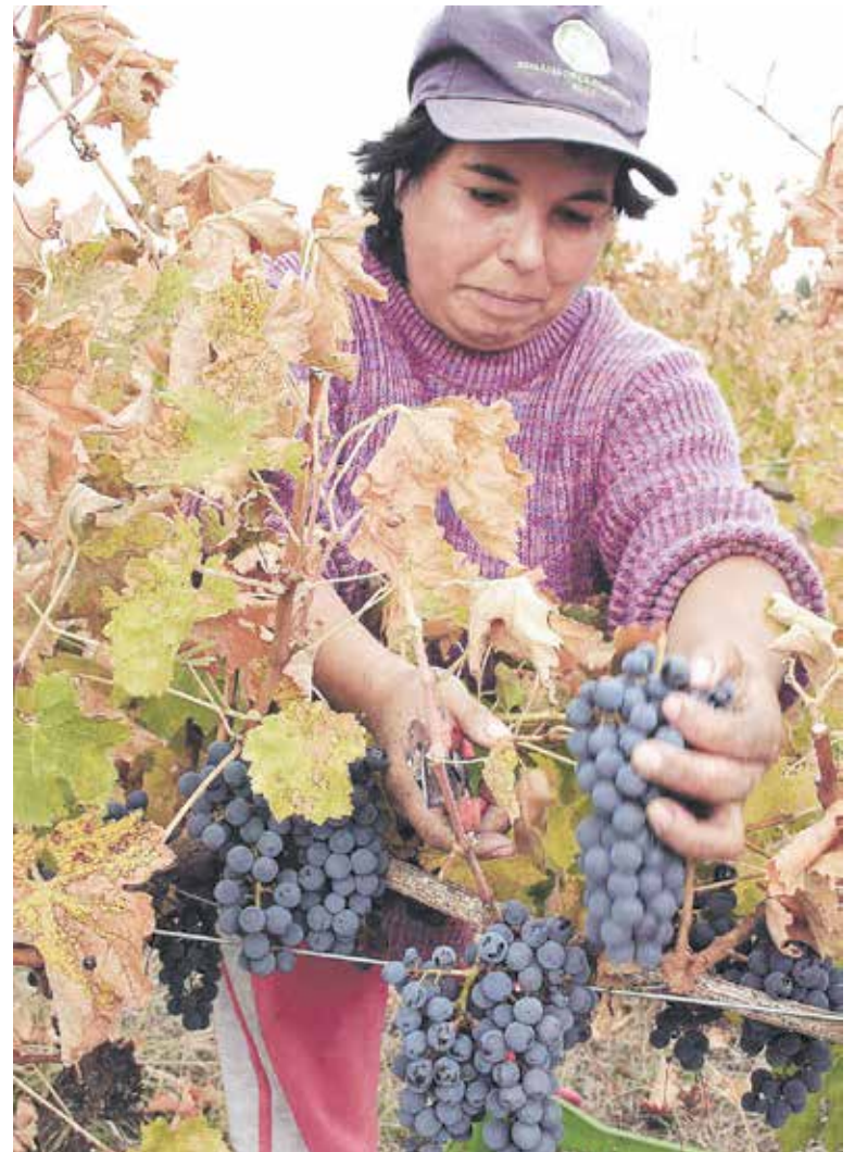
UNA DE LAS REVISIONES está asociada a prevención de la radicación UV en temporeros.

“Todos los años las fiscalizaciones aumentan en un 50% entre septiembre de un año y marzo del año siguiente, con el fin de vigilar las condiciones laborales de trabajadores agrícolas de temporada, prevenir intoxicaciones agudas por plaguicidas, así como para vigilar el cumplimiento de los protocolos laborales y la normativa en radicación UV de origen solar”, concluyó.