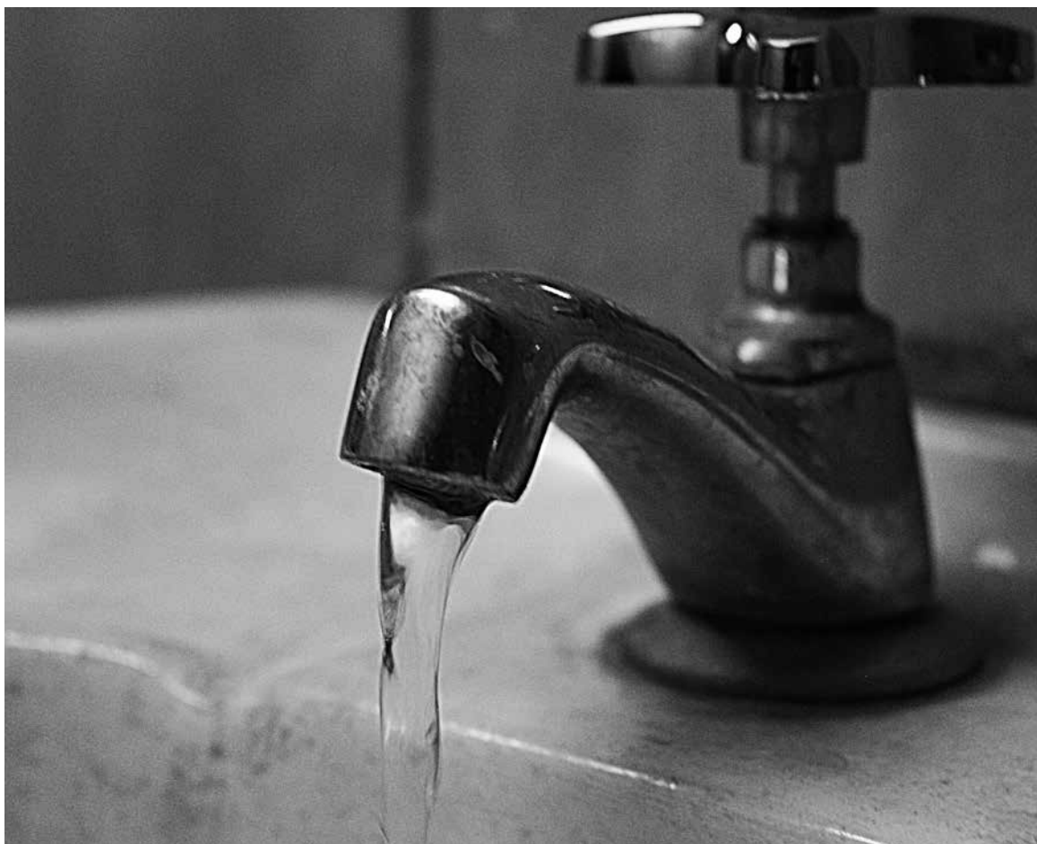
EN DICIEMBRE la diferencia entre los días de mayor consumo (25 y 31) es de un 10% más por casa aproximadamente.

Por otra parte, la SISS hizo un llamado a la ciudadanía para que realice un consumo responsable de agua potable, revisando sus artefactos sanitarios verificando que no tengan fugas antes de salir de sus casas, y haciendo un uso correcto del alcantarillado, no arrojando basuras en los inodoros ni en los colectores de aguas servidas.