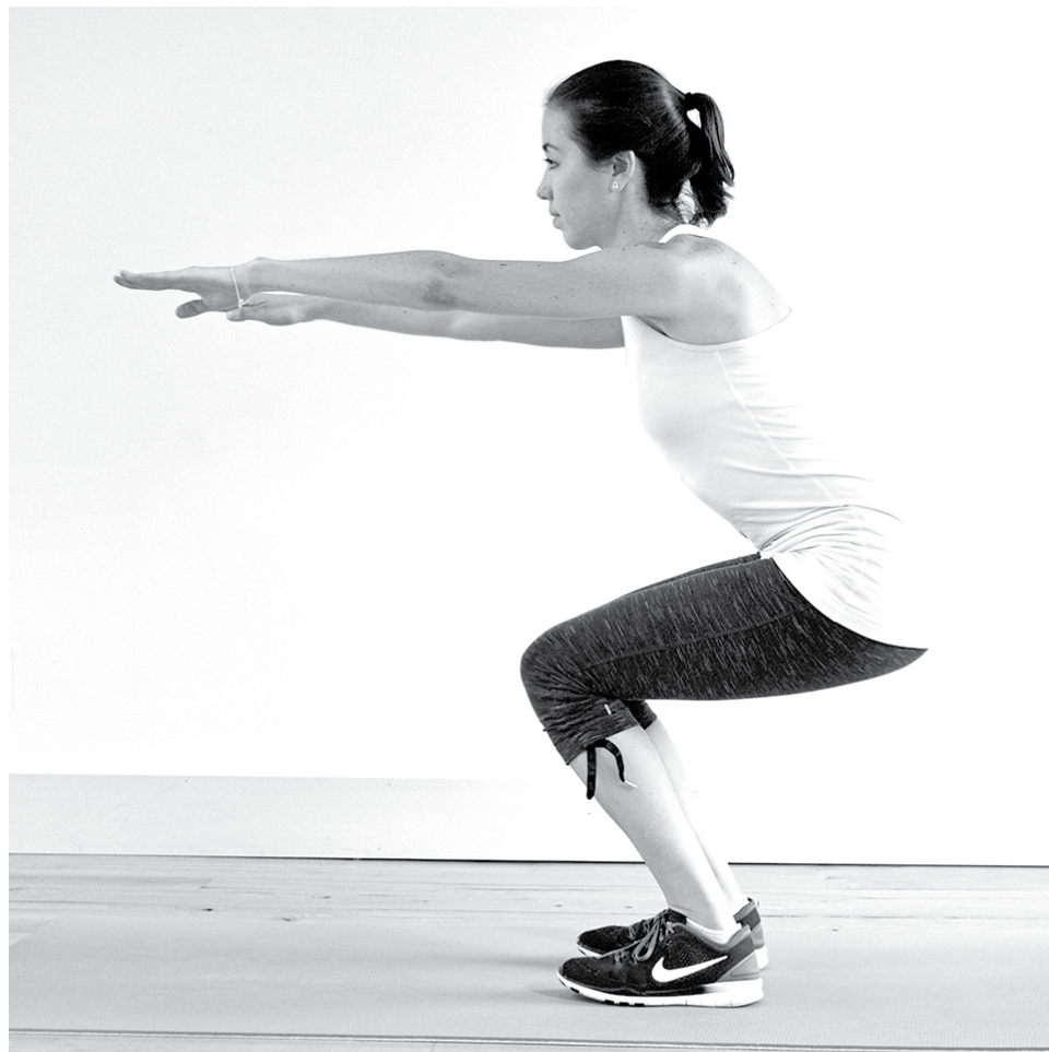
SI TIENES ALGÚN problema, visita a tu médico, para evitar lesiones.

Recarga firmemente tus pies sobre una banca o en la pared. Cuida que los muslos