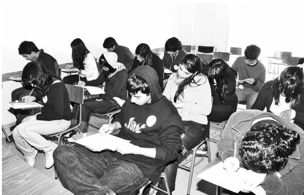
UN 40% DE LAS instituciones no están acreditadas. Esto incluye institutos profesionales, centros de formación técnica y universidades.

La acreditación es un antecedente clave a la hora de postular, más aún si se necesita contar con becas o beneficios estatales.