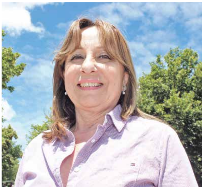
PESE A CONFIRMAR LA NOTICIA, la -ahora- líder electa desconoció la fecha exacta de su asunción al cargo.