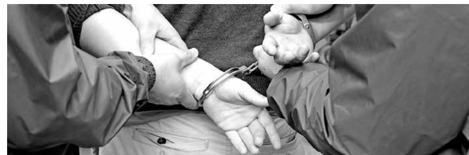
EL HOMBRE, DE 35 AÑOS, era requerido por la justicia por los delitos de hurto y tráfico ilícito de drogas. (Foto de contexto)

Esta persona era requerida por el Juzgado de Garantía por los delitos de hurto simple y por tráfico ilícito de drogas.