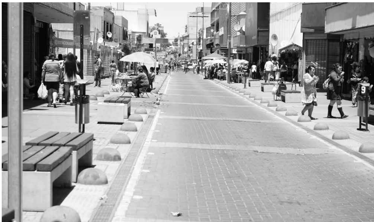
LA OBRA DEBERÁ repararse en un plazo máximo de 12 meses.

En tanto, sobre la reunión, el presidente de la Cámara de