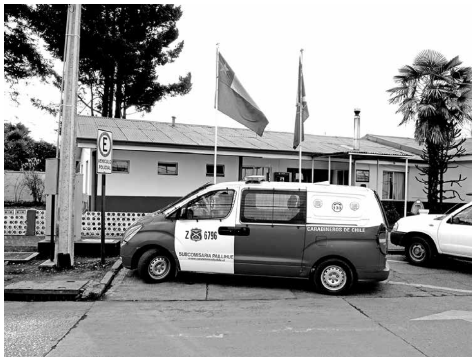
LOS DOS HOMBRES arrestados mantienen antecedentes policiales por diferentes delitos.

Las diligencias se enmarcaron dentro de un patrullaje preventivo efectuado por Carabineros en dicha población. Jara detalló que, en esos momentos, fueron requeridos por una persona que entregó información valiosa al momento del arresto del hombre. Datos recepcionados por Carabineros daba cuenta de que unos hombres caminaban por calle Río Bureo y habían ingresado al domicilio de “Los Chelos”, con especies que ocultaban en unas sábanas y en una maleta y que, al parecer, eran producto de un robo. Con esta información,