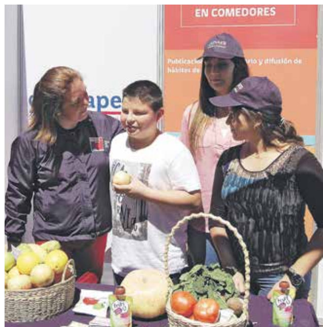
ESTA ESTRATEGIA de salud pública también será aplicada en la provincia de Biobío.

Medida contempla diversas acciones que fomentan la actividad física y buenos hábitos alimenticios.