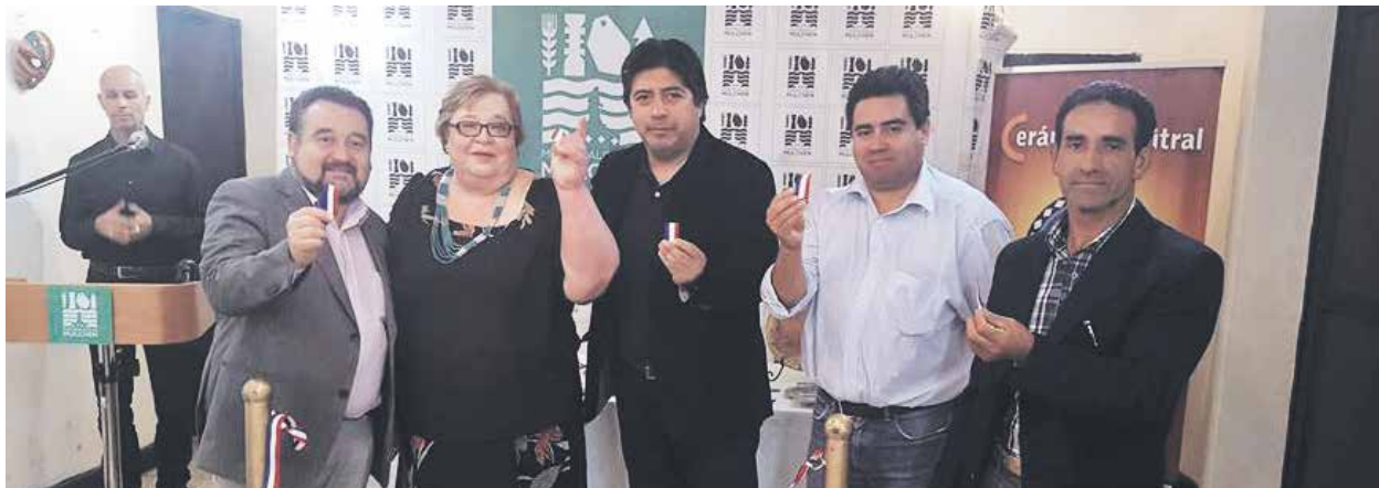
EN LA CEREMONIA de inauguración participó el alcalde de Mulchén, Jorge Rivas, además de autoridades locales.