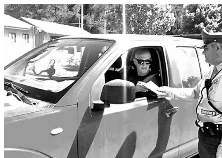
CARABINEROS ENTREGÓ una serie de recomendaciones para evitar que la comunidad sea víctima de algún delito o mal rato.

Por su parte, Carabineros de la Tercera Comisaría de Nacimiento han realizado diversas campañas