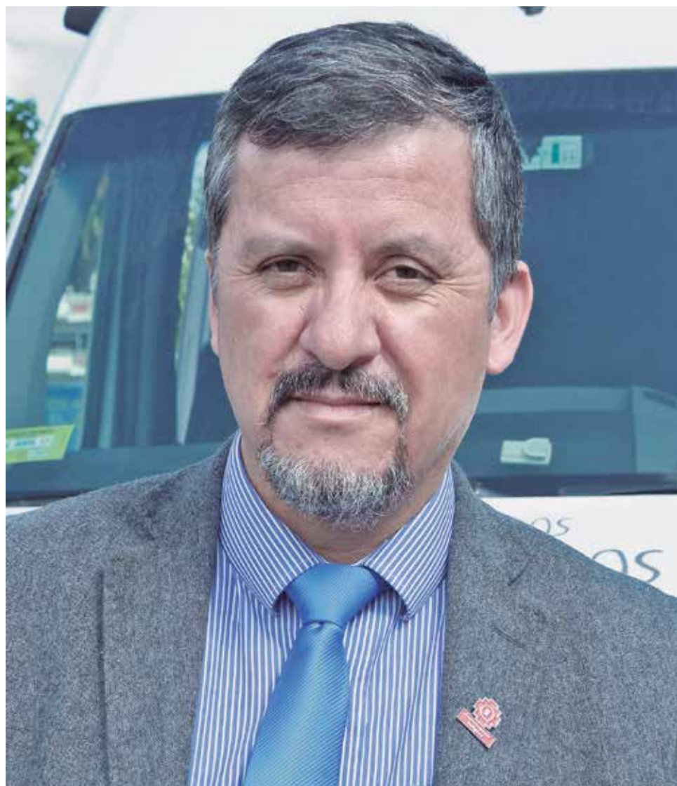
LA AUTORIDAD REGIONAL ministerial no pudo descartar la presencia de integrantes de la CAM en el proceso.

Por último, vale mencionar que todos los acuerdos y solicitudes suscritas en el proceso constituyente en la zona, están siendo sistematizados por la Universidad del Biobío para ser entregados a fines de diciembre a la Seremi de Desarrollo social.