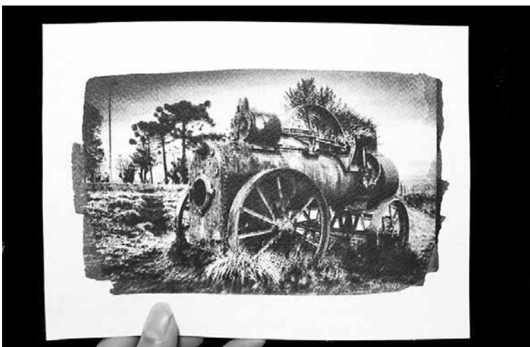
Fotografía cianotipia, antiguo procedimiento fotográfico.

La experiencia ha sido sacrificada, ya que todo ha sido una iniciativa autogestionada, desde su lanzamiento, difusión y trabajo. Lo que si ha sido satisfactorio todo el esfuerzo puesto en el proyecto, ya que si bien nace desde el amor por las técnicas artesanales y todo lo que ocurre allí, me ha permitido conocer personas remotivadas en trabajar con ellas, lo cual ha generando una red para trabajar en conjunto.