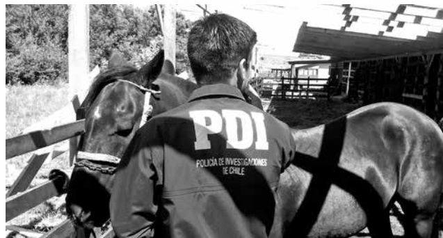
SE TRATA DE UN CABALLO corralero que se encontraba debidamente inscrito.

Fiscalía Local, detectives de la Bicrim confiscaron el caballo para luego entregárselo a su propietaria.