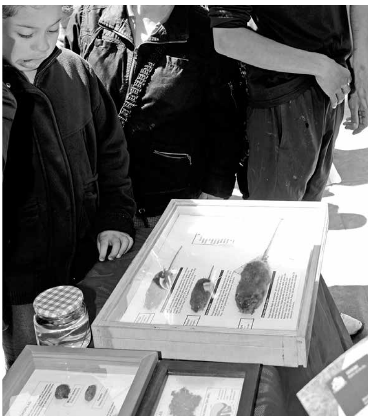
PESE AL DESCENSO, los casos se concentraron en la provincia de Biobío y Ñuble.

De igual modo, entregaron recomendaciones para aquellas personas que deseen acampar durante sus vacaciones, invitándolas a recoger los desechos en bolsas al momento que se producen, para luego enterrarlas alejadas de las carpas o viviendas, a una profundidad superior de 50 centímetros.