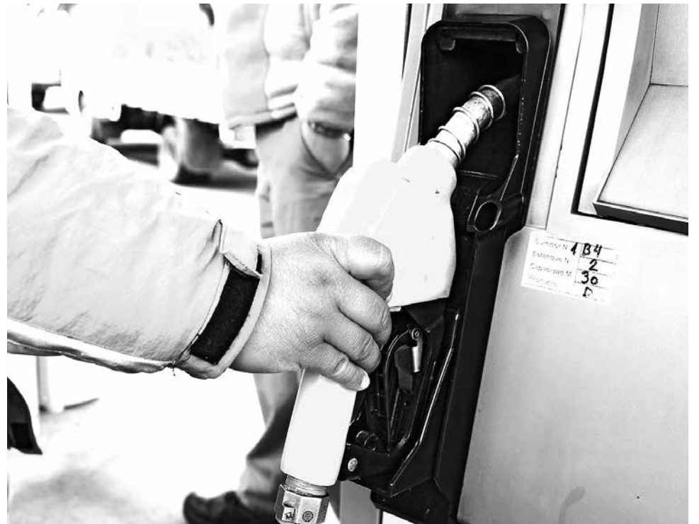
FUE EL KEROSENE quien tuvo el mayor incremento, con $26,9 pesos por litro.

Asimismo, el manejar a una velocidad alta con las