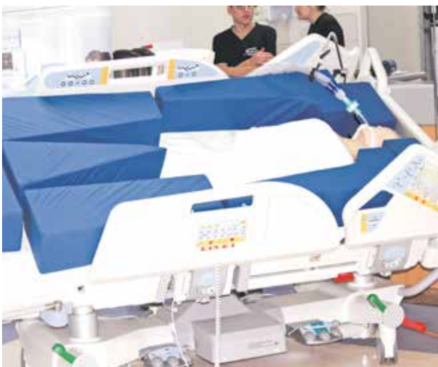
CON LAS RENOVADAS camas se espera disminuir las licencias solicitadas por trabajo pesado por parte de los funcionarios.

Durante este año se llevó a cabo una considerable inversión para la renovación de camas críticas en el complejo asistencial angelino “Dr. Víctor Ríos Ruiz”, las cuales permiten un mejor desempeño en la labor de los funcionarios que atienden pacientes críticos.