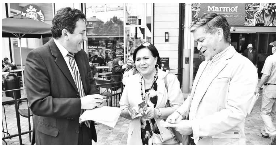
DEL 1 DE ENERO al 30 de noviembre, el Sernac recibió más de 25 mil reclamos por problemas para ejercer el derecho a la garantía legal.

Cabe recordar que en esta ley existen excepciones que quedan libres de esta obligación, como las farmacias de turno, negocios que sean atendidos por sus dueños, clubes o restaurantes, locales de entretenimiento como cines, espectáculos en vivo, discotecas, pubs, cabarets, casinos de juego y lugares de juego, así como los puntos de expendio de combustibles y centros asistenciales.