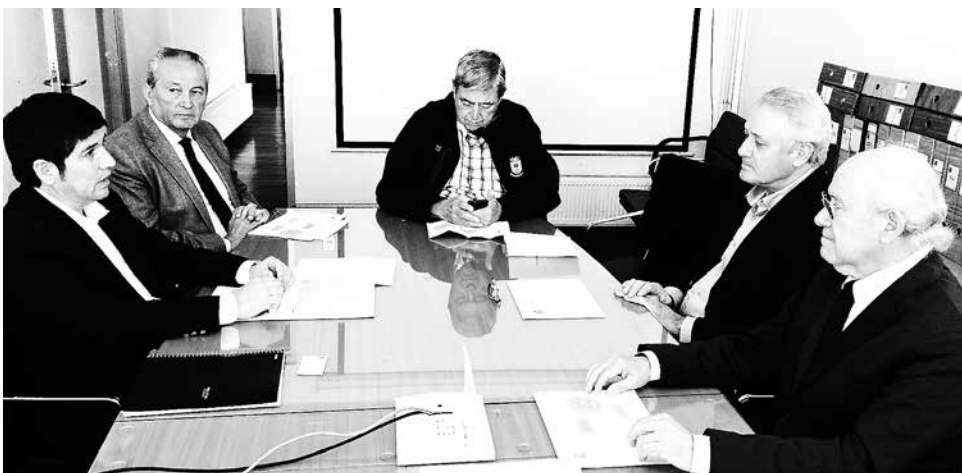
OTRA REUNIÓN CLAVE se sostendrá próximamente con el subsecretario de Hacienda en el afán de acercar más el poder central al Biobío.

En el marco del plan para aumentar la inversión productiva en la región, otra reunión clave se sostendrá próximamente con el subsecretario de Hacienda, en el afán de acercar más el poder central al Biobío, y acordar las prioridades que surgen ante el actual escenario económico.