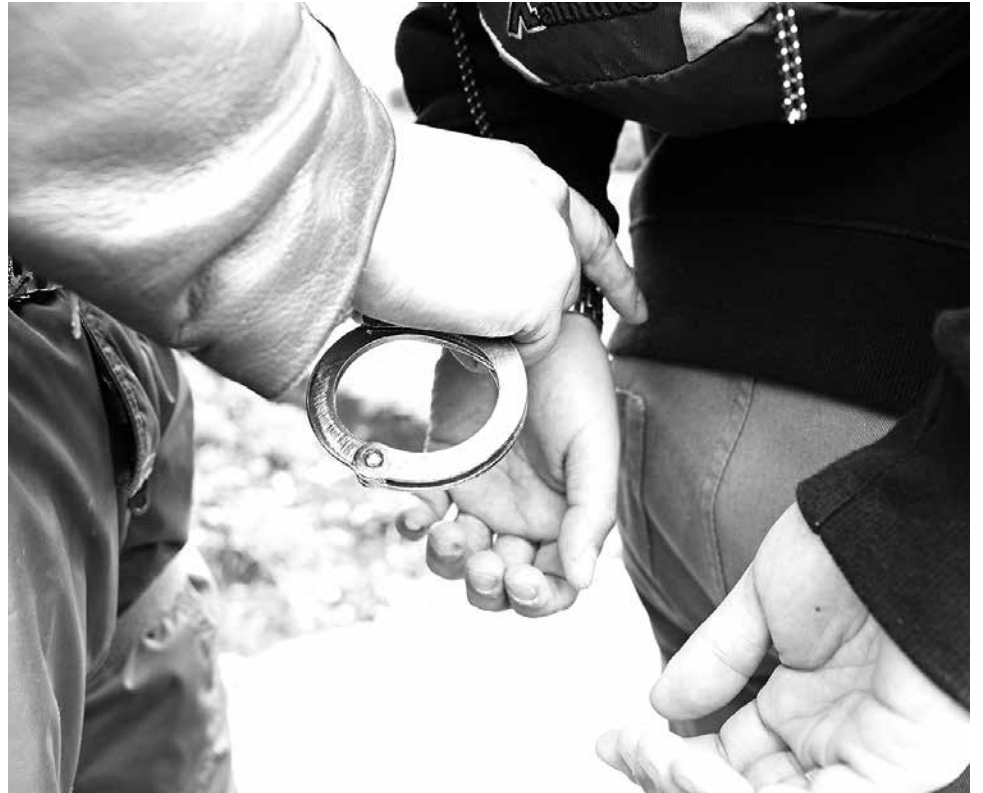
J.G.P., DE 37 AÑOS, registra antecedentes penales y un amplio prontuario policial. (Imagen de referencia)

Del total, 15 corresponden a controles de identidad, nueve fiscalizaciones a locales de alcoholes, 197 controles