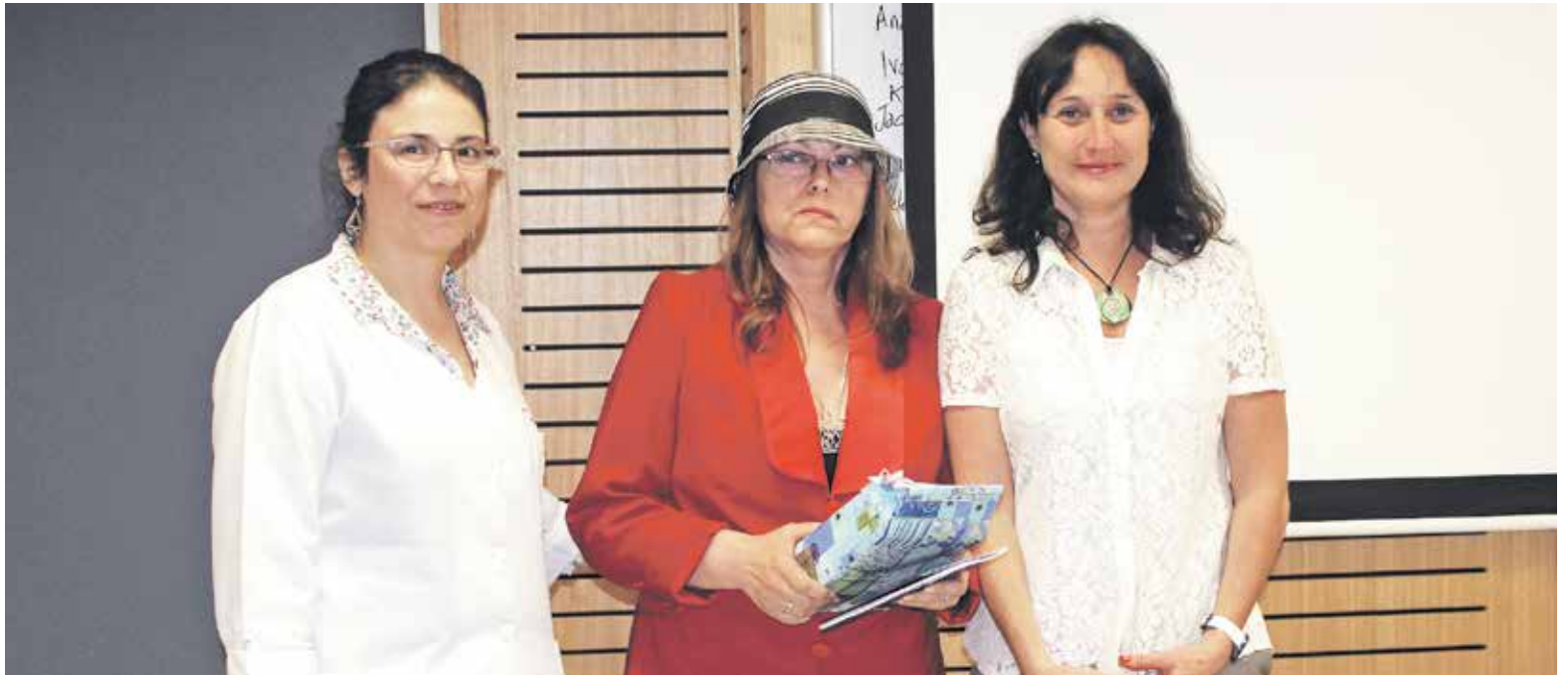
GANADORA DEL CONCURSO se inspiró en la pérdida de su padre por un cáncer de próstata.

La ganadora del concurso añadió que “yo siempre he sostenido que cada persona que participa lo hace porque cree en lo que escribe, lo escribe con el sentimiento, desde