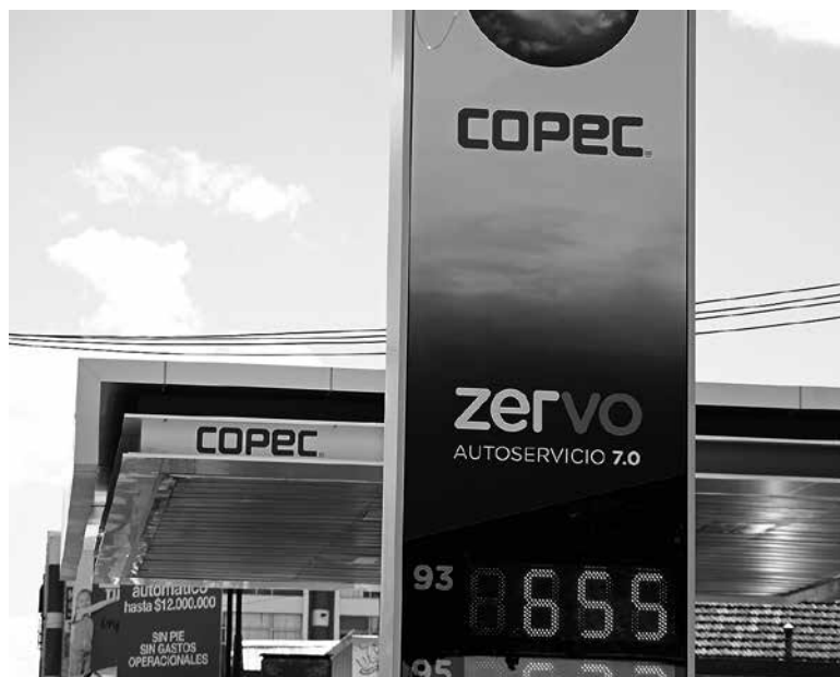
EL HECHO OCURRIÓ en el servicentro Copec ubicado a la altura del kilómetro 488 de la Ruta 5 Sur.

Cuatro personas fueron arrestadas luego de que intentaran sustraer una caja fuerte desde dependencias de un servicentro ubicado en el sector norte de la comuna de Los Ángeles.