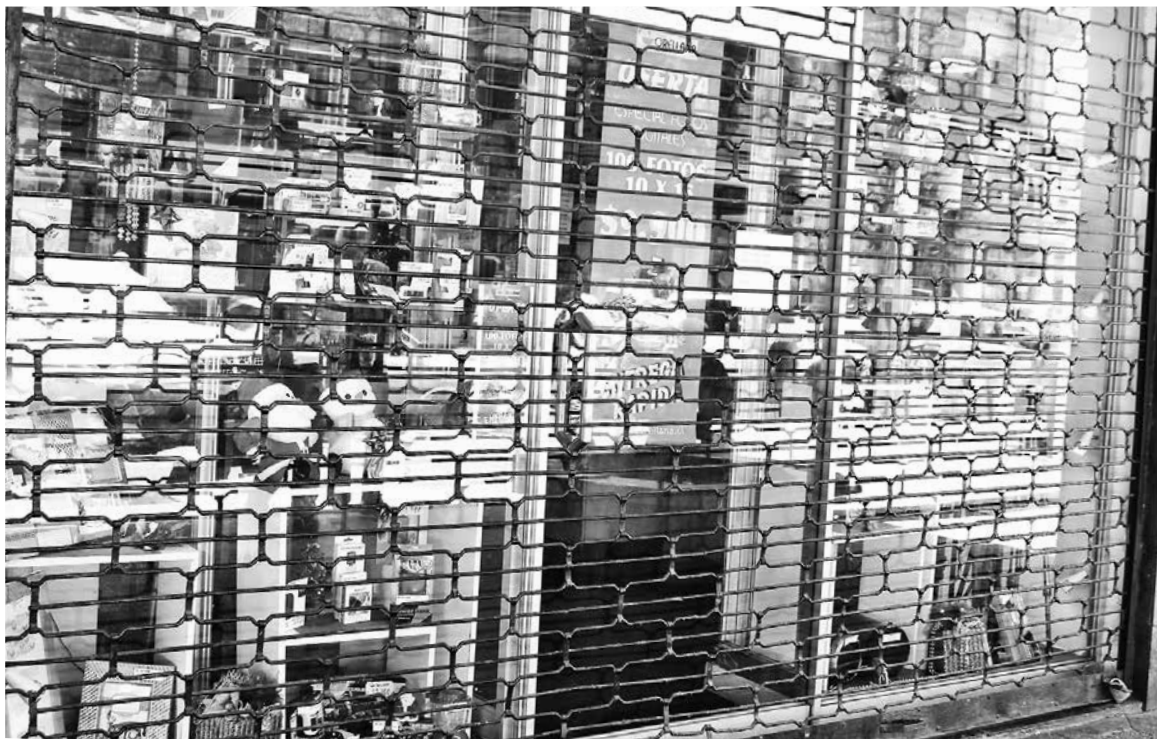
A PESAR DE no recibir denuncias durante este feriado irrenunciable, igualmente se pueden realizar con posterioridad.

En esa línea, Patricio Pinilla manifestó que “van a regir las mismas condiciones para este domingo 1 de enero 2017. Se va a estar atento a fiscalizaciones, con fiscalizador en turno que va a estar disponible para ver si ingresa algún tipo de denuncia, o al hacer una ronda, él encuentre alguna irregularidad en el plano laboral”.