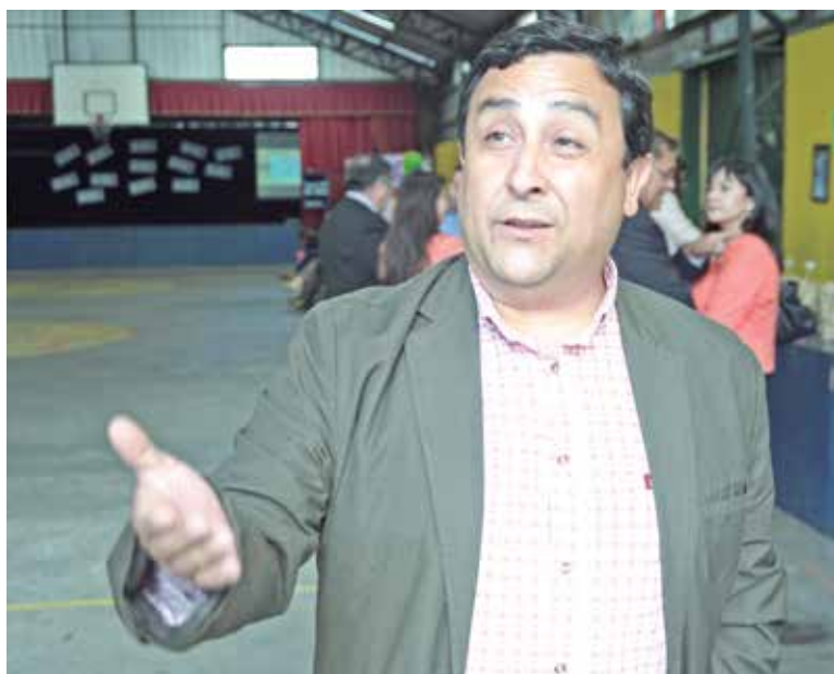
EL POLÍTICO FALANGISTA anunció un proceso de inspección a mediados de enero.

De igual modo, el líder de la Comisión de Medioambiente del Concejo Municipal desestimó que arribo de toneladas de basura no tenga impacto significativo.