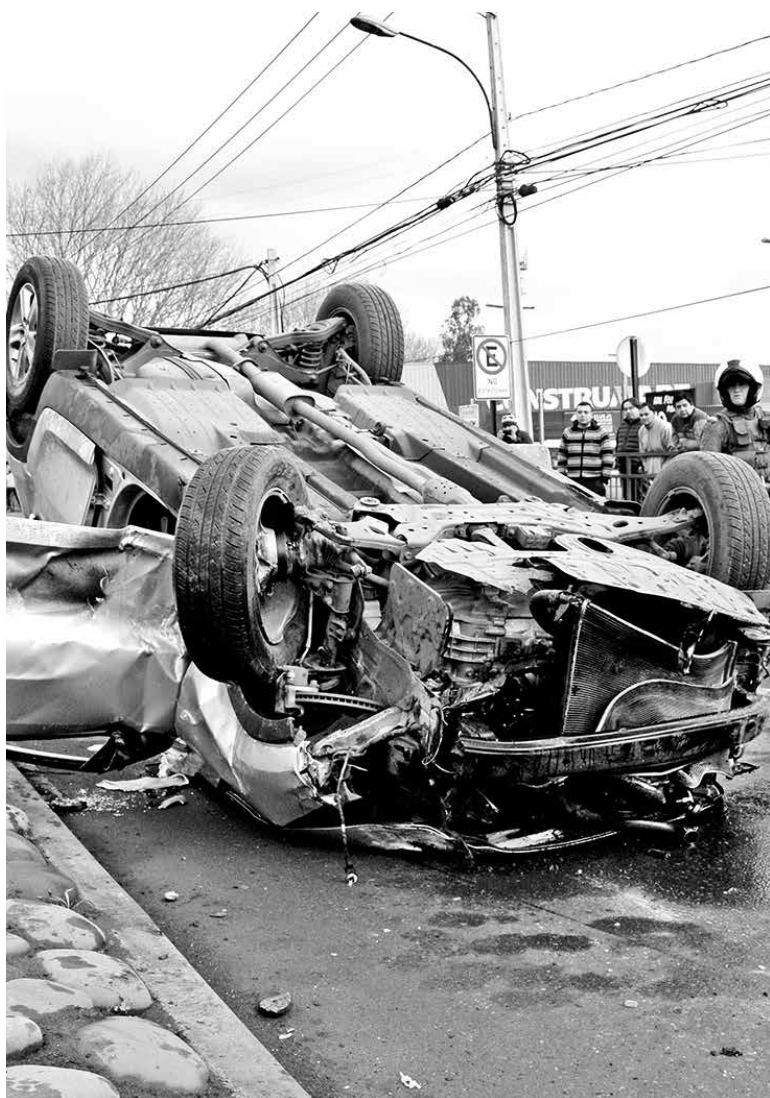
EN JUNIO DE ESTE AÑO, una menor perdió la vida en un accidente protagonizado por un hombre que manejaba en estado de ebriedad.

"El llamado es a tomar conciencia, a ser responsables y a la prohibición absoluta del consumo de alcohol", expresó el oficial.