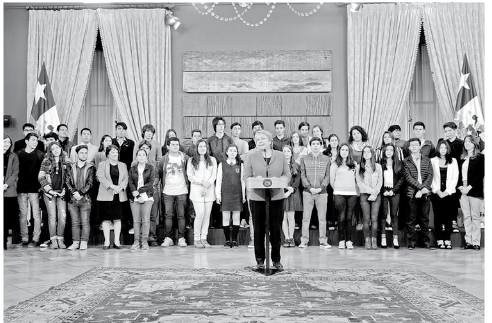
TRAS EL DESAYUNO PRESIDENCIAL, la muchacha se tomó algunas fotografías con la mandataria.

"Ella me habló directamente porque fui una de las pocas a las que llamó para comunicar del puntaje nacional. Así que comentamos cómo fueron mis primeras