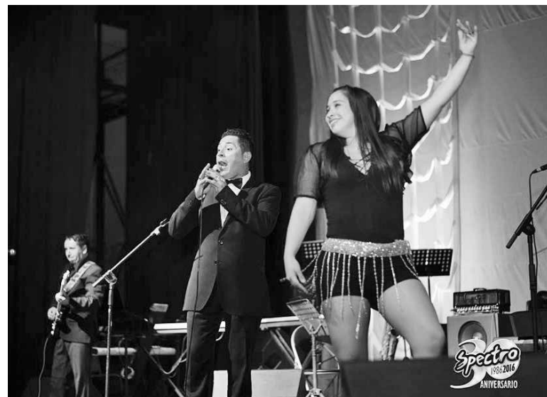
SECCIÓN BAILABLE, donde los músicos estuvieron acompañados por cantantes invitados.