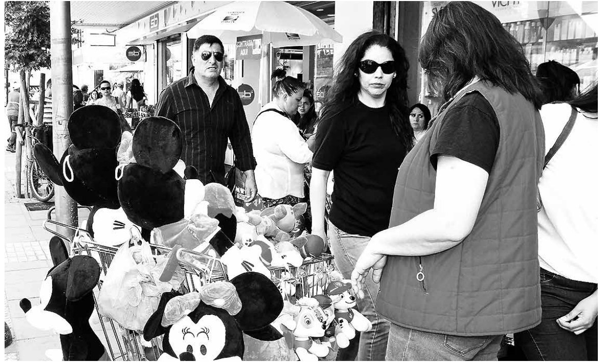
A PESAR DE LA BAJA en las ventas, los juguetes y bicicletas siguen siendo los productos más comprados en esta fecha.