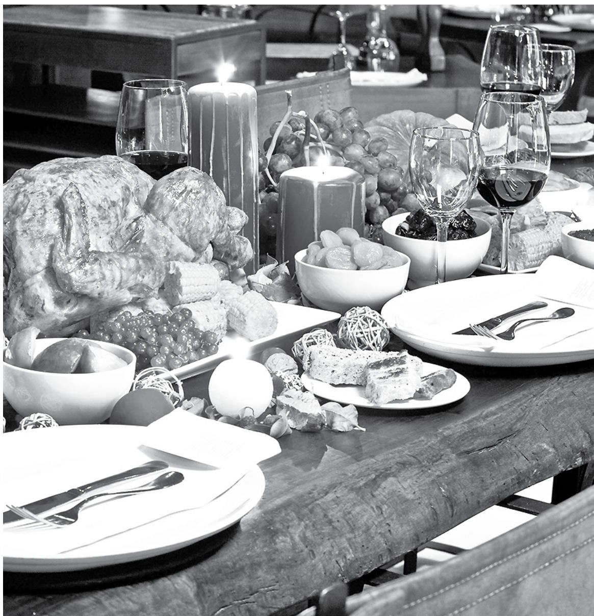
EN LA CENA DE NAVIDAD o Año Nuevo se puede subir con facilidad medio kilo.

La pasada celebración de la Navidad y la llegada de un nuevo año se asocian, por tradición, a una mesa decorada con abundante variedad de alimentos, todos preparados con mucho cariño. ¿Cómo disfrutar el próximo Año Nuevo y no sufrir los costos de engordar, manteniendo el peso bajo control? Aquí recogimos algunas recomendaciones.