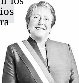
Michelle Bachelet, presidenta de la República.

"Quiero destacar la manera ejemplar como reaccionaron las comunidades afectadas, los alcaldes, los organismos regionales y también los organismos técnicos. Las personas evacuaron el borde costero con orden, con tranquilidad, tomaron los resguardos necesarios y actuaron de manera responsable".