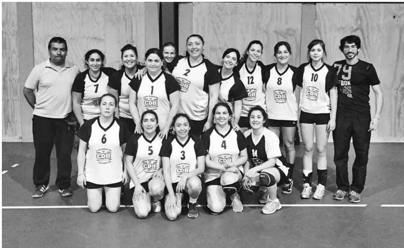
EL VÓLEIBOL ANGELINO fue a mostrar todo su talento al torneo realizado en Cabrero.

Por su parte, los organizadores del evento destacaron el gran desempeño de los equipos que llegaron a competir, y el entusiasmo que ha generado este campeonato a nivel nacional, que se ha desarrollado durante tres años y que comenzó con la participación de sólo seis equipos, y este año se sumaron 12, quedando los primeros lugares en la comu-