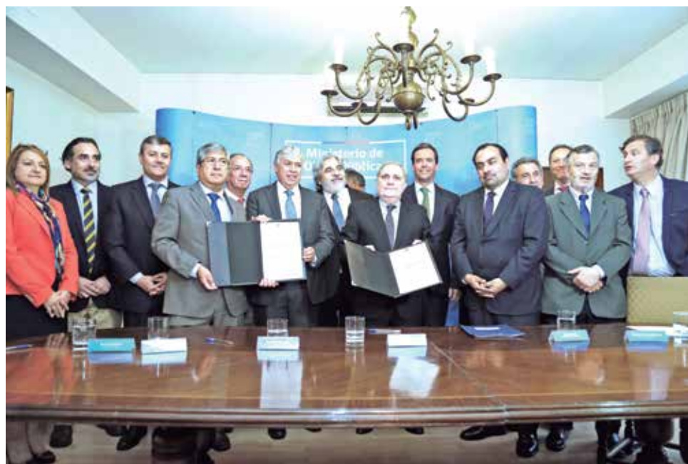
EL ACUERDO SE LLEVÓ a cabo en la región Metropolitana, con la presencia de variadas autoridades de gobierno.

Pese a ello, el parlamentario aprovechó la instancia para plantear que el convenio debiera ser por más años. “Es un acuerdo que cuesta bastante reunir a las partes y convenir, por lo que debería ser