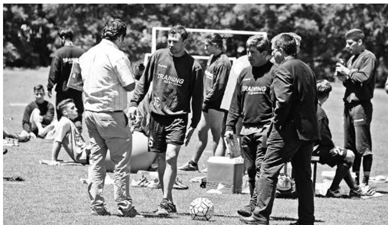
MALLECO ES ALTERNATIVA para jugar uno de los dos amistosos pactados; el otro es Nublense.

Por ahora, Montoya indicó que el plazo para asegurar el o los nombres que llegarán a la institución como refuerzos es el 2 de enero del 2017.