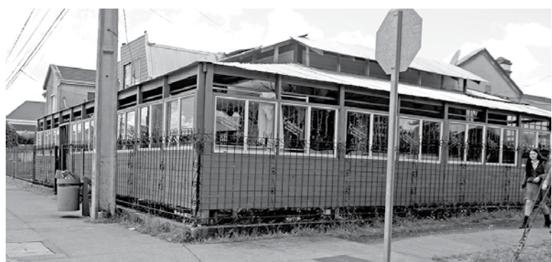
LA DUEÑA DEL RECINTO salió a entregar una explicación, descartando que la calle sea usada como baño público.

Sintiéndose "pasados a llevar", vecinos de la intersección de las calles Darío Barrueto con avenida Alemania denunciaron ruidos molestos y veredas convertidas prácticamente en baños públicos en el lugar.