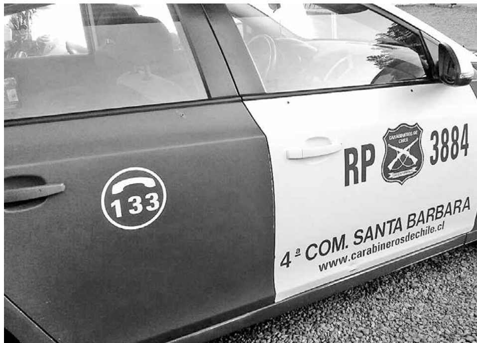
CARABINEROS DE SANTA BÁRBARA efectúa una investigación en torno al esclarecimiento de los hechos.

llegan a ofrecer alguno de estos productos, el llamado es a marcar el nivel 133 "para que nosotros podamos continuar con la investigación que estamos llevando a efecto", expresó el oficial.