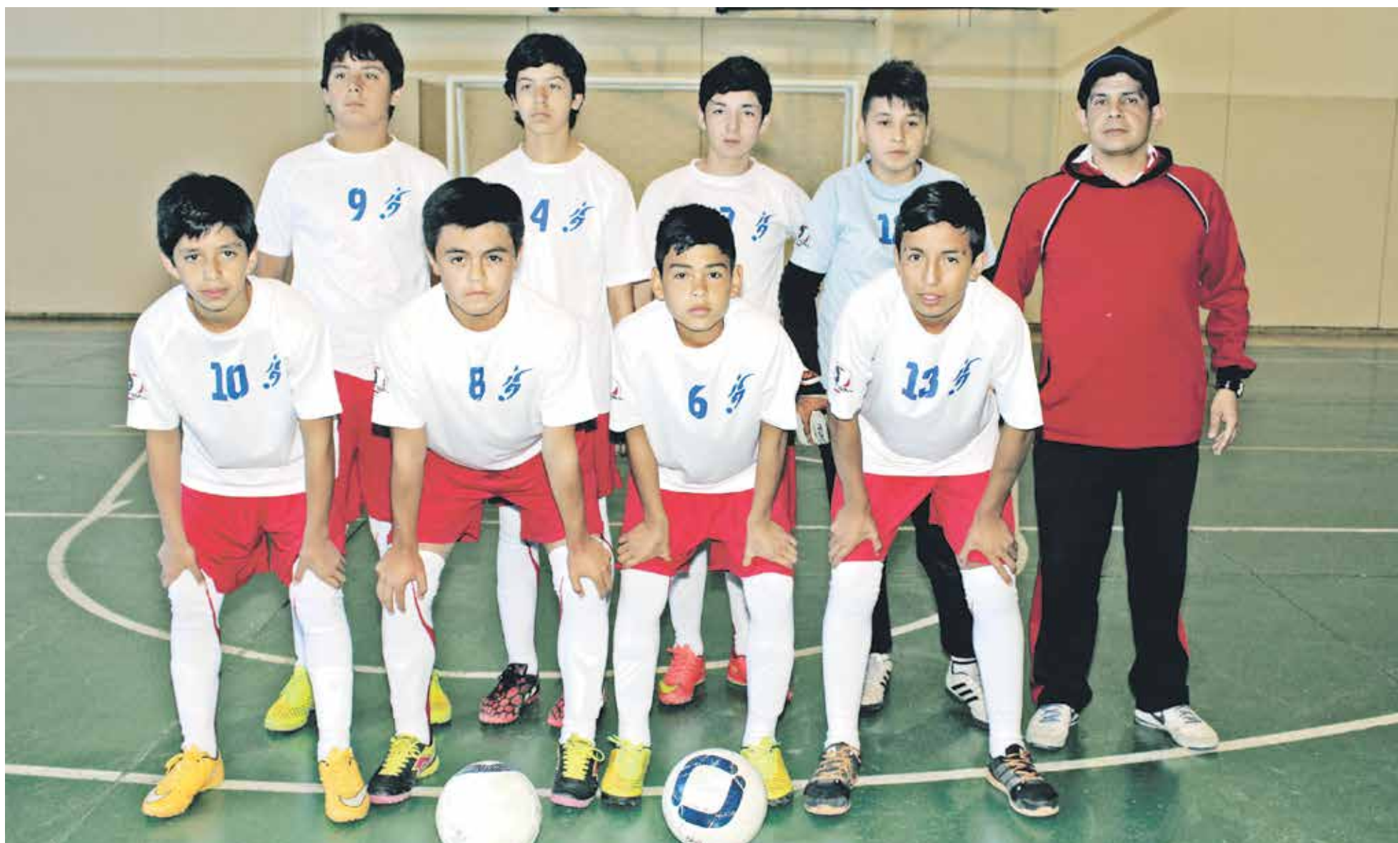
AMBAS DISCIPLINAS presentan atractivos desafíos de cara al 2017, algo que Jara pretende cumplir con creces.