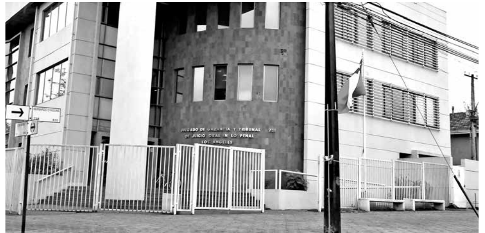
AUDIENCIA DE FORMALIZACIÓN de cargos se realizó la mañana de este martes en el Juzgado de Garantía de Los Ángeles.

detenida tras ser sorprendida lanzando miguelitos en calle Balmaceda con avenida Ricardo Vicuña. Se trata de una persona que fue retenida por particulares en las afueras del pub Terracan el mismo día de los hechos.