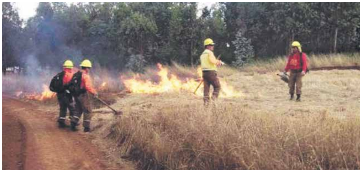
LOS TRABAJOS DE DISMINUCIÓN de material combustible se realizarán entre los días miércoles 4 y viernes 6 de enero.

Ante ello, llamó a la comunidad a estar tranquila pues esta labor se efectuará con personal especializado y siempre pensando en el bienestar de los habitantes de Mulchén.