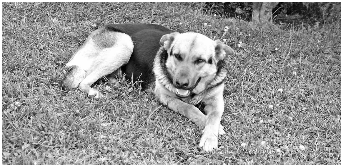
TANTO EL FRÍO como el calor extremo pueden comprometer la fisiología y comportamiento de los animales

pasean con bozal para evitar que agredan, o por otra indicación conductual, por lo que este tipo de pacientes necesariamente lo deberá hacer en los momentos más frescos del día: antes de las 11:00 AM, o bien, posterior a las 19 horas”, agregó la especialista en etología y bienestar animal.