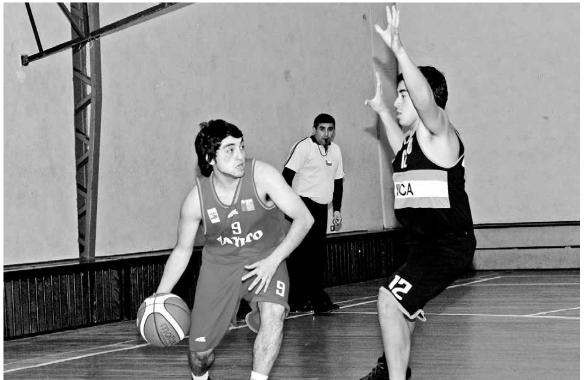
SÓLO RESTAN DETALLES para que el equipo ‘profesional’ comience a funcionar sin problemas, entre ello, el aporte económico del municipio.

El problema de tope, es que las horas que pidieron son pick, pero Molina insiste en que el básquetbol, por lo que aspira, la inversión que significa, debería tener la prioridad