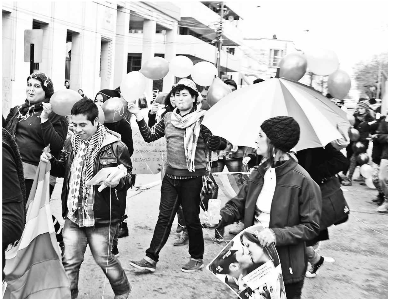
EN LA PROVINCIA de Biobío, durante 2016 se registraron tres denuncias por discriminación.

El dirigente gay apuntó directamente al gobierno regional al denunciar que “en la zona no se está cumpliendo el acuerdo que selló el Estado de Chile con el Movilh. Existe un escaso interés del ejecutivo. No se están impulsando políticas públicas ni cam-