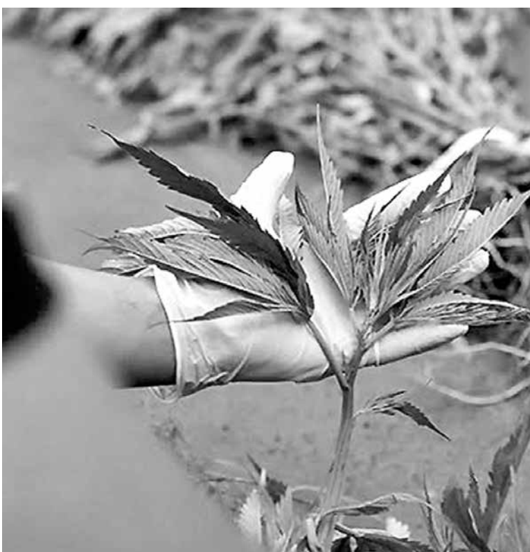
LAS PLANTAS incautadas fueron remitidas al Servicio de Salud de Mulchén para su análisis y destrucción.

Las plantas fueron remitidas al Servicio de Salud de Mulchén para su análisis y destrucción.