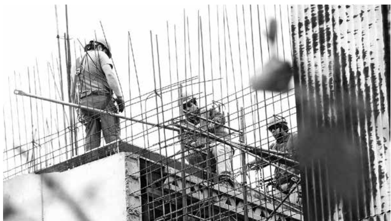
PROVINCIA DE BIOBÍO totalizó 10.850 m 2 autorizados.

A su vez, la superficie de Obras Nuevas se compone de Vivienda con 59,6%, Industria, Comercio y Establecimientos financieros con 22,1% y Servicio con 18,2%. De la misma forma, en Ampliaciones, el sector Vivienda aporta con el 64,2%, Servicio con el 19,5% e Industria, Comercio y Establecimientos financieros con 16,3%.