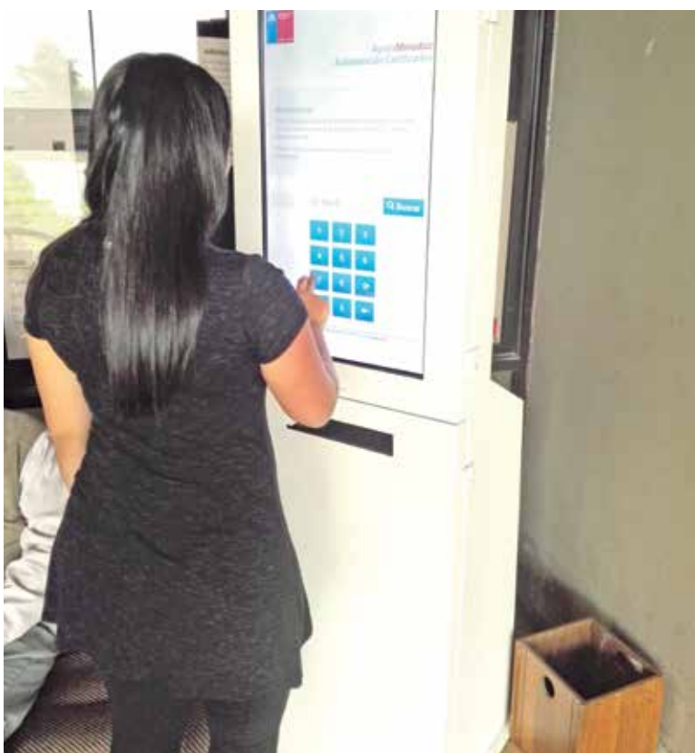
ÁGIL FORMA de obtener tu certificado de estudios.

Del mismo modo, señaló que “de repente, la administración y no sólo es responsabilidad del alcalde, sino de quienes le colaboran o asesoran, deberían decir, ‘alcalde, estos son temas que se abordan como municipio’”.