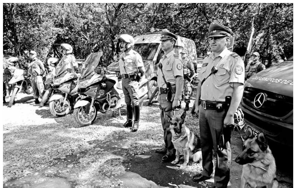
DURANTE LA ÉPOCA ESTIVAL, Carabineros de Chile dispondrá de servicios policiales en los Saltos del Laja.

Esta iniciativa se enmarca dentro del Plan Verano Seguro, el cual se implementa a nivel nacional y que refuerza los servicios policiales en todos aquellos sectores donde existen balnearios. Los Saltos del Laja resulta ser uno de los principales atractivos turísticos de la provincia de Biobío, hasta donde concurren muchas personas durante la semana a fin de relajarse en vacaciones.