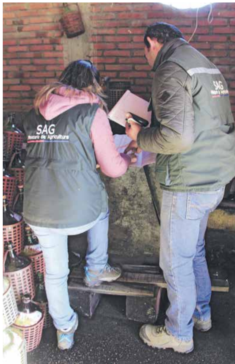
EL TRÁMITE ES COMPLETAMENTE gratuito y permite mantener actualizada la información sobre volúmenes en existencias de vinos.

Los tenedores de vinos que no realicen la Declaración de Existencia en los plazos establecidos, se arriesgan a una multa que va de 1 a 150 U.T.M.