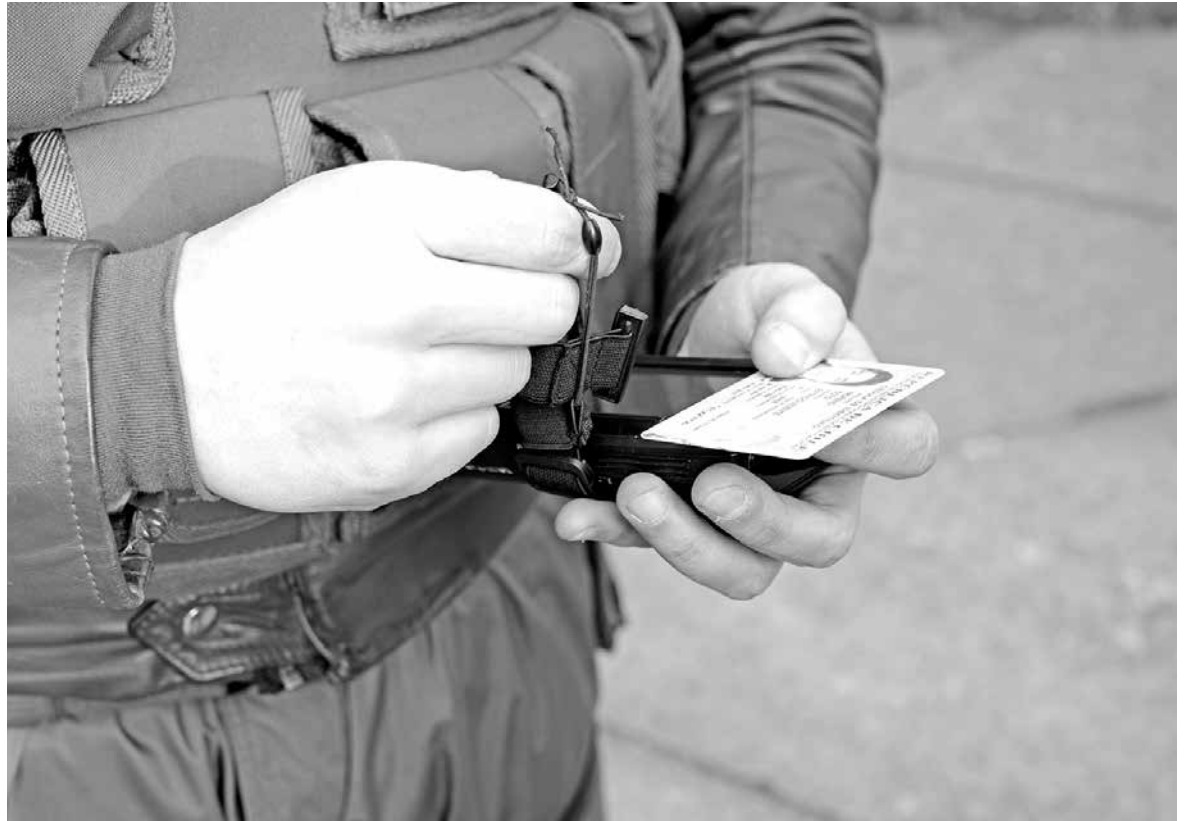
DEL TOTAL DE PERSONAS arrestadas por esta patrulla durante 2016, más de 200 mantenían órdenes de detención vigente.

A nivel provincial, las labores que realiza la Sección de Intervención