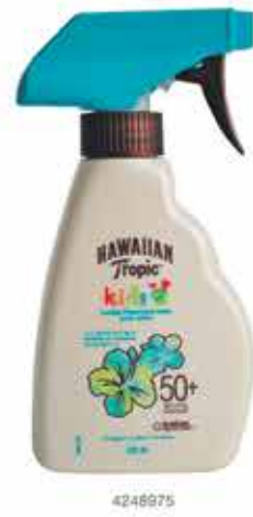
HAWAIIAN TROPIC Protector Solar Infantil FPS50+ 240ml

$9.990 | $11.990 CON OTRO MEDIO DE PAGO | PRECIO REFERENCIAL