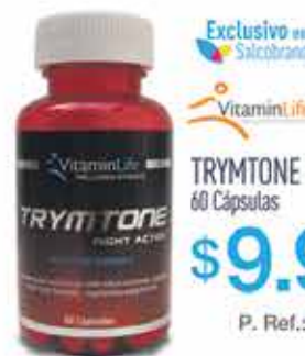
TRYMTONE 60 Cápsulas

$5.990 | $10.990 CON OTRO MEDIO DE PAGO | PRECIO REFERENCIAL