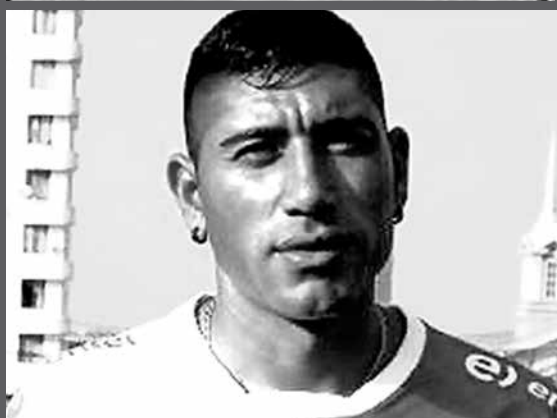
NUEVOS JUGADORES se suman a la azulgrana, confirmados por la dirigencia del club.