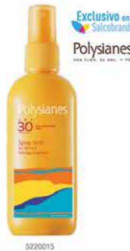
POLYSIANES Protector Solar FPS30 Milk 125ml