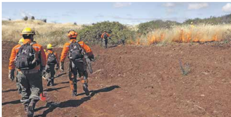
MÁS DE 50 PERSONAS formaron parte del contingente que trabajó para realizar esta reducción de combustible.

Además, Cifuentes sostuvo que esto se efectúa