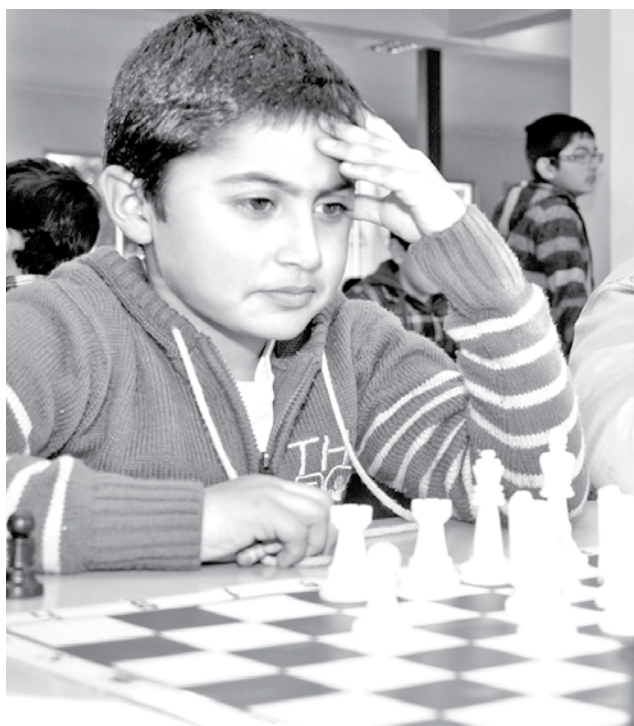
ES EL MOMENTO de revalidar las buenas presentaciones de los ajedrecistas locales este 2017.