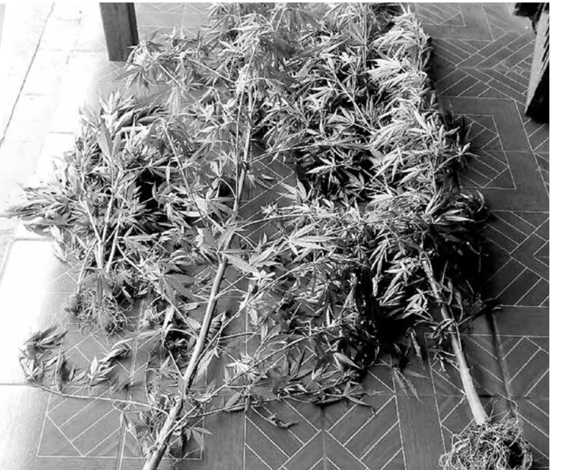
DILIGENCIAS ENCABEZADAS por Carabineros en Santa Bárbara y Los Ángeles permitieron decomisar varias plantas de cannabis.

persona -quien no registra antecedentes policiales- fue detenida por infracción al artículo 8 de la Ley 20.000 de Drogas.