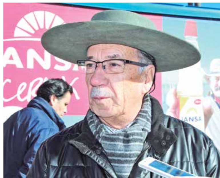
EL LEGISLADOR DESTACÓ que es necesario tener agua potable en condiciones para la gente de sectores rurales.

Hay que consignar que este proyecto tiene como objetivo regular los