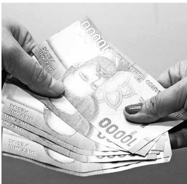
SE ESPERA LLEGAR a un monto de doscientos 76 mil pesos para este 2018.