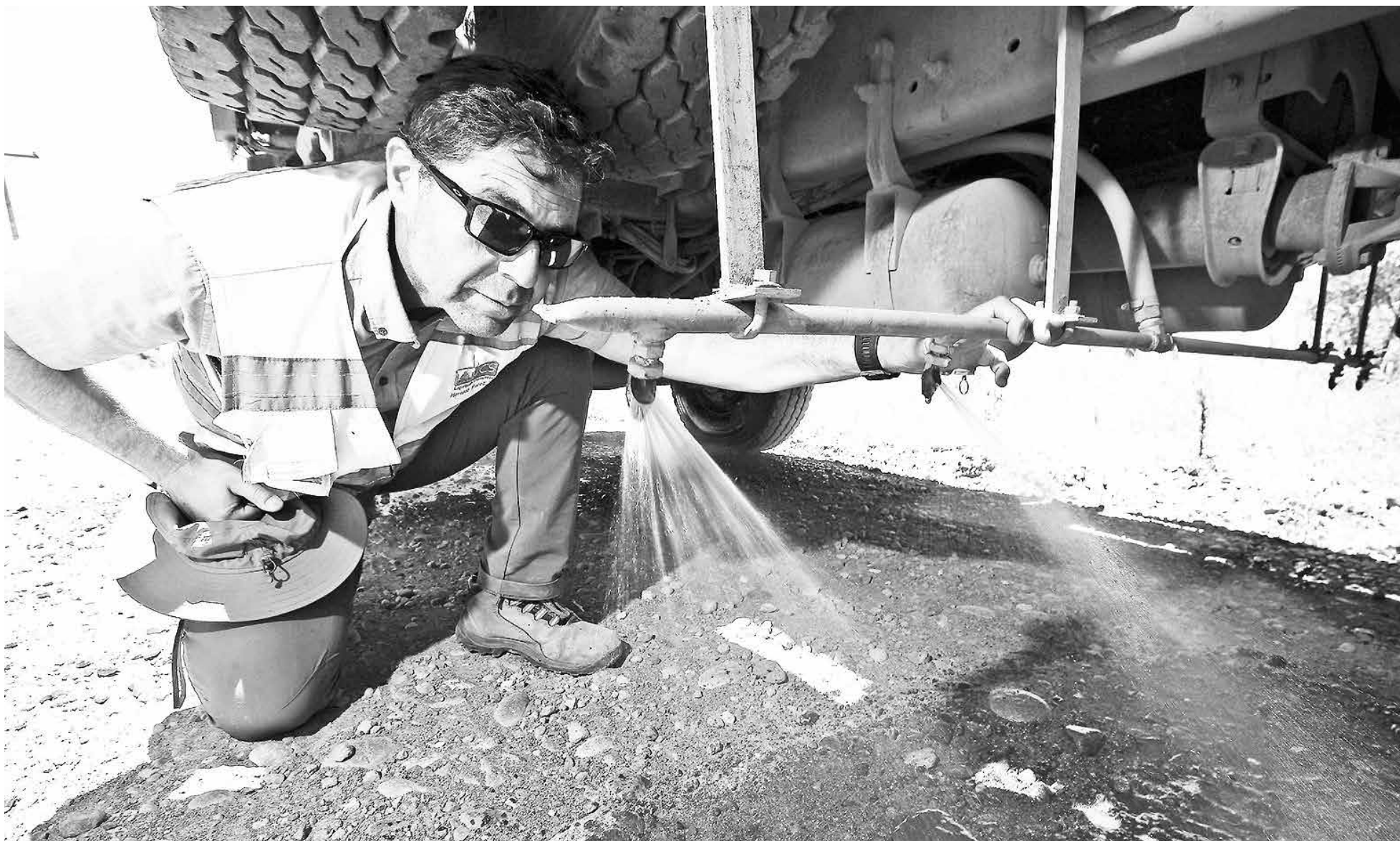
ESTE SISTEMA ENTREGA una solución ideal para la mitigación del polvo, ya que beneficia a los vecinos y hace un uso eficiente de los recursos económicos y del agua.

CREADO EN UN CONCURSO DE EXCELENCIA OPERACIONAL