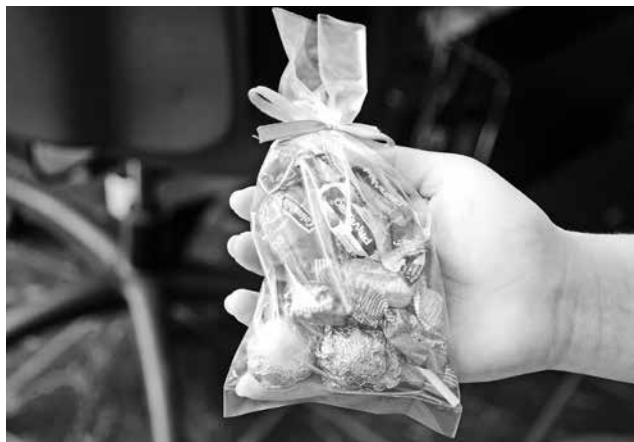
ENTRE 20 A 25 MIL PESOS invierte en crear las bolsitas que vende en el centro de la ciudad.

A pesar de los malestares constantes, asegura que seguirá expresando su deseo por seguir adelante y también por los demás, ya que “uno nunca sabe lo que le puede pasar, la idea es que a los demás les dé más fuerza, si ellos me compran yo les trato de devolver con una bendición, porque es mi manera de agradecer que Dios me levantó de mi enfermedad”.