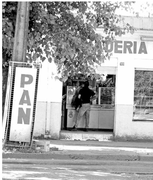
SUCESO SE REGISTRÓ luego de que el hombre ingresara al interior de la panadería Súper Pan.

bineros se percató de que el hombre mantenía un brazalete en su tobillo y cumplía arresto nocturno.