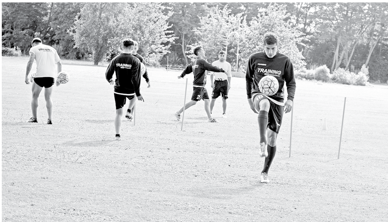
EL EQUIPO TRABAJA PENSANDO en su primer duelo amistoso, el día de mañana, a las 11 AM.