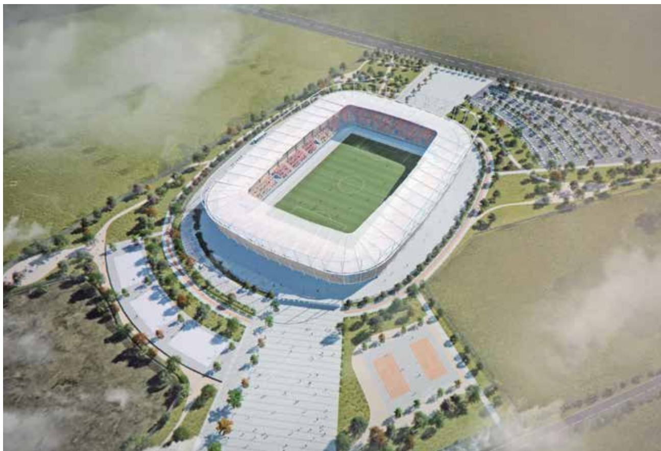
SEGÚN GONZÁLEZ, recién se envió el proyecto al gobierno regional, el que debe ser aprobado.

Por lo mismo, queda en evidencia una aparente postergación de los plazos del inicio de la construcción del nuevo estadio angelino, algo que ya había sido adelantado por La Tribuna, por lo tanto, todo parece indicar que los fanáticos de Iberia, del fútbol y del deporte en general, deberán esperar para poder ver en