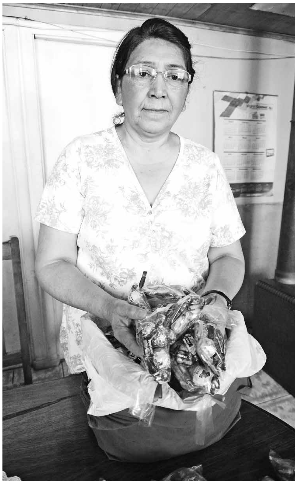
CERCA DE $120.000 debe juntar cada mes para costear los medicamentos que necesita.

A pesar de la gran ayuda que ha significado la venta de sus bolsas de dulces, ya que