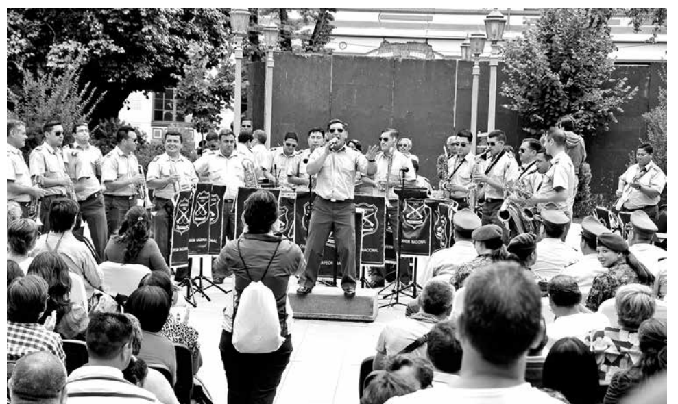
LAS POSTULACIONES se encuentran abiertas hasta el 10 de marzo próximo.

Quienes deseen postular, deben hacerlo en la Oficina de Postulaciones de Carabineros ubicadas en Ricardo Vicuña