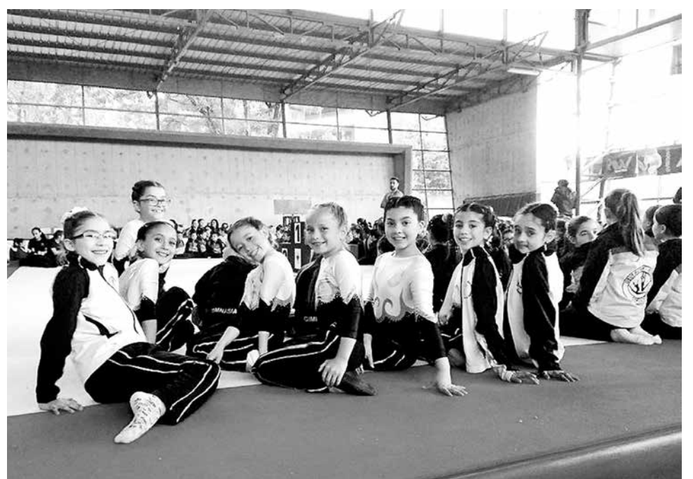
GIMNASTAS SE PREPARAN para una competencia el 14 de enero próximo en Los Ángeles.

La convocatoria para participar de este campeonato ha sido muy bien recibida por las delegaciones nacionales, confirmando su participación en el evento, equipos de gimnasia de trayectoria y renombre