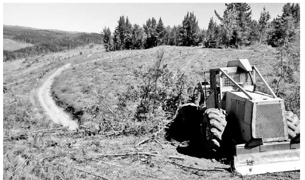
LA PRIMERA VÍCTIMA falleció tras caerle un árbol encima, en un predio ubicado en el sector rural de Cerro de Piedra.

En horas de la tarde de este miércoles, otra persona murió tras protagonizar un accidente laboral al interior del fundo El Naranjo 2. El hecho se pro-