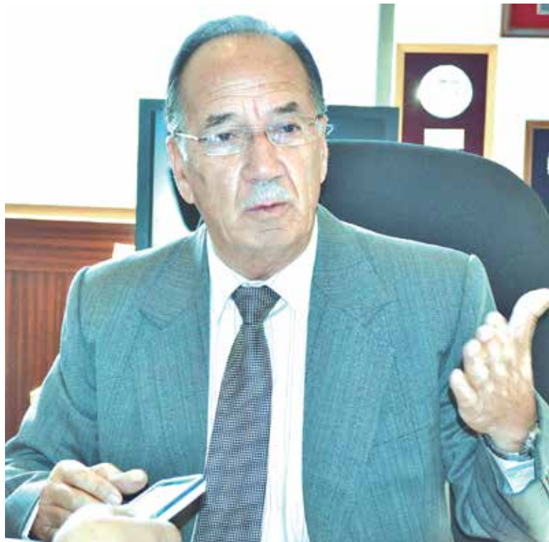
LEGISLADOR ABORDÓ otras nuevas disposiciones, que podrían afectar al mundo del agro.