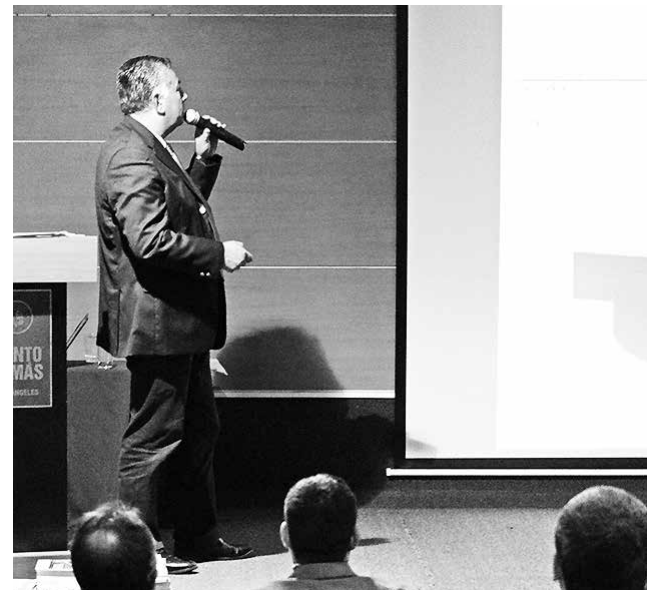
BIOBÍO ES LA REGIÓN que tiene un mayor presupuesto en el país, por sobre Santiago.

Consultado por la estancada situación económica en la que se encuentra el país, y la posibilidad de no recibir la cantidad de dinero requerido, el core expresó que “estoy de acuerdo, y entiendo que pueda ser así, recuerdo que en una ocasión pedimos $178 mil millones y nos entregaron 101, ahora nos están entregando para el próximo año 112 mil millones, pero no recibimos eso porque la