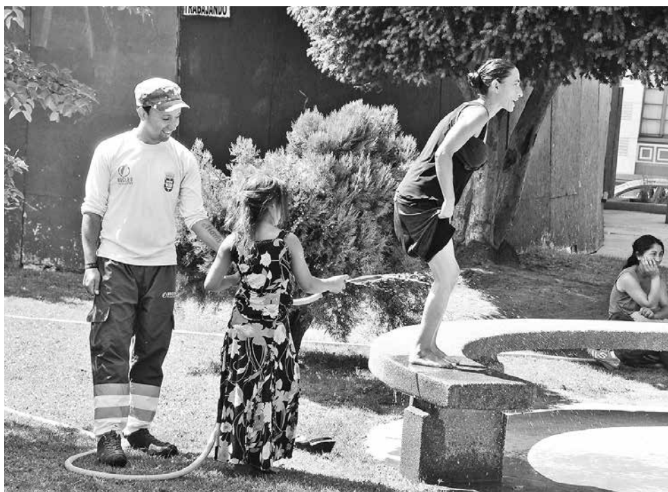
LAS PERSONAS DEBEN usar protector solar principalmente en esta época, independiente del tipo de piel.

Aunque el sol está muy lejos de nosotros, a unos 152 millones de kilómetros, en la realidad este se encuentra muy cerca de nuestra piel y tiene múltiples efectos en ella. Algunos son considerados como estéticos o de belleza, como el “tono bronceado”, y otros también positivos,