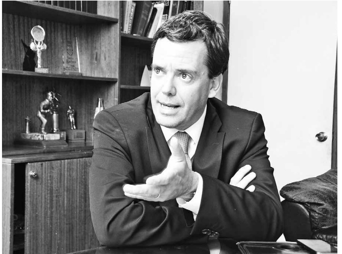
SENADOR PPD indicó que podríamos estar en la puerta de un cambio en el modelo de desarrollo económico de la región.

“Es hora de unir fuerzas de los sectores públicos y privados para sacar adelante este paso relevante para la región y el país”, concluyó.