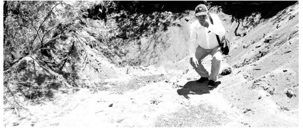
EL DIRIGENTE EN EL LUGAR en donde se realizó -presumiblemente- la descarga, que conserva aún el fuerte hedor a deposiciones.

ron sólo ahí, ya que el pasado jueves sus dirigentes se movilizaron al centro de la comuna angelina, con el objetivo de estampar dos denuncias formales en la Provincial de la Seremi de Salud de Biobío y la Municipalidad de Los Ángeles. A raíz de lo anterior, desde la Dirección de Medioambiente del municipio angelino habrían desarrollado algunas diligencias en el lugar, la jornada del pasado martes, como relató el mismo dirigente de Corte de Lima.