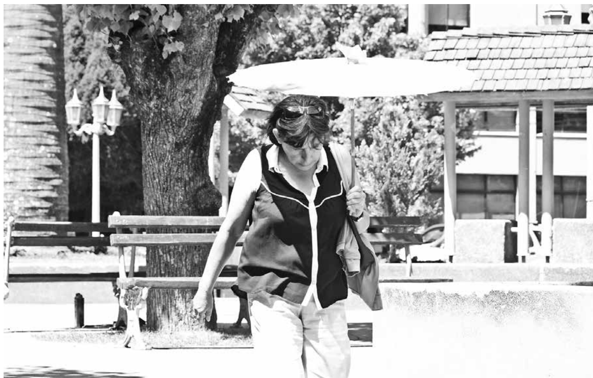
SE ESPERA QUE ya para el fin de semana, las temperaturas no superen los 30 grados.

De este modo, sostuvo que “hay un estudio que indica que en esta primavera sobre todo lo que es la zona central, y también obviamente el Biobío, ha sido la primavera más