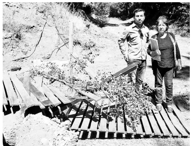
EL DENUNCIANTE junto con su madre, mostrando los destrozos provocados por la maquinaria.

Vale mencionar que en el instante en que estaba el diario de la provincia en el sitio se encontraba también personal de Carabineros y un conservador de bienes raíces de la comuna cabrerina, este último,