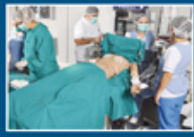
Pabellones de Práctica