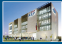
AIEP San Joaquín