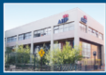
AIEP Los Angeles