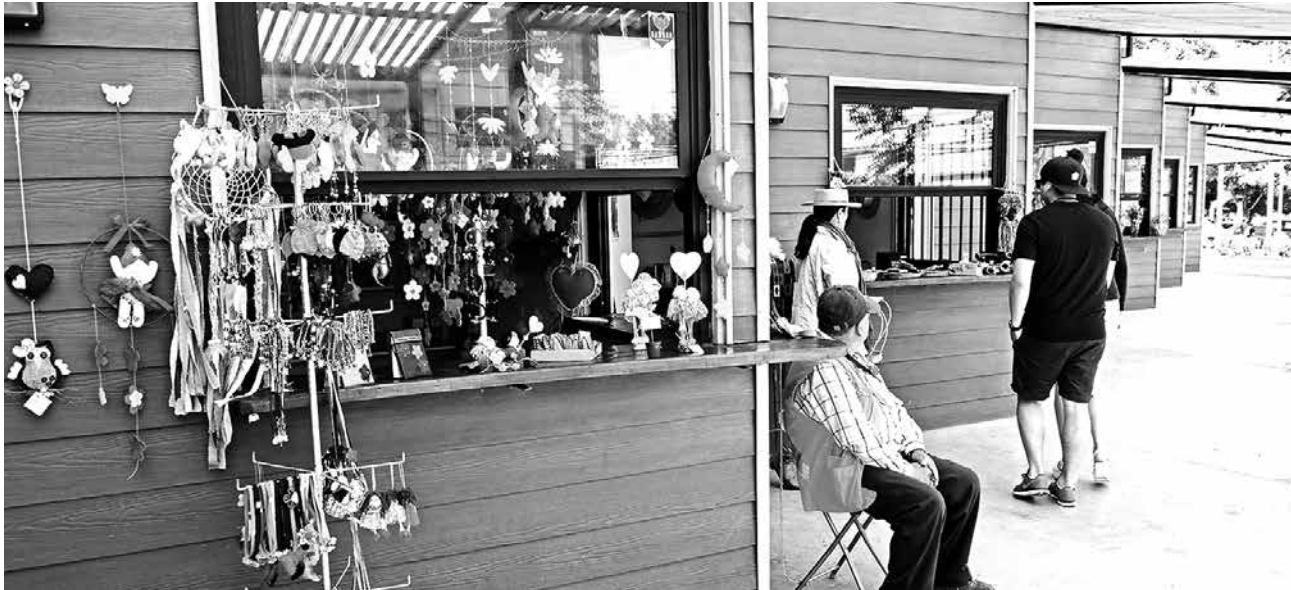
ARTESANOS OFRECEN productos hechos a mano, con materiales como el cuero o madera, pasando también por tejidos a crochet o palillo.