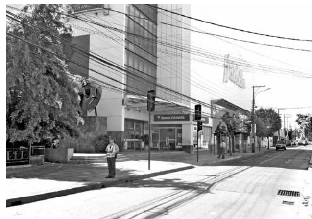
FALABELLA fue una de las dos tiendas afectadas por el delito de hurto.

Al momento de ser fiscalizado por efectivos policiales, el hombre se movilizaba con