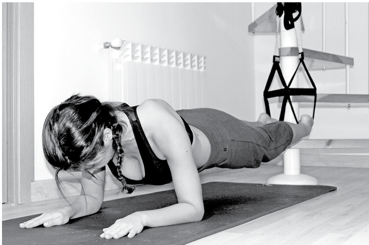
SIGUE ESTOS CONSEJOS; es fácil hacer estos ejercicios en casa.

Con 3-5 minutos de jumping jacks o correr sobre el sitio (con pausas si no estás muy en forma) juzgo que son suficientes, pero aquí puedes encontrar un calentamiento más completo.