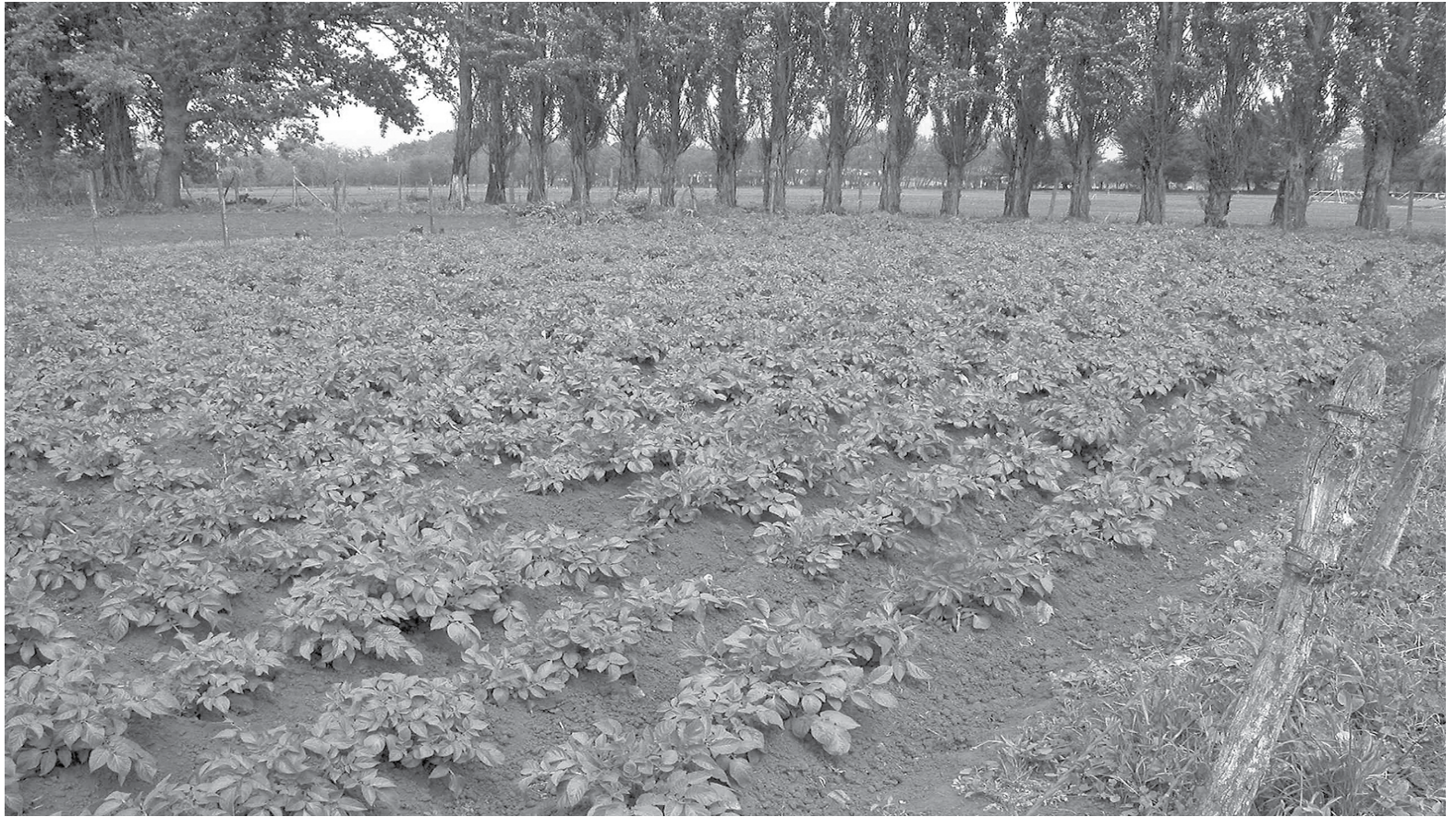
LA VARIACIÓN a 12 meses de este indicador fue de -1,1%.

Productor Industria Manufacturera presentó una variación mensual de 0,1% y acumuló -0,9% en lo que va de 2016. A 12 meses varió -1,4%.