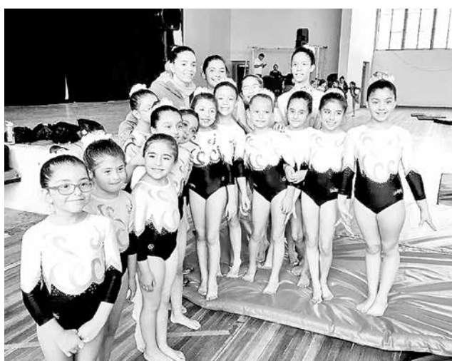
ESTE PRÓXIMO 14 DE ENERO, estas mismas gimnastas nos representarán en el torneo que se realizará en Los Ángeles.

Participaron diversas escuelas, entre ellas destacó la anfitriona Escuela Municipal de Gimnasia de Angol.