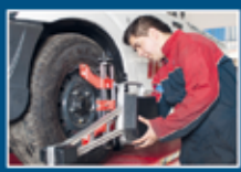
Taller de Mecánica