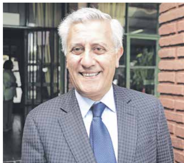
EL EDIL DESESTIMÓ la desconfianza de los profesores ante el cierre, sin embargo, entendió que existan dudas.