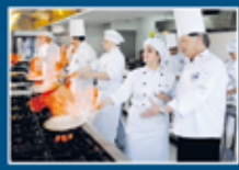
Taller de Gastronomía