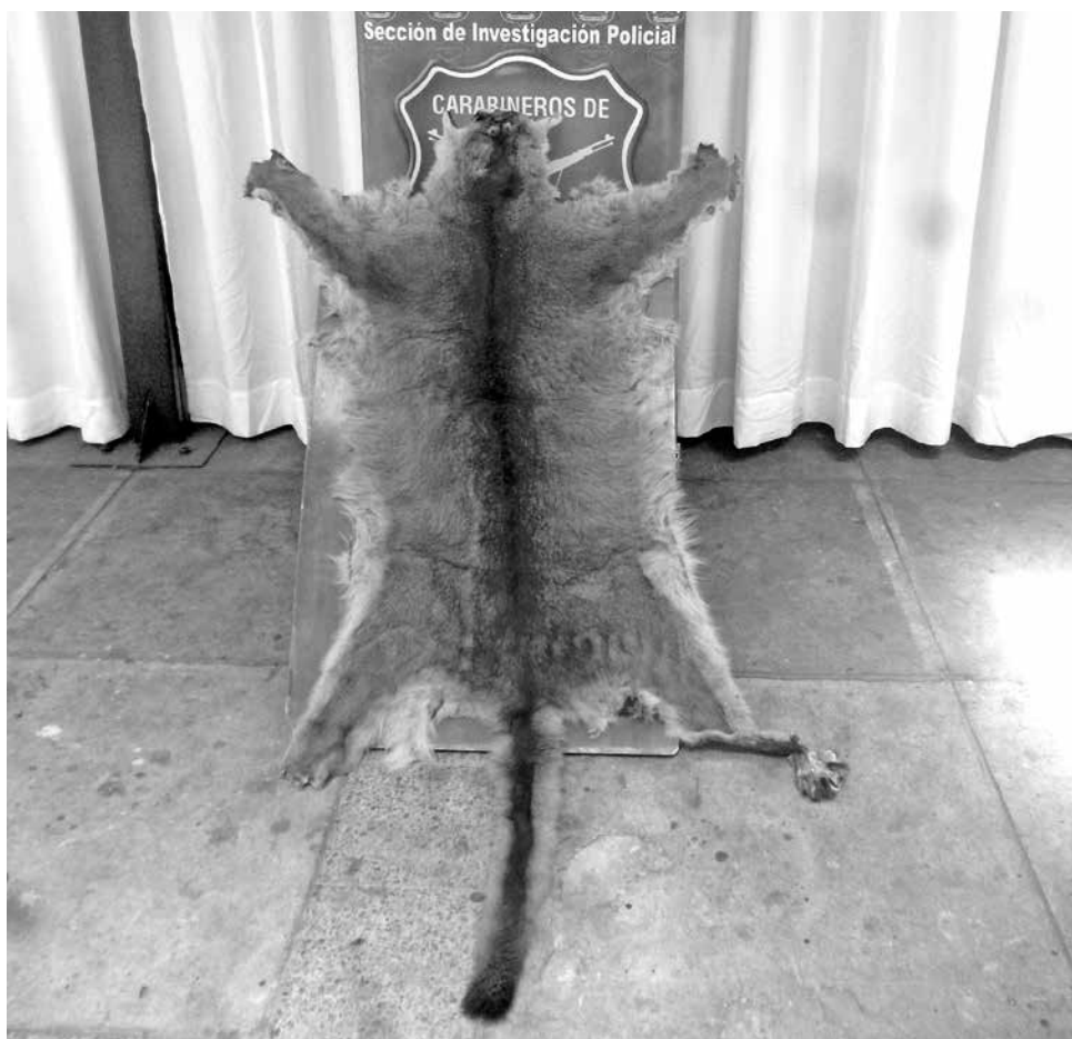
LA PIEL DE PUMA fue recuperada al interior de una vivienda ubicada en villa El Capricho, en el sector de Duqueco.

La caza, captura o comercio de especies prohibidas es sancionada con prisión en su grado máximo o con multas que pueden ir de tres a 50 Unidades Tributarias Mensuales (UTM).