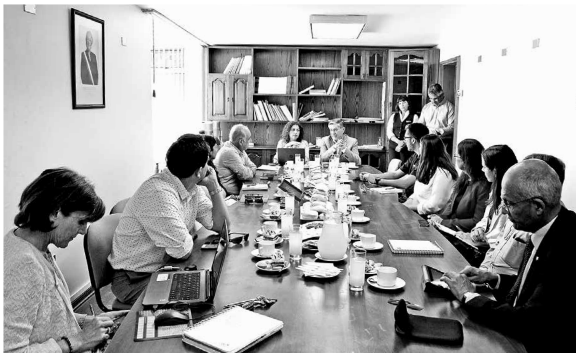
EL LANZAMIENTO del Nodo Vitivinícola del Biobío es el principal hito de estos acuerdos.

El segundo logro es la reactivación de un APL que se firmó en 2011, donde siete puertos de la