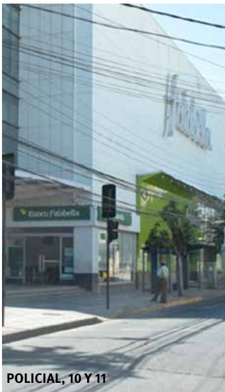
POLICIAL, 10 Y 11

Un inmueble quedó totalmente destruido a causa de un incendio ocurrido el sábado en la tarde, por el que siete personas quedaron damnificadas.