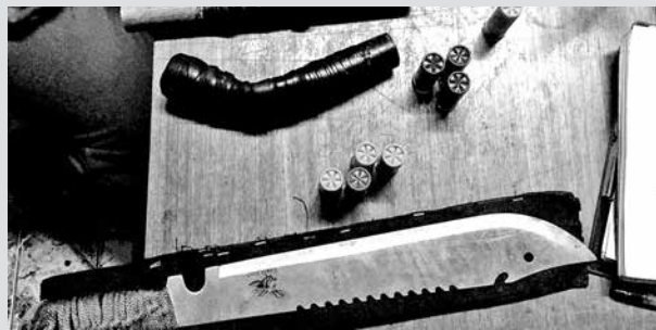
DILIGENCIAS SE ORIGINARON a raíz de un patrullaje preventivo realizado por Carabineros de Mulchén.

El oficial añadió que, mientras el automóvil aún se encontraba en marcha, el acompañante descen-