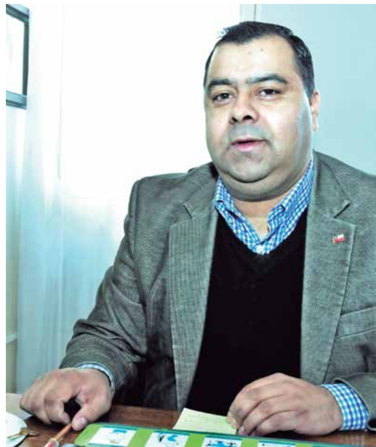
CORE DE RENOVACIÓN NACIONAL apuntó a las próximas elecciones, como el estimulante de mantener las expectativas sobre el viaducto.

“En dicha reunión, muy productiva por lo demás, se indicó claramen-