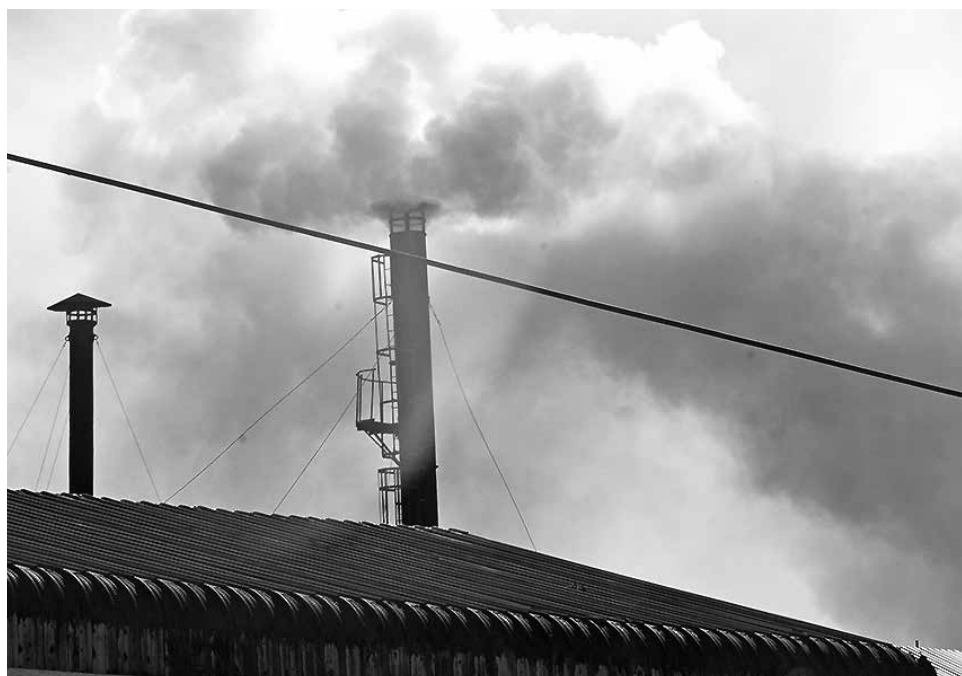
HOY ENTRA EN DISCUSIÓN el llamado "impuesto verde" de la Reforma Tributaria, el que entrará en vigencia este 1 de enero del 2017.

A ellos, añadió que se han regulado cuatro sustancias; material particulado, óxidos de nitrógeno, dióxido de azu-