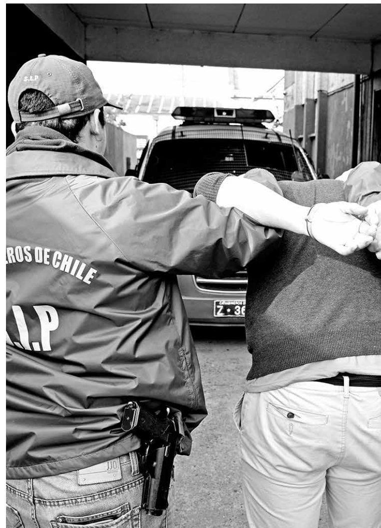
OPERATIVO FUE ENCABEZADO por personal de la Sección de Investigación Policial (SIP) de Carabineros de Los Ángeles.

Desde Carabineros de Chile llamaron a la comunidad a no utilizar esta red social para adquirir artículos, puesto que su origen -muchas veces- puede ser producto de un delito.