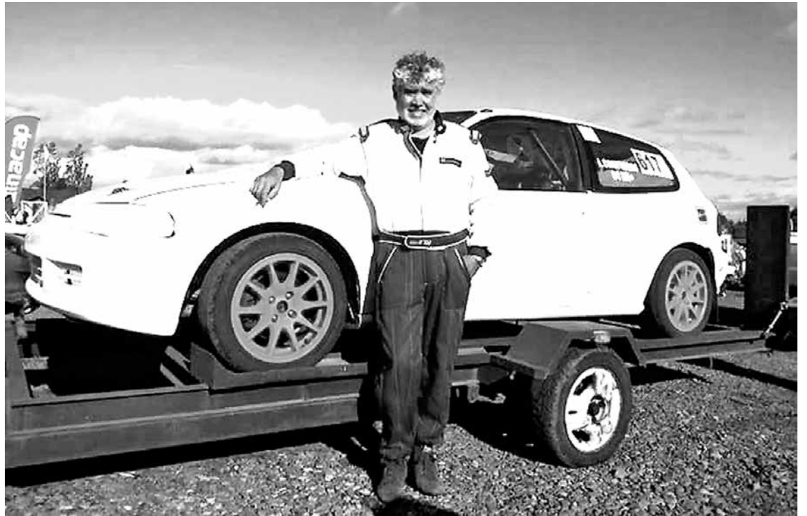
TODOS LOS AMANTES DEL MUNDO tuercas están absolutamente invitados al asfalto de Cabrero, este domingo.