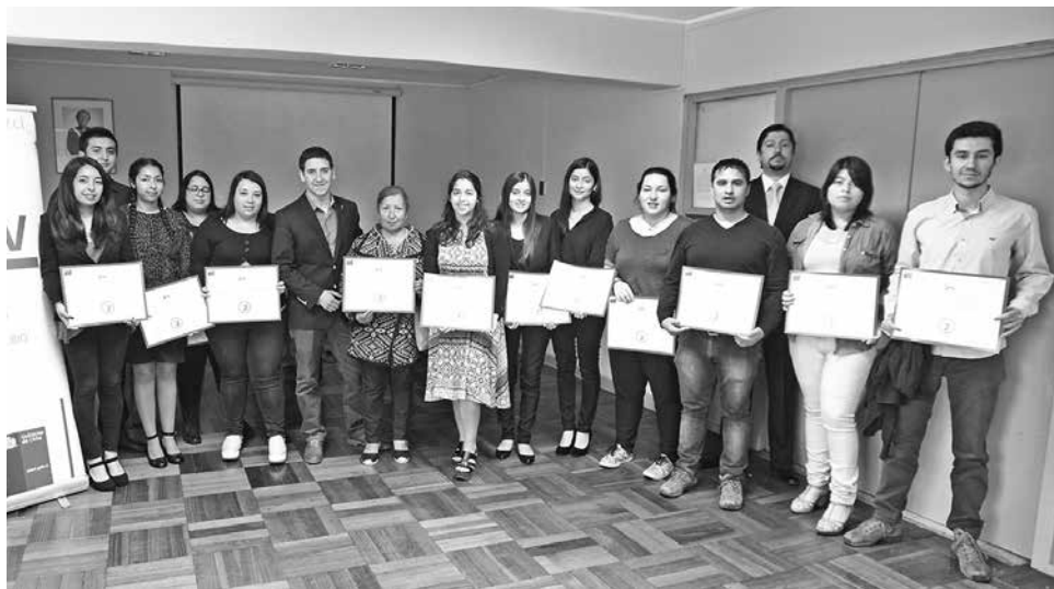
PARTICIPANTES aprobaron curso de chino mandarín y fueron certificados por Injuv Biobío.

El Instituto Nacional de la Juventud Injuv Biobío, certificó a 14 angelinos que aprobaron el curso “Conoce y emprende con China 2016”,