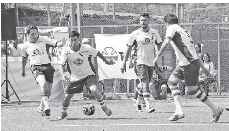
ARTISTAS DE LA MÚSICA y la televisión, no quisieron estar ausentes del encuentro deportivo.