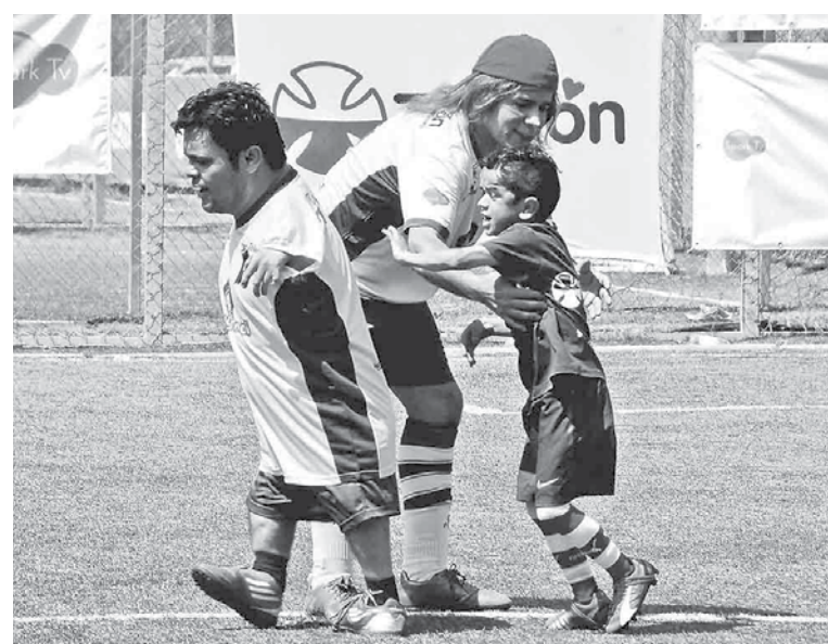
UNO DE LOS ROSTROS que llegó al partido fue el conocido humorista "Oscarito".

Por su parte, el argentino Bernardo Borgeat, se mantuvo entre la cancha y la preparación del asado de