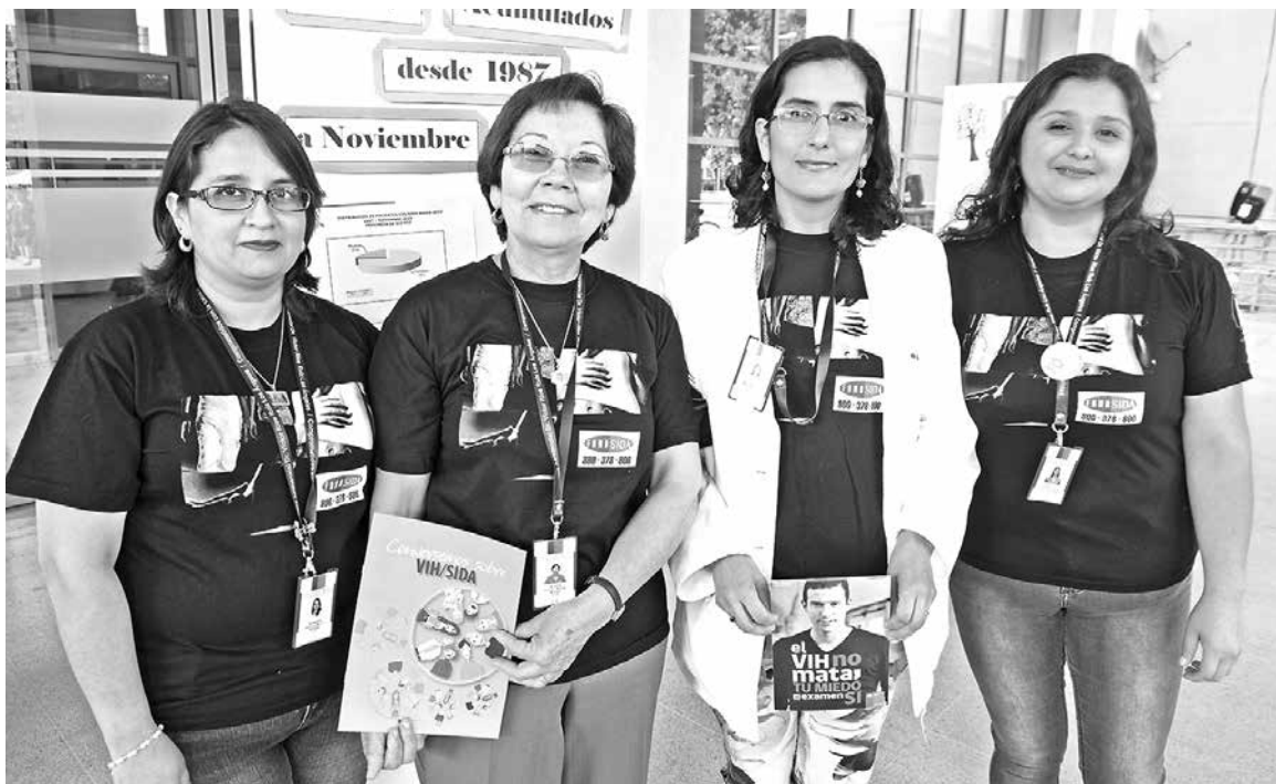
LA ÚNICA MANERA de descubrir si se tiene VIH, es realizando un examen de sangre en algún centro médico.

Es por esto que la matrona llamó a tomar conciencia en cuanto al virus y conocer las maneras en que se contrae. Además, invitó a tomarse el examen en los consultorios o en el hospital, para así averiguar un posible contagio o, de lo contrario,