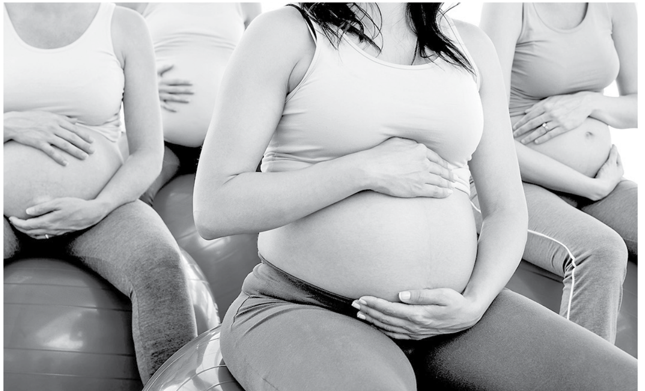
CUANDO SE TRATA de aplanar el abdomen, tienes que enfocar tu atención a la pérdida de grasa en general.

Este ejercicio es especialmente beneficioso para las madres primerizas luego de una cesárea debido a que trabaja los músculos de la parte baja del abdomen, los cuales se ven afectados por la cirugía. Comienza recostándote boca arriba con los pies sobre el suelo con los brazos derechos a los costados de tu cuerpo, con las palmas hacia abajo. Mantén la pelvis en su lugar para trabajar los músculos. Contrae los músculos abdominales para deslizar tu pierna derecha hacia afuera, de forma