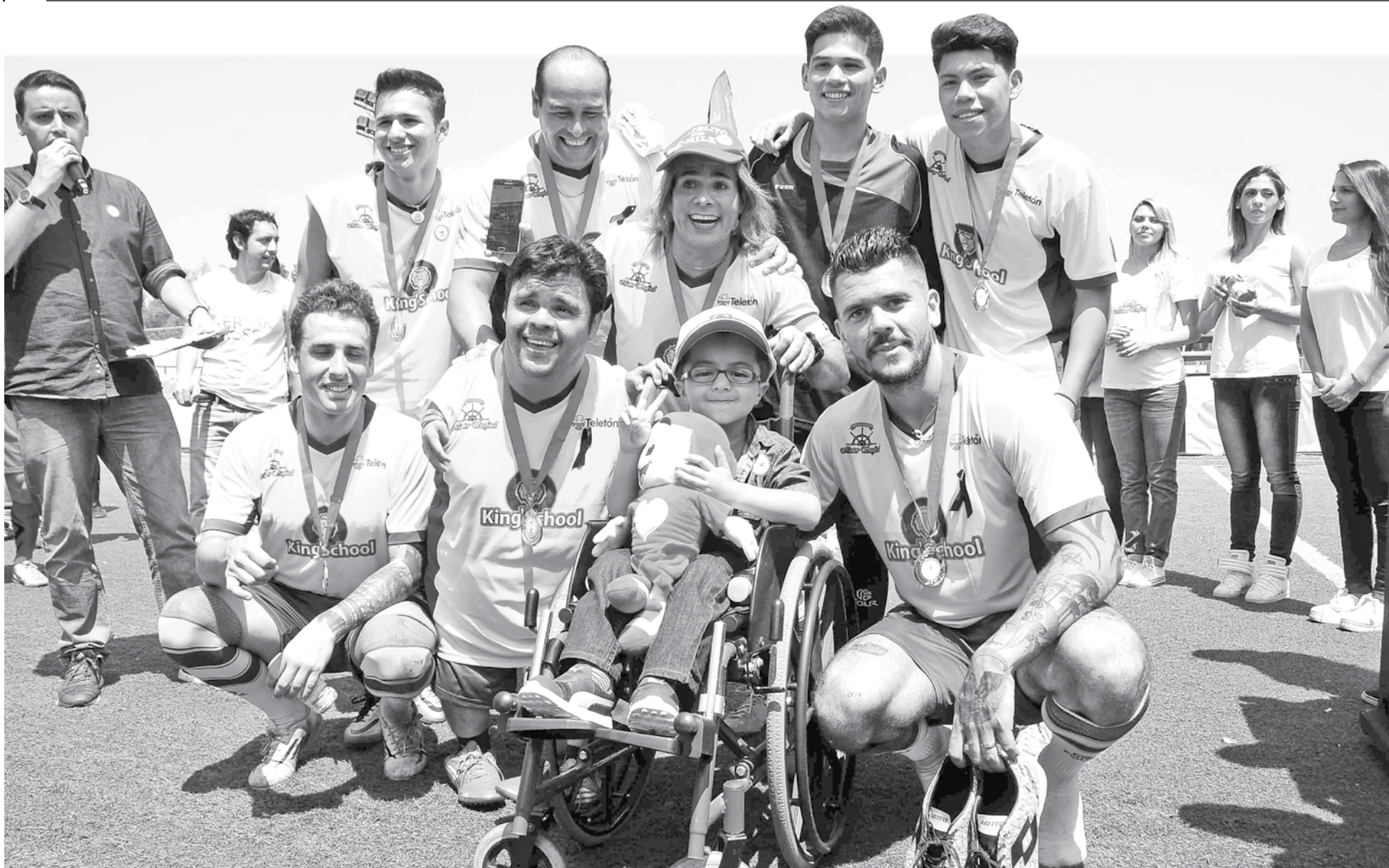
100 MIL NIÑOS se han rehabilitado en Teletón a lo largo de su historia.