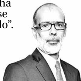
Rodrigo Valdés, ministro de Hacienda.

"Dada la caída en el precio del cobre que hemos tenido en el último año y medio, la empresa prácticamente no ha generado excedentes, eso significa que dado lo que implica la Ley Reservada del cobre, Codelco ha tenido que endeudarse para poder pagar hacia el Estado lo que implica esta ley y ha debido endeudarse más de lo planeado".