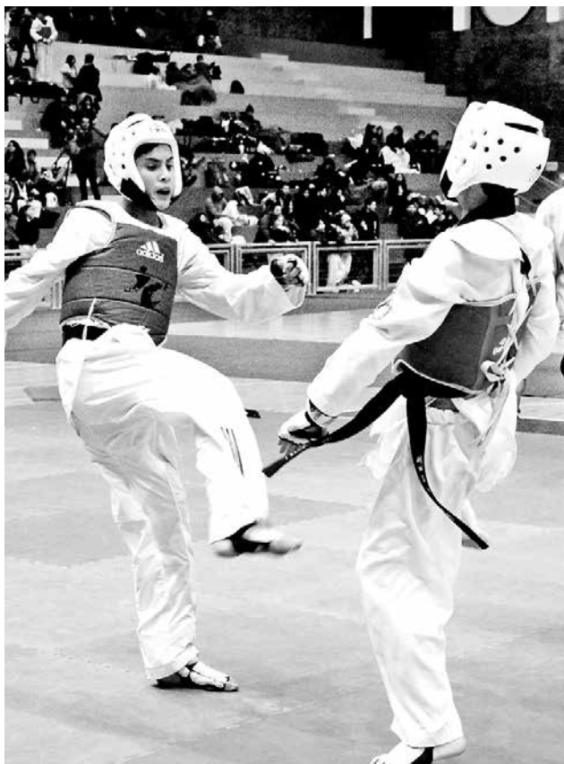
ARTES MARCIALES se tomará las dependencias del Complejo Asistencial este fin de semana.

Las puertas del recinto se abrirán a partir de las 09:30 horas, la competencia comenzará a las 14:30 horas aproximadamente. La ceremonia de premiación se hará a las 18 horas, y el valor de ingreso al recinto sector galería tendrá un costo de $1000 general, y el ingreso a zona de parque tendrá un valor de $2000. Los menores de 10 años quedan liberados de pago, desde ya quedan todos invitados a participar en familia.