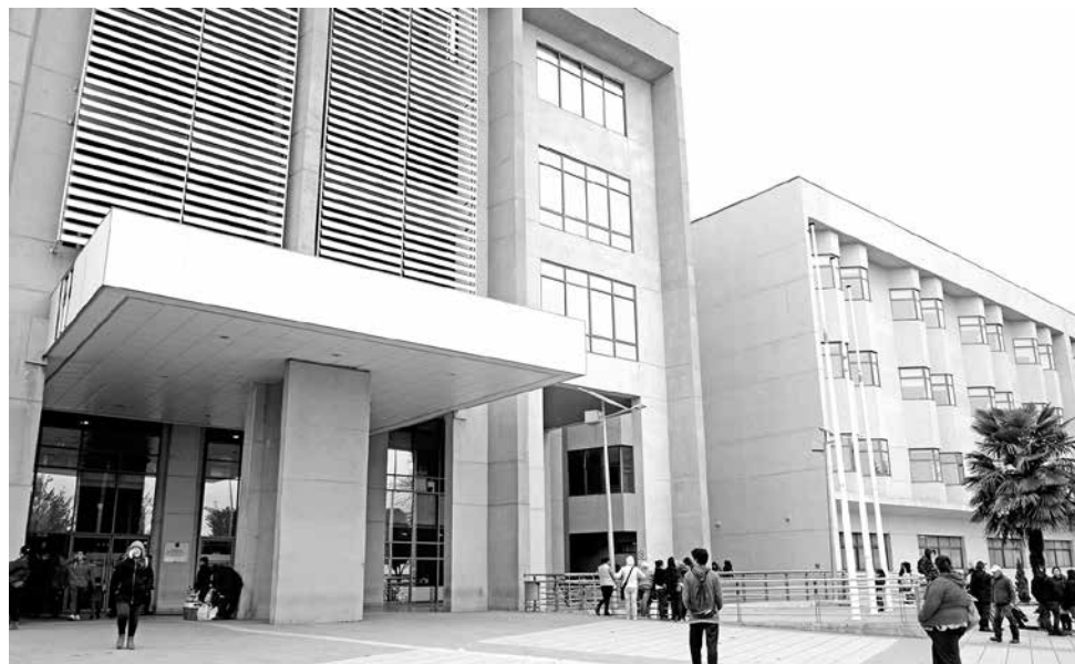
EL FUNCIONARIO POLICIAL se encuentra hospitalizado en el Complejo Asistencial "Dr. Víctor Ríos Ruiz" de Los Ángeles.

Sin embargo, el operativo no salió según lo esperado ya que -debido a la ubicación de los efectivos policiales- "el que se encontraba aledaño al neumático derecho delantero del vehículo, prestándole la cobertura al otro carabi-