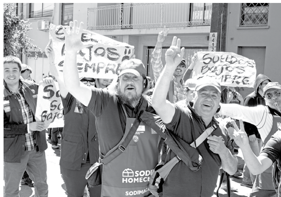
LOS OPERARIOS LLEVAN más de 20 días de paralización, sin que hasta el minuto se vea una pronta salida al conflicto laboral.

“Nadie se va a perder la Fiesta de Navidad de Sodimac. Pese a que la normativa inhabilita a la empresa a otorgar beneficios a trabajadores que estén en huelga, incluyendo la fiesta de Navidad, es importante que se sepa que realizaremos una celebración navideña adicional para todos