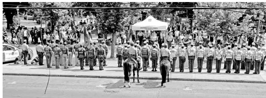
LANZAMIENTO DEL PLAN “Navidad Segura” se realizó la mañana de este jueves en Plaza de Armas de Los Ángeles.

Faltando sólo un par de días para la llegada de Navidad y Año Nuevo, la aglomeración de personas por los distintos sectores de la ciudad trae consigo el escenario casi perfecto para que los amigos de lo ajeno puedan obrar.