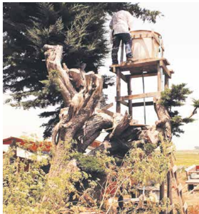
PROFESIONAL DE LA AUTORIDAD sanitaria tomando una muestra de agua para su análisis.

ppm, según legislación vigente D.S. 735, correspondiente al Reglamento de agua para consumo humano, así como que el sistema particular de agua potable se encuentre en funcionamiento normal”, concluyó.