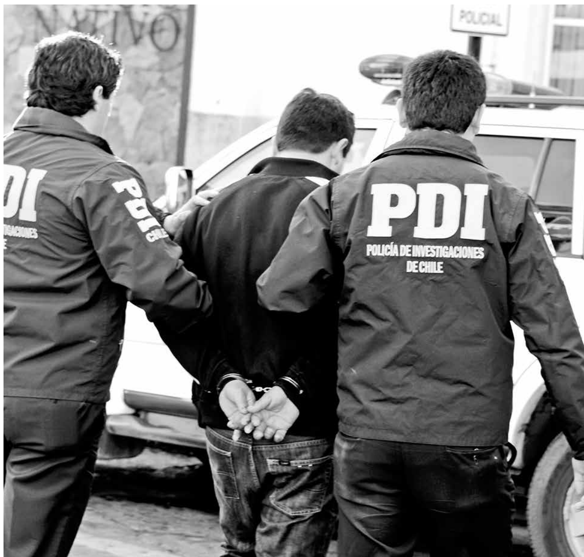
LA TOTALIDAD DE LAS PERSONAS aprehendidas fueron puestas a disposición de la justicia durante esta última semana. (Fotografía de referencia)

Diligencias apuntaron a un objetivo concreto: identificar a quienes estuvieran prófugos de la justicia tanto en Los Ángeles como en comunas aledañas de la provincia de Biobío.