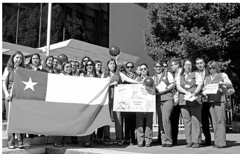
LOS TRABAJADORES protestaron en el ingreso de la sede de Banco Estado en la capital provincial.

Adhiriéndose al llamado nacional a movilizarse, los cerca de 25 trabajadores de ServiEstado de Los Ángeles, comenzaron una huelga legal la jornada de ayer.