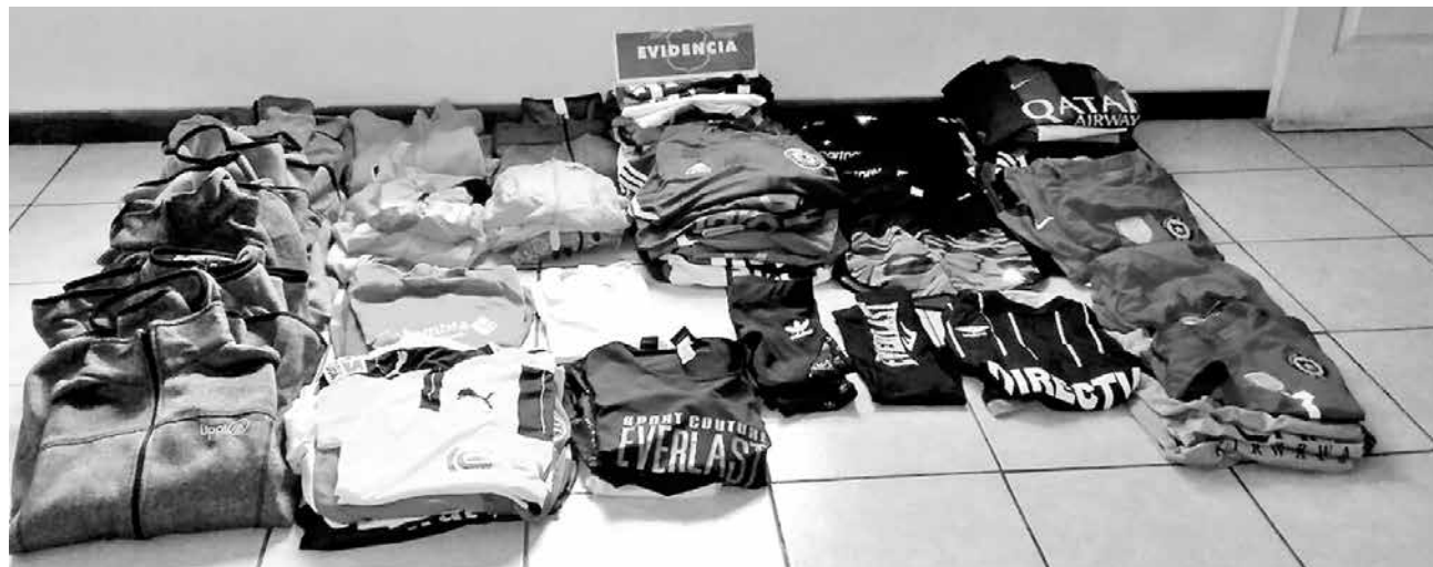
TODA LA ROPA DECOMISADA fue remitida a la Fiscalía Local de Los Ángeles.

años y oriunda de la ciudad de Los Ángeles, fue detenida mientras intentaba vender 35 jockeys Nike, Puma y Adidas que en realidad no correspondían a esas marcas.