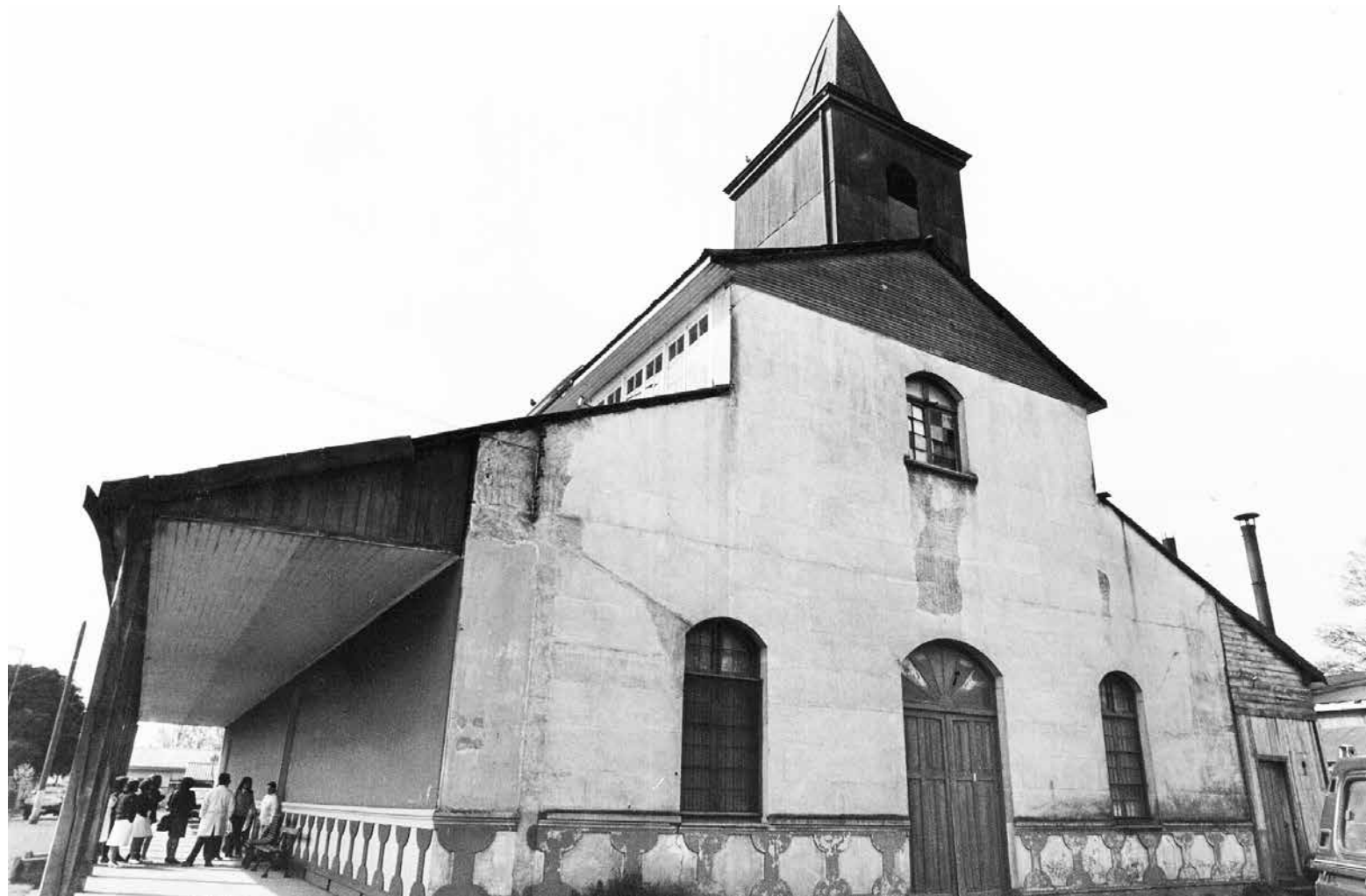
CAPILLA SAN SEBASTIÁN es uno de los dos monumentos históricos nacionales con que cuenta la capital provincial.

Cabe destacar que el proyecto se hizo considerando su triple dependencia, por lo que cuenta con la