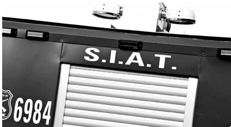
EN EL LUGAR se constituyó personal de la SIAT de Carabineros de Biobío.

El lugar donde ocurrió este fatídico accidente se ubica a la altura del kilómetro 21 de la Ruta Q-60, que conecta la comuna santuario con la localidad de Rere.