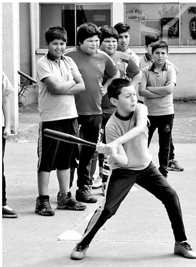
LA IDEA QUE TIENEN proyectada es que los niños puedan mejorar hasta llegar al nivel competitivo.

A esta nueva fase se unirían los restantes establecimientos educacionales de esta zona rural de Los Ángeles, es decir, el Liceo Santa Fe y la escuela La Victoria.