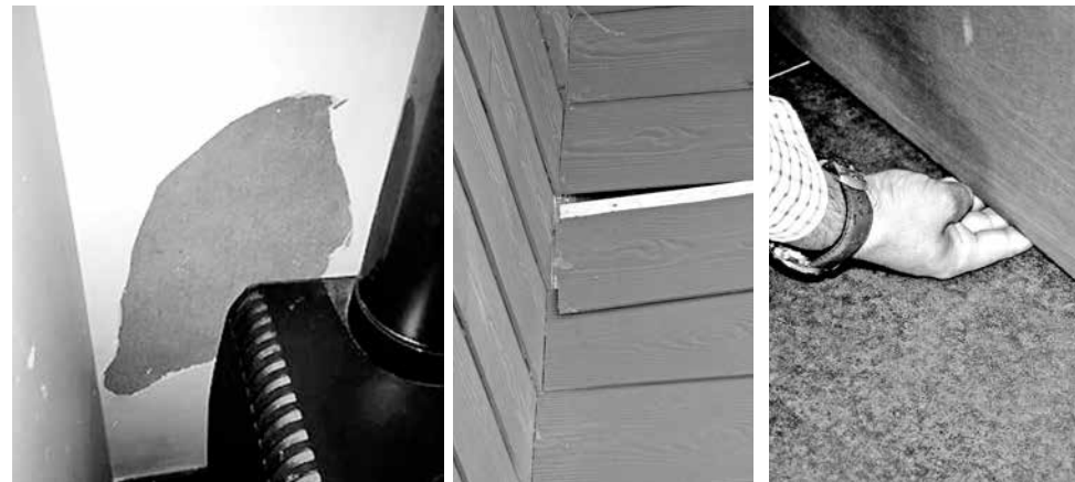
EL DENUNCIANTE EXHIBIENDO los “arreglos” que la empresa ejecutó en su propiedad.

las otras etapas del conjunto habitacional, sin embargo, estos no les colaboran en nada”, precisó.