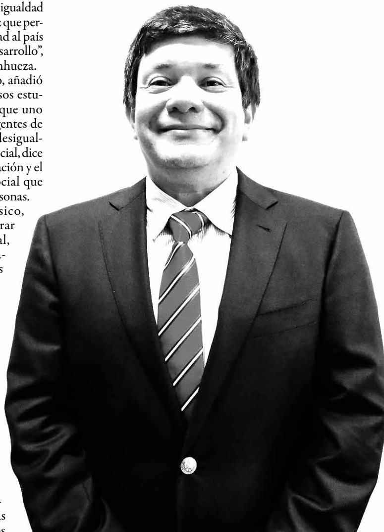
SANHUEZA RECALCÓ que no se puede dejar de lado el crecimiento económico para tener una mayor “torta” que repartir.

Finalmente, enfatizó que “la gran movilidad se da luego con la educación superior, pues está demostrada, según datos de diversos estudios, la existencia de brechas salariales entre personas con estudios medios, técnico de nivel superior y universitarios”.