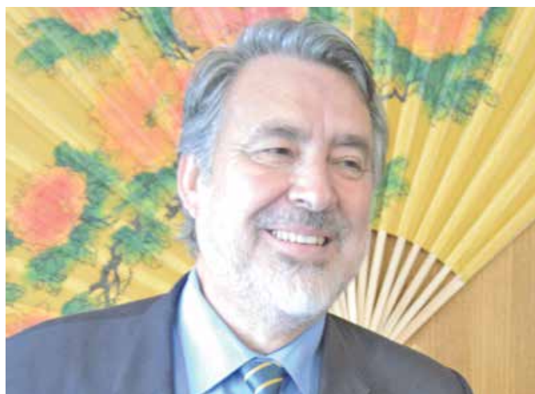
EL MAS se suma al Partido Radical en apoyo del senador por la región de Antofagasta.

Anticipándose a las definiciones de campaña del próximo año, el Movimiento Amplio Social (MAS) de la provincia de Biobío, comprometió su respaldo al senador, Alejandro Guillier (Indep), como carta presidencial para el 2017.