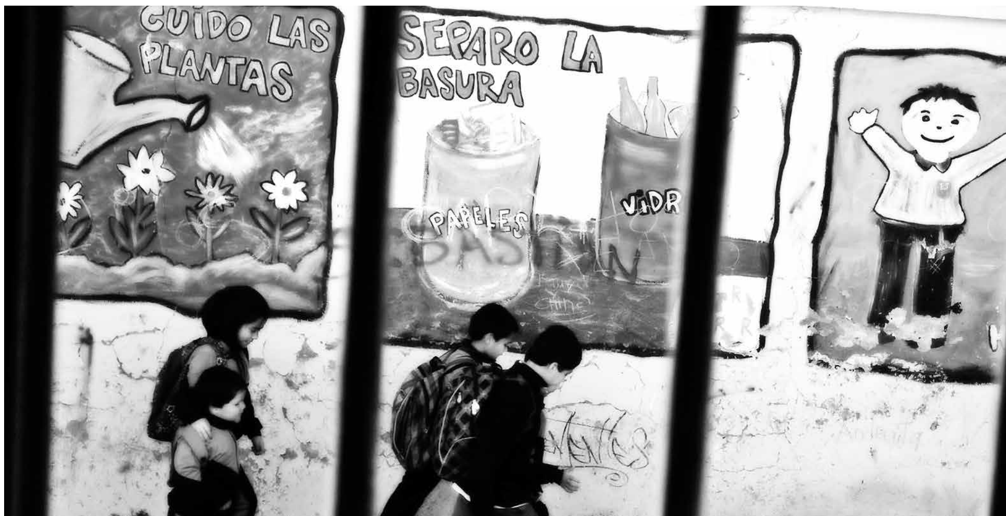
PROFESIONAL ASEGURA que el personal de la institución debería contar con las competencias para abordar estas complejidades.