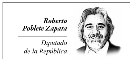
Roberto Poblete Zapata Diputado de la República

Los objetivos que planteó en ese entonces -y ahora- al país el Día Nacional de la Creatividad, buscan estimular la participación ciudadana a partir de una metodología en la que los adherentes definen sus actividades y lugares de realización. Esto la convierte en una iniciativa participativa desde el inicio, y apela a la acción voluntaria. Fortalecer nuestra originalidad a través de vivir ese día de manera diferente, desde la alegría, la expresividad, el ritual comunitario y la fiesta; saliéndose de los hábitos y rutinas, de las burocracias laborales y educacionales. Desarrollar nuestra capacidad de reconocernos como comunidad y no como una sumatoria de soledades aisladas, propiciar y facilitar conductas de bien común, generar propuestas, mensajes simbólicos, acciones y objetos nuevos en cualquier área del quehacer humano. Vivir una fiesta nacional participativa, pluralista e integradora, autogenerada por la ciudadanía en todos sus espacios de expresión ya sea local, comunal, regional, institucional,