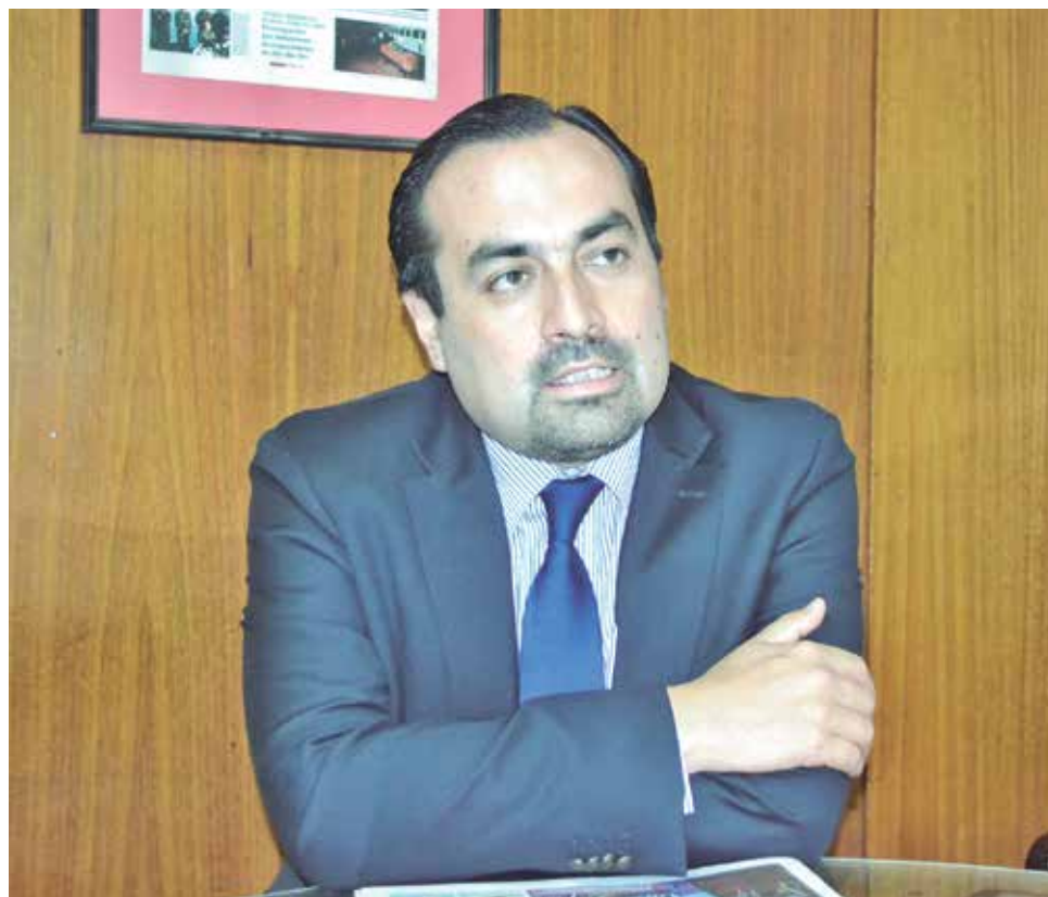
LA MÁXIMA AUTORIDAD regional (S) también respondió si el Mecano será el broche de oro del 2016.

“Una decisión de esta envergadura no se toma de un día para otro, por lo tanto todas las reuniones que han sido públicas y transparentes por parte del intendente, van a llevar a la decisión que se va a comunicar el día jueves por la mañana, con invitación especial a todos los medios de comunicación”, concluyó.