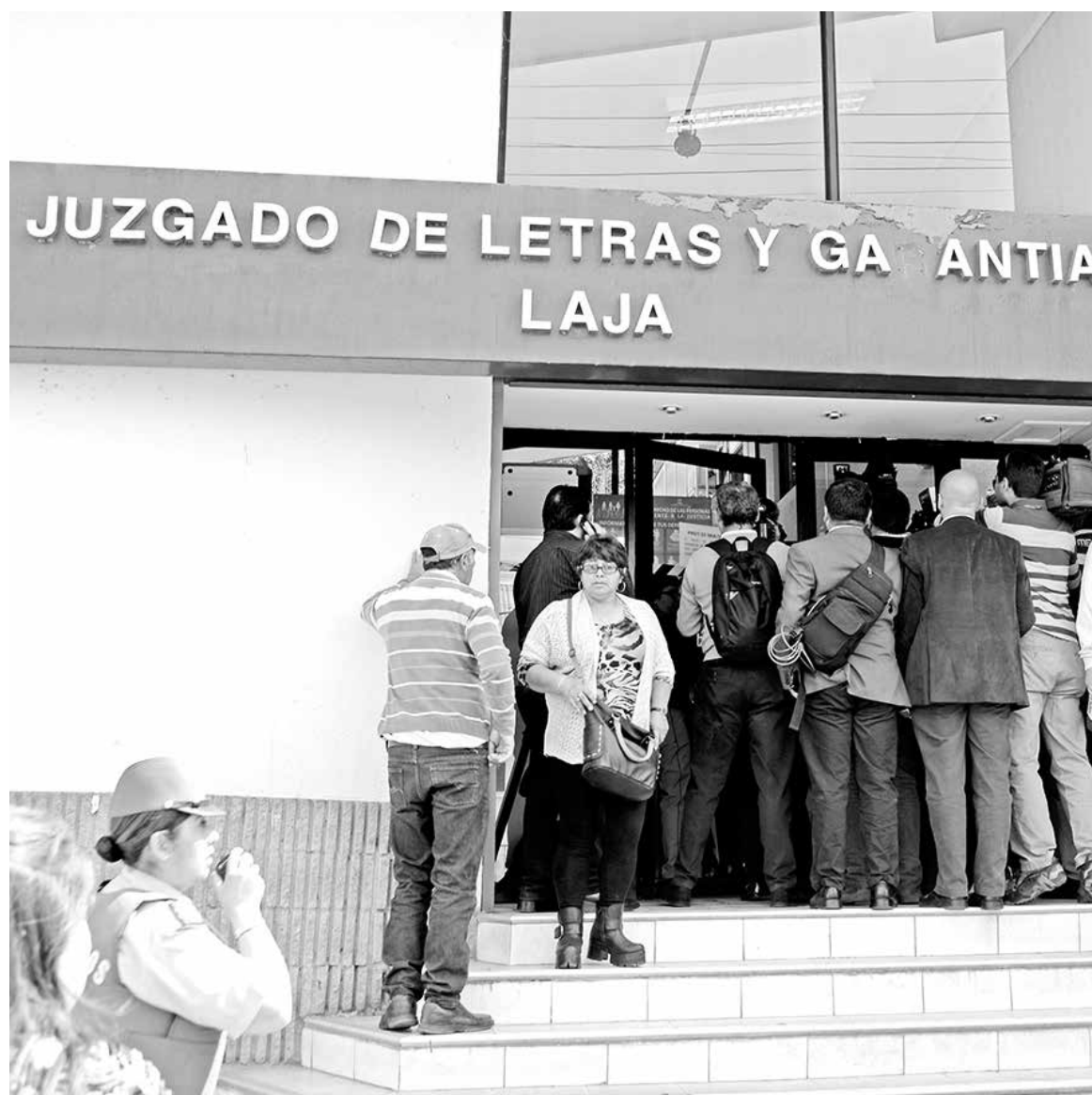
EL HOMBRE FUE FORMALIZADO por el delito de violación en dependencias del Juzgado de Garantía de Laja.

Asimismo, se decretó un plazo de cuatro meses para que la Fiscalía Local investigue el hecho.