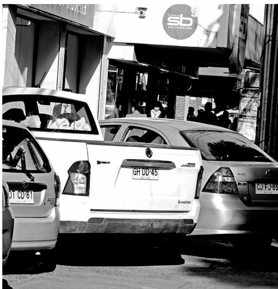
PARA PERPETRAR EL DELITO, los hombres abrieron una de las puertas del vehículo afectado.

Dos de los cuatro detenidos registran un amplio prontuario policial por diferentes ilícitos. Entre ellos, delitos de robo, lesiones, robo en lugar habitado, receptación y hurto, sólo por mencionar algunos.