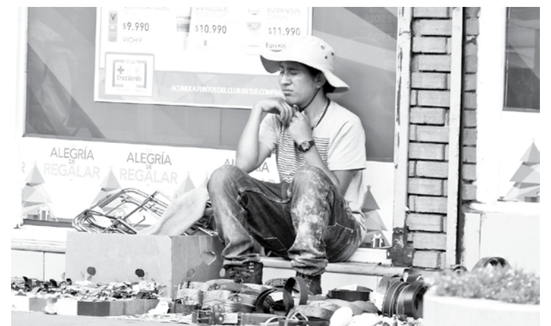
QUIEN CONTRATA A un extranjero que tiene visa de turista comete una ilegalidad.

sino que además lo está haciendo en contravención a las normas del Código del Trabajo, que obligan al empleador a tener un contrato de trabajo toda vez que existe un vínculo de subordinación y dependencia entre las partes, y a realizar el descuento de las cotizaciones previsionales mensuales. En este sentido, se cae en el absurdo de pensar ¿por qué tengo que hacerle contrato de trabajo a alguien que no puede trabajar? Entonces optan por tenerlo trabajando ilegal. Por eso decimos que la ley tiene vacíos que es necesario subsanar para evitar fraudes e irregularidades a la hora de contratar extranjeros", finaliza.