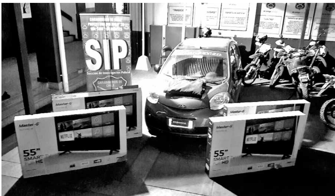
LAS ESPECIES FUERON evaluadas, en total, en un monto cercano a los 3 millones de pesos.

Esto es, por no brindar respuesta satisfactoria respecto a la procedencia y/o propietario de las especies que ocultaban tanto dentro del vehículo abandonado como en el techo del vehículo en el que se desplazaban.