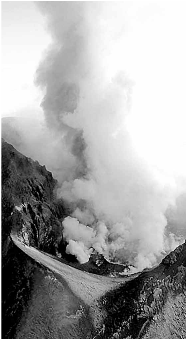
RECORDEMOS QUE EL VOLCÁN Copahue se encuentra en alerta amarilla desde el 3 de junio del 2013.