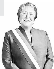
Michele Bachelet, Presidenta de la República.

“Debemos detener de una buena vez la violencia machista que subyace en nuestra cultura. Para eso no nos podemos quedar en la indignación, tenemos que transformar indignación en acción”.