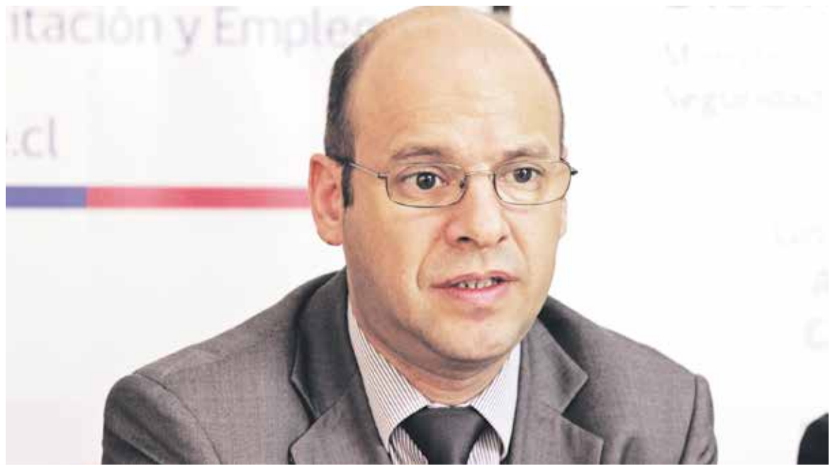
LA AUTORIDAD REGIONAL del organismo fue el encargado de explicar los detalles del nuevo beneficio para capacitación de trabajadores.

Cabe mencionar que las empresas también pueden postular como organismo, teniendo como requisito ser contribuyentes de primera categoría ante el SII, tener una planilla anual de remuneraciones imponibles superiores a 35 UTM y poseer las cotizaciones de sus trabajadores