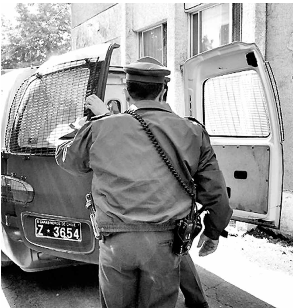
I.E.M.R., DE 20 AÑOS, mantiene antecedentes penales por diferentes delitos pero nada pendiente.

Personas desconocidas cortaron la aldaba artesanal que era utilizada para mantener cerrado el inmueble, la cual fue cortada para poder ingresar.