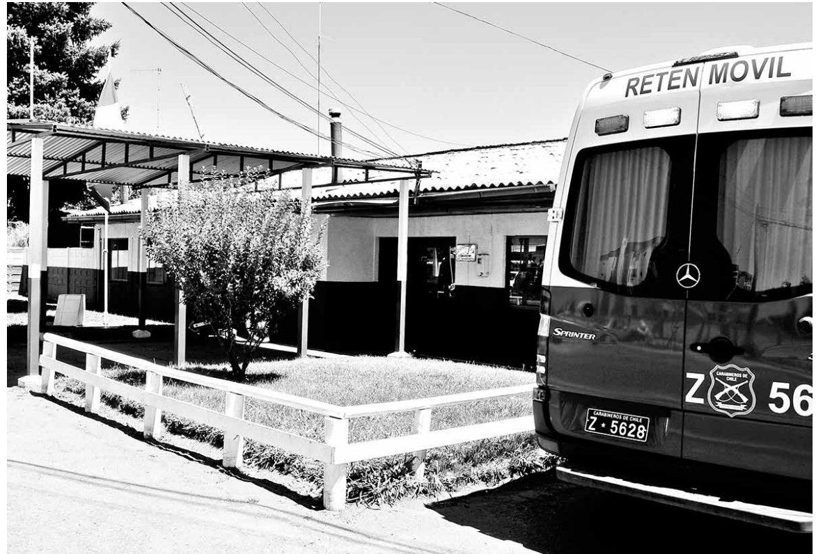
LAS DILIGENCIAS FUERON adoptadas por personal de la Subcomisaría de Carabineros de Cabrero.

Tras el hallazgo de las especies, cuya procedencia sería producto de robo, Carabineros de Chile inició las diligencias investigativas para dar con el propietario de las herramien-