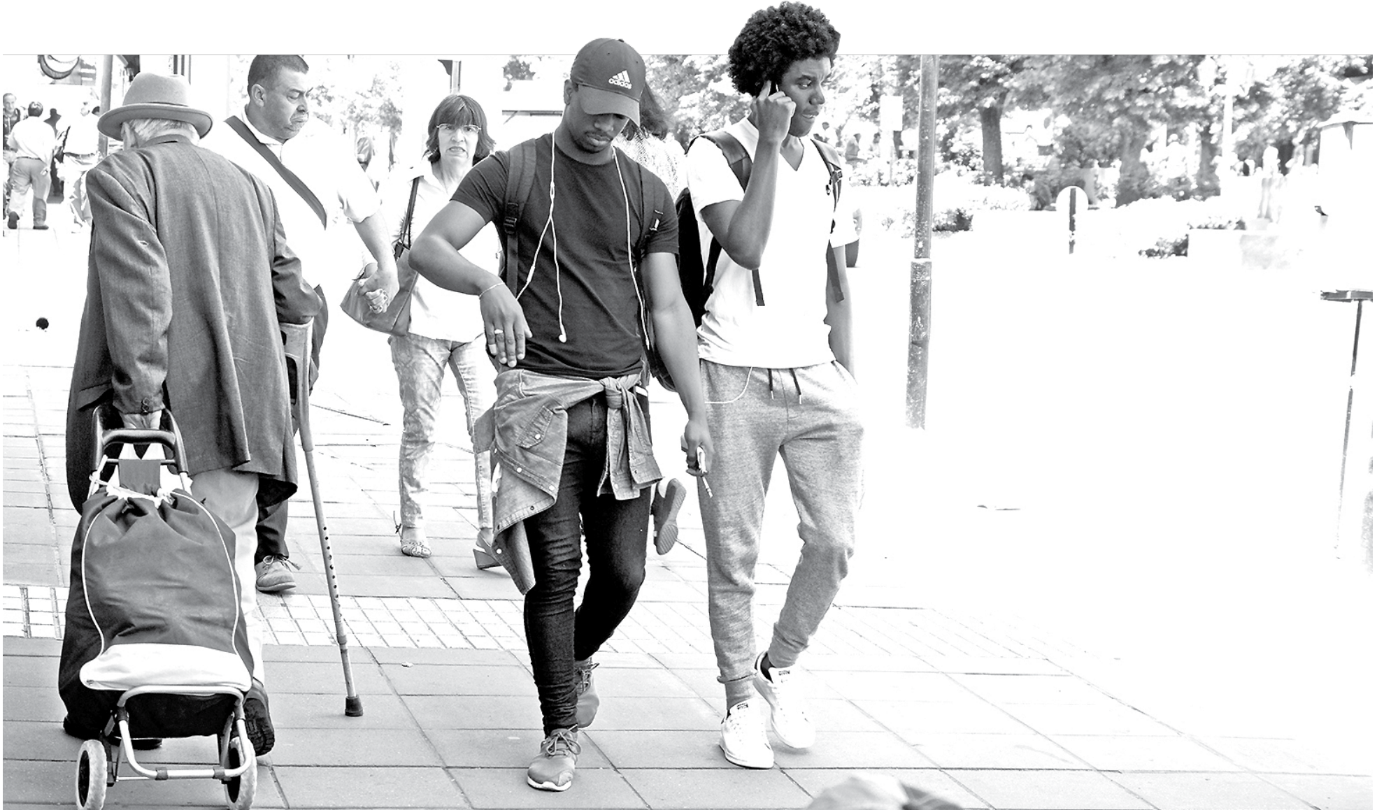
PROBLEMAS se originan porque los empleadores no están dispuestos a esperar que los extranjeros obtengan su visa.