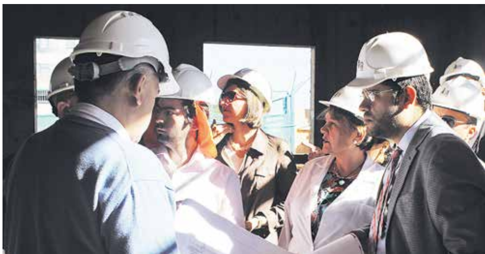
AUTORIDADES INSPECCIONANDO -en terreno- el avance de las obras.

“El trabajo del SAMU es muy complejo, pues todavía es visto sólo como el traslado de pacientes, cuando en realidad es la entrega de atención prehospitalaria la más crítica de sus funciones. Esperamos -continuó- que al duplicar su capacidad operativa podemos cumplir con las expectativas de los usuarios, a los que también invitamos a usar con responsabilidad este servicio, porque una llamada no pertinente puede bloquear el acceso a la atención a usuarios que si lo requieran de manera urgente”, sentenció.