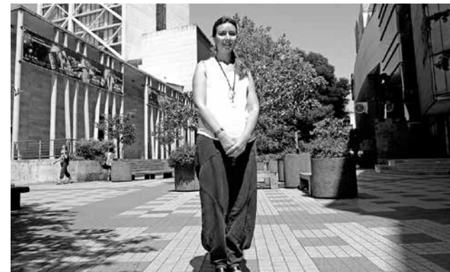
ESTE SERÁ EL LUGAR donde expondrán a la comunidad los diversos sistemas de entrenamiento.

“Los invitamos con mucha energía, como tienen que ir, ojalá con ropa liviana, protec-