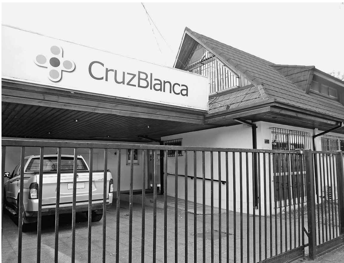
ISAPRES ALCANZARON UTILIDADES por $28.872 millones, que contrastan con los $20.263 del 2015.

Finalmente, el superintendente destacó que “estas cifras nos muestran que el Sistema Isapre sigue funcionando y sigue siendo muy rentable. Sin embargo, creemos en la necesidad de cambios regulatorios que den más transparencia y mayor funcionalidad a las personas. Estamos todos convocados a trabajar por ello”.