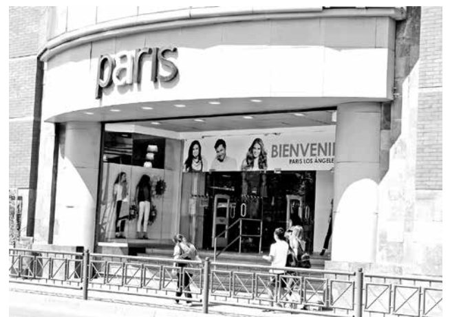
DEUDA DEJÓ DE APARECER en la cobranza de la tienda Almacenes Paris del mes de noviembre.

“Tuvimos que hacer muchas gestiones, yo creo que es bueno decirle a la gente que no se dé por vencida, que haga todos los trámites y que insista. Porque no hay que dejarse pasar y hay que comenzar a exigir sus derechos”, concluyó.