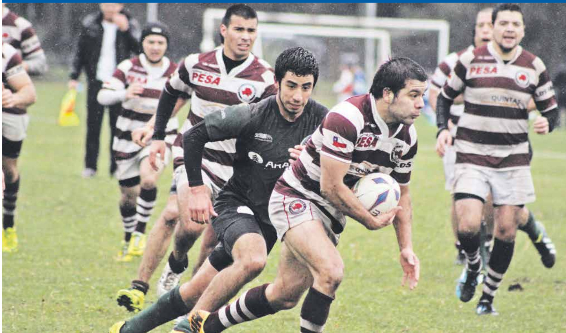
APUESTAN A QUE CALLAQUÉN sea protagonista de la Liga Regional de Rugby.