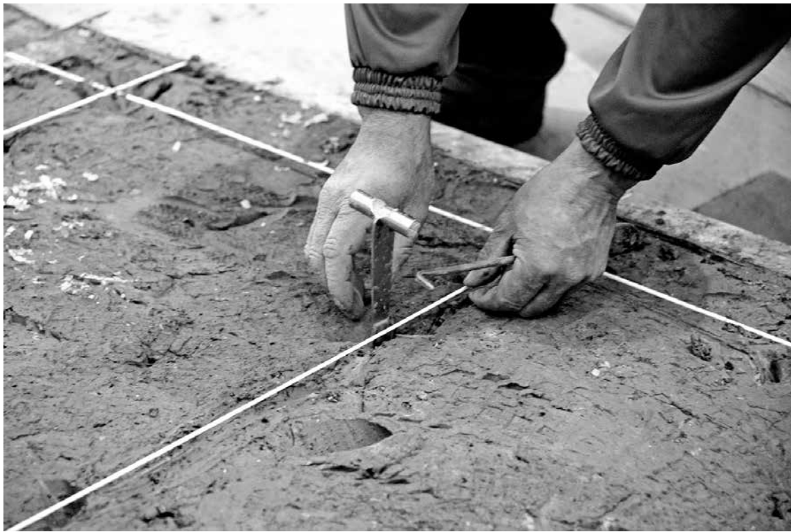
RAYUELEROS DEL BERNARDO O'HIGGINS pueden saborearse. Para cerrar el torneo tendrán cordero al palo.