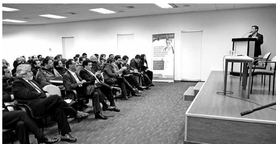
ESTE VIERNES 25 de noviembre se realizarán las firmas de convenio con los 42 proyectos beneficiados.

Este año se destinaron $ 89.572.988 millones de pesos para el desarrollo de 42 proyectos beneficiados con el Fondo de Fortalecimiento de las Organizaciones de Interés Público, (FFOIP) en la Región del Biobío. Así lo informó el seremi de gobierno, Enrique Inostroza, quien además dijo que este viernes se realizarán las firmas de convenio.