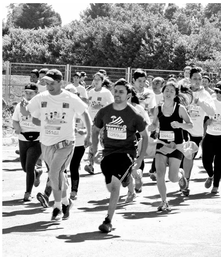
SIGUE ESTOS PASOS, que para estas fechas te serán de gran ayuda.

Varía tu velocidad durante la corrida. Esto te ayudará a no cansarte, sin necesidad de detenerte, y, además, a mantener un ritmo cardíaco más lento. Y lo más importante: no te sobre exijas, si cuentas con antecedentes médicos o sufres de sobrepeso. Si notas que estás fatigado o mareado, detente a tomar aire y, si aun así quieres concluir la carrera, continúa caminando.