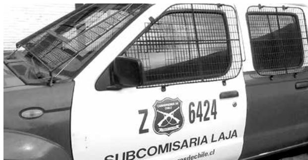
LAS DILIGENCIAS FUERON encabezadas por personal de la Subcomisaría de Carabineros de Laja.

Con los datos recepcionados, efectivos policiales de la subcomisaría de Carabineros de Laja se constituyeron en el lugar, sorprendiendo a una persona con las mismas características entregadas por la persona que denunció el hecho.