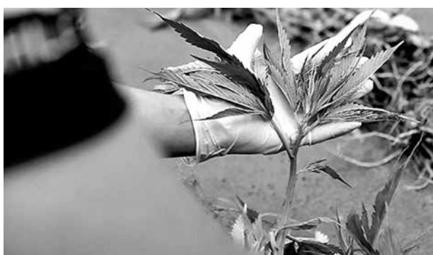
UNA VEZ QUE ÉSTAS ALCANZARAN su producción óptima serían comercializadas entre consumidores y adictos de sector.

Tras efectuar las primeras diligencias, el fiscal de turno tramitó la respectiva orden de entrada y registro de la casa del