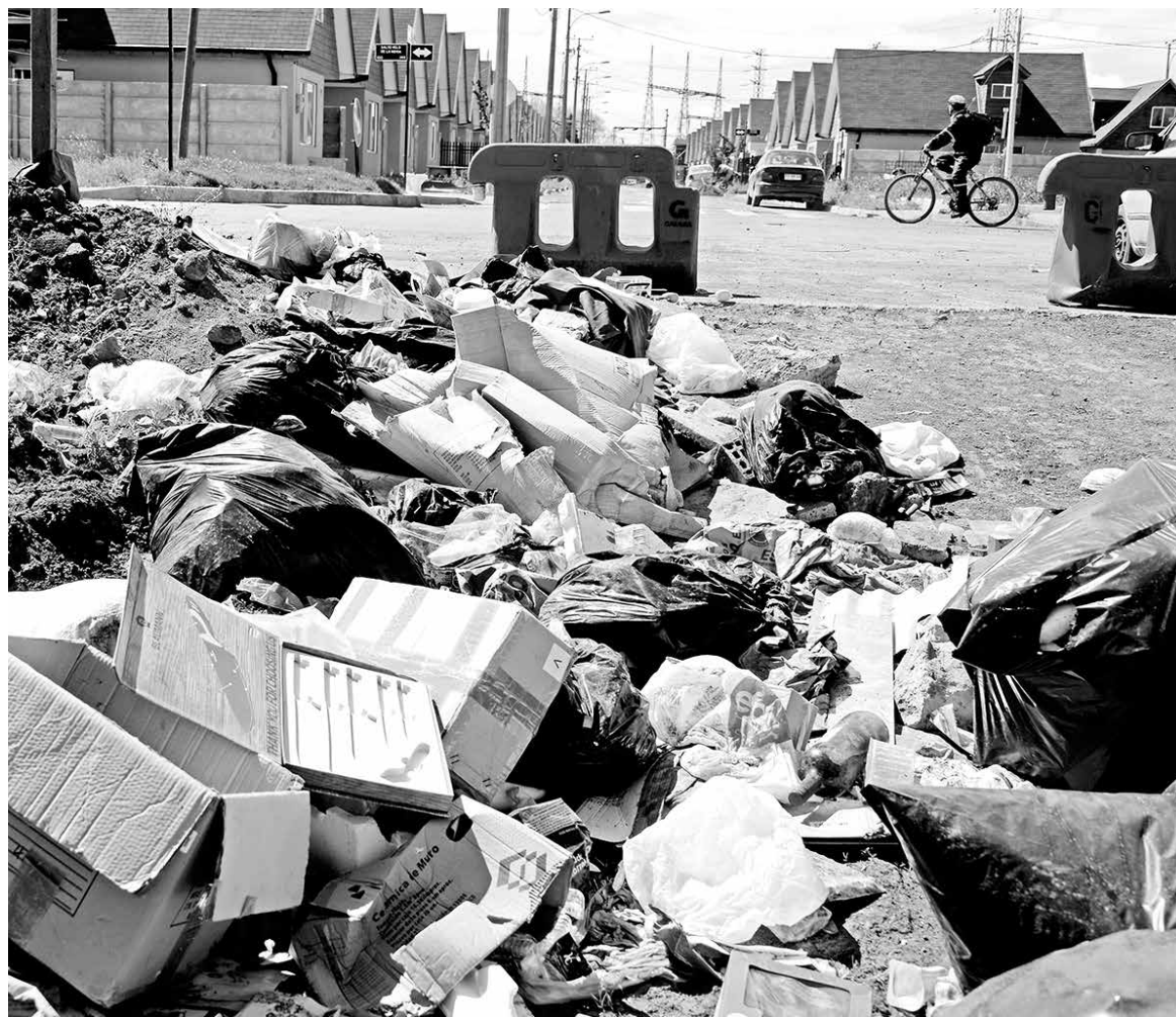
TAMBIÉN SE LOGRÓ UN ARREGLO –momentáneo- al sitio eriazos donde se acumula basura.

Fue así que la representante de la compañía aclaró que efectivamente se encuentran recepcionadas las