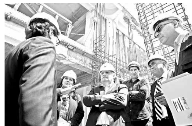
AUTORIDADES REALIZARON un recorrido por las instalaciones, constatando que se cumplan los plazos estipulados.

“Estoy muy contento por el avance de las obras, también porque se ha ido cumpliendo lo que diseñamos, en el sentido de espacios más amplios y