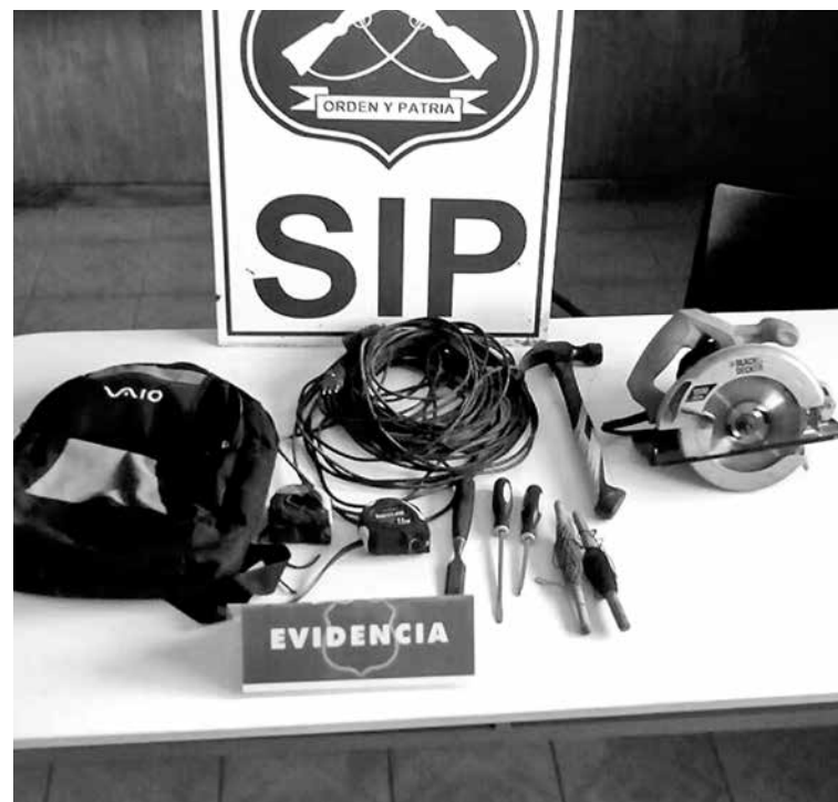
UN SERRUCHO ELÉCTRICO, huinchas de medir, formones y un alargador fueron las especies recuperadas por la SIP

Las especies recuperadas por carabineros de Mulchén fueron avaluadas en un monto cercano a los 250 mil pesos.