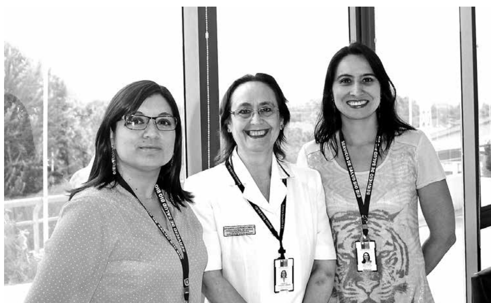
EL HOSPITAL DE SANTA BÁRBARA forma parte de los 7 hospitales provinciales acreditados por la Superintendencia de Salud.

La Superintendencia de Salud acreditó al Hospital de Santa Bárbara en cuanto a la calidad y seguridad del paciente, sumándose a otros 6 hospitales de la provincia del Biobío. De este modo, se finaliza la primera etapa de