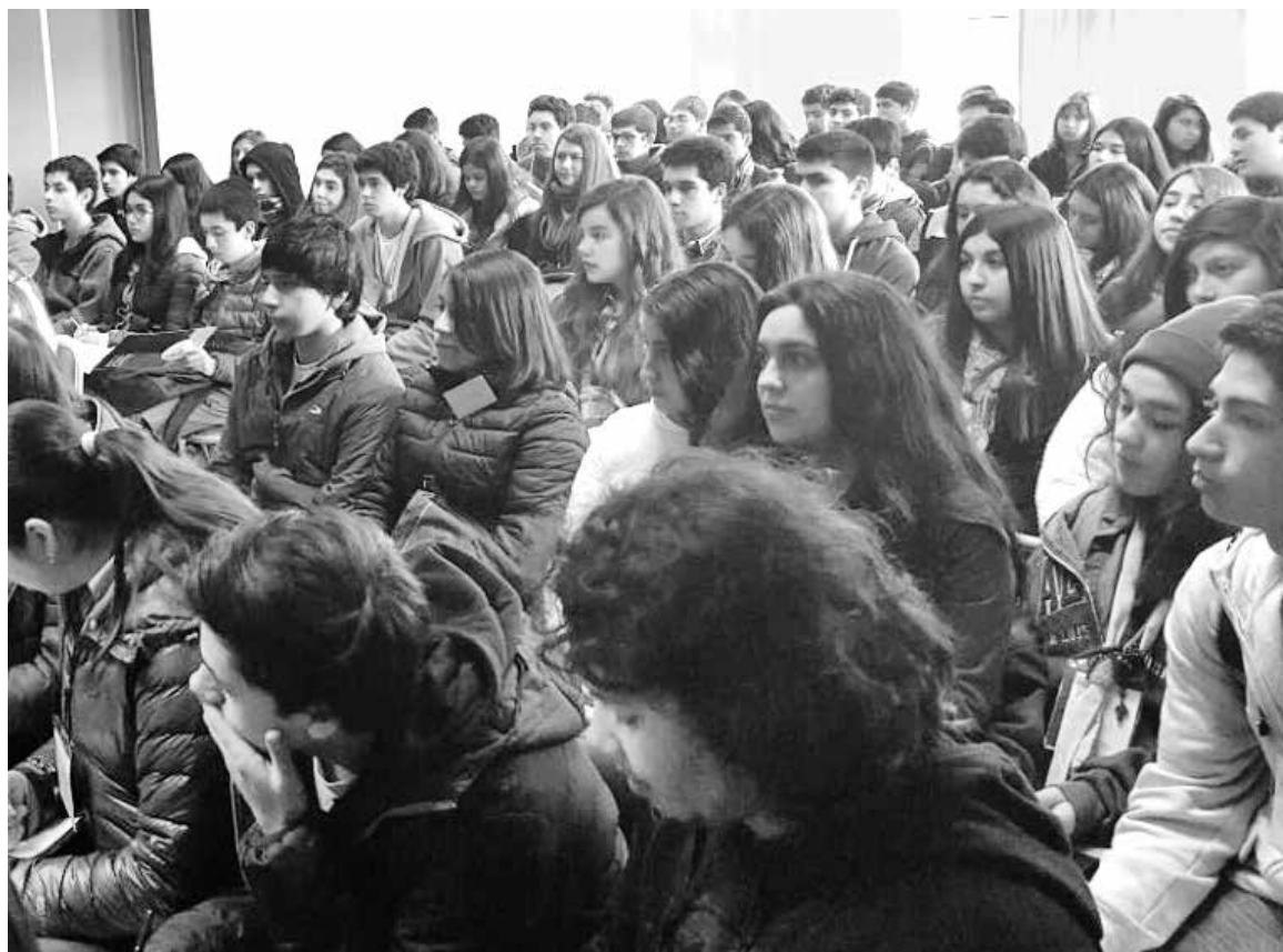
SERÁN CERCA DE 70 los jóvenes angelinos que se graduarán de la onceava Escuela Nacional de Líderes Católicos.

Los galardonados serán el senador Francisco Chahuán, por su liderazgo