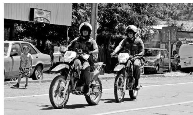
RONDA MASIVA se realizó a fin de aumentar la sensación de seguridad en la comunidad, en la comuna de Los Ángeles.

Quiroz explicó que durante esta ronda masiva se realizaron diversos servicios, especialmente preventivos, los que incluyeron controles de