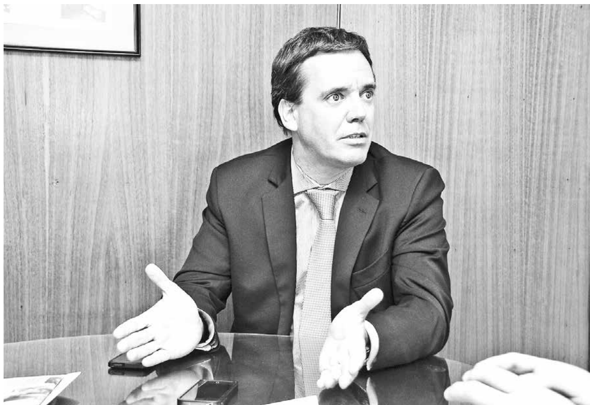
PARLAMENTARIO ASEGURÓ no sentir temor por las amenazas del mundo del agro, agregando que ellos nunca han sufragado por él.

“Creo que es evidente que la actual estructura del Código de Aguas no es la adecuada. (...) Desde el punto de vista jurídico, constitucional, el tema de la expropiación no tiene ningún fundamento. (...) Yo creo que la discusión va a ser de méritos, si es adecuada o no una nueva regu-