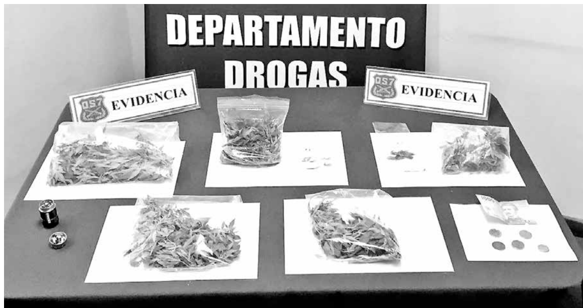
LOS 250 GRAMOS de droga incautada se traducen en cerca de 700 dosis de marihuana elaborada.

Mientras una de las mujeres fue detenida por el delito de tráfico de drogas en pequeñas cantidades, las