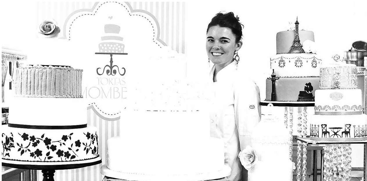
LA PROVINCIA DE BIOBÍO TIENE asignado un 22% del presupuesto en los programas Capital Semilla y Abeja Emprende.