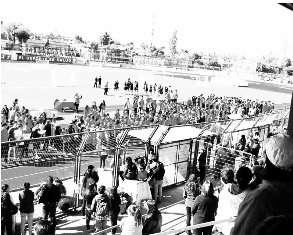
APODERADOS Y ALUMNOS se la jugaron por pasar un fin de semana entretenido.

Gran convocatoria se obtuvo, al igual que años anteriores, en esta gran instancia deportiva, que se llevó a cabo el recién pasado fin de semana.