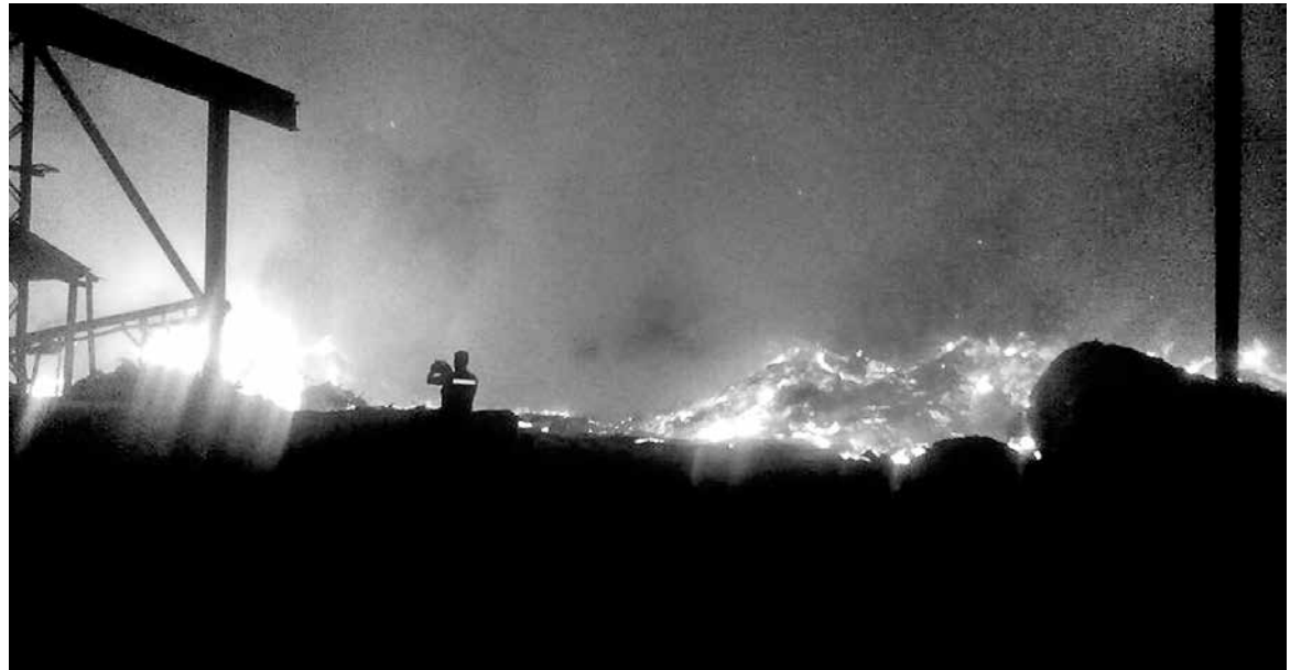
EL SINIESTRO SE INICIÓ a eso de las 23:30 horas y afectó a una empresa laminadora ubicada en la localidad de Coigüe.

En el lugar donde ocurrió la emergencia existen algunos, pero detalló que se autoriza sacar agua de ellos solamente cuando existe alguna emergencia de vivienda.