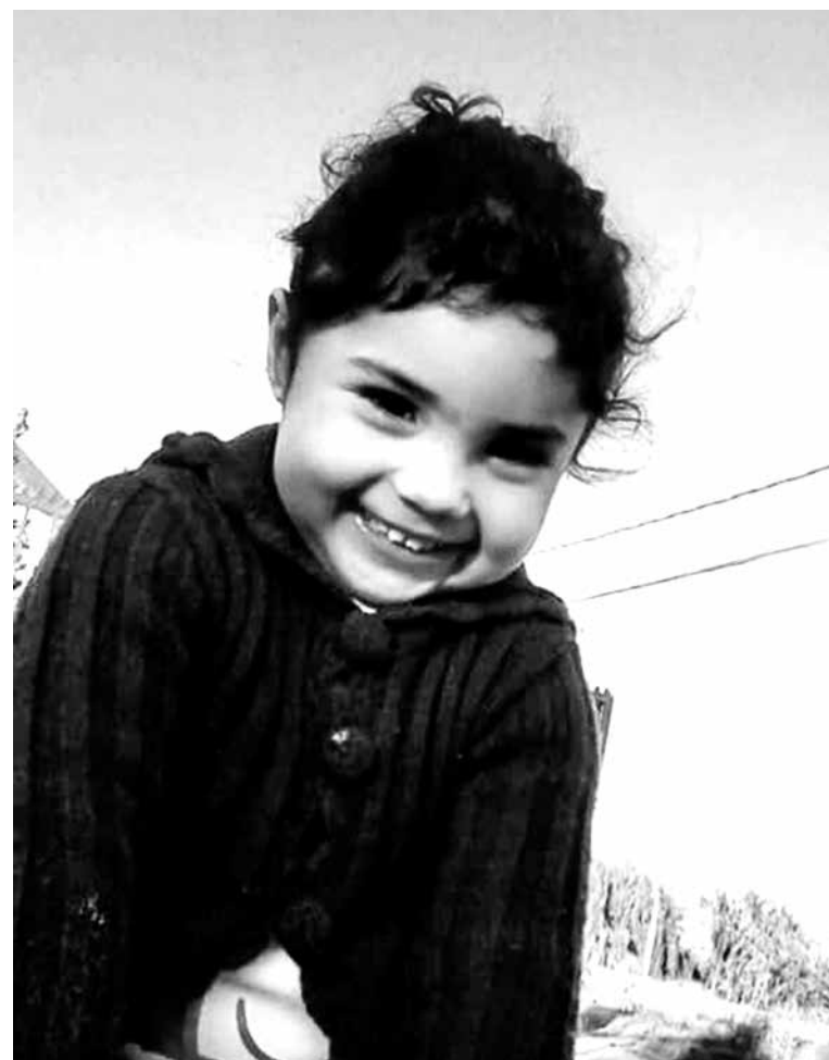
LA PEQUEÑA NECESITA que la vea algún inmunólogo o genetista. Especialistas que no se encuentran en Los Ángeles.

“Por lo mismo, ahora mi hija está pasando por un mal estado psicológico, no se quiere mirar al espejo porque se siente fea, esto es hace poco, de un día para otro cambió, no quiere hacer nada, van a la casa y se esconde en la pieza, no sale, se tapa y si sale quiere andar con polerón, pantalones, cosa que no se le vea ninguna