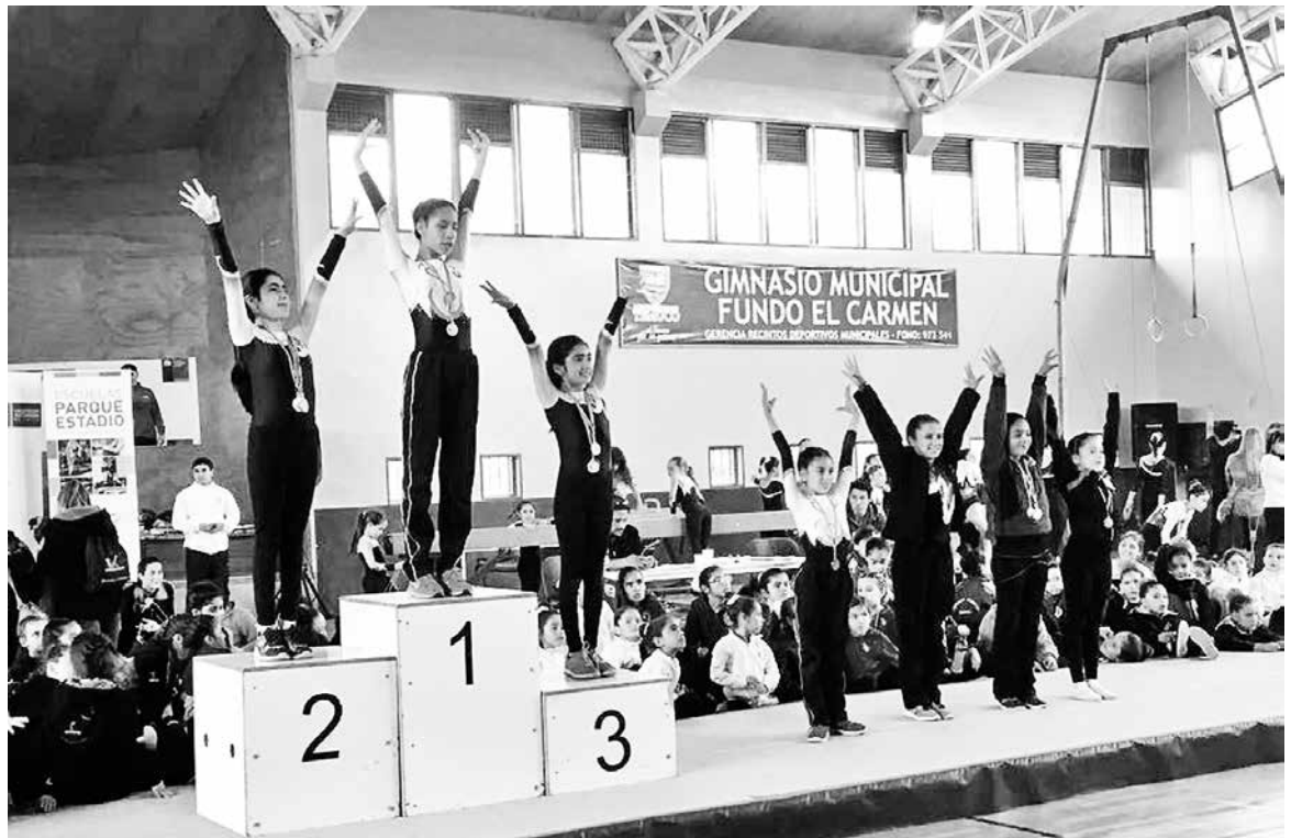
TRES COMPETENCIAS son las más próximas para el club angelino, donde deberá revalidar su gran nivel.