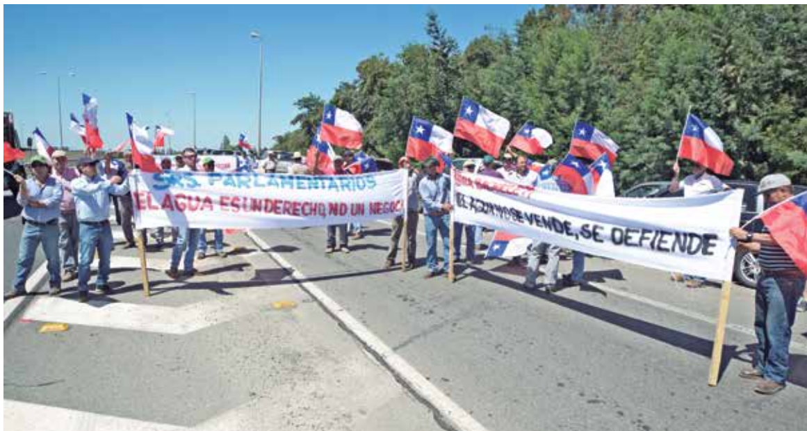
LOS EMPRESARIOS AGRÍCOLAS se mantuvieron pacíficamente a un costado de la vía, sin interrumpir la circulación vehicular.

Durante la protesta se realizaron emplazamientos a los parlamentarios locales, debido a que hoy la reforma será revisada en la