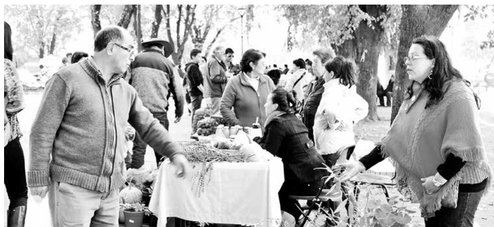
EL OBJETIVO es que el lugar acerque a los visitantes y habitantes a los productos del campo.

En la capital provincial son aproximadamente 700 los agricultores que son atendidos por el Programa de Desarrollo local de Indap, lo que la convierte en la comuna con mayor número de beneficiarios en la región, razón por la que ha sido elegida para la probable implementación de un punto de interés de comercialización de productos agrícolas.