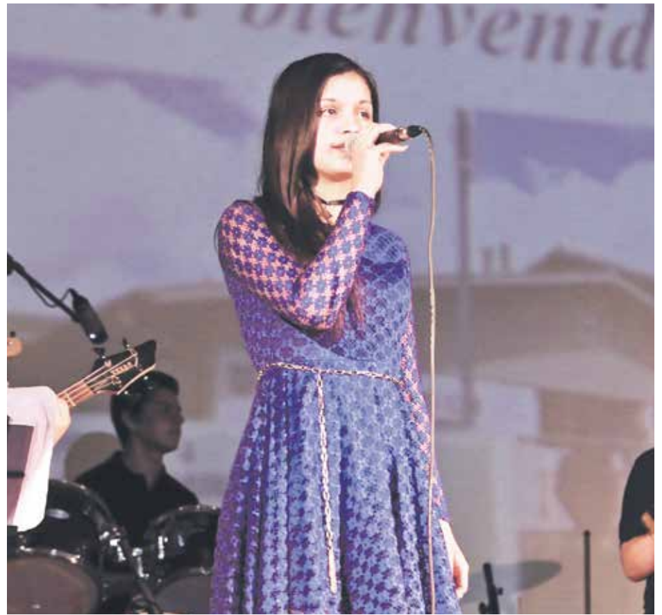
EL FESTIVAL SE EFECTUARÁ este 23 y 24 de noviembre, en dependencias de la Casa de la Cultura de Mulchén.

También expresó que el jurado de este Festival Provincial de la Canción estará compuesto exclusivamente por estudiantes,