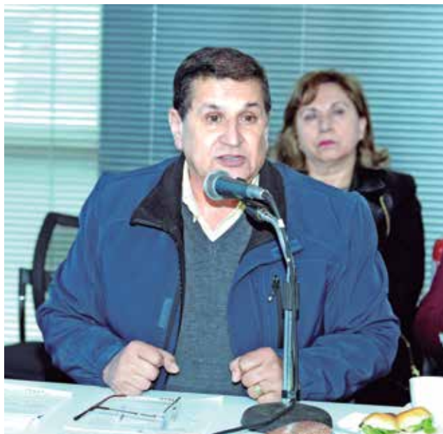
BORGÑO CONFIRMÓ que ha tenido varias conversaciones al respecto, sin embargo, está a la espera de lo que resuelva el partido.

No sólo las Presidenciales 2017 están comenzando a generar noticia en la zona y el país, sino también los otros comicios que -también- se