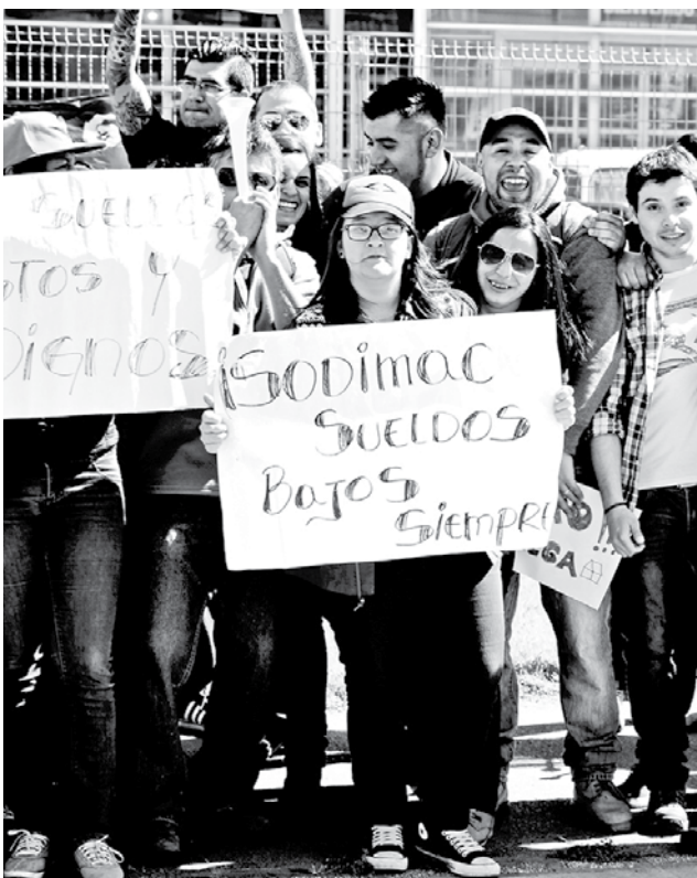
LOS TRABAJADORES DEL SINDICATO Homecenter están paralizados desde el 9 de noviembre.

Finalmente, cabe destacar que la empresa prosigue con su atención -prácticamente- normal, sustentada en los operarios de los restantes sindicatos, quienes no se encuentran movilizados.