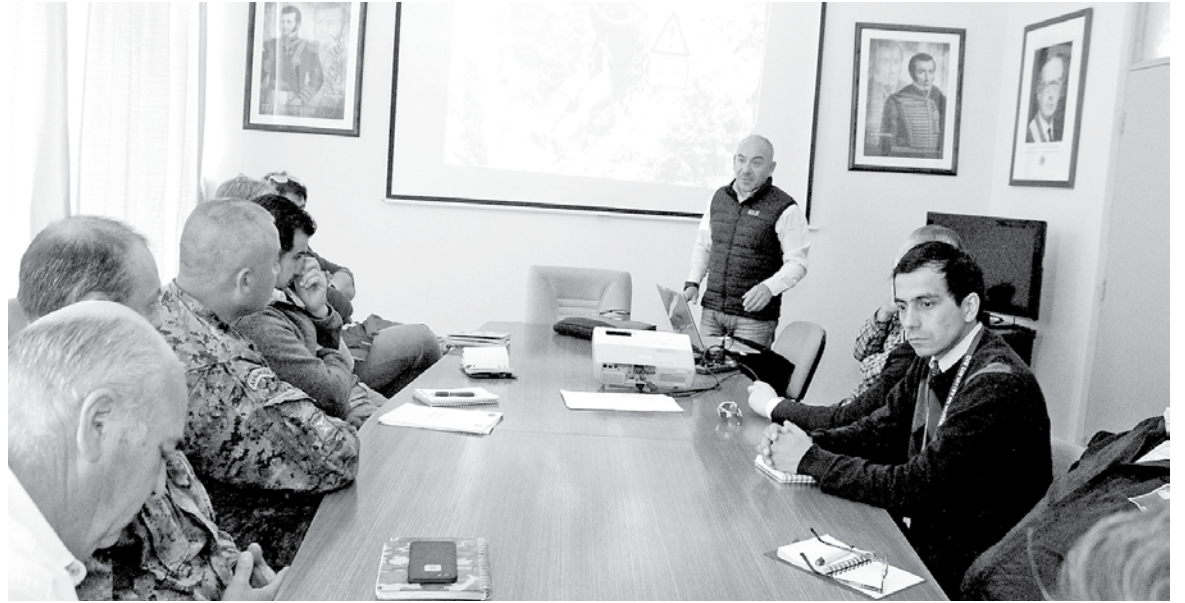
EN LA INSTANCIA EXPUSO personal del Ejército de alta montaña, entregando los principales consejos.

“Ir a la montaña no es como caminar por la ciudad, es muchísimo más peligroso. A simple vista no lo parece, por la belleza escénica, el sector, la fauna, en el caso de nosotros el lago