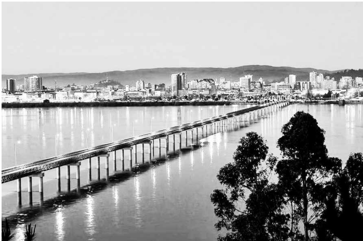
EL CONCURSO ha demostrado ser un auténtico espacio de expresión ciudadana.