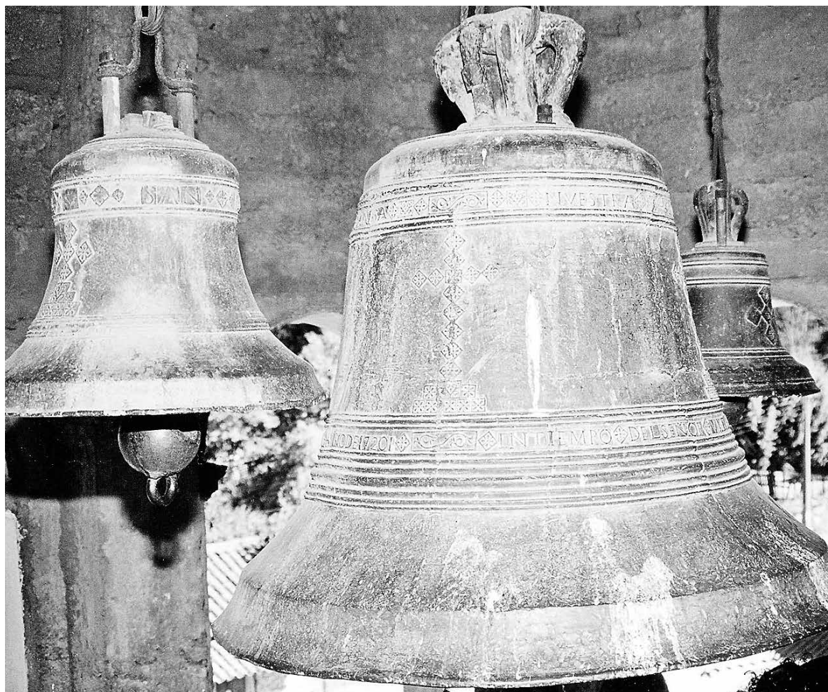
EN LA ACTUALIDAD, las campanas de oro de Rere están en un campanario de estilo gótico construido en la década de 1920.

Desde Madrid, España, llegó a Rere el padre Juan Pedro Mayoral a educar a los habitantes del lugar. Según cuenta la historia, Mayoral