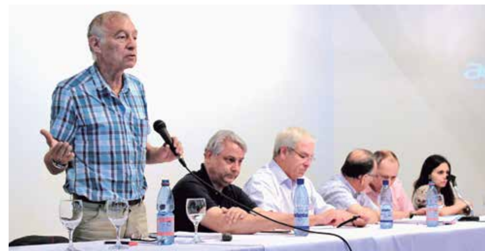
REGISTRO DE LA REUNIÓN sostenida en Los Ángeles por la Comisión de Agricultura y el director General de Aguas.

Cabe destacar que en este cuerpo legal, el principio rector era que el agua formaba parte indisoluble de la propiedad de la tierra, sin contemplar la figura legal del derecho de aprovechamiento.