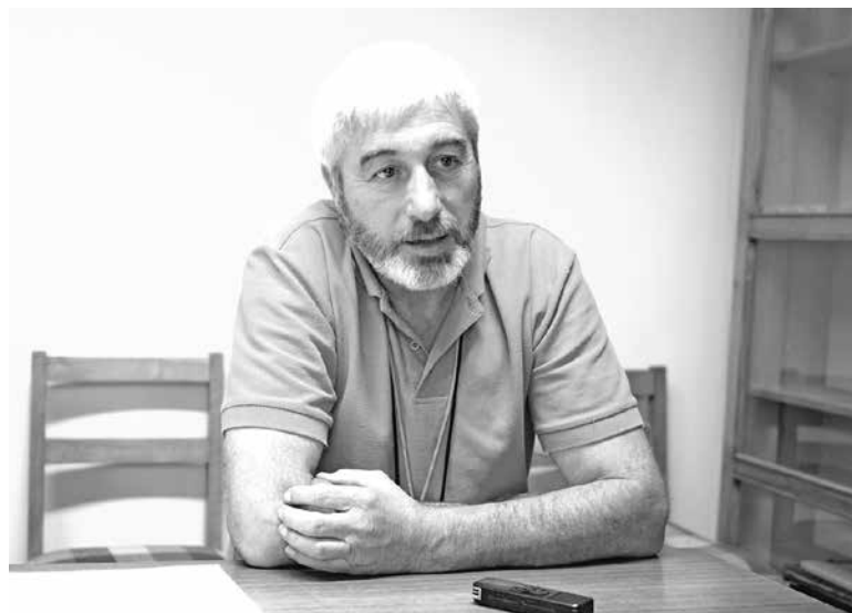
EL ACTUAL PRESIDENTE provincial del Magisterio no fue a la reelección, dándole la oportunidad a la aparición de nuevos dirigentes.

De manera similar a lo ocurrido a nivel nacional, en la zona también se impuso la Lista C, que agrupa a los disidentes al actual presidente nacional del Colegio de Profesores, quedándose con todo el directorio del Magisterio en la provincia.