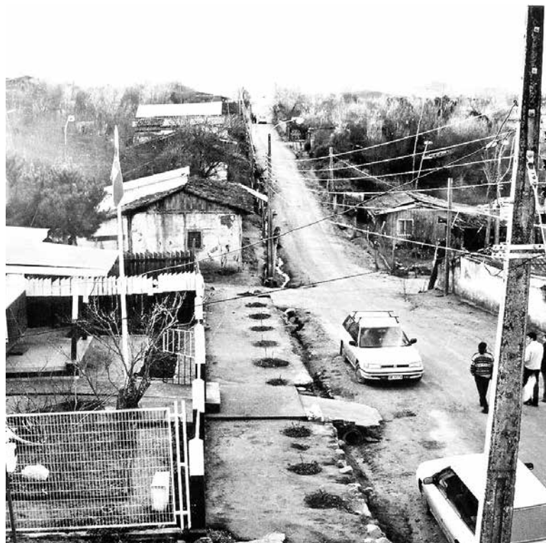
VISTA DE RERE desde el campanario.

Esto contempla la lápida de la tumba del padre Juan Pedro Mayoral, las palmas chilenas, las campanas de oro y la Torre Campanario.