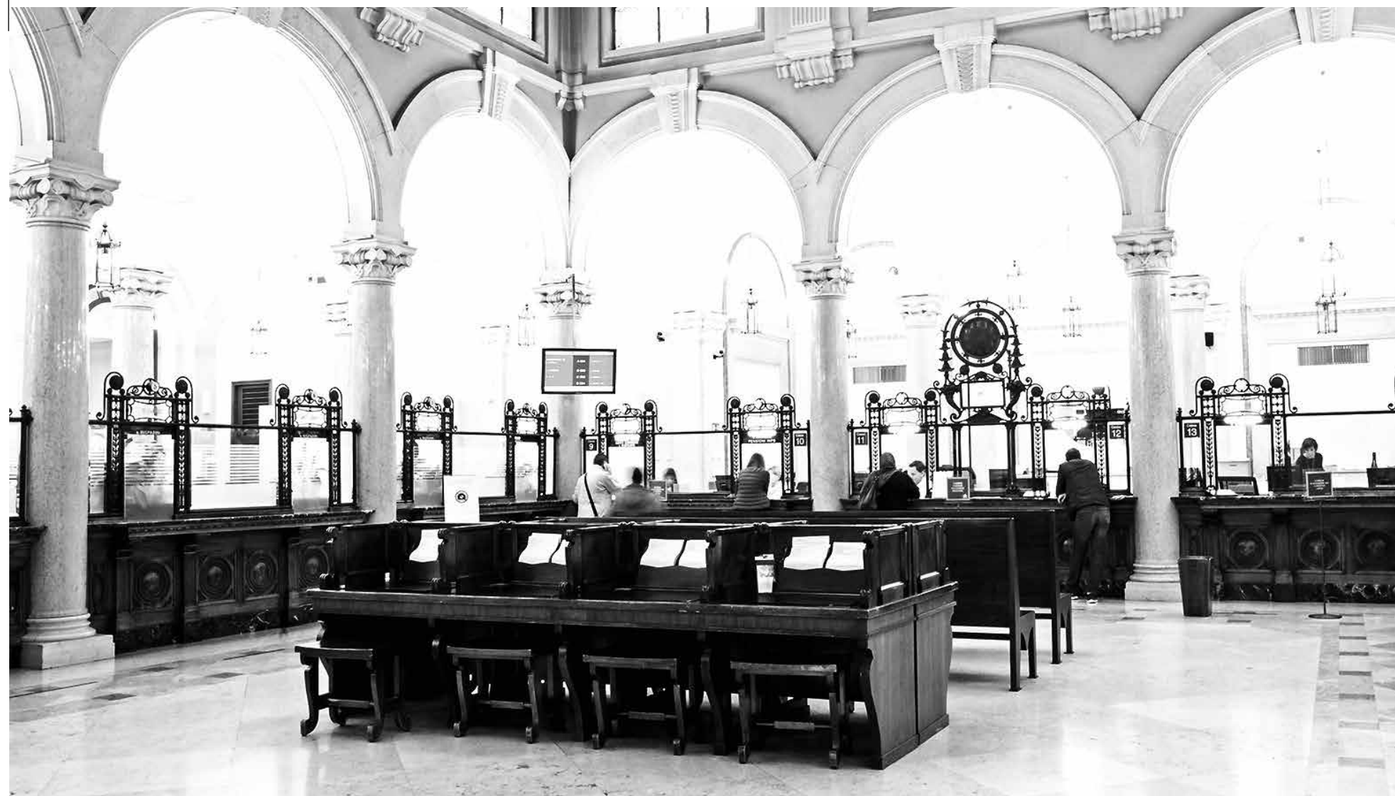
UBI es una de la mayoría de los bancos italianos que están atrapados en un enigma que enfatiza la austeridad, limita los déficits presupuestarios y hunde la economía del capital. Y no está mejorando.

Peter S. Goodman / © 2016 New York Times News Service