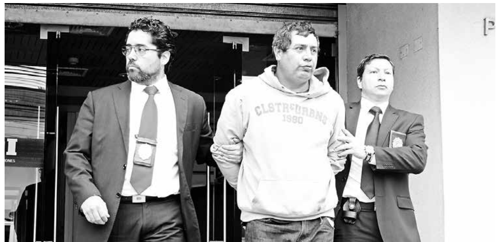
EL PRINCIPAL SOSPECHOSO en el caso fue detenido la madrugada de este viernes en la comuna de Santa Bárbara.

Las indagaciones realizadas habrían permitido establecer que no existía una relación entre víctima y agresor, lo cual hizo compleja las labores investigativas. Por lo mismo, los detectives de esta unidad