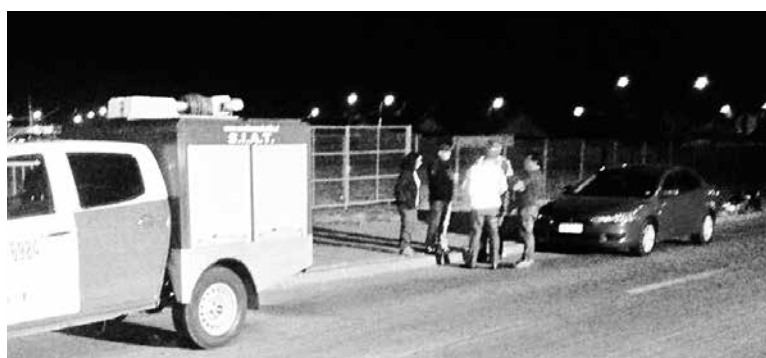
LAS DILIGENCIAS FUERON encabezadas por personal de la SIAT de Carabineros y la Seremi de Transportes y Telecomunicaciones.

El oficial agregó que -al infringir esta normativa- los vehículos fueron retirados de circulación y puestos a disposición del tribunal respectivo.