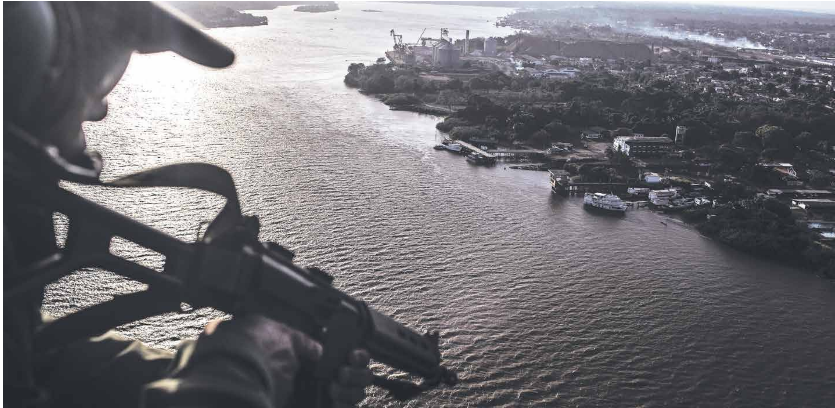
UN SOLDADO DEL GRUPO AÉREO TÁCTICO, patrulla un canal cerca del puerto de Santana en Brasil, el 27 de octubre de 2016. A medida que la población en la Amazonía aumenta y las bandas de narcotraficantes expanden su dominio sobre la región, las oportunidades de secuestro en los barcos fluyen y las fuerzas policiales están luchando para mantenerse al día con el crimen.