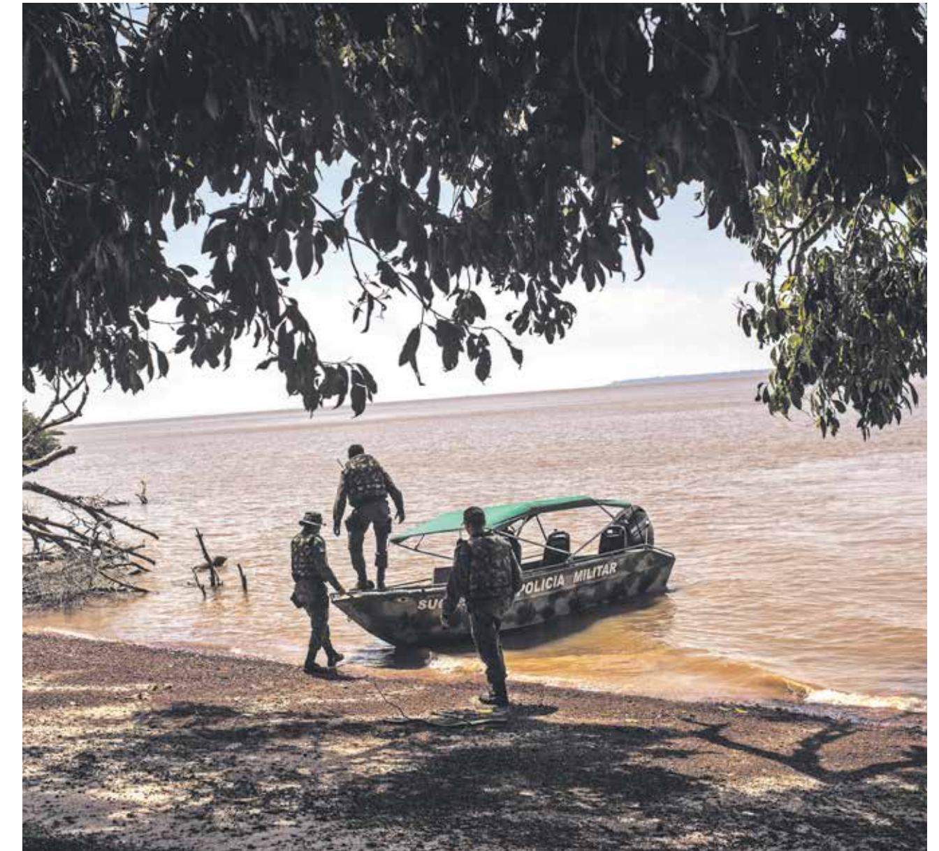
LOS POLICÍAS MILITARES regresan a su embarcación después de revisar una playa fluvial para alojarse ilegalmente cerca del río Amazonas, cerca de Macapá, Brasil, el 26 de octubre de 2016.