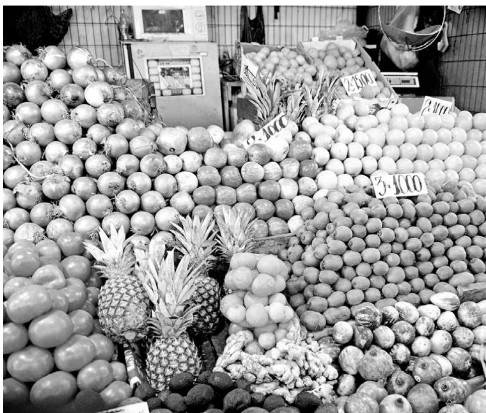
ASPECTOS ESTACIONALES que influyeron en las ofertas de varias frutas explicaron las alzas de sus precios.

En esta sexta versión, se trasladaron a Valparaíso donde participaron 78 estudiantes acompañados de sus profesores.