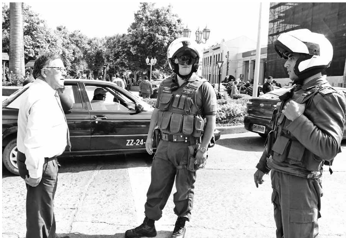
REGISTRO DEL MINUTO de tensión entre el dirigente de los taxistas con la autoridad policial.

Cabe mencionar que -según Carabineros- el permiso era para