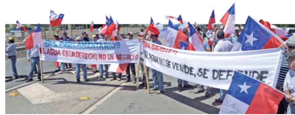
REGISTRO DE LA MANIFESTACIÓN realizada -hace algunas semanas- por representantes del mundo agrícola y de los canalistas.

Con la finalidad de conocer las principales modificaciones de la reforma, se recogió la exposición realizada en enero pasado en la zona, cuando la Comisión de Agricultura sesionó en Los Ángeles, con presencia del director general de Aguas, Carlos Estévez. En ese sentido, se estableció -en dicha oportunidad- que el espíritu central de la reforma es priorizar el agua para subsistencia, en desmedro de la explotación industrial del recurso, todo en el contexto de crisis hídrica por la sequía y el calentamiento global. Debido a ello, se planteó que la disposición pretenda ser más férrea en la protección de áreas de importancia ambiental; como humedales, glaciales y áreas protegidas, entre