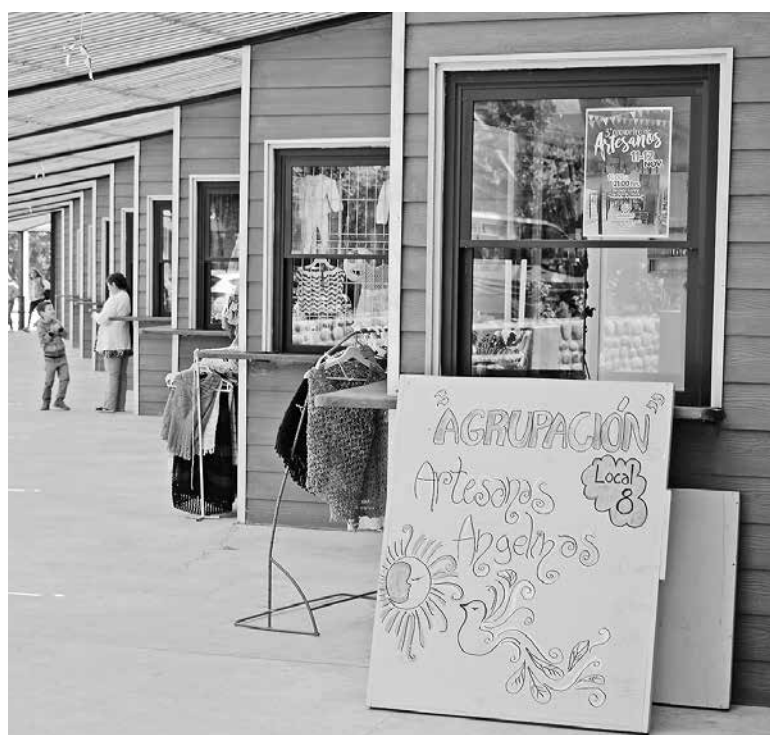
LA ACTIVIDAD DE DESARROLLARÁ en el bandejón central de avenida Ricardo Vicuña, donde existen 17 locatarios.