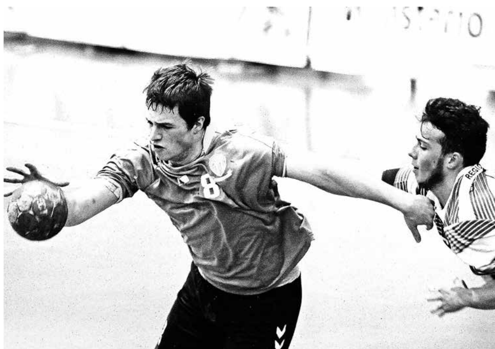
EN TANTO, LA CATEGORÍA adulta resta por disputar un último partido en la liga chilena.

Se desarrollará del 2 al 4 de diciembre en dependencias del Polideportivo de la capital de la sexta región, donde se enfrentarán los mejores clubes federados del país.