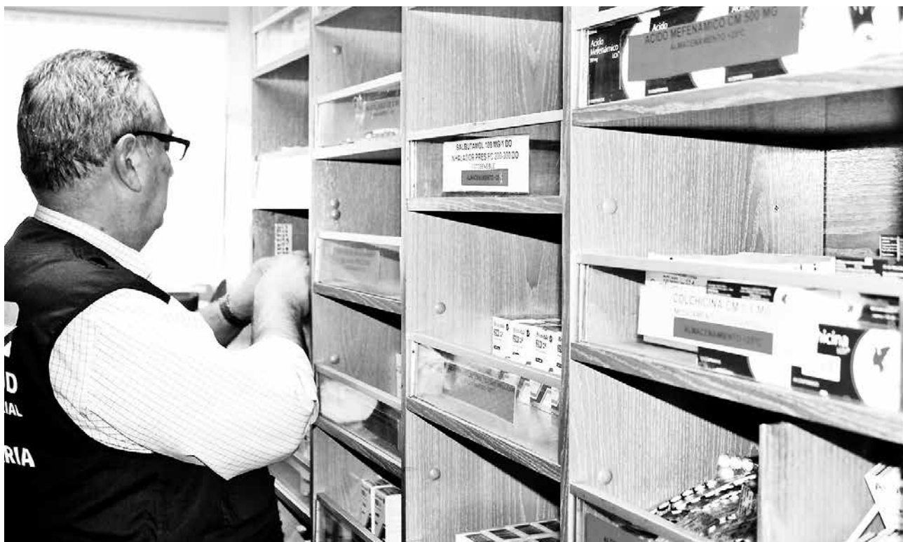
DEL TOTAL de las inspecciones, 78 de ellas corresponden a farmacias.

Cabe destacar que las fiscalizaciones realizadas han dado origen a 15 sumarios sanitarios, 11 radicados en farmacias, 3 en centros de diálisis y 1 en ELAM.