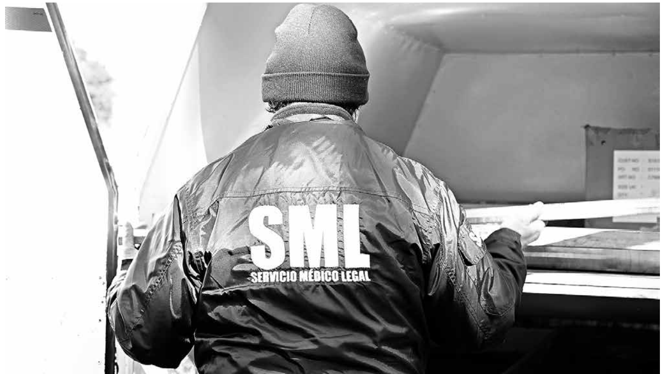
EL HOMBRE FALLECIÓ tras perder el equilibrio y caer a un canal.

De ellas, 114 corresponden a controles de identidad; 15 fiscalizaciones a locales de alcoholes; 440 controles vehiculares; 10 entrevistas