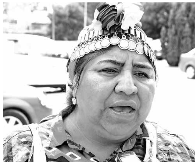
LA WERKÉN acudió a las instalaciones de La Tribuna, con el objetivo de hacer público -en detalle- su reclamación.

Vale mencionar que durante la jornada de hoy se conocerán las primeras sentencias emanadas del TER.