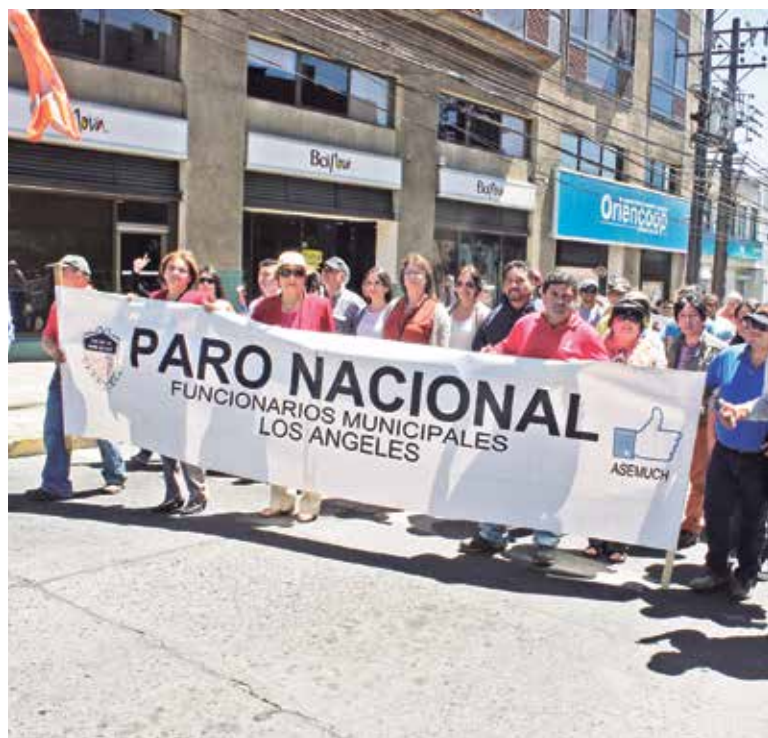
TAN SÓLO AYER LOS TRABAJADORES fiscales desarrollaron una marcha por pleno centro de Los Ángeles.

PARLAMENTARIOS POR LA ZONA TUVIERON UN DISPAR PRONUNCIAMIENTO