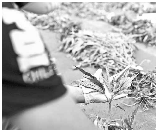
DE HABER alcanzado su producción óptima en su fase adulta, se podrían haber obtenido un total aproximado de 315 mil dosis.

Éstas se encontraban ocultas en medio de un bosque nativo inaccesible y abarcaba una superficie aproximada de media hectárea.