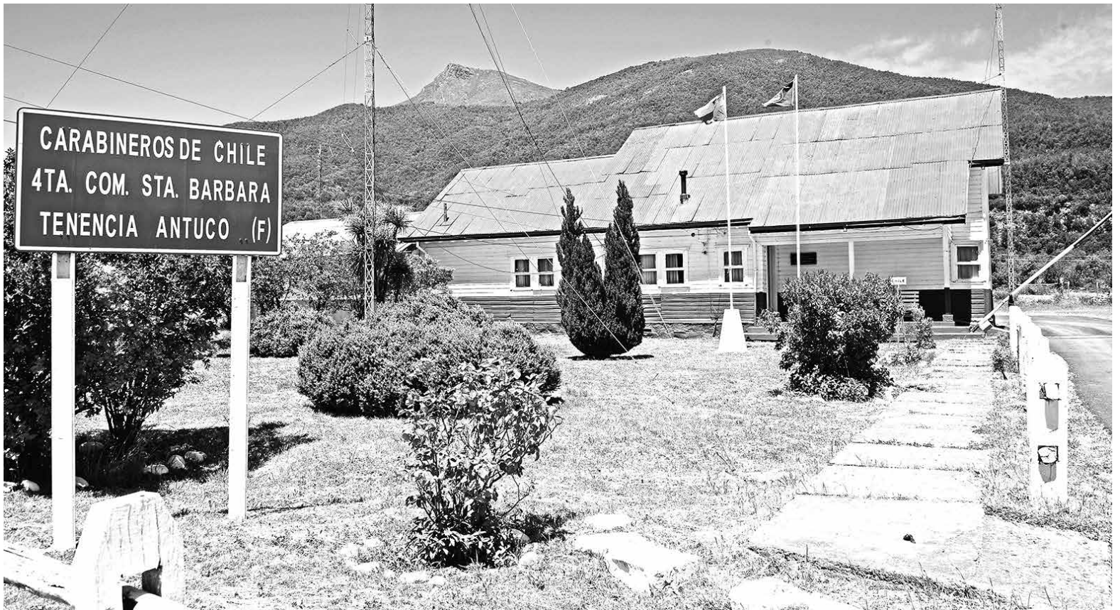
LAS LABORES DE BÚSQUEDA concluyeron con éxito durante la tarde de este martes.

Asimismo, detallaron que eran especialistas en esta materia, que la