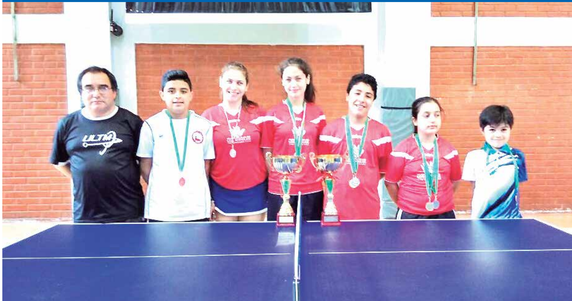
A PESAR DE LO AJENO a lo deportivo, siguen destacando los resultados de los jugadores.