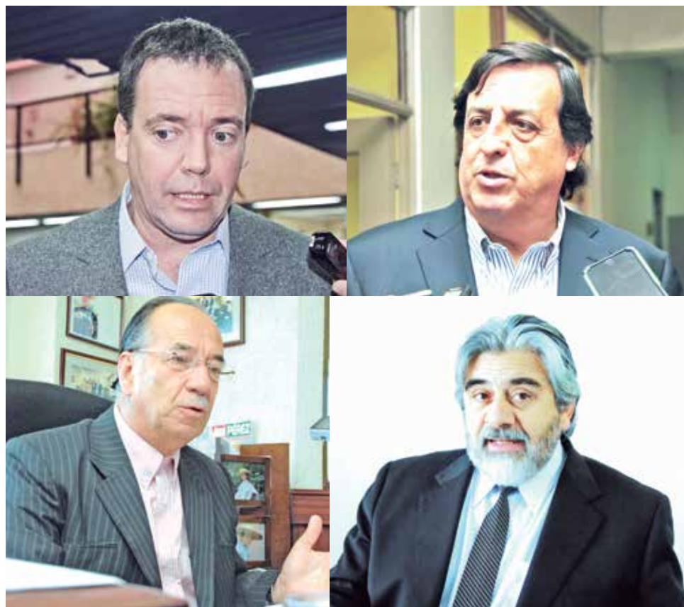
JEFE COMUNAL ELECTO resaltó que si no se prioriza la zona, es consecuencia que los parlamentarios locales no han motivado una mirada distinta.

Ñuble es una provincia que está creciendo. No quiero caer en el tema que Biobío es el patio trasero de la región, sino más bien enfatizar que es responsabilidad de los parlamentarios, que nuestra zona sea vista con una mirada dis-