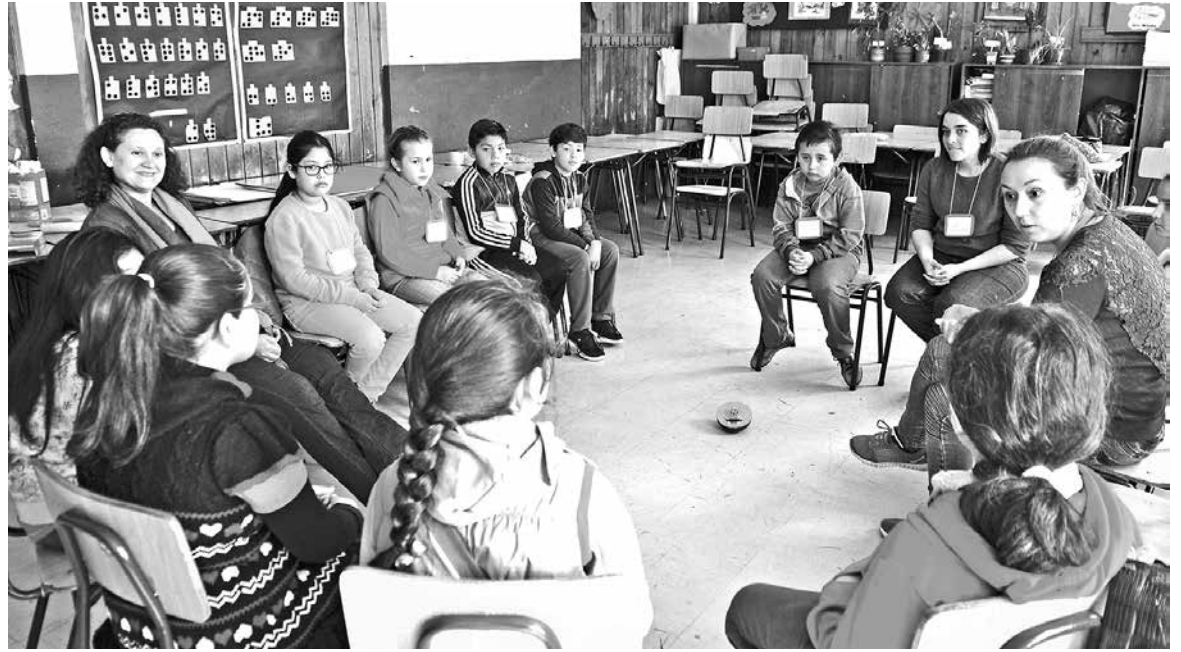
LA INSTANCIA FORMATIVA tiene por objetivo motivar a los/as participantes a considerar nuevas posibilidades metodológicas que estimulen el desarrollo de la creatividad.

El seminario se desarrollará el próximo martes 15 de noviembre, entre las 9 y 17 horas, en dependencias del Auditorio Manuel Riosco Vásquez de la Universidad de