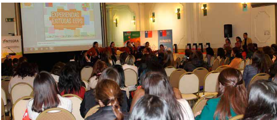
EN LA CAPITAL REGIONAL se llevó a cabo una ceremonia con todos los establecimientos adheridos a la medida.