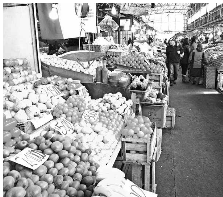
EN LO QUE VA DEL AÑO, el IPC lleva acumulando 2,9%.

Ocho de las doce divisiones que conforman la canasta consignaron incidencias positivas y cuatro presentaron incidentes negativos.