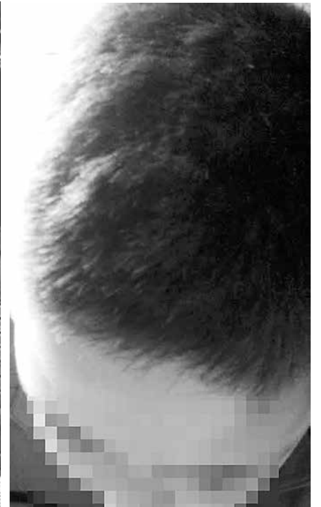
IMAGEN DEL ANTES Y DESPUÉS el muchacho que sufrió la -supuesta- vulneración de sus derechos.

progenitora efectuó una denuncia formal a la Superintendencia de Educación el pasado lunes, con la finalidad que se investigue el hecho.