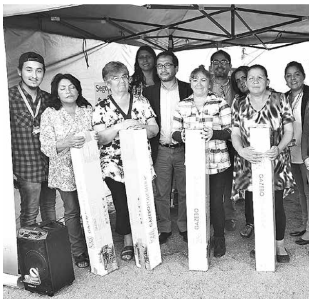
EL PROYECTO se concretó gracias a las propuestas de la propia comunidad.

La iniciativa es un gesto sencillo pero que dará gran apoyo a estos emprendedores, especialmente en el periodo estival.