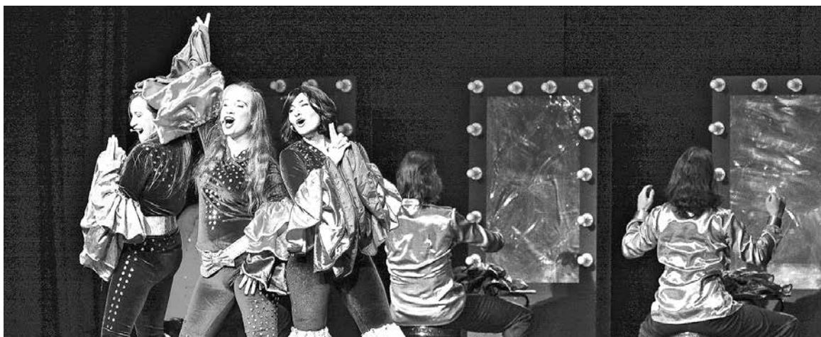
“EL REY LEÓN”, “Los Miserables”, “Jesucristo Superestrella” y más fueron parte del espectáculo que cautivó a 800 personas.