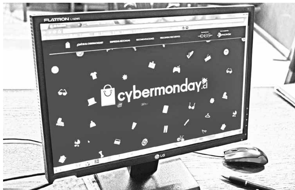
HOY, tras varias versiones, el número de empresas inscritas suman 140.

Finalmente, Bustos añadió que la frase “vacaciones para todos”, también se suma a este fenómeno. “Cada vez más chilenos disfrutan de sus días libres en destinos fuera de los límites nacionales, y este viaje, ya no necesariamente se planifica en época estival, es por ello que la posibilidad de obtener pasajes de avión y estadías con un buen descuento es aprovechada por muchos