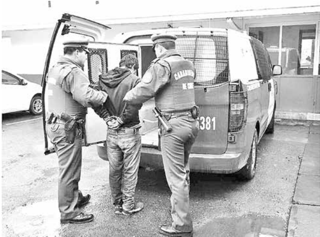
EL HOMBRE fue detenido mientras Carabineros realizaba un patrullaje preventivo por calle Balbino Sanhueza.

J.A.V.M. fue dejado en libertad a la espera de citación por parte de la Fiscalía Local de Los Ángeles.