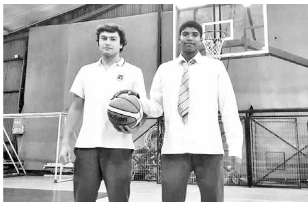
AMBOS DEPORTISTAS angelinos están en segundo medio del colegio Alemán.

El básquetbol angelino ha surgido mucho durante los últimos cinco años, pero también ha crecido en términos del trabajo de cada establecimiento educacional, gracias al espíritu competitivo que surge por los Juegos Escolares.