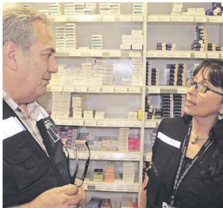
LA FISCALIZACIÓN BUSCA verificar el cumplimiento de la Ley nacional de fármacos y garantizar productos de calidad.

El incumplimiento de la normativa, conlleva sanciones que van desde 4 a 63 UTM e incluso la clausura del local.