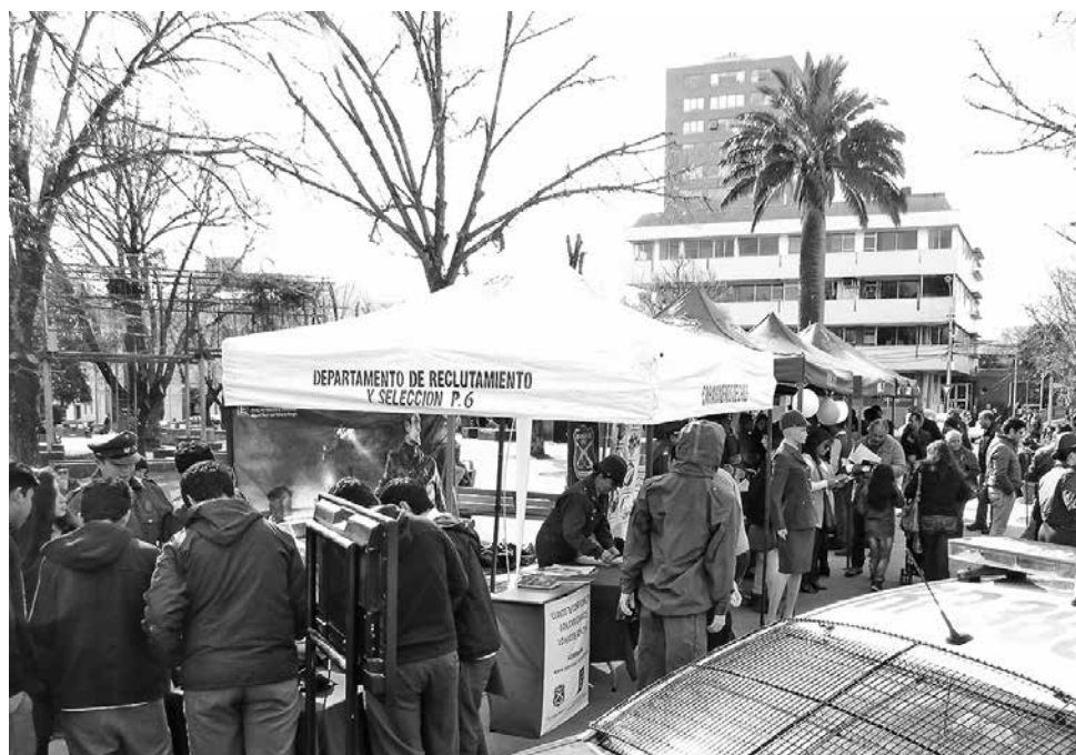
JORNADA SE DESARROLLARÁ el próximo miércoles 16 de noviembre, desde las 9:30 horas en la Plaza de Armas de Los Ángeles.

La actividad busca difundir la carrera policial y captar nuevos postulantes para su Escuela de Formación "Alguacil Mayor Juan Gómez de Almagro".