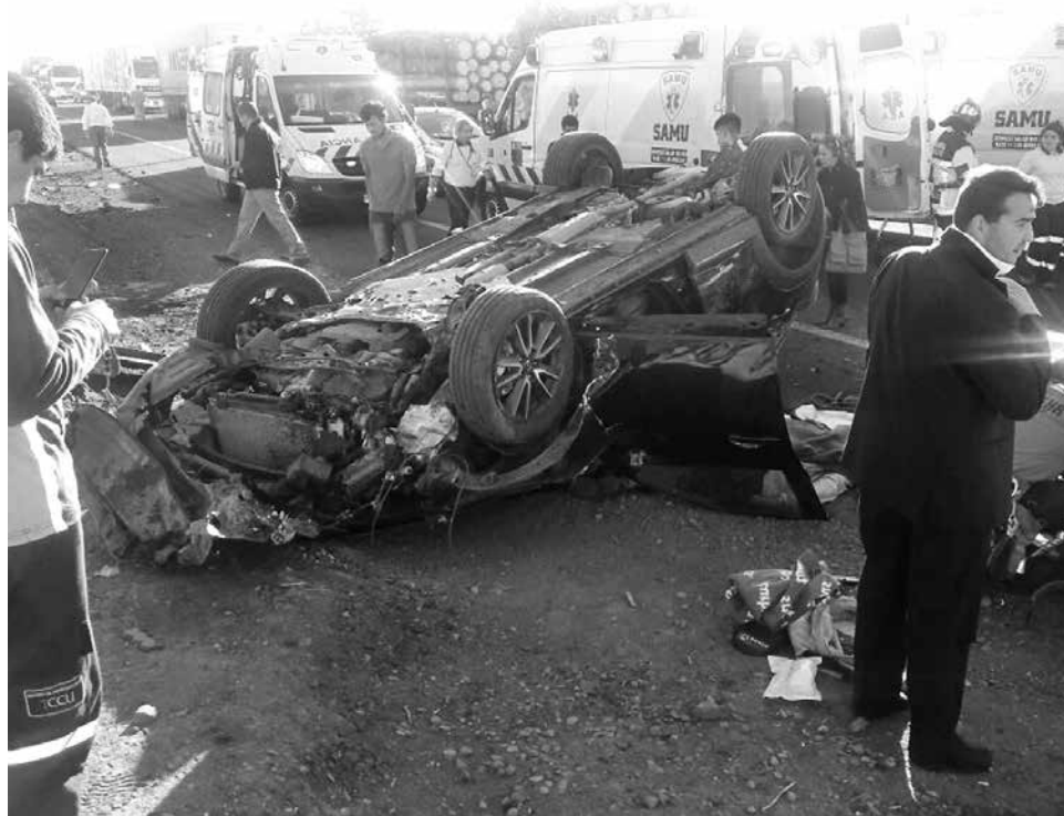
ACCIDENTE se registró cerca de las 18:45 horas, a pocos metros del peaje, camino María Dolores.

Producto de lo mismo, el móvil volcó a un costado de la ruta, donde lamentablemente "resultó una persona fallecida y cuatro personas lesionadas. Al momento, no sabemos si hay participación de más vehículos o no. Eso es materia de investigación", relató el subcomisario administrativo de Carabineros de Los Ángeles, capitán Ramiro Lobos.