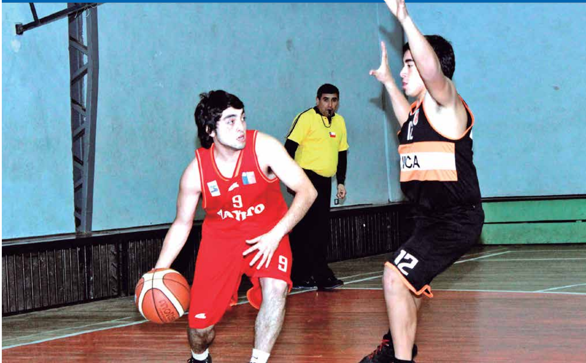
EL BÁSQUETBOL VIVIRÁ su jornada final a partir de las 10 de la mañana de este domingo.