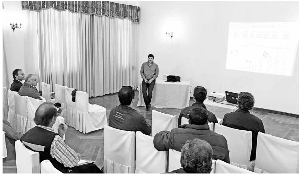
AGRICULTORES piden mayor apoyo del Estado mediante subvenciones.

Asimismo, el profesional agregó que en antes no había tanta importación de trigo, razón por la cual, se podía mantener un nivel de precio nacional, pero, a medida que los volúmenes fueron bajando y las importaciones creciendo, el precio del trigo ha ido disminuyendo con un techo de casi de $140 pesos el kilo, es decir $140 mil el quintal, y eso, ubicado en los mejores esce-