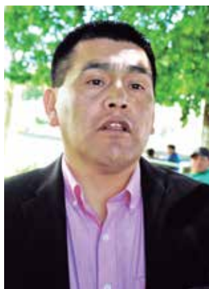
JEFE COMUNAL calificó mala intención tras la denuncia en la comuna cordillerana.