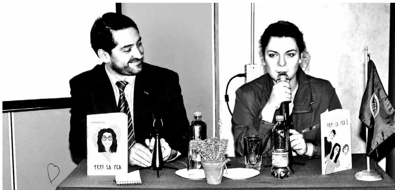
ESTE JUEVES a las 10:00 horas se llevó a cabo el lanzamiento de la séptima versión de Biobío Lee.