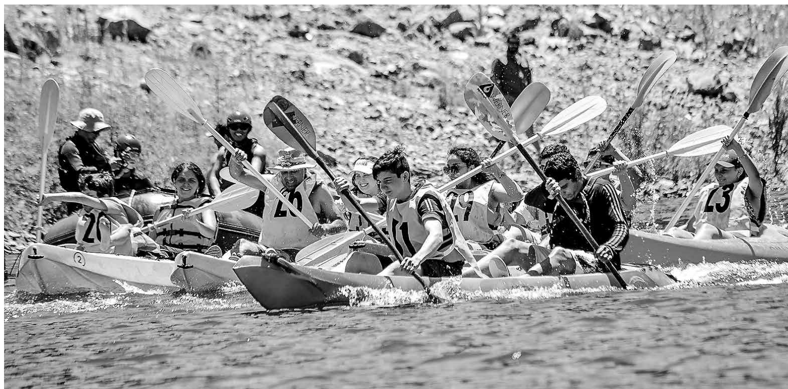
ANGOSTURA NUEVAMENTE será la sede del kayak local, cuando reciba a más de 50 competidores de la zona.

Además, añadió que “a la fecha llevamos cerca de 50 personas inscritas, ahí se pueden inscribir en la página web angosturabiobio.cl, y las