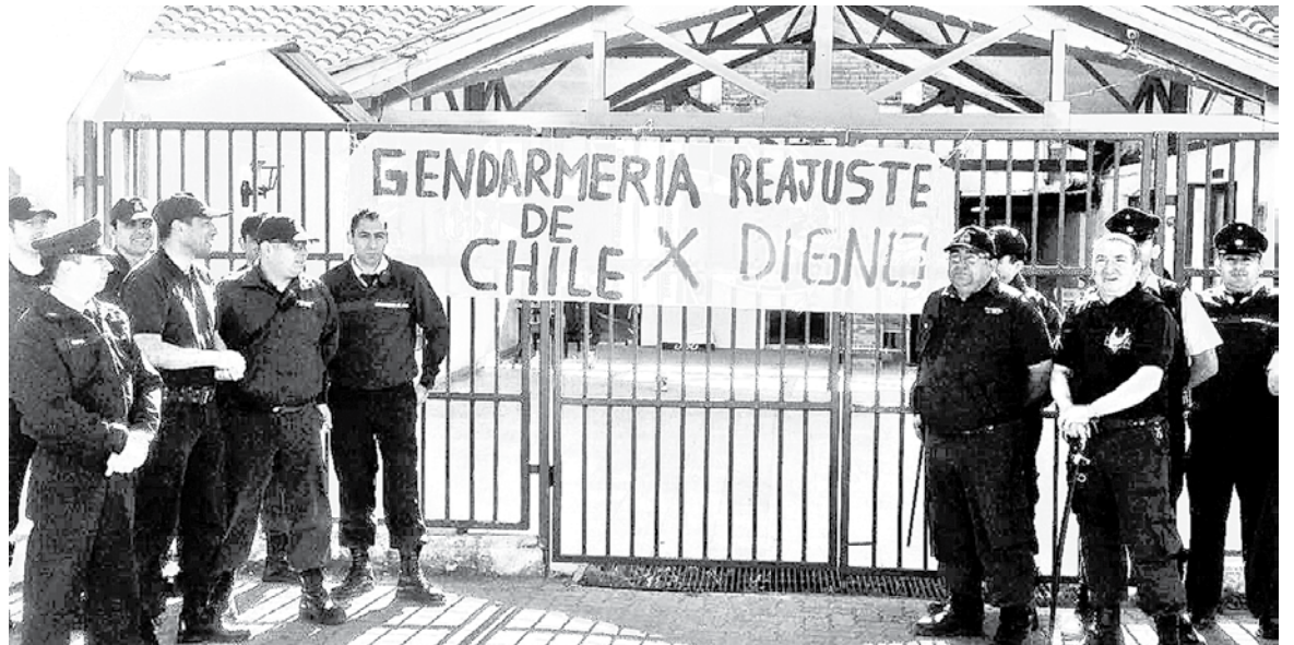
MANIFESTACIÓN de Gendarmería en el frontis de la Cárcel de Yumbel.

“Hoy (ayer) día partiremos con una jornada de reflexión, reuniéndonos con nuestros colegas en los diferentes centros penitenciarios de la zona. Vale mencionar que esto