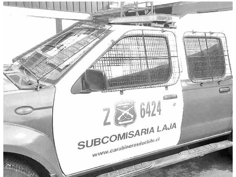
LAS DILIGENCIAS fueron encabezadas por personal de la Subcomisaría de Carabineros de Laja.

Al efectuar las consultas correspondientes, quedó al descubierto