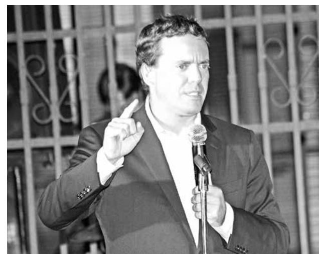
SE TRATA de más de 560 mil millones de pesos.

“Por eso, pido a la Presidenta Bachelet, que destine los 560 mil millones de pesos que contenía el reajuste a los trabajadores del sector público, para las pensiones más bajas del país”, concluyó Harboe.