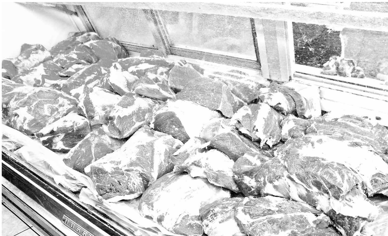
HABRÍA MAL MANEJO sanitario de los animales durante su crianza.

La empresa aludida señaló que en el país de origen se detectaron lesiones similares, atribuibles a un manejo sanitario de los animales durante su crianza y vacunación; mientras el Minsal sostuvo reunión con el Laboratorio de Parasitología del IPS para definir los procedimientos analíticos a seguir.