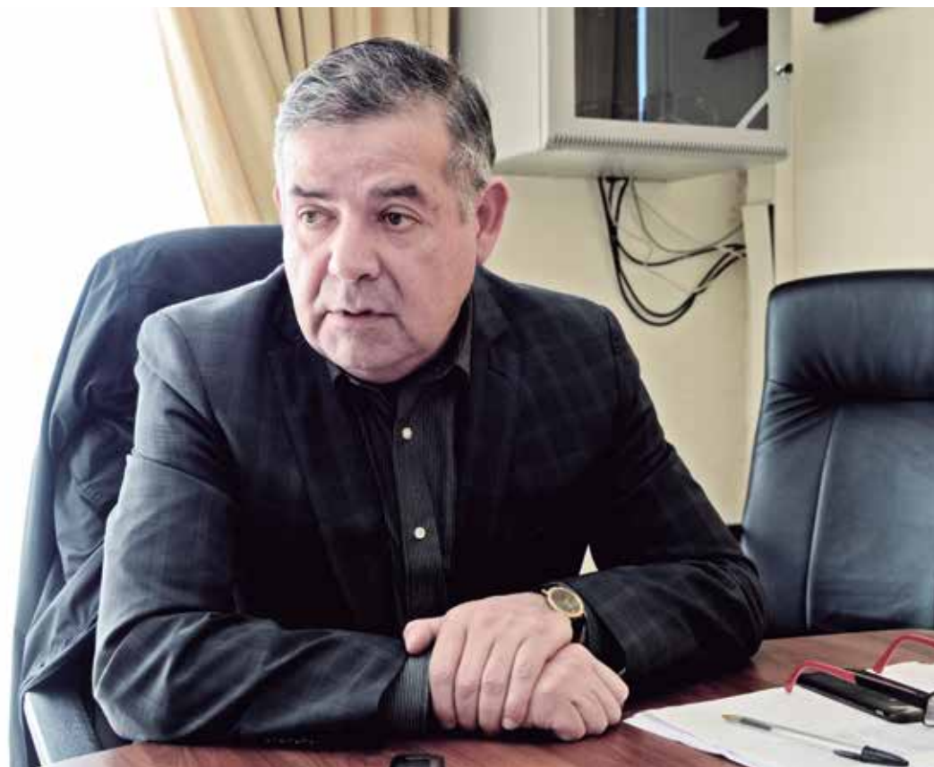
LOS EMPLEADOS FISCALES efectuaron una nueva marcha por la capital provincial.

Vale recordar que esta ofensiva de las autoridades comunales, se entiende en que la provincia de