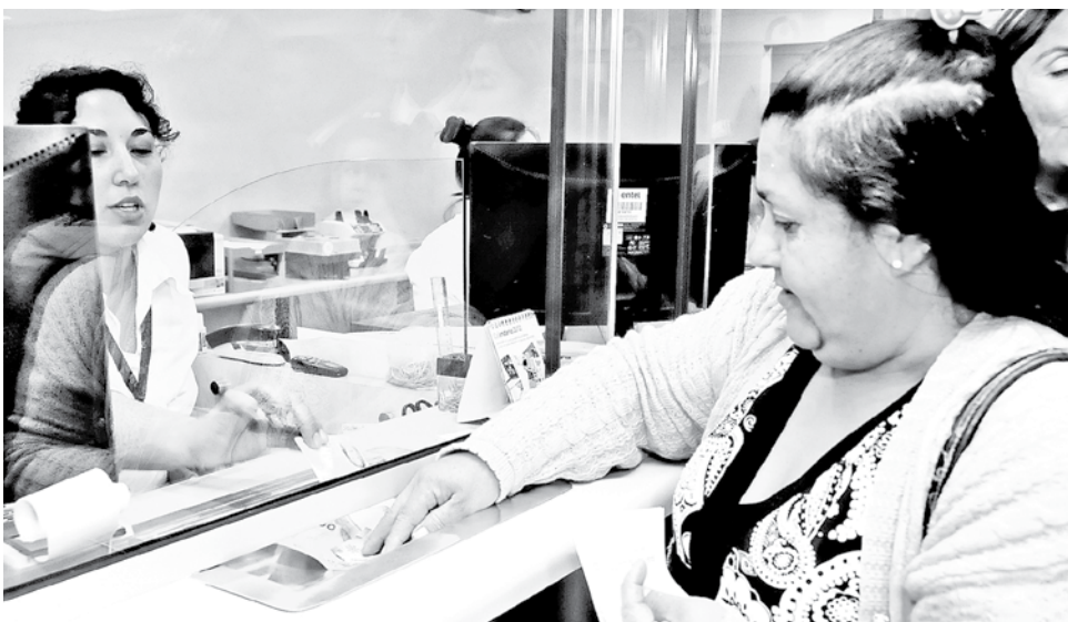
UNA DE LAS MANERAS de conocer si es uno de los beneficiados, es acudir directamente con su carnet a la Caja Los Héroes.

Con la finalidad que no pierdan el beneficio, desde el Instituto de Previsión Social, IPS, llamaron a sus usuarios a informarse si se encuentran dentro de los asignatarios del