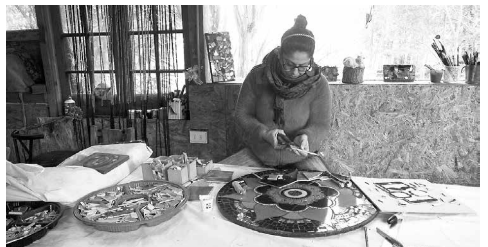
LA CERAMISTA tiene su taller en un “inspirador” lugar a 15 kilómetros de Los Ángeles.