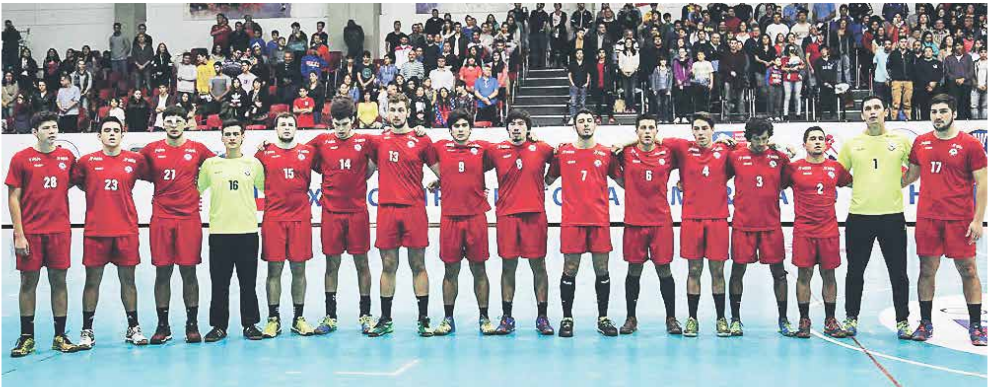
LA SELECCIÓN AHORA se enfrentará a Francia, actual campeón del mundo juvenil.

JUVENILES JUGARÁN CON EL ACTUAL CAMPEÓN DEL MUNDO