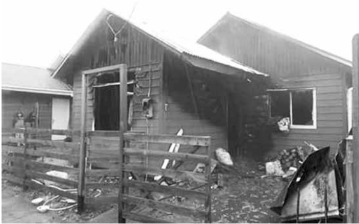
EL SINIESTRO AFECTÓ a una vivienda emplazada en Ralco, en la comuna de Alto Biobío.

El grupo estaba conformado por una madre y su hija; la primera es funcionaria de un jardín infantil de la zona.