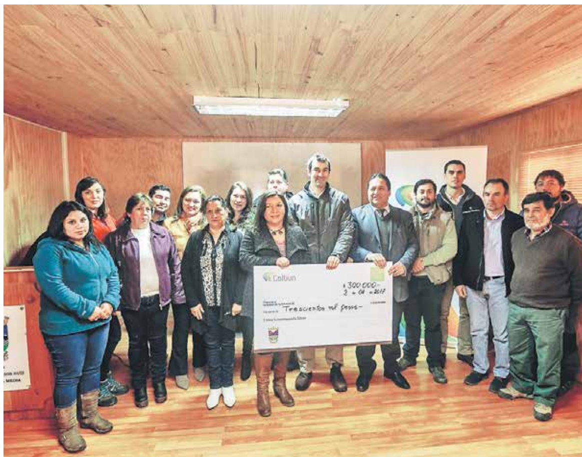
LOS 10 PROYECTOS ganadores serán nuevamente evaluados para postular a un fondo final de un millón y medio.