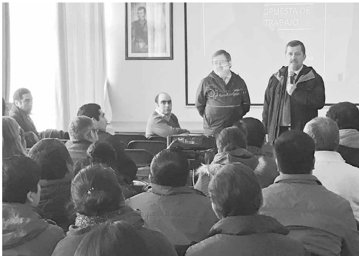
EL SEREMI de Desarrollo Social junto al gobernador de Biobío encabezaron la reunión efectuada en Los Ángeles.

"Estamos concretando el anuncio que realizó nuestra Presidenta en su cuenta pública del pasado 1 de