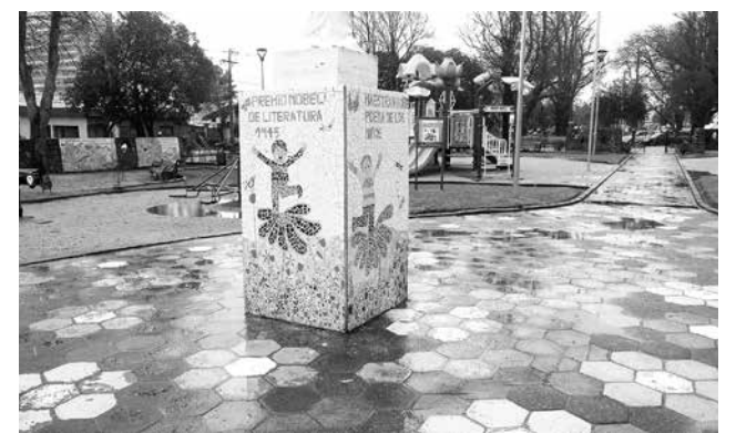
LA PLAZA DE LOS NIÑOS queda en Ricardo Vicuña con Almagro.

Falleció en Nueva York víctima de un cáncer en 1957.