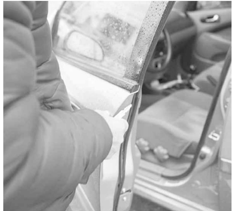
MOMENTOS DE TERROR fueron los vividos por el trabajador de Uber tras ser abordado por un grupo de tres delincuentes.

Asimismo, es personal de la Sección de Investigación Policial (SIP) de Carabineros de Los Ángeles quien se encuentra realizando las diligencias tendientes a esclarecer lo sucedido.