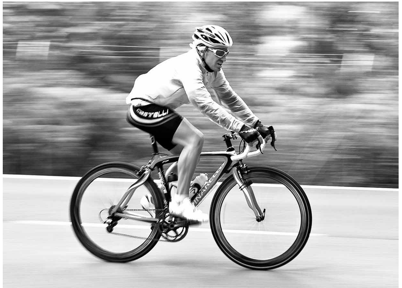
LA BICICLETA es una de las mejores actividades.

La adaptación muscular que se produce con el ejercicio aeróbico y dinámico es la más beneficiosa para tu corazón. Esta aumenta el desarrollo