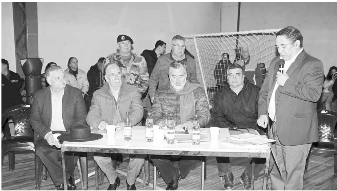
ALEJANDRO GUILLIER participó de un encuentro con ex soldados conscriptos de la zona durante el período 1973-1990 en el Gimnasio Municipal de Los Ángeles.

“Yo soy más agresivo que el proyecto del gobierno, creo que en las regiones, parte de la estructura tributaria deben ser impuestos locales para beneficiar a las comunas y a las regiones donde están los emprendimientos, más que a las oficinas