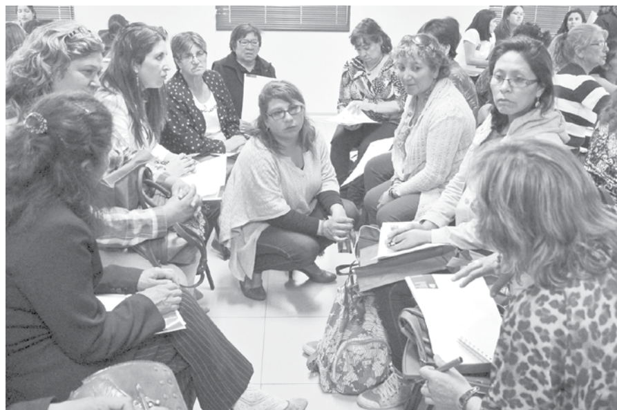
ES DE SUMA IMPORTANCIA, tener claros los puntos al momento de optar por ser dirigente.

Por lo tanto, los concejales como servidores públicos no debe ocupar otros cargos como el de ser presidentes de las Juntas de Vecinos, porque estas labores pueden llegar a ser incompatibles en cuanto a su gestión y desarrollo.