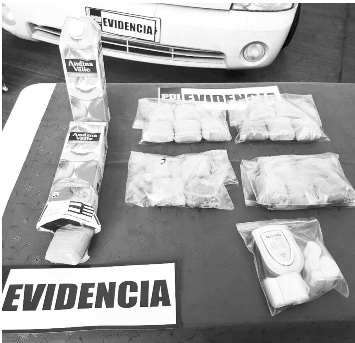
LA DROGA INCAUTADA fue evaluada en un monto cercano a los 20 millones de pesos.

Asimismo, la estupefaciente fue remitida al Servicio de Salud Araucanía Norte.