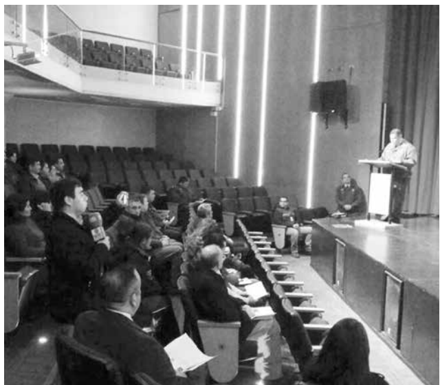
LA CITA SE EFECTUÓ en Nacimiento y contempló la presencia de residentes de sectores rurales de esta comuna y Negrete.

La jornada fue apoyada por personal del municipio y del Servicio Agrícola y Ganadero.