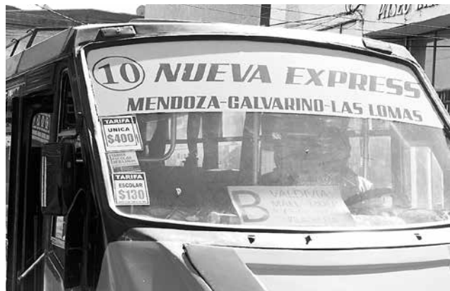
ASOCIACIÓN GREMIAL de Dueños de Taxibuses Urbanos de Los Ángeles agrupa a cinco líneas.

Cabe señalar que la Asociación Gremial de Dueños de Taxibuses Urbanos de Los Ángeles agrupa a cinco líneas.