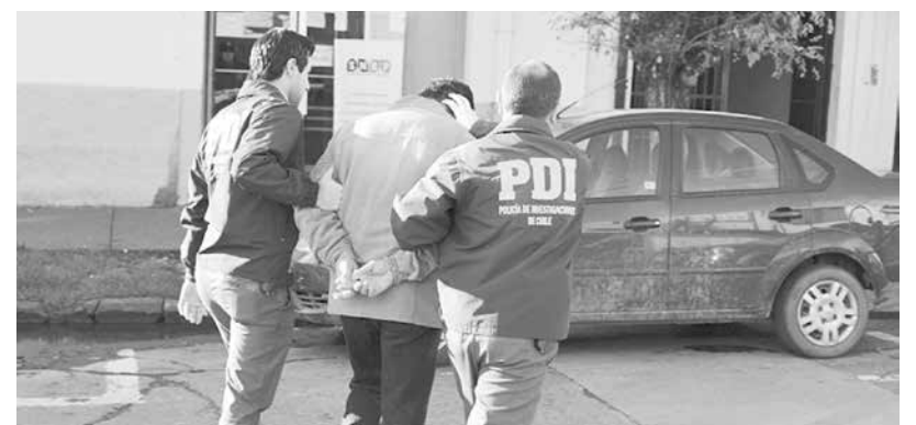
TRAS UNA INVESTIGACIÓN encabezada por la Bicrim, detectives lograron sorprender a esta persona en la comuna de Mulchén. (Imagen de contexto)

Por lo mismo, agregaron que -en ocasiones- quienes son requeridos por este concepto prefieren pasar un par de noches en la cárcel en lugar de pagar las deudas o cambiar constantemente de domicilio para no cumplir con esta obligación económica.