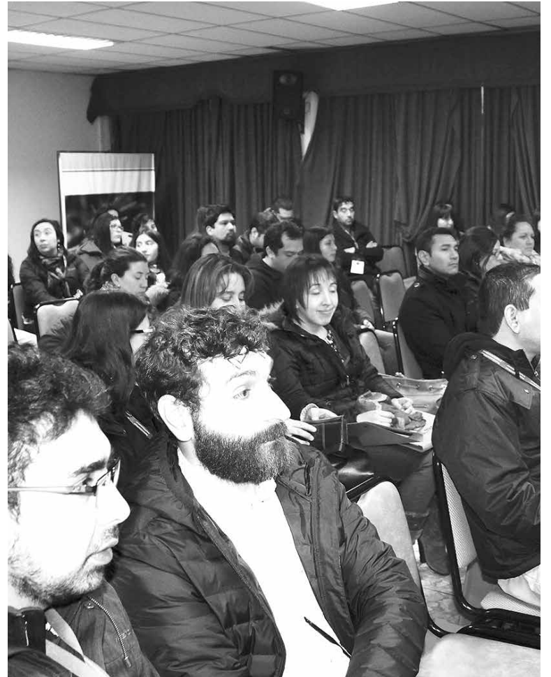
SEGÚN LAS CIFRAS DE LA OMS el 14% de la carga mundial de morbilidad pueden atribuirse a problemas de salud mental, representando el 30% de la carga de enfermedades no transmisibles.

Esta iniciativa será de carácter permanente, por lo que los asistentes a esta primera jornada continuarán fortaleciendo sus competencias en el ámbito de la salud mental, además deberán traspasar los conocimientos adquiridos al resto de los equipos de atención, para de esta manera reforzar la pesquisa, el abordaje y tratamiento de los problemas de salud mental en los establecimientos de la red.