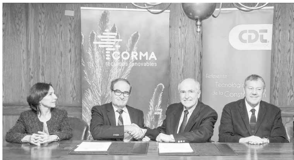
EL EVENTO ESPERA reunir a expositores europeos y norteamericanos, líderes mundiales en construcción en madera.

La muestra se realizará entre el 15 y 17 de noviembre del próximo año en la Región del Biobío.