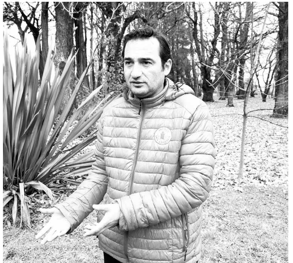
ADEMÁS DIJO que San Felipe será uno de los rivales más difíciles del campeonato.