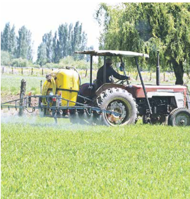
CUENTA CON RECURSOS DISPONIBLES por $4 mil millones de pesos, y donde los productores del sector podrán presentar proyectos de promoción internacional.

Los productores del sector podrán presentar sus proyectos de promoción internacional hasta el próximo 30 de agosto.