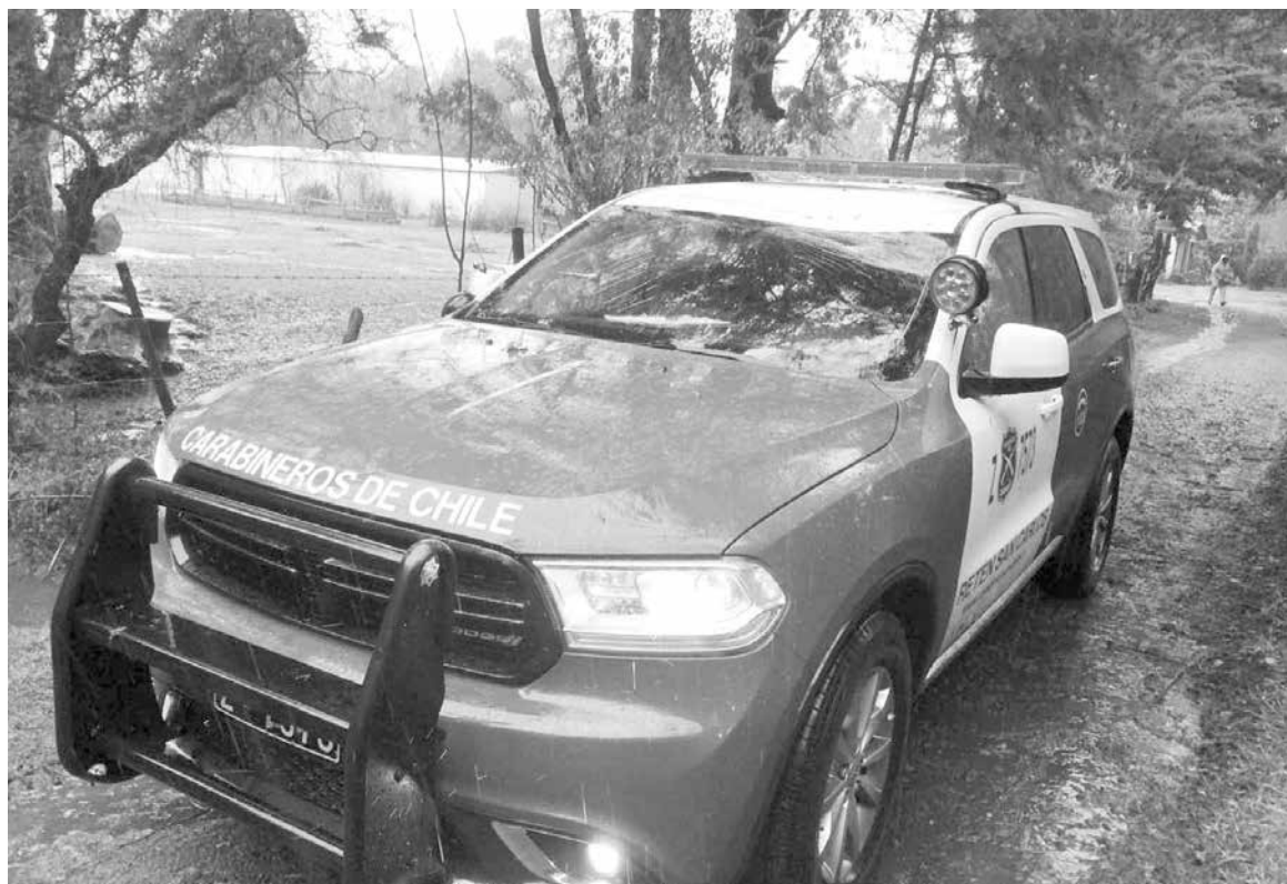
EL AUTOMÓVIL AFECTADO corresponde a uno de dotación del retén de San Carlos de Purén.

El prefecto de Carabineros N° 20 de Biobío, coronel Hugo Zenteno, detalló que la región recibió 38 vehículos, de los cuales ocho llegaron a la zona para ser parte de distintos destacamentos y unidades de la provincia.