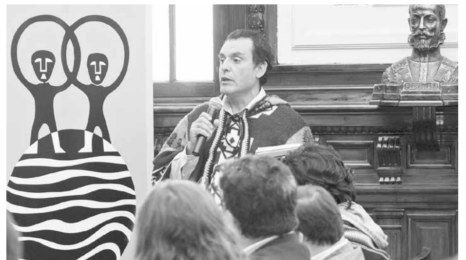
DESDE EL MIÉRCOLES 16 de agosto y hasta el lunes 16 de octubre se recibirán las propuestas.

Las bases y requisitos de participación, información sobre los premios, el formulario de postulación y el material de difusión se encuentran disponibles en www.indh.cl . Consultas sobre la convocatoria pueden hacerse llegar al correo electrónico arteyderechos-humanos@indh.cl