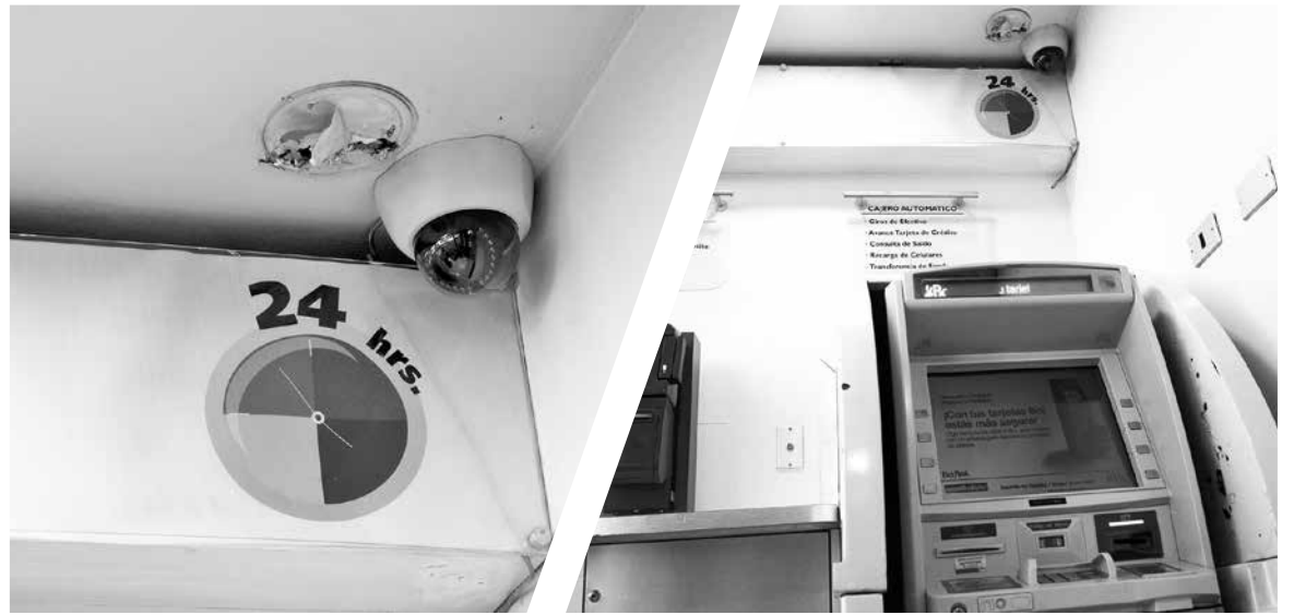
LA SUSTRACCIÓN DE LA CÁMARA de seguridad se registró en horas de la madrugada de este miércoles.

que permitió establecer que "el cajero automático propiamente tal no recibió ningún tipo de manipulación por parte de estas personas", expresó Cárdenas.