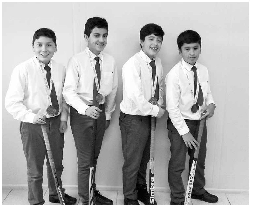
LOS PEQUEÑOS DEPORTISTAS han estado desde los inicios en el establecimiento.

“Hoy contamos con un semillero importante que se proyecta de forma positiva