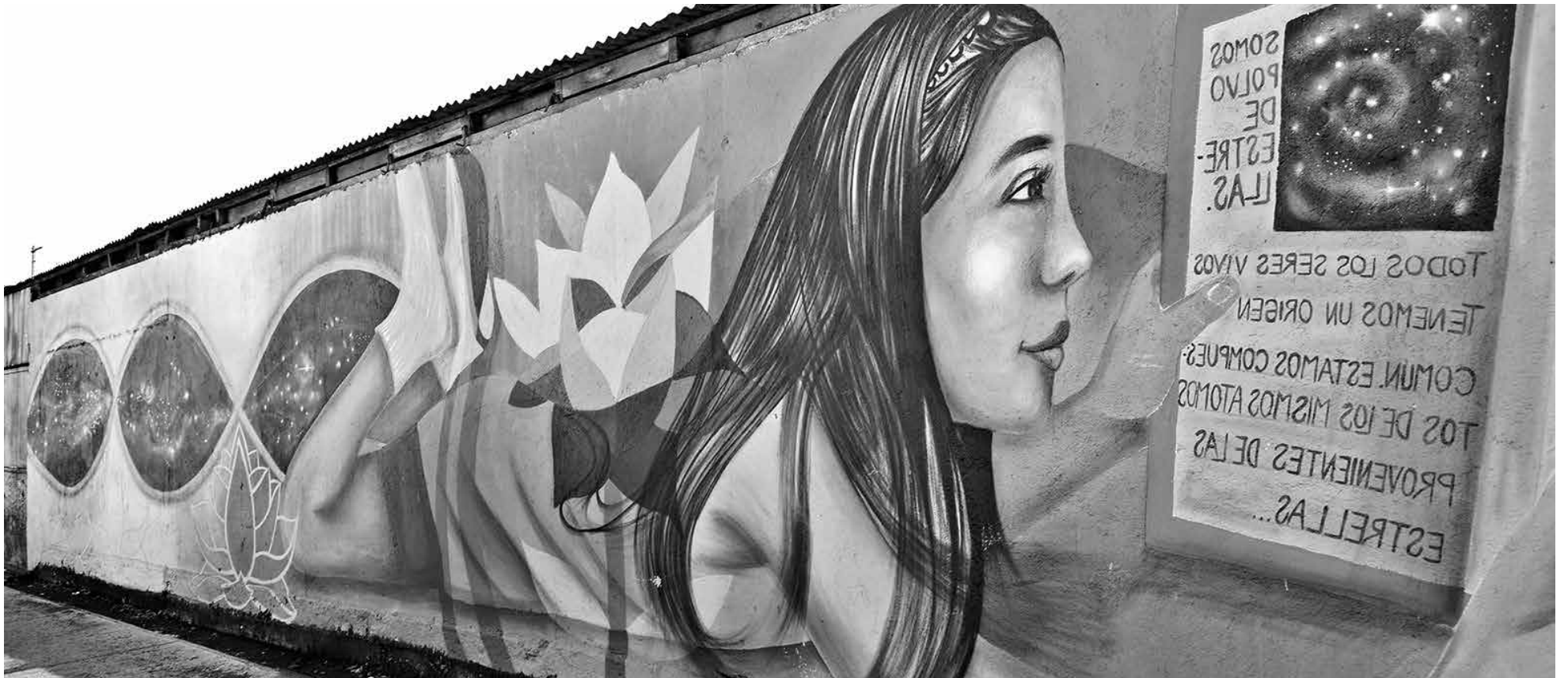
LA OBRA DE WILFREDO MEDINA representa el conocimiento y la sabiduría humana en un mural ubicado en Galvarino con esquina pasaje El Roble.