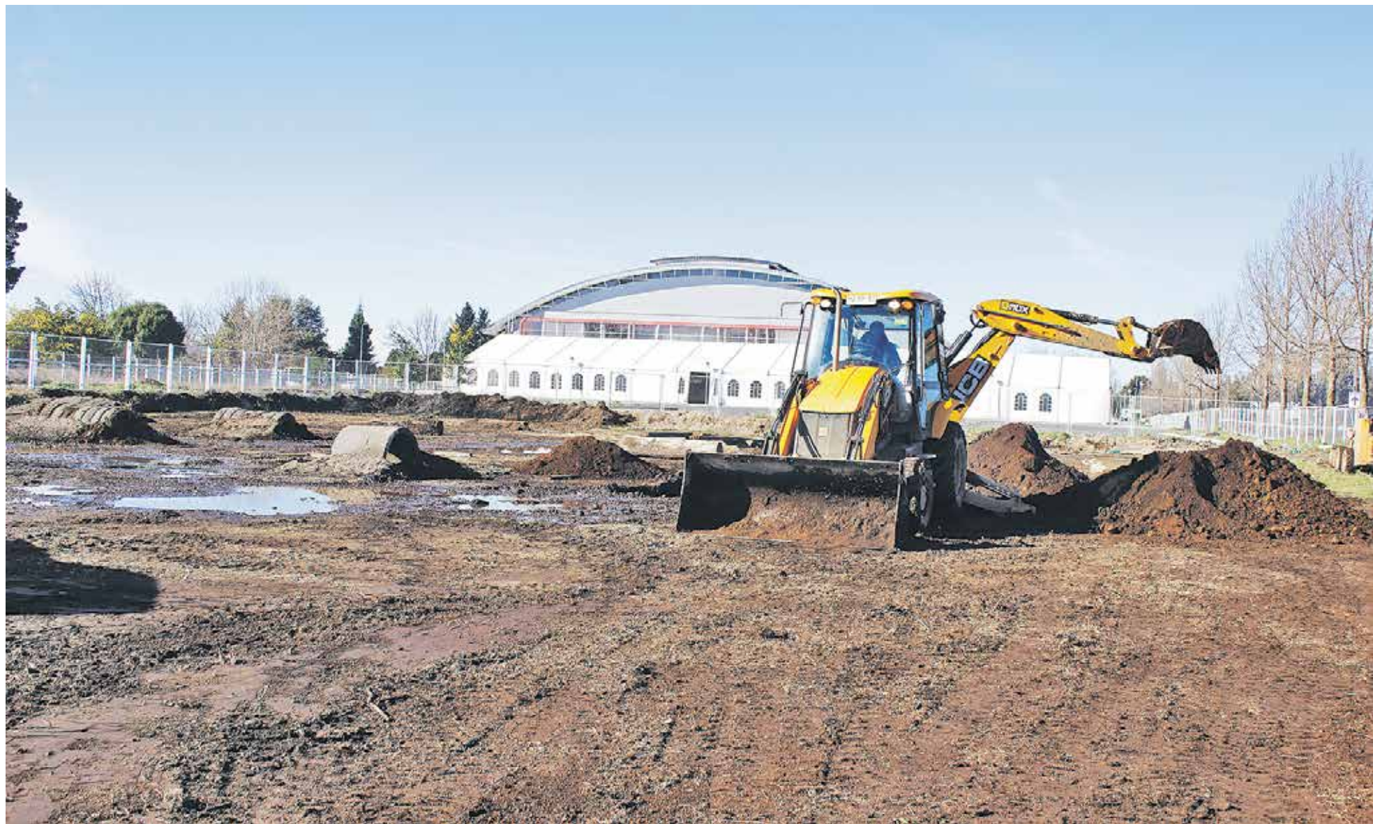
LA ORGANIZACIÓN DEL EVENTO trabaja arduamente desde el lunes para crear una buena pista de súper test.

Serán cientos los pilotos que llegarán a Los Ángeles este fin de semana para ser parte de un evento de talla nacional. La entrada será totalmente gratuita.