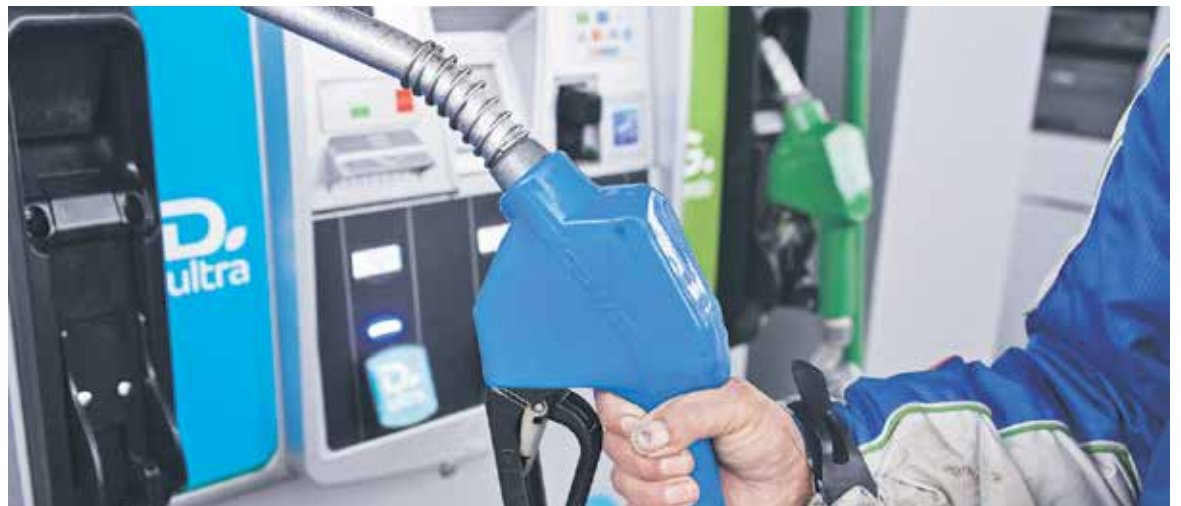
EL INCREMENTO PROMEDIO de todos los derivados del petróleo será de 7,2 pesos por litro.

93 OCTANOS + $5,6 97 OCTANOS + $5,6 KEROSENE + $3,6 DIÉSEL + $5,6