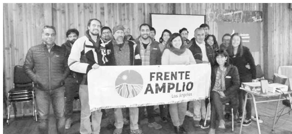
REPRESENTANTES DEL FRENTE AMPLIO en Los Ángeles se mostraron críticos frente a la crisis que atraviesa su conglomerado en los últimos días. (Foto de archivo)