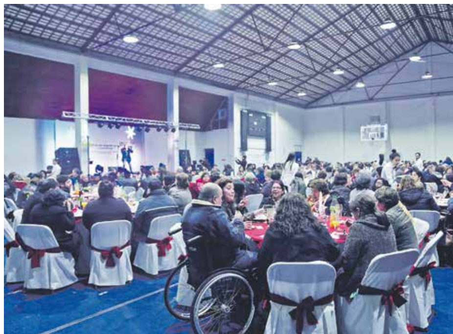
LOS ASISTENTES DISFRUTARON de una cena acompañados de autoridades comunales y nacionales.

El diputado Roberto Poblete expresó su admiración hacia los dirigentes de las distintas organizaciones de Mulchén, porque ellos -dijo- han recibido un don, que es el tener la preocupación, solidaridad y trabajar por los demás, sin esperar nada a cambio.