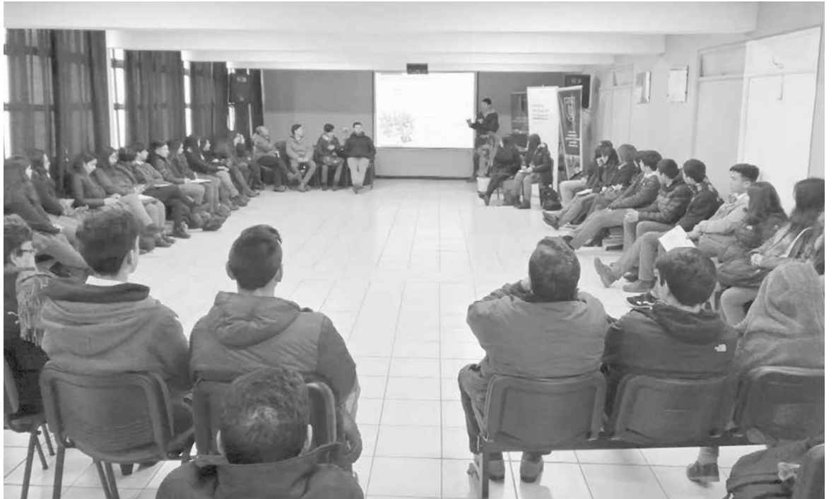
DURANTE EL MES de septiembre continuarán estas actividades con los estudiantes.