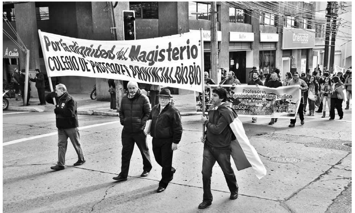
A ESO DE LAS 12 HORAS, los profesores comenzarán la marcha por las calles de Los Ángeles, para culminar con un acto frente a los edificios públicos.