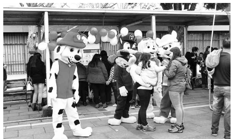
LOS INFALTABLES personajes infantiles no estuvieron ausentes de esta jornada familiar.