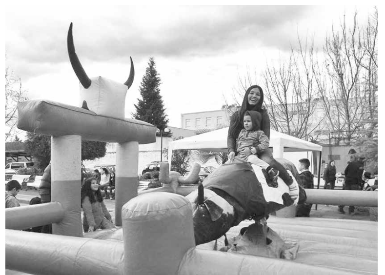
JUEGOS INFLABLES fue una de las mayores entretenimientos que disfrutaron los más pequeños.

Según los organizadores, durante la jornada participaron de las diferentes actividades planificadas alrededor de 300 personas, considerando a adultos y niños.