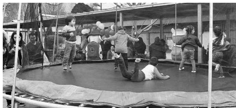
LOS ORGANIZADORES calcularon en cerca de 300 los asistentes a la actividad.

Juegos inflables, pintacaritas, toros mecánicos, concursos y regalos, entre otras atracciones, alegraron la jornada de quienes llegaron a participar de esta tarde recreativa que, pese al amenazante clima,