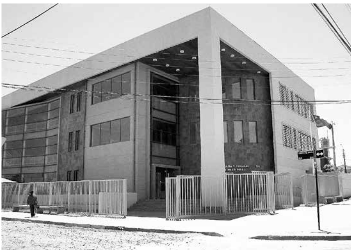
LA PENA EN CONTRA de estas dos personas se conoció en el Tribunal de Juicio Oral en lo Penal de Los Ángeles.

Las diligencias encabezadas por la PDI terminaron con el decomiso de varias dosis de cocaína base y 482 plantas de marihuana sin la respectiva autorización.