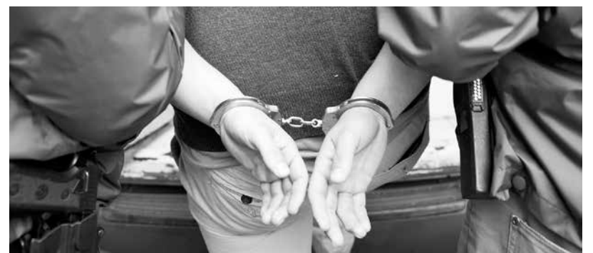
EL HOMBRE FUE DETENIDO tras un control vehicular de rutina realizado por Carabineros.

Asimismo, las circunstancias en las que el móvil llegó a manos del imputado son materia de investigación. El vehículo, en tanto, fue devuelto a su propietario.