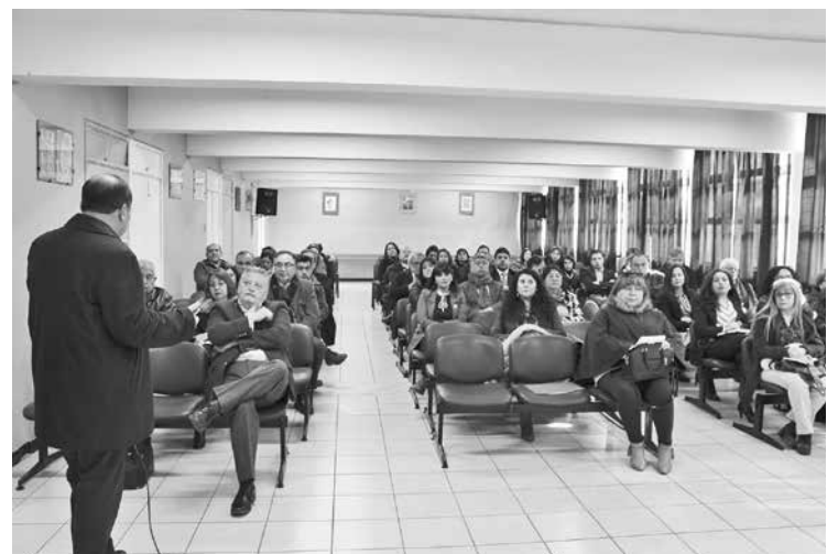
DIRECTORES DE LOS ESTABLECIMIENTOS municipales de Los Ángeles conocieron la propuesta elaborada por el “Consejo Comunal para la Calidad de la Educación”.

Al término de la reunión los directores destacaron la iniciativa y agradecieron la mayor fluidez en la comunicación y coordinación de las medidas que cada establecimiento está tomando por separado y en conjunto con la Dirección de Administración de Educación Municipal, con el fin de lograr el objetivo.