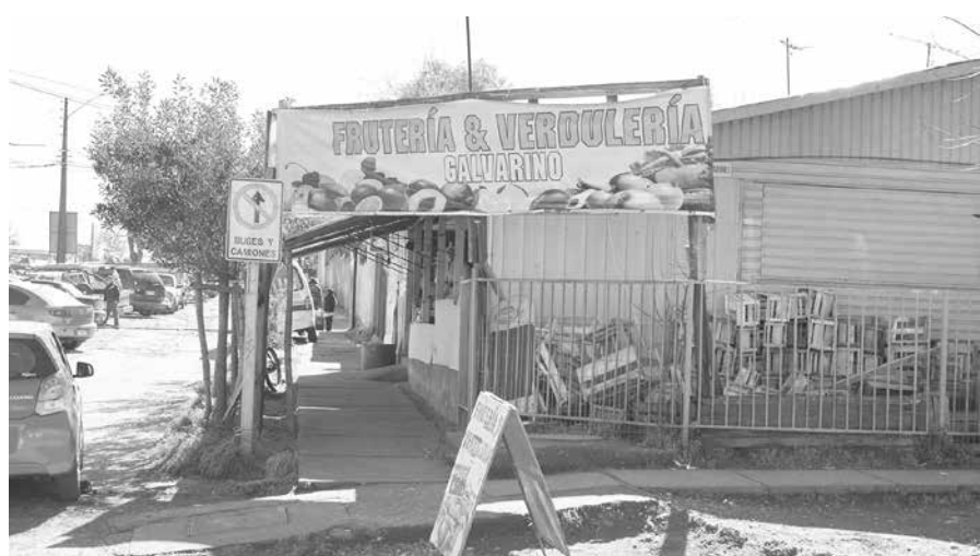
EL DELITO AFECTÓ a la frutería Galvarino, ubicada en el sector poniente de la comuna de Los Ángeles.

Se trató de dos delincuentes habituales, conocidos por personal policial. Ambos fueron sorprendidos en flagrancia.