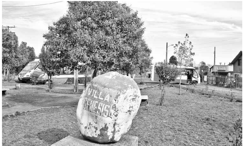
EL PROYECTO DE UN CECOSF para villa Génesis es un proyecto que se arrastra desde hace varios años.