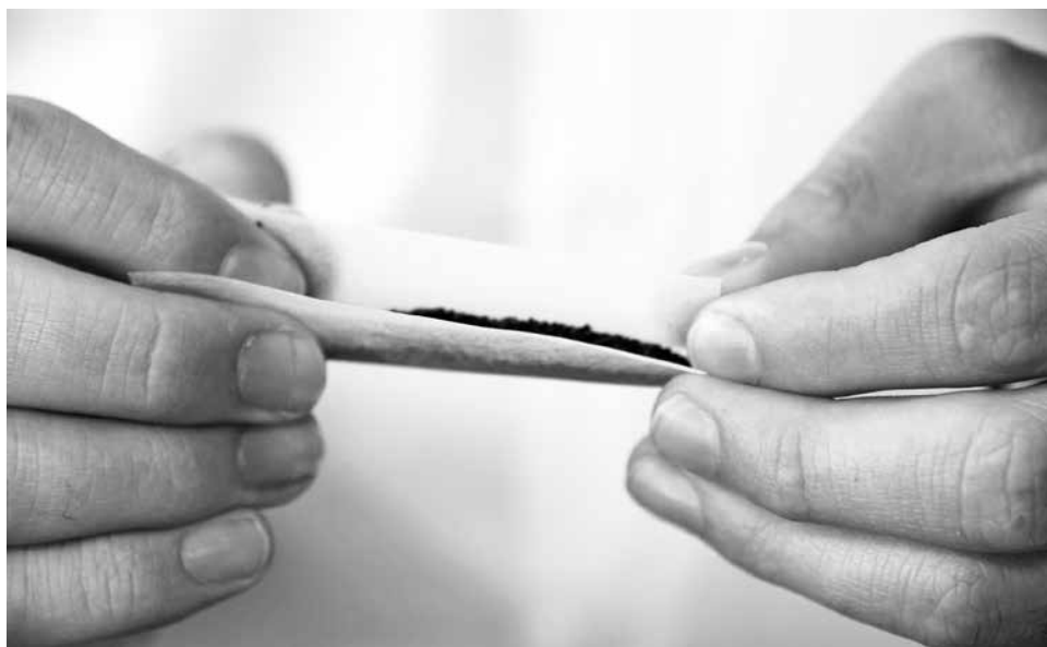
EL HOMBRE fue sorprendido con cerca de 50 gramos de marihuana ocultos entre sus vestimentas.

El hombre, quien no mantenía antecedentes penales, fue puesto a disposición del Ministerio Público para su posterior control de detención en el Juzgado de Garantía de Los Ángeles.