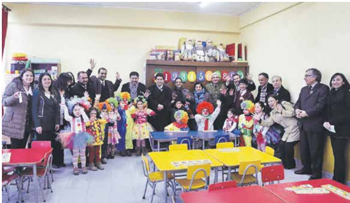
LA CEREMONIA SE REALIZÓ el lunes recién pasado en la Escuela Mulchén, de la comuna del Bureo.

“Esto no hubiera sido posible sin el apoyo de nuestro alcalde, quien ha estado siempre respon-