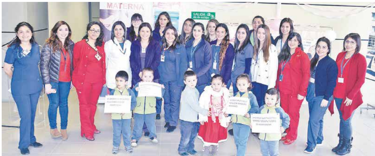
PROFESIONALES DE SALUD y niños fueron parte de la inauguración de la Semana Mundial de la Lactancia Materna en Los Ángeles.

Este 1 de agosto se dio inicio en Los Ángeles a la Semana Mundial de la Lactancia Materna, la cual contará con variadas actividades enfocadas en la crianza basada en la buena alimentación, especialmente desde los primeros meses de vida.