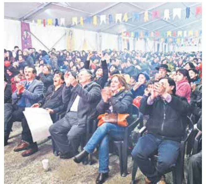
GRAN CONCURRENCIA de público tuvieron las actividades.