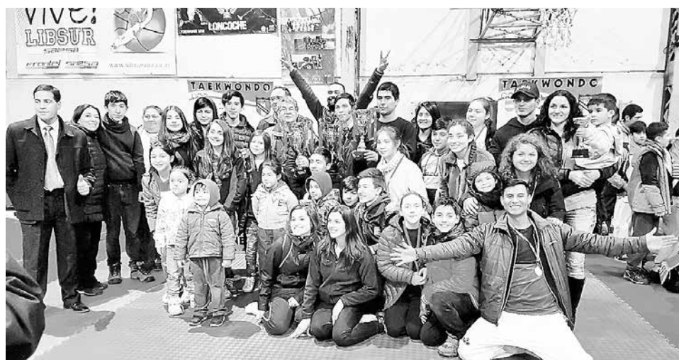
CON TRES PRESEAS volvió el elenco angelino, que nuevamente sacó la cara por la provincia de Biobío.