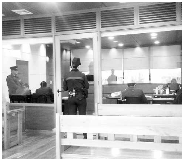
EL HECHO por el cual fue condenado se remonta a finales de julio de 2016, en la intersección de la Ruta 5 Sur con la Ruta 97.

Por el ilícito de hurto simple en grado tentativo, el hombre recibió una condena de 50 días de prisión en su grado máximo, una multa a beneficio fiscal de 2 UTM y a la accesoria de suspensión de cargos u oficios públicos durante el tiempo que dure la condena.