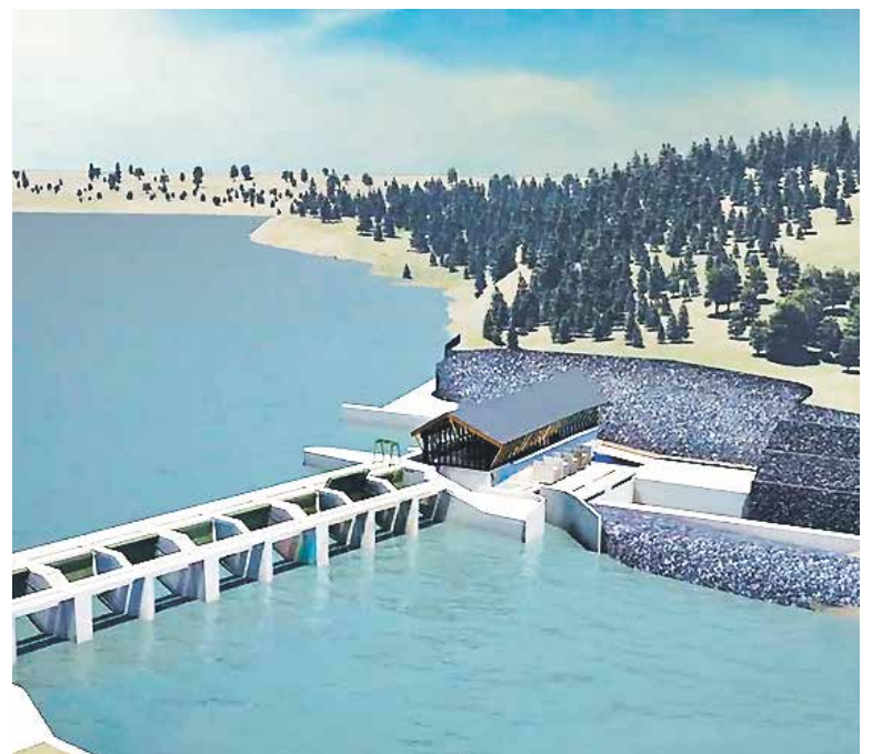
LA EMPRESA DE HELLER con esta acción podría invalidar el permiso ambiental de la Central Frontera.

Es bueno recordar que Ancali mantiene en las dependencias de la lechera una generadora de electricidad a base de purines. Dicha energía es vendida al Sistema Interconectado Central.