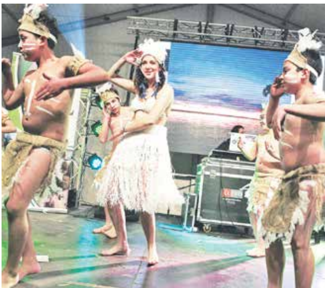
LA REINA ELECTA dice que anda con bototos y que no le gusta el maquillaje.