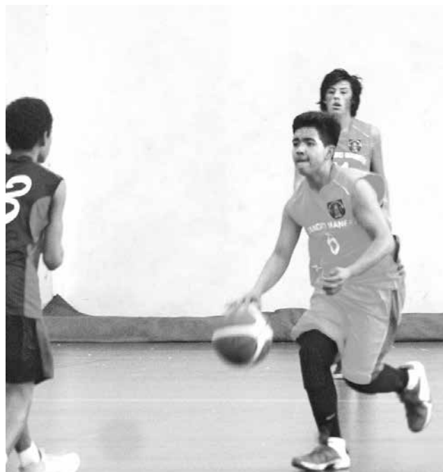
LOS ÁNGELES logró superioridad evidente en el torneo y se clasificó a la fase regional.

En la final se midió ante el local, Mulchén, en el gimnasio municipal “Eduardo Gallegos”.