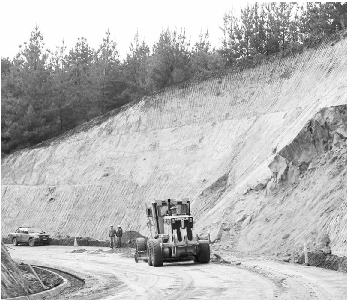
LOS RECURSOS TRASPASADOS desde el Gobierno Regional permitirán pavimentar un total de 10 kilómetros de rutas vecinales en la provincia.

Uno de los sectores más complicados en las recientes semanas ha sido Butalelbún, desde donde vecinos denunciaron encontrarse, prácticamente, aislados debido a que la locomoción no estaba llegando al lugar.