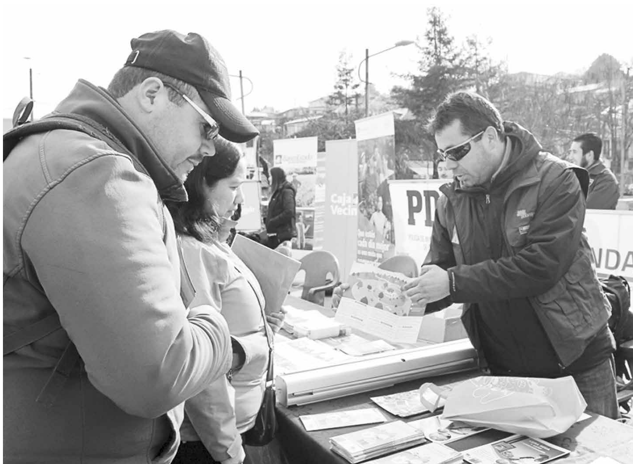
PROFESIONALES DE CONAF, PDI y otras instituciones participaron de este nuevo Gobierno en Terreno, en Laja.

“Me parece una muy buena iniciativa la de disponer de estos servicios, más aún en plena plaza de nuestra comuna, así es que se agradece la disposición de los profesionales porque atienden con mucha amabilidad y responden todas