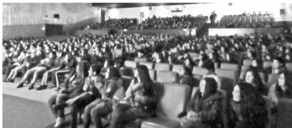
DIVERSOS ESTABLECIMIENTOS educativos asistieron a la jornada.