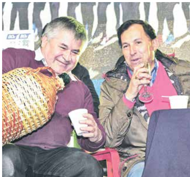
"GUACHACAS" angelinos disfrutaron de los tres días de fiesta.