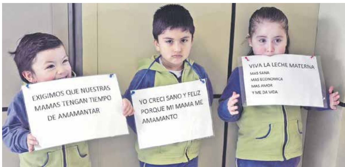
LA LACTANCIA MATERNA fomenta el desarrollo sensorial y cognitivo, y protege al niño de las enfermedades infecciosas y crónicas.

Con respecto al aporte integral que proporciona la lactancia mater-