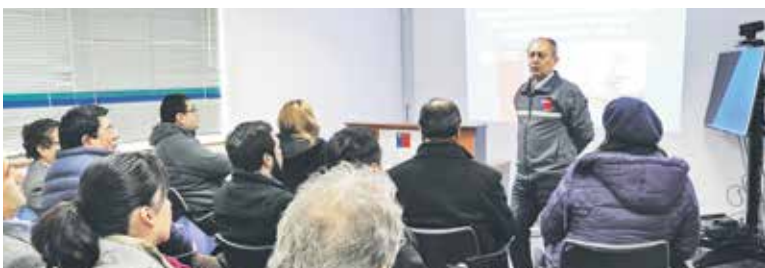
LAS FISCALIZACIONES se ejecutarán hasta el 25 de octubre de 2017, siendo esta última fecha el plazo máximo para que las comisiones de fiscalización se encuentren visadas.

Con respecto a las infracciones, se cursaron cinco sanciones administrativas a empresas principales, lo que equivale a un 9,62% del total de empresas fiscalizadas. Las multas, por su parte, recaudaron 410 Unidades Tributarias Mensuales, equivalentes al monto de $18.855.910. Respecto de las tres fiscalizaciones realizadas a empresas contratistas, no se constataron infracciones en materias de higiene y seguridad.