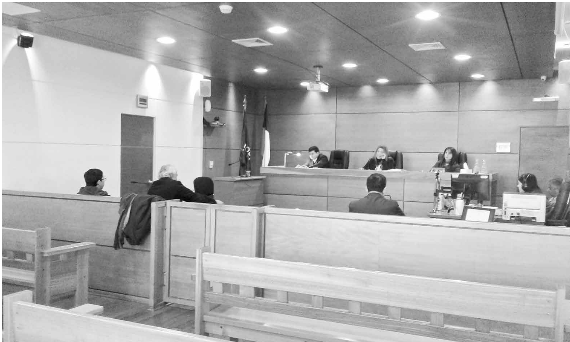
EL JUICIO SE DESARROLLÓ durante los días lunes y martes en dependencias del Tribunal Oral en lo Penal de Los Ángeles.

Las circunstancias por las que fue declarado culpable se remontan a junio de 2016, cuando disparó a dos hermanos que se movilizaban en un automóvil.