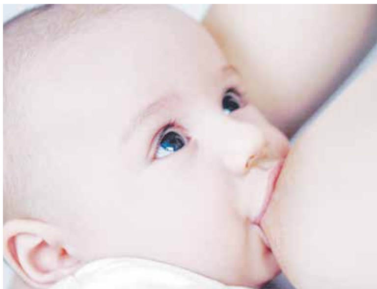
LA LECHE MATERNA aporta toda la energía y los nutrientes que el niño necesita en sus primeros meses de vida.

salud y al bienestar de las madres, ayuda a espaciar los embarazos, reduce el riesgo de cáncer de ovario y mama, aumenta los recursos familiares y nacionales, es una forma de alimentación segura y carece de riesgos para el medio ambiente.