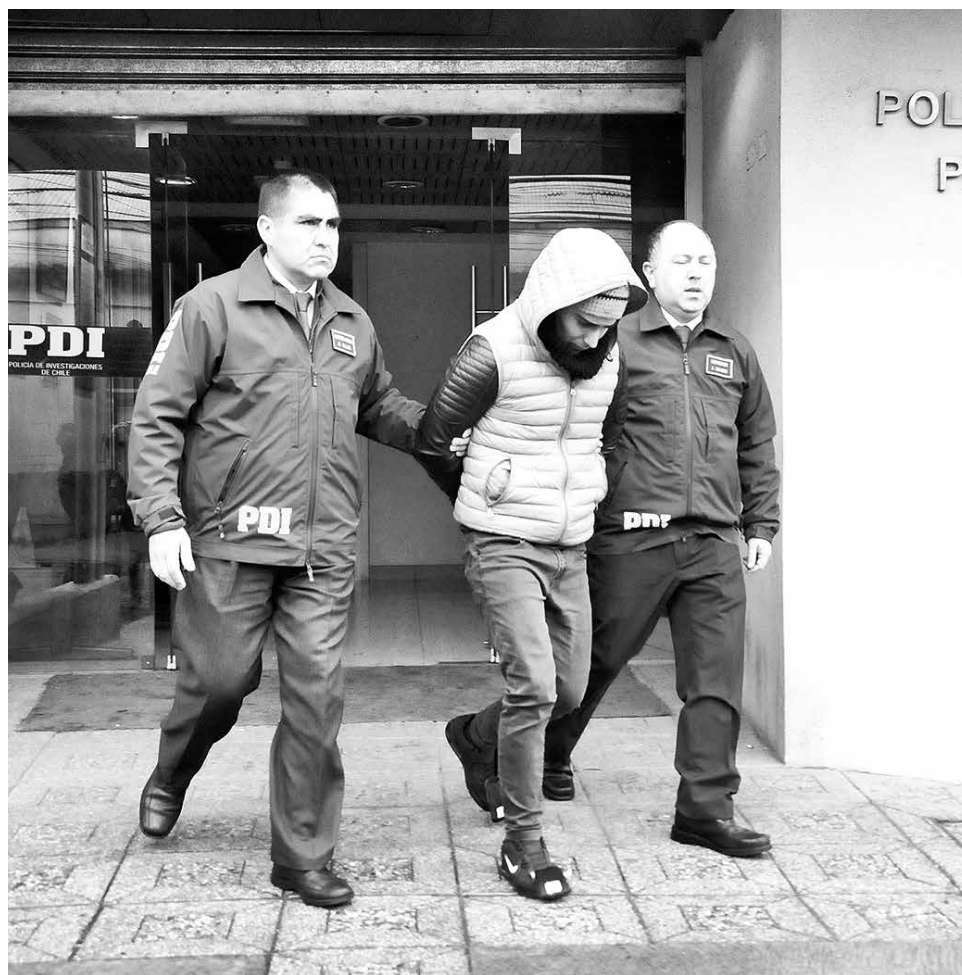
EL JOVEN FUE DETENIDO en su domicilio, emplazado en el sector norte de la comuna de Laja.

Asimismo, el tribunal decretó un plazo de cuatro meses para investigar.