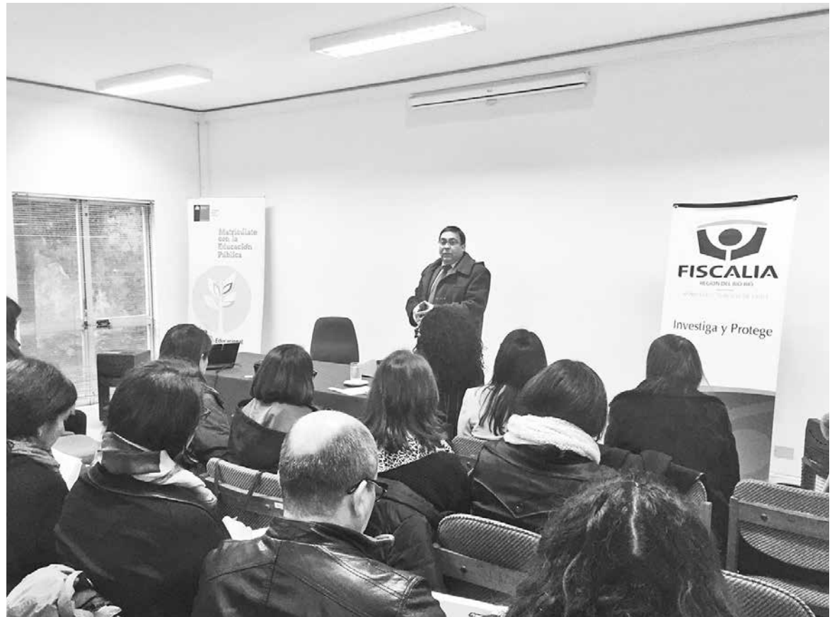
LA MAYORÍA de las inquietudes de los profesores giraron en torno a los delitos sexuales que afectan a los menores y especialmente sobre cuándo deben denunciar.

La mayoría de las inquietudes de los profesores giraron en torno a los delitos sexuales que afectan a