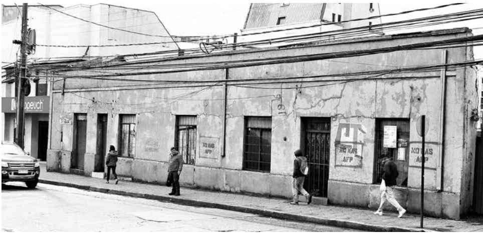
LA ANTIGUA EDIFICACIÓN que albergaba la CUT en Los Ángeles quedó dañada desde el terremoto del 27/F.

La estructura ubicada en calle Almagro entre Caupolicán y Lautaro, quedó averiada desde el terremoto del 27/F. La municipalidad ejecutará su derrumbe a cambio de dos metros de vereda que, de acuerdo al plano regulador vigente en la comuna, corresponde que sean entregados.