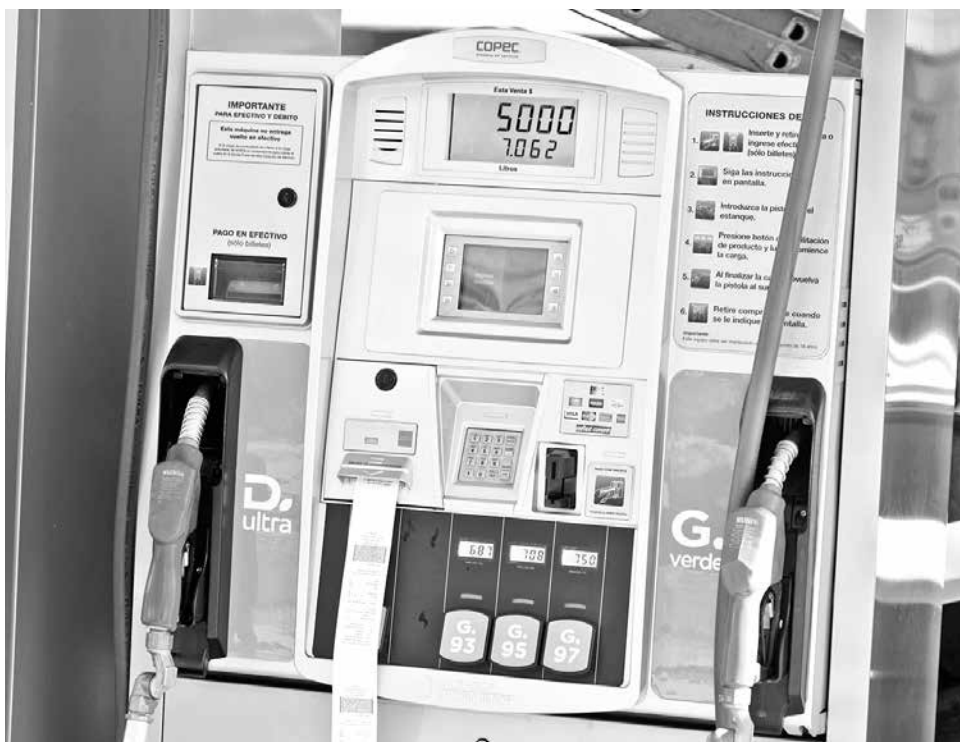
EL MAYOR AUMENTO se verá en el precio del kerosene.

En tanto, el kerosene costará $12,3 más que la semana anterior, y finalmente, el diésel