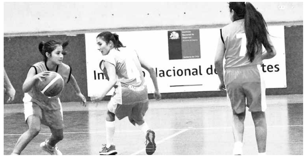
LA FINAL REGIONAL de los JDE se disputará los días 28 y 29 de agosto en el Polideportivo de Los Ángeles.

La Etapa Regional de Fútbol es el 30 y 31 de agosto en la ciudad de Concepción.