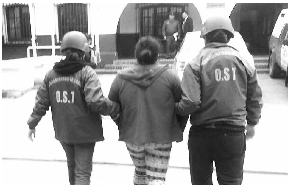
LA ABUELA DE LA MENOR fue detenida, después que Carabineros encontrara 69 dosis de marihuana en su casa.

Cabe hacer presente que es materia de investigación si las dosis eran para ser comercializadas o para consumo personal.