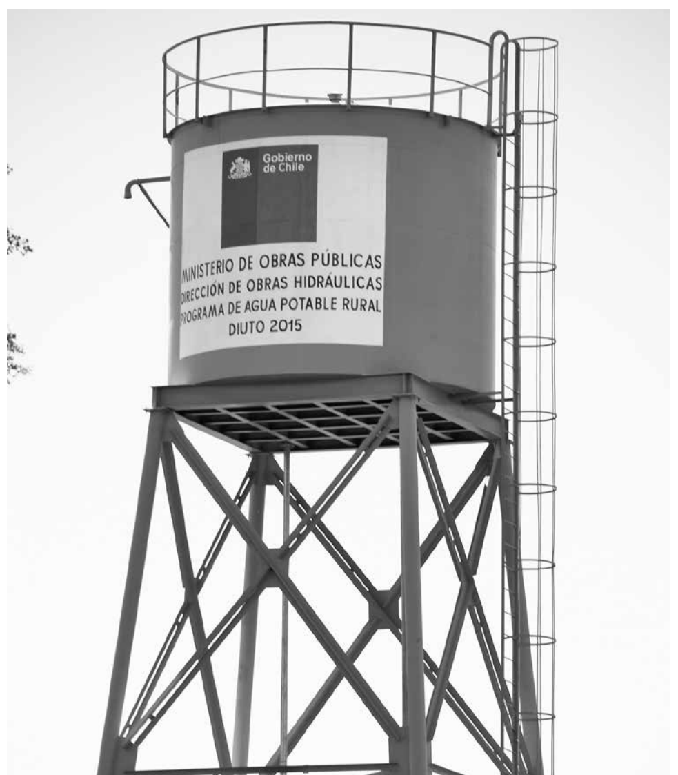
EL DIRIGENTE DIJO que es factible una extensión de red en algunos sectores para suministrar

“Sumando lo que gasta una municipalidad con el reparto de agua en camiones aljibes, a lo mejor es factible una extensión de red para llegar a solucionar esos problemas”, propuso.