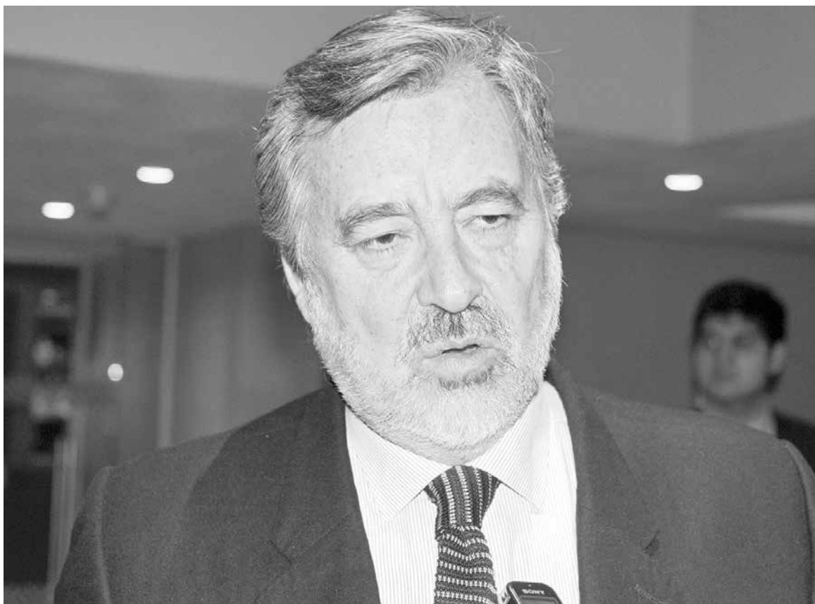
GUILLIER INSCRIBIÓ SU CANDIDATURA con cerca de 62 mil firmas, de las cuales 7.400 salieron de la región del Biobío.