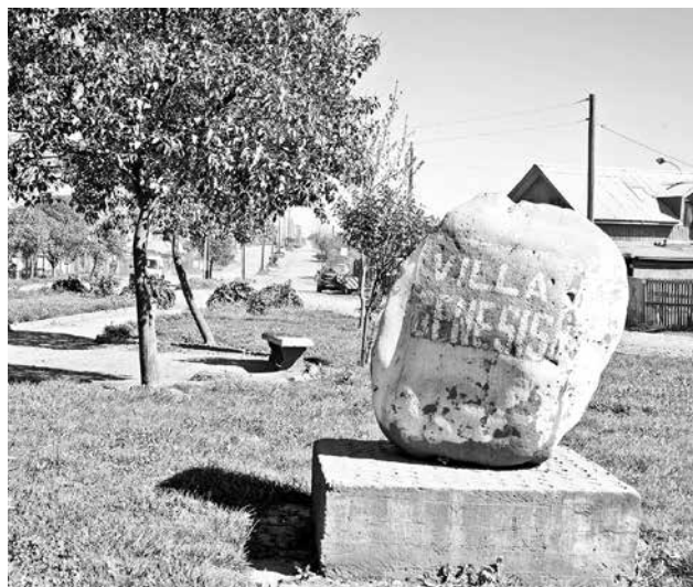
LA INICIATIVA se encuentra a la espera de su admisibilidad y recomendación social con el sectorialista del Gobierno Regional.