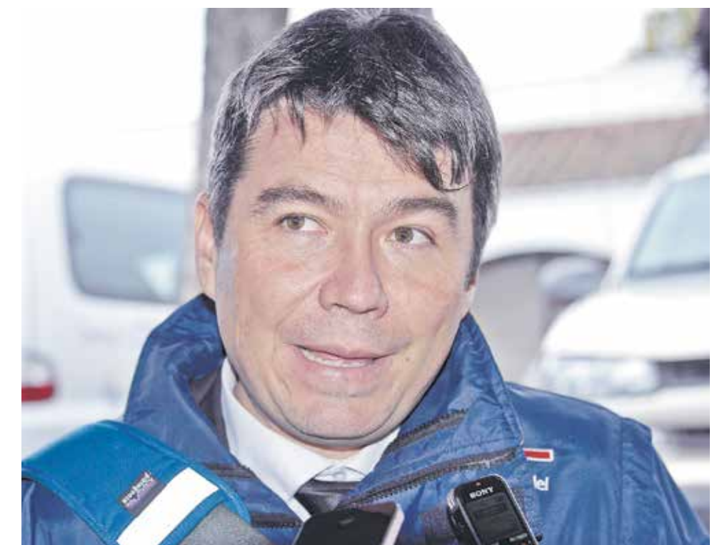
MINISTRO MENA INDICÓ que debe haber participación ciudadana en el proceso de evaluación de la planta