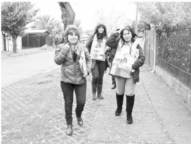
EL 31 DE AGOSTO se conocerá el resultado más esperado del Censo, saber cuántos somos realmente los chilenos.

Primero se conocerá cuántos somos los chilenos y cuántas viviendas existen en el país. Luego se informará sobre los detalles de la población.