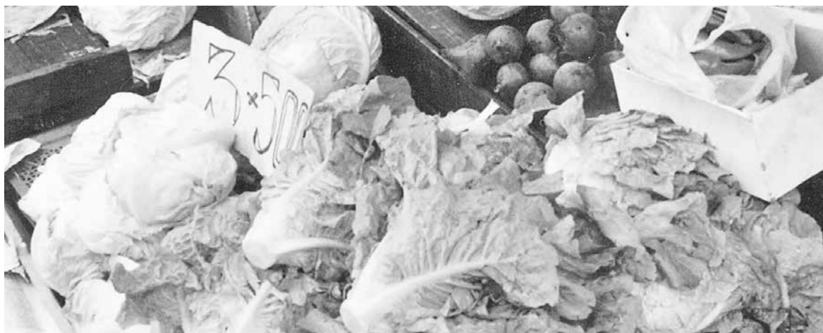
OCHO DE LAS DOCE divisiones que conforman la canasta del IPC consignaron incidencias positivas, y cuatro negativas.

El informe de Lácteos es un informe mensual elaborado por Fedeleche a objeto de informar a los productores de leche sobre los precios en general de los alimentos y de los productos lácteos en particular.