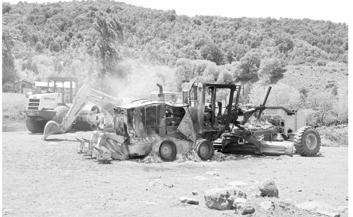
ACOFARAG YA HA MANIFESTADO su molestia contra la autoridad por los ataques sufridos por sus miembros en Biobío y La Araucanía.