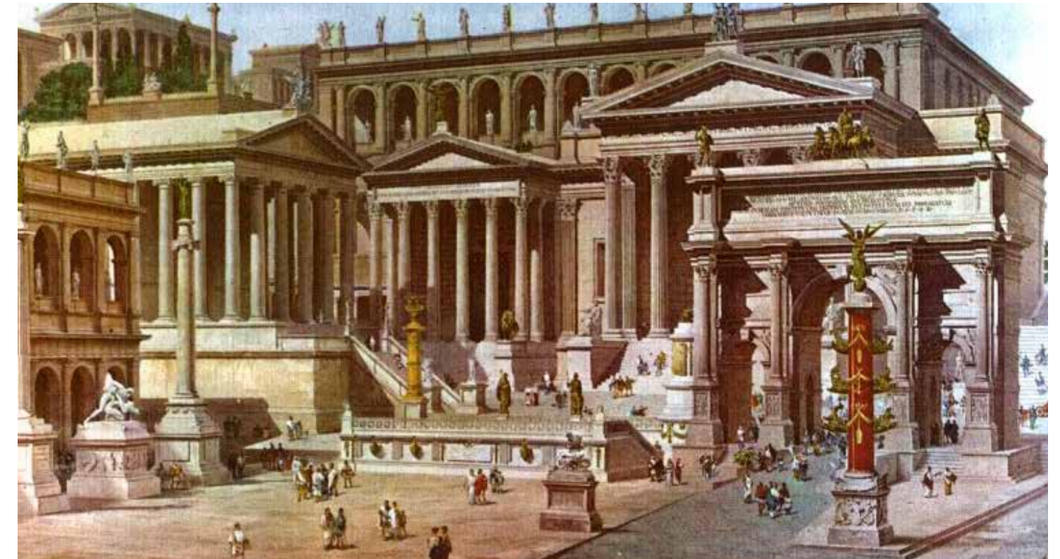
EN LA INVESTIGACIÓN se indica que una de las razones de la desaparición del Imperio Romano fue por la infertilidad de su clase gobernante, producida porque almacenaban el vino en vasijas de plomo.