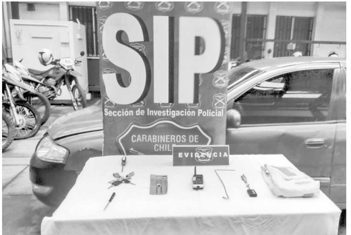
UN CONTROL REMOTO e inhibidor de alarmas, además de destornilladores y limas fueron encontrados en el auto.