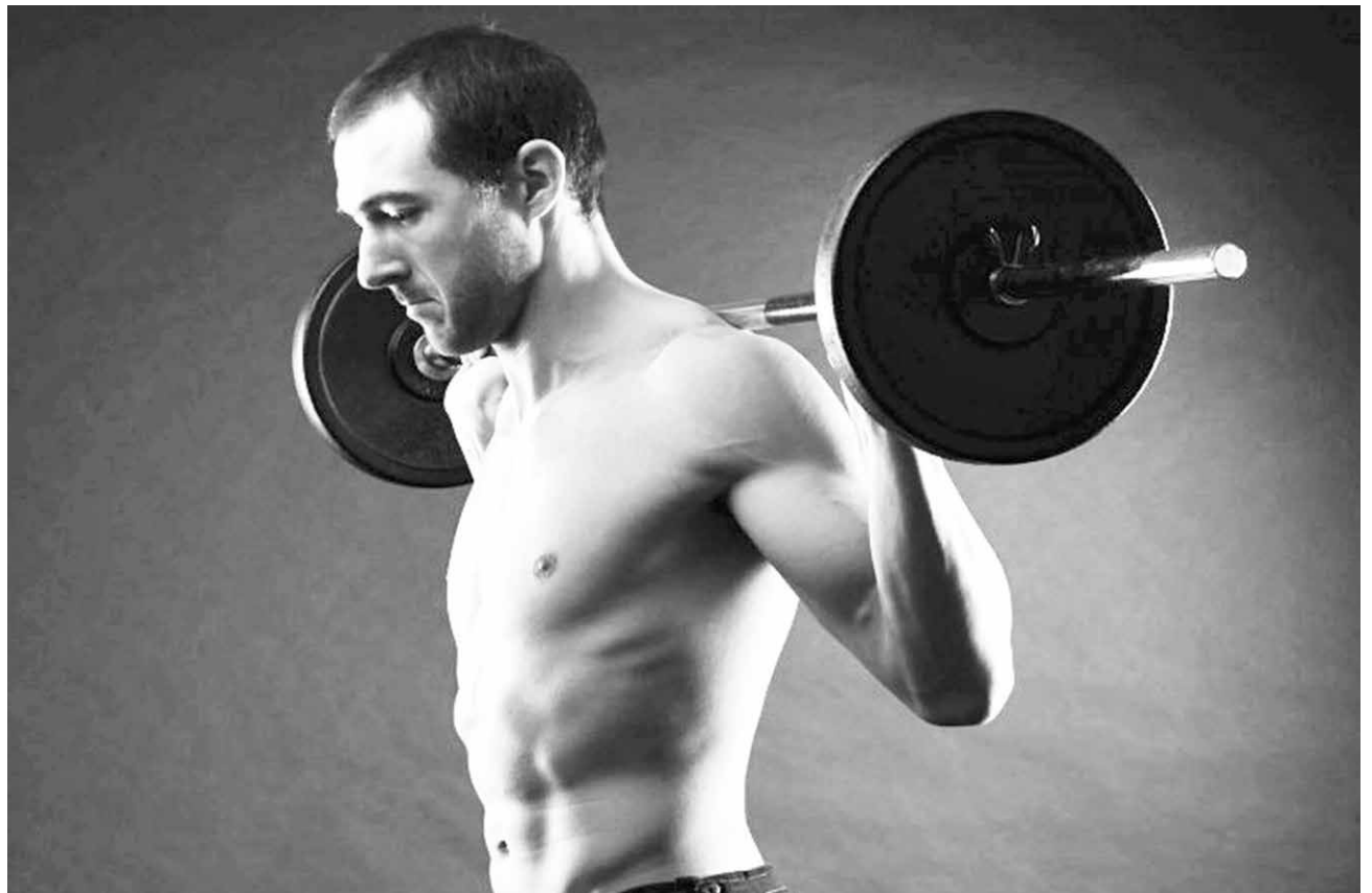
LO PRINCIPAL PARA EVITAR lesiones es fortalecer la espalda, por lo mismo es relevante ejercitarla.

Cuando se permanece mucho rato de pie, es importante que no se cargue el peso en la zona lumbar. Es necesario que se cambie habitualmente la postura subiendo una pierna un poco más alta que la otra, andando para descargar la zona de la espalda. Para que no se cargue la espalda se debe evitar llevar calzado plano. Es aconsejable usar un poco de