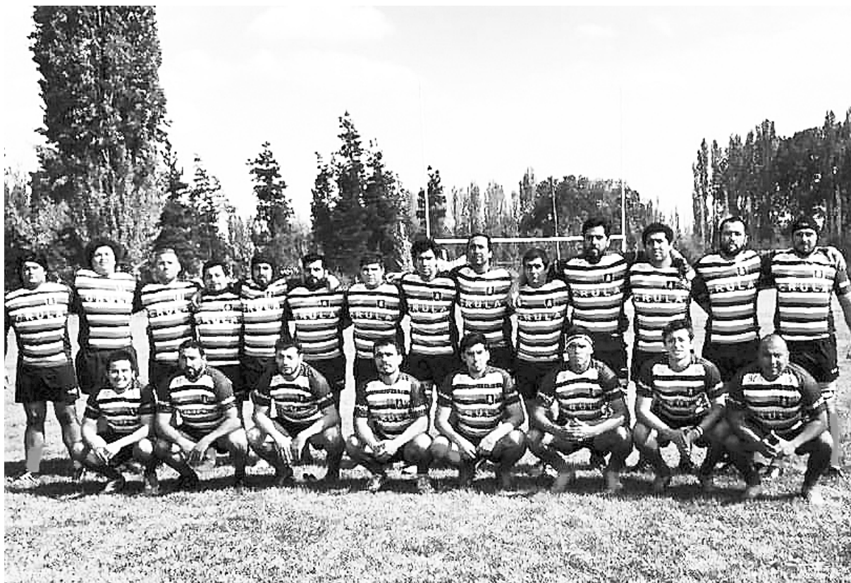
ESTE SÁBADO ENFRENTARÁ a Panguel de Chillán en el recinto Socabío a eso de las 15:30 horas.

El club también posee una rama infantil, que entrena los días sábado a las 11 de la mañana en el club Adomares, donde asisten niños de 5 a 13 años.