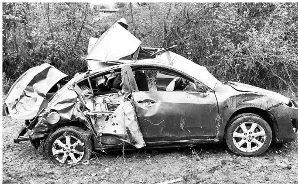
EL FATAL ACCIDENTE se registró a la altura del kilómetro 5 de la ruta que conecta a la localidad de Huépil con Trupán.

A causa del impacto, el automóvil resultó comple-