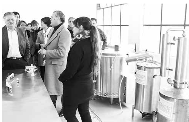
AUTORIDADES COMUNALES encabezaron la inauguración de estas importantes obras en el Liceo Llano Blanco.

El Liceo Agroindustrial Llano Blanco tiene, además de la especialidad de Técnico en Elaboración de Alimentos, la de Técnico Agrícola, para lo cual desarrolla plantación de berries, legumbres y hortalizas, entre otros.