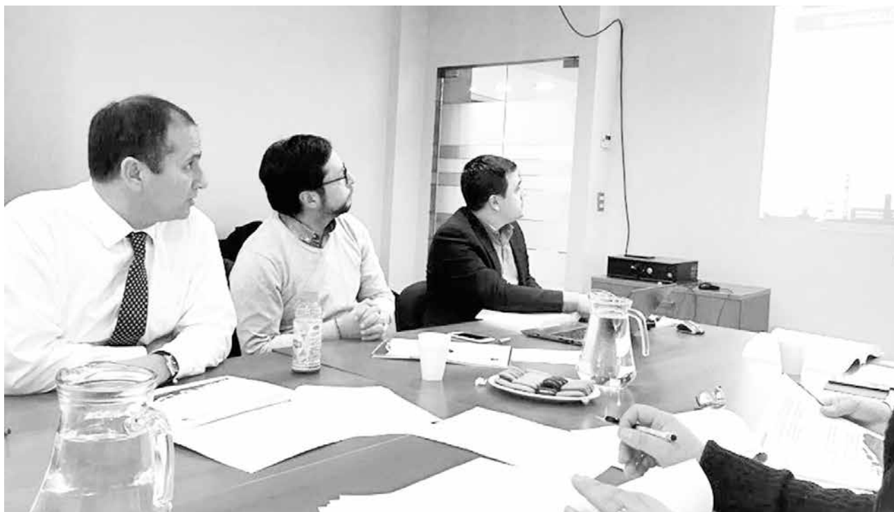
TODOS LOS AÑOS, las autoridades regionales viajan a Santiago a hacer la defensa del presupuesto para la región correspondiente al año siguiente.

El jefe de la División de Análisis y Control de Gestión del Gobierno Regional,