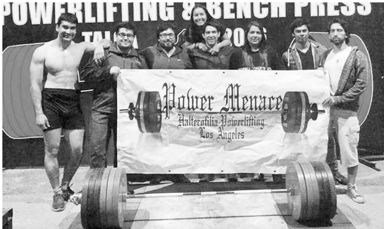
COMPUESTO POR UNA DECENA de competidores, el club angelino PowerMenace busca conseguir cupos para un mundial en Argentina.

No por nada fueron el equipo más fuerte de Chile y obtuvieron cinco medallas de oro y un segundo lugar, dejando no sólo en lo alto el nombre del club al que pertenecen, sino que también a la ciudad de donde proceden: Los Ángeles.