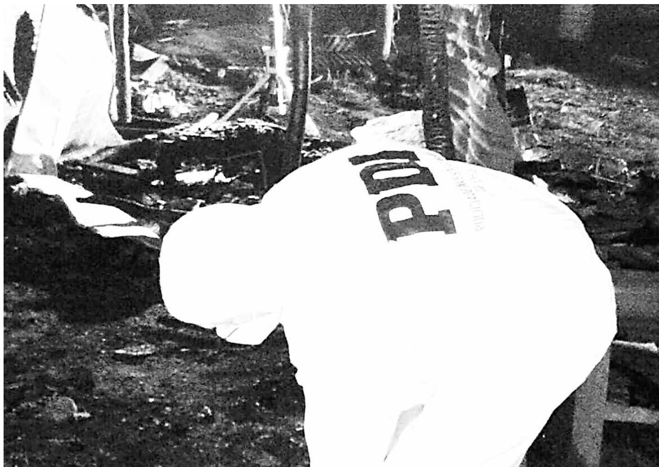
DOS PERSONAS murieron calcinadas en un incendio registrado a la altura del kilómetro 5 del camino a Antuco.

Toda una vida de esfuerzos reducida a cenizas. Es lo