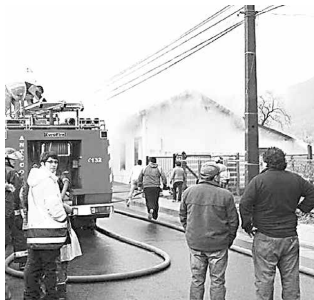
EL SINIESTRO AFECTÓ a una casa ubicada a la altura del #449 de calle O'Higgins, en la comuna de Antuco.

Asimismo, desde la institución detallaron que no se registraron personas heridas a consecuencia de la emergencia y las causas basales que originaron el siniestro deberán ser investigadas por voluntarios de Bomberos.