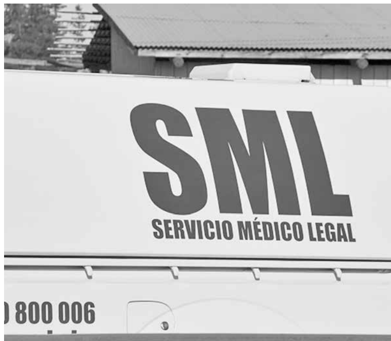
LA BRIGADA DE HOMICIDIOS indaga las circunstancias en que murió el hombre hallado en la población O'Higgins.

Un hecho de sangre se registró durante la madrugada de este sábado en el sector norponiente de la comuna de Los Ángeles.