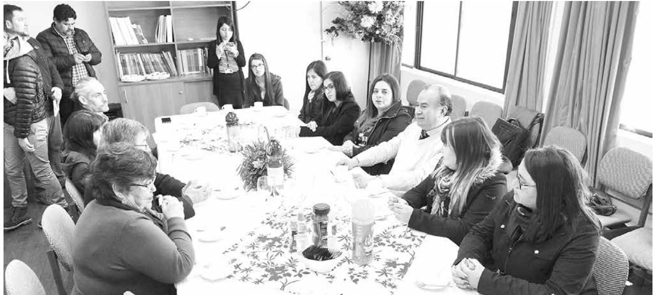
PROFESORES FAVORECIDOS con un primer aumento de sueldo luego de haber ingresado a la carrera docente, se reunieron con autoridades de la provincia.

“Estamos bastante conformes con lo que ha significado el inicio de esta carrera docente en cuanto a remuneraciones del profesorado. He escuchado que muchos han dicho que es lo que faltaba para ellos sentirse más contentos y motivados en seguir desarrollando la carrera hasta llegar al tramo más alto