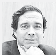
Diputado Iván Norambuena

Un afectuoso saludo en el día del dirigente.