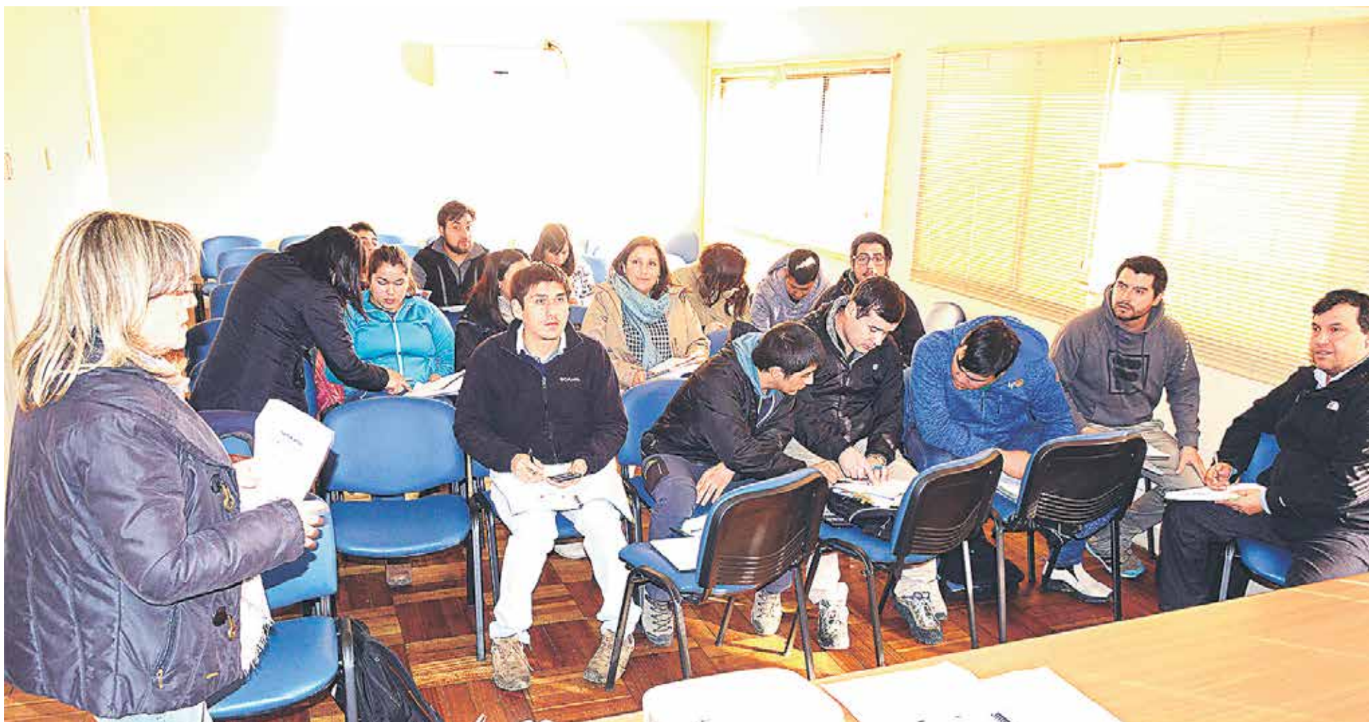
EN DEPENDENCIAS de la Gobernación del Biobío fue dictado este curso durante una semana.

Un total de 15 alumnos provenientes de las regiones del Biobío, La Araucanía y Los Ríos fueron capacitados en el marco del programa Pre-embarque SAG-USDA APHIS-ASOEX.