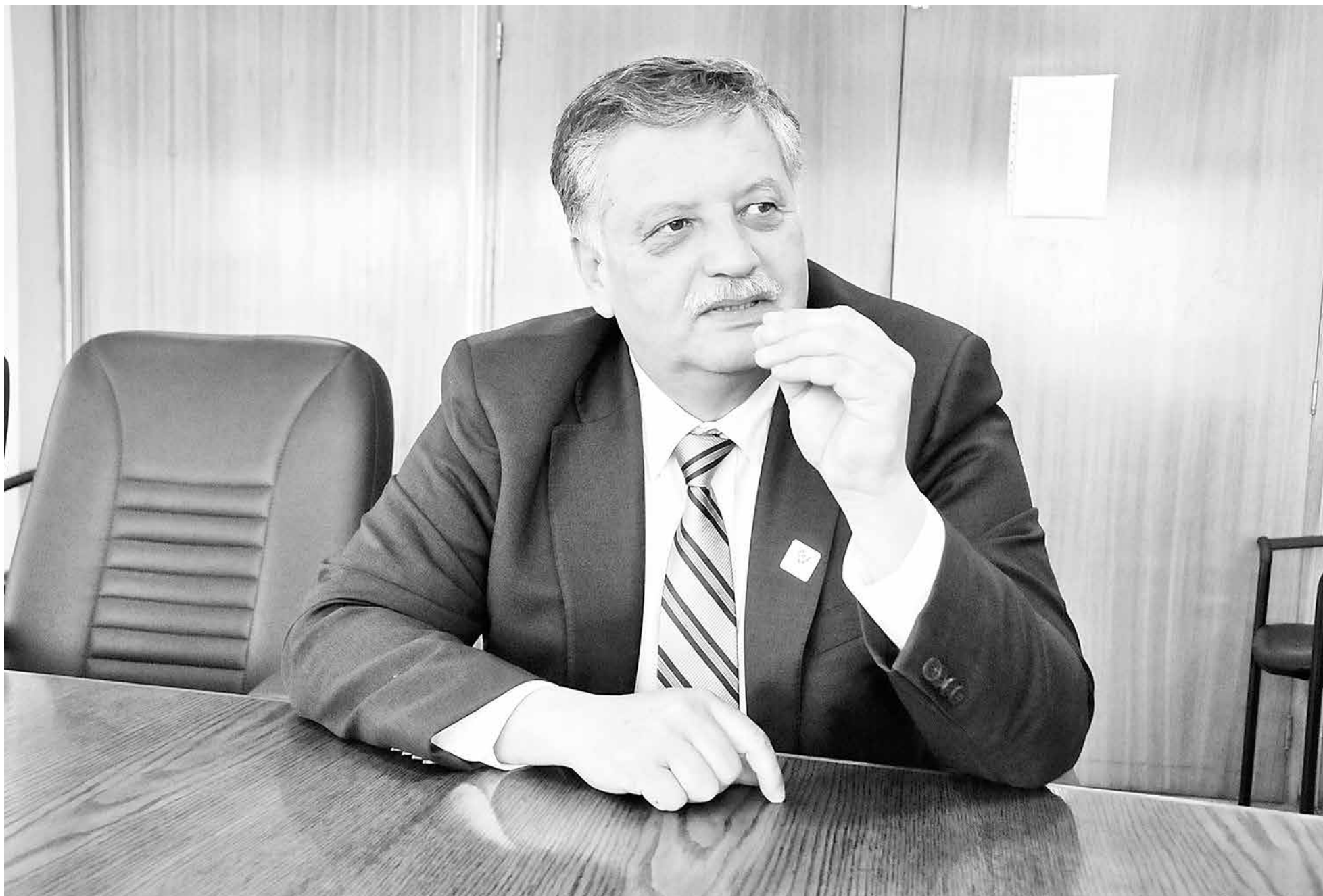
EXPERTOS EN COMUNICACIONES analizaron la nueva apuesta del alcalde para salir a contestar las inquietudes de la ciudadanía.

Debido a la ola de críticas surgidas en el último tiempo a raíz de temas polémicos como ECM, la ampliación del Cementerio General y las faltas detectadas por Contraloría, entre otros, Esteban Krause ha optado por retomar una estrategia que le rindió réditos durante la campaña: interactuar con la comunidad por medio de redes sociales