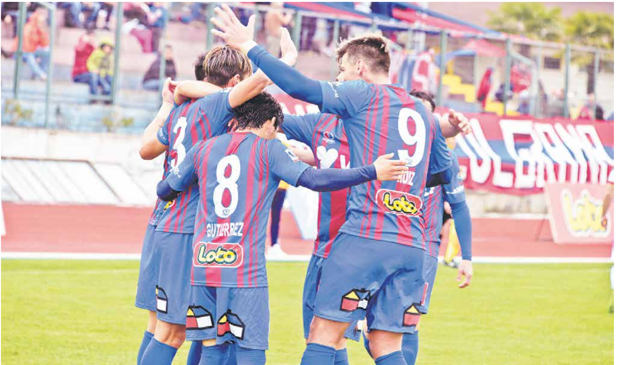
IBERIA DERROTÓ con justicia a Deportes Valdivia en partido válido por la segunda fecha del Campeonato Loto Transición 2017.