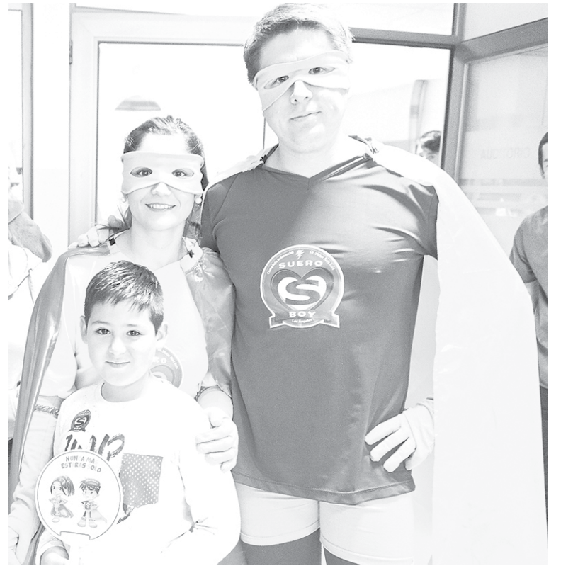
PROFESIONALES MÉDICOS de la misma sección de Pediatría se ofrecieron para convertirse en estos nuevos superhéroes.

La presentación de esta novedosa iniciativa fue seguida por un recorrido por las distintas salas de Pediatría, ocasión que