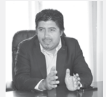
Jorge Rivas Figueroa Alcalde de Mulchén