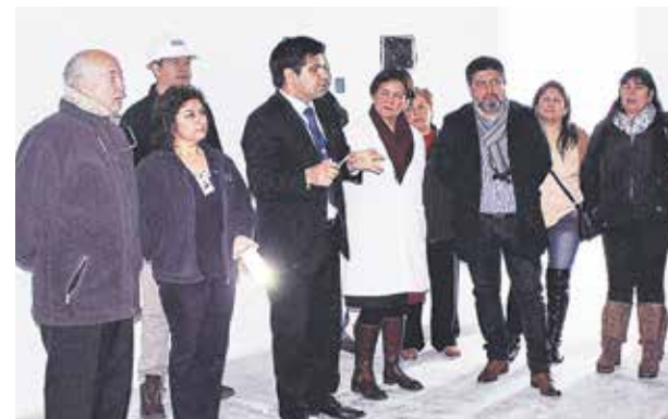
LAS OBRAS DEL PABELLÓN contemplan una inversión que bordea los $558 millones.

"Realmente estamos muy contentos de que estos proyectos se estén empezando a hacer realidad porque es una muy buena forma de mejorar la atención en red del Servicio de Salud Biobío, con lo cual vamos a dar solución a una gran cantidad de problemas a nuestra comunidad, y además obviamente vamos a disminuir la lista