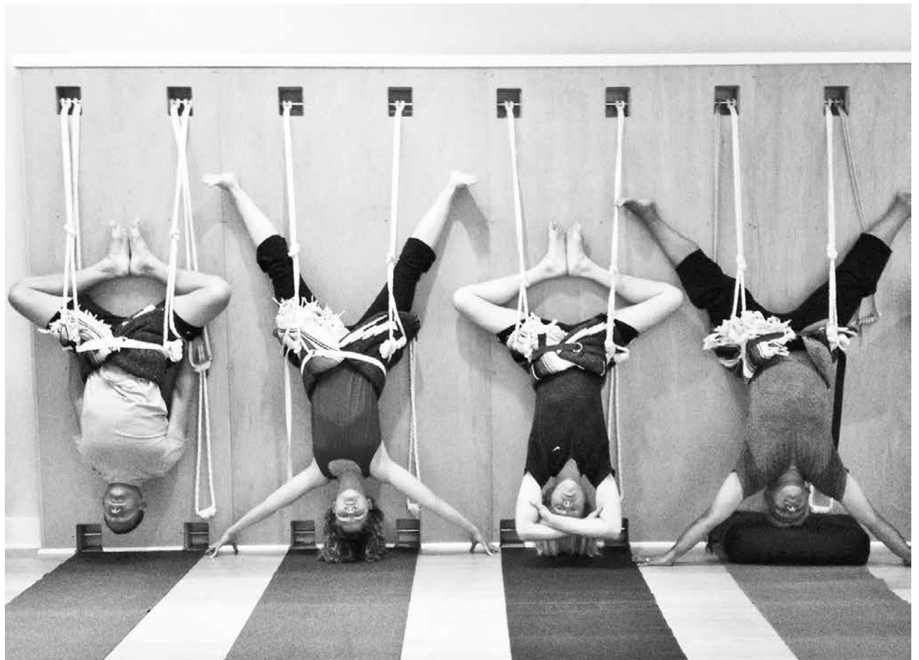
PUEDEN SER UN COMPLEMENTO ideal para las personas que practican algún deporte de alto rendimiento.

Comprenden todas aquellas posiciones que se realizan estando de pie, y en las que se trabajan piernas, espalda, rodillas, pies y cadera.