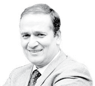
Rodrigo Díaz Intendente Región del Biobío

No somos prisioneros del destino, nuestras acciones importan. Las ideas creativas