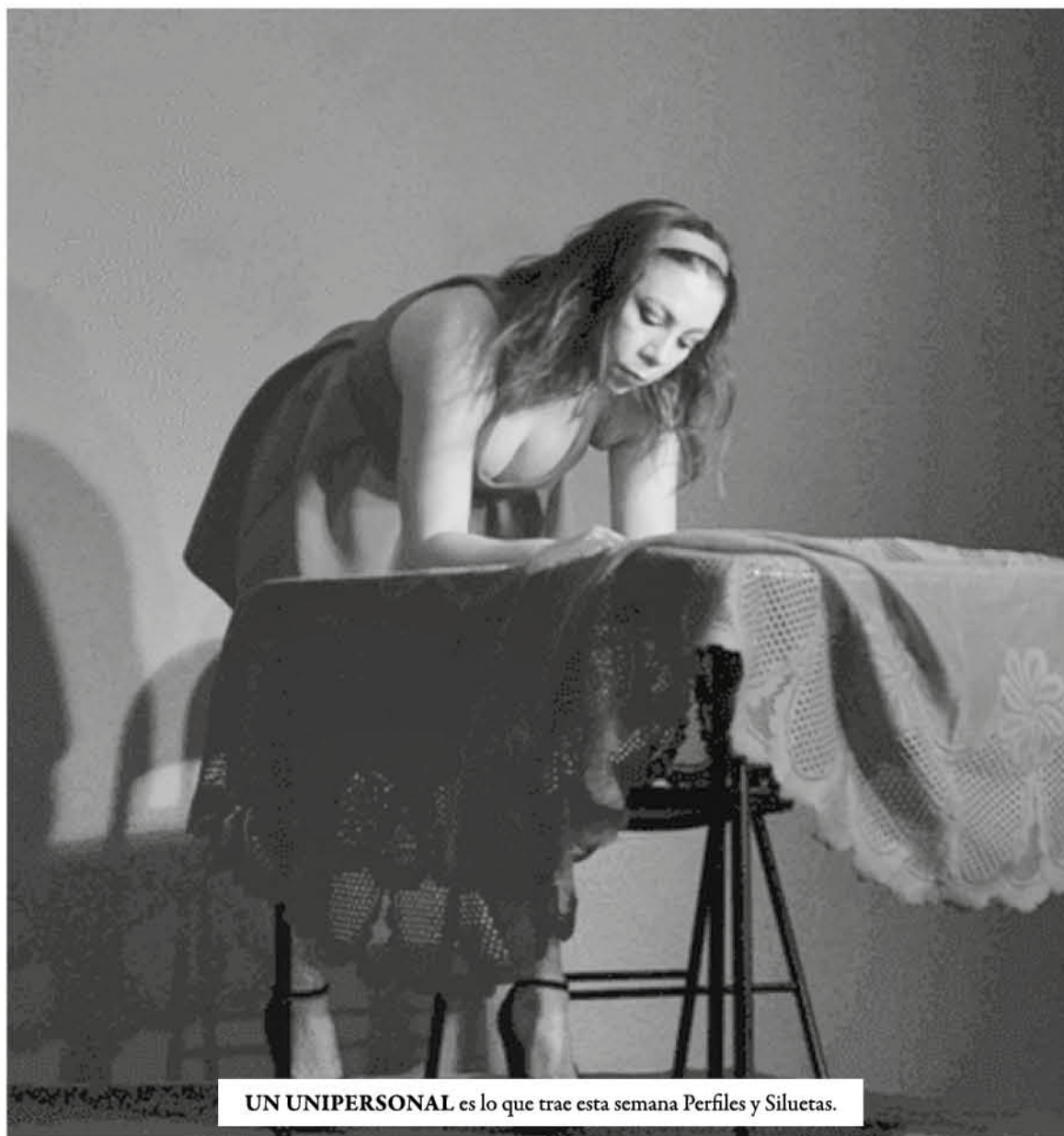
UN UNIPERSONAL es lo que trae esta semana Perfiles y Siluetas.

de poder lograr hacer este encuentro con elencos de diferentes partes que quieran estar en la ciudad y que en general el público ha respondido bien, por lo que, dice, se está generando un hábito de tener un panorama teatral los fines de semana.