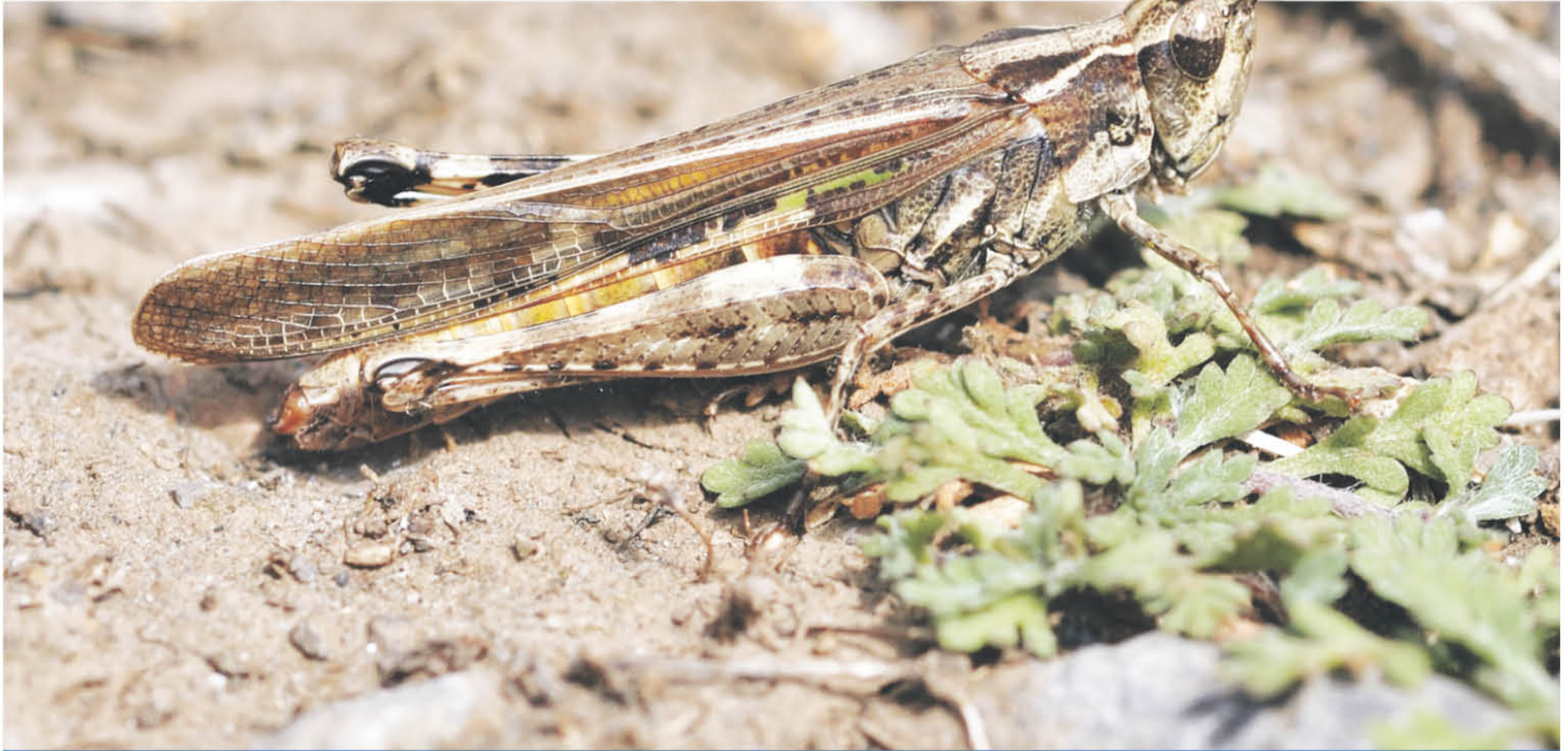
LAS LANGOSTAS COMIENZAN a aparecer en esta época del año, dejando estragos en ganadería y agricultura.