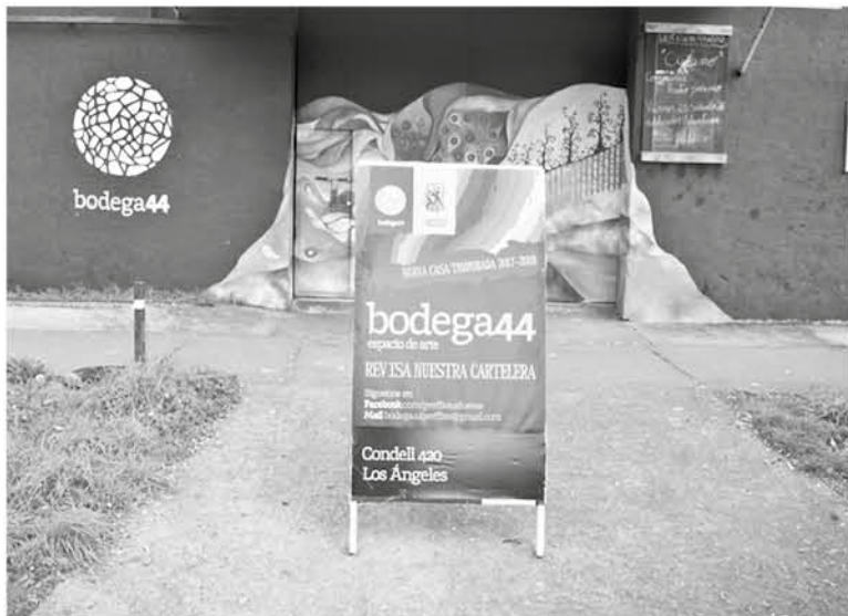
BODEGA 44 nuevamente trae al escenario angelino una obra ya probada.

“Ama es un unipersonal, que significa que es una persona la que interpreta diferentes roles. Es una obra feminista particularmente, tiene que ver con esa mirada patriarcal del amor que tenemos en Chile, que todavía existe harto, donde la mujer queda relegada a un plano más de la casa y en un relación idílica y vivimos felices para siempre”.