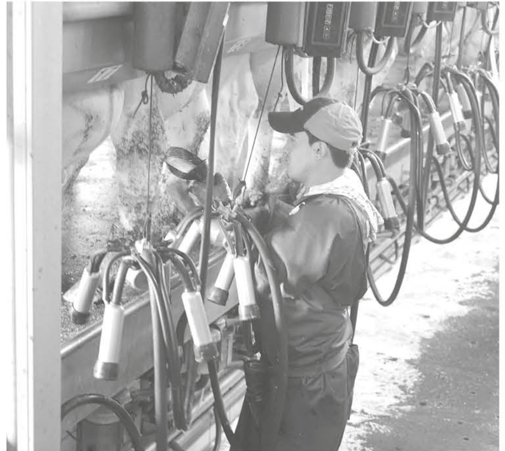
EL PASADO 8 DE MARZO comenzaron las investigaciones por el aumento de sus importaciones.

"Hasta el momento, los únicos favorecidos con esta situación han sido los inte-