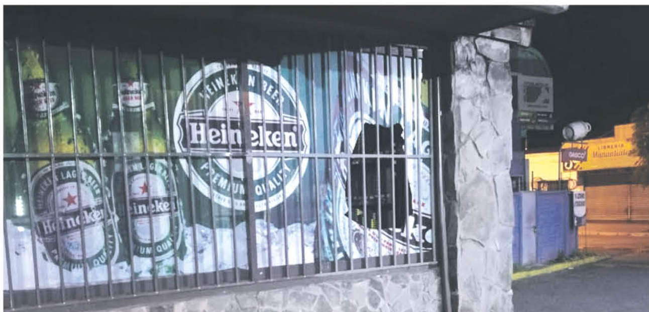
LOS MALHECHORES HICIERON un agujero por donde sustrajeron la mayor cantidad de artículos posibles, limitados por una reja.

El involucrado quien ya a su corta edad mantiene antecedentes delictuales actuó en compañía de otro joven de 19 años.