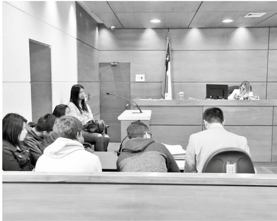
ESTE RESPONSABLE REALIZABA compras personales con distintos documentos que adquiría mientras realizaba funciones en el departamento de proveedores. (Foto de contexto)

En el proceso se reconoció que el individuo tenía entre