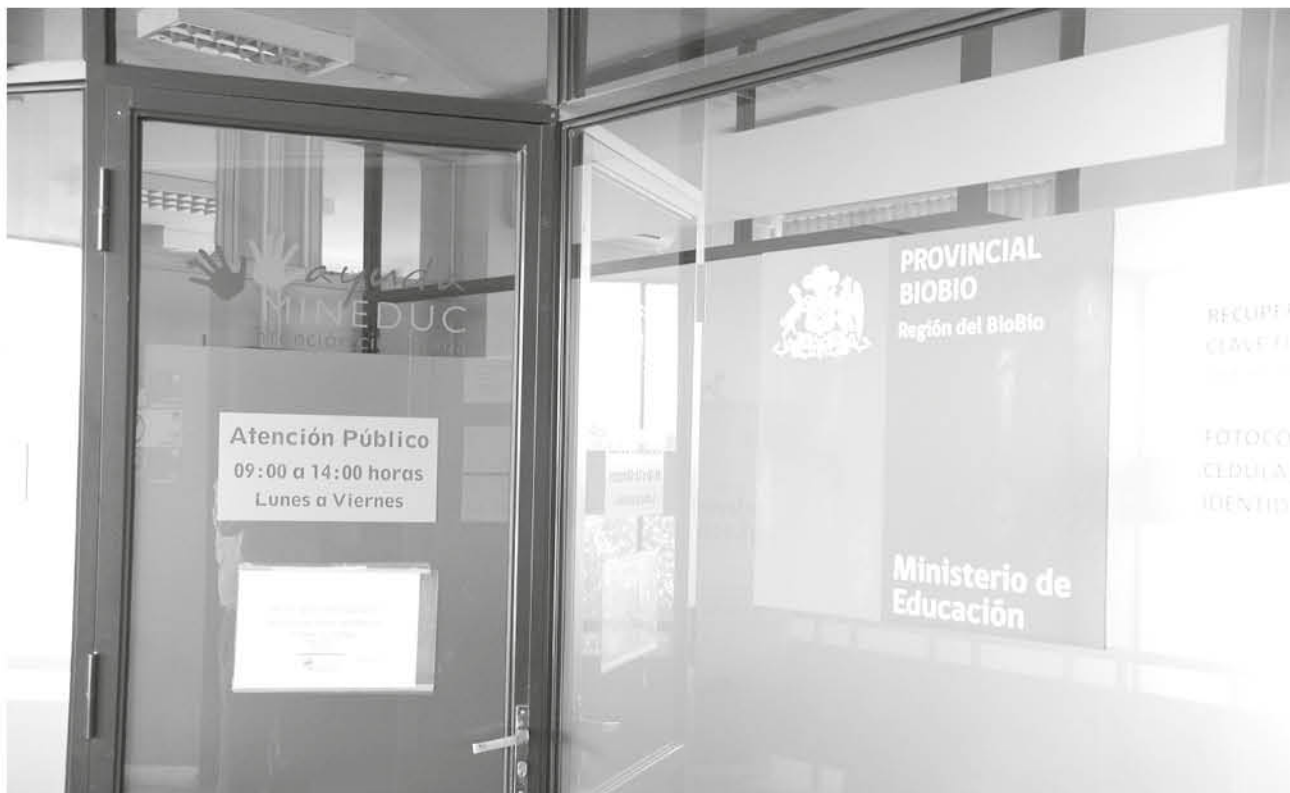
LA ATENCIÓN será hasta las 13:30 horas.

Desde las 11 hasta las 13:30 horas de este jueves, en la oficina del Departamento Provincial de Educación de Los Ángeles, ubicada en los edificios públicos de calle Caupolicán, se estará recibiendo a la comunidad para atender sus requisitos.