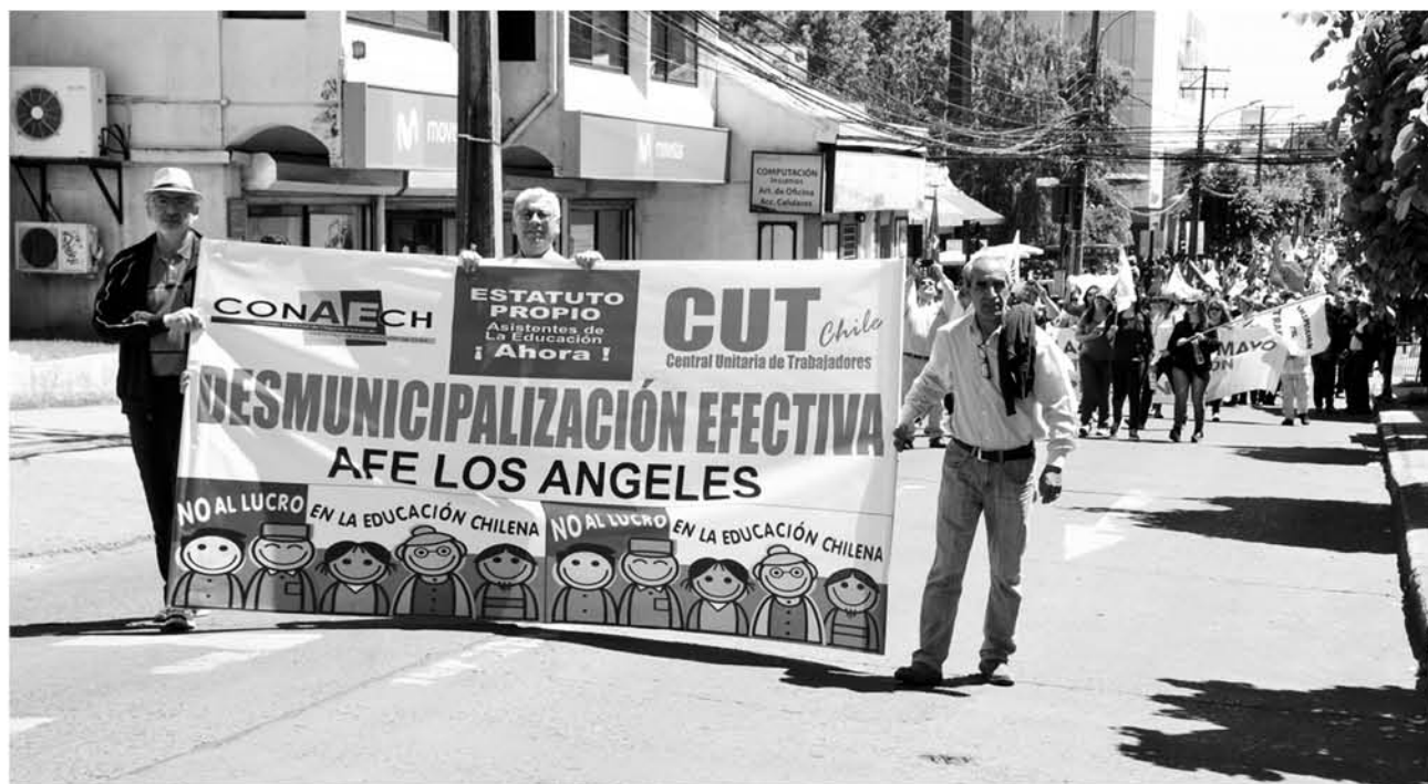
“SI NOSOTROS VAMOS POR UN PROYECTO de reajuste salarial de sector público, es eso y no temas reivindicativos”, dijo el dirigente sindical.

Sin embargo, el día lunes, después de una breve reunión en los salones de la CUT en Los Ángeles de la mesa de