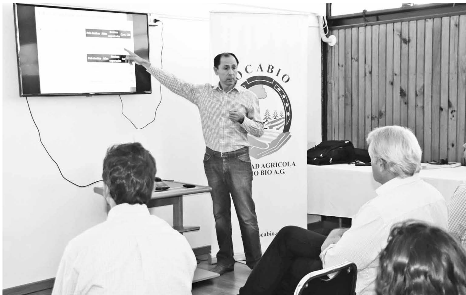
SE REALIZÓ UNA JORNADA DE CAPACITACIÓN para ganaderos en las comunas de Mulchén y Los Ángeles con la finalidad de dar a conocer las actualizaciones realizadas SIPECweb del Programa Oficial de Trazabilidad Animal que ejecuta el SAG.

Sistema en línea permite obtener de manera inmediata información de los establecimientos pecuarios, de sus titulares y de los animales con DIIO registrados en la base de datos del SAG, facilitando de esta forma la entrega del FMA.