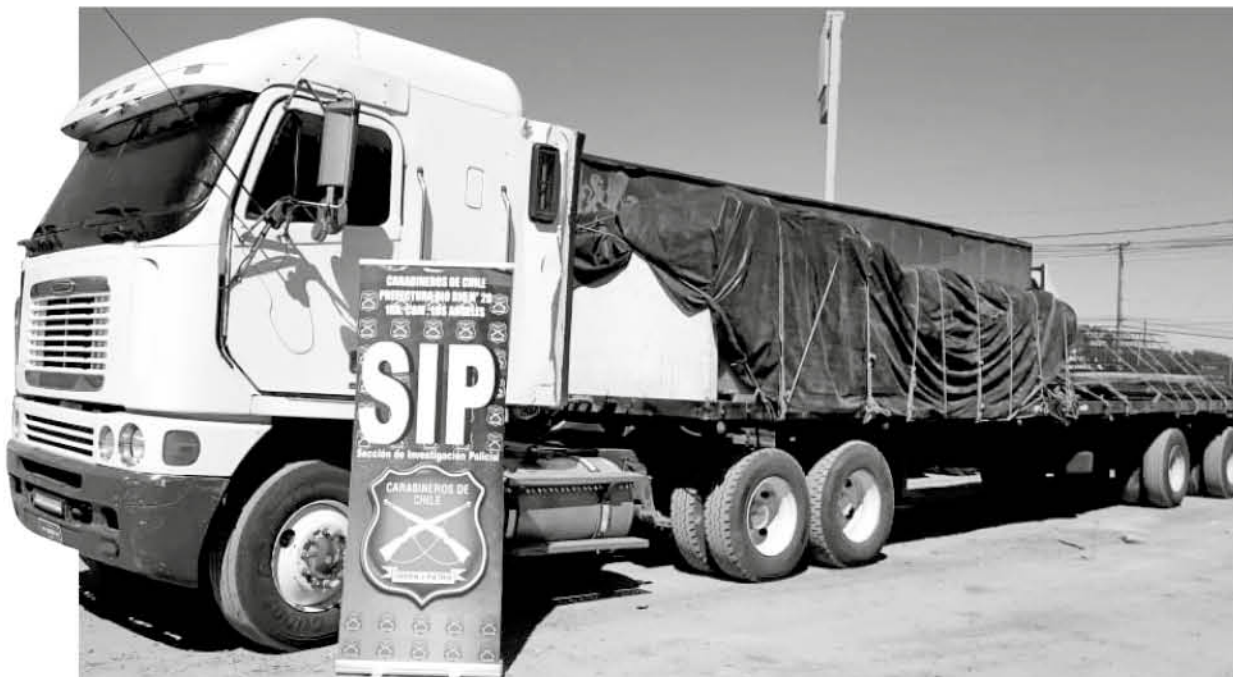
A LA HORA DE SER ASALTADO, el camión trasladaba una carga de materiales de construcción avaluados en un total de 20 millones de pesos, los que se dirigían a Temuco.

En la capital provincial fue recuperado un camión con orden de robo de Ñuble, el que estaba oculto por una mujer en una bodega, en el sector camino a Paraguay.