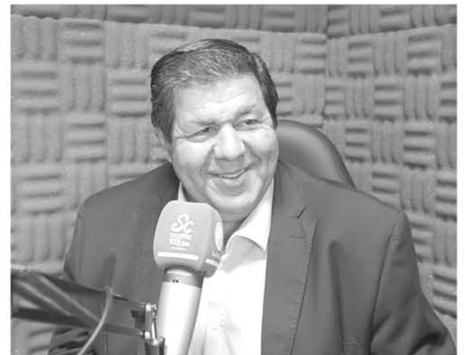
EL ALCALDE VELOSO declaró en radio San Cristóbal los avances de la gestión municipal en el tema de la vivienda para su comuna.

Igualmente, la gestión de los centros cívicos de Trupán Y Polcura, “por lo tanto tenemos una agenda súper nutrida con el ministro de la vivienda”, finalizó la autoridad.