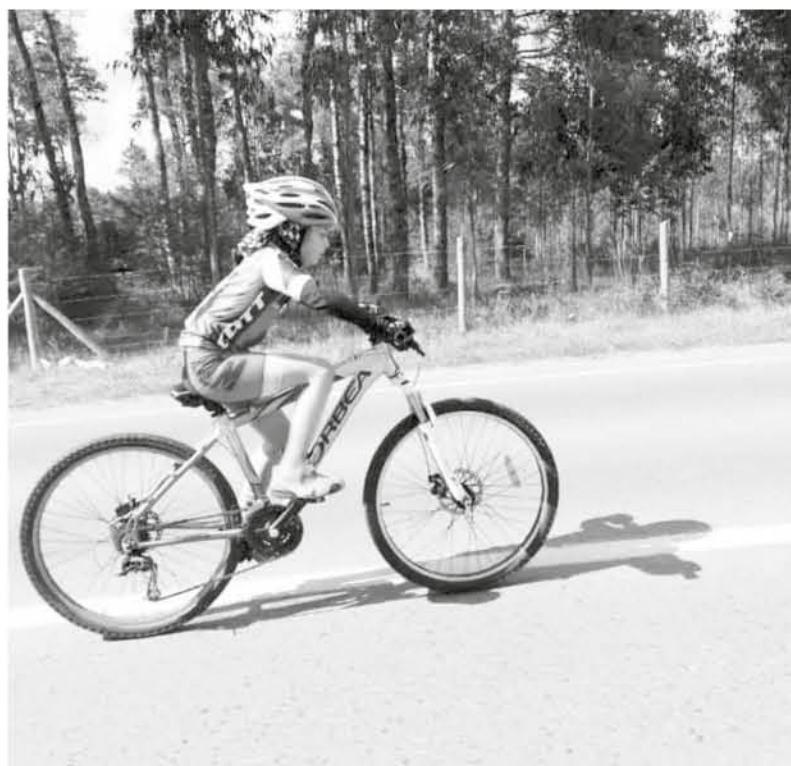
AL CAMPEONATO NACIONAL asistieron más de 200 ciclistas que lucharon por el podio en las inmediaciones del balneario de Curanilahue.

Con este triunfo la deportista de 8 años se tituló como la mejor ciclista de la modalidad derrotando a sus similares que asistieron desde todo Chile.