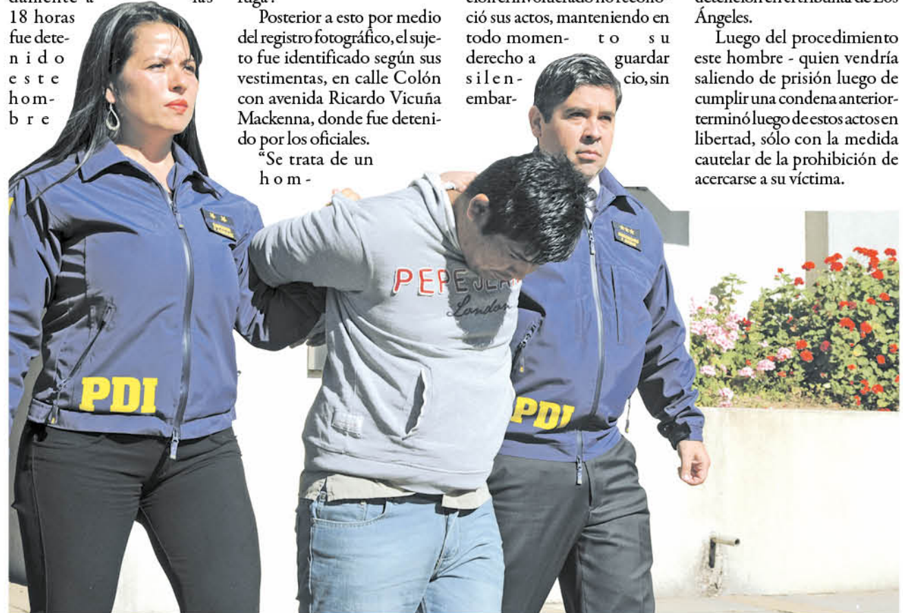
ESTE HECHO se dio a conocer en diferentes redes sociales donde la mujer agredida manifestó el acto que este sujeto habría cometido contra ella.