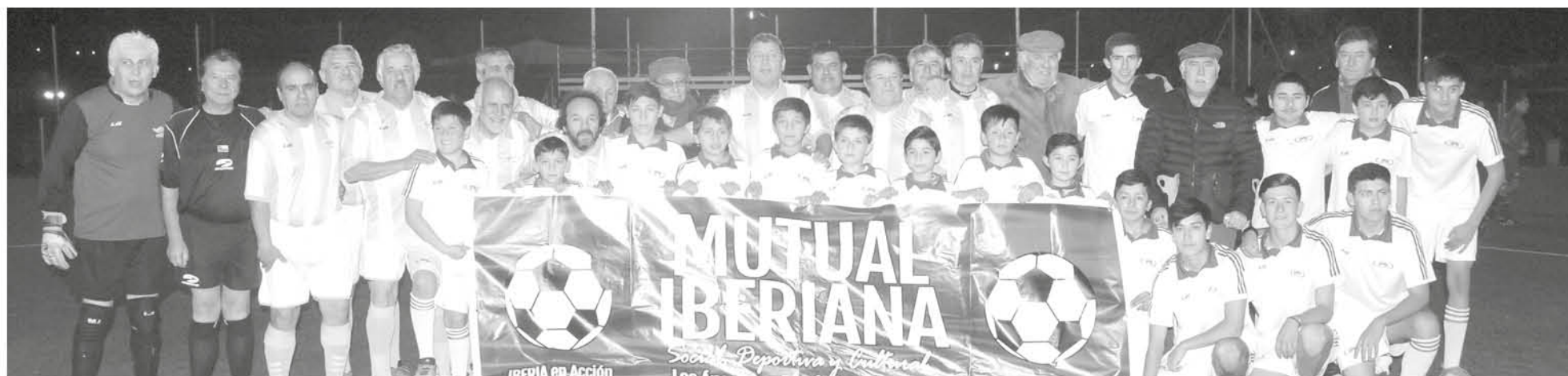
ESTA CRUZADA SOLIDARIA se realizará también para que los asistentes comprendan y valoren la importancia de ayudar.

En el marco del evento a beneficio más importante del país, la asociación de ex jugadores del club angelino de fútbol realizará un evento deportivo para colaborar.