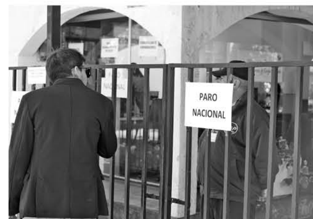
DIVERSOS ORGANISMOS públicos de Los Ángeles se sumaron a la paralización.

El sector público logró 3,5% de reajuste salarial a partir del 1 de diciembre de este año.