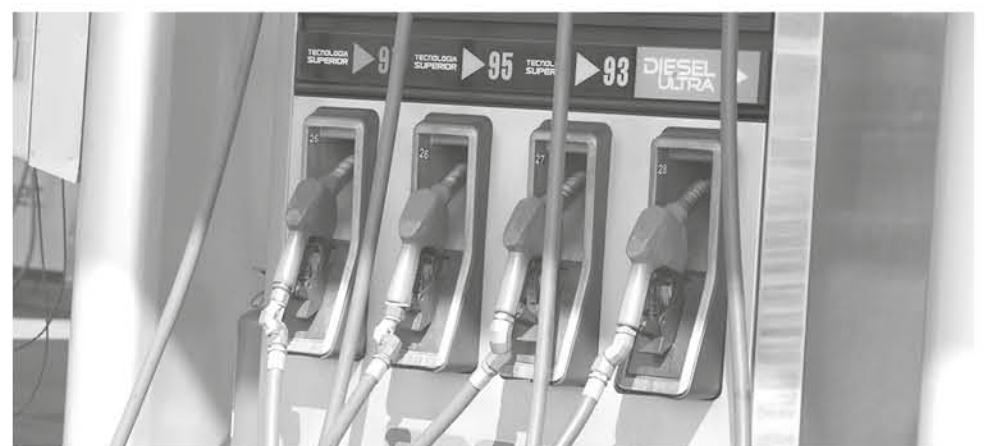
TODAS LAS GASOLINAS bajarán $5,8 por litro.

La variación ya acumula en promedio una disminución de $32 pesos por litro en los derivados del petróleo.