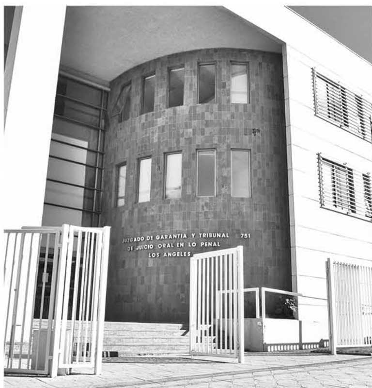
LA FALTA DE PRUEBAS en este caso se debió a que la misma víctima huyó del centro asistencial.

A primera hora del pasado miércoles se llevó a cabo la apertura del juicio condenatorio en contra de un hombre, acusado de agredir a una mujer con un hacha, luego de una discusión donde ambos se encontra-