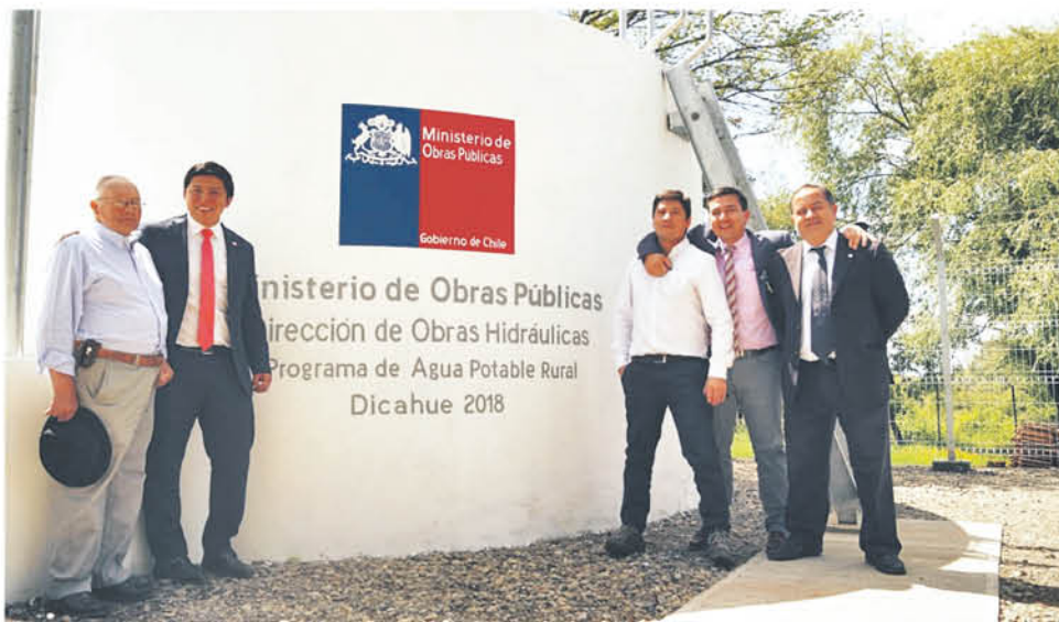
EL PROYECTO CONSISTIÓ en la construcción de un sistema de regulación, tratamiento, presurización y distribución de agua.

La iniciativa financiada por la Dirección de Obras Hidráulicas del MOP, tiene la finalidad de dotar de agua potable a un total de 220 familias del sector rural, que por años esperaban contar con este servicio, y que les permitirá optar a mejores condiciones de vida, principalmente durante la época de verano, donde la escasez hídrica ha golpeado con fuerza a algunos sectores de la comuna.