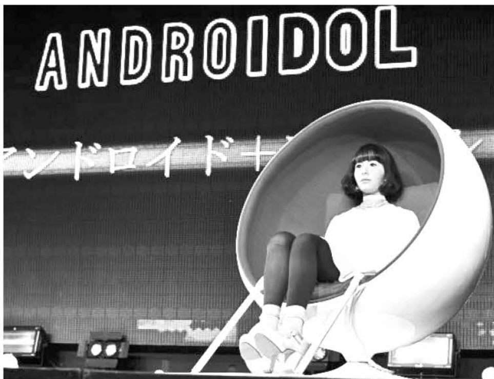
ANDROIDOL U MIDE UNOS 1,60 metros, su peso es similar al de un ser humano de esa estatura, y así forma parte de un experimento social.