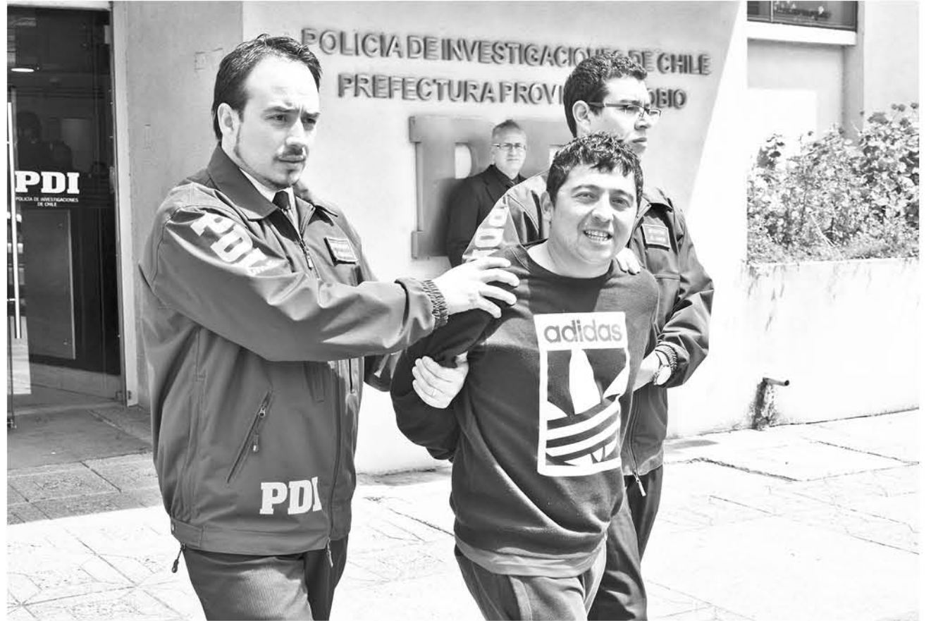
TRAS ESTA CAPTURA se da por finalizada la primera etapa de este complejo procedimiento policial.

Hay que recordar que este es un caso, que se está desarrollando desde el día 7 de noviembre, cuando fue