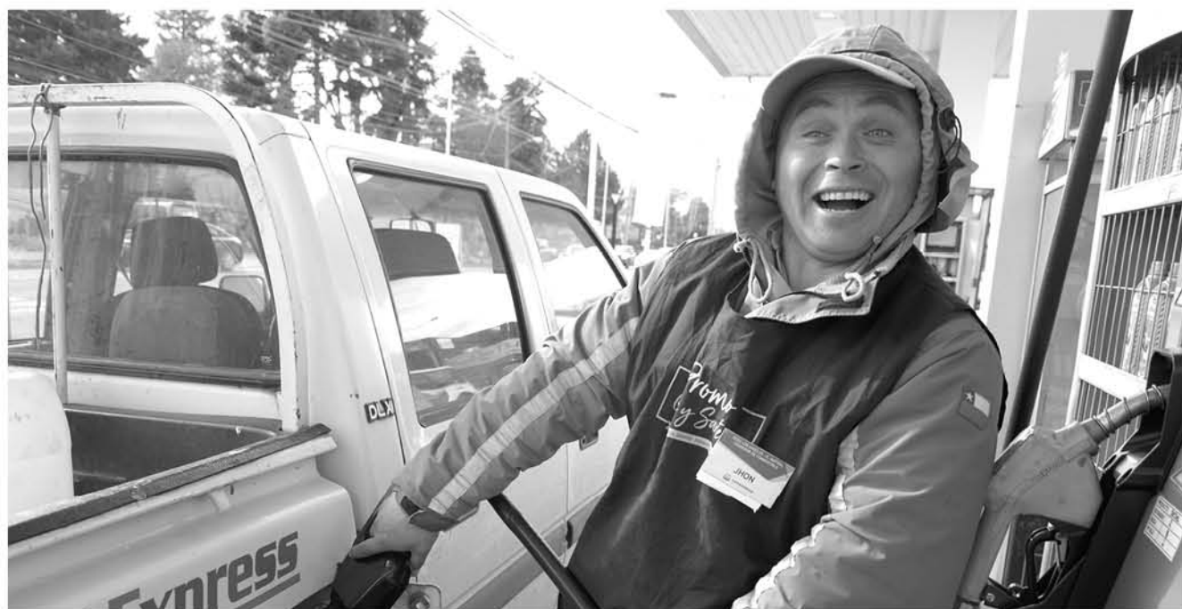
CON ESTA VARIACIÓN se cumple la cuarta semana consecutiva de baja.

Desde este jueves los derivados del petróleo, disminuirán $5,8 pesos por litro en promedio.