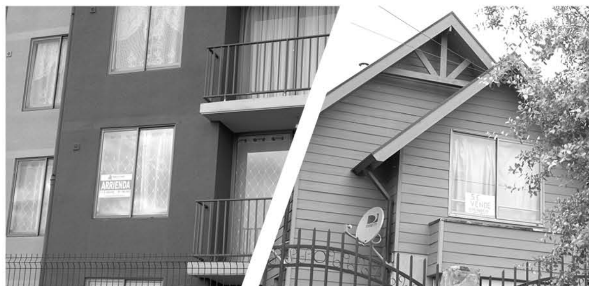
LOS PRECIOS DE LAS VIVIENDAS en Biobío, mantienen una leve alza, con un aumento promedio del 3%.

"El crecimiento del valor del metro cuadrado en Concepción la ubica como la segunda ciudad a nivel nacional en rentabilidad bruta anual de departamentos y sexto en casas, lo que sumado a las facilidades crediticias que están otorgando los bancos, la transforman en una buena oportunidad para quienes quieran invertir en el mercado inmobiliario", puntualizó Izquierdo.