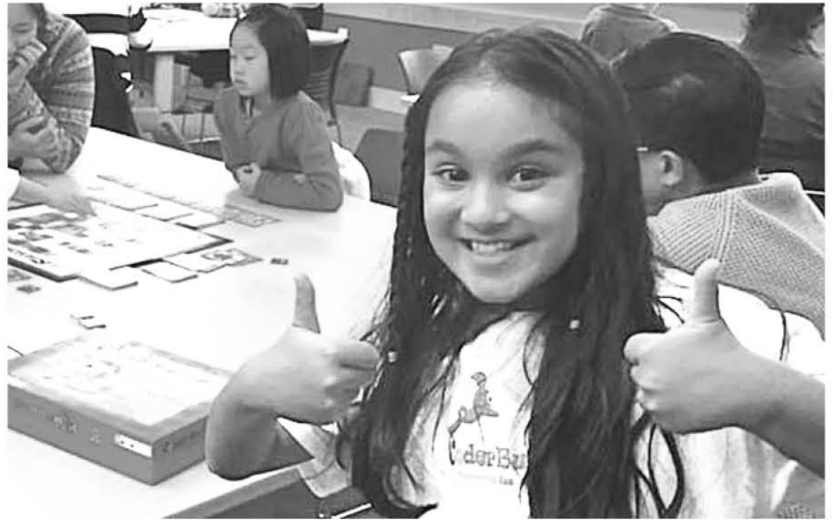
HA DESARROLLADO dos apps que generaron cerca de $35,000.

Una de las mejores lecciones de gestión de talento la ha dado una niña de origen indio de 10 años, al llamar la atención de Google y Microsoft, por haber explotado de manera creativa el tema que domina.