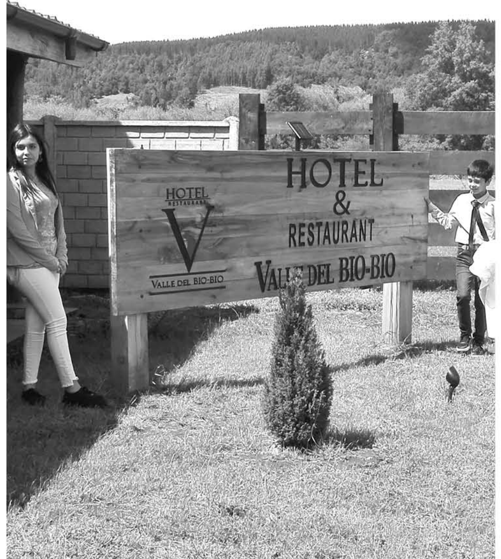
CON BASTANTE EMOCIÓN fue descubierta el letrero oficial que permite visualizar el hotel desde el camino.