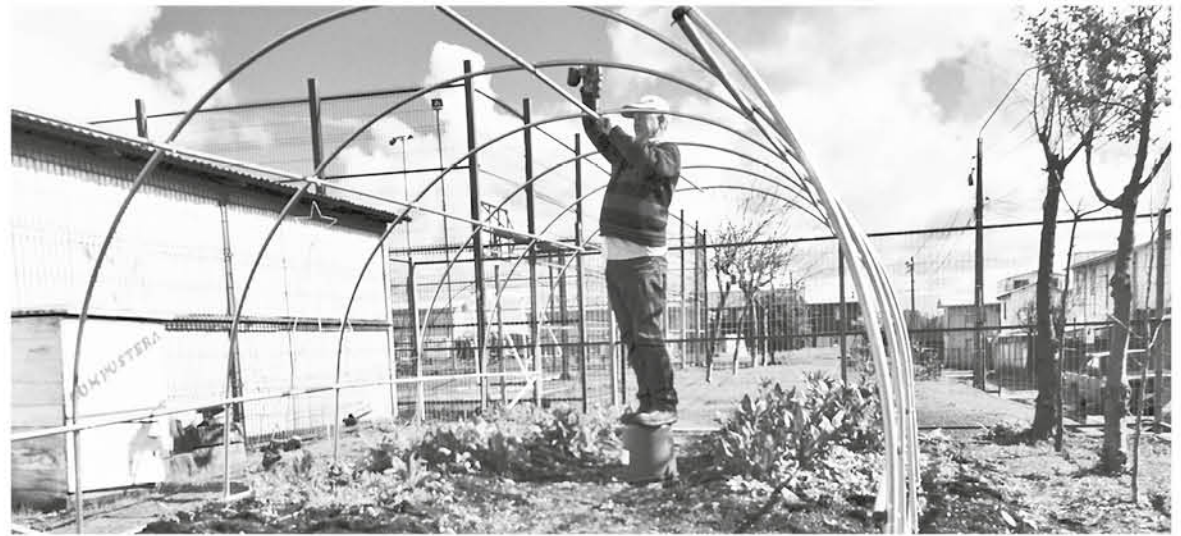
LA INICIATIVA ya se aplica en Antuco y Mulchén.

De esta misma forma, el profesional dijo que "esta iniciativa nace, principalmente, con contribuir al cuidado del medioambiente, y a la vez bajar la carga de utilización de productos químicos, ya que, lamentablemente hoy en día toda nuestras frutas y verduras que compramos en