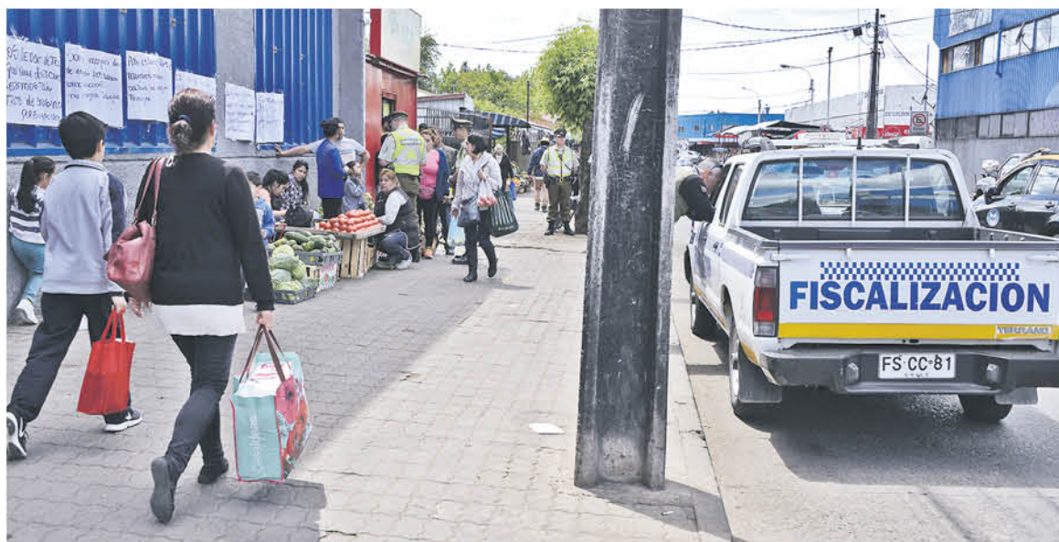
NO SON MENORES la cantidad de comerciantes que se ubican en el sector.

"Lo otro que estamos haciendo es despejar las veredas, estamos con una fiscalización permanente en ese sentido, porque mucha gente se quejaba de que no hay espacio para transitar, que las veredas estaban sucias, instaladas con vendedores ambulantes y lo otro que también ha sido importante el tema de generar las condiciones de seguridad", detalló la máxima autoridad de Los Ángeles.