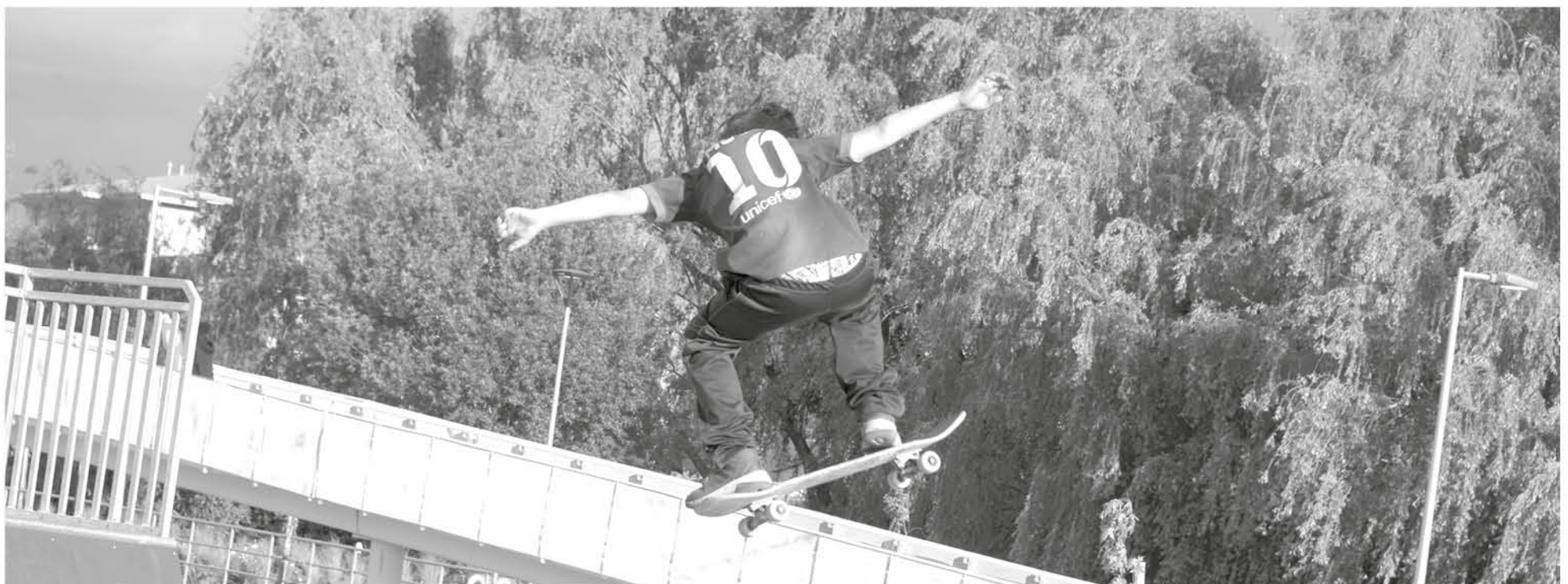
EN TODOS LOS PAÍSES el skateboarding es un deporte que crece masivamente y está pronto a ser olímpico.