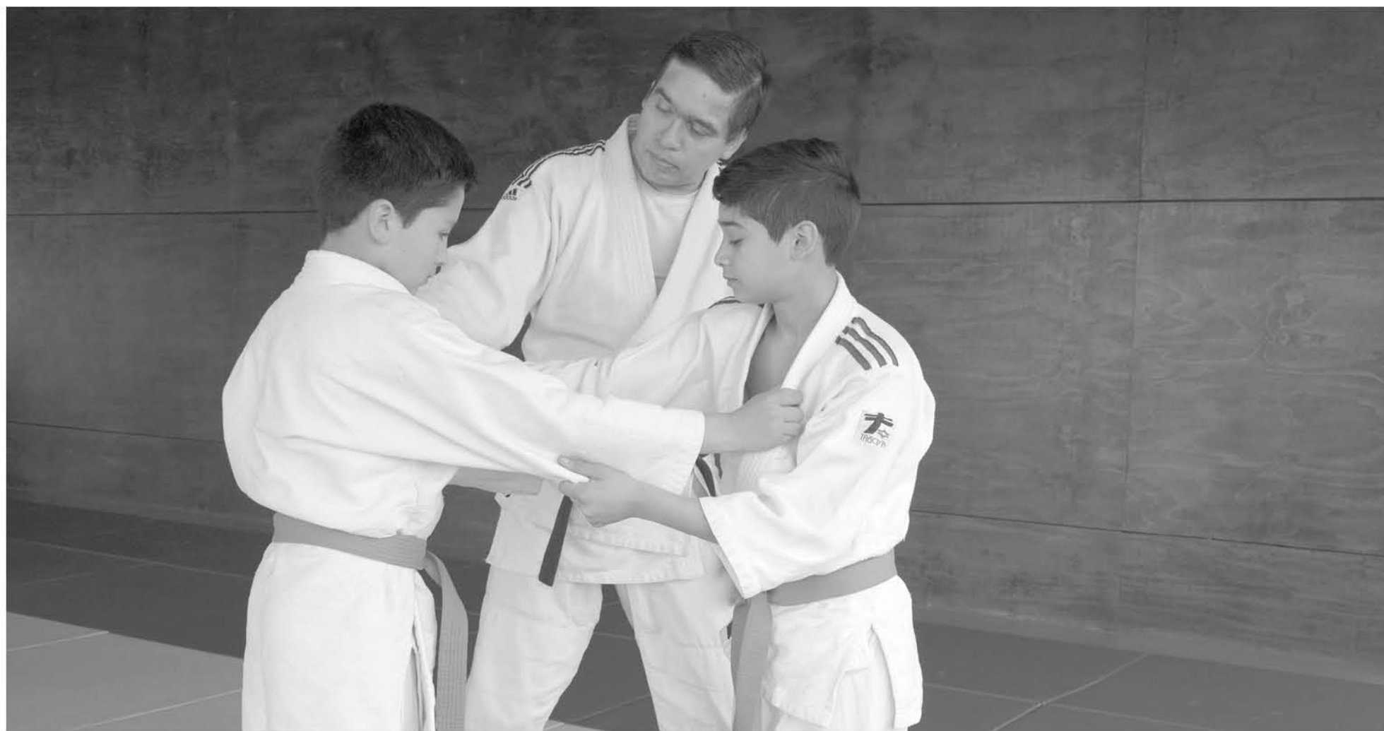
LOS TRAJES DE JUDO profesionales se los consiguieron con una asociación de la disciplina perteneciente a la novena región.

Las familias angelinas lograron reunir sólo por las suyas el dinero para que los jóvenes defendieran la bandera en la máxima cita continental debido a la paupérrima ayuda de las autoridades.