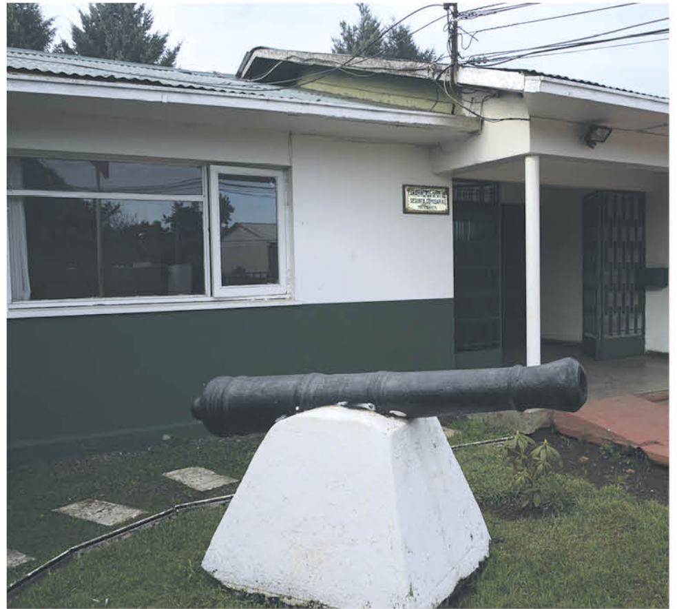
EL EX FUNCIONARIO es un hombre de 47 años quien no mantenía en los últimos años antecedentes de faltas hacia la institución.

Además de esto, el ex funcionario identificado con las iniciales D.M.O y el otro involucrado fueron dispuestos en la fiscalía local en la comuna de Mulchén, por el delito de hurto de madera.