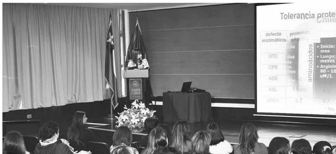
CON ESTE TIPO DE INICIATIVAS pretende capacitar a los nutricionistas de la región y a los futuros profesionales del área.

Con el objetivo de abordar distintas miradas en torno a las enfermedades metabólicas que puedan presentarse a lo largo de la vida, la carrera de Nutrición y Dietética de la Universidad Santo Tomás Los Ángeles realizó una Jornada Pediátrica destinada a profesionales dedicados al área.