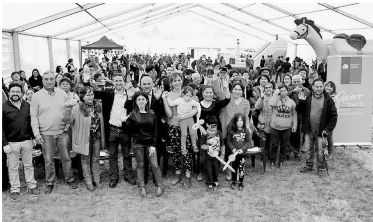
LA INICIATIVA, que se ejecuta en conjunto con el Ministerio de Vivienda y Urbanismo de la Región del Biobío y la Ilustre Municipalidad de Yumbel.

Los vecinos y familias del barrio Héctor Dávila se dieron cita en la cancha de calle 21 de mayo esquina Serrano desde muy temprano en la mañana, disfrutando de los juegos y concursos que lide-