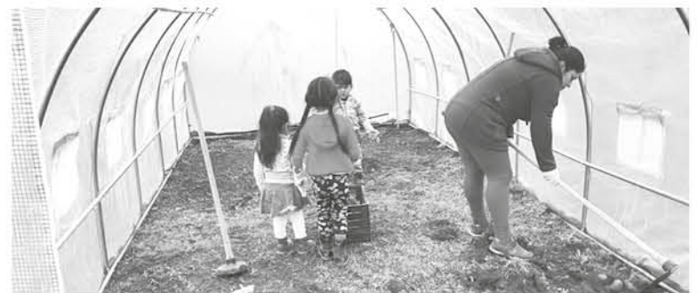
A LOS ALUMNOS se les entrega conocimientos respecto de las etapas de siembra, trasplante, riego, control de plagas, entre otros.

Cabe recordar que con el programa se busca enseñar las distintas etapas de la producción orgánica con una mirada agroecológica.