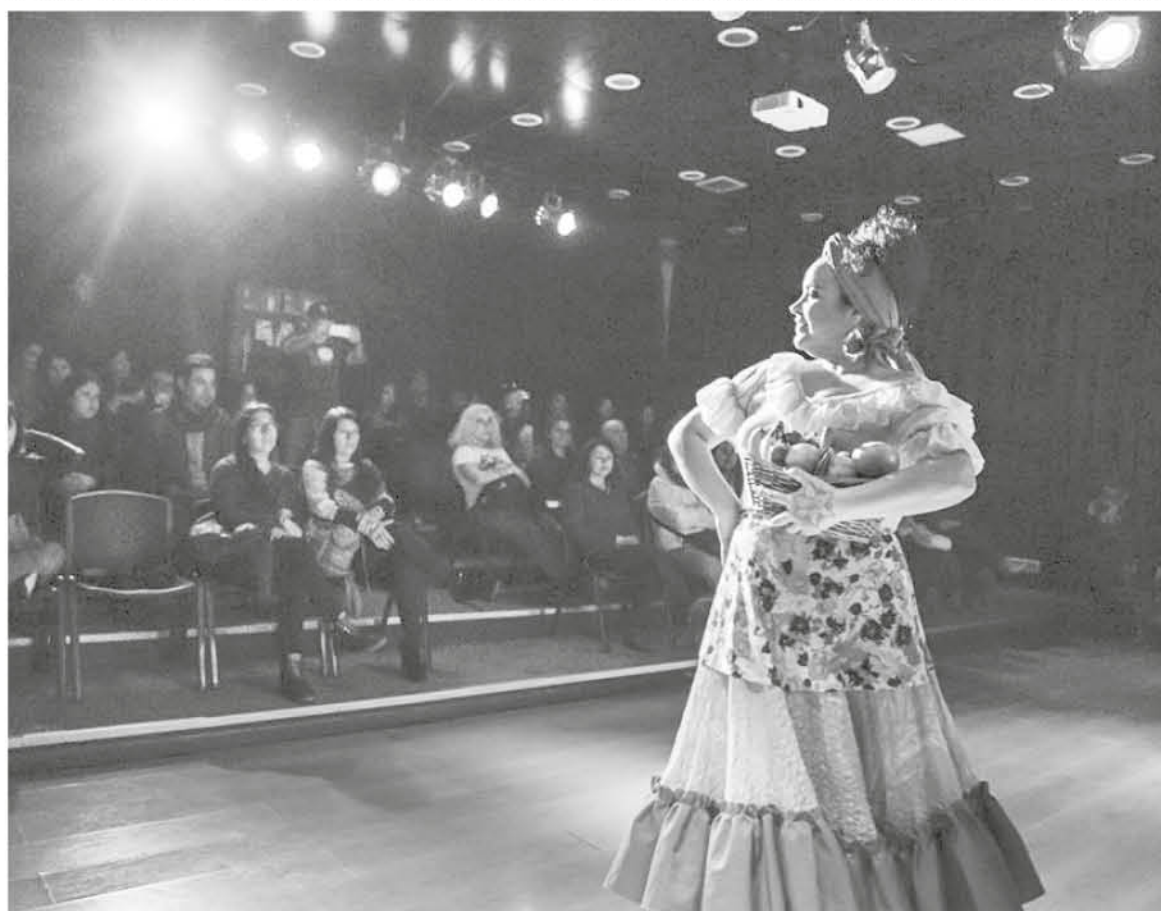
DANZA Y MÚSICA en vivo “Del África llegó mi abuela”, de la agrupación Ensamble Pacífico Sur.