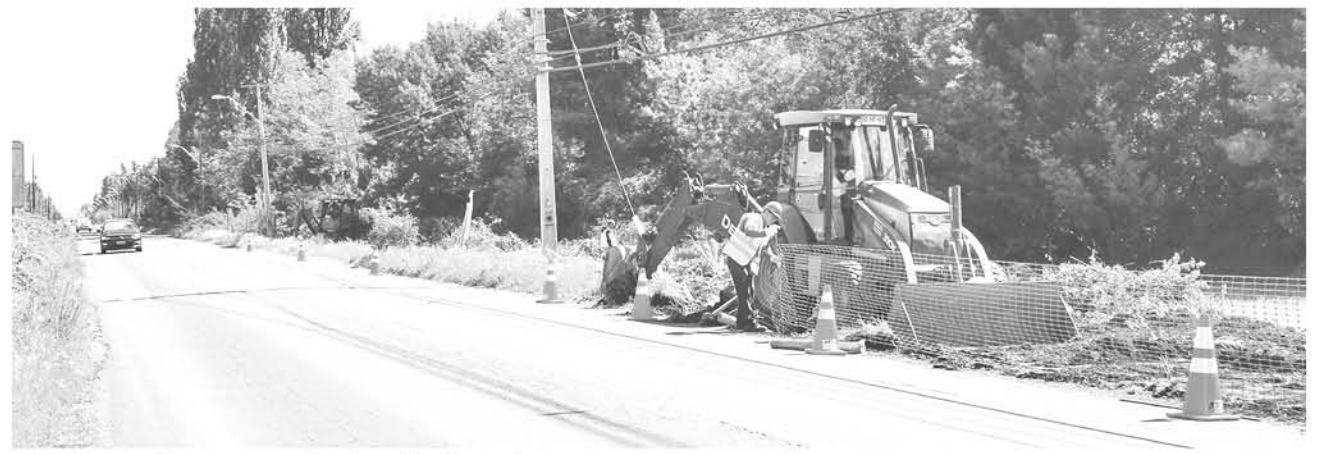
LA INVERSIÓN BORDEA los dos mil millones de pesos.