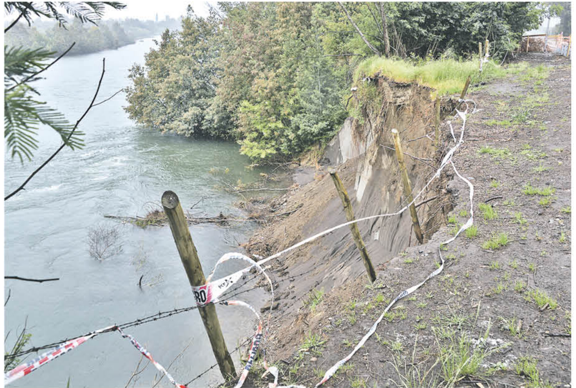
EL CAMINO CLAUSURADO Negrete - Coigüe, fue reforzado por Vialidad para impedir todo tipo de tránsito previniendo los peligros provocados por el socavón.

Según el director municipal todo parte por el informe emitido por la