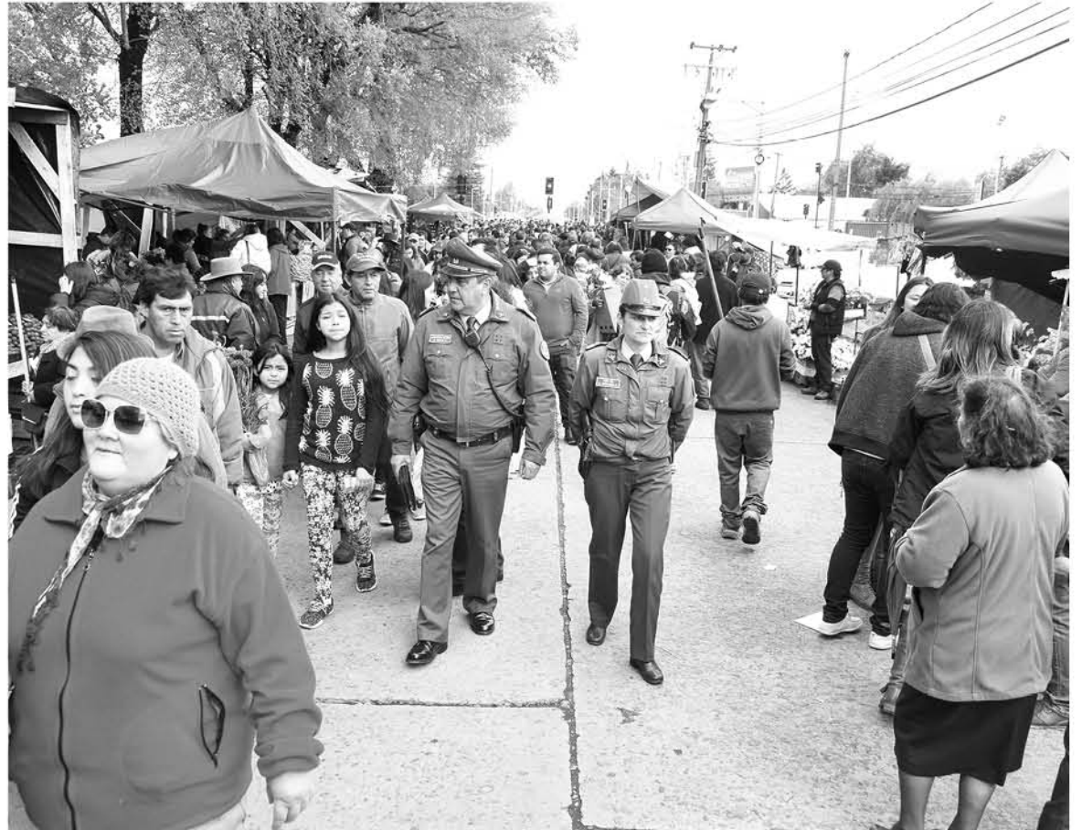
SE ESPERA QUE CERCA DE MIL personas lleguen al cementerio católico de Los Ángeles este 1 y 2 de noviembre.

Cabe recordar que son cerca de tres cuadras con vendedores las que cada año llegan a este lugar, por lo que se procede a un corte de tránsito autorizado lo que se produce en las calles Gabriel Mistral y avenida Las Industrias, los días 1 y dos de