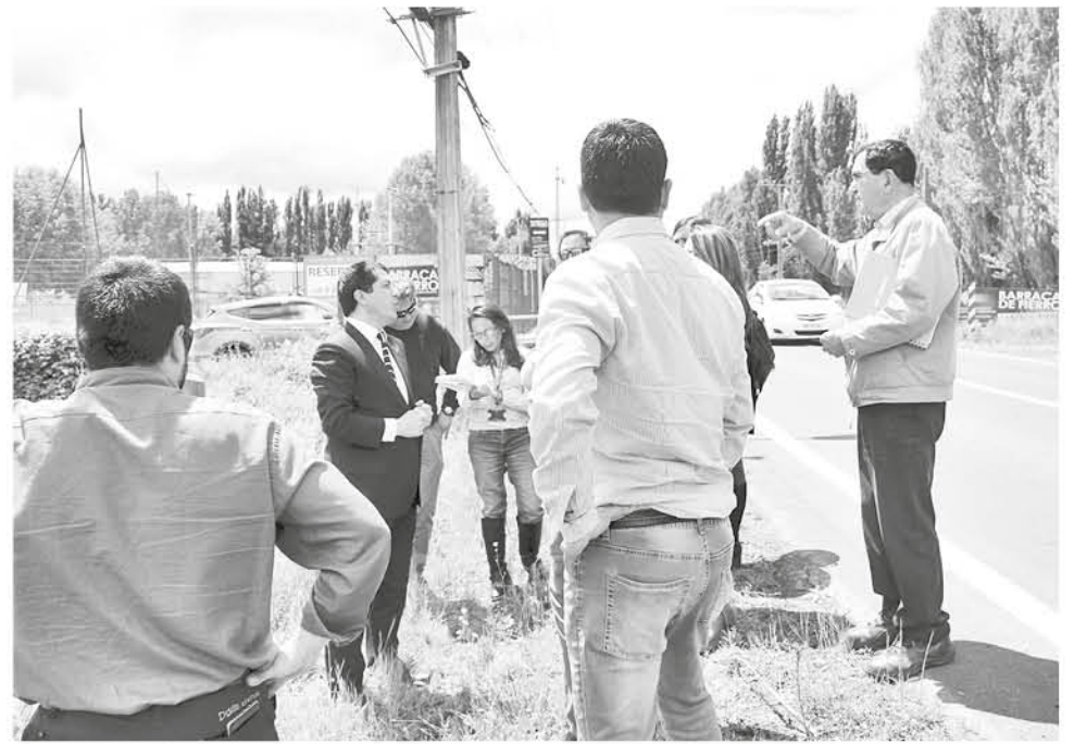
LA CICLOVÍA unirá las Plazas de Armas de Cabrero y Monte Águila.

La realización contempla 7,5 km de ciclovía, uniendo la Plaza de Armas de Cabrero con la Plaza de Monte Águila.