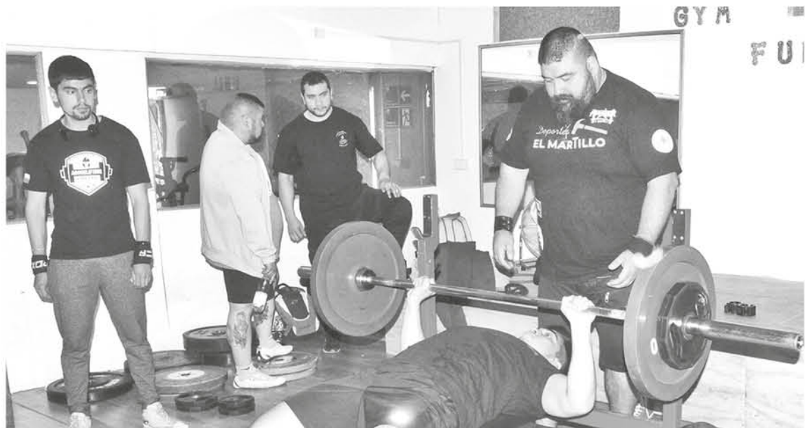
LOS ATLETAS le dieron un plus a la primera convocatoria organizada por el Club Vikingos a través de su alto nivel.

Por último, el organizador comentó que otra situación interesante que se dio en la competencia, fue con un grupo de chicos de Temuco, quienes posterior al torneo improvisaron un