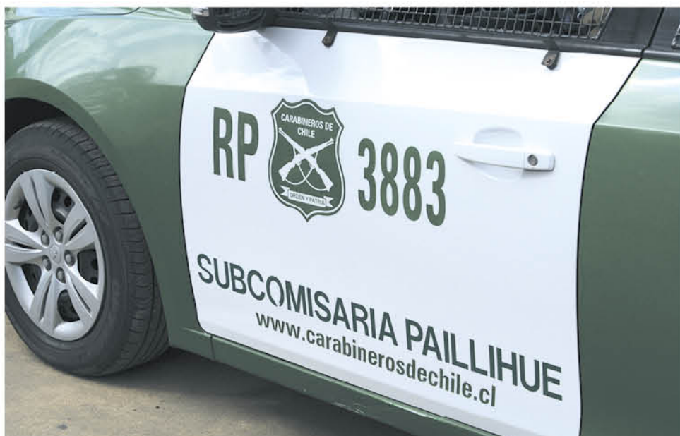
LOS TRES INVOLUCRADOS quedaron a disposición del tribunal para el desarrollo de la investigación de estos incidentes.

Dos hombres fueron descubiertos intentando hurtar en una vivienda, mientras que otro fue sorprendido en un acto de robo con violencia.