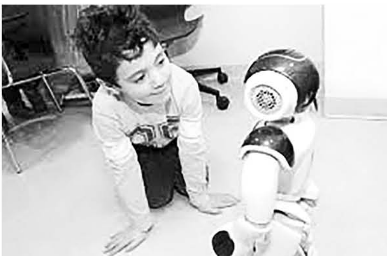
EN EL ANIMADO de la realidad virtual, el personaje principal recibe un escudo con poderes, una metáfora de la vacuna que se le administra al niño.

El hospital Pediátrico Alberta cuenta con cuatro de ellos. Y el personal médico asegura que han sido efectivos en más de un paciente.