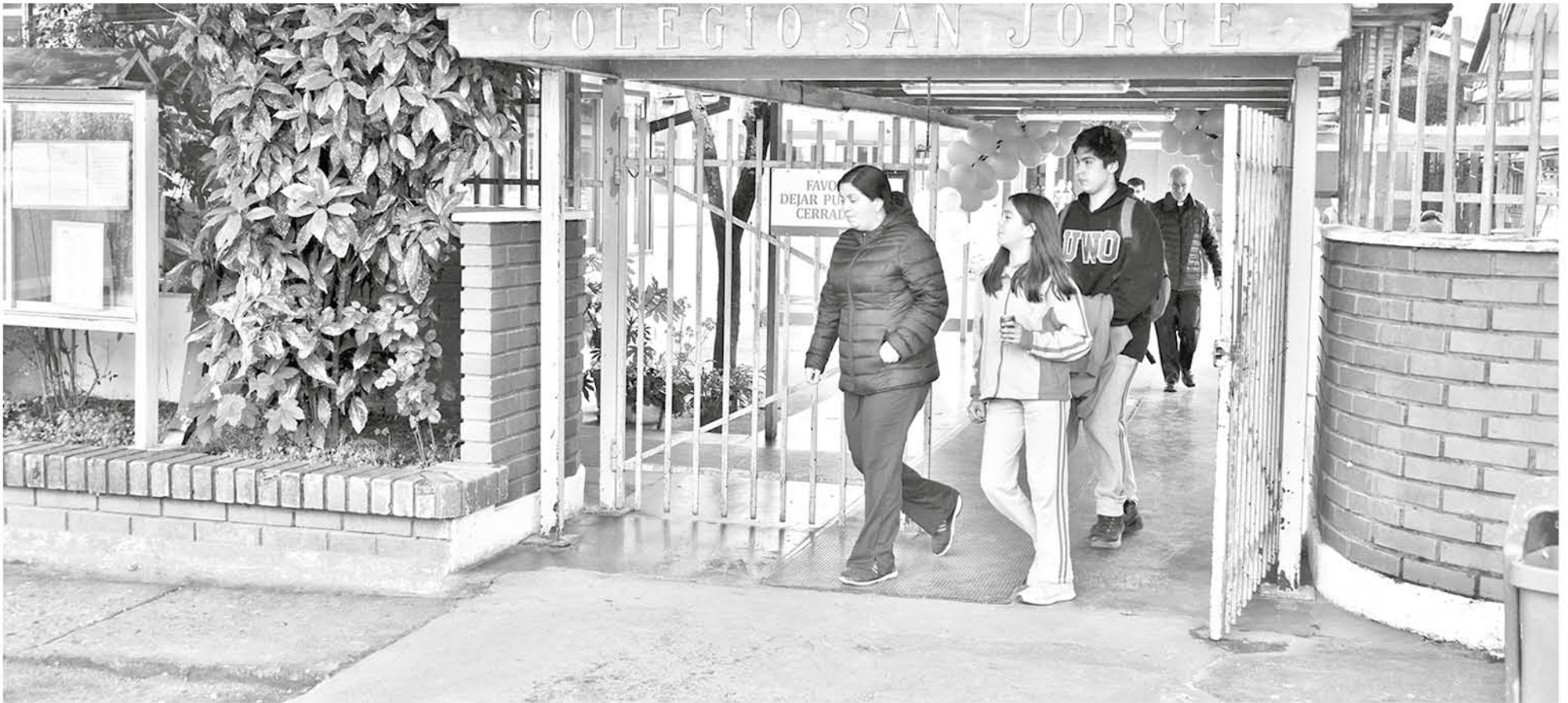
LA FUNDACIÓN JUAN XXIII se hará cargo del colegio a contar del año escolar 2020.

Además, este martes se firmó un convenio en el que CMPC traspasa el establecimiento educacional a la Fundación Juan XXIII, y que permitirá la continuidad del recinto escolar, el que además pasará a ser gratuito, sin selección e inclusivo.