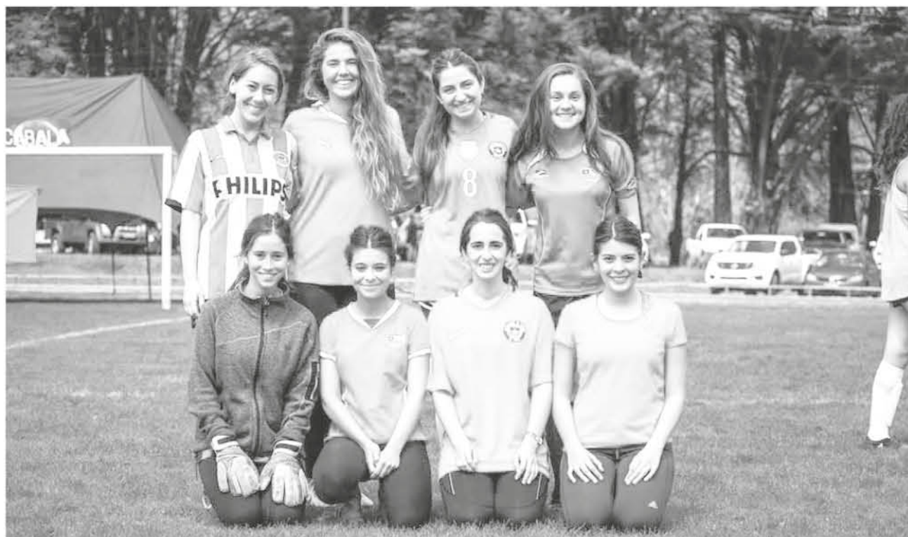
CUALQUIER PERSONA QUE FORMÓ parte del Liceo Alemán podrá participar de la jornada futbolística al aire libre.

El evento buscará conservar lazos de amistad, compañerismo y pasar una jornada grata junto a toda la comunidad "verbita".