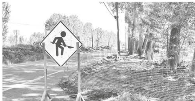
EL PRÓXIMO 10 DE NOVIEMBRE realizarán una ceremonia de colocación de la primera piedra de la obra a las 15 horas, en el kilómetro 3,5 de la ruta.