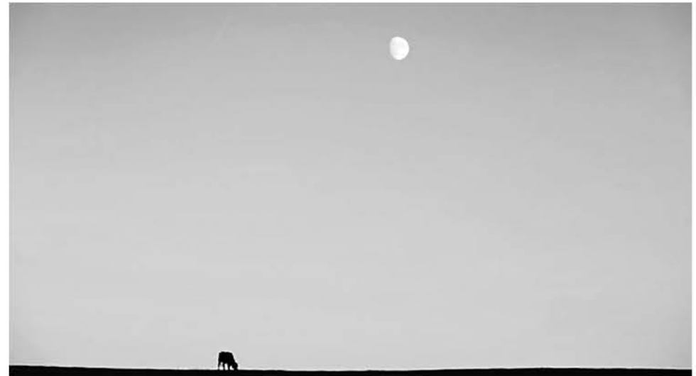
SE ESPERA QUE ESTE ASTRO ARTIFICIAL sea capaz de iluminar un área con un diámetro de hasta 80 kilómetros.

Será diseñada para complementar al satélite natural de la Tierra, dijeron los científicos.