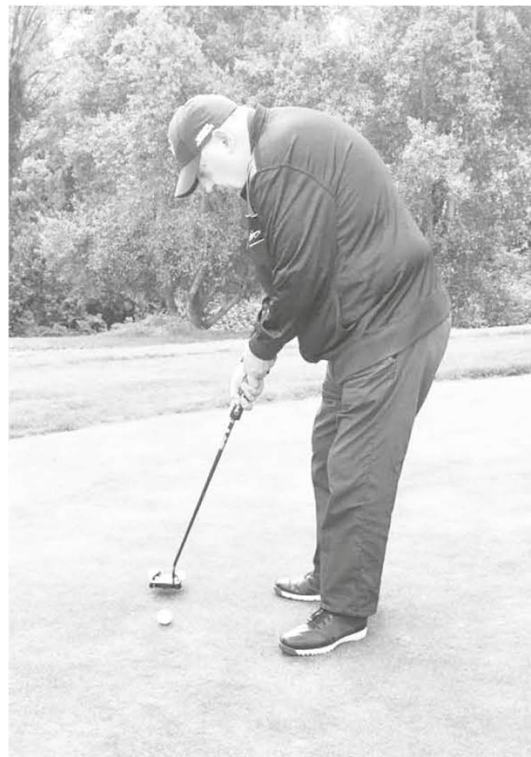
EL TORNEO del año pasado recibió cerca de 100 participantes y este año se espera llenar nuevamente la cancha de 9 hoyos.