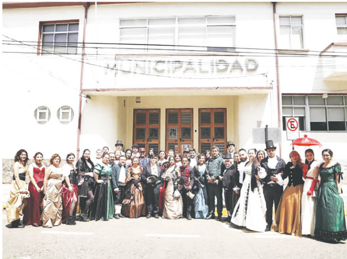
Diferentes representaciones de la época se llevaron a cabo en esta nueva versión de la popular fiesta.

Uno de los hitos que más llamó la atención fue el emporio que estuvo muy bien representado a la usanza del tiempo, luego se dirigieron al comercio ambulante, la casa del hacendado, casa del inquilino, pasaron por la batalla de Yervas Buenas, el Circo, la Casa de Remolienda y finalizaron en la gran fiesta de la Chingana.