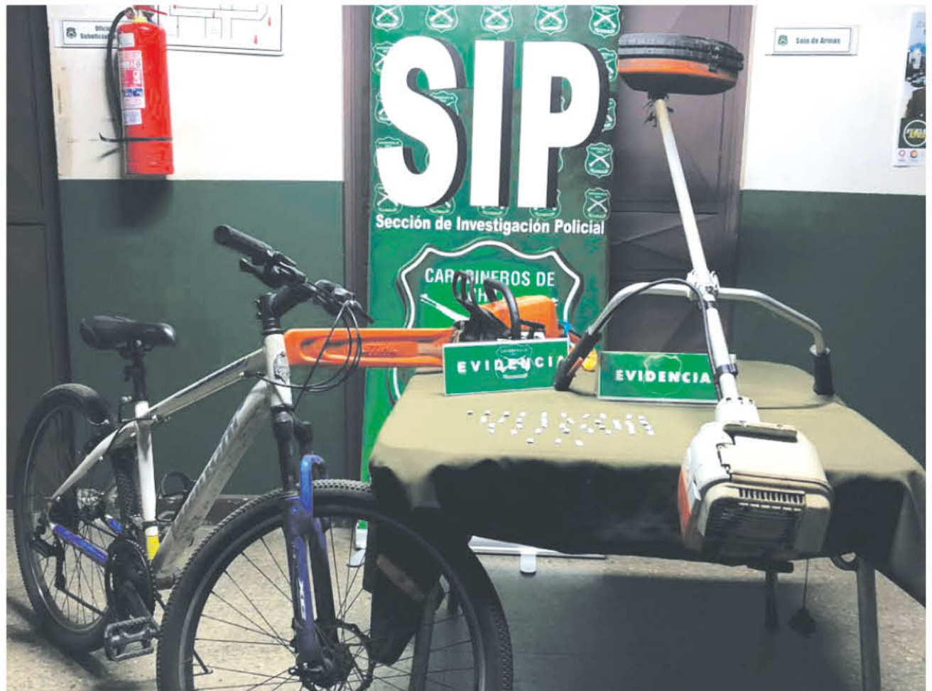
EL IMPLICADO debía cumplir condena de arresto domiciliario total.

"El imputado mantiene registro de detenciones por