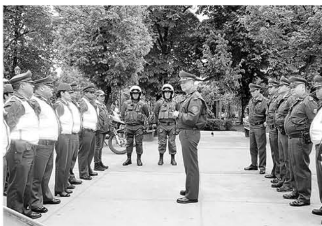
POR MEDIO DE ESTOS PROCEDIMIENTOS se ha sacado de circulación a una importante cantidad de delinquentes reincidentes.

La estrategia que se va a realizar durante una semana entre el 30 de octubre y el seis de noviembre, está orientada a detener individuos con órdenes de detención pendientes.