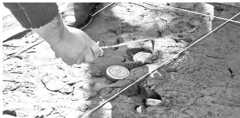
SON CUATRO CONJUNTOS los que se mantienen con encuentros pendientes y uno de ellos pelagra su tercera posición.