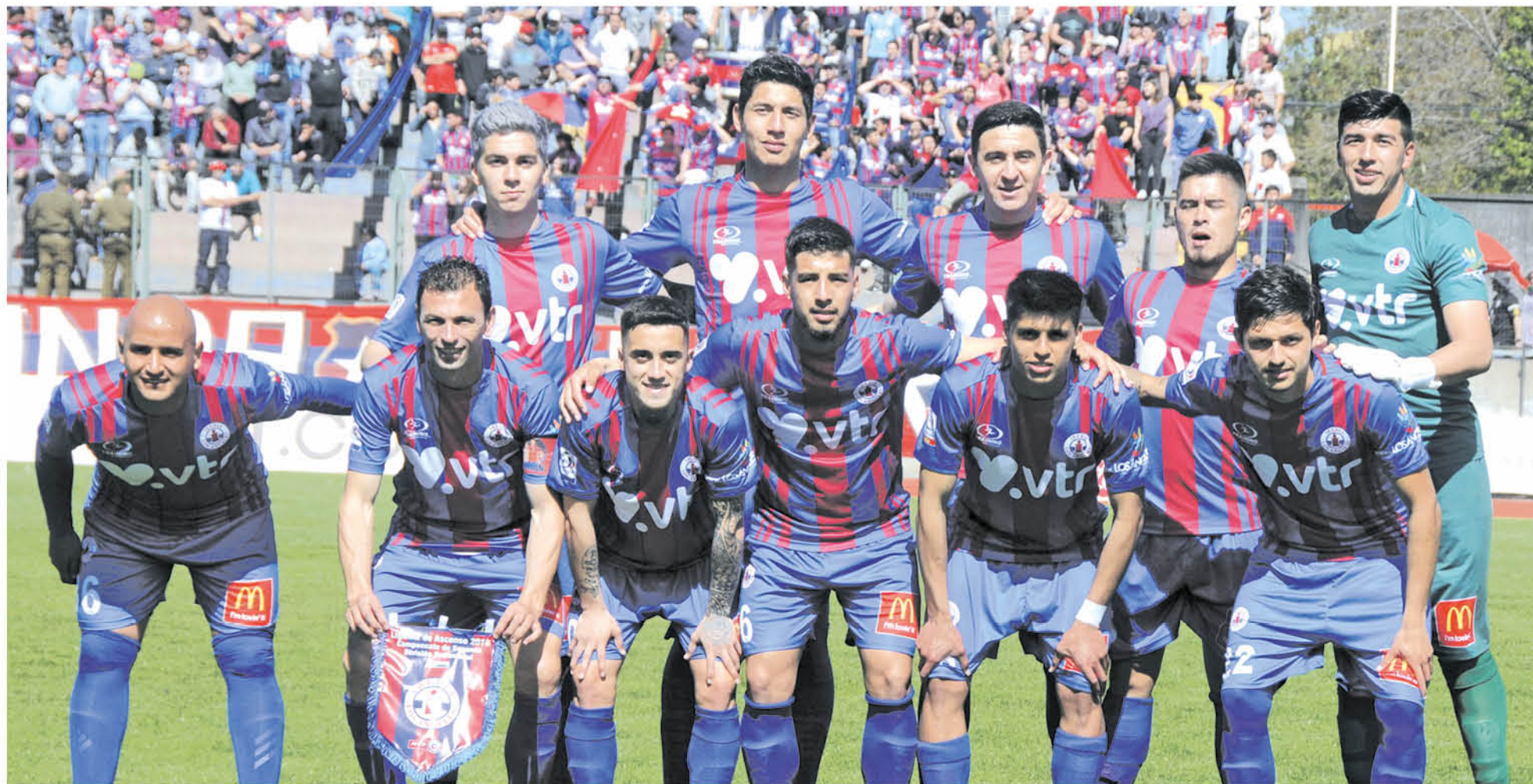
EL CUADRO AZULGRANA deberá dejar definitivamente los puntos en casa este domingo frente a Deportes Santa Cruz.

Pese a mostrar un pobre desempeño futbolístico en esta liguilla por el ascenso, aún queda una posibilidad de poder alcanzar al líder de la tabla, sólo si gana frente a este su próximo encuentro.