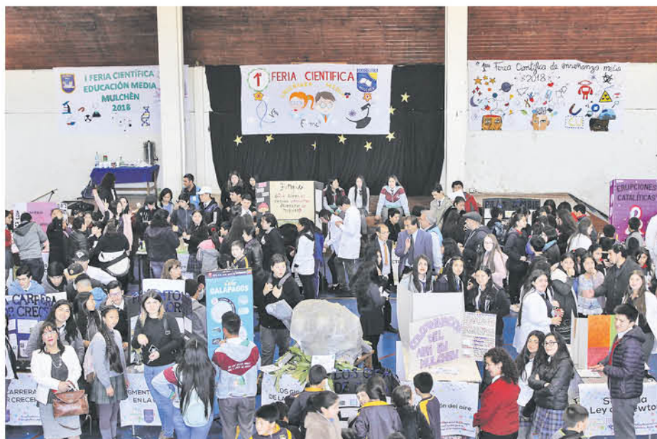
Alumnos de tres liceos participaron de esta actividad en su primera versión.