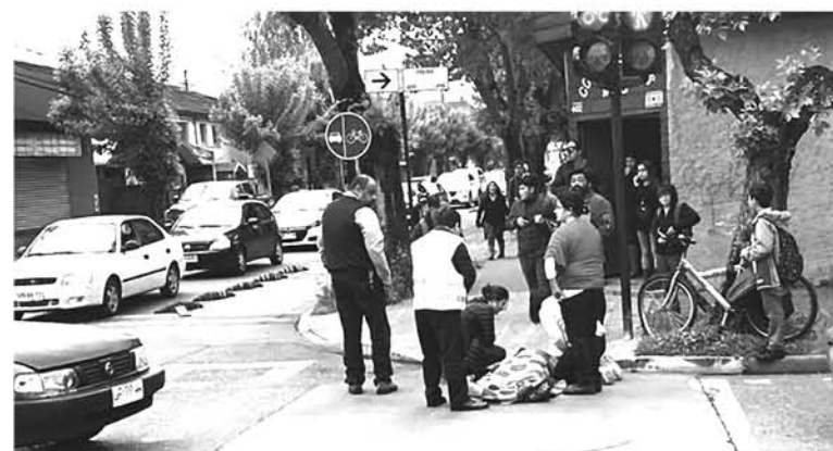
CARABINEROS SE MANTIENE en búsqueda del responsable.

Sobre esto, el capitán agregó que testigos entregaron características del vehículo responsable, quien huyó del lugar, por lo que se mantiene una investigación al respecto de este incidente.