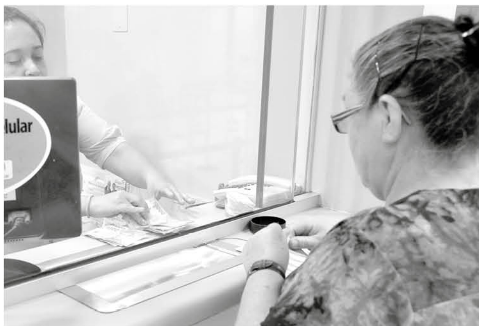
EL ANUNCIO que se centró en el aumento de la tasa de cotización y en los aportes al Pilar Solidario.

-Las administradoras podrán compartir sus utilidades con los afiliados. Además, podrán devolverles parte de las comisiones que paguen.