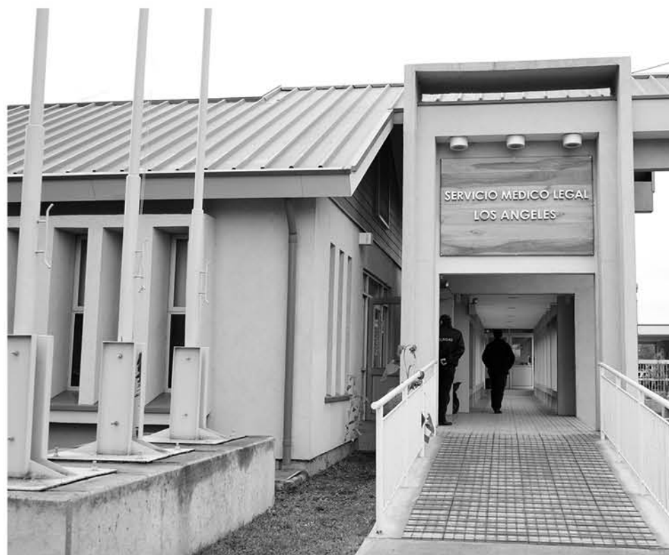
HASTA EL DÍA LUNES, según se pudo conocer no hubo identificación de este hombre que se mantiene en calidad de "N.N".

Cabe señalar que por el momento en este servicio provincial se mantiene en proceso de investigación tres hechos de diferentes incidentes de muertes, que se han registrado en las últimas horas.