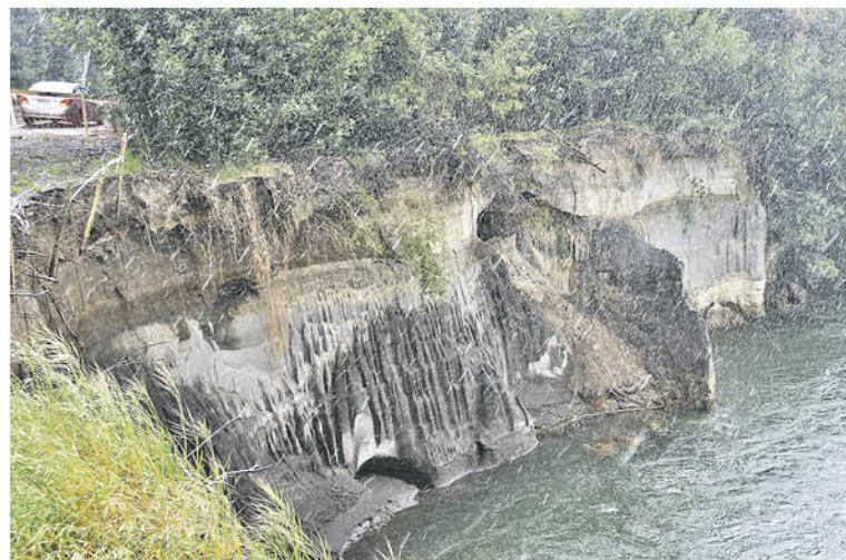
EL SOCAVÓN que hace peligrar el paso de los vehículos por el camino, es provocado por el afluente más caudaloso de Chile el río Biobío.

cia, que en un principio habrían sido aceptados pero que por el poco respeto de los conductores finalmente se impidió el paso de todo vehículo de cuatro ruedas.