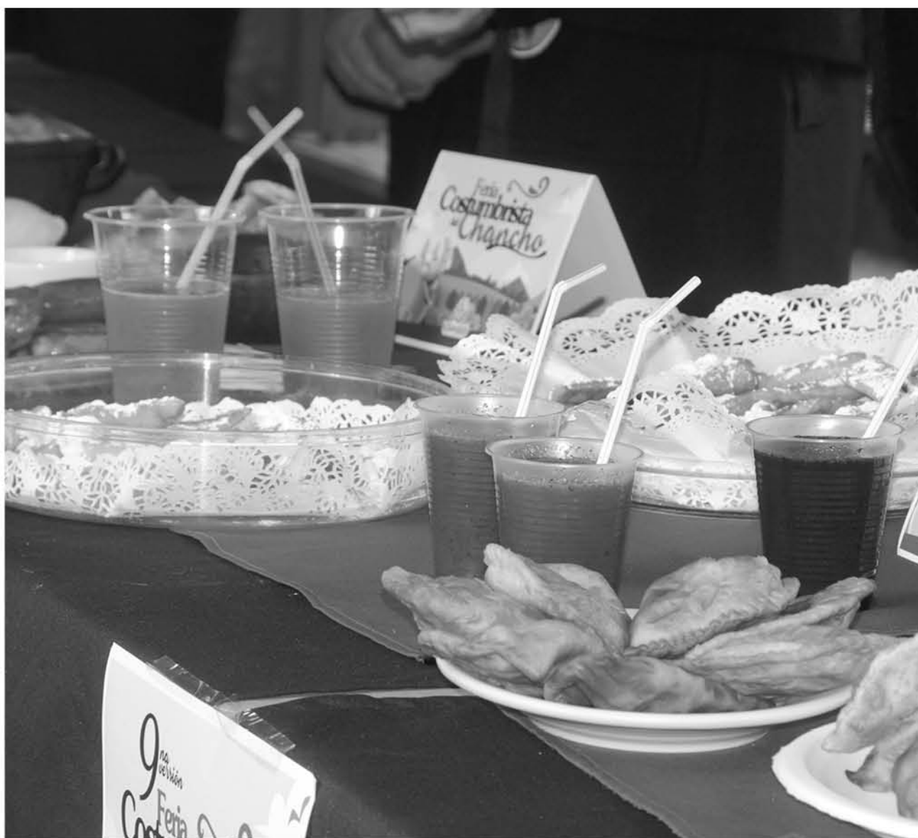
CON DISTINTAS COMIDAS, jugos de fruta y cervezas se realizó el lanzamiento de la actividad.

La actividad se llevará a cabo este 1, 2 y 3 de noviembre en el estadio municipal de dicha localidad, donde habrá una carpa de mil 200 metros y una gran cantidad de puestos.