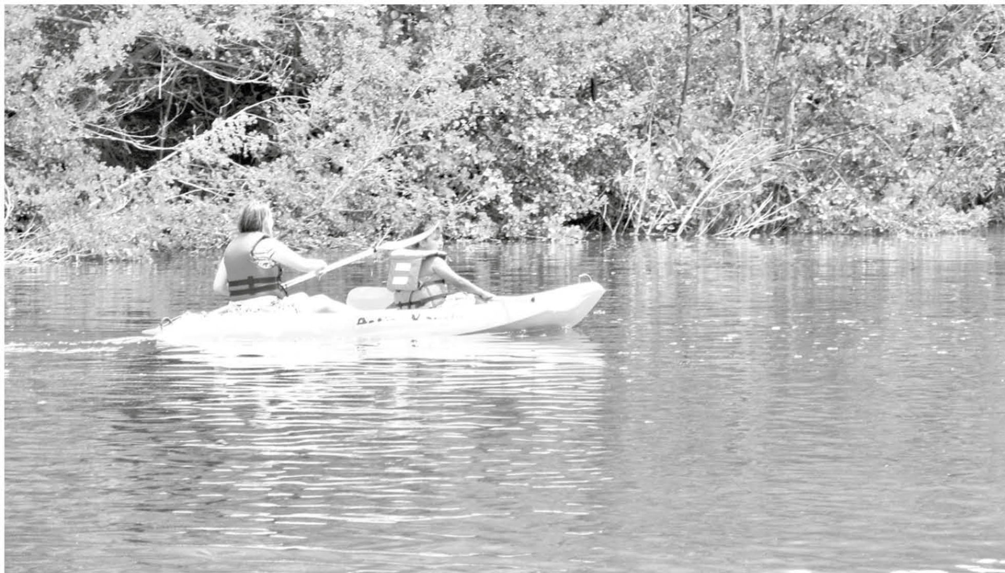
LA PROVINCIA cuenta con 174 lugares autorizados en óptimas condiciones para recibir al público. (Imagen de archivo)