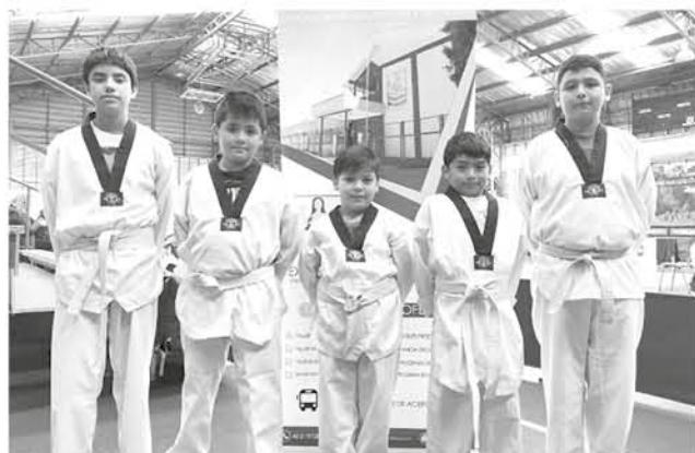
LOS DEPORTISTAS LOGRARON destacar en la cita gracias a un arduo entrenamiento durante todo el año.