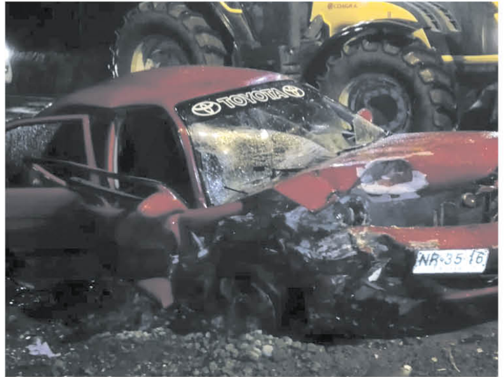
LOS HECHOS SE REGISTRARON la tarde del domingo cerca de las 21 horas, en la ruta Q-180 camino a Nacimiento.

de carácter graves también en el hospital de Los Ángeles, mientras que el conductor terminó con lesiones leves.