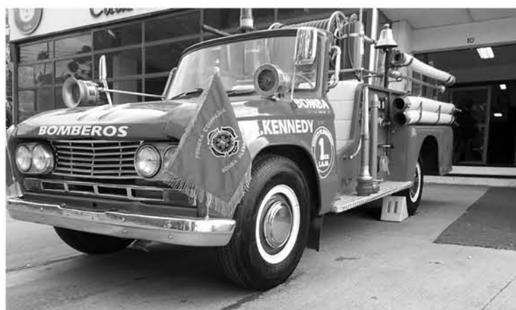
ESTA ERA LA FACHADA posterior del vehículo, bautizado como "Kennedy", que se mantenía en esta comuna desde 1960.

El automóvil que data de 1960 en el cuartel de la Primera Compañía de Bomberos de la comuna, se volcó tras cortarse sus frenos y de manera posterior cayó desde una grúa.