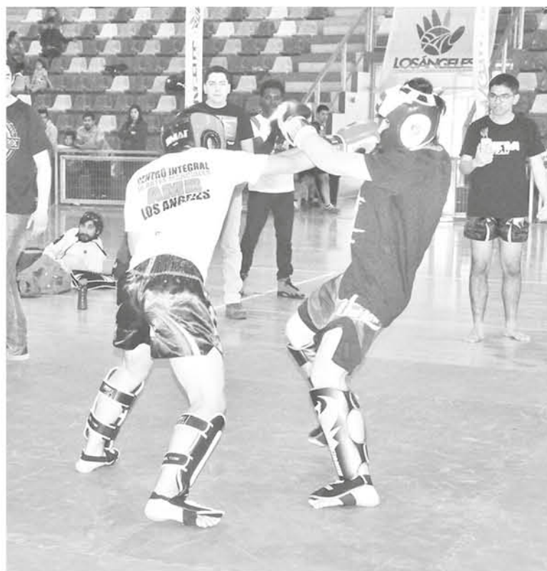
PARA EL PRÓXIMO AÑO se esperará una asistencia por sobre los 200 competidores en un ring propio.

Por último, el director comentó que ahora se enfocarán en conseguir los recursos económicos para llegar al campeonato mundial de artes marciales en Argentina que se realizará el 16 de noviembre.