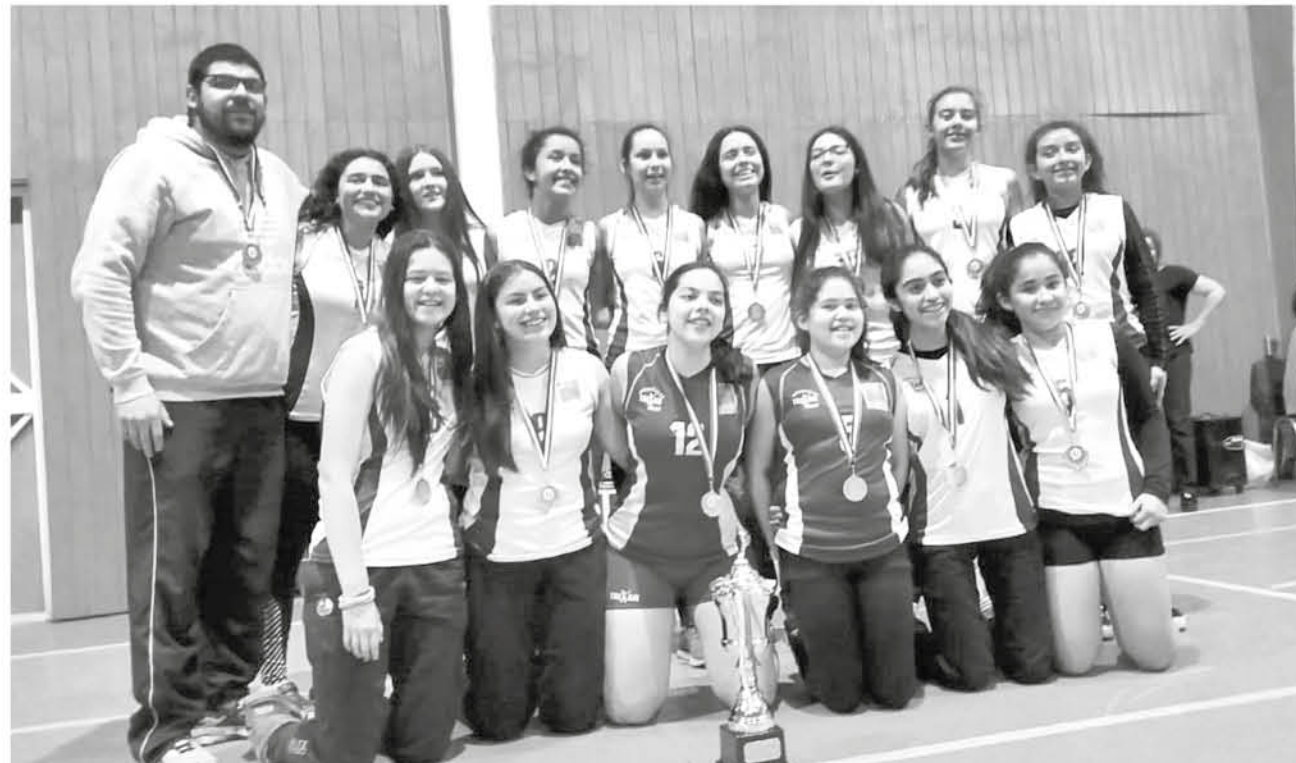
LAS CHICAS JUGARÁN CAMPEONATOS cortos para que sigan puliendo su técnica y subiendo su nivel de juego.

Ahora el próximo desafío que deberá enfrentar el club será para la categoría sub 14 apoyada por la sub 12, este sábado 10 de noviembre en Los Ángeles, donde se jugarán los play offs –en lugar por definir–.