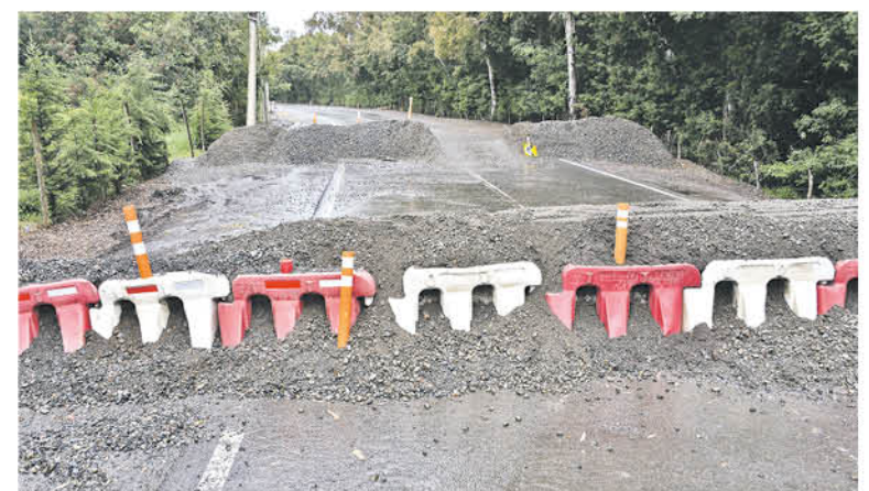
HASTA EL LUNES EL CAMINO se mantenía cerrado por Vialidad, sin embargo, en la reunión efectuada en el municipio el alcalde anunció que lo reabrirían bajo su propio riesgo.

Finalmente, la situación quedó a la espera de los acontecimientos anunciados por el alcalde Melo quien comentó "en pocas horas más (jornada del martes) reabriremos el camino, por una vía, con el compromiso de sólo dejar pasar vehículos medianos y no queremos que pase ningún incidente pero si el socavón hace ceder el pavimento tendremos que asumir los riesgos".