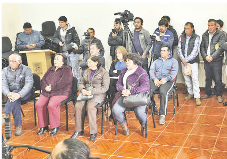
MEDIO DE COMUNICACIÓN de la comuna de Negrete y de la provincia de Biobío fueron convocados también al encuentro con el objeto de visibilizar el problema que viven diariamente las familias negretinas desde hace dos meses.