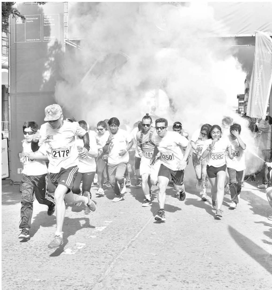
EN LA ACTIVIDAD participaron hasta las mascotas y superó con creces las expectativas de la organización.

Cabe destacar que la actividad no fue de carácter competitivo ya que la finalidad del programa del Ministerio del Deporte es la participación social abriendo los espacios públicos, poniéndolos a disposición de la población, para que las familias realicen deporte y se logre generar conciencia de la importancia de los hábitos de vida saludable, no sólo de un punto de vista alimentario sino que también de la importancia de la actividad física que es uno de los pilares del programa "Elige Vivir Sano".