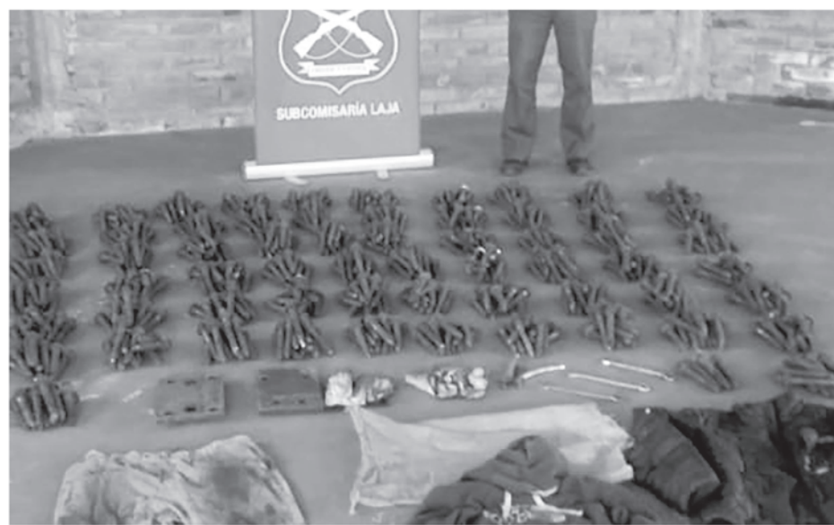
LOS SUJETOS HABRÍAN extraído 625 pernos de fijación de la línea férrea.

Sujetos habrían extraído en forma ilegal pernos de fijación de la línea férrea en la comuna del papel. El hecho no afectó al normal funcionamiento de la vía.