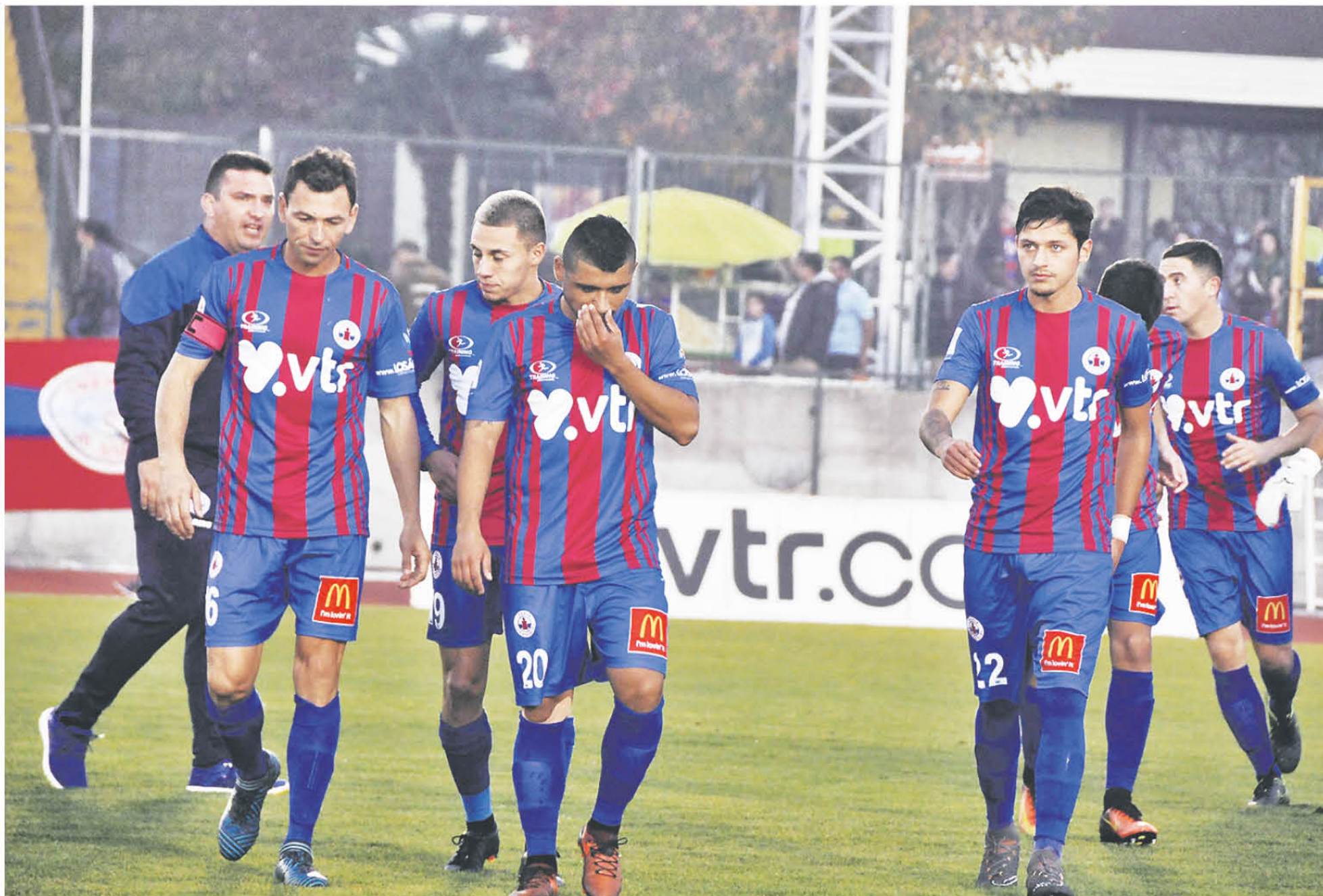
LA AZULGRANA no pudo en San Fernando y se complica en demasía. (imagen de contexto)