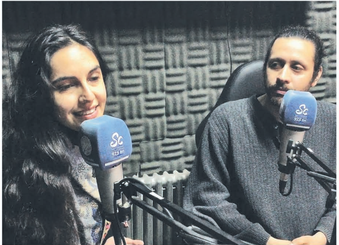
DESDE EL LUNES 28 DE OCTUBRE hasta el 8 de noviembre se podrán escuchar las historias de 14 artistas de la zona contadas por ellos mismos.

El ciclo de programas “Al rescate de los artistas de la provincia de Biobío” son cápsulas que tienen una duración promedio entre 3 a 5 minutos. Estas cápsulas irán relatando la historia de 14 artistas, 7 hombres y 7 mujeres de Los Ángeles, Mulchén