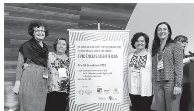
LA ENFERMERA ESPECIALISTA expuso en Brasil acerca de “Políticas de las PICCS en Chile” y “Atención de PICCS en los servicios de salud en Chile”.

“No así en Chile, donde lo que tenemos primero son experiencias locales –como en el caso nuestro, donde hemos ido innovando en