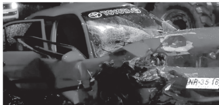
Centro Asistencial Víctor Ríos Ruiz de Los Ángeles para ser atendidos.

Preliminarmente, se conocería que quien conducía el Toyota Tercel lo habría hecho bajo los efectos del alcohol, debido a que se encontraban latas de cerveza en su interior. Los lesionados, finalmente, fueron trasladados hasta el