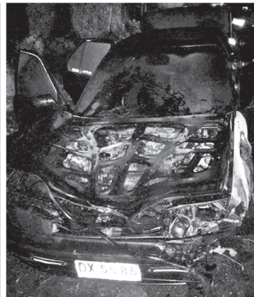
TRES INDIVIDUOS ROBARON en un servicentro de Yungay y finalmente terminaron su escape en Villa Mercedes, con el incendio de su vehículo. Carabineros logró capturar al chofer del móvil.

do buscados incansablemente por los destacamentos policiales.