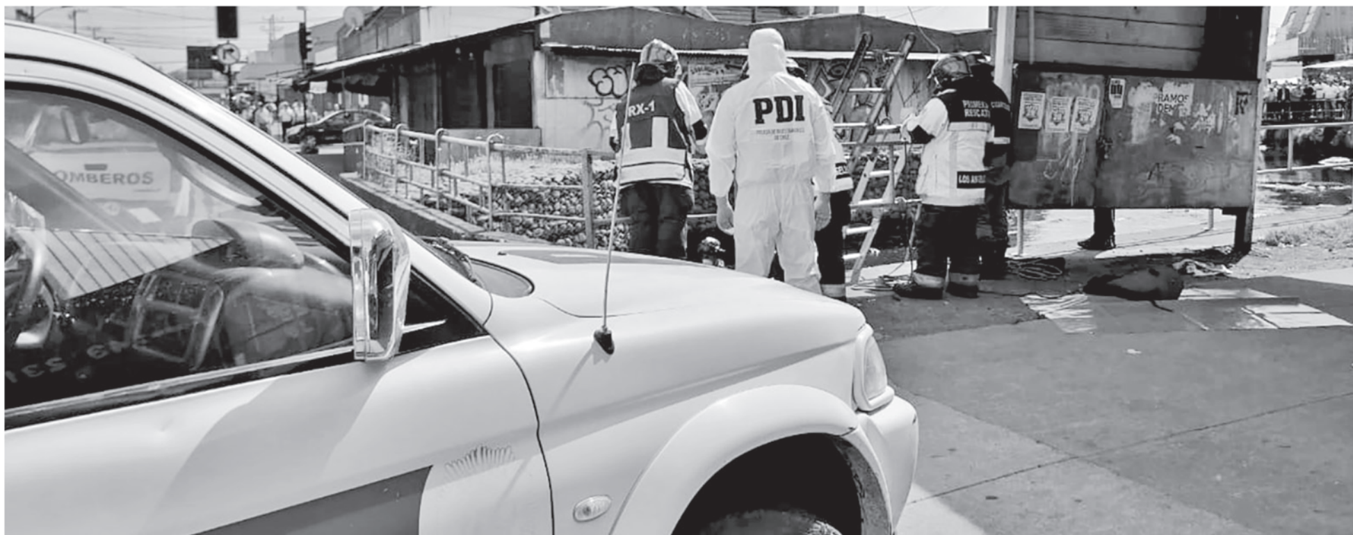
ENCUENTRAN CUERPO BAJO un puente en pleno centro de Los Ángeles, luego que Canalistas del Laja realizara trabajos de limpieza en el lugar.