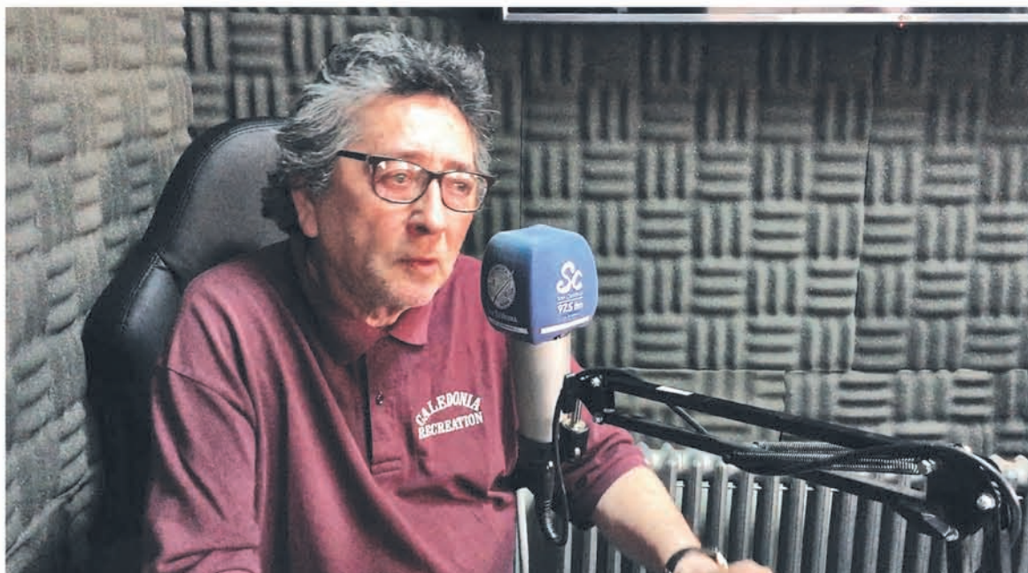
LA PRODUCCIÓN DE LAS CÁPSULAS se realizó en poco menos de un mes, al igual que su edición, ya que los convocados tuvieron que trasladarse hasta los estudios de Radio San Cristóbal.