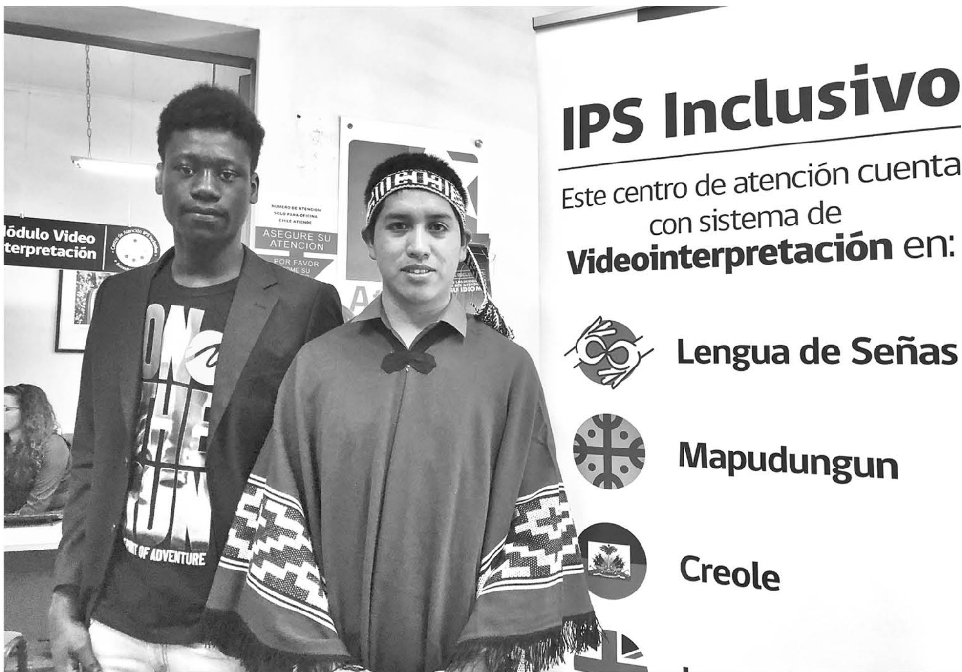
IPS ESTÁ REALIZANDO verdaderas tareas de inclusión en la provincia, inició en Los Ángeles pero a partir de ahora también existen módulos de traducción y sistema de señas en Mulchén y Santa Bárbara.

Para acercar la Seguridad Social a todas las personas, el Instituto de Previsión Social, IPS, y su plataforma ChileAtiende lanzaron sistema de videointerpretación, como parte de su línea de trabajo “IPS inclusivo”.