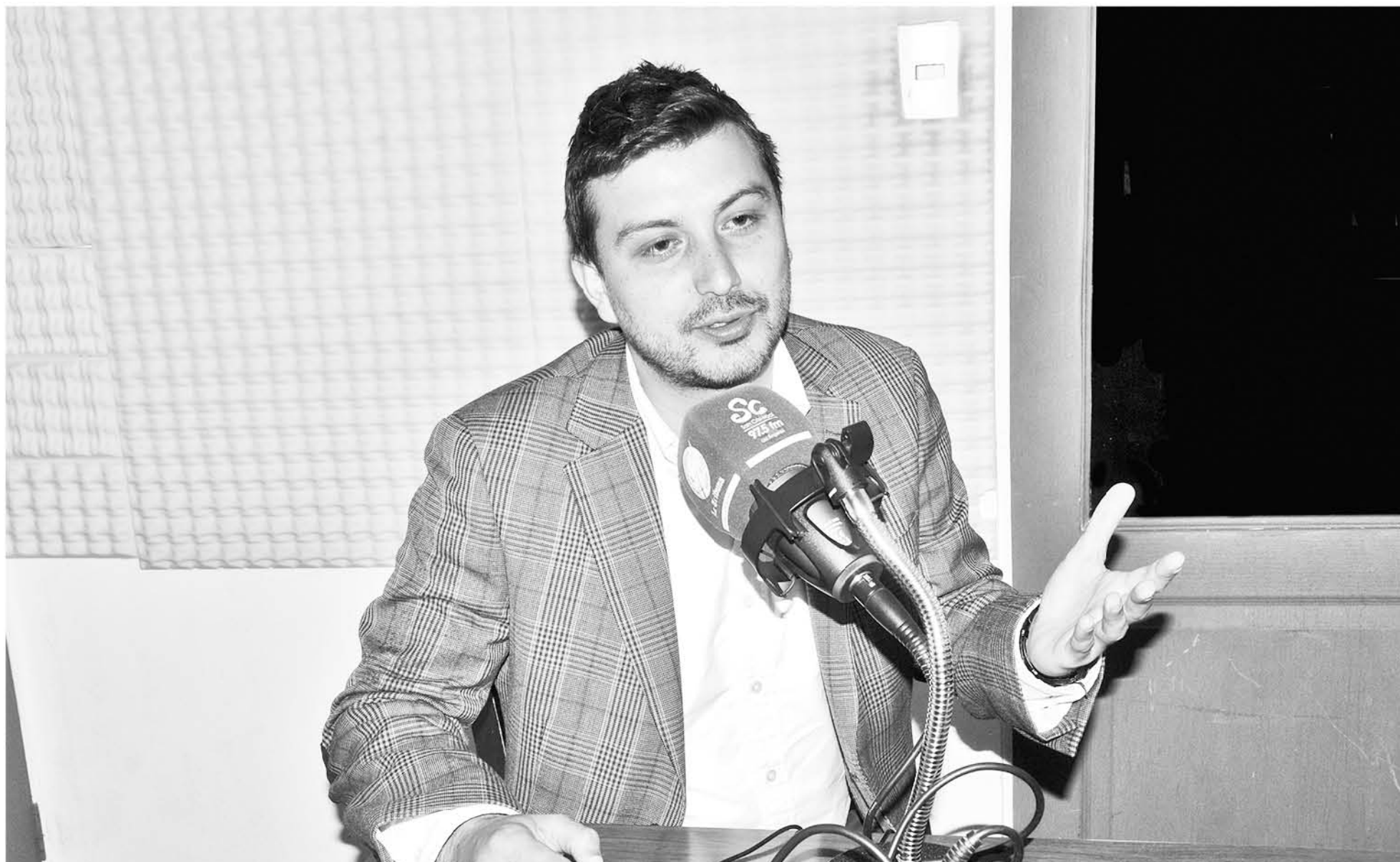
LA AUTORIDAD COMENTÓ en conversación con radio San Cristóbal en qué consiste dicho plan.

Según explicó la autoridad, existen diez temas que son complejos en la región.