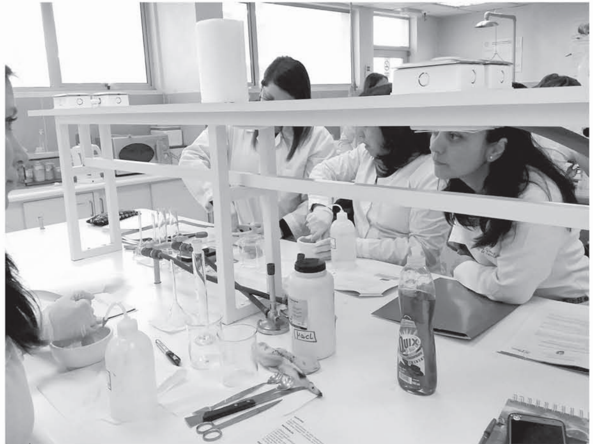
PROFESORES DE LA PROVINCIA de Biobío aprendieron técnicas y nuevos conocimientos en el área de la ciencia para replicar a sus alumnos en sus establecimientos.