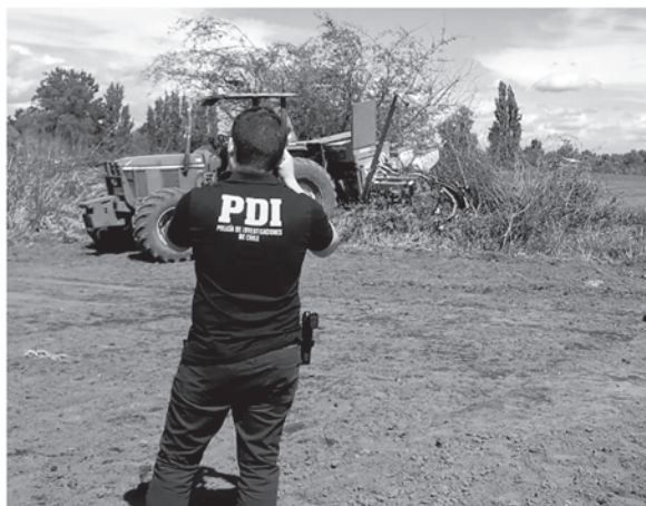
A RAÍZ DE UN ACCIDENTE laboral habría fallecido un hombre en el sector rural de Cerro Colorado. También una persona en situación de calle dejó de existir en pleno centro de Los Ángeles el viernes 26 de octubre.