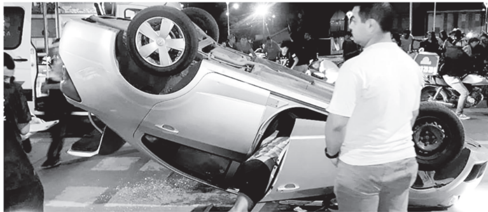
CONGESTIÓN Y CURIOSIDAD entre los transeúntes dejó un accidente ocurrido la noche del sábado en avenida Padre Hurtado en Los Ángeles.

Aunque el hecho no dejó heridos graves, la posición en que quedó el móvil provocó gran conmoción entre los transeúntes de esa arteria vial, la noche del sábado.