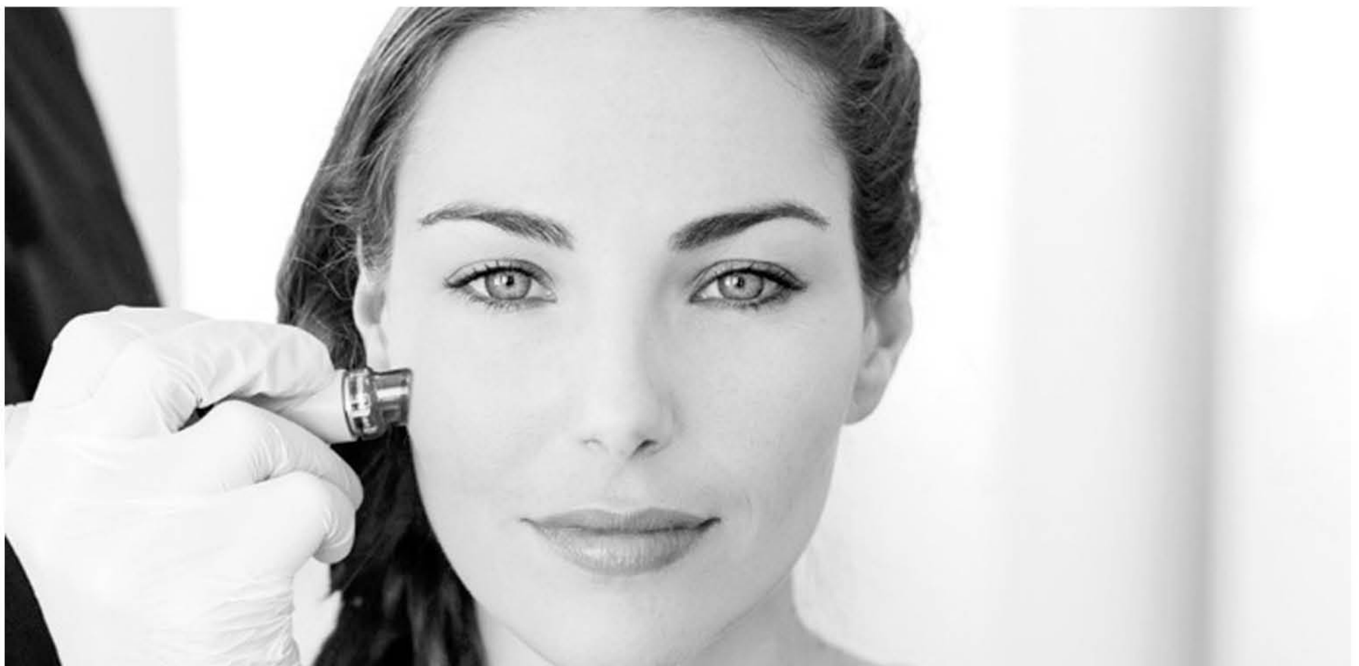
HYDRAFACIAL es uno de los tratamientos más novedosos para devolver luminosidad a la piel.

Opciones todas en las que la piel busca revitalizarse para no consumirse en la oscuridad de la contaminación.