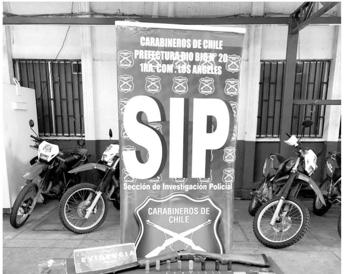
LOS DETENIDOS FUERON descubiertos tras una investigación por disparos en el lugar e inclusive una denuncia, cuando una mujer fue baleada en su muslo.