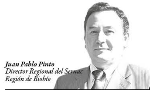
Juan Pablo Pinto Director Regional del Sernac Región de Biobío

Con el propósito de facilitar a los consumidores que no reciban mensajes publicitarios o spam, en el año 2013 el SERNAC lanzó la plataforma "No Molestar", la cual está alojada y disponible para los usuarios en el sitio web