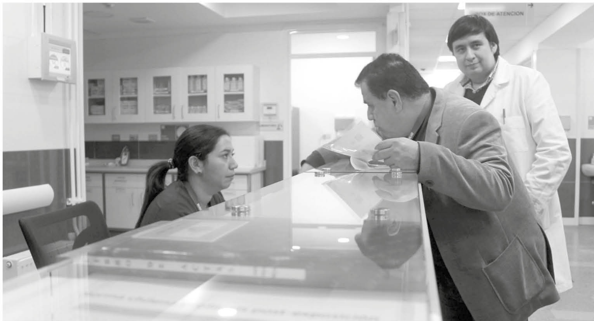
UNA MAYOR DOTACIÓN, infraestructuras y servicio para todas las necesidades en salud primaria de los habitantes son parte del avance en la construcción de nuevos centros.