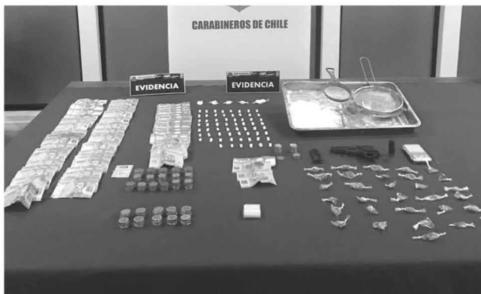
AL MOMENTO DE SER DETENIDOS, los implicados se mantenían realizando la división de dosis de diferentes drogas.

Los implicados en este delito fueron sorprendidos en la población Dos de Septiembre, donde mantenían dos viviendas para ejecutar las transacciones de este comercio ilegal.