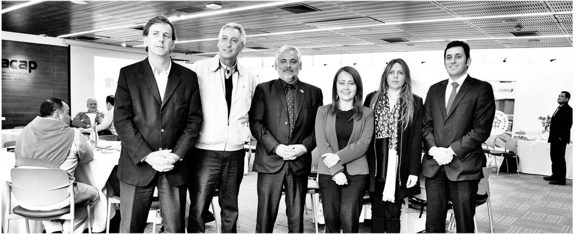
SE REUNIERON AUTORIDADES, empresarios madereros, actores del mundo público y universidades para analizar y orientar el desarrollo productivo de esta materia prima en la zona.