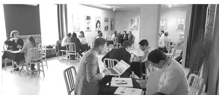
LAS ACTIVIDADES COMENZARON en Polonia con una rueda de negocios en la ciudad de Varsovia, donde sostuvieron más de 50 reuniones de negocios con importadores polacos.

Respecto al sector agroindustria, en 2017 el sector tuvo exportaciones por US$ 1.326 millones y los principales envíos correspondieron a ciruelas deshidratadas, arándanos congelados y pasas. Para el primer semestre de 2018 las exportaciones totalizan US$ 672 millones un 8% más que para el mismo período 2017 cuando alcanzaron US$ 620 millones.