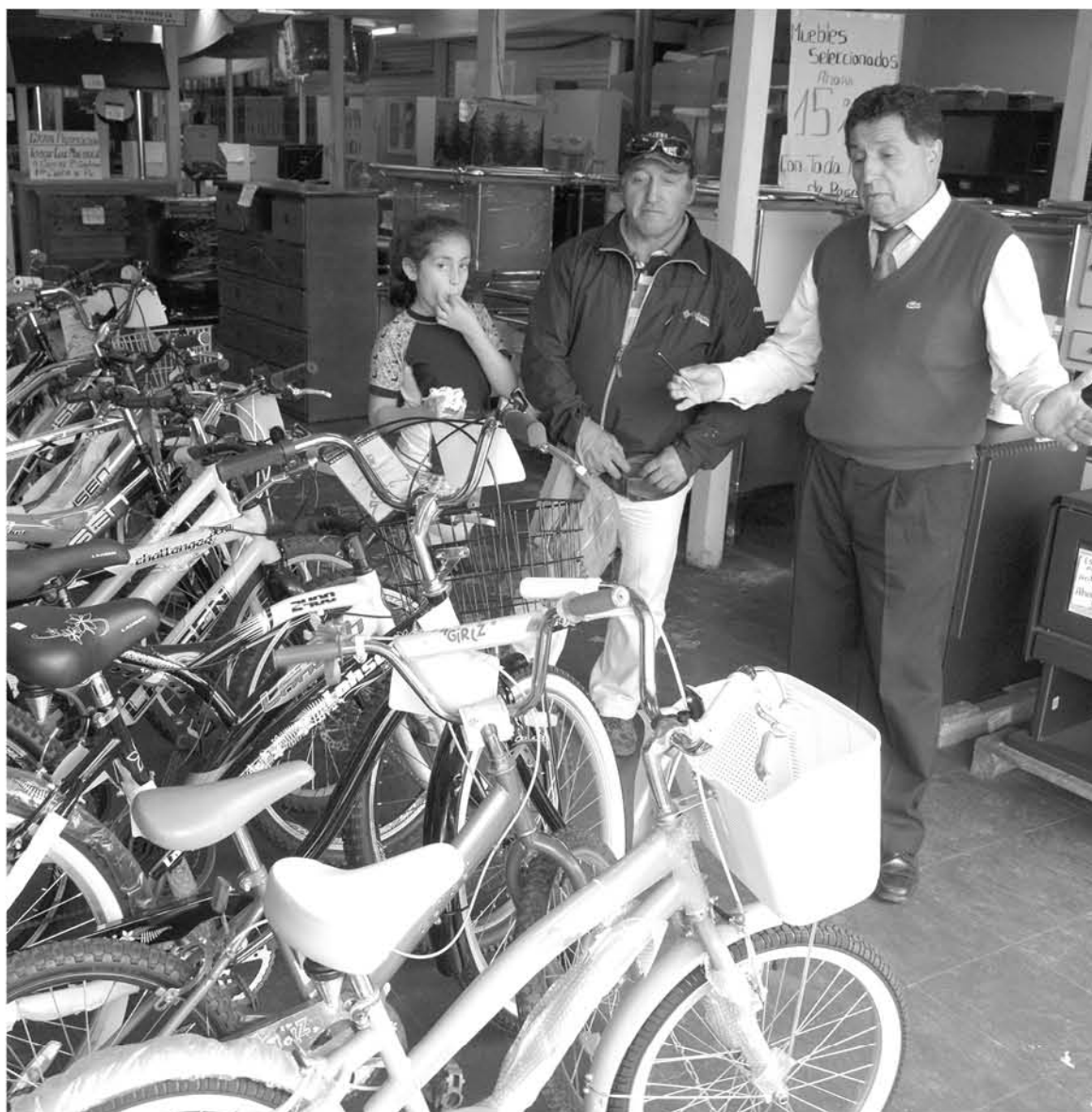
EVIDENCIÓ un aumento de 3,6% real anual en las ventas.

Finalmente, las ventas de la línea tradicional de Supermercados registraron un alza real anual en agosto de 1,8% anual, cerrando los ocho meses del año con un alza marginal de 0,9%.