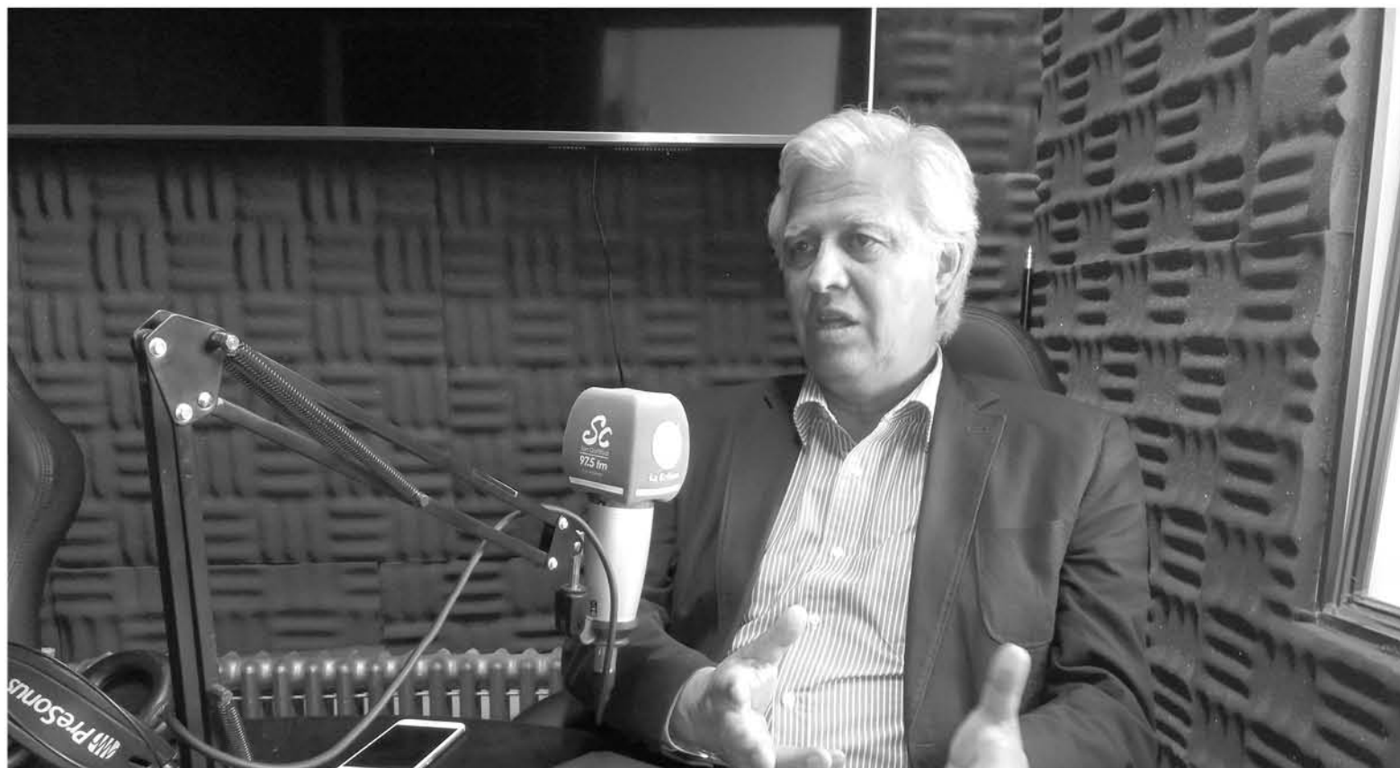
EL DIPUTADO se reunió en su visita con diferentes exponentes locales para conocer variados temas que tienen resonancia a nivel regional.

El abanderado del PS y diputado del distrito 20 conversó con La Tribuna sobre la situación presupuestaria y la realidad que observó en su paso por la zona.