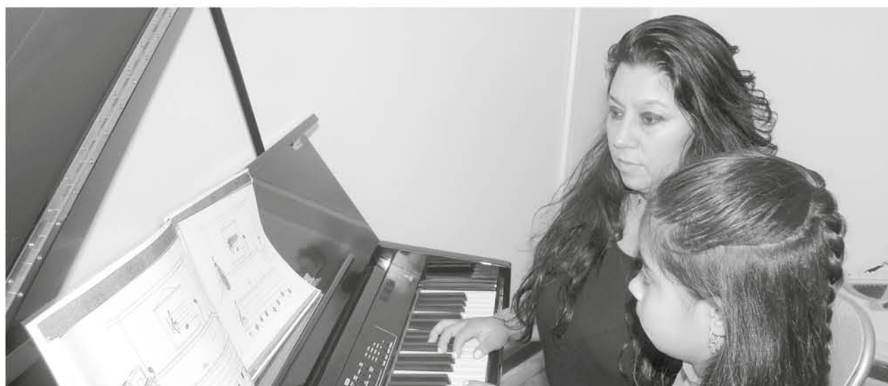
ESTAS CLASES QUE SE VAN A REALIZAR con apoyo municipal fija en sus proyecciones acompañar a los estudiantes durante toda su etapa escolar.