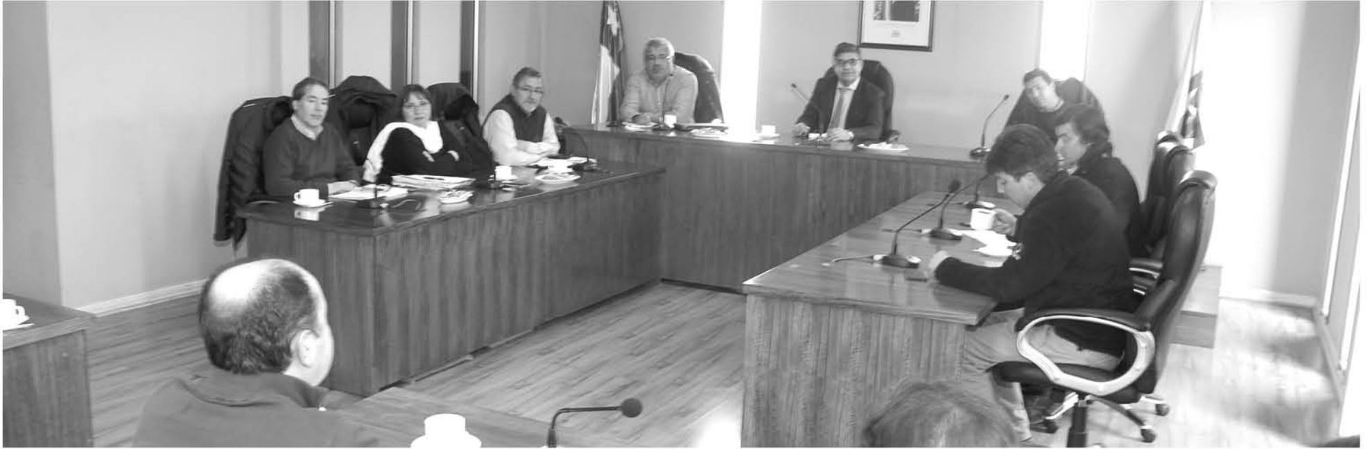
ESTA INSTANCIA mantendrá su continuidad de trabajo y seguimiento de las acciones.

La idea es propiciar un espacio de diálogo en base al trabajo de cada uno de los actores en el impacto ambiental de la comuna, así como también de los antecedentes y seguimiento por parte de la comunidad.