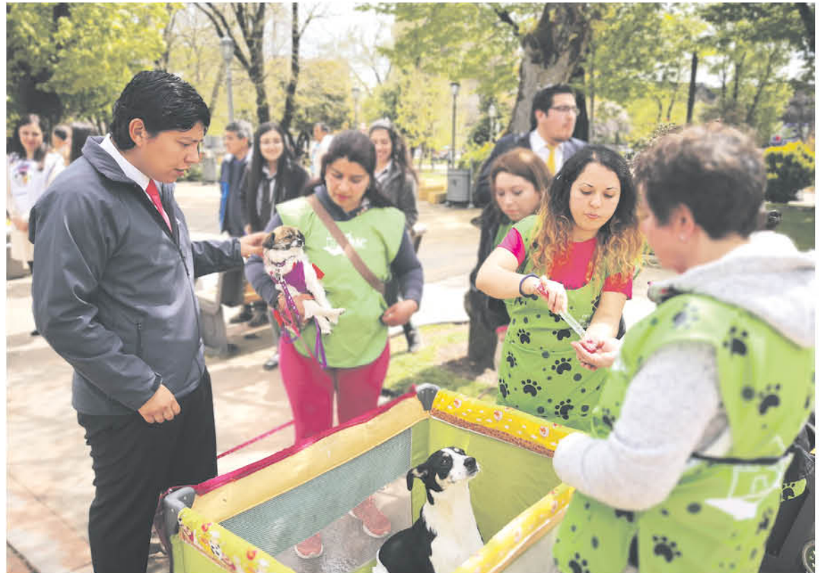
SÓLO EN LOS ÁNGELES se invirtieron 203 millones, Alcalde, gobernador, jefa comunal de medio ambiente y jefe regional de Subdere recorrieron la clínica veterinaria móvil de la municipalidad angelina.

directora comunal de Medio Ambiente, comentó que "en lo que va del año llevamos más de 100 esterilizaciones y 250 cirugías extras, que han sido dirigidas principalmente a sectores más vulnera-