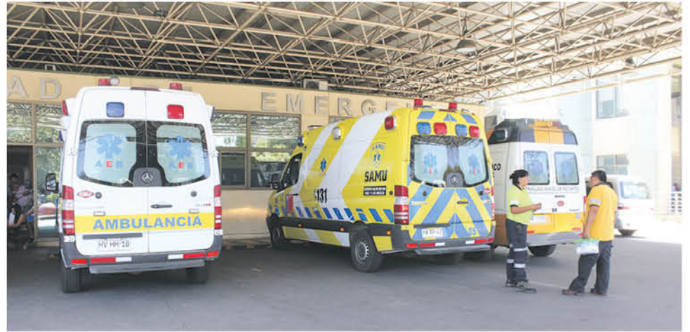
PESE A LO GRAVE del hecho, la víctima no entregó mayores antecedentes a Carabineros.

Cabe recordar que este lugar de la provincia se caracteriza por recibir a decenas de turista en esta temporada, así como sus locales comerciales y restaurantes, que mantiene una importante cantidad de clientes.