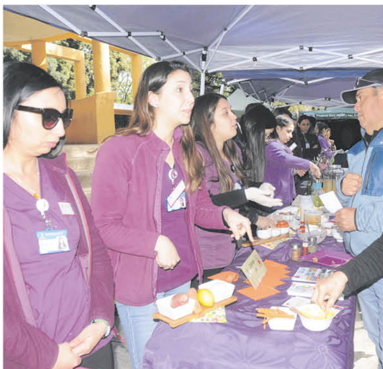
MUCHOS CONSUMIDORES se reunieron para llevar diferentes ideas a sus hogares, todas cargadas de ideas saludables.

Siete profesionales del ámbito alimenticio se ubicaron junto a la tradicional feria Prodesal para promover ideas de alimentos sanos y naturales, que se pueden adquirir en este lugar.