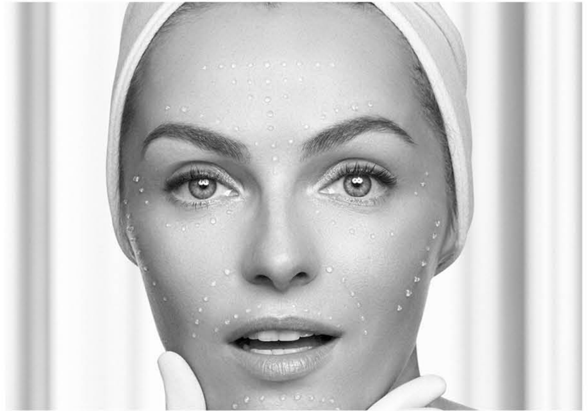
LA POLUCIÓN permite que aparezcan antes las imperfecciones del rostro.

Con la intención de mitigar esos efectos, la firma ha desarrollado Diamond Cocoon Collection que actúa como una "defensa inteligente" para fortalecer la barrera cutánea y aislarla del daño medioambiental mediante tres compuestos: uno que aumenta la oxigenación de la piel y ayuda a mejorar la microbiota; otro que bloquea la adhesión de partículas contaminantes en la superficie cutánea y un