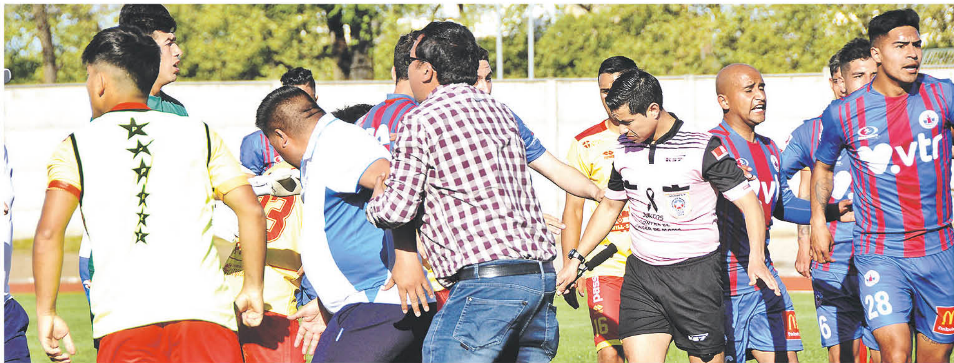
POSIBLEMENTE SE TOMEN sanciones en contra de los involucrados en las rencillas que ocurrieron después del encuentro.

Demostrando un bajo nivel futbolístico, con un expulsado junto a una rencilla al final del compromiso, la azulgrana aun depende de sí misma para seguir luchando el ascenso.