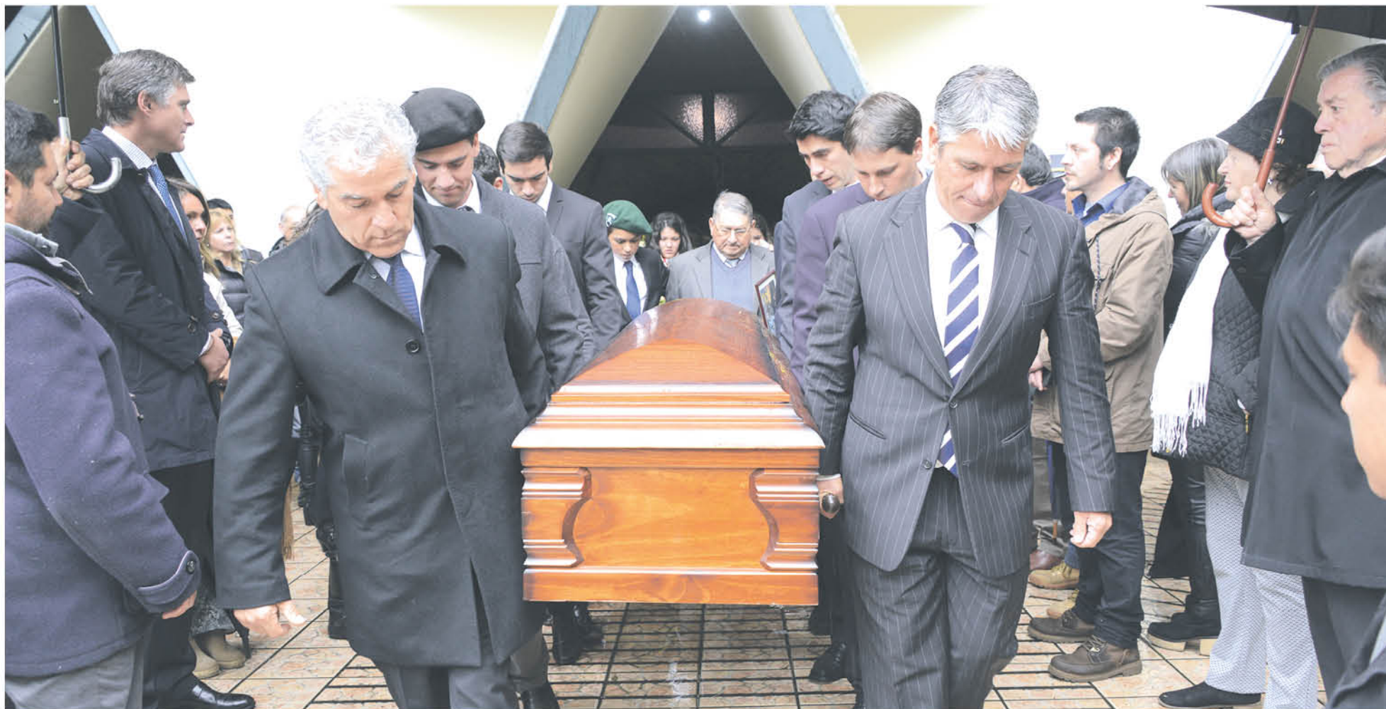
LA EMINENCIA DEL DEPORTE ecuestre traspasó sus conocimientos a través de toda su vida sin esperar nada a cambio.

Desde distintas partes del país se hicieron presentes en el funeral de una de las figuras más emblemáticas del deporte ecuestre, que dejó un legado de enseñanza y generosidad.