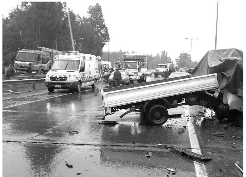
PERSONAL DE LA SIAT y Carabineros de Laja investigan este trágico accidente que al parecer aumentó su gravedad cuando terceros intentaron ayudar.

Debido a esto, en el lugar se registró una considerable detención del tráfico vehicular, que alcanzó una hora