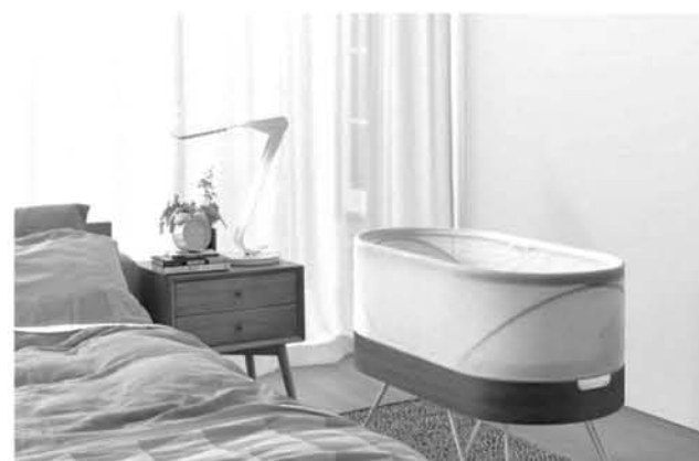
“SNOO” está programada para detenerse después de tres minutos de llanto del bebé.

También proporciona tranquilidad ya que cuenta con un saco especial para dormir que se adhiere a la cama, envuelve al bebé, y lo mantiene durmiendo de espaldas, una posición recomendada por la Sociedad estadounidense de Pediatría, el Servicio de Salud de Reino Unido y organizaciones benéficas como The Lullaby Trust, que informa que “dormir al bebé boca arriba... es una de las mejores precauciones para asegurarte de que el bebé duerma lo más seguro posible”.