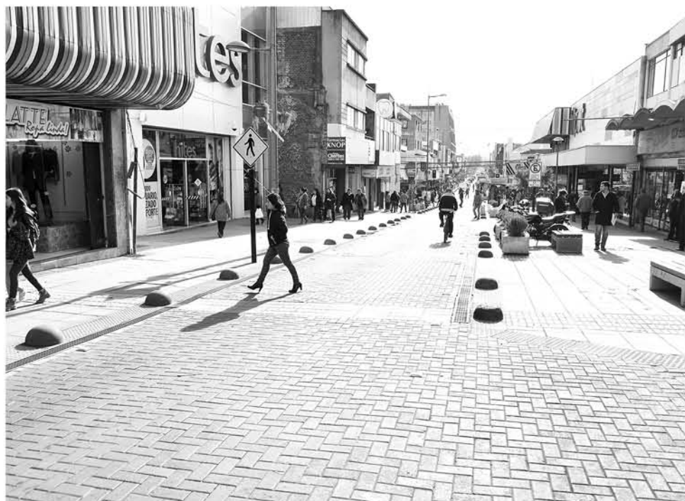
PESE A QUE EL PRÓXIMO AÑO comienza a funcionar la ley, la gran mayoría del gremio es minorista, por lo que lo harán el 2020.

Por último, el timonel del comercio local se sumó al espíritu promovido por el legislador, orientado al cuidado del medioambiente, manifestando que "no creemos que exista un comerciante que pueda tener una idea contraria a ello, pues todos queremos un planeta mejor para nosotros y nuestras familias, así es que consideramos que esta ley debe ir acompañada de una campaña de educación que nos incentive a todos a reciclar y a hacer del comercio una actividad que también promueva la sustentabilidad".