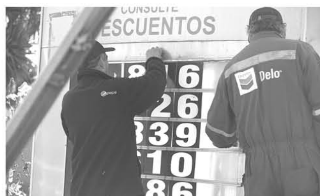
ESTA ES LA NOVENA semana consecutiva de alza en las gasolinas de 93 y 97 octanos, incluyendo el diesel.

En concreto, el litro de gasolina en Los Ángeles, durante la semana del 18 al 24 de octubre de 2018, se sitúa en un valor promedio de $850 pesos para la de 93 octanos, en tanto la de 97 presenta un precio de $896, y finalmente el diesel está en 651 pesos.