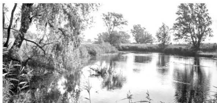
EL AMEBOIDE ‘NAEGLERIA FOWLERI’ puede encontrarse en lagunas, estanques y piscinas.

Es importante recordar que la probabilidad de ser infectado con este parásito es muy baja. Pero si te sientes realmente preocupado, lo mejor es bañarte en el mar, ya que el parásito evita las aguas frías y saladas.