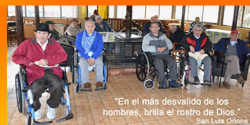
“En el más desvalido de los hombres, brilla el rostro de Dios.” San Luis Orione