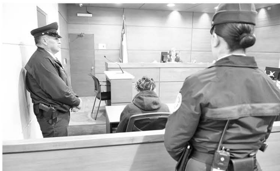
EL MENOR CUMPLIRÁ la medida de arresto domiciliario nocturno en su vivienda de villa Los Profesores entre las cero horas y seis de la madrugada.

El hecho se registró la tarde del martes cuando la víctima, quien recibió un disparo en el muslo derecho dio cuenta a Carabineros.