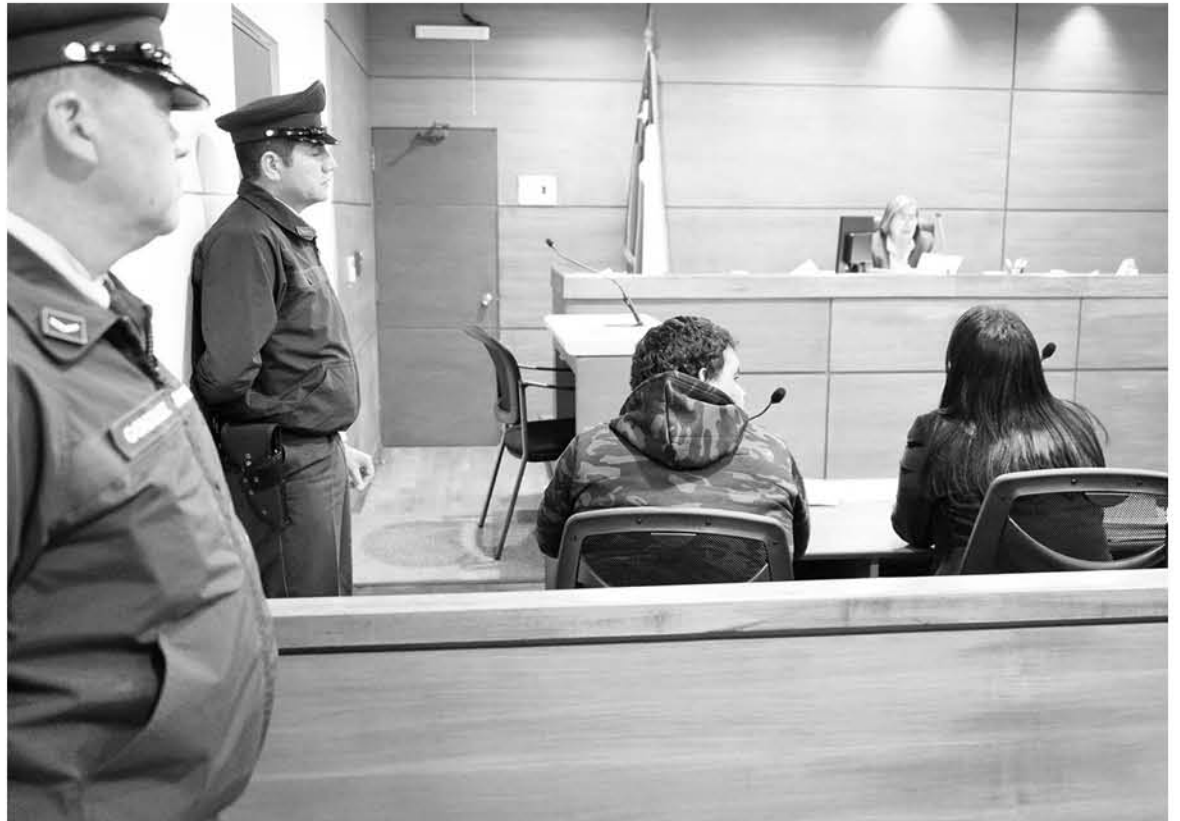
LA AMENAZA DE ESTE SUJETO produjo el traslado de oficiales del GOPE a Los Ángeles de Concepción, ya que en la provincia no se encuentra esta sección policial.

Posterior a esto y al trasladarse personal de esta sección policial, se realizó la investigación por parte de los profesionales, quienes determinaron que el implicado mantenía un aparato de índole simulador