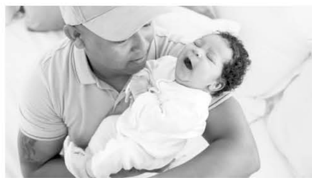
¿PUEDE LA TECNOLOGÍA reemplazar el instinto de los padres?

Cuando “oye” el llanto, Snoo elige el mejor sonido y movimiento oscilante para calmar al bebé.