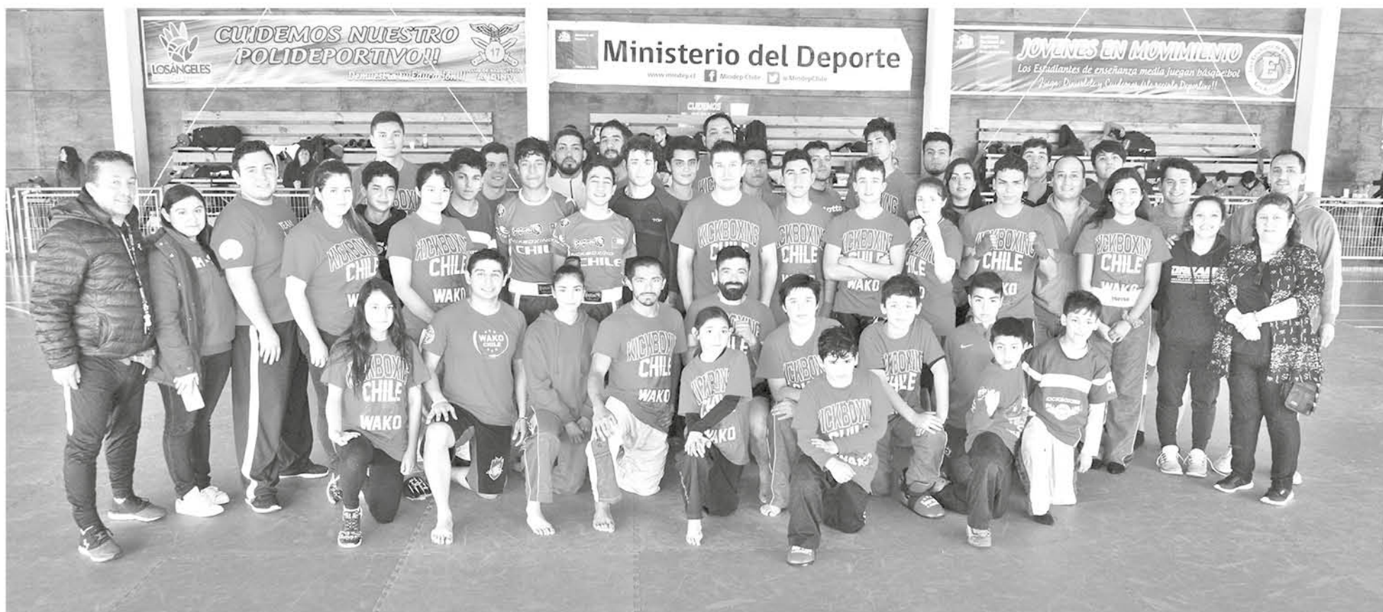
LA DELEGACIÓN ASISTENTE perteneciente a WAKO propondrá a Los Ángeles como sede del próximo Panamericano de la disciplina.