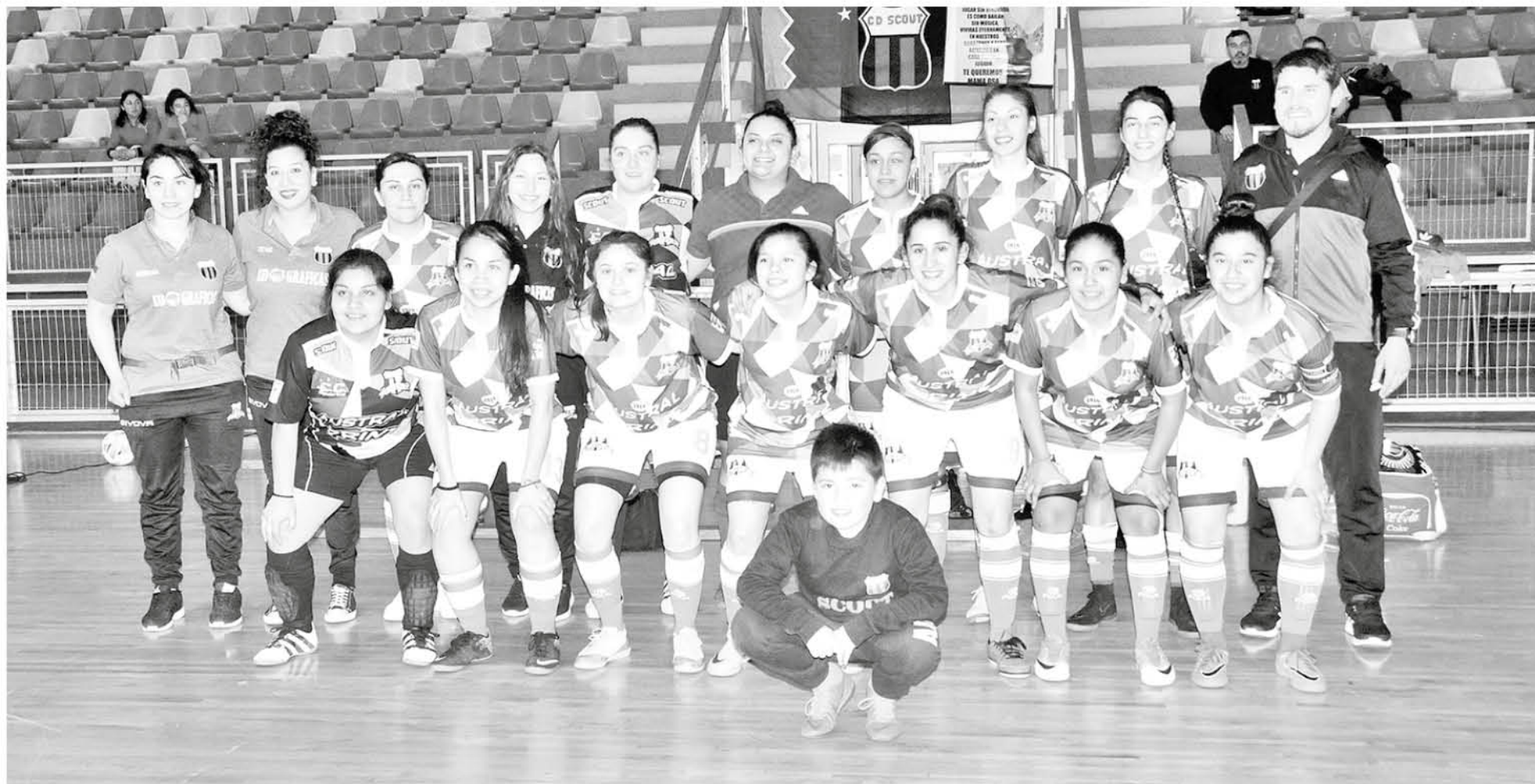
EL CLUB SCOUT DEMOSTRÓ TENER el mejor futsal femenino adulto del país en el marco de su aniversario número cien.