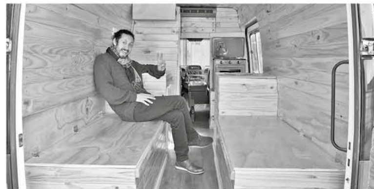
UN TEATRO MÓVIL es el nuevo y gran proyecto de la compañía angelina Teatro Plan. Iniciativa autofinanciada y próxima a iniciar sus viajes.

Muy pronto comenzaremos a ver este novedoso escenario móvil recorriendo las calles y campos de la zona, realizando innovadoras puestas en escena, con esta pareja de artistas entusiastas y enamorados de lo que hacen.