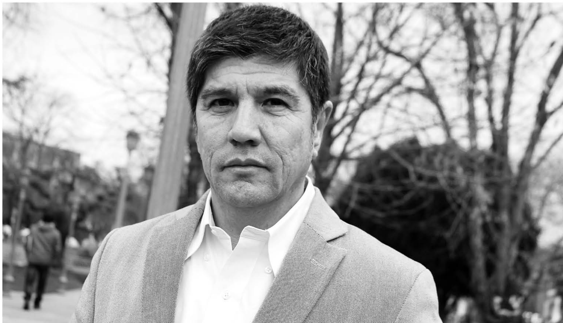
EL PARLAMENTARIO dijo que el director de la institución recibió una sanción menor que la que debió tener.

El diputado socialista sostuvo que debiese haber una ley que castigue severamente la incitación al odio.