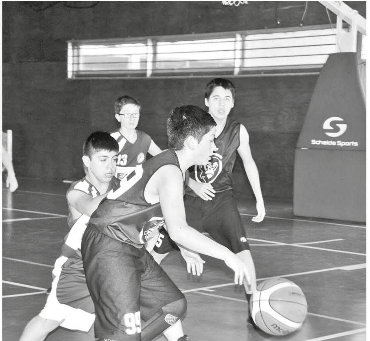
CUANDO ENTREN AL CIRCUITO profesional los basquetbolistas de la provincia auguran un excelente desempeño.

En las instalaciones del Polideportivo en Los Ángeles se disputó el Segundo Encuentro Regional de Básquetbol 2018, donde los equipos locales lograron derrotar en las dos jornadas a todos sus similares de las categorías sub 16 y sub 18.