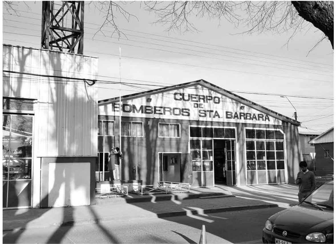
SEGÚN EL RELATO DE BOMBEROS, estas personas no serían moradores de la vivienda afectada, sólo residentes aledaños.

"Una vez que nos retiramos del lugar e informamos las novedades, se procedió al traslado al centro asistencial donde se constaron lesiones y hematomas en dos casos y se cursó la denuncia en la cuarta comisaría