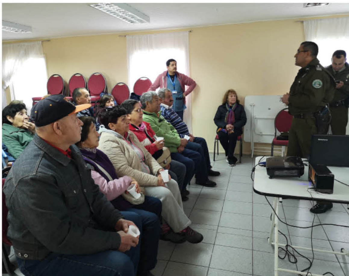
LA CAPACITACIÓN se enmarca en la conmemoración del Mes del Adulto Mayor.