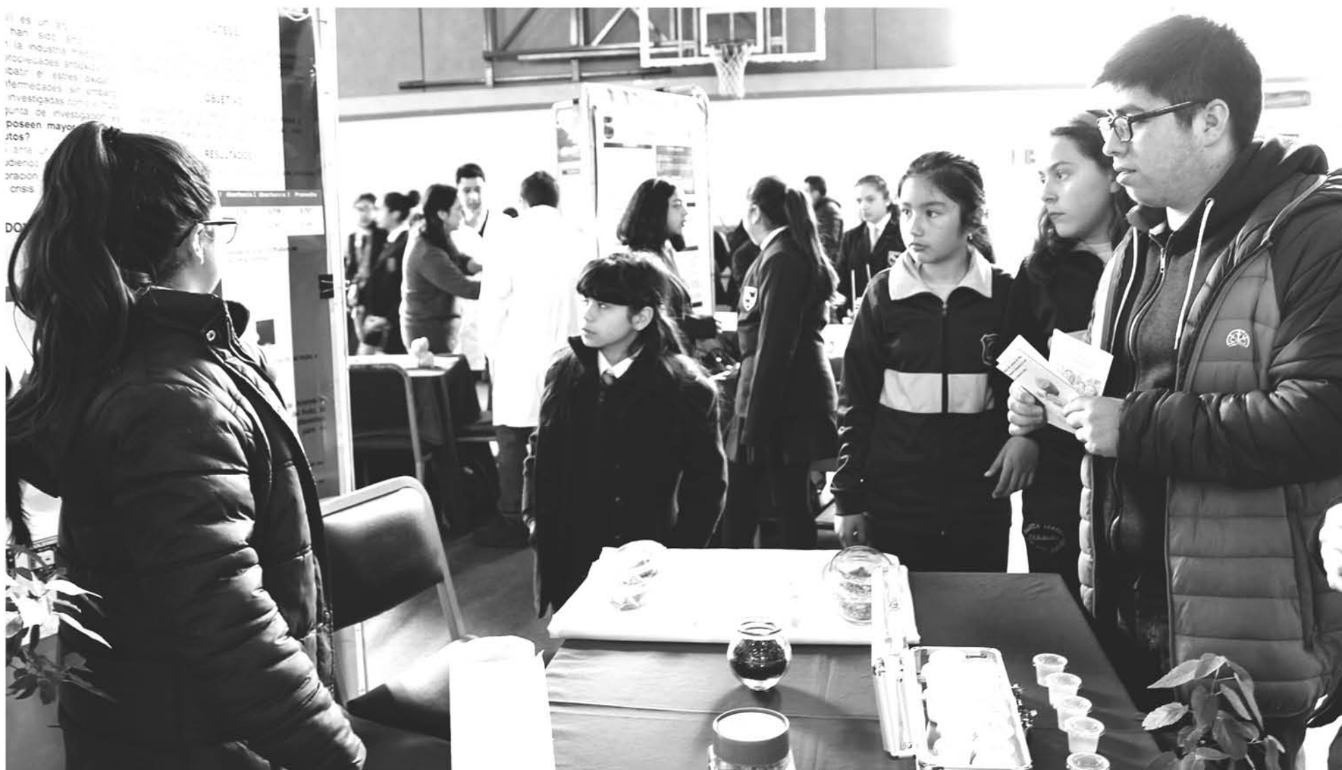
EN LA ACTIVIDAD SE PRESENTARON un total de dieciséis equipos.

Durante la jornada se realizó el X Congreso Provincial Escolar de Ciencia y Tecnología de Biobío, instancia que reunió a equipos de estudiantes de las comunas de Los Ángeles, Nacimiento, Tucapel, Laja, Quilleco y Cabrero.