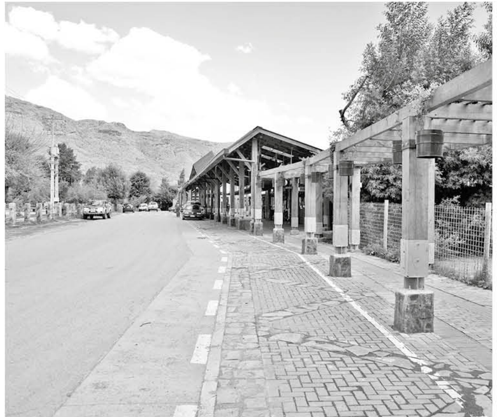
DESDE ESTE 2019 el municipio se hará cargo de su administración.

"Por lo tanto, la instancia de colaboración y participación de la municipalidad, siempre va a estar allí para que los niños y la comunidad no pierdan la escuela. Los desafíos son que a partir del año 2019, el administrador de la escuela Quepuca sería la municipalidad de Alto Biobío", puntualizó.