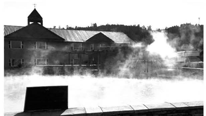
DESDE 1982, estas aguas termales han sido utilizadas para dar calefacción a viviendas de Pagosa Springs.

El método será similar en el invernadero de la comunidad, cuya apertura está prevista antes de fines de este 2018. Allí, organizaciones civiles locales -como los bancos de alimentos- tendrán sus propios huertos en los que cultivarán alimentos para alimentar a sus comunidades.