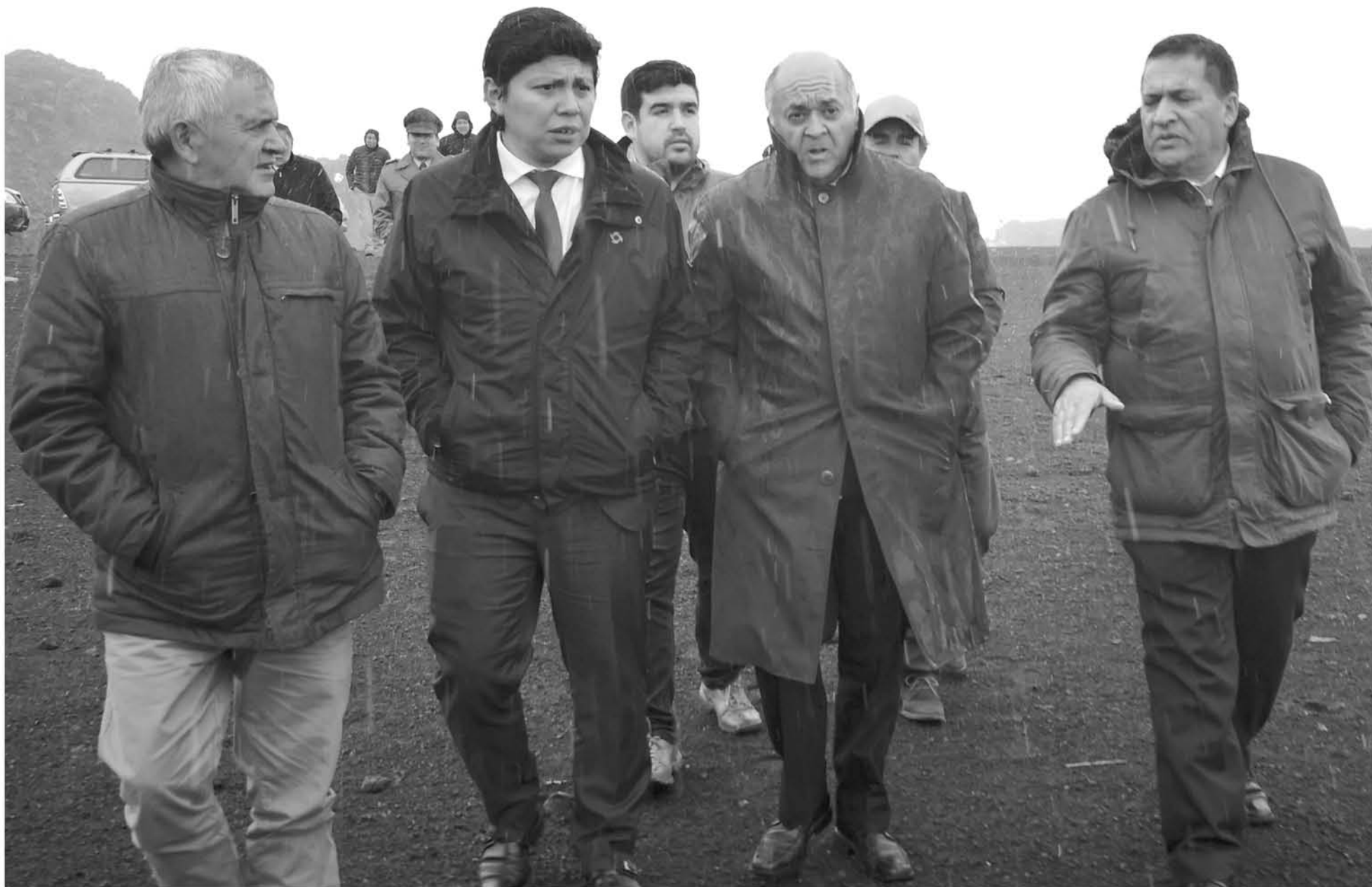
PESE A LA NIEVE, durante la semana pasada, el gobernador Fica, intendente Ulloa y alcalde Abuter visitaron el paso para iniciar coordinaciones.

La tarea no ha sido sencilla, debido a que las condiciones climáticas no han permitido visitar con tranquilidad el lugar.