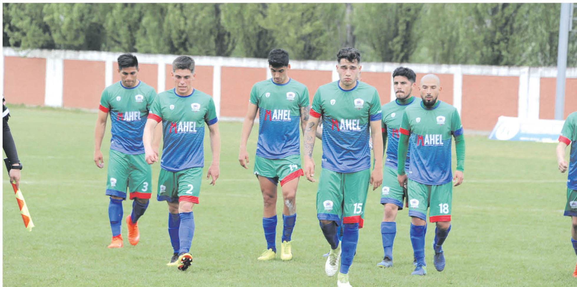
EL TÉCNICO INDICÓ que está enfocado en hacerle entender a los muchachos lo importante que es su partido frente a Buenos Aires de Parral.

El estratega fue crítico con el conjunto y comentó sobre el duro golpe que significó su última derrota frente a Pilmahue. Por otra parte, aseguró que podría dejar su cargo a disposición.