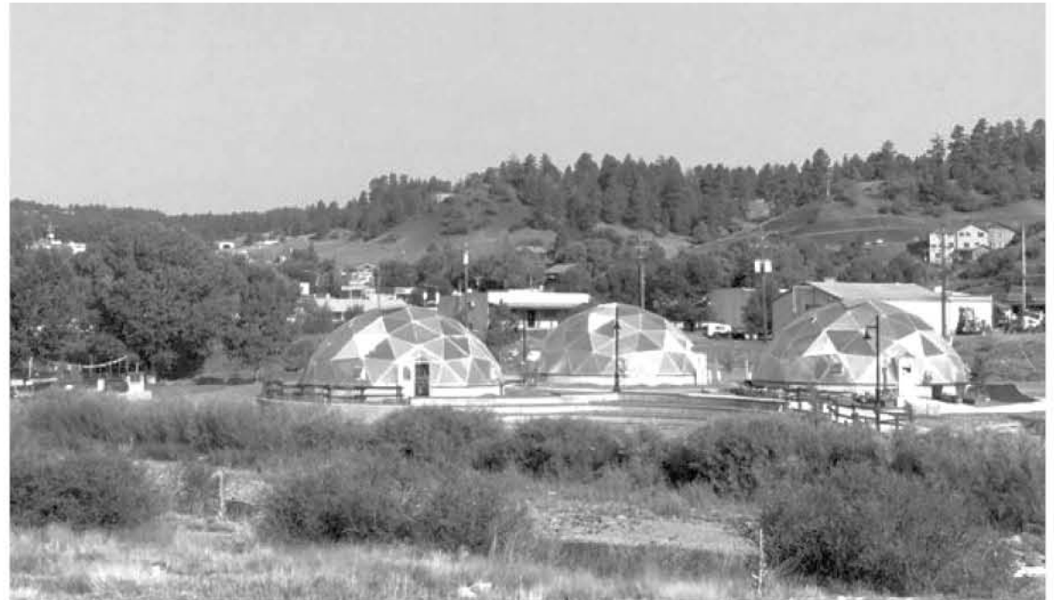
LOS TRES INVERNADEROS usan energía geotermal para cultivar plantas todo el año, incluso en el frío clima de Colorado.

invernadero mantener una temperatura constante cercana a los 14 °C en las noches más frías de invierno y a 32 °C en los más cálidos días de verano (un estanque, ventiladores, un sistema de rocío y las ventanas también ayudan a regular la temperatura).