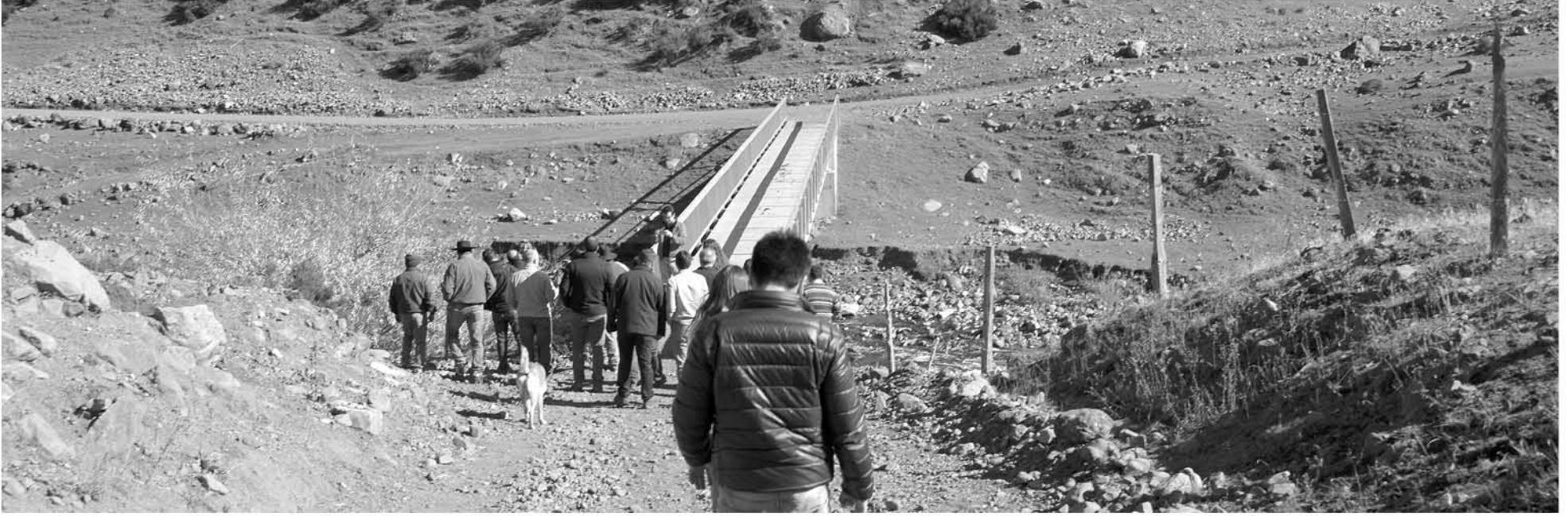
DE SER APROBADA, la apuesta para este 2019 sería un gran paso para el turismo local.

Con esta iniciativa, que pretende ser entregada durante este mes, se requiere conseguir los fondos directos para aplicar en la zona.