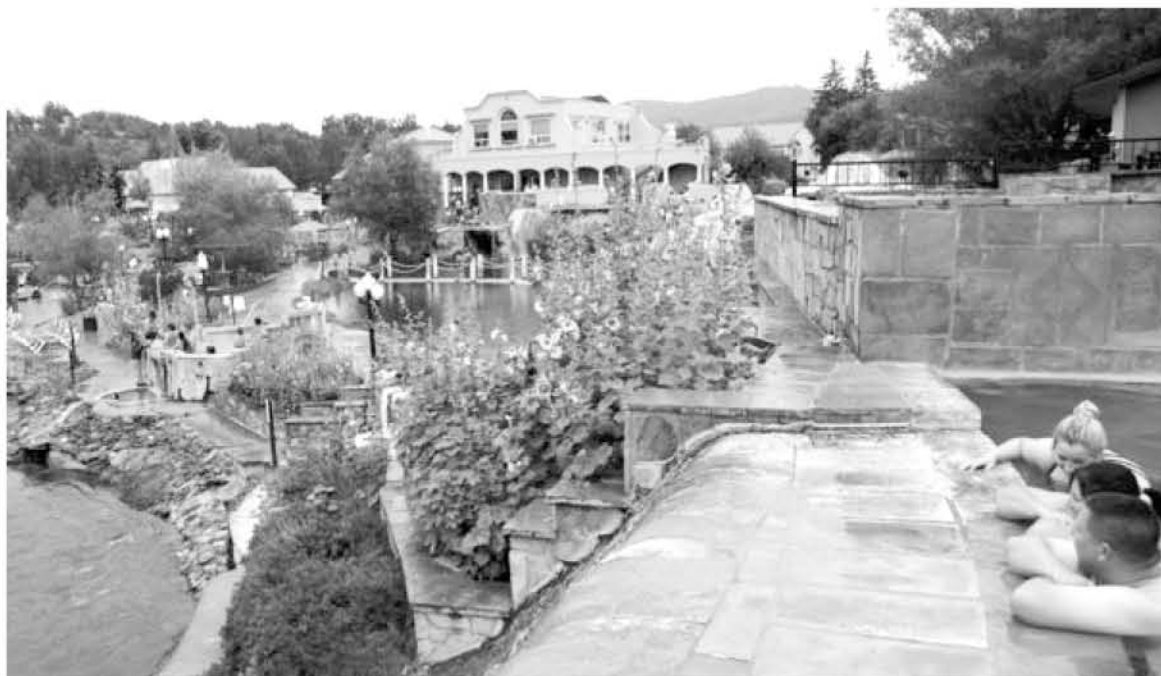
DESCUBIERTAS EN EL SIGLO XIX, estas aguas termales son populares por sus usos terapéuticos.

La mayor parte de las conversaciones sobre energía geotermal se enfocan en Islandia, donde este recurso natural representa un 25% de la producción de electricidad del país y donde 90% de las viviendas están calentadas geotermalmente.