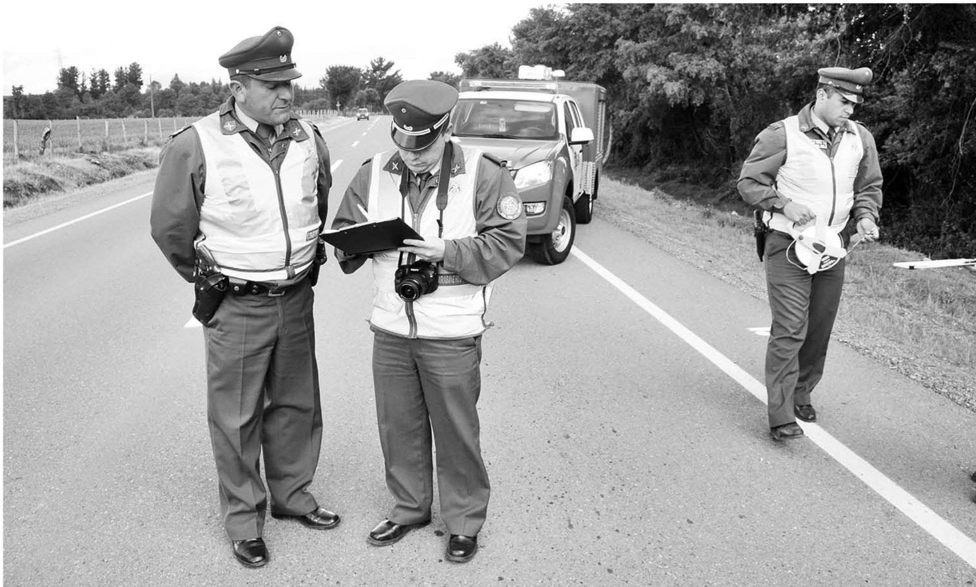
EFFECTIVOS POLICIALES DE LA SIAT BIOBÍO serán los encargados de realizar las fiscalizaciones desde el viernes 12 de octubre, hasta el lunes 15.

Personal de la SIAT Biobío se va a disponer en distintos puntos de la provincia para mantener control vehicular y con ello evitar accidente en la zona.