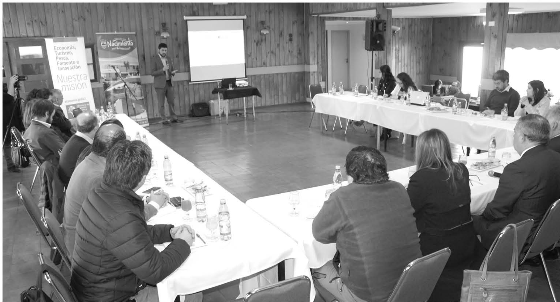
JUNTO AL SEREMI de la cartera, también hubo representantes de Sercotec, Corfo, Inapi, entre otros.

Igualmente destacó que ve muchas oportunidades, considerando que el Banco Central prevé un crecimiento del orden del 4%, pero quieren que ese crecimiento tenga una bajada en las personas. "Nosotros estamos trabajando en medidas fuertes para generar empleo y de mayor calidad", dijo.