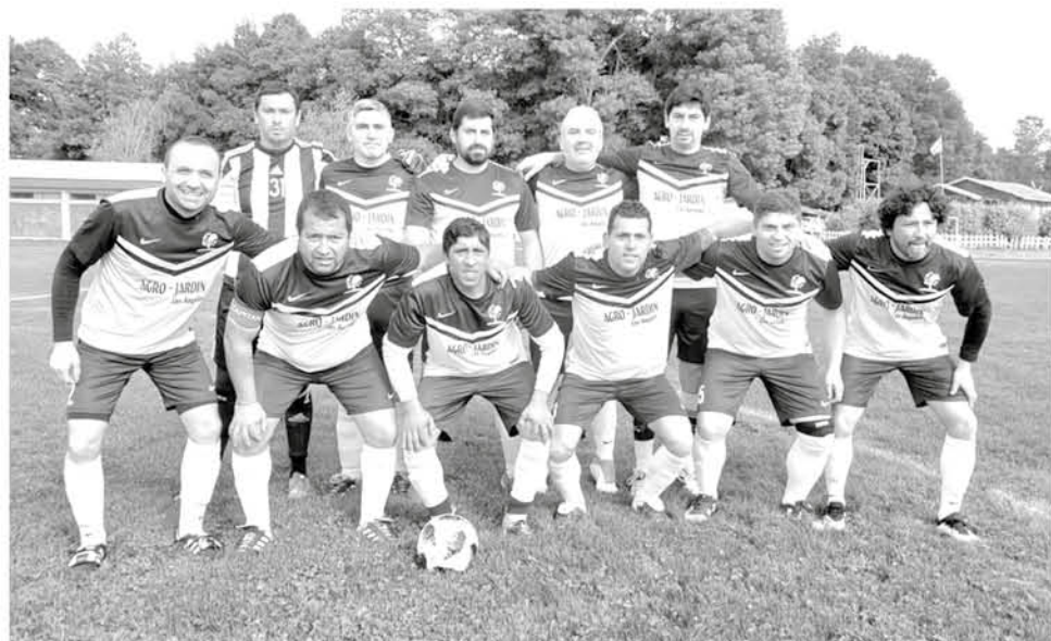
EL EVENTO DE AJEDREZ cuenta con 8 años de tradición realizando competencias para el circuito escolar.

Los exponentes locales del deporte ciencia obtuvieron una actuación destacable derrocando al rey oponente en la última convocatoria de la disciplina.