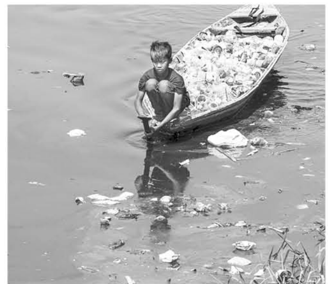
RÍO CONTAMINADO en Indonesia.