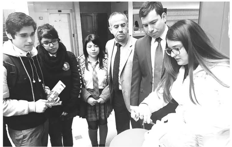
EN LA REGIÓN DEL BIOBÍO y Ñuble un 23,1% de los niños de 6 años y un 18,9% de los adolescentes de 12, atendidos en el sector público de Salud.

"La distribución de estas patologías en la población, de acuerdo al análisis de situación de salud bucal en nuestro país, difiere según nivel socioeconómico y lugar de residencia, siendo más afectados quienes se encuentran en situación de