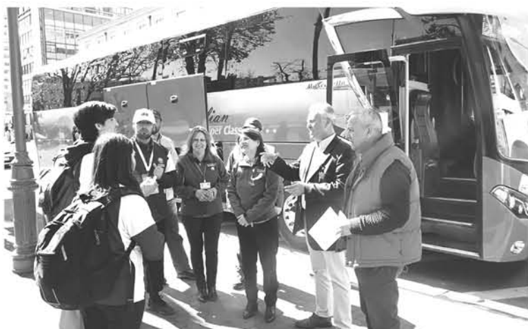
ESTA SOLICITUD debe concretarse con al menos 7 días hábiles de anticipación a la salida del viaje en sectores urbanos.

Si se contrata un bus para salir fuera del país, éste no puede tener más de 10 años de antigüedad y debe contar con un seguro internacional que será requerido en la aduana.