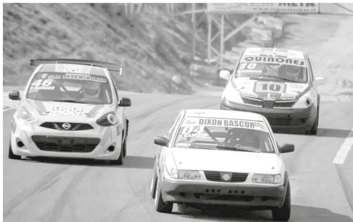
AL SER UNA FECHA DOBLE, los angelinos tienen grandes posibilidades de alcanzar el liderato de la tabla.

Tras su cancelación la semana pasada por lluvia, la organización aseguró que el evento donde tendrán cita pilotos de distintas partes del país se realizará definitivamente.