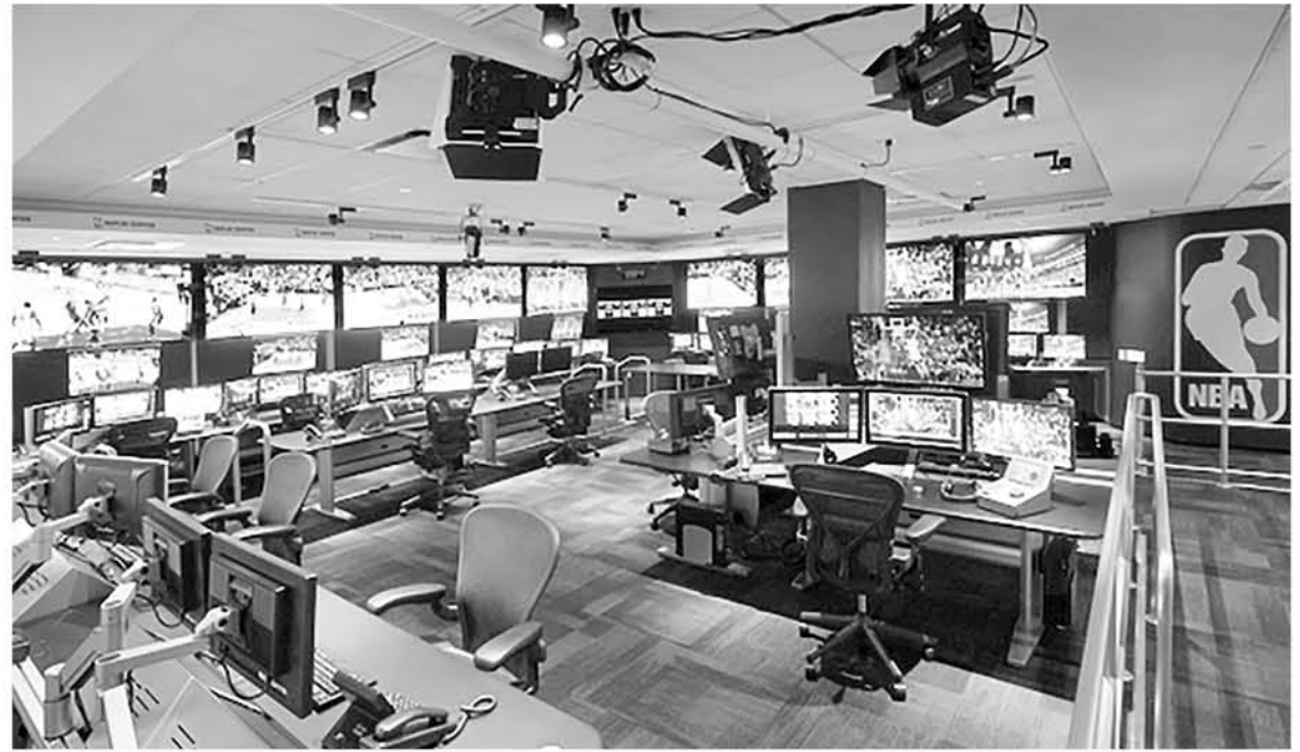
ASÍ ES EL 'REPLAY CENTER' de la NBA, alta tecnología para resolver jugadas dudosas

la utilización del sistema de videoarbitraje (VAR), el cual se estrenó con el partido inicial de la Copa Mundial de Rusia. El VAR podría ser utilizado en cuatro momentos, para determinar si el balón entra o no a la red, para definir si una acción es penalti o no, si es justa una tarjeta roja directa, no después de tener amarilla; y un error para identificar un jugador.