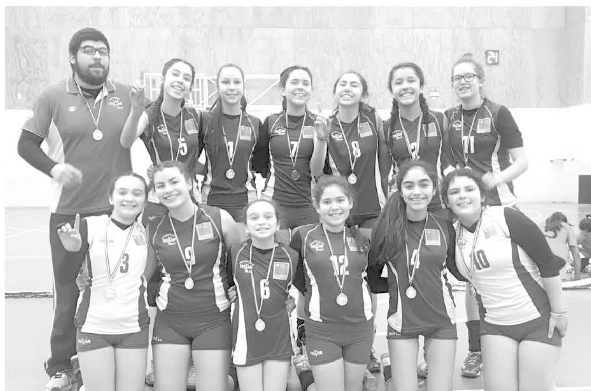
EL CLUB está pronto a pelear el título zonal de la federación que les permitirá seguir escalando como club.

Sub 12: noviembre 17-18 sub 14: octubre 9-10-11 sub 16: noviembre 26-27-28