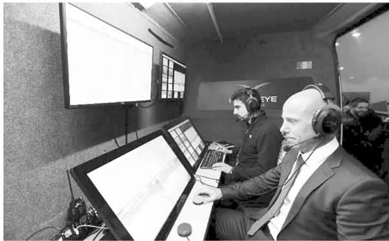
RUSIA 2018: el primero con videoarbitraje (VAR)

Algunas de las tecnologías que se ha quedado en el mundo del deporte y se considera indispensable es el ojo de halcón en tenis. Su función es esclarecer el bote de las bolas para saber si ha entrado o ha salido fuera de los límites de la pista y para ello comprueba la trayectoria y la velocidad de la pelota, de esta manera permite interpretar de la mejor forma posible los botes de la pelota.